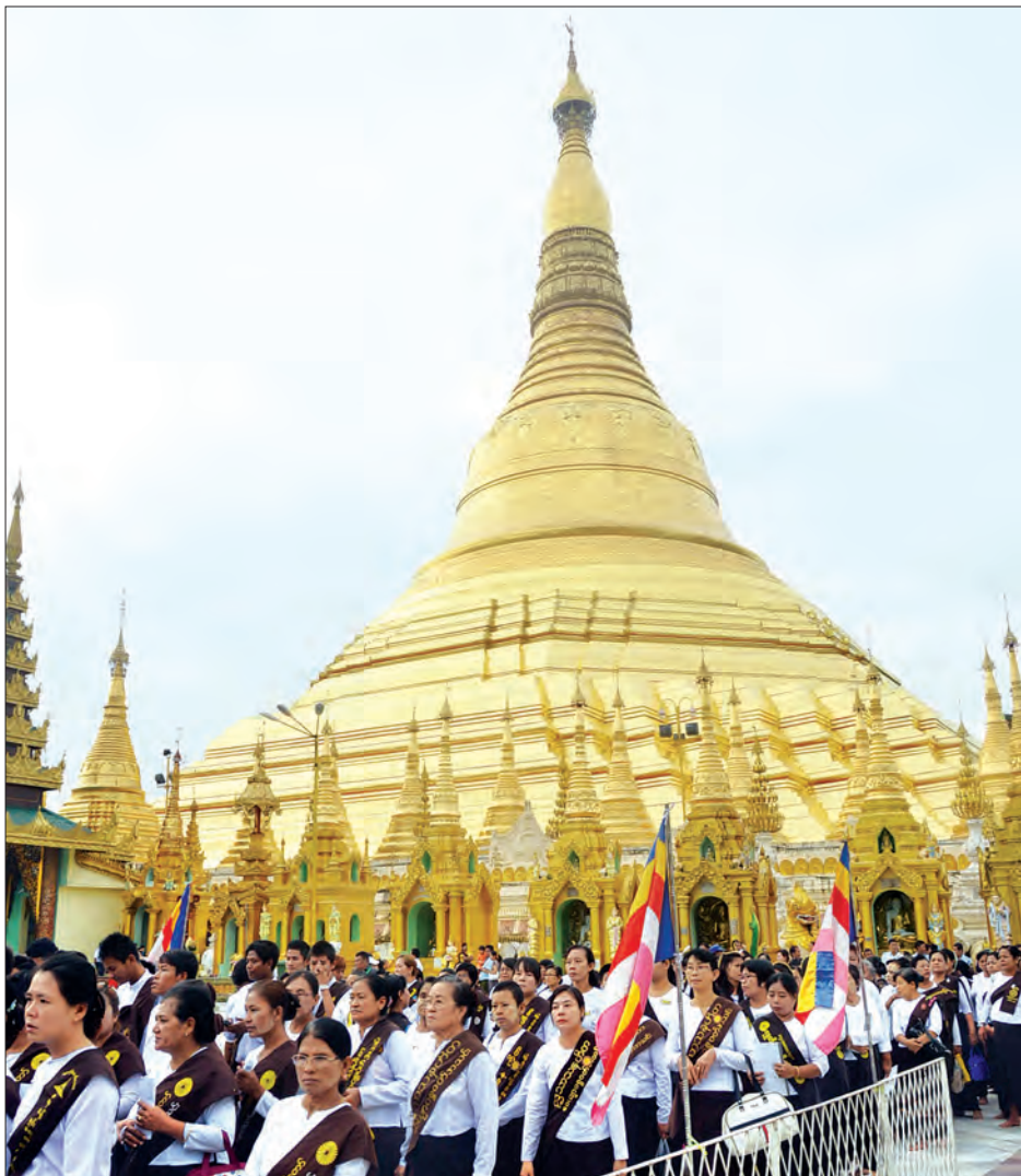
အလားတူ သီရိမင်္ဂလာကမ္ဘာအေး အခမ်းအနားကို စေတီတော် အာရုံခံတန်ဆောင်း အပေါ် ဝတ်အသင်းသူ ထပ်၌ နယုန်လပြည့်နေ့ (မဟာသမယနေ့) ဂေါပကအဖွဲ့ဝင်များ၊ ဝတ်အသင်းသူ စည်ကား သိုက်မြိုက်စွာ ကျင်းပခဲ့သည်။ သတင်း - ကိုကိုဇော်

အဖွင့်မင်္ဂလာစာတမ်း ဖတ်ကြားလျှောက် ထားသည်။ ယင်းနောက် နိုင်ငံတော် ဩဝါဒါ စရိယ အဘိဇေ မဟာရဋ္ဌဂုရု၊ အဂ္ဂမဟာ ဂန္ဓဝါစက ပဏ္ဍိတ၊ အဂ္ဂမဟာ ပဏ္ဍိတ ပဟန်းမြို့နယ် ခြောက်ထပ်ကြီး သီရိဦး ကျောင်းတိုက် ဆရာတော် ဘဒ္ဒန္တ နန္ဒောဘာသထံမှ ဂေါပကအဖွဲ့ဝင်များ၊ ဘာသာရေးအသင်းအဖွဲ့ဝင်များက နဝင် သီလ ခံယူဆောက်တည်ကြပြီး ဆရာ တော်၊ သံဃာတော်များအား လှူဖွယ် ပစ္စည်းများ ဆက်ကပ်လှူဒါန်းကြသည်။ ဆက်လက်၍ နိုင်ငံတော် ဩဝါဒါ စရိယ အဂ္ဂမဟာပဏ္ဍိတ အဂ္ဂမဟာကမ္မ ဌာနစရိယ ဒွိဝိဇ္ဇကကောဝိဒ မရမ်းကုန်း မြို့နယ် ကလေးဝတောရကျောင်းတိုက် ဆရာတော် ဘဒ္ဒန္တဇာဂရာ ဘိဝံသထံမှ အနုမောဒနာတရားနာကြားပြီး ရေစက်ချ အမှုပေးပေးကြသည်။ ထို့နောက် ရှေးဟောင်းပုဒ္ဓရုပ်ပွား တော် တန်ဆောင်းမှစတင်၍ ဂေါပက အဖွဲ့ဝင်များ၊ ဘာသာရေးအသင်းအဖွဲ့ များက မဟာသမယအခါတော်နေ့ ဖြစ် ပေါ်လာခြင်းကို ဖော်ကျူးသော အခမ်း အနား အဆောင်အယောင်များဖြင့် အုပ်စု နှစ်စုခွဲ၍ စေတီတော်ကြီးအား လက်ဝဲရစ်၊ လက်ယာရစ် လှည့်လည်ပူဇော်ကြပြီး (ယာပုံ) ရာဟုထောင့်ချမ်းသာကြီး တန်ဆောင်းတွင် မဟာသမယအခါတော် နေ့ အခမ်းအနားကို အောင်မြင်စွာ ကျင်းပခဲ့သည်။