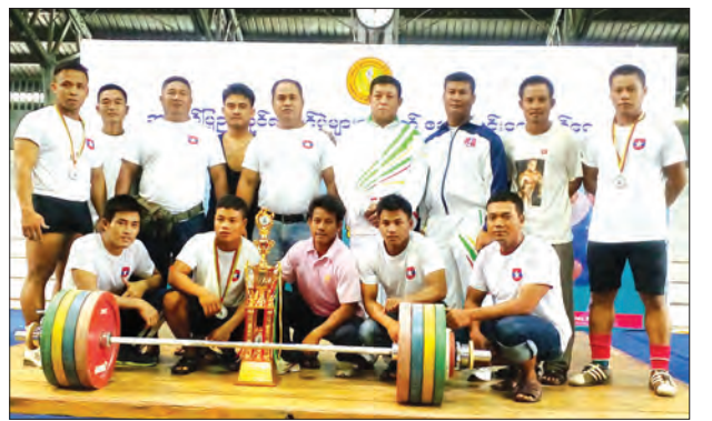
တံခွန်စိုက်ခိုင်းဆု ဆွတ်ခူးခဲ့သော ကာကွယ်ရေးအသင်း

အဆိုပါပြိုင်ပွဲတွင် ယခု ခိုင်းဆုဆွတ်ခူးရရှိသွားသော ကာကွယ်ရေး အလေးမအသင်းအနေဖြင့် အုပ်ချုပ်သူတစ်ဦး၊ နည်းပြနှစ်ဦးနှင့် ဝိတ်တန်းအလိုက် အမျိုးသားအားကစားသမား