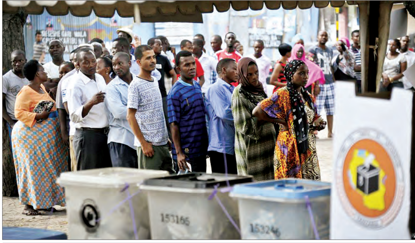
၂၀၀၅ ခုနှစ်က ကျင်းပခဲ့သည့် တန်ဇန်နီးယားရွေးကောက်ပွဲတွင် ပြည်သူများ မဲထည့်ရန် စောင့်ဆိုင်းခဲ့ပုံကို တွေ့မြင်ရစဉ်။

စစ်အေးတိုက်ပွဲတွေ အဆုံးသတ်ခဲ့တဲ့ ၁၉၉၀ ပြည့်နှစ်များအတွင်းမှာ အောင်ပွဲရအောင်အုပ်စုအစိုးရများရဲ့ လှည့်ဖြားမှုနဲ့အတူ ယှဉ်တွဲရောက်ရှိလာတဲ့ လစ်ဘရယ် ဒီမိုကရေစီစနစ်ဟာ အာဖရိကနိုင်ငံများစွာကို နိုင်ငံရေးပါတီများစွာပါဝင်တဲ့ နိုင်ငံရေးစနစ်ကို ပြန်လည်အသက်သွင်းဖို့ ရှေ့ဆောင်နိုင်ခဲ့ပါတယ်။ ရွေးကောက်ပွဲတွေကိုလည်း ထုံးစံတစ်ခုလို ကျင်းပနိုင်ခဲ့ပြီး နိုင်ငံရေးစည်းမျဉ်းစည်းကမ်းတွေနဲ့မညီတဲ့အစိုးရရဲ့ အပြောင်းအလဲမှန်သမျှကိုတားမြစ်ကာ အဆင့်မြင့်တင်မှုတွေ ပြုလုပ်ခဲ့ပါတယ်။