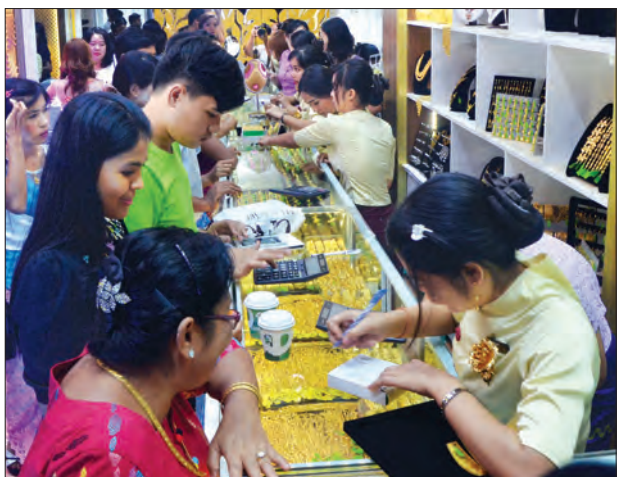
ရွှေထည်အရောင်းအဝယ်ပြုလုပ်နေသူများကို တွေ့ရစဉ်

လက်ရှိ မြန်မာ့ရွှေဈေးကွက်တွင် ကမ္ဘာ့ရွှေဈေးနှင့် တိုက်ရိုက်ချိတ်ဆက်