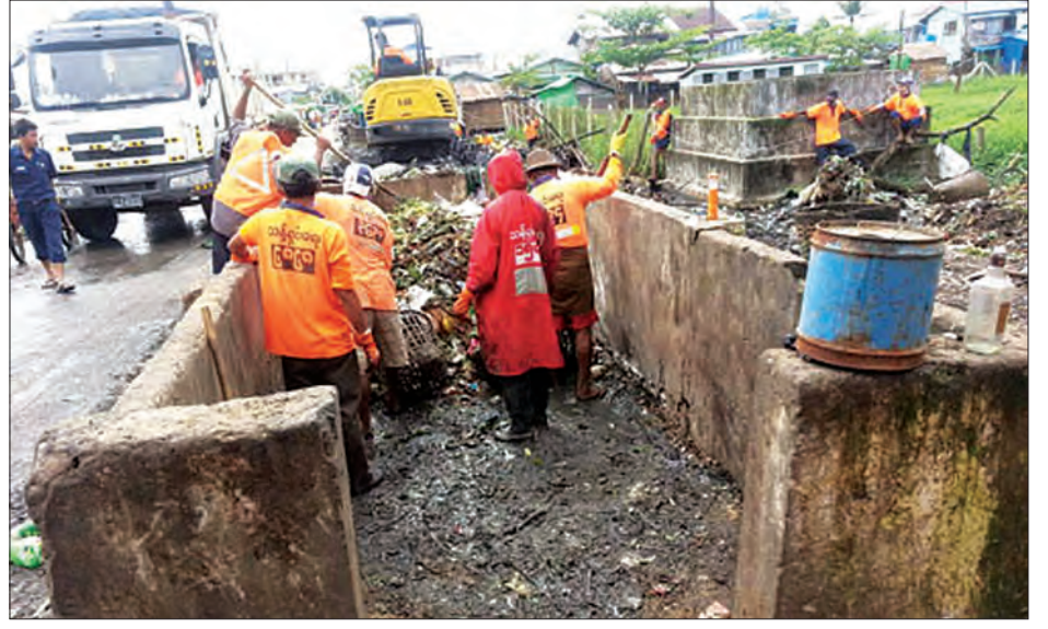
ဈေးသွားဈေးလာများအနီးရှိ စာသင်ကျောင်းမှကျောင်းသား ကျောင်းသူများ မြေစာအမှိုက်ပုံမှထွက်ပေါ်လျက်ရှိသော အနံ့အသက်ဆိုးများ ကင်းဝေးသွားပြီဖြစ်၍ ဝမ်းသာပီတိဖြစ်လျက်ရှိကြောင်း သိရသည်။ သန်းထိုက်(လှိုင်သာယာ)

ရန်ကုန် ဇွန် ၂၀ ရန်ကုန်တိုင်းဒေသကြီး လှိုင်သာယာမြို့နယ်၏ လူစည်ကားရာဈေးတစ်ခုဖြစ်သော မီးခွက်ဈေး (ပိတောက်မြိုင်ဈေး) နံဘေးတွင်ရှိသည့် အမှိုက်ကန်မှာ စွန့်ပစ်သည့် အမှိုက်ကန်မမျှတမှုကြောင့် အမှိုက်များကန်နံဘေးသို့လျှံကျခဲ့ရာမှ ရက်ကြာလာသောအခါ ပြီးလွယ်အမှိုက်ပစ်သည့်ကြောင့် အမှိုက်မြေစာပုံကြီးဖြစ်နေသည့်အတွက် မိုးရာသီတွင် ရပ်ကွက်ပြည်သူများဆိုးရွားသော အနံ့အသက်တို့ကို ရှူရှိုက်နေရလျက်ရှိသည်။ ရန်ကုန်မြို့တော်စည်ပင်သာယာမှုပတ်ဝန်းကျင်ထိန်းသိမ်းရေးနှင့် သန့်ရှင်းရေးဌာန ဒုတိယဌာနမှူးနှင့်အတူ ရပ်ကွက်အုပ်ချုပ်ရေးမှူးတို့ ပူးပေါင်း၍ စနေနေ့အထူးသန့်ရှင်းရေးအဖြစ် အမှိုက်ကန်နံဘေးမှ မြေစာပုံရုံအမှိုက်များနှင့် ပိတ်ဆို့နေသော ရေမြောင်းအတွင်းမှ စွန့်ပစ်အမှိုက်များကို စက်ယန္တရားဖြင့် ဇွန် ၁၈ ရက် နံနက်ပိုင်းက ရှင်းလင်းဆောင်ရွက်ခဲ့သည့်အတွက် ရပ်ကွက်ပြည်သူနှင့်