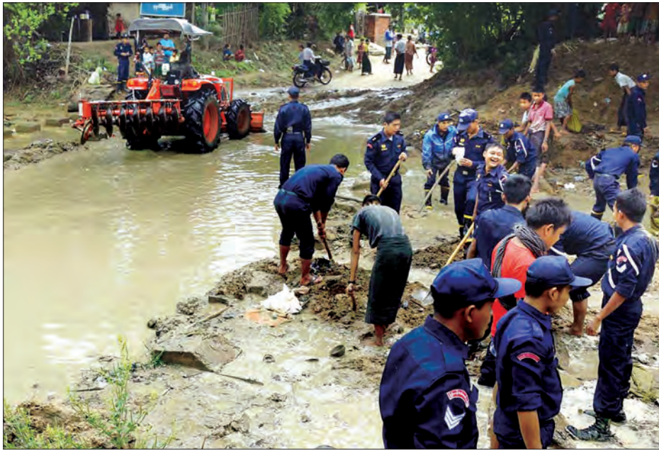
KIOTI ထယ်ထိုးစက်ဂေါ်ဖြင့် ကွင်းဆင်းဆောင်ရွက်ခဲ့ကြောင်း သိရသည်။ မင်းမင်းလတ်(ရှုပဒေ)

ပြည်ထောင်စုနယ်မြေ နေပြည်တော် ဥက္ကဋ္ဌရခိုင် ပုဗ္ဗသီရိမြို့နယ် ကျည်တောင်ကန် အမှတ် ၆ ရပ်ကွက် ကျည်တောင်ကန် မြို့ပတ်လမ်းပေါ်ရှိ ကွင်းကြီးချောင်းမှ နန်း၊ သဲ၊ အမှိုက်များပိတ်ဆို့၍ ရေကျော်မှုအား ရေစီးရေလာကောင်းမွန်ရေးအတွက် အမှိုက်များဆယ်ယူခြင်း၊ သဲနန်းများ ဆယ်ယူခြင်းတို့ကို ဇွန်လဒုတိယပတ်က ဆောင်ရွက်လျက်ရှိကြောင်း သိရသည်။