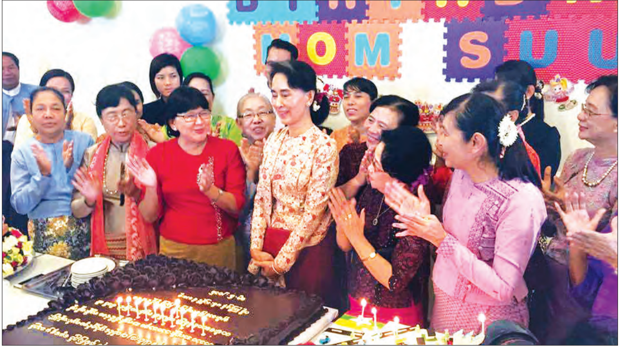
၏ အတိုင်ပင်ခံပုဂ္ဂိုလ် ဒေါ်အောင်ဆန်းစုကြည်အနေဖြင့် နိုင်ငံတော်နှင့် နိုင်ငံသူ နိုင်ငံသားများ၏အကျိုးကို ကျန်းကျန်းမာမာ ချမ်းချမ်းသာသာဖြင့် ထမ်းဆောင်နိုင်ပါစေကြောင်း၊ ငြိမ်းချမ်းသာယာပြီး ခေတ်မီတိုးတက်သော ဒီမိုကရေစီဖက်ဒရယ် ပြည်ထောင်စု နိုင်ငံတော်သစ် တောင်းဆိုကြောင်း သိရသည်။ သို့ ဦးဆောင်လျှောက်လှမ်းနိုင်ပါစေကြောင်း မေတ္တာပို့သ၍ ဆုမွန်ကောင်း (သတင်းစဉ်)

နိုင်ငံတော်၏ အတိုင်ပင်ခံပုဂ္ဂိုလ် ဒေါ်အောင်ဆန်းစုကြည်သည် ဇွန် ၁၉ ရက်တွင် ပြည်မြောက်ဘက် (၇၁)နှစ်မြောက် မွေးနေ့အထိမ်းအမှတ်အဖြစ် ယနေ့နံနက်ပိုင်းက လွှတ်တော်ရုံးနှင့် သမ္မတရုံးများအတွင်း စားသောက်ဖွယ်ရာများ ကျွေးမွေးခဲ့သည်။ နိုင်ငံတော်၏ အတိုင်ပင်ခံပုဂ္ဂိုလ်သည် ၎င်း၏(၇၁)နှစ်မြောက် မွေးနေ့အထိမ်းအမှတ်အဖြစ် လွှတ်တော်ဝင်းအတွင်းရှိ (I-12)အဆောင်၌ လွှတ်တော်များမှ ဝန်ထမ်းများအား မွေးနေ့ကိတ်နှင့် စားသောက်ဖွယ်ရာများကို လည်းကောင်း၊ နိုင်ငံတော် သမ္မတရုံးရှိ သန့်ရှင်းရေးဝန်ထမ်းများ၊ ယာဉ်မောင်းများနှင့် အောက်ခြေဝန်ထမ်းများ အပါအဝင် အမှုထမ်း၊ အရာထမ်းများအားလုံးကို မွေးနေ့ကိတ်ဖန်အား လည်းကောင်း မျှဝေကျွေးမွေးခဲ့ခြင်းဖြစ်သည်။ နိုင်ငံတော်သမ္မတရုံးနှင့် လွှတ်တော်ရုံးများမှ ဝန်ထမ်းများကလည်း နိုင်ငံတော်