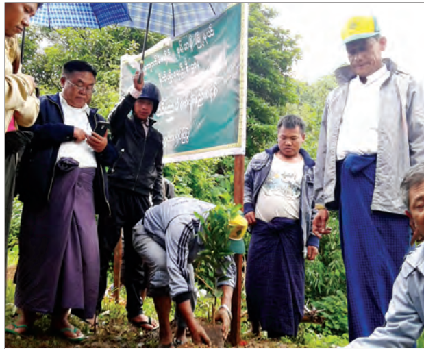
ရည်အန်ကြောင့် ပိုးမွှားများ မျိုးဥပမာ နှစ်ခြင်း၊ မတွယ်ကပ်နိုင်ခြင်း၊ ပိုးမွှားရောဂါကာကွယ်ပြီးသား ဖြစ်နေခြင်းများကြောင့် ဆောင်ရွက်ရခြင်းဖြစ်ပါစဉ် (သီပေါ)

စိုက်ပျိုးနည်းပညာဆိုင်ရာများ ဟောပြောကြပြီး နှစ်ရှည်သီးနှံစိုက်ပျိုးနည်းများကို လက်တွေ့ပြသ၍ လိမ္မော်သီးနှံပျိုးပင် ၃၈၀၀၊ ထောပတ်သီးနှံ ပျိုးပင် ၁၀၀၀၊ စပါးပျိုးနှင့်ဟင်းသီးဟင်းရွက်ပျိုးစေ့များအား (အခမဲ့) ဖြန့်ဖြူးပေးအပ်ခဲ့သည်။