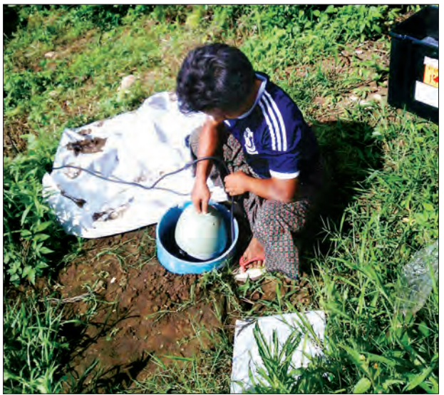
လျှင်တိုင်းစက်များ လိုက်လံတပ်ဆင်နေစဉ်

ဖြစ်စဉ်တွေကိုလေ့လာပြီး မြေအောက် အနေအထားတွေကို ခန့်မှန်းမှာပါ။ မိုးတွင်းအထိ ၄၃ လုံးတပ်ဆင်ပါမယ်။ ဆောင်းတွင်းမှာ ၂၂လုံး ထပ်ပြီး တပ်ဆင် မယ်။ လောလောဆယ်မှာတော့ ဒီလမှာ ပဲ မုံရွာ၊ ဂန့်ဂေါ၊ ကလေးနဲ့ မန္တလေးအရှေ့ ဘက်ခြမ်းနေရာ ဒေသတွေမှာသုံးစွဲဖို့ပြီး တပ်ဆင်နေပါတယ်။ စီမံကိန်းကာလ တစ်နှစ်အတွင်းမှာ လုံလောက်တဲ့ အချက်အလက်မရသေးရင် ထပ်တိုး လုပ်ဆောင်မယ်”ဟု ၎င်းက ဆိုသည်။ ထိုသို့တပ်ဆင်ပြီးပါက မြန်မာနိုင်ငံ အနောက်ဘက်ခြမ်းရှိ လျှင်လှုပ်ခတ် နိုင်မှု အလားအလာ၊ အနာဂတ်တွင် လှုပ်ခတ်လာနိုင်မည့် လျှင်အခြေအနေ များ၊ လှုပ်ခတ်မည့်နေရာနှင့် အချိန် စသည့် အချက်အလက်များအား သုတေသနရလဒ်တစ်ခုအဖြစ် ရရှိလိမ့် မည်ဟုမျှော်မှန်းထားကြောင်း ၎င်းက ဆက်လက်ပြောသည်။