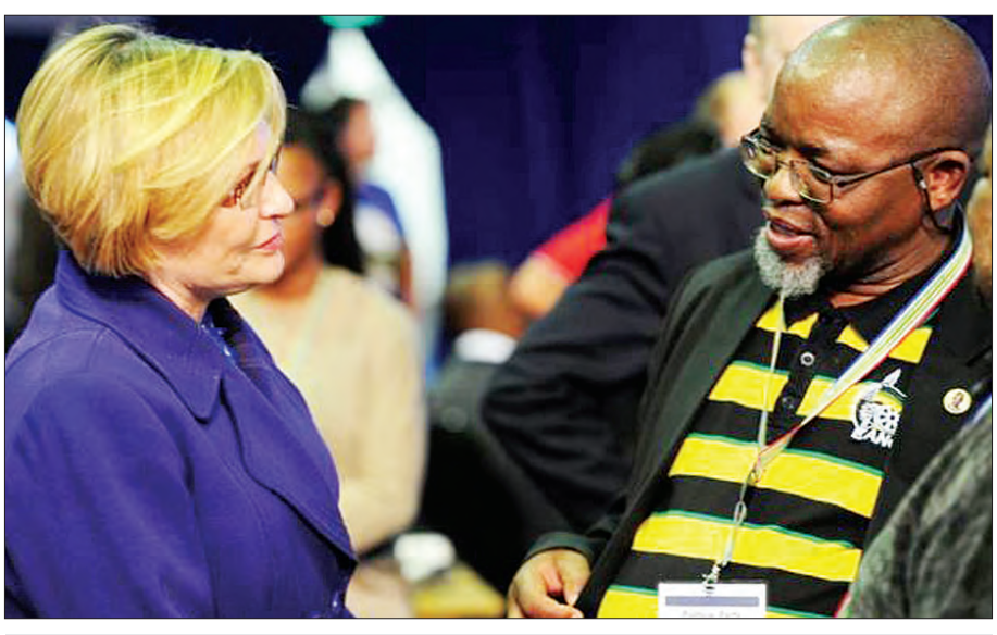
ဒီမိုကရက်တစ်မဟာမိတ်ခေါင်းဆောင် ဟီလနီဇီလီနှင့် အာဖရိကအမျိုးသားကွန်ဂရက်လွှတ်တော် အထွေထွေအတွင်းရေးမှူးချုပ် ဂွာဒီမန်တာရီတို့ကို မေ ၈ ရက်က လွတ်လပ်သော ရွေးကောက်ပွဲကော်မရှင်အဖွဲ့၏ ရလဒ်ထုတ်ပြန်ရေးဌာနတွင် တွေ့ရစဉ်။

ဒုတိယကမ္ဘာစစ်မှစကာ ဒုက္ခသည်စီးဝင်မှုအမြင့်ဆုံးဖြစ်ကြောင်း ကုလသမဂ္ဂဒုက္ခသည်အေဂျင်စီ အကြီးအကဲပြော