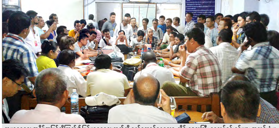
ကမ္ဘာ့ရွှေဈေးအနိမ့်အမြင့်ကိုကြည့်၍ မြန်မာ့ရွှေဈေးကွက်ကို ဖော်ဆောင်နေသော တိုင်းဒေသကြီး ရွှေလုပ်ငန်းရှင်များ အသင်းရုံးမှ ရွှေလုပ်ငန်းရှင်များကို တွေ့ရစဉ်

မြန်မာ့ရွှေဈေးသည် ၉၅၀၀၀ ဖြစ်သည်။ နေ့လယ်ပိုင်းတွင် ၉၅၀၀၀ သာ အကျတက်သို့လှည့်ခဲ့သော်လည်း ညနေဈေးကွက်ပိတ်ချိန်တွင် ကမ္ဘာ့ရွှေဈေး ၁၂၉၃ ဒေါ်လာ ဖြစ်လာသည့်အတွက် မြန်မာ့ရွှေဈေးမှာ ၉၅၀၀၀ ဖြင့်ဈေးကွက်ပိတ်ခဲ့သည်။ ဇွန် ၁၈ ရက်သည် စနေနေ့ဖြစ်သည့်အတွက် ကမ္ဘာ့ရွှေဈေးကွက်ပိတ်သော်လည်း မြန်မာ့ရွှေဈေးကွက်၌ ဈေးအပြောင်းအလဲများ ရှိခဲ့သည်။ ဈေးကွက်ပိတ်ချိန်တွင် ၉၅၀၀၀ ဖြစ်ခဲ့သော ရွှေဈေးသည် ညနေဈေးကွက်ပိတ်ချိန်၌ ၉၅၀၀၀ ဖြင့်အဆုံးသတ်ခဲ့သည်။