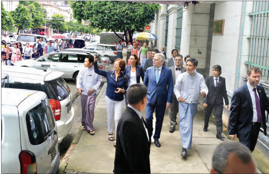
ရှင်းလင်းပြောကြားသည်။ ထို့နောက် ချစ်ကြည်ရေးကိုယ်စားလှယ်အဖွဲ့ဝင်များသည် ရွှေတိဂုံ

ရှင်းလင်းပြသကြသည်။ ထို့နောက် ပြင်သစ်နိုင်ငံခြားရေးဝန်ကြီးနှင့် နိုင်ငံတကာ ဖွံ့ဖြိုးတိုးတက်ရေးဝန်ကြီးနှင့် အဖွဲ့သည်ဘုရားကျောင်းမှ ကုန်သည်လမ်းအတိုင်း လမ်းလျှောက်၍ လမ်းတစ်လျှောက်ရှိ ရန်ကုန်မြို့ပြအမွေအနှစ် ထိန်းသိမ်းစောင့်ရှောက်ရေးအဖွဲ့ဝင်များအား တွေ့ဆုံဆက်သွယ်အသိပေးအသိပေးသည့်နေရာများအပါအဝင် အထက်ကရ နေရာများကို ကြည့်ရှုလေ့လာကြသည်။ (ယာပုံ) ယင်းနောက် ပန်းဆိုးတန်းရှိ ရန်ကုန်မြို့ပြအမွေအနှစ် ထိန်းသိမ်းစောင့်ရှောက်ရေးအဖွဲ့ရုံးခန်းသို့ ရောက်ရှိရာ ဥက္ကဋ္ဌ ဒေါက်တာသန့်မြင့်ဦးက လုပ်ငန်းဆောင်ရွက်ထားရှိမှုနှင့် စပ်လျဉ်း၍