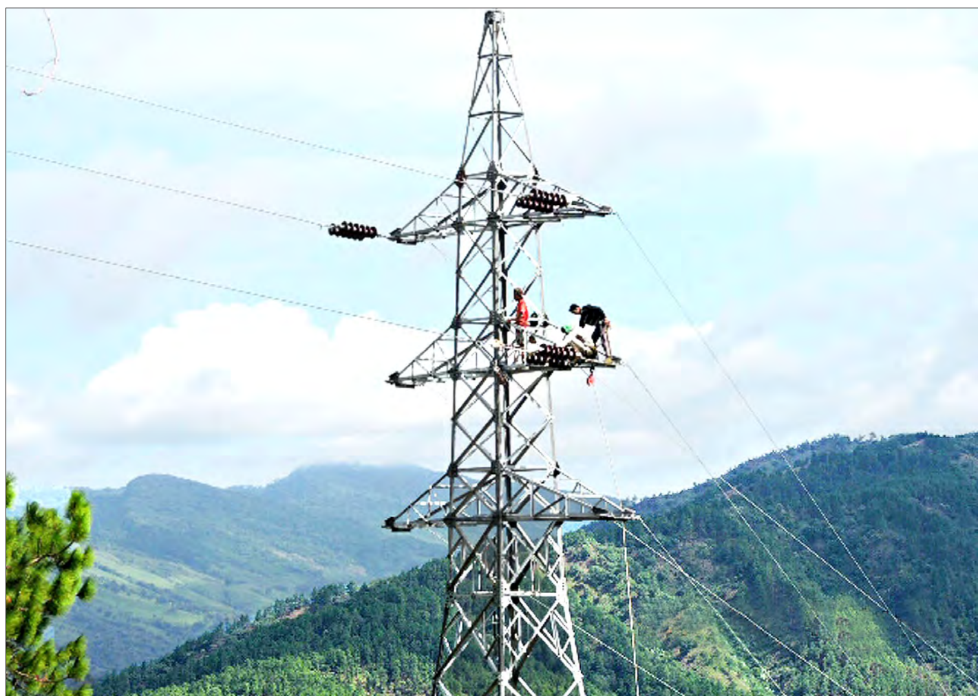
၂၀၁၅ ခုနှစ် ဇွန်လအတွင်းက ဟားခါးနှင့် ဖလမ်းဒေသ အကြား လျှပ်စစ်ကြိုးသွယ်တန်းခြင်းလုပ်ငန်း ဆောင်ရွက်နေစဉ်