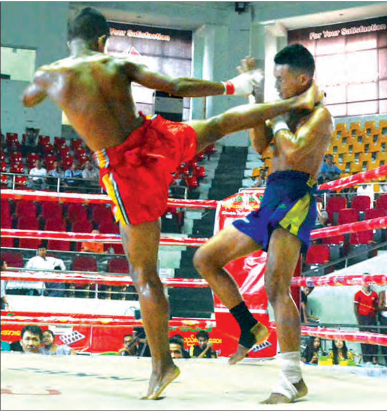
ထွန်းလွင်မိုး(နဂါးမာန်)ညာခြေကန်ချက် ဂျိုကာ(ရန်စစ်ငြိမ်း)လည်မျို ထိစိစဉ်