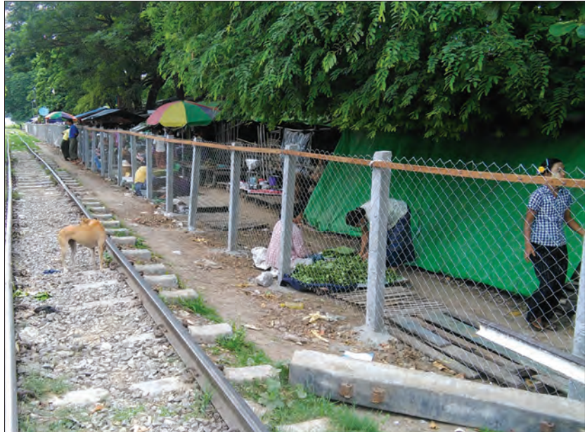
ရထားလမ်းဘေး ဈေးရောင်းဝယ်သူများ အန္တရာယ်ကင်းရန် သံဆန်ခါများကာရံ

အဆိုပါဈေး၌ ရပ်ကွက်/ကျေးရွာများရှိဈေးသည်များက အိမ်ခြံထွက် ဟင်းသီးဟင်းရွက်၊ သစ်သီးဝလံနှင့် ပန်းအမျိုးမျိုးတို့ကို နံနက်ဝေလီဝေလင်းအချိန်မှစ၍ လာရောက်ရောင်းချကြကြောင်း၊ ဈေးသည်များမှာ နေ့စဉ် သံလမ်းကို ကျောပေးရောင်းချနေကြကာ ဈေးဝယ်သူများအား အာရုံစိုက်နေချိန်များတွင် ရထားလာပါက အန္တရာယ်ရှိနိုင်သောကြောင့် ဈေးကော်မတီနှင့် ဈေးသူ ဈေးသားများ စုပေါင်းပြီး သံလမ်းနှင့် ခုနစ်ပေအကွာတွင်သံဆန်ခါကာရံခြင်းဖြစ်ကြောင်း၊ အရှည်ပေ ၄၀၀၊ အမြင့်ငါးပေရှိ သံဆန်ခါကို ကွန်ကရစ်တိုင်များစိုက်၍ ကာရံနိုင်ခဲ့သဖြင့် ဈေးရောင်း ဈေးဝယ်သူများအနေဖြင့် အန္တရာယ်ကင်းရှင်းစွာ ရောင်းချဝယ်ယူနိုင်ကြပြီဖြစ်ကြောင်း သိရသည်။ မျိုးဝင်းညို(ကျွန်းလှ)