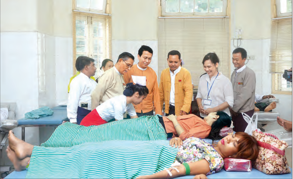
အမျိုးသားဒီမိုကရေစီအဖွဲ့ချုပ်နာယက ဦးတင်ဦး၊ ရန်ကုန်တိုင်းဒေသကြီးဝန်ကြီးချုပ် ဦးမြိုးမင်းသိန်းတို့က နိုင်ငံတော်၏ အတိုင်ပင်ခံပုဂ္ဂိုလ် ဒေါ်အောင်ဆန်းစုကြည်၏ မွေးနေ့အထိမ်းအမှတ်အဖြစ် သွေးလှူဒါန်းသူများ အား တွေ့ဆုံနှုတ်ဆက်အားပေးစဉ်

အသည်းရောင်အသည်းဝါ ဘီပိုးကာကွယ်ဆေးများထိုးနှံပေးခဲ့ကြောင်း သိရသည်။ (သတင်းစဉ်)