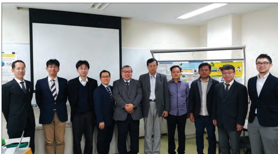
တိုကျိုစိုက်ပျိုးရေးနှင့် နည်းပညာတက္ကသိုလ်၌ စိုက်ပျိုးရေးပါမောက္ခများ

(Making Foods and Food Safety and Science in the 21 of Century) ဆိုသည့် သူတို့၏ ဆောင်ပုဒ်အတိုင်း သင်ကြားသုတေသနပြုနေပါသည်။