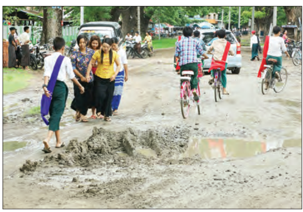
သစ်ကိုင်းမြောက်ကြီးအား အမြန်ဆုံးရှင်းလင်း ပေးစေလိုကြောင်း ဒေသခံပြည်သူများက လိုလားလျက်ရှိနေကြသည်။ သန်းထိုက်(ရေဦး)

စစ်ကိုင်းတိုင်းဒေသကြီး ရေဦးမြို့၊ ပိုလ်အောင်ဇေယျရပ်ကွက် အထက(၂) နှင့်ကပ်လျက် အရှေ့မှအနောက်သို့ ဖောက်လုပ်ထားသည့် အများပြည်သူ နေစဉ်အသုံးပြုသွားလာနေသည့် အရှည် ပေ ၁၀၀ဝခန့်ရှိ ကတ္တရာလမ်းသည် လမ်း အကြောင်းပေါက်ပြကာ ကာလရှည် ကြာမြင့်စွာ ချိုင့်ခွက်များ ဖြစ်ပေါ်လျက် မိုးရွာပါက ရေအိုင်သဖွယ်ဖြစ်နေသည်။ အဆိုပါလမ်းသည် ဒေသခံပြည်သူ များသာမက ရဟန်းသံဃာတော်များ နေစဉ် ဆွမ်းခံကြွခြင်း သံဃာတော် အပါး ၇၀ ခန့် အပတ်စဉ်အရုဏ်ဆွမ်း အလှူခံကြွခြင်းတို့အပြင် ကျောင်းသား များ ကျောင်းသွား ကျောင်းပြန်အသုံးပြု သော လမ်းဖြစ်သည်။ လမ်းပျက်စီးနေ သည့်အပြင် ခွားများက လမ်းမပေါ်တက် ဝပ်နေခြင်းများရှိ၍ ယာဉ်အန္တရာယ်ကြုံ တွေ့ နိုင်သည်။ ယာဉ်အန္တရာယ် ကင်းရှင်းစေရန်တိရစ္ဆာန်များ ရှင်းလင်း ပေးခြင်းနှင့်လမ်းသွားလာရေး အဆင် ပြေစေရန် မြို့နယ်တာဝန်ရှိသူများမှ ပြုပြင်ထိန်းသိမ်းဆောင်ရွက်ပေးစေလို ကြောင်း ကျောင်းသားမိဘတစ်ဦးက ပြောသည်။ ထို့အတူ မူလတန်းကျောင်းသို့သွား ရာလမ်းနှင့် ကျောင်းကြီးလမ်းဆုံရာ၌ ကုက္ကိုပင်ကြီးပေါ်တွင် ကြီးမားသော သစ် ကိုင်းခြောက်ကြီးမှာ လမ်းပေါ် ကန်လန့်ဖြတ်အနေအထားရှိ နေပြီး အောက်တွင် လျှပ်စစ်ဓာတ်အားလိုင်း ကြိုးများရှိနေသည့်အတွက် အချိန်မရွေး မူလတန်း ကျောင်းသားကလေးများ အတွက် အန္တရာယ်ရှိနိုင်သဖြင့်စာရာ