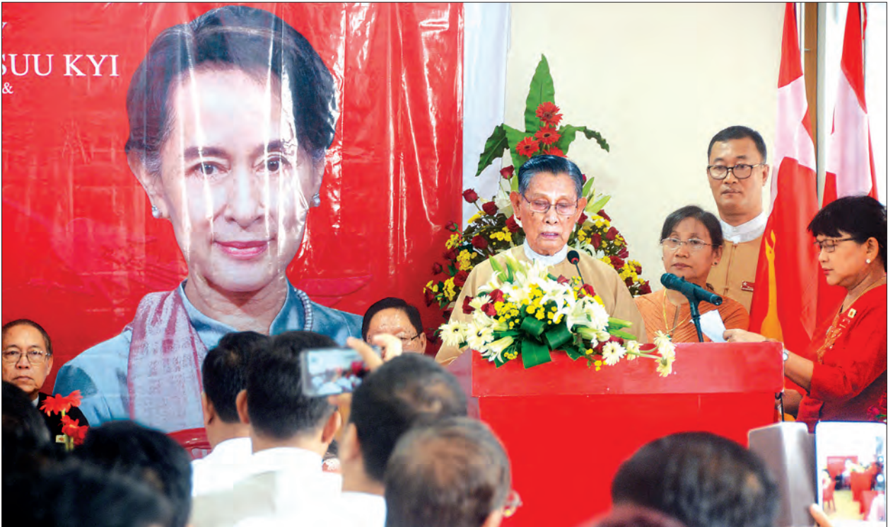
သူ့အတွက်ပိုပြီး ဆီလျော်လာတာပေါ့။ ဒီတိုင်းပြည်မှာရှိနေတဲ့ အခြေအနေနဲ့ ချို့ယွင်းဆုတ်ယုတ်နေတဲ့ ကိစ္စတွေကို

ဖွင့်ပွဲအတွက် မိတ်ဆက်အမှာစကားပြောကြားသည်။ (ယာဝု) ဆက်လက်၍ NLD ရုံးချုပ်သစ်အတွက် လှူဒါန်းကြသူများကို အမျိုးသားဒီမိုကရေစီအဖွဲ့ချုပ်နာယက သူရဦးတင်ဦး၊ အမျိုးသားဒီမိုကရေစီအဖွဲ့ချုပ် ပဟိုအလုပ်အမှုဆောင်ကော်မတီဝင် ဦးဉာဏ်ဝင်းနှင့် ရန်ကုန်တိုင်းဒေသကြီး လွှတ်တော်ဥက္ကဋ္ဌ ဦးတင်မောင်ထွန်းတို့က ဂုဏ်ပြုမှတ်တမ်းလွှာများ ပေးအပ်သည်။ အမျိုးသား ဒီမိုကရေစီအဖွဲ့ချုပ်နာယက သူရဦးတင်ဦးက နိုင်ငံတော်၏ အတိုင်ပင်ခံ ပုဂ္ဂိုလ် ဒေါ်အောင်ဆန်းစုကြည်နှင့်ပတ်သက်၍ “ဒီနေ့ကတော့ ဒီမိုကရေစီရေးနဲ့ပတ်သက်ရင် တကယ်ကို စွမ်းစွမ်းတမ်းတမ်းဆောင်ရွက်ခဲ့တဲ့ ခေါင်းဆောင်တစ်ယောက်အနေနဲ့ နိုင်ငံတကာက အသိအမှတ်ပြုခံရသူရဲ့ မွေးနေ့ပေါ့။ အရင်ကတော့ ဒေါ်အောင်ဆန်းစုကြည်က နိုင်ငံရေးခေါင်းဆောင်ဆိုတဲ့ သဘောမျိုးသက်ရောက်နေပေမယ့် နိုင်ငံရေးသမားထက် နိုင်ငံရေးသုခမိန့်ဆိုတာ