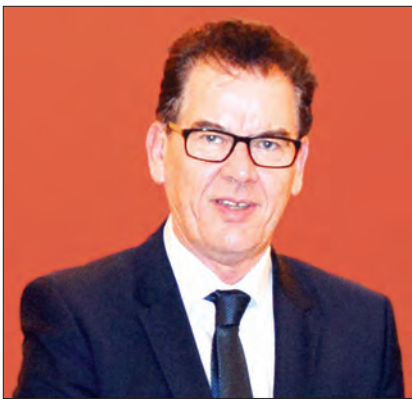
ဒေါက်တာဂဲလ်မြူးလာ(Dr.Gerd Müller)

ဝန်ကြီး ဒေါက်တာဂဲလ်မြူးလာကို ၁၉၅၅ ခုနှစ် ဩဂုတ် ၂၅ ရက်တွင် ဂျာမနီနိုင်ငံ Krumbach မြို့၌ မွေးဖွားခဲ့သည်။ ၎င်းသည် အိမ်ထောင်သည်တစ်ဦးဖြစ်ပြီး ဇနီး၊ ကလေး နှစ်ယောက်တို့နှင့်အတူ ဘာဗေးရီးယားပြည်နယ် ဒူရက်ချ်ဒေသ ကမ်းပတ်မြို့၌ နေထိုင်လျက်ရှိသည်။ ဒေါက်တာဂဲလ်မြူးလာ သည် Business Education ဖြင့် မဟာဘွဲ့ရရှိထားပြီး ကက်သလစ်ဘာသာဝင်တစ်ဦးဖြစ်သည်။