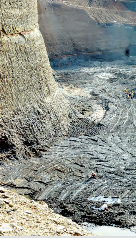
မှော်ပိုင်းကြီးလုပ်ကွက်တွင် ရေမဆေးကျောက်များ တရားမဝင် ဝင်ရောက်ရှာဖွေနေသူများကို တွေ့ရစဉ်

ထို့အပြင် “ဘယ်သူ၊ ဘယ်နေရာမှာ တန်ဖိုးရှိတဲ့ ကျောက်ရသွားတယ်” ဆိုသည့်သတင်းများကလည်း အနယ်နယ်အရပ်ရပ်မှ ပျံ့ကျအလုပ်သမားများကို ရေမဆေးကျောက် ရှာဖွေဖို့အတွက် ဖားကန့်မြေသို့လာရောက်ရန် ဖိတ်ခေါ်သကဲ့သို့ဖြစ်ခဲ့ပြီး။ “ရေမဆေး” အရေအတွက်လည်း တဖြည်းဖြည်းနှင့် တိုးပွားလာခဲ့သည်။