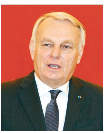
မစ္စတာ ဂျီးမာ့ခ်အီရော့ခ်(Mr. Jean-Marc Ayrault)

မစ္စတာ ဂျီးမာ့ခ်အီရော့ခ်နှင့် ၎င်း၏ဝန်ကြီးများအဖွဲ့သည် အစိုးရအဖွဲ့တာဝန်ယူစဉ် ပင်စင်ယူသည့်အသက်ကို ၆၂ နှစ်မှ ၆၀ နှစ်သို့ လျော့ချပေးသည့် ကိစ္စရပ်များအပါအဝင် အလုပ် သမားရေးရာကိစ္စရပ်များနှင့် ဝန်ကြီးများ၏လစာကို ၃၀ ရာခိုင်နှုန်းဖြုတ်တောက်ခြင်း၊ အနိမ့်ဆုံးလုပ်ခလစာအား မြှင့်တင် သတ်မှတ်ခြင်း၊ မြို့ကြီးအချို့ရှိ ကန်ထရိုက်သစ်များအပေါ် ၃၆ လ ငှားရမ်းမှုနှုန်းကိုထိန်းချုပ်ခြင်း၊ ဝင်ငွေနည်းမိသားစု များအတွက် ပညာရေးထောက်ပံ့ငွေတိုးမြှင့်ပေးခြင်း၊