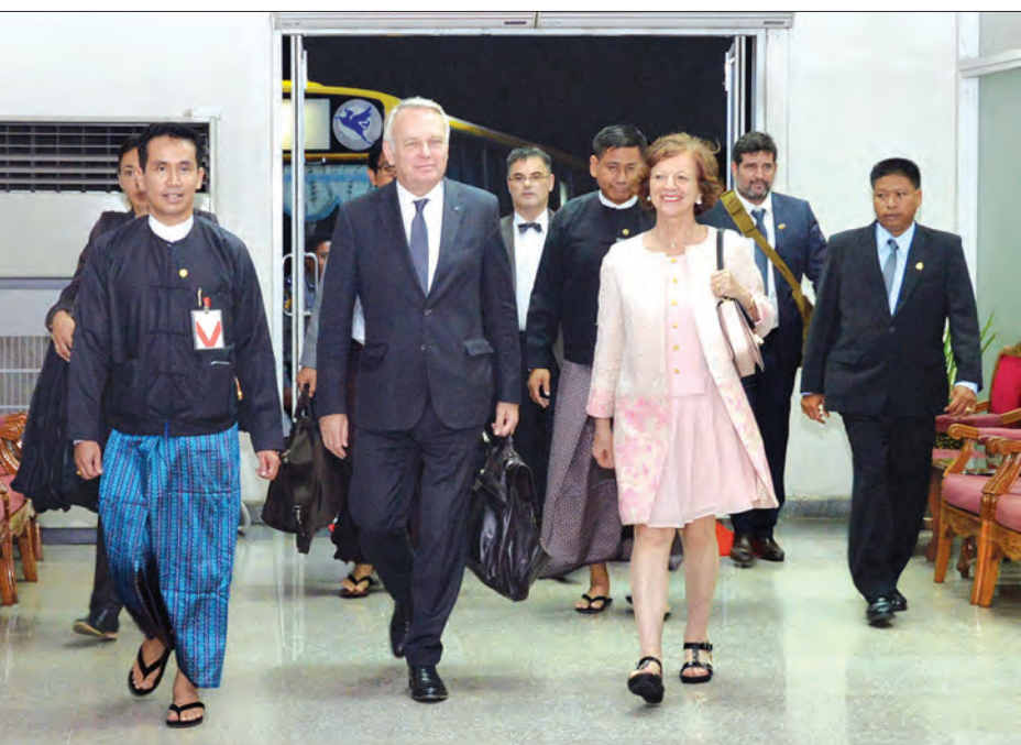
ပြင်သစ်သမ္မတနိုင်ငံ နိုင်ငံခြားရေးနှင့် နိုင်ငံတကာဖွံ့ဖြိုးတိုးတက်ရေးဝန်ကြီး မစ္စတာ ဂျီးမာ့ခ်အီရော့ခ်ဦးဆောင်သည့် ကိုယ်စားလှယ်အဖွဲ့ ရန်ကုန်အပြည်ပြည်ဆိုင်ရာလေဆိပ်သို့ရောက်ရှိလာရာ တာဝန်ရှိသူများက ကြိုဆိုကြစဉ်

အသက် ၁၆ နှစ်မှ ၂၅ နှစ်အတွင်း လူငယ်များအတွက် အလုပ်တိုးမြှင့်ခန့်ထားရေးစနစ်ကို မိတ်ဆက်ပေးခြင်းနှင့် အခမဲ့ကျန်းမာရေးစောင့်ရှောက်မှုပေးသည့်အစီအစဉ်အား လူဦးရေငါးသိန်းအတွက် ထပ်မံတိုးမြှင့်ခြင်းတို့ကို ဆောင် ရွက်ခဲ့သူ ဖြစ်သည်။