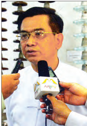
ဦးထိန်လွင် အမြဲတမ်းအတွင်းဝန် လျှပ်စစ်နှင့် စွမ်းအင်ဝန်ကြီးဌာန

နဲ့ သူတို့ဆီက စီးပွားရေးအဖွဲ့အစည်းတွေနဲ့ တွေ့ဆုံပါတယ်။ ဒီလိုတွေ့တဲ့အခါမှာ အဓိက ပြင်သစ်နဲ့ ကျွန်တော်တို့ လျှပ်စစ်စွမ်းအင်ကဏ္ဍ ပူးပေါင်းဆောင်ရွက်ဖို့ ဆွေးနွေးခဲ့ပါတယ်။ ရှမ်းပြည်မြောက်ပိုင်းမှာ မဂ္ဂိုလ် ၁၀၅၀ လောက်ထုတ်လုပ်နိုင်တဲ့ ရွှေလီ(၃)ရေအားလျှပ်စစ်စီမံကိန်းကြီး