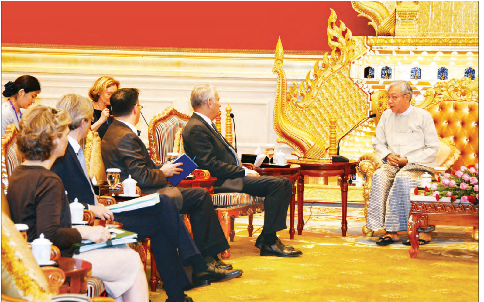
နိုင်ငံတော်သမ္မတ ဦးထင်ကျော်နှင့် ပြင်သစ်နိုင်ငံ နိုင်ငံခြားရေးနှင့် နိုင်ငံတကာဖွံ့ဖြိုးတိုးတက်ရေးဝန်ကြီး မစ္စတာ ဂျီမာဒ်အီရောင်တို့ တွေ့ဆုံဆွေးနွေးစဉ်

မွန်းလွဲပိုင်းတွင် ပြင်သစ်နိုင်ငံခြား ရေးဝန်ကြီး မစ္စတာ ဂျီမာဒ်အီရောင် သည် ပြည်ထောင်စုလွှတ်တော်နာယက၊ အမျိုးသားလွှတ်တော်ဥက္ကဋ္ဌ မန်းဝင်း ခိုင်သန်းအား နေပြည်တော်ရှိ အမျိုးသား လွှတ်တော် ဧည့်ခန်းမဆောင်သို့ သွား ရောက် တွေ့ဆုံပြီး နှစ်နိုင်ငံချစ်ကြည် ရင်းနှီးမှု တိုးမြှင့်ရေးဆိုင်ရာ ကိစ္စရပ်များကို ဆွေးနွေးခဲ့သည်။