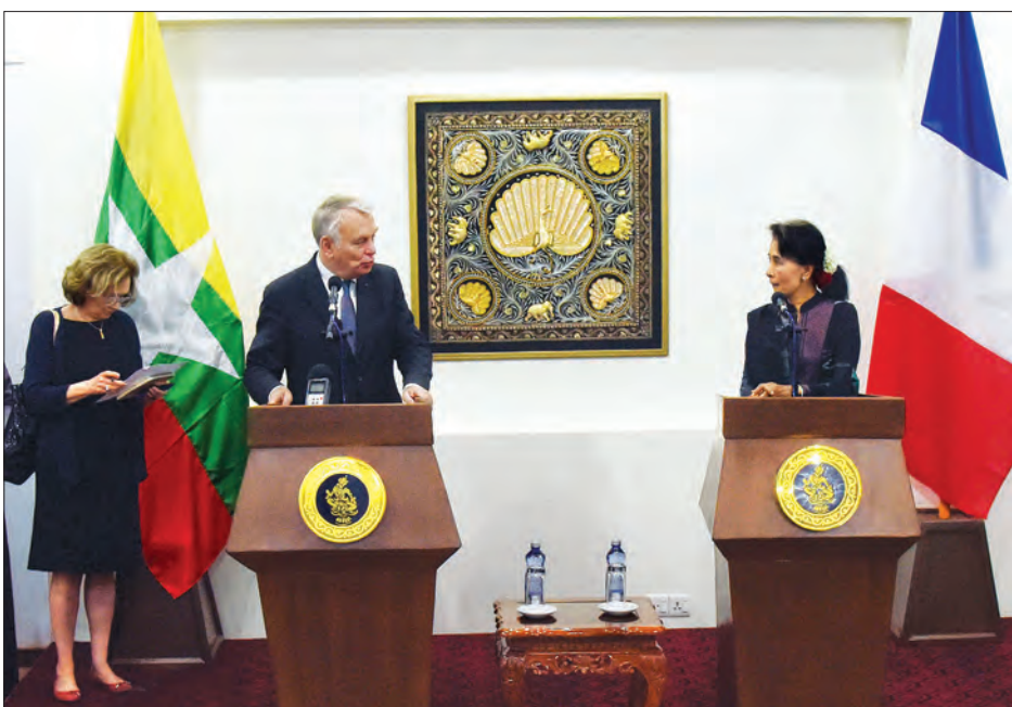
ပြည်ထောင်စုဝန်ကြီး ဒေါ်အောင်ဆန်းစုကြည်နှင့် ပြင်သစ်နိုင်ငံ နိုင်ငံခြားရေးနှင့် နိုင်ငံတကာဖွံ့ဖြိုးတိုးတက်ရေးဝန်ကြီး မစ္စတာ ဂျီးမာဒ်အီရောင်တို့ သတင်းစာရှင်းလင်းပွဲပြုလုပ်စဉ်

ထို့ပြင် ပြင်သစ်နိုင်ငံခြားရေးဝန်ကြီးက အစိုးရမဟုတ်သည့် အဖွဲ့အစည်းများလည်း မြန်မာနိုင်ငံတွင် လုပ်ကိုင်လျက်ရှိပါ ကြောင်း၊ စီးပွားရေး၊ ယဉ်ကျေးမှုနှင့်အခြားကဏ္ဍများတွင် ဖွံ့ဖြိုးတိုးတက်ရန် နှစ်နိုင်ငံအကြားပူးပေါင်းဆောင်ရွက်လိုပါ ကြောင်း၊ ပြင်သစ်ယဉ်ကျေးမှုဌာနတည်ထောင်ခဲ့သည့် ၅၅ နှစ် မြောက် ယဉ်ကျေးမှုပွဲတော်ကြီးကိုလည်း ယခုနှစ်တွင်ကျင်းပရန် စီစဉ်ထားပါကြောင်း၊ ရန်ကုန်မြို့၌ရှိသည့် ပြင်သစ်ကျောင်းကို