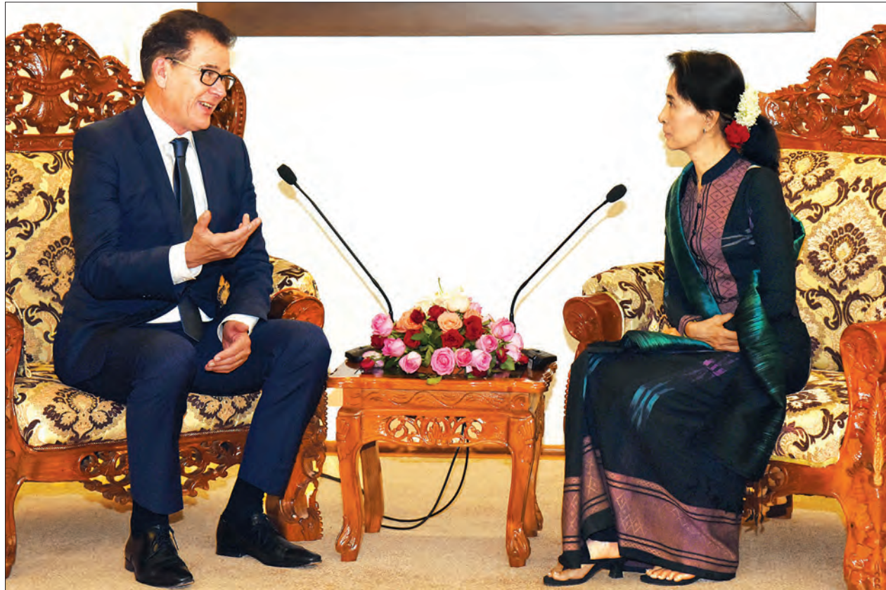
ပြည်ထောင်စုဝန်ကြီး ဒေါ်အောင်ဆန်းစုကြည်နှင့် ဂျာမနီနိုင်ငံ စီးပွားရေးဖွံ့ဖြိုးတိုးတက်မှုနှင့် ပူးပေါင်းဆောင်ရွက်မှုဝန်ကြီးဌာန ဝန်ကြီး ဒေါက်တာဂဲလ်ဖြူးလာတို့ တွေ့ဆုံ ဆွေးနွေးစဉ်

ပြင်သစ်နိုင်ငံခြားရေးဝန်ကြီးသည် ရန်ကုန်မြို့တွင် ရန်ကုန်တိုင်းဒေသကြီး ဝန်ကြီးချုပ်၊ မြန်မာလူမှုအဖွဲ့အစည်း မှ ကိုယ်စားလှယ်များနှင့် တွေ့ဆုံမည် ဖြစ်ပြီး ဦးသန့်၏နေအိမ်၊ အတွင်းဝန် များနှင့် ရွှေတိဂုံစေတီတော်သို့ သွား ရောက်လေ့လာမည်ဖြစ်ကြောင်း သိရ သည်။ (သတင်းစဉ်)