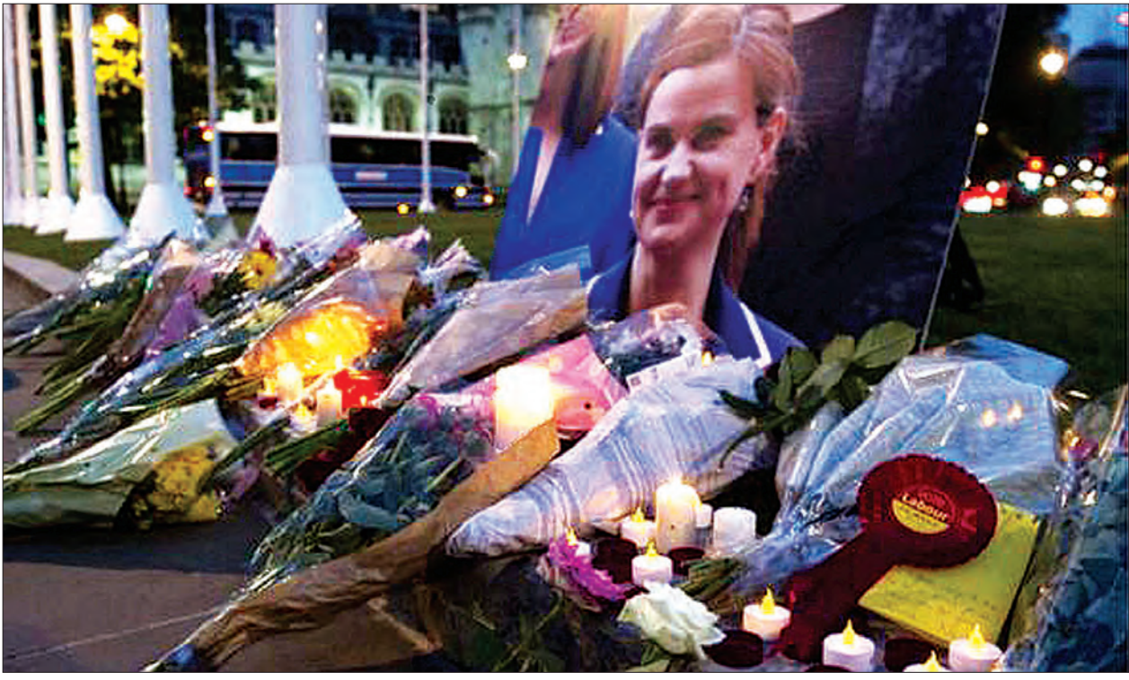
အုပ်စုနှင့် ခွဲထွက်လိုခြင်းမရှိသည့် အုပ်စုနှစ်ခုလုံးကပါ ၎င်း၏သေဆုံးမှုကြောင့် မဲဆွယ်စည်းရုံးလှုပ်ရှားမှုများကို ရပ်ဆိုင်းထားသည်။ ပြတိန်ဝန်ကြီးချုပ် ဒေးဗစ်ကင်မရူးက စပိန်ကမ်းရိုးတန်းတောင်ပိုင်း ပြတိန်နယ်မြေရှိ ဂျီဘရော်လတာ၌ လူထုစည်းဝေးပွဲများကို ရုပ်သိမ်းရန် စီစဉ်ထားကြောင်းပြောသည်။ ပြတိန်သည်ဥရောပသမဂ္ဂမှထွက်ခွာရန်သင့်မသင့် လူထုဆန္ဒမူပွဲကို ဇွန် ၂၃ ရက်တွင် ပြုလုပ်မည်ဖြစ်သည်။ (ရိုက်တာ)