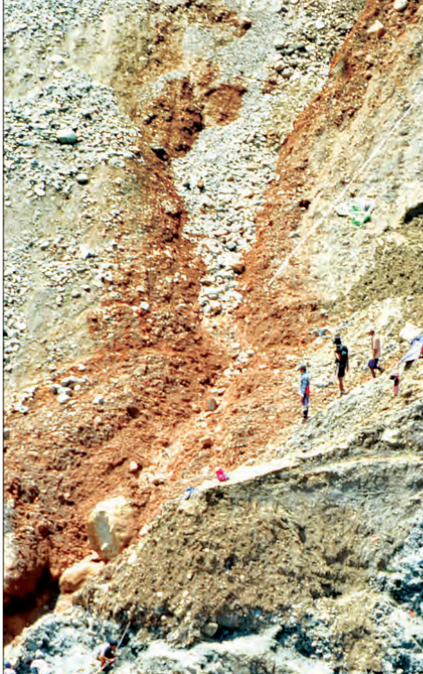
ဝေခါ မော်လုပ်ကွက်၌ ရေမဆေးကျောက် စွန့်စွန့်စားစားကျောက်ရှာဖွေနေသည်ကို တွေ့ရစဉ်

“မကြာသေးမီက မြေကမ်းပါးပျံကျပြီး လူသေဆုံးမှုဖြစ်စဉ် ဖြစ်ပွားခဲ့တဲ့ ဝေခါမော်လုပ်ကွက်ဧရိယာမှာ ကုမ္ပဏီလုပ်ငန်းရှင်တွေကို တရားမဝင်ချပေးထားတာဖြစ်ပြီး မိုးရာသီရောက်လို့ လုပ်ငန်းတွေ ရပ်နားထားတာ ဖြစ်ပါတယ်။ ဒါပေမယ့် အဲဒီအနီးဝန်းကျင်မှာ နေထိုင်တဲ့ ရေမဆေးတွေက ကျောက်ရလို့ဇော တစ်ခုတွေနဲ့ အန္တရာယ်ကို သတိမမူတော့ဘဲ၊ နည်းစနစ်မှန်မဟုတ် ဝင်ရောက် ရှာဖွေတူးဖော်ချိန်မှာ မမျှော်လင့်ဘဲ ကမ်းပါး ပြိုကျမှုတွေဖြစ်၊ မြေစာတွေပြိုကျမှုတွေဖြစ်ပေါ်ကာ ဘေးအန္တရာယ်ဆိုးနွံ ကြုံတွေ့