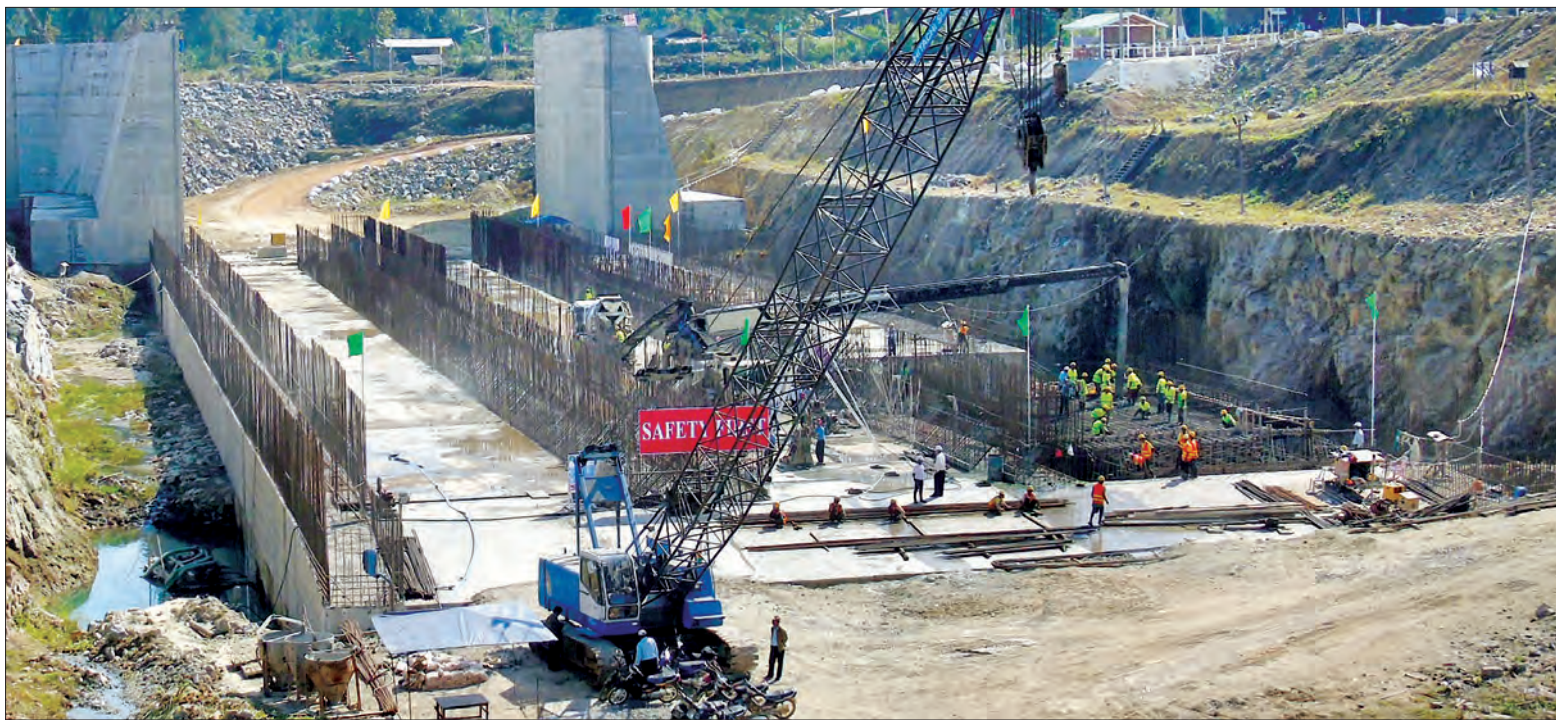
ရွှေလီ (၃)ရေအားလျှပ်စစ်စီမံကိန်း လုပ်ငန်းခွင်ကို တွေ့ရစဉ်

ယင်းတွေ့ဆုံဆွေးနွေးမှုမှတစ်ဆင့် မြန်မာနိုင်ငံ၏ လျှပ်စစ်လိုအပ်ချက် ဖြည့်ဆည်းနိုင်ရေးနှင့် ပတ်သက်၍ ပြင်သစ်နိုင်ငံနှင့် ပူးပေါင်းဆောင်ရွက် သွားမည့် အခြေအနေများအပေါ် စာမျက်နှာ ၇ ကော်လံ ၃ ❖