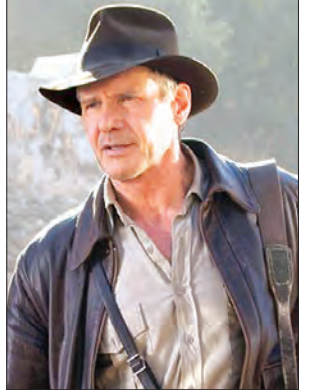
လေးကားကို ရိုက်ကူးခဲ့ပြီး အသစ်ရိုက်ကူးမည်ဇာတ်ကားအတွက် စိတ်လှုပ်ရှားမိကြောင်းလည်း ဆိုသည်။ ဟာရီဆင်ဖို့ဒ်သည်လည်းဇာတ်ကားသစ်ရိုက်ကူးမည်အခါ၌ ၎င်း၏အသက်မှာ ၇၇ နှစ်ရှိလာမည်ဖြစ်သည်။ ယခုနှစ် အစောပိုင်းကလည်း ဟာရီဆင်ဖို့ဒ်က ၎င်းအနေဖြင့် ဇာတ်ကားသစ်ထပ်မံ ရိုက်ကူးရန်ဆန္ဒရှိကြောင်း သို့သော် စတီဗင်စပီးဘတ်မပါဘဲ ရိုက်ကူးမည်မဟုတ်ကြောင်း ပြောသည်။ (ဆင်ဟွာ)

“ဇာတ်လမ်းရဲ့ အဆုံးသတ်မှာ ဟာရီဆင်ဖို့ဒ်ကို သေခိုင်းမှာမဟုတ်ဘူး” ဟု စပီးဘတ်က ပြောသည်။ ၎င်းသည် အင်ဒီရာနာဂျူးဇာတ်ကား