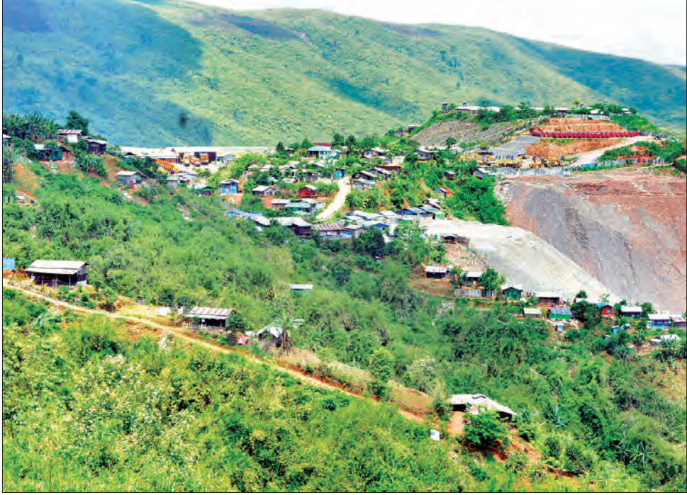
ဖားကန့် ပြို့ဝေပေါ်ကျေးရွာနှင့် စုပေါင်းမြေစာပုံကို တွေ့ရစဉ်

သတင်းဆောင်းပါး-တင်မောင်လွင်(မြန်မာ့အလင်း)၊ ဓာတ်ပုံ-မောင်မွှေး