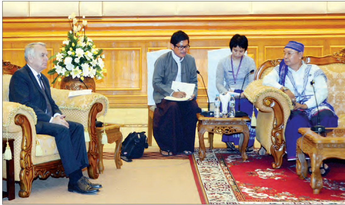
ပြည်ထောင်စုလွှတ်တော် နာယက အမျိုးသားလွှတ်တော် ဥက္ကဋ္ဌ မန်းဝင်း ခိုင်သန်းနှင့် ပြင်သစ်နိုင်ငံခြားရေး ဝန်ကြီး မစ္စတာ ဂျိုးမာ့ဒ်အီရောင်တို့ နေပြည်တော်ရှိ အမျိုးသားလွှတ်တော် ဧည့်ခန်းမဆောင်၌ နှစ်နိုင်ငံချစ်ကြည် ရင်းနှီးမှု တိုးမြှင့်ရေးဆိုင်ရာများ ဆွေးနွေးစဉ် သတင်း(စာ-၄) (သတင်းစဉ်)

ရန်ကုန် ဇွန် ၁၇ မြတ်စွာဘုရားရှင်သည် နယုန်လပြည့်နေ့တွင် ကပ္ပိလဝတ်ပြည် မဟာဝုန်တော်ကြီးအတွင်း မဟာသမယသုတ်တော်အား တော်ကြားတော်မူသည်ကို အကြောင်းပြု၍ကျင်းပမည့် နယုန်လပြည့် မဟာသမယအခါတော်နေ့မင်္ဂလာအခမ်းအနားကို ဇွန် ၂၀ ရက် (တနင်္လာနေ့) နံနက် ၇ နာရီတွင် ရန်ကုန်တိုင်းဒေသကြီး အင်းစိန်မြို့နယ် မင်းဓမ္မကုန်းတော်ပေါ်ရှိ လောကချမ်းသာ အဘယလာဘမုနိရုပ်ပွားတော်မြတ်ကြီး (ကျောက်တော်ကြီး ဘုရား)၌ ကျင်းပမည်ဖြစ်သည်။ အဆိုပါ နယုန်လပြည့် မဟာသမယအခါတော်နေ့ မင်္ဂလာ အခမ်းအနားသို့ ဘုရားဖူးလာပြည်သူများ ကြွရောက်ကြည့်ညှိ တရားတော်နာယူနိုင်ကြောင်း သိရသည်။ ကိုချစ်