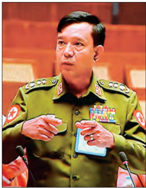
လုံခြုံရေးနှင့် နယ်စပ်ရေးရာဝန်ကြီး ဝိုင်းမိုးကြီး တင်အောင်ထွန်း ပြန်လည်ဖြေကြားစဉ်

ရန်ကုန်တိုင်းဒေသကြီးအတွင်း တရားမဝင်လိုင်စင်မဲ့အရက်များ ဖမ်းဆီးမှုမှာ ငါးလကျော်အတွင်း အမှုပေါင်းတစ်ထောင်ကျော် ဖမ်းဆီးနိုင်ခဲ့ကြောင်း တိုင်းဒေသကြီး မူးယစ်ဆေးဝါးနှင့် စိတ်ကိုပြောင်းလဲစေသော ဆေးဝါးများ အန္တရာယ် တားဆီးကာကွယ်ရေးအဖွဲ့ ဥက္ကဋ္ဌ လုံခြုံရေးနှင့် နယ်စပ်ရေးရာဝန်ကြီး ဝိုင်းမိုးကြီး တင်အောင်ထွန်းက ပြောကြားသည်။