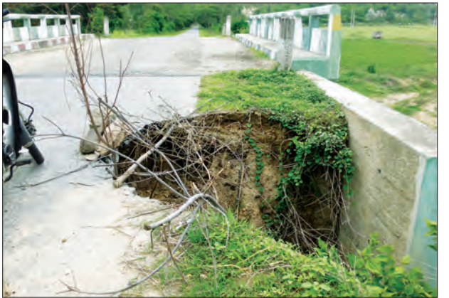
တင်စိုးလွင်(ပြန်/ဆက်)

နေပြည်တော်တပ်ကုန်းမြို့နယ် ကင်းသကျေးရွာမှ မန္တလေး တိုင်းဒေသကြီး ကျောက်ဆည်မြို့နယ် ဖျောက်ဆိပ်ပင်ကျေးရွာ အထိ အရှည် ၁၁၃ မိုင်၊ ၇ ဖာလုံရှိသော အမှတ်(၂)ခရိုင်ချင်း ဆက် ကတ္တရာကားလမ်းသည် တပ်ကုန်းမြို့နယ်အတွင်း မိုင်တိုင် ၁၄၉/၁ နှင့် ၁၄၉/၂ အကြားရှိ တံတား၏မြောက်ဘက် ထိပ်တွင် ကတ္တရာခင်းလမ်း သုံးပေခန့်နှင့် လမ်းမြေချောက်အပေါက်ကို ဇွန် ၁၀ ရက် နံနက်ပိုင်းက ပျက်စီးနေမှုအား တွေ့ရှိရသည်။ အဆိုပါခရိုင်ချင်းဆက်ကားလမ်းတွင် ကတ္တရာခင်းလမ်း သုံးပေခန့်နှင့် လမ်းမြေချောက်အပေါက်ကို ပြန်လည်ပြုပြင်ပေးစေ လိုပါသည်။ အဆိုပါလမ်းကို နေ့/ည ဖြတ်သန်းမောင်းနှင် အသုံးပြုကြသည့် ကားများနှင့် အနီးအနားရှိကျေးရွာများမှ ဆိုင်ကယ်စီးသမားများအား အန္တရာယ်ဖြစ်နိုင်စေရန် ပြုပြင် ခြင်းမပြုလုပ်မီ သတိပြုမောင်းနှင်ကြရန် အမှတ်အသားတစ်ခုကို ပြုလုပ်ထားသင့်ကြောင်း အကြံပြုတင်ပြအပ်ပါသည်။