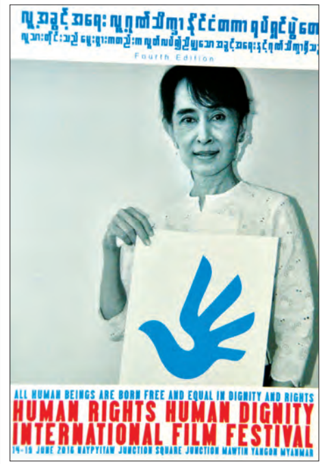
ALL HUMAN BEINGS ARE BORN FREE AND EQUAL IN DIGNITY AND RIGHTS. HUMAN RIGHTS HUMAN DIGNITY INTERNATIONAL FILM FESTIVAL. 14-16 JUNE 2016 WATPHAYAN JUNCTION SQUARE JUNCTION MARTIN TANGOR MYANMAR.

လူ့အခွင့်အရေးနှင့်ပတ်သက်ပြီး ပြည်သူများ ကျယ်ကျယ် ပြန့်ပြန့်သိရှိလာစေရန်ရည်ရွယ်၍ လူ့အခွင့်အရေး၊ လူ့ဂုဏ် သိက္ခာနိုင်ငံတကာရုပ်ရှင်ပွဲတော် ကျင်းပသွားမည်ဖြစ်ကြောင်း