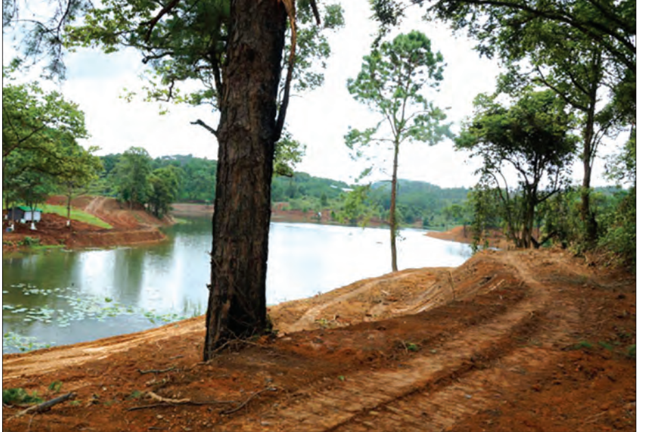
လွိုင်လင်မြို့ကျက်သရေဆောင် မြကန်သာရေကန် ပတ်လမ်းဖောက်လုပ်ခြင်းလုပ်ငန်းကို ဇွန် ၁၃ ရက်က တွေ့ရစဉ်

ကွတ်ချိုးကန် တူးဖော်ခြင်းလုပ်ငန်းများကိုမူ ယခုရက်ပိုင်းတွင် မိုးအဆက်မပြတ်ရွာသွန်းနေသောကြောင့် မြေပျော့လွန်းသဖြင့် ခေတ္တရပ်ဆိုင်းထားကြောင်း၊ ကွတ်ချိုးကန်ကို နန်းတားကန်အဖြစ် တူးဖော်တည်ဆောက်မည်ဖြစ်ပြီး မြို့ရေပေးဝေရေးလုပ်ငန်းများကို စတင်ပင်သာယာရေးဌာနမှ တာဝန်ယူဆောင်ရွက်မည်ဖြစ်ကြောင်း၊ ကန်ရေတင်ခြင်းလုပ်ငန်းအတွက် ထရန်စဖော်မာကို လျှပ်စစ်ဌာနက တပ်ဆင်ဆောင်ရွက်မည်ဖြစ်ကြောင်း၊ အဆိုပါလုပ်ငန်းများအားလုံးအတွက် ရှမ်းပြည်နယ်အစိုးရအဖွဲ့ ရန်ပုံငွေ ကျပ်သန်း ၂၃၀ ခွင့်ပြုထားကြောင်း ဆည်မြောင်းဦးစီးဌာနမှ တာဝန်ရှိသူတစ်ဦးက ပြောသည်။