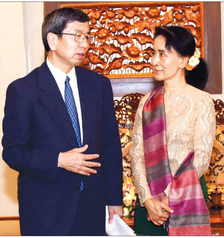
ပြည်ထောင်စုဝန်ကြီး ဒေါ်အောင်ဆန်းစုကြည်နှင့် အာရှဖွံ့ဖြိုးရေးဘဏ်ဥက္ကဋ္ဌ မစ္စတာ တက်ဟိကို နာကာအိုတို့ တွေ့ဆုံစဉ်