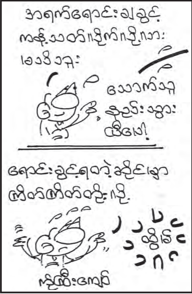
ထင်သာမြင်သာပြုပြင်စရာ

အဆိုပါလုပ်ငန်းဌာနသည် လွတ်လွတ်လပ်လပ် သုတေသနပြုလုပ်ဆောင်ရွက်ပိုင်ခွင့်ရှိသော လုပ်ငန်းဌာနဖြစ်သင့်ပါသည်။ သို့မှသာ တိုင်းပြည်၏အကျိုးစီးပွားအတွက်အပြည့်အဝဆောင်ရွက်နိုင်မည်ဖြစ်ပါသည်။ အရေးကြီးသည်မှာ ပြည်ထောင်စုဝန်ကြီး ဦးကျော်ဝင်းပြောဆို တင်ပြသွားသကဲ့သို့ လူထုအစိုးရနှင့် စီးပွားရေးလုပ်ငန်းရှင်များအကြား လက်တွဲညှိနှိုင်း ပူးပေါင်းဆောင်ရွက်ရန်ဖြစ်ပါသည်။ အပေးအယူ၊ အတိုင်အဖောက်ညီမျှသော လူထုအစိုးရနှင့် စီးပွားရေးလုပ်ငန်းရှင်များ၏ လက်တွဲညှိနှိုင်း ပူးပေါင်းဆောင်ရွက်မှုသည်သာ တိုင်းပြည်ဖွံ့ဖြိုးတိုးတက်မှုကို အရှိန်အဟုန်မြှင့်တင်ဆောင်ရွက်ပေးနိုင်မည်ဖြစ်ပါသည်။