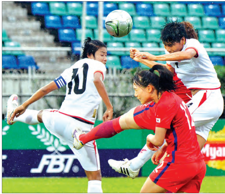
မြန်မာအမျိုးသမီးဘောလုံးအသင်း အာရှထိပ်သီး တောင်ကိုရီးယား လက်ရွေးစင်အသင်းနှင့် ခြေစမ်းကစားခဲ့စဉ်

သတင်း-ညိုမြတ်သော်တာ ရန်ကုန် ဇွန် ၁၀ မြန်မာနိုင်ငံက အိမ်ရှင်အဖြစ်လက်ခံ ကျင်းပမည့် ၂၀၁၆ အာဆီယံအမျိုးသမီးဘောလုံးပြိုင်ပွဲ ပွဲစဉ်များထွက်ပေါ်လာပြီဖြစ်ပြီး အိမ်ရှင်မြန်မာအသင်းသည် တီမောအသင်းနှင့် ပွဲဦးထွက်ယှဉ်ပြိုင်ကစားရမည်ဖြစ်သည်။ အဆိုပါပြိုင်ပွဲကို ဇူလိုင် ၂၆ ရက်မှ ဩဂုတ် ၄ ရက်အထိ မန္တလေးမြို့ရှိ မန္တလေးသီရိဘောလုံးကွင်း၌ ကျင်းပမည်ဖြစ်ပြီး အသင်း ရှစ်သင်း ယှဉ်ပြိုင်မည်ဖြစ်သည်။ ပြိုင်ပွဲကိုလေးသင်း နှစ်အုပ်စုခွဲ၍ ကျင်းပမည်ဖြစ်ပြီး အိမ်ရှင်မြန်မာအသင်းသည် အုပ်စု(ခ)တွင် ဩစတြေးလျ၊ ယူ.၂၀၊ မလေးရှား၊ တီမောအသင်းတို့နှင့် တစ်အုပ်စုတည်း ကျရောက်နေကာ အုပ်စု(က)တွင် လက်ရှိချန်ပီယံ ထိုင်း၊ ဗီယက်နမ်၊ စင်ကာပူနှင့် ဖိလစ်ပိုင်အသင်းတို့ ပါဝင်လျက်ရှိသည်။ အုပ်စုပွဲစဉ်များကို တစ်နေ့လျှင်နှစ်ပွဲနှုန်းဖြင့် ကျင်းပမည် စာမျက်နှာ ၁၄ ကော်လံ ၁ ○