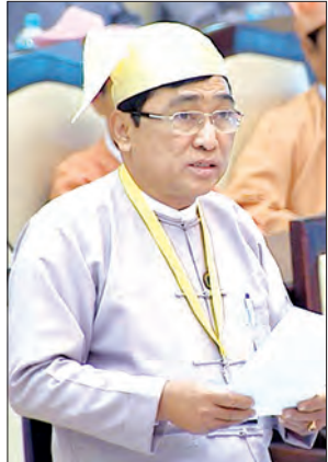
ပြည်ထောင်စုဝန်ကြီး ဦးဝင်းမြတ်အေး

ကမ္ဘာပေါ်တွင် လူငယ်မူဝါဒ ရေးဆွဲ အကောင်အထည်ဖော်ဆောင် ရွက်နိုင်ခြင်းမရှိသည့် နိုင်ငံပေါင်း ၃၀