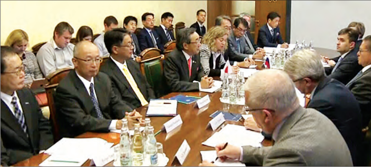
မော်စကို ဇွန် ၁၀

ဂျပန်စီးပွားရေး လုပ်ငန်းရှင်များအဖွဲ့ ချုပ်မှ တာဝန်ရှိသူများသည် ရုရှားနိုင်ငံ ၏ စီးပွားရေးဖွံ့ဖြိုးမှုတွင် အထောက်အကူပြုနိုင်ရေး စီစဉ်ဆောင်ရွက်ရန် သဘောတူခဲ့သည်။