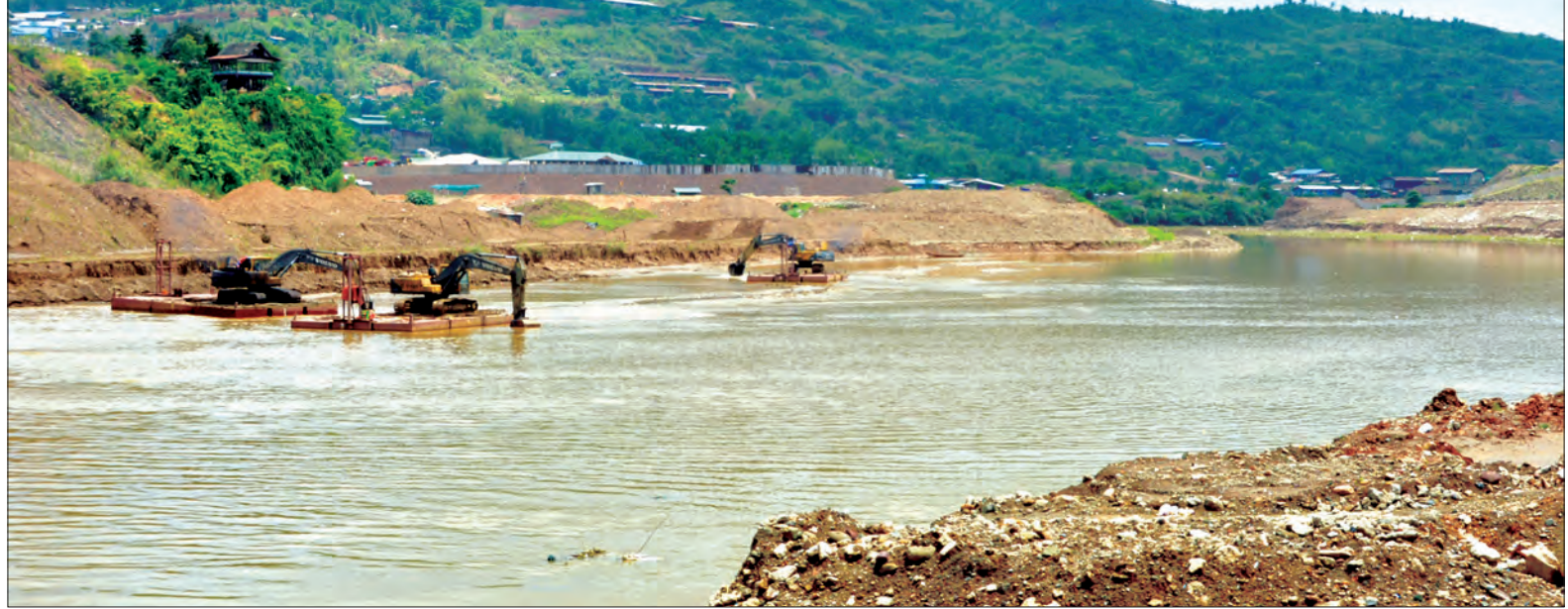
ကျောက်စိမ်းထုတ်လုပ်သည့်ကုမ္ပဏီများက ဥရုချောင်းအတွင်း စက်ယန္တရားများဖြင့် ရှင်းလင်းနေသည်ကို တွေ့ရစဉ်