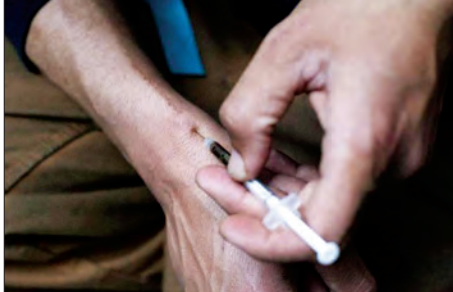
မက္ကဆီကိုစီးတီး ဇွန် ၁၀

မက္ကဆီကို၊ အမေရိကန်နှင့် ကနေဒါသုံးနိုင်ငံသည် ဘိန်းစိုက်ပျိုးမှုနှင့်မြောက်အမေရိကတစ်ဝန်း ဘိန်းဖြူဖွံ့ဖြိုးမှု နှိမ်နင်းရေးကို ယခုလနှောင်းပိုင်းတွင် အစည်းအဝေးတစ်ခုပြုလုပ်မည်ဟု မက္ကဆီကိုအစိုးရက ကြာသပတေးနေ့တွင် ပြောသည်။