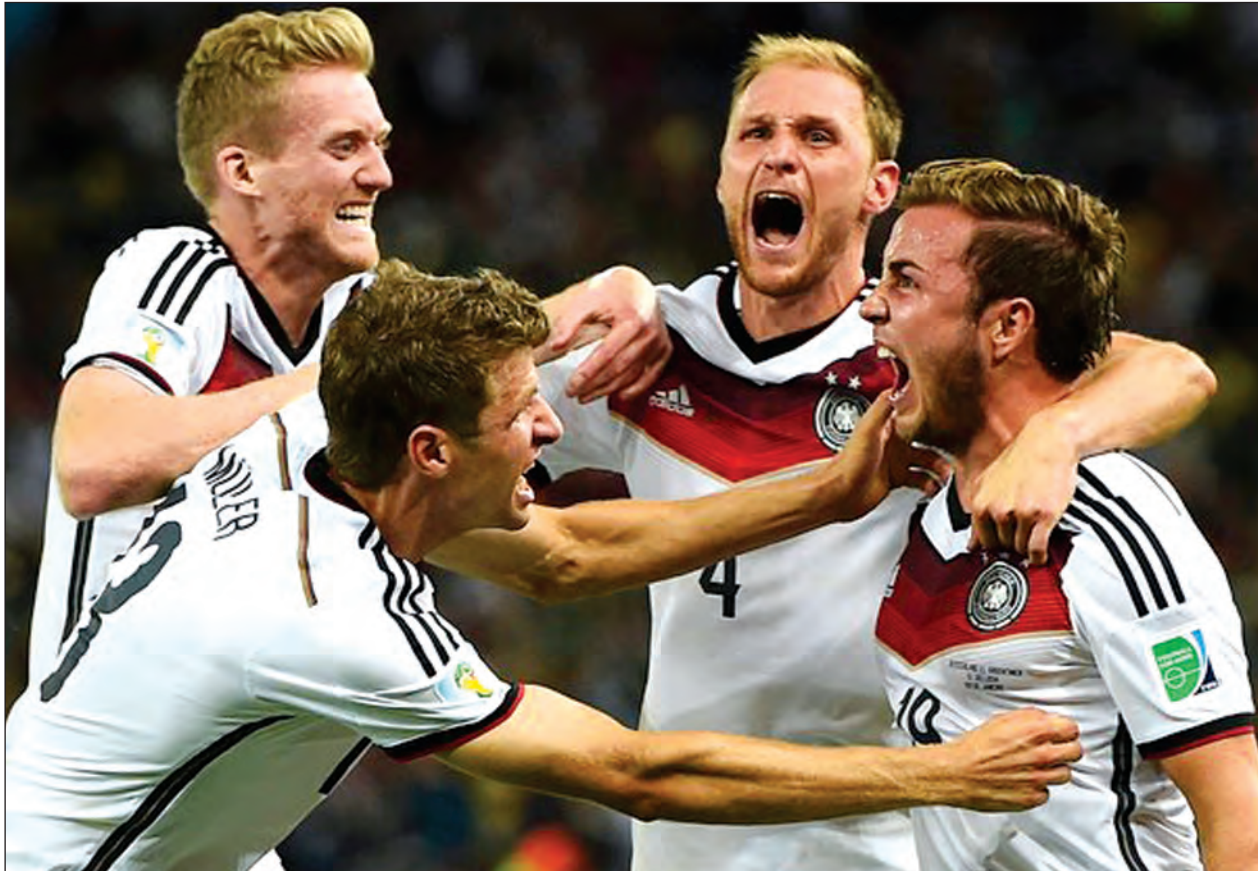
တောင်ပံတိုက်စစ်တွေရဲ့အားနဲ့ ဂျာမနီကို အခက်တွေ့အောင်ကစားပါလိမ့်မယ်။ ဒီပွဲက သရေပွဲဖြစ်သွားနိုင်ပြီး ဂျာမနီတို့နိုင်ရင်တောင် ဂိုးမပြတ်နိုင်ပါဘူး။ ပိုလန်နှင့် မြောက်အိုင်ယာလန် အုပ်စု(C)မှာတော့ မြေပြည့်တူနစ်သင်းဖြစ်ပါတယ်။ ပိုလန်ရဲ့ အားသာချက်က ခံစစ်ပိုင်းဖြစ်ပြီး နောက်ဆုံးငါးပွဲကစားခဲ့ရာမှာ နှစ်ဂိုးသာပေးခဲ့တာမို့ မြောက်အိုင်ယာလန်တိုက်စစ်မှူးတွေ ခက်ခဲပါလိမ့်မယ်။ ပိုလန်ရဲ့ ကစားအားကိုကြည့်ရင် ချက်

နာမည်ကြီး ဂျာမနီတို့လည်း ခြေစွမ်းမတည်မငြိမ်ဖြစ်နေပါတယ်။ ဂျာမနီရဲ့ လောလောဆယ်ကစားခဲ့တဲ့ ဟန်ဂေရီနဲ့ပွဲမှာ နှစ်ဂိုးပြတ်အနိုင်ရခဲ့ပေမယ့် ခြေစွမ်းက အားရစရာတော့မရှိသေးပါဘူး။ ပြီးခဲ့တဲ့လက ဆလိုဗက်ကီးယားနှင့်ပွဲမှာ ဂျာမနီတို့ သုံးဂိုးတစ်ဂိုးနဲ့ ရှုံးထားခဲ့တာမို့ အခုပွဲမှာ သတိကြီးစွာထားပြီး အမှားအယွင်းနည်းအောင် ကြိုးစားရပါလိမ့်မယ်။ ယူကရိန်းတို့ကတော့ နောက်ဆုံးကစားခဲ့တဲ့ အယ်လ်ဘေးနီးယားနဲ့ပွဲမှာ သုံးဂိုး-တစ်ဂိုးနဲ့နိုင်ခဲ့သလို ရိုမေးနီးယား၊ ဝေလ်၊ ဆိုက်ပရပ်စ်အသင်းတွေနဲ့ ကစားတဲ့အခါမှာလည်း နိုင်ပွဲတွေဆက်တိုက်ရရှိခဲ့ပါတယ်။ ယူကရိန်းတို့က တိုက်စစ်ပိုင်းမှာ ထိုးဖောက်နိုင်စွမ်းရှိပေမယ့် အဆုံးသတ်ဂိုးသွင်းမှုအပိုင်းမှာ လွှဲချော်မှုတွေရှိနေဆဲဖြစ်ပါတယ်။ ဒါပေမယ့် အသင်းလိုက် နားလည်မှုရှိရှိနဲ့ ကွင်းလယ်ကစားအား