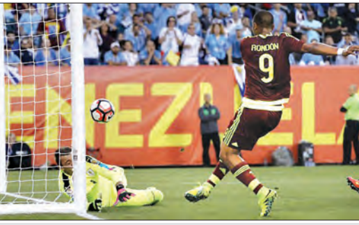
ပင်နီစွဲလားတိုက်စစ်မှူး ရွန်ဒန် ဥရုဂွေးဘက်သို့ ဘောလုံးကန်သွင်းစဉ်

မက္ကဆီကိုနှင့် ဂျမေကာပွဲတွင် တိုက်စစ်မှူး ဟာနန်ဒက်စ်က ပွဲစပြီး ပွဲချိန် ၁၈ မိနစ်တွင် မက္ကဆီကို အတွက် ဦးဆောင်ဂိုးသွင်းယူခဲ့ပြီး ဒုတိယပိုင်း ၈၁ မိနစ်တွင် အိုရီ