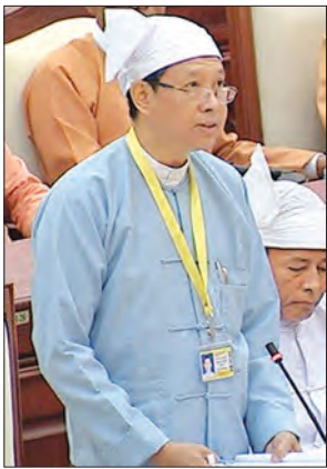
ပြည်ထောင်စုဝန်ကြီး ဒေါက်တာမျိုးသိမ်းကြီး

နေပြည်တော် ၉ ဇွန် ၁၀ အင်းစိန်ဂျီတီအိုင်တွင် မူလအတိုင်း နည်းပညာနှင့် အသက်မွေးပညာ သင်တန်းများ ဖွင့်လှစ်နိုင်ရန် စီစဉ်ဆောင် ရွက်လျက်ရှိကြောင်း ပညာရေးဝန်ကြီး ဌာန ပြည်ထောင်စုဝန်ကြီး ဒေါက်တာ မျိုးသိမ်းကြီးက ပြောသည်။