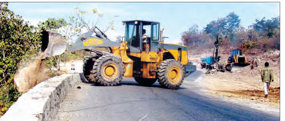
အတိုင်း ညောင်တုန်းလမ်းနှင့်ဆုံရာအထိ (၄ မိုင် ၆ ဇာလုံ) မအူပင်-ဆားမလောက်