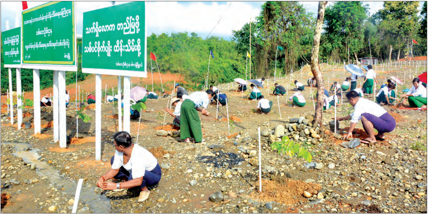
ဖားကန့်မြို့နယ် လယ်ပြင်ရွာထိပ်တွင် သဘာဝပတ်ဝန်းကျင် စိမ်းလန်းစိုပြည်ရေးအတွက် စုပေါင်းသစ်ပင်စိုက်ပျိုးကြစဉ်

ဖြေ။ ကုမ္ပဏီ ၂၃၀ က အကျိုးစွဲလုပ်ကိုင် ၃၅၅ ကွက် ဧက အားဖြင့် ၁၄၃၉၂ ဒဿမ ၈၅ ဧက၊ နောက်ပြီး ကုမ္ပဏီ ၅၉၁ ခု က ပုဂ္ဂလိကလုပ်ကိုင် ၇၄၄၄ ကွက် ဧကအားဖြင့် ၇၄၄၄ ဧက ရှိပါတယ်။ လက်ရှိတူးဖော်လုပ်ကိုင်နေတဲ့ ကုမ္ပဏီအကျိုးစွဲ ၁၂၅ ကွက် ဧက ၉၃၄၃ ဒဿမ ၈၀၊ လက်ရှိတူးဖော်လုပ်ကိုင်နေတဲ့