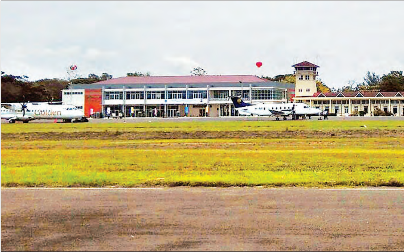
မြစ်ကြီးနားလေဆိပ် နှစ်ထပ်အဆောက်အအုံသစ်ကို ဇွန် ၁၀ ရက်က တွေ့ရစဉ် (အလျား ပေ ၂၀၀၊ အကျယ် ပေ ၈၀ရှိကာ ထွက်ခွာ/ဆိုက်ရောက်ခန်းမများကို နိုင်ငံတကာ အဆင့်မီ ပြည်တွင်းလေဆိပ်အဆောက်အအုံများ၏သတ်မှတ်ချက်များနှင့်အညီ ထည့်သွင်းတည်ဆောက်ထားသည်) သတင်း၊ စာမျက်နှာ- ၇