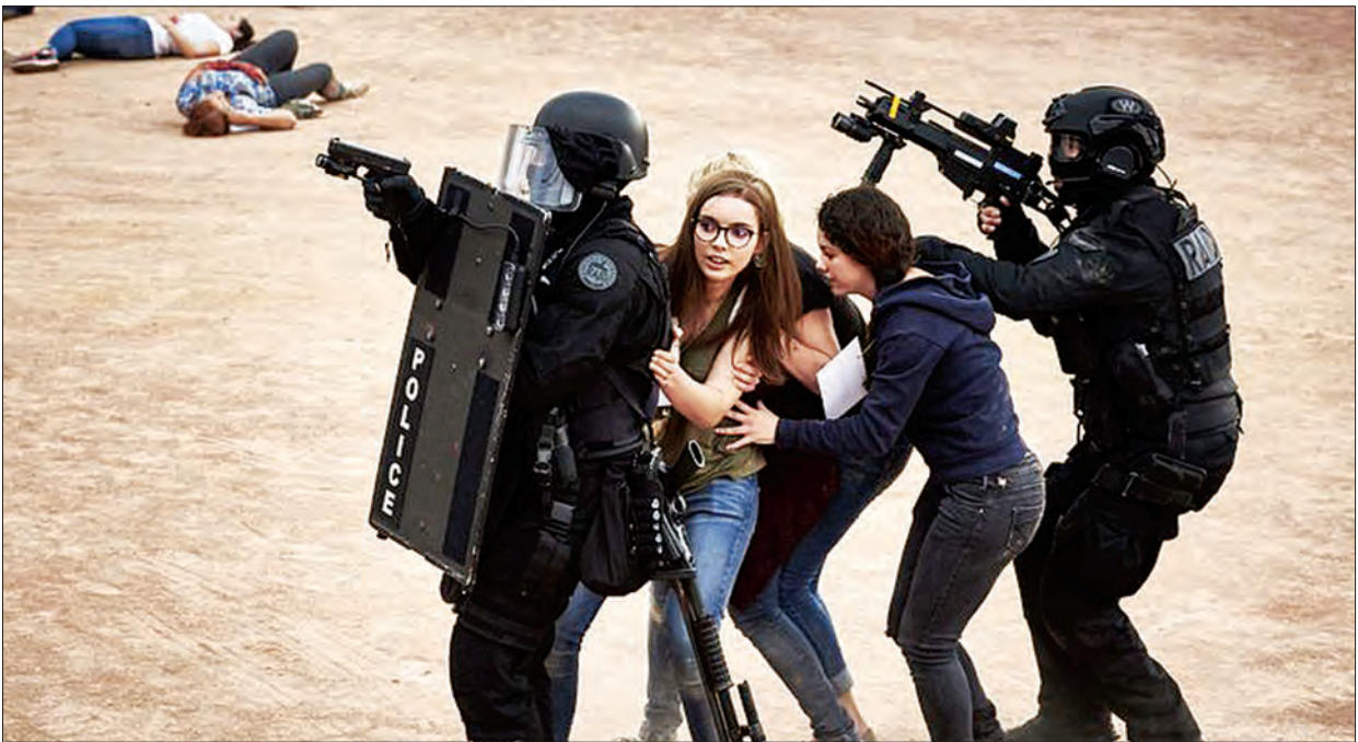
၂၀၁၆ ယူရိုအားကစားပြိုင်ပွဲအတွက် အကြမ်းဖက်တိုက်ခိုက်မှုမှ ရှောင်ရှားနိုင်ရေး အစမ်းလေ့ကျင့်မှုများပြုလုပ်စဉ်

ထို့အပြင် နိုင်ငံအတွင်း လုံခြုံစိတ်ချရမှုသည် ပြင်သစ်နိုင်ငံအတွက် လက်ရှိအခြေအနေ၌သာ အရေးပါသည်မဟုတ်။ အနာဂတ်နှင့်လည်း များစွာသက်ဆိုင်သည်။