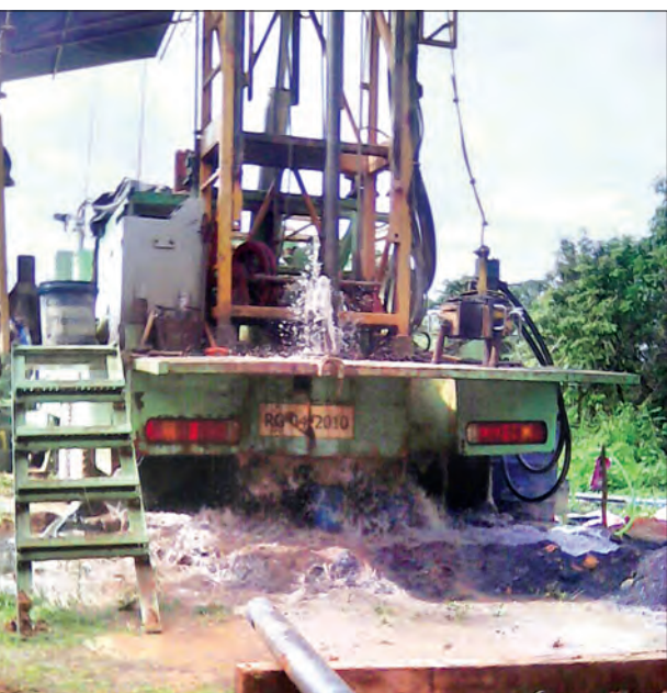
တက္ကသိုလ် (စီးပွားရေးစီမံခန့်ခွဲမှုဗဟာ ဘွဲ့)သင်တန်းသားများနှင့် ပူးပေါင်း၍ ဧပြီ ၄ ရက်မှ ယနေ့အထိ ရေဂါလန် ၂၈၀၀ ဆုံ ရေသယ်ယာဉ်ကြီးဖြင့် လည်းကောင်း၊ တောင်ကြီးမြို့၊ ညောင်ရွှေမြို့၊ မကွေးမြို့၊ ချင်းပြည်နယ်၊ ဟားခါးမြို့နှင့် ဖလမ်းမြို့