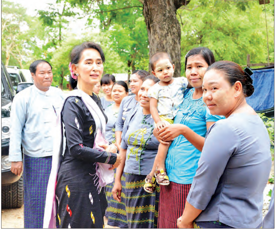
နိုင်ငံတော်၏ အတိုင်ပင်ခံပုဂ္ဂိုလ် ဒေါ်အောင်ဆန်းစုကြည် သင်တန်းကျောင်းမှ ရဲတပ်ဖွဲ့ဝင်များ၏ မိသားစုများနှင့် ရင်းရင်းနှီးနှီး တွေ့ဆုံစဉ်

ကျောစွမ်းမှ ဈေးကျတယ်ပေါ့။ ပြီးခဲ့တဲ့ ရက်ပိုင်းက မုတ်သုံကျနေတော့ အိန္ဒိယသင်္ဘောတွေ မထွက်ကြဘူး။ ဒီဘက်ဆိပ်ကမ်းမှာလည်း ကုန်ကွန်တိန်နာတွေ အထုတ်၊ အသွင်းကျပ်နေတော့ အမှာလျော့သွားတာ။ အခုရက်ပိုင်းတော့ အမှာပြန်ကျလာတယ်” ဟု ပြောသည်။