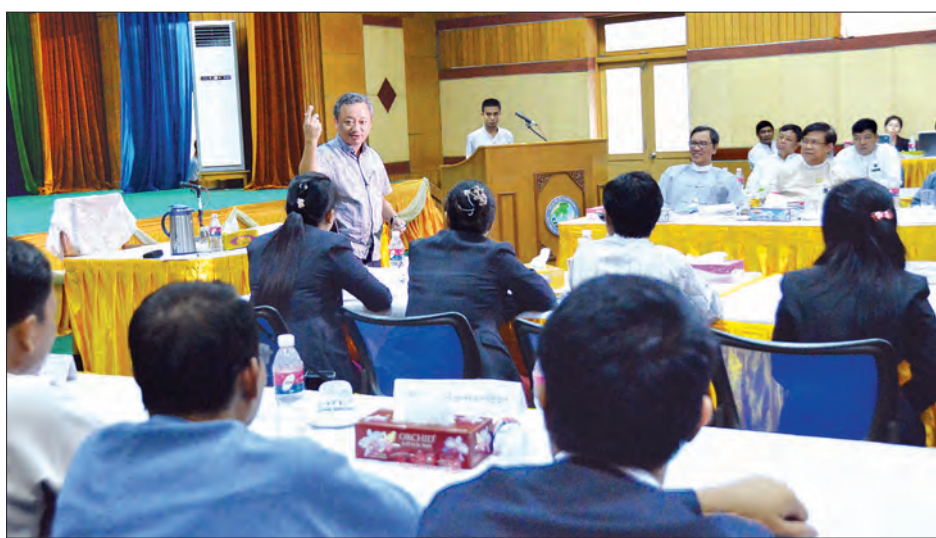
ဝန်ကြီးဌာနအလိုက် ပြောရေးဆိုခွင့်ရှိသူများ မီဒီယာဆက်ဆံရေး အလုပ်ရုံဆွေးနွေးပွဲ ဒုတိယနေ့ကျင်းပစဉ်

အရင်တုန်းကပြောရေးဆိုခွင့်ရှိသူတွေ ထားပေမယ့် မပြောခဲ့ဘူးဆိုတာက ဒီလိုအလုပ်ရုံဆွေးနွေးပွဲတွေ တစ်ခု