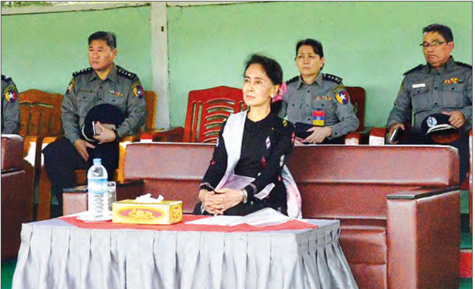
နိုင်ငံတော်၏ အတိုင်ပင်ခံပုဂ္ဂိုလ် ဒေါ်အောင်ဆန်းစုကြည် ရမည်းသင်းမြို့ရှိ အမှတ်(၁) ရဲလေ့ကျင့်ရေးကျောင်းတွင် အကြမ်းဖက်တိုက်ဖျက်ရေး အနီးကပ်တိုက်ခိုက်နည်းနှင့် လေ့ကျင့်ရေးသင်တန်းသူများ၏ လက်တွေ့အသုံးချဖမ်းဆီးထိန်းသိမ်းနည်း သရုပ်ပြမှုကို ကြည့်ရှုအားပေးစဉ်

ရှိမရှိ၊ လျှပ်စစ်မီး၊ သောက်သုံးရေ ဖူလုံစေရေးနှင့် ကျန်းမာရေးစောင့်ရှောက်မှုများ၊ အဆောက်အအုံအသုံးပြုမှုများကို ထောက်ပြဆွေးနွေးခဲ့ပြီး အဆိုပါ သင်တန်းကျောင်းသည် မြန်မာနိုင်ငံရဲတပ်ဖွဲ့မှ ဖွင့်လှစ်သည့် ရဲလေ့ကျင့်ရေးကျောင်းများအနက် စံပြသင်တန်းကျောင်းအဖြစ် အမြန်ဆုံးအကောင်အထည်ဖော်နိုင်ရန် လိုအပ်သည့် အခြေခံလိုအပ်ချက်များကို ဦးစွာဖြည့်ဆည်းဆောင်ရွက်ပေးရန် ကော်မတီဖွဲ့စည်းပေးမည်ဖြစ်သည့်အပြင် နိုင်ငံတကာရဲသင်တန်းကျောင်းများနှင့် ကိုက်ညီသည့် စံပြသင်တန်းကျောင်းတစ်ခုအဖြစ် ကြိုးပမ်းပေးသွားမည် ဖြစ်ကြောင်းလမ်းညွှန်မှာကြားခဲ့သည်။