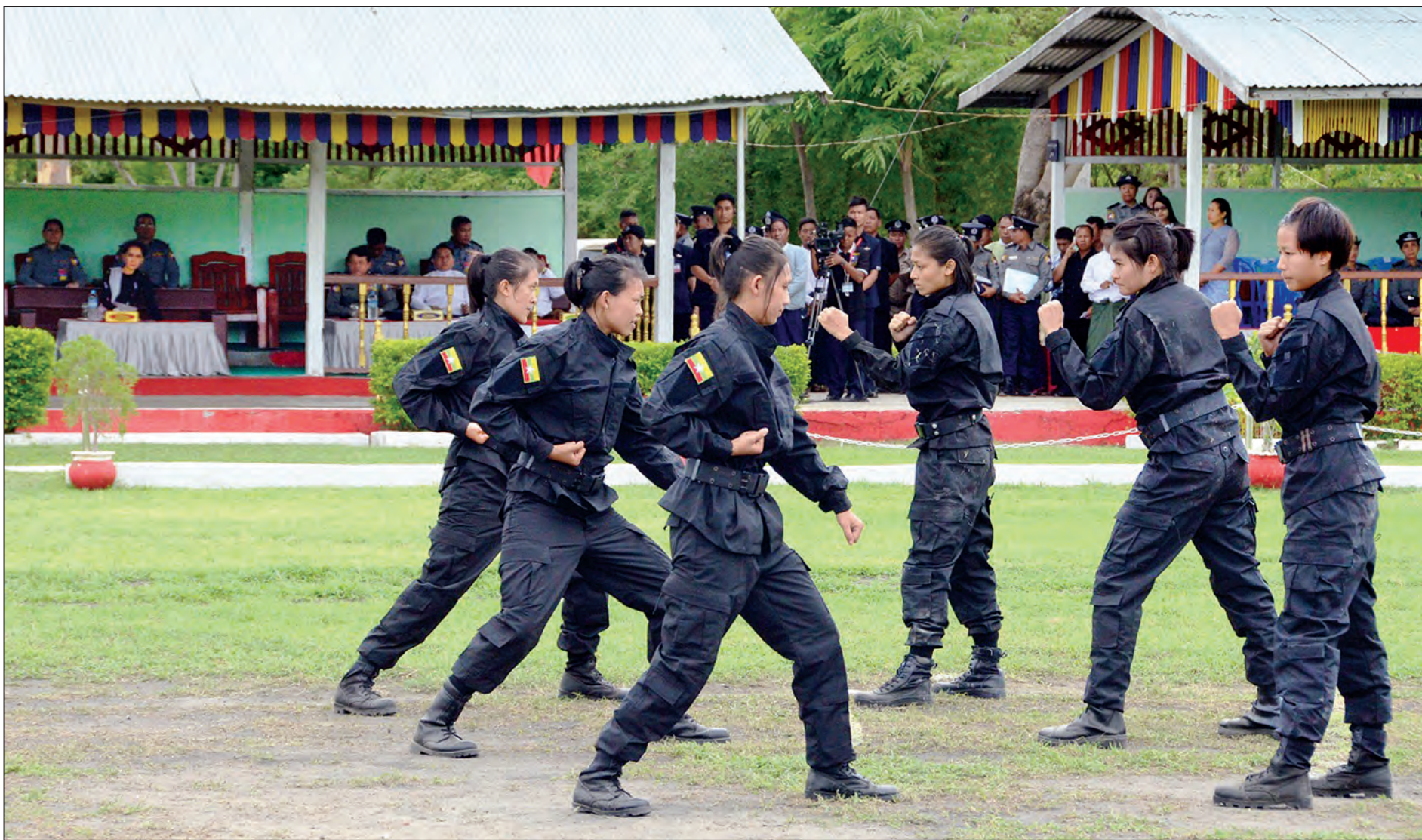
နိုင်ငံတော်၏အတိုင်ပင်ခံပုဂ္ဂိုလ် ဒေါ်အောင်ဆန်းစုကြည် ရမည်းသင်းမြို့ အမှတ်(၁) ရဲလေ့ကျင့်ရေးကျောင်း၌ သင်တန်းသူများ သရုပ်ပြလေ့ကျင့်နေမှုကို ကြည့်ရှုအားပေးစဉ်

အမှတ်(၁) ရဲလေ့ကျင့်ရေးကျောင်း(ရမည်းသင်း)အား စံပြုရဲသင်တန်းကျောင်းဖြစ်လာစေရေး နိုင်ငံတော်၏အတိုင်ပင်ခံပုဂ္ဂိုလ် မျှော်မှန်း