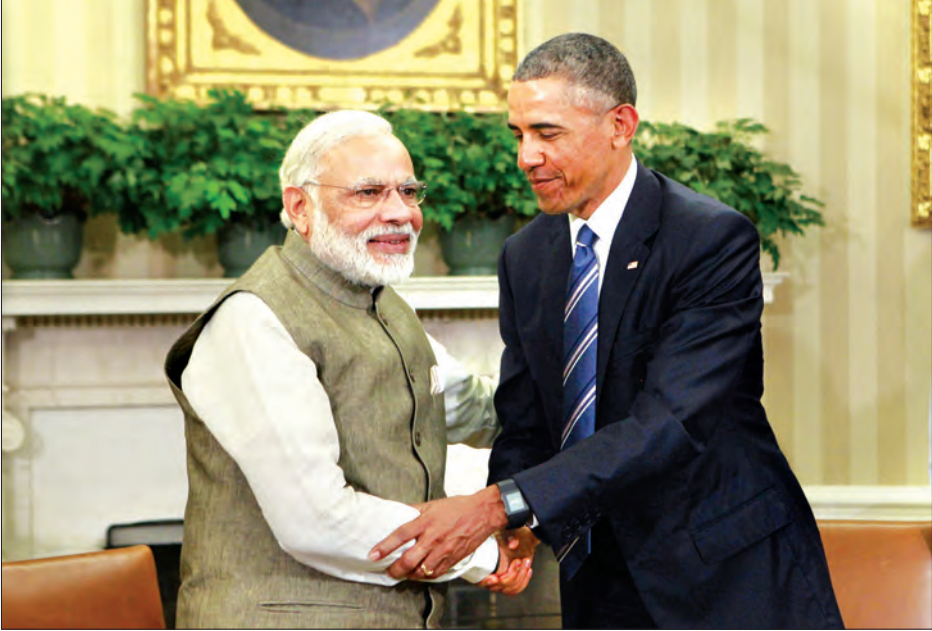
တွေ့ဆုံမှုအပြီး ကမ္ဘာ့အကြီးဆုံး အိန္ဒိယတပ်ဖွဲ့အဖွဲ့ဝင်များနှင့် အိန္ဒိယတပ်ဖွဲ့အဖွဲ့ဝင်များ အတူတူပူးပေါင်းဆောင်ရွက်မှုကို တွင် ပူးပေါင်းဆောင်ရွက်မှုကို ကျယ်ကျယ်ပြန့်ပြန့် လုပ်ဆောင်ရမည် ဖြစ်ကြောင်း အိန္ဒိယအစိုးရက ပြောခဲ့သည်။ မိုဒီကလည်းနှစ်နိုင်ငံ၏ မိတ်ရင်း ချစ်ရင်း ဆက်ဆံရေးအပေါ် ဂုဏ်ယူမိ ကြောင်းပြောခဲ့သည်။ (အင်န်အိတ်ချ်ကေ)

အိန္ဒိယသမ္မတနှင့် တောင်တရုတ် ပင်လယ်ပြင်တွင် လုံခြုံရေးပူးပေါင်း ဆောင်ရွက်ရေးတိုးမြှင့်ရန် အမေရိကန် နှင့်အိန္ဒိယတို့က သဘောတူခဲ့သည်။ နှစ်နိုင်ငံသည် တရုတ်၏ကြောင်း လှုပ်ရှားမှုများကို ထိန်းသိမ်းရန် သိသိ သာသာပြသလိုက်ခြင်းပင်ဖြစ်သည်။