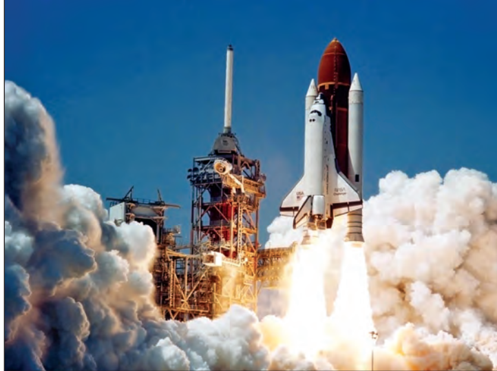
ပထမဆုံးအာကာသလွန်းပြန်ယာဉ် ကိုလံဘီယာကို စတင်လွှတ်တင်စဉ်

ဦးစွာ အာကာသလွန်းပြန်ယာဉ်ကို လှုံ့လျက် အနေအထားမှ အာကာသထဲသို့ ပစ်လွှတ်ရန်