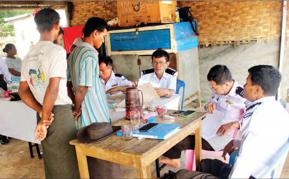
၁၉၈၂ ခုနှစ် မြန်မာနိုင်ငံသား ဥပဒေလုပ်ထုံးလုပ်နည်းနှင့်အညီ နိုင်ငံသားအဖြစ်ရရှိစေရန် မြို့နယ်အဆင့် ပြည်နယ်အဆင့်

နိုင်ငံသားစိစစ်ရေးကိစ္စလုပ်ငန်းစဉ်များကို ဆောင်ရွက်ရာတွင် လက်ရှိအိမ်ထောင်စုစာရင်းတွင်ရှိသော လူဦးရေအနက် အသက် ၁၀ နှစ် အထက်ရှိသူများအား NVC ကတ် ထုတ်ပေးသွားမည်ဖြစ်သည်။ ယင်းကတ်အပေါ်၌ မူတည်ပြီး