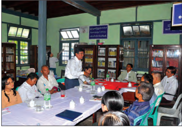
အလွဲသုံးမှုနှင့် တရားမဝင်ရောင်းဝယ်မှုတိုက်ဖျက်ရေးနေ့ အထိမ်းအမှတ် အသိပညာ ပေးဟောပြောပွဲများနှင့် ပညာပေးပြပွဲများ၊ ပြခန်းများ ကျင်းပနိုင်ရန်အတွက် တာဝန် ရှိသူများက ပူးပေါင်းပါဝင်ဆောင်ရွက်ကြရန်လည်း ဆွေးနွေးခဲ့ကြကြောင်း သိရသည်။

ကျေးရွာစာကြည့်တိုက်များရှင်သန်ခိုင်မာရေး၊ စာကြည့်တိုက်များကို ပံ့ပိုးမှုများ ပေးနိုင်ရေးနှင့် ကျေးလက်နေပြည်သူများအား အသိပညာဖြန့်ဝေပေးရေးတို့အတွက် ဌာနဆိုင်ရာများ၊ မြိတ်ခရိုင် စာကြည့်တိုက်ဝန်ဆောင်မှုဖြင့်တင်ရေးလုပ်ငန်းကော်မ တီ ဝင်များ၊ မြို့နယ်စာရေးဆရာအသင်းဝင်များ၊ ရပ်ကွက်/ကျေးရွာ အုပ်ချုပ်ရေးမှူး များနှင့် စာကြည့်တိုက်ကော်မတီဝင်များ၊ စာကြည့်တိုက်မှူးများ မြိတ်ခရိုင်ပြည်သူ့ စာကြည့်တိုက် ဇွန် ၆ ရက်က ညှိနှိုင်းဆွေးနွေးခဲ့ကြသည်။