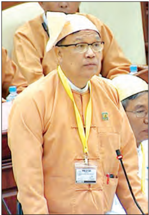
ပြည်ထောင်စုဝန်ကြီး ဦးသန့်စင်မောင်

ရန်ကုန်မြို့ပိုလ်တထောင်ဘုရားလမ်းနှင့် ပိုလ်အောင်ကျော်တံတားအကြား မြေဧက ၂၀ ခန့်ပေါ်တွင် မြန်မာနိုင်ငံရင်းနှီးမြှုပ်နှံမှုကော်မရှင်၏ ခွင့်ပြုချက်ဖြင့် ဆောင်ရွက်မည့် ဘက်စုံသုံးဆိပ်ခံတံတား တည်ဆောက်ရေးလုပ်ငန်းစီမံကိန်းသည် ကောင်းကျိုးထက် ဆိုးကျိုးပိုများနေသဖြင့် ရပ်ဆိုင်းတော့မည်ဖြစ်သည်။