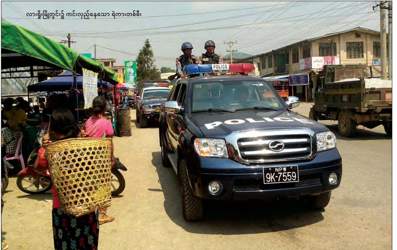
လားရှိုးမြို့တွင်း၌ ကင်းလှည့်နေသော ရဲကားတစ်စီး