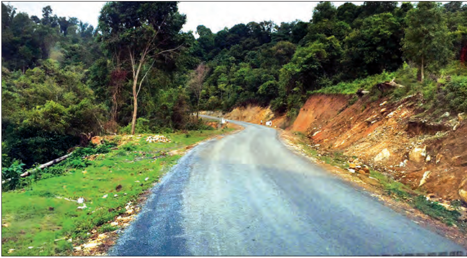
နမ့်ခမ်း-နမ့်ဖတ်ကာသွား ကားလမ်းပိုင်းတစ်နေရာ