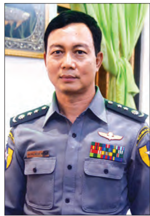
ရဲမှူးကြီးအောင်ဌေးမြင့်

အတွင်းက ဆောင်ရွက်ခဲ့ပြီးဖြစ်ပါတယ်။ အမျိုးသား ဆေးဝါးဥပဒေအရ အရေးယူခဲ့တဲ့ အမှုပေါင်းဟာ ၂၀၁၅ ခုနှစ်မှာ ၅၁ မှု၊ ၂၀၁၆ ခုနှစ် ဇန်နဝါရီလမှ မေလအတွင်း မှုခင်းရဲတပ်ဖွဲ့နဲ့ ပူးပေါင်းပြီး အရေးယူခဲ့တဲ့ အမှုပေါင်း ကိုးမှု၊ ရဲစခန်းက တင်ပြလာတဲ့ အမှု ၂၀ စုစုပေါင်း ၂၉ မှုတို့ကို အမျိုးသားဆေးဝါးဥပဒေအရ တရားစွဲဆိုအရေးယူခဲ့ပါတယ်။