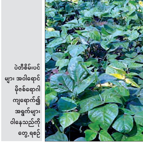
ပဲတီစိမ်းပင် များ အဝါရောင် မိုစ်ရောဂါ ကျရောက်၍ အရွက်များ ဝါနေသည်ကို တွေ့ရစဉ်

ဖြေ။ ။ ဟုတ်ပြီ။ ခုနလို တစ်ခုမှလည်းမလုပ်ခဲ့ဘူး။ တကယ် လည်း ကျရောက်နေပြီဆိုရင် အပင်ဝါတာနဲ့ တစ်ပြိုင် နှက် တစ်ခါတည်းနှုတ်ပစ်၊ နတ်ပြီးမီးရှို့ပစ်မယ်။ ယင်ဖြူကို သတ်ဖို့ အတွက် ပင်လုံးဖြတ်ပိုးသတ်ဆေးကို သုံးမယ်။ တောင်သူတွေက အဲဒါကိုသိတယ်။ အညွှန်းပါအတိုင်းပေါ့။ နှုန်းထားပြည့်စီရုံတင် မရပါဘူး။