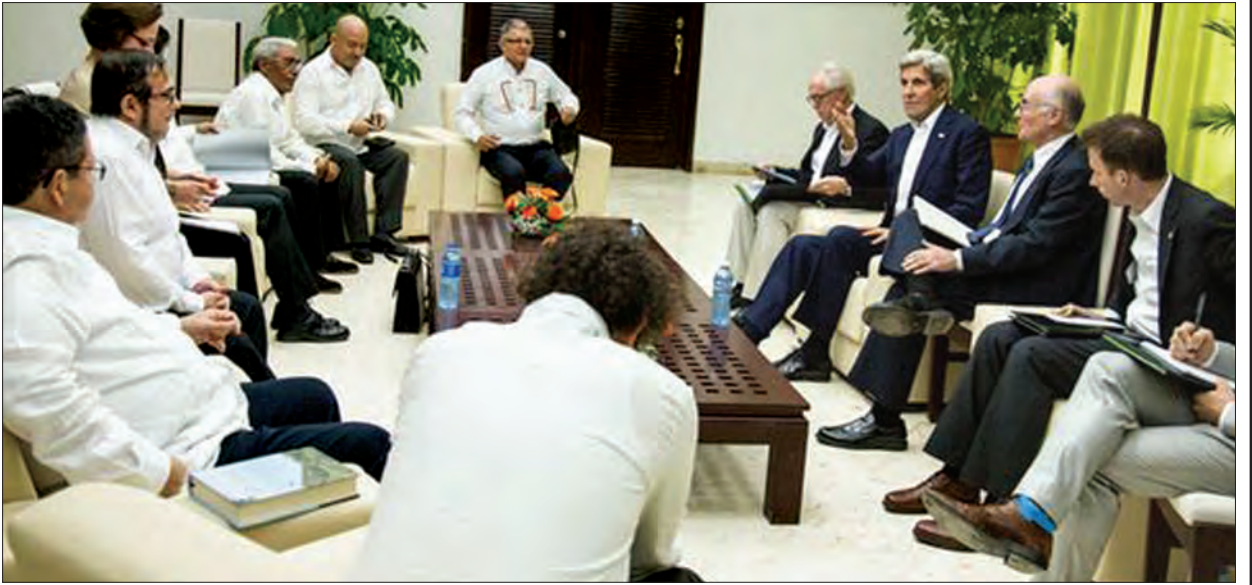
အမေရိကန်နိုင်ငံခြားရေးဝန်ကြီး ဝှန်ကယ်ရီ ကိုလံဘီယာလက်နက်ကိုင်တော်လှန်ရေးအဖွဲ့ (FARC) မှ ခေါင်းဆောင်များနှင့်ညှိနှိုင်းဆွေးနွေးစဉ်

ထိုအချိန်မှာ လက်ရှိတာဝန်ယူသွားတဲ့ နီကိုလပ်စ်မဒူရိုဦးဆောင်သော ဆိုရှယ်လစ်ပြည်ထောင်စုပါတီအစိုးရအဖွဲ့နဲ့ ခေါင်းဆောင်ဟောင်း ဟိုဂိုချာပက်ဇီတို့ ဟာ ရေနံကြွယ်ဝမှုကို အသုံးချပြီး တိုင်းပြည်တိုးတက်ရေးအတွက် ဖြစ်ဖြစ် မြောက်မြောက် ဆောင်ရွက်သွားတာမျိုး မရှိခဲ့ပါဘူး။ အဲလိုဆောင်ရွက်ရမယ့်အစား ပါတီဟာ ကျူးတားသမ္မတ ဖီဒယ်ကက်စထရို ရဲ့ ဆိုရှယ်လစ်ဝါဒကို အစွမ်းကုန် သွတ်သွင်းခဲ့ပါတယ်။ ချာပက်ဇီဟာ