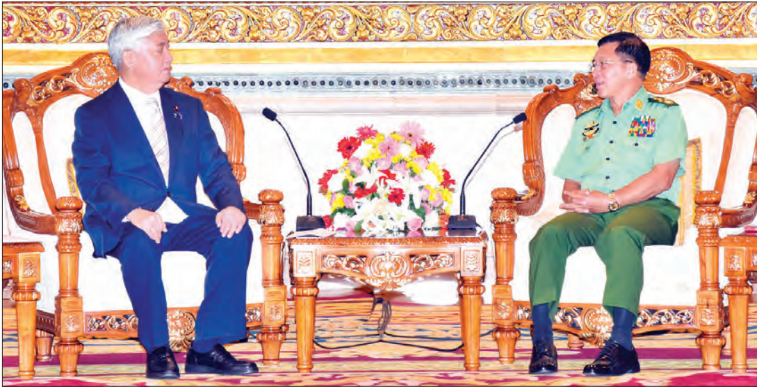
နေပြည်တော် ဇွန် ၆

တပ်မတော်ကာကွယ်ရေးဦးစီးချုပ် ဗိုလ်ချုပ်မှူးကြီး မင်းအောင်လှိုင်သည် ဂျပန်နိုင်ငံ ကာကွယ်ရေးဝန်ကြီး မစ္စတာ ဂန်း နာကာတာနိုနှင့် ယနေ့ နံနက် ၈ နာရီတွင်လည်းကောင်း၊ ဥရောပသမဂ္ဂစစ်ဘက် ရေးရာကော်မတီဥက္ကဋ္ဌ ဗိုလ်ချုပ်ကြီး မီခေးလ်ကိုစတာရာကော့စ်နှင့် ညနေ ၄ နာရီတွင်လည်းကောင်း နေပြည်တော်ရှိ ဇေယျာသီရိဗိမာန် ဧည့်ခန်းမဆောင်၌ တွေ့ဆုံသည်။