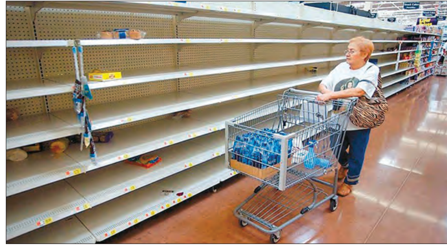
ကုန်ပစ္စည်းပြတ်တောက်နေသော ပင်နီစွဲလားရှိ အရောင်းဆိုင်များ

အမှန်စင်စစ် ဆိုရှယ်လစ်ဝါဒဆိုတဲ့ အမည်နာမအောက်မှာ ပင်နီစွဲလားဟာ သေခြင်းတရားထက် ခါးသီးတဲ့အရာတွေကိုရရှိခဲ့ပြီး အရှင်လတ်လတ် ဖရဲပြည်ကို ကျရောက်ခဲ့ရပါတော့တယ်