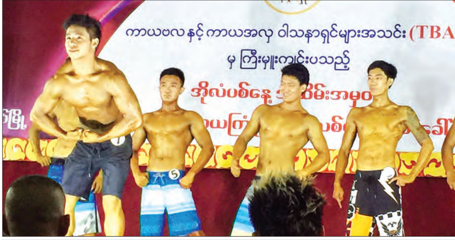
၂၀၁၆ ခုနှစ် ကမ္ဘာ့အိုလံပစ်နေ့ အထိမ်းအမှတ် ကာယဗလနှင့် ကာယကြံ့ခိုင်မှု လူသစ်တန်း ဖိတ်ခေါ်ပြိုင်ပွဲကို ဇွန် ၄ ရက် ညနေပိုင်းက တာချီလိတ်မြို့အောင်မြတ်ခန်းမတွင် ကျင်းပစဉ် မောင်ယဉ်ကျေး