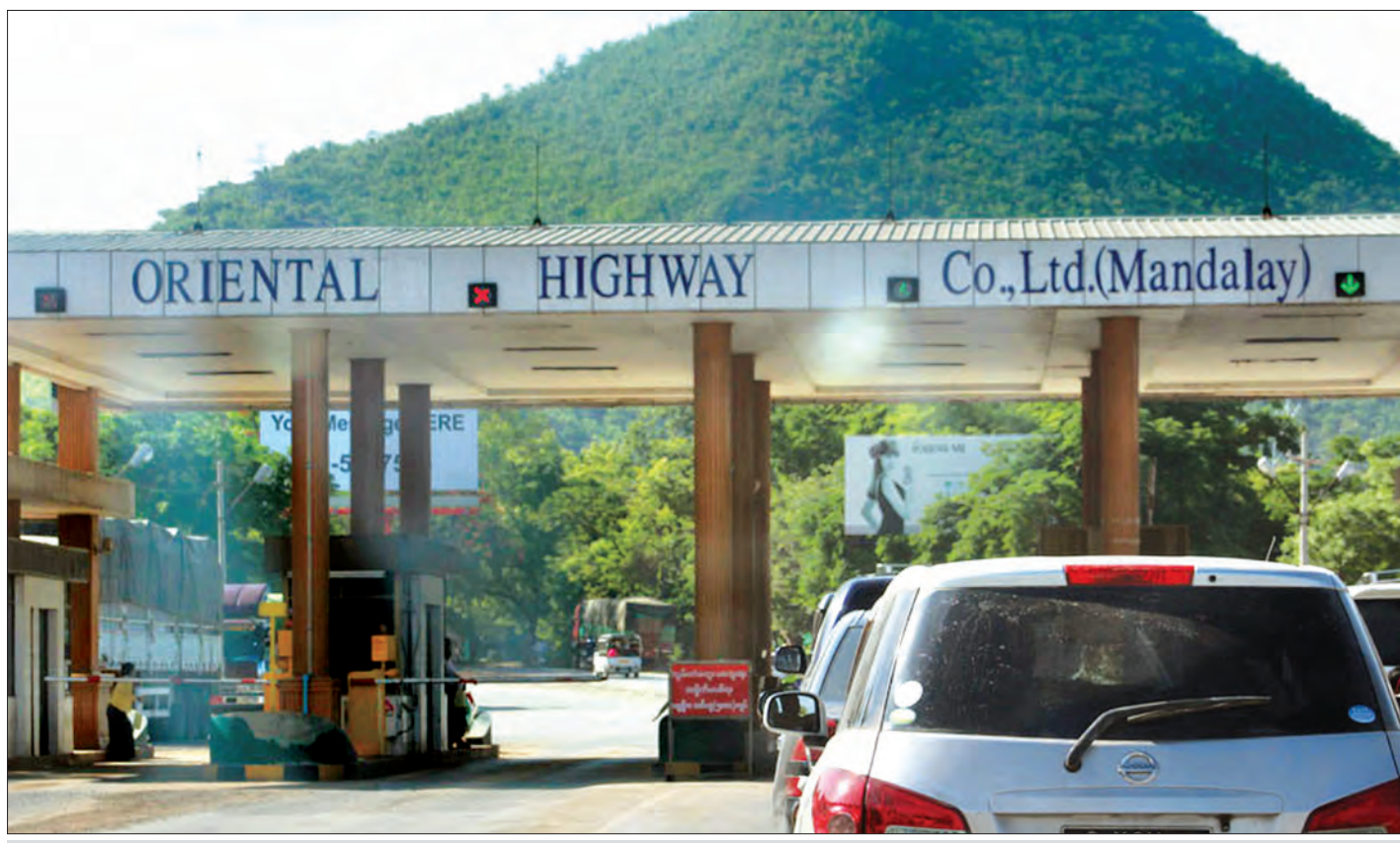
မန္တလေး၊ ကျောက်မဲ၊ လားရှိုး၊ မူဆယ်လမ်းပိုင်း၌ ယာဉ်များသွားလာမှုအဆင်ပြေစေရန် ယာဉ်ဖြတ်သန်းခကို စမတ်ကတ်ဖြင့် အသုံးပြုနေသည့် တိုးဂိတ်တစ်ခု

“အစိုးရသစ်အနေနဲ့ ပြည်သူတွေပါဝင်တဲ့ စီးပွားရေး လုပ်ငန်းတွေလုပ်ဆောင်ဖို့ ကြိုးပမ်းနေပါတယ်။ ဒီလို လုပ်ဆောင်တဲ့နေရာမှာ အတားအဆီးတွေမရှိဘဲ လွတ်လွတ် လပ်လပ်လုပ်နိုင်ဖို့ အရေးကြီးပါတယ်။ အမေရိကန်နိုင်ငံရဲ့ ပေါ်လစီတွေ၊ မြန်မာနိုင်ငံအပေါ်မှာထားရှိတဲ့ မူဝါဒတွေကို ဖြေလျှော့ပေးဖို့ အထူးလိုအပ်ပါတယ်။ အဓိကဖြစ်နေတဲ့ ကိစ္စက အဟန့်အတားတွေ၊ အရေးယူပိတ်ဆို့မှုတွေ၊ GSP လို့ခေါ်တဲ့ အထူးအခွင့်အရေး ပြန်ရဖို့တွေ၊ ကုန်သွယ်ထားတဲ့ ပုဂ္ဂိုလ်တွေစာရင်း ဖြေလျှော့ပေး ဖို့အစစအရာရာအဆင်ပြေဖို့ ဒီကနေ ဆွေးနွေးကြပါတယ်။ ဒီကနေတစ်ဆင့် ပိတ်ဆို့မှုတွေ အားလုံးရုပ်သိမ်းသွားပြီး စာမျက်နှာ ၈ ကော်လံ ၄