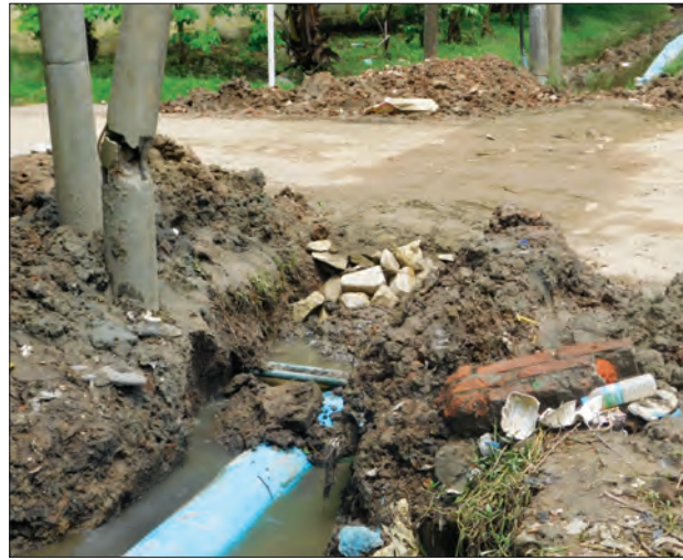
Diamond wall ကုမ္ပဏီက တာဝန် ယူဆောင်လုပ်လျက်ရှိသော ဖျာပုံမြို့ ရေပေးဝေရေးစီမံကိန်း၏ ရေပိုက် လိုင်း တူးဖော်ခြင်းလုပ်ငန်းများကြောင့် မြို့ပေါ်ရှိ လမ်းအချို့ ပျက်စီးနေခြင်း၊ တယ်လီဖုန်းလိုင်းများ ပြတ်တောက်ခြင်း များ ကြုံနေကြရကြောင်း ဒေသခံများထံ က သိရသည်။ “စီမံကိန်းလုပ်တဲ့အပေါ် ကန့်ကွက် လိုင်း တူးဖော်ခြင်းလုပ်ငန်းများကြောင့် စရာမရှိပါဘူး။ ဖြစ်နေတာက ဒီရေပိုက် လိုင်း တွေချတဲ့အခါ လမ်းတွေဖြတ်တယ်။ တယ်လီဖုန်းလိုင်းများ ပြတ်တောက်ခြင်း ပြီးတော့သေချာပြန်မဖို့ထားလို့ အခု