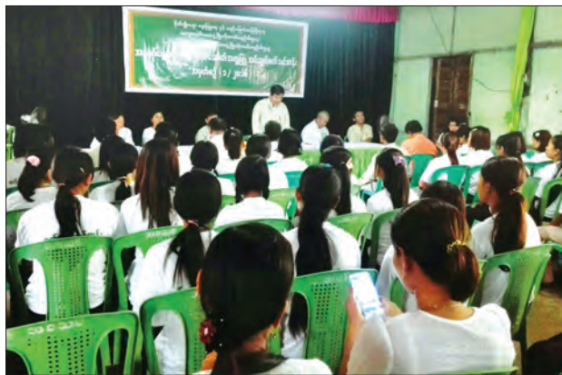
ပခုက္ကူတိုင်းဒေသကြီး ပြည်ခရိုင် သဲကုန်းမြို့နယ် ကျေးလက်ဒေသ ဖွံ့ဖြိုး တိုးတက်ရေး ဦးစီးဌာနက ရက် (၁၀၀) စီမံချက် ကာလအတွင်း ဆောင်ရွက်လျက်ရှိသော အသက်မွေးဝမ်းကျောင်းအထောက်အကူပြု အပ်ချုပ်စက် သင်တန်းဖွင့်ပွဲကို ကြိုပင်သောကျေးရွာအုပ်စု အုပ်ချုပ်ရေးမှူးရုံး၌ ဇွန် ၂ ရက်က ကျင်းပစဉ် မြို့နယ် (ပြန် / ဆက်)