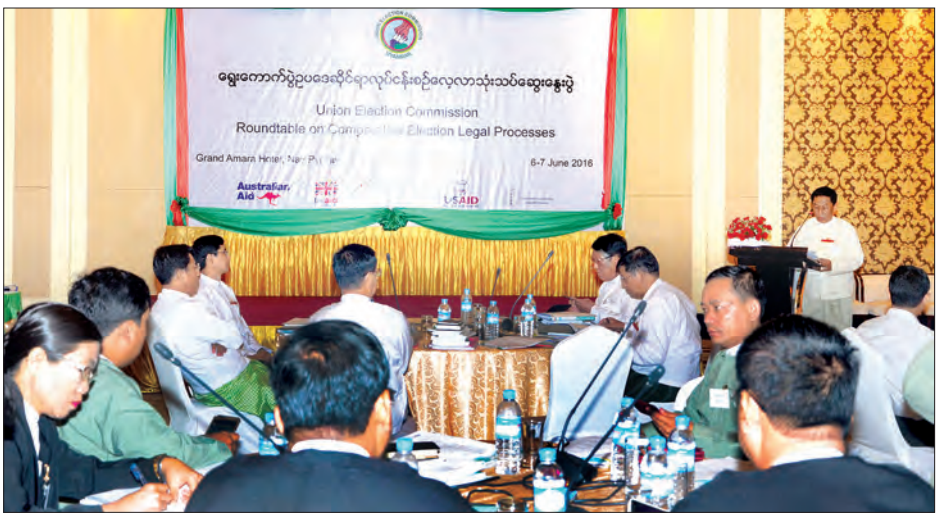
အားကောင်းစေရန် ပြုပြင်ပြောင်းလဲနိုင်သည့် ကဏ္ဍများ များ၏ ဆောင်ရွက်ပုံနမူနာများအပေါ် သုံးသပ်ဆွေးနွေးမည် ဆွေးနွေးခြင်း။ အရပ်ဘက်လူမှုအဖွဲ့အစည်းများနှင့် ဝန်ကြီး ဖြစ်ကြောင်း သိရသည်။ ဌာန ကိုယ်စားလှယ်များတက်ရောက်မည်ဖြစ်ပြီး အခြားနိုင်ငံ (သတင်းစဉ်)

ဒုတိယနေ့တွင် အနာဂတ်ရွေးကောက်ပွဲလုပ်ငန်းများ ပိုမို