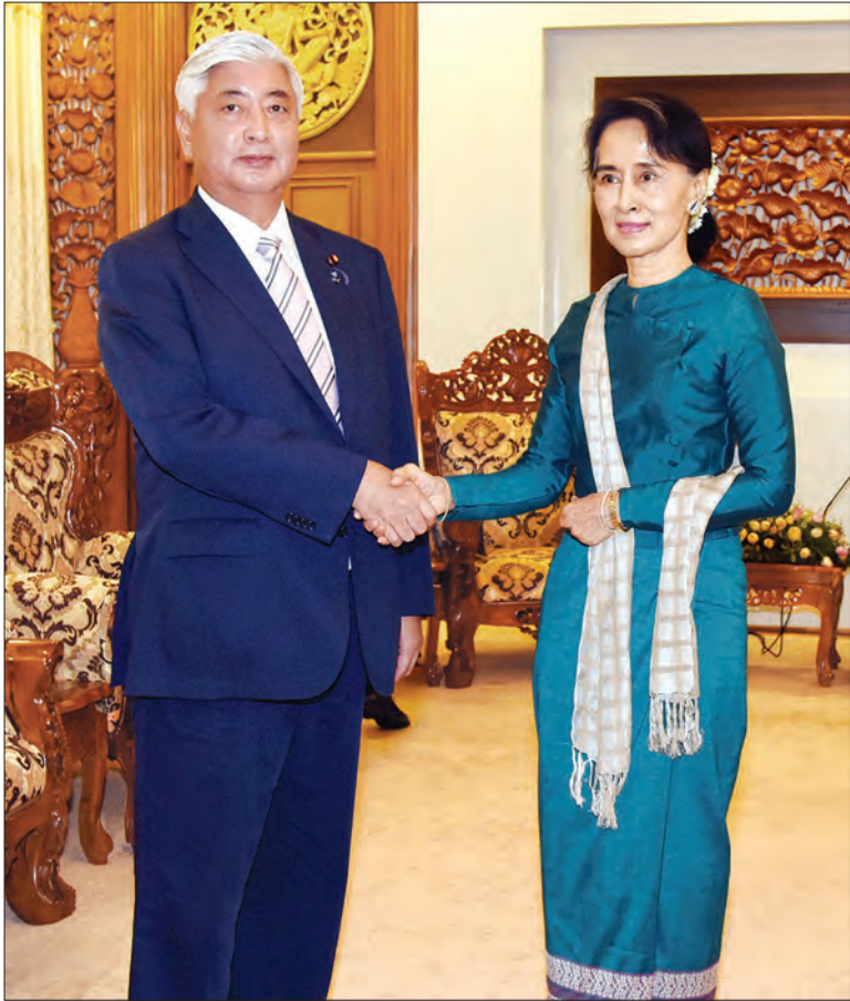
နေပြည်တော် ဇွန် ၆

နိုင်ငံခြားရေးဝန်ကြီးဌာန ပြည်ထောင်စုဝန်ကြီး ဒေါ်အောင်ဆန်းစုကြည်နှင့် ဥရောပသမဂ္ဂ စစ်ဘက်ရေးရာ ကော်မတီဥက္ကဋ္ဌ ပိုလ်ချပ်ကြီး မီခေးလ် ကိုစိတာရာ ကော့စ်တို့ သည် ယနေ့နံနက် ၁၀ နာရီတွင် နိုင်ငံခြားရေးဝန်ကြီးဌာန၌ တွေ့ဆုံကြသည်။