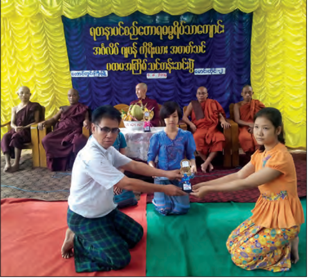
တက်ရောက်ခဲ့ကြောင်းနှင့် အင်္ဂလိပ် ဘာသာ သင်တန်းတွင် ၉၄ ဦး၊ ဂျပန် ဘာသာ သင်တန်းတွင် ၅၂ ဦးနှင့် ကိုရီးယား ဘာသာသင်တန်းတွင် ၂၆ ဦး ဖြေဆိုအောင်မြင်ခဲ့ကြောင်း သိရ သည်။ (စာရ)

တောင်တွင်းကြီး ဇွန် ၆ မကွေးတိုင်းဒေသကြီး တောင်တွင်းကြီး မြို့နယ်အတွင်းမှ လူငယ်လူရွယ်များ နိုင်ငံတကာသုံးဘာသာစကား တတ် မြောက်စေရန် ရည်ရွယ်၍ ရတနာပင် စည်တောရ မေ့ရိပ်သာကျောင်းတိုက် ဆရာတော်က ကြီးမှူး၍ ပထမအကြိမ် ဖွင့်လှစ်ခဲ့သော အင်္ဂလိပ်၊ ဂျပန်နှင့် ကိုရီးယားဘာသာစကား ပညာဒါန သင်တန်းများ၏ သင်တန်းဆင်းပွဲကို အဆိုပါကျောင်းတိုက်၌ ဇွန် ၄ ရက်က ကျင်းပခဲ့သည်။