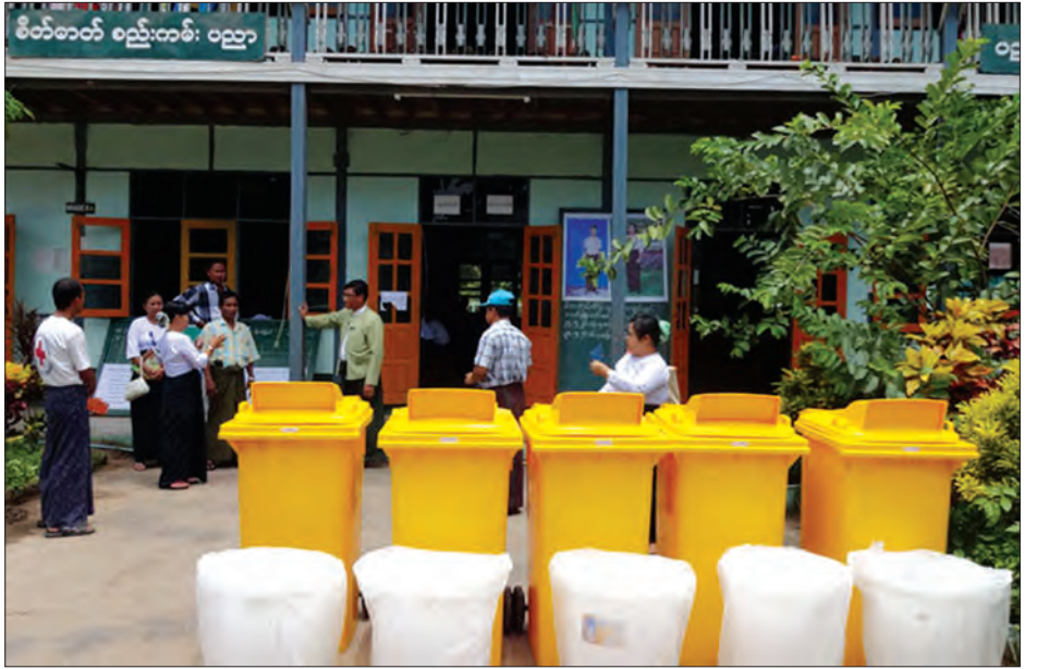
စာသင်ကျောင်းများ သန့်ရှင်းသာယာလှပရေးနှင့် အမှိုက်စွန့်ပစ်ရာတွင် စနစ်တကျဖြန့်ဝေရေးအတွက် လိုအပ်သည်များကိုလည်း ခရိုင်အုပ်ချုပ်ရေးမှူးက ဖြည့်ဆည်းဆောင်ရွက်ပေးခဲ့ပြီး ကျောင်းသား ကျောင်းသူများ စာသင်ကြားနေသည့်ကိုလည်း ကြည့်ရှုအားပေးခဲ့ကြောင်း သိရသည်။