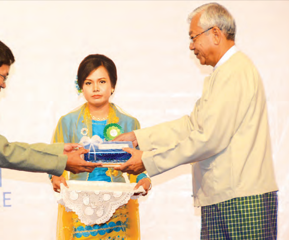
နိုင်ငံတော်သမ္မတ ဦးထင်ကျော် ၂၀၁၆ ခုနှစ် ကမ္ဘာ့ပတ်ဝန်းကျင်ထိန်းသိမ်းရေးနေ့အထိမ်းအမှတ် အလွတ်တန်းဆောင်းပါးပြိုင်ပွဲ တတိယဆုရ ဦးကျော်ဆွေဦးအား ဆုပေးအပ် ချီးမြှင့်စဉ်

ဖွင့်ပွဲအခမ်းအနားကို ရုပ်သိမ်းလိုက်သည်။ ဖွင့်ပွဲအခမ်းအနားအပြီးတွင် နိုင်ငံ တော်သမ္မတသည် ဆုရရှိကြသူများ၊ အခမ်းအနားသို့ တက်ရောက်လာကြသူ များနှင့်အတူ စုပေါင်း၍ မှတ်တမ်းတင် ဓာတ်ပုံရိုက်ပြီး အဆိုပါခန်းမအတွင်း၌ ပတ်ဝန်းကျင်ထိန်းသိမ်းရေးနေ့ အထိမ်း အမှတ်အဖြစ် ပြသထားသော ပြခန်းများ ကို လှည့်လည်ကြည့်ရှုလေ့လာသည်။