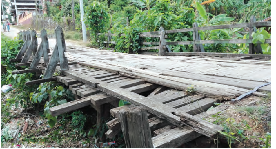
ပါက ကျောင်းသား ကျောင်းသူများနှင့် ဆရာ ဆရာမများအပြင် ကသာမြို့သူ မြို့သားများအတွက်လည်း စိုးရိမ်စိတ်မရှိတော့ဘဲ အန္တရာယ်ကင်းစွာ ဖြတ်သန်းသွားလာနိုင်မည်ဖြစ်ကြောင်း တင်ပြအပ်ပါသည်။ လူ့အောင်(ကသာ)

စစ်ကိုင်းတိုင်းဒေသကြီး ကသာခရိုင် ကသာမြို့ရှိ အထက(၂)သို့သွားရာလမ်းမှ သစ်သားတံတားတစ်စင်းသည် သက်တမ်း ကြာရှည်နေပြီးအောက်ခြေပေါင်တန်းများဆွေးမြည့်နေခြင်း၊ လက်ရန်းတိုင် များမရှိတော့ခြင်း၊ အောက်ခင်းကြမ်းပြင်များကျိုးပဲ့နေခြင်းနှင့် ချို့နယ်များတွယ်ကပ်နေခြင်းများ တွေ့ရှိရပါသည်။ ယခုကဲ့သို့ ကျောင်းဖွင့်ရာသီတွင် ကျောင်းသူ ကျောင်းသားများအတွက် အန္တရာယ်စိုးရိမ်ရပြီးကုန်းဆင်း၊ ကုန်းတက်နေရာလည်း ဖြစ်နေသဖြင့် ဈေးသွားဈေးလာ၊ ကျောင်းသွားကျောင်းလာ ယာဉ်သွားယာဉ်လာများအတွက် ဘေးကင်းစွာသွားလာနိုင်ရေးအတွက် ပြုပြင်ရန် တင်ပြထားသည်ဟု တာဝန်ရှိသူများက ပြောပြထားသော်လည်း ယနေ့အချိန်ထိ ပြုပြင်မှုမရှိသဖြင့် သက်ဆိုင်ရာမှ ဤတံတားလေးကို အမြန်ဆုံးပြုပြင် ပေး