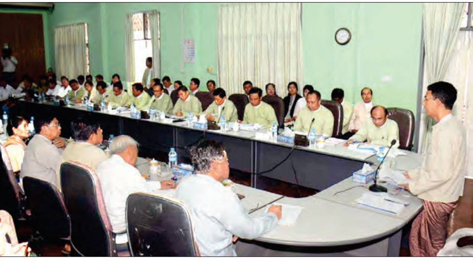
ပေးခြင်း၊ ပုဂ္ဂလိက ငါး/ပုစွန် မွေးမြူထုတ်လုပ်ရေးကို အားပေးကူညီဆောင်ရွက်ခြင်း၊ လိုအပ်သော ရင်းနှီးမြုပ်နှံမှုများအတွက် ချေးငွေများ ပံ့ပိုးပေးခြင်းနှင့် ငါးအစာဈေးနှုန်း တည်ငြိမ်ရေးတို့ကို ဆောင်ရွက်ပေးလျက်ရှိကြောင်း၊ ငါးရိက္ခာ လိုအပ်ချက်များကို ဖြည့်ဆည်းပေးနိုင်ရေးအတွက် ခေတ်မီ ရေချို ရေငန် ငါး/ပုစွန်မွေးမြူရေးလုပ်ငန်းများ ဖွံ့ဖြိုးတိုးတက်လာစေရေးနှင့် ရေလုပ်သားများ၏ လူမှုစီးပွားဘဝများ ဘက်စုံဖွံ့ဖြိုးတိုးတက်စေရေးတို့

ငါးလုပ်ငန်းဦးစီးဌာနမှူးရုံး အစည်းအဝေးခန်းမ၌ မြန်မာနိုင်ငံ ငါးလုပ်ငန်းအဖွဲ့ချုပ်နှင့် မြန်မာနိုင်ငံ မွေးမြူရေးလုပ်ငန်းအဖွဲ့ချုပ်တို့မှ တာဝန်ရှိသူများနှင့် သီးခြားစီတွေ့ဆုံစဉ် စိုက်ပျိုးရေး၊ မွေးမြူရေးနှင့် ဆည်မြောင်းဝန်ကြီးဌာန ပြည်ထောင်စုဝန်ကြီး ဒေါက်တာအောင်သူက ဆွေးနွေးပြောကြားသည်။ ပြည်ထောင်စုဝန်ကြီးက ငါးသယံဇာတများ အလွန်အမင်း လျော့နည်းလာမှုအပေါ် ပြန်လည်ကုစားနိုင်ရေးအတွက် သုတေသနလုပ်ငန်းများ၊ ပညာပေးလုပ်ငန်းများ၊ ဥပဒေနှင့် နည်းဥပဒေများ ပြဋ္ဌာန်းသတ်မှတ်နိုင်ရေး ဆောင်ရွက်ခြင်းများ အပါအဝင် မွေးမြူရေးကဏ္ဍမှ တိုင်းရင်းသားပေါက်များ၊ မွေးမြူရေး ငါးသားပေါက်များကို သဘာဝရေပြင်၌ မျိုးစိုက်ထည့်