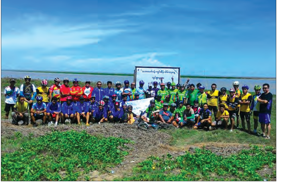
စက်ဘီးစီးဝါသနာရှင် မည်သူမဆို ရှိသည့် စက်ဘီးအမျိုးအစားများဖြင့် လာရောက်ပူးပေါင်းပါဝင်နိုင်ပြီး ခရီးစဉ်များတွင် လိုက်ပါနိုင်မည်ဖြစ်ကြောင်း သိရသည်။ မေဦးမိုး

အပါအဝင် အသွားအပြန် မိုင် ၁၀၀ ဝန်းကျင်စီရကြောင်း၊ လက်ခုပ်ကုန်းကမ်းခြေ ခရီးစဉ်တွင် လက်ခုပ်ကုန်း Orchid Hotel Group က ဂုဏ်ပြုကြိုဆိုသည့်အနေဖြင့် နေ့လည်စာဖြင့် ဧည့်ခံကျွေးမွေးပြီး ပံ့ပိုးကူညီခဲ့ကြောင်း သိရသည်။ Bicycle Network Myanmar က ဆက်လက်ပြုလုပ်သွားမည့် တစ်လနှစ်ကြိမ် စက်ဘီးခရီးစဉ်များတွင်