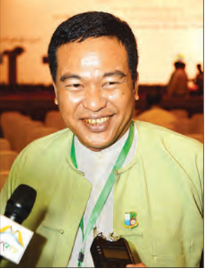
ဦးကျော်ဆန်းနိုင် ညွှန်ကြားရေးမှူး၊ သယံဇာတနှင့် သဘာဝပတ်ဝန်းကျင် ထိန်းသိမ်းရေးဝန်ကြီးဌာန

ရေရှည်စဉ်ဆက်မပြတ် ဖွံ့ဖြိုးတိုးတက်မှုနှင့်ပတ်သက်၍ ပတ်ဝန်းကျင်ထိန်းသိမ်းရေးကို ကဏ္ဍအလိုက် ဖွံ့ဖြိုးတိုးတက်ရေးလုပ်ငန်း စီမံချက်များတွင် ထည့်သွင်းရေးဆွဲနိုင်ရန်အတွက် အမျိုးသားပတ်ဝန်းကျင်ဆိုင်ရာ မူဝါဒနှင့် မဟာဗျူဟာ မူဘောင်ကို ကုလသမဂ္ဂ ဖွံ့ဖြိုးမှုအစီအစဉ်ဖြင့်လည်းကောင်း၊ အမျိုးသားအဆင့် ရာသီဥတုပြောင်းလဲမှုဆိုင်ရာ မဟာဗျူဟာနှင့် လုပ်ငန်းအစီအစဉ်များကို ဥရောပသမဂ္ဂ၊ ကုလသမဂ္ဂပတ်ဝန်းကျင်ဆိုင်ရာ အစီအစဉ်နှင့် ကုလသမဂ္ဂအခြေချနေထိုင်ရေးအစီအစဉ်တို့ဖြင့် လည်းကောင်း၊