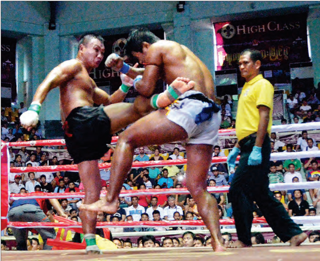
စောဂေါ်မုဒို၏ ခြေကန်ချက် သွေးသစ်အောင်အား ထိမိစဉ်