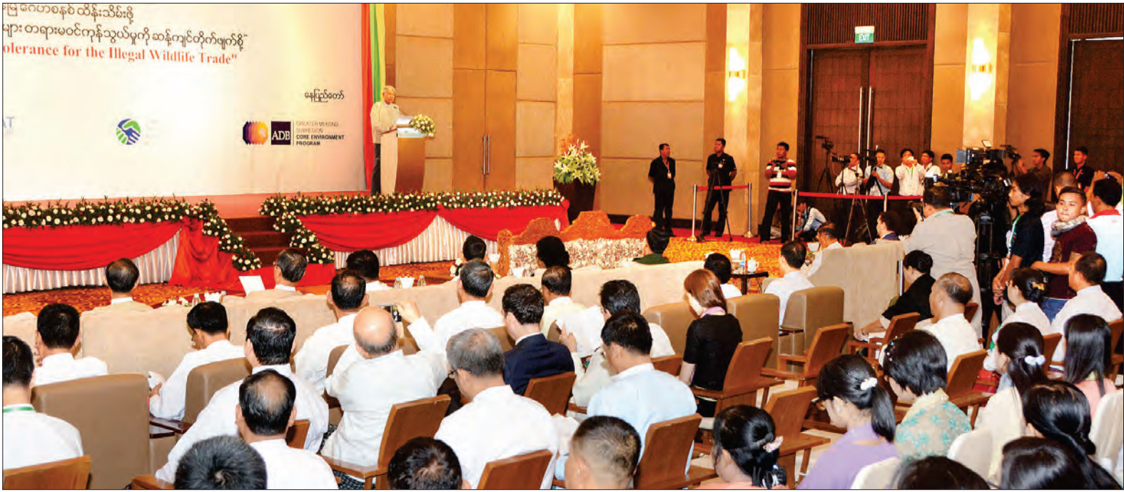
၂၀၁၆ ခုနှစ် ကမ္ဘာ့ပတ်ဝန်းကျင်ထိန်းသိမ်းရေးနေ့ အထိမ်းအမှတ်အခမ်းအနား၌ နိုင်ငံတော်သမ္မတ ဦးထင်ကျော် အမှာစကားပြောကြားစဉ်

အာရှနိုင်ငံအချို့၏ ဈေးဆိုင်ခန်း များတွင် ကျားအရေခွံများ၊ ဧရာမပင်လယ် လိပ်ခွံကြီးများကို တွေ့မြင်နေရပါ ကြောင်း၊ ထိုပုံရိပ်များက တောရိုင်း တိရစ္ဆာန်များ တရားမဝင်ကုန်သွယ်မှု သည် မိမိတို့ ကမ္ဘာမြေ၏ အဖိုးတန်လှ သည့် ဇီဝမျိုးစုံမျိုးကွဲများ လျော့ပါးခြင်း နှင့် မျိုးသုဉ်းခြင်းအခြေအနေ ရောက်ရှိ နေသည်ကို သတိပေးနေပါကြောင်း၊ အာရှမှောင်ခို ဈေးကွက်တွင် ဆင်စွယ် တစ်ကီလိုသည် ဒေါ်လာ ၂၂၀၀ ခန့်