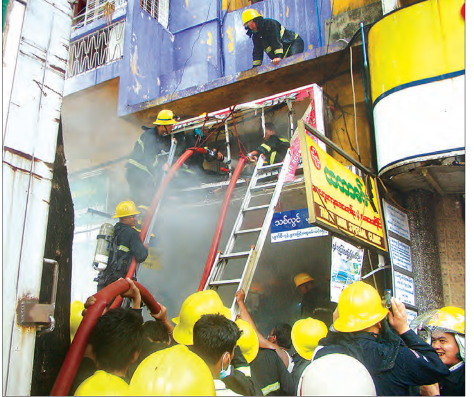
မီးသတ်တပ်ဖွဲ့ဝင်များ ခက်ခက်ခဲခဲမီးငြိမ်းသတ်နေသည်ကို တွေ့ရစဉ် ဓာတ်ပုံ - ပုံပုံ