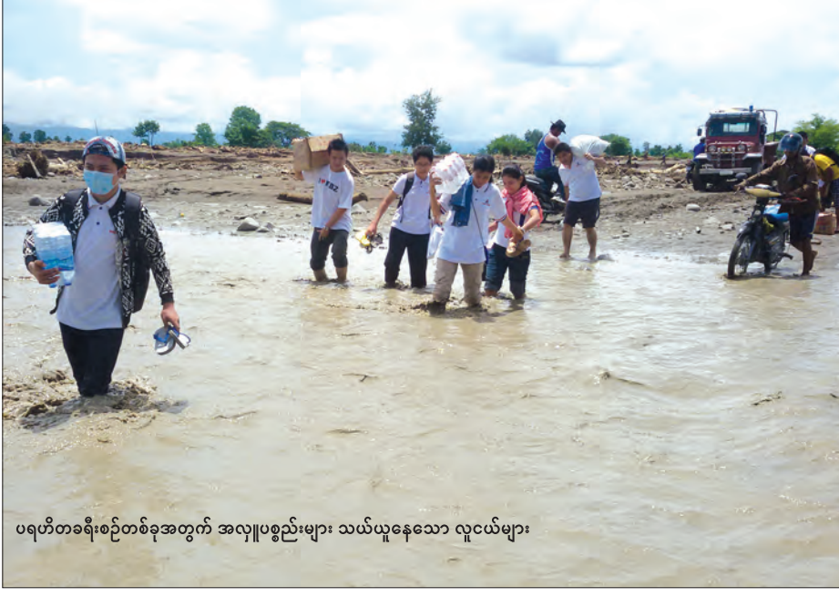
ပရဟိတခရီးစဉ်တစ်ခုအတွက် အလှူပစ္စည်းများ သယ်ယူနေသော လူငယ်များ

နေ့စဉ်ထုတ်သတင်းစာများကို ကျွန်ုပ် အမြဲဖတ်လေ့ရှိပါတယ်။ ခုတစ်လောထူးခြားပြီး လူတိုင်းစိတ်ဝင်စားတဲ့ သတင်းကတော့ မိုးလေဝသ သတင်းပါ။ မြန်မာနိုင်ငံသာမကပါ ကမ္ဘာ့နှံ့အဝန်းမှာ ရာသီဥတုဖောက်ပြန်မှုတွေ ဖြစ်ပေါ်နေပါတယ်။ မကြာမှီပဲ ထန်းသီးလုံးလောက် မိုးသီးကြွေတာတွေ၊ မိုးကြိုးပစ်တာတွေကိုလည်း ကြားသိနေရပါတယ်။ ရာသီဥတုဖောက်ပြန်မှုကြောင့် ပြည်သူတွေ အတိဒုက္ခရောက်တာတွေရတော့ များစွာ စိတ်မကောင်းဖြစ်မိပါတယ်။ အချို့နေရာဒေသတွေမှာ သောက်သုံးရေပြတ်လပ်ကုန်လို့ နိုင်ငံတော်အစိုးရ ဒေသအုပ်ချုပ်ရေးအဖွဲ့တွေက လိုက်လံလှူဒါန်းနေတာတွေ၊ ပရဟိတအဖွဲ့အမျိုးမျိုးက လိုက်လံလှူဒါန်းနေတာတွေ သတင်းစာမှာဖတ်ရတော့ အနည်းနဲ့အများဆိုသလို ပြည်သူတွေအတွက် စိတ်အေးရပါတယ်။ ရာသီဥတုဖောက်ပြန်မှုကြောင့် အချို့နေရာများမှာ လယ်ယာသုံးခိုင်းနွားတွေ သေဆုံးကုန်ပါတယ်။ အဲဒီလို သေဆုံးမှုတွေကြောင့် ဆုံးရှုံးသွားတဲ့ တောင်သူတွေကို ပရဟိတအဖွဲ့ တစ်ခုက နွားတစ်ကောင်သေဆုံးရင် ငွေကျပ် ၁၀ သိန်း ပေးလှူနေတာကိုလည်း နေ့စဉ်ထုတ်သတင်းစာမှာ ဖတ်လိုက်ရတော့ သာဓုခေါ်လိုက်မိပါတယ်။