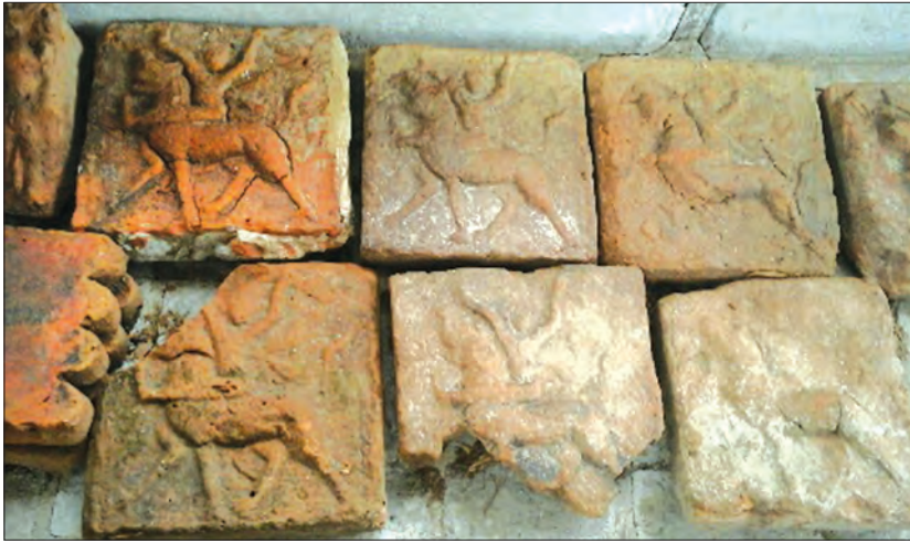
ထိန်းသိမ်းထားသော မြင်းစီးယောက်ျားပုံပါ အုတ်ချပ်များ ခေတ္တရာမြို့လျှင် မိုင်းမောသည် အကြီးဆုံး ပျူမြို့ဟောင်း ဖြစ်ကြောင်း ပျူယဉ်ကျေးမှုဆိုင်ရာသမိုင်းအထောက်အထားများအရ သိရသည်။ ခေတ္တရာမြို့ (မြစ်သား)

မြစ်သား ဇွန် ၅ မန္တလေးတိုင်းဒေသကြီး မြစ်သားမြို့နယ်အတွင်းရှိ မိုင်းမောမြို့ဟောင်းတွင် လေလွင့်လျက်ရှိသော ရှေးဟောင်းပစ္စည်းများကို ထိန်းသိမ်းပြသသွားရန်အတွက် ပြတိုက်ငယ်တစ်ခုကို ဆောက်လုပ်လျက်ရှိကြောင်း သိရသည်။ အဆိုပါပြတိုက်ငယ်ကို တည်ဆောက်နေသည့် မိုင်းမောသုခရတနာကျောင်းတိုက် ဆရာတော်က ယင်းကျောင်းတိုက်ဝင်းအတွင်းရှိ အဆောက်အအုံငယ်တစ်ခုတွင် ရှေးဟောင်းအုတ်ချပ်များကို ထိန်းသိမ်းထားကြောင်း၊ သမိုင်းတွင် အရေးပါသော မြင်းစီးယောက်ျားတစ်ဦး၏ပုံပါ ရုပ်ကြွအုတ်ချပ်များလည်းပါဝင်ကြောင်း၊ ရှေးခေတ်က ပျူလူမျိုးများ မိုင်းမောမြို့ဟောင်းဒေသတွင် နေထိုင်ခဲ့ဖူးကြောင်း သမိုင်းအထောက်အထားအချို့ကို နှောင်းလူများလေ့လာနိုင်အောင် ထိန်းသိမ်းထားခြင်းဖြစ်ကြောင်း၊ ပြတိုက်ငယ်ကို ဆောက်လုပ်ရန်အတွက် ကျောက်ဆည်မြို့ ရှေးဟောင်းသုတေသနဌာနနှင့် ခရိုင်အုပ်ချုပ်ရေးမှူးထံ အကြောင်းကြားပြီးဖြစ်ကြောင်း မိန့်ကြားသည်။ မိုင်းမောမြို့ဟောင်းသည် သရေခေတ္တရာ၊ ဟန်လင်းနှင့် ပျူမြို့ဟောင်းများနှင့် ခေတ်ပြိုင်ဖြစ်ပြီး သရေ