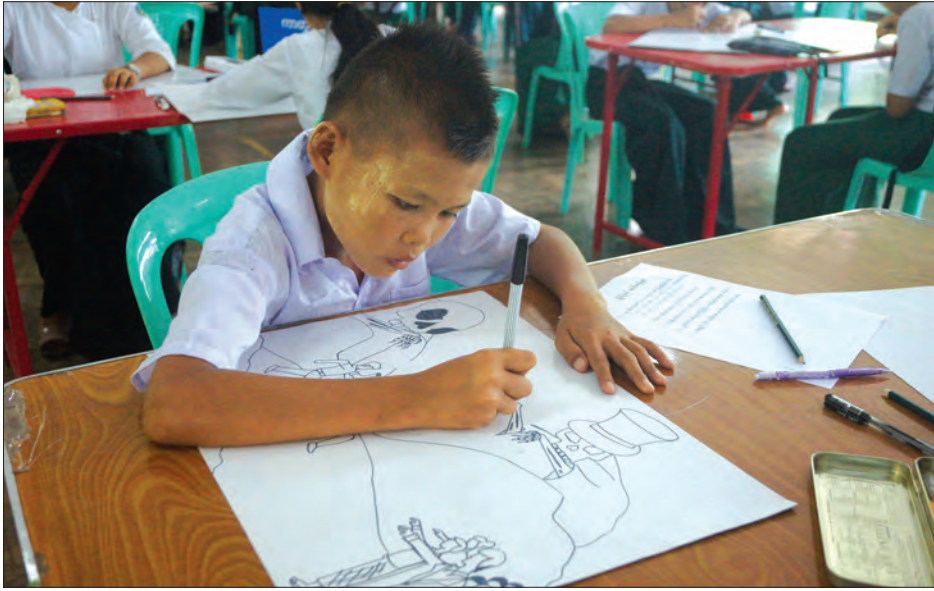
ပန်းချီပြိုင်ပွဲတွင် ယှဉ်ပြိုင်နေသော ကျောင်းသားတစ်ဦး

လုံးမှာ မူးယစ်ကင်း၊ ရေရှည်တည်တံ့ ဖွံ့ဖြိုးရေး မူးယစ်ဆေးကိုရှောင်ပါမနွေး အစရှိသည့် ခေါင်းစဉ်ငါးမျိုးဖြင့် ကျင်းပခဲ့သည်။ ပြိုင်ပွဲသို့ ကရင်ပြည်နယ်အတွင်းရှိ ဘားအံ၊ လှိုင်းဘွဲ့၊ ကော့ကရိတ်၊ ကြာအင်းဆိပ်ကြီးနှင့် မြဝတီမြို့များရှိ အခြေခံပညာကျောင်းများမှ ကျောင်းသားကျောင်းသူ ၈၉ ဦး၊ တက္ကသိုလ်များမှ ကျောင်းသားကျောင်းသူ ၂၂ ဦး စုစုပေါင်း ၁၁၁ ဦး ဝင်ရောက်ယှဉ်ပြိုင်ခဲ့ပြီး ပန်းချီပြိုင်ပွဲတွင် ၄၄ ဦး၊ ကာတွန်းပြိုင်ပွဲတွင် ၃၀ ဦး၊ ပို့စတာပြိုင်ပွဲတွင် ၃၇ ဦး ဖြစ်ကြောင်း သိရသည်။ ပြိုင်ပွဲတွင် ဆုရရှိသော ကျောင်းသား ကျောင်းသူများအား ဇွန် ၂၆ ရက်တွင် ကျင်းပမည့် အပြည်ပြည်ဆိုင်ရာ မူးယစ်ဆေးဝါးအလှည့်စားနှင့် တရားမဝင်ရောင်းဝယ်မှု တိုက်ဖျက်ရေးနေ့အခမ်းအနားတွင် ဆုများ ပေးအပ်ချီးမြှင့်သွားမည် ဖြစ်သည်။ ပြိုင်ပွဲကျင်းပနေမှုကို ကရင်ပြည်နယ် ဝန်ကြီးချုပ် ဒေါ်နန်းခင်ထွေးမြင့် ပြည်နယ် တရားလွှတ်တော် တရားသူကြီးချုပ် ဦးစောစံလင်း၊ ပြည်နယ်လွှတ်တော် ဒုတိယဥက္ကဋ္ဌ ဒေါ်နန်းသူဇာဝင်း၊ ပြည်နယ် ဝန်ကြီးများ၊ ပြည်နယ်၊ ခရိုင်နှင့် မြို့နယ် အဆင့် ဌာနဆိုင်ရာတာဝန်ရှိသူများ လာရောက်ကြည့်ရှုအားပေးခဲ့ကြသည်။ စောမျိုးမင်းသိန်း (ပြန်/ဆက်)