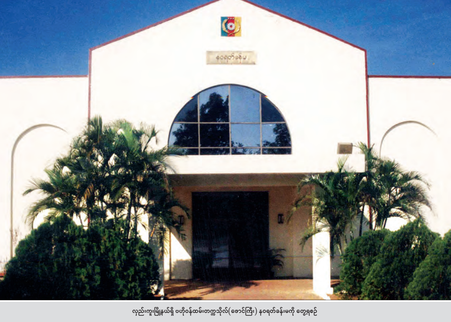
လည်းကူးပြီးမှမရှိ ဝဟိုဝန်ထမ်းတက္ကသိုလ် (ဓောင်ကြီး) နဝရတ်ခန်းမကို တွေ့ရစဉ်

ဖြေ ။ ။ Civil Services Academy (CSA) မှာ ဘွဲ့လွန် ဒီပလိုမာ၊ အဆင့်မြင့် ဒီပလိုမာနဲ့ မဟာဘွဲ့တွေပေး မှာဆိုတော့ တာဝန်ပေးဌာနတွေစွဲဖို့ သက်ဆိုင်ရာတာဝန်ပေး အလိုက် သင်ရိုးညွှန်းတမ်းတွေ ရေးဆွဲနိုင်ဖို့ကို စတင်ပြင်ဆင် ဆောင်ရွက်နေပါပြီ။ ထိရောက်မှုရှိတဲ့ သင်ကြားရေးစနစ်ဖြစ်ဖို့ သင်တန်းအမျိုးအစားအလိုက် သင်ရိုးညွှန်းတမ်းတွေ ပြောင်းလဲ သတ်မှတ်သွားပါမယ်။