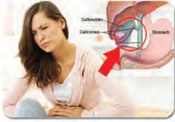
သည်းခြေအိတ်နှင့်သည်းခြေကျောက်များကို ခွဲစိတ်ကုသခြင်း