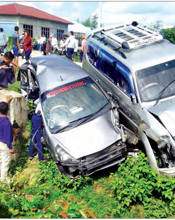
ဥပဒေဘောင်အတွင်း နေထိုင်ခြင်း ဘေးကင်းရန်ကွာ စိတ်ချမ်းသာ