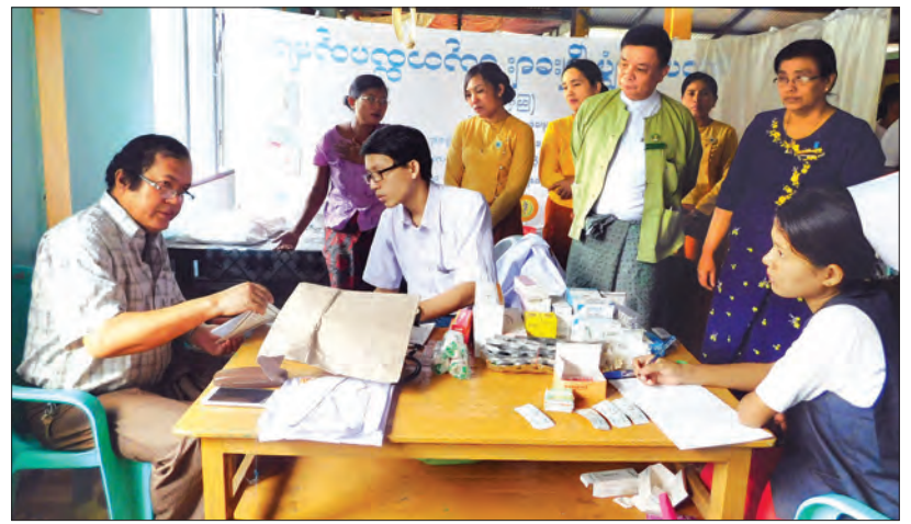
အရေပြား အရိုးအကြော၊ ကလေး၊ ခွဲစိတ်စသည့် လူနာများအား အခမဲ့စစ်ဆေးကုသပေးခဲ့ကြသည်။ အဆိုပါ ဆေးကုသခြင်းအတွက် ဆေးဝါး

လူနာပေါင်း ၃၀၀ ကျော်အား အခမဲ့ဆေးကုသပေးသည့် အစီအစဉ်တွင် ဆေးရုံအုပ်ကြီးနှင့်အတူ ခရိုင် ခုတင် ၂၀၀ ဆံ့ ပြည်သူ့ဆေးရုံကြီးမှ အထွေထွေ၊ ခွဲစိတ်၊ သားဖွားနှင့် မီးယပ်၊ ကလေး၊ အရိုး၊ အကြော၊ သွားနှင့်ခံတွင်း၊ မျက်စိနှင့်ပတ်သက်သောအထူးကုဆရာဝန်ကြီးများ၊ သူနာပြုများ၊ မြို့နယ်မိခင်နှင့် ကလေးစောင့်ရှောက်ရေးအသင်းဝင်များ၊ အမျိုးသမီးရေးရာအဖွဲ့၊ ဝင်များ ပါဝင်ကာ သမိန်ထောကျေးရွာရှိ အထွေထွေ၊ သားဖွားနှင့်မီးယပ်၊ သွားနှင့်ခံတွင်း