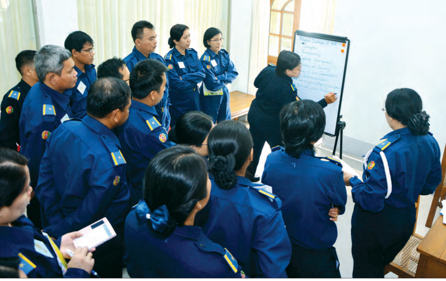
ဝဟိုဝန်ထမ်းတက္ကသိုလ်တွင် ဝန်ထမ်းများ စာတွေ့လက်တွေ့ စိတ်ဝင်တစားလေ့လာသင်ယူနေကြစဉ်

တာဝန်ရှိသူတွေနဲ့လည်း တွေ့ဆုံညှိနှိုင်းပြီးဖြစ်ပါတယ်။ နောက်ပြီး ကျွန်တော်တို့ ဝဟိုဝန်ထမ်းတက္ကသိုလ်နှစ်ခုမှာ ဖွင့်လှစ်ပို့ချနေတဲ့ တက္ကသိုလ်၊ ကောလိပ် ဆရာ ဆရာမတွေအတွက်