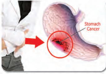
အစာအိမ်နှင့် အူလမ်းကြောင်းကင်ဆာ များကို ခွဲစိတ်ကုသခြင်း။