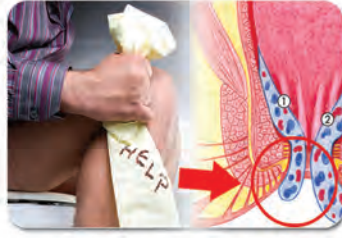
လိပ်ခေါင်းရောဂါ ခွဲစိတ်ကုသခြင်း။