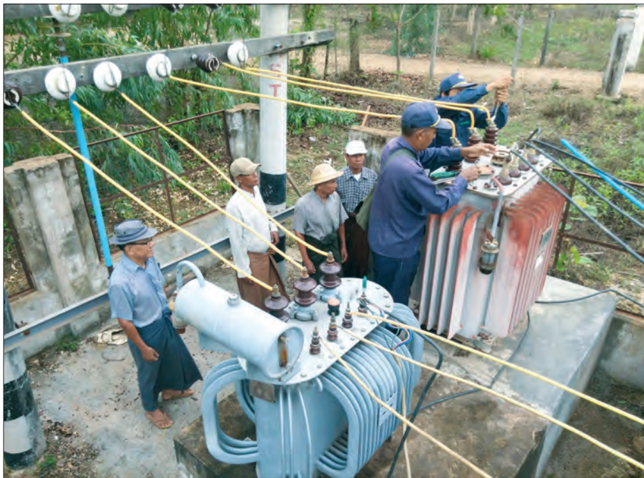
ပဲခူးတိုင်းဒေသကြီး သာယာဝတီခရိုင် နတ်တလင်းမြို့ ရွာမရပ်ကွက် အေးငြိမ်းသာမြို့သစ်တွင် 11/0.4KV-100KVA ထရန်စဖော်မာတစ်လုံးကို မြို့နယ်လျှပ်စစ်ဗဟိုဦးစီးဌာနမှ ဦးထွန်းထွန်းဦးနှင့်ဝန်ထမ်းများက မေလနောက်ဆုံးပတ်က တပ်ဆင်ပေးခဲ့စဉ် (၀၆၂)