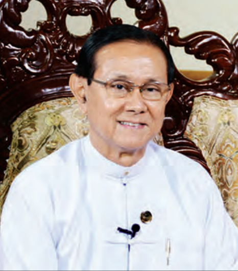
ဦးဝင်းသိန်း ဥက္ကဋ္ဌ၊ ပြည်ထောင်စုရာထူးဝန်အဖွဲ့