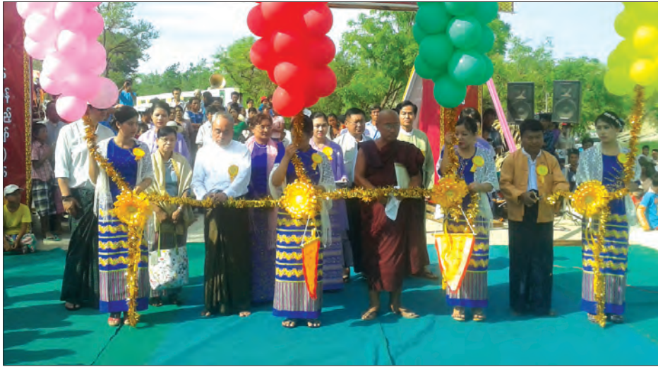
မြင်းမူ ဇွန် ၃ စစ်ကိုင်းတိုင်းဒေသကြီး၊ မြင်းမူ-ထီးဆောင်း-အရာတော်ကတ္တရာလမ်းမှ ကျောက်ကာကတ္တရာလမ်းအထိ ၂၁ မိုင် မေလနောက်ဆုံးပတ်က ဖွင့်လှစ်ခဲ့သော ထန်းလုပ်ချောင်းကူးတံတားကို “ဒီကားလမ်းက စစ်ကိုင်းခရိုင်

မြင်းမူမြို့နယ်ရှိ အစွန်အဖျား၊ မုံရွာခရိုင် အရာတော်မြို့နယ်ရှိ အစွန်အဖျားကြိတ် ဒေသတောင်ကုန်းတွေကို ကန့်လန့်ဖြတ်ပြီး ဖောက်လုပ်ထားတာပါ။ တောင်ကျချောင်းတွေ လျှိုမြောင်းတွေ ထန်းပင်လောက်မြင့်တဲ့ ချောက်ကမ်းပါးကြီးတွေကိုဖြိုချပြီး ဖောက်ထားတာဖြစ်ပါတယ်။ လမ်းဖောက်ခဲ့တာ ၁၆ လ ရှိပါပြီ။ မုံရွာမြို့နယ်အပိုင်းမှာ ချောင်းကူးတံတားလေးစင်းထိုးပြီးပါပြီ။ ဆည်မြောင်းဦးစီးဌာနက နှစ်စင်းထိုးပြီး မုံရွာကျေးလက်ဖွံ့ဖြိုးရေးဦးစီးက တစ်စင်းထိုးတာပါ။ အခုဖွင့်တဲ့ ထန်းလုပ်တံတားက သုံးခန်း ၅၂ ပေ၊ အကျယ်ပေ ၃၀ ခန့်ခင်းအား တန် ၆၀ ရှိတဲ့ သံကူကွန်ကရစ်တံတားဖြစ်ပါတယ်”ဟု မေ့စေတီစာသင်တိုက် နာယကဆရာတော် ဘဒ္ဒန္တပညာဝရက မိန့်ကြားသည်။ မျိုးဝင်းထွန်း(မုံရွာ)