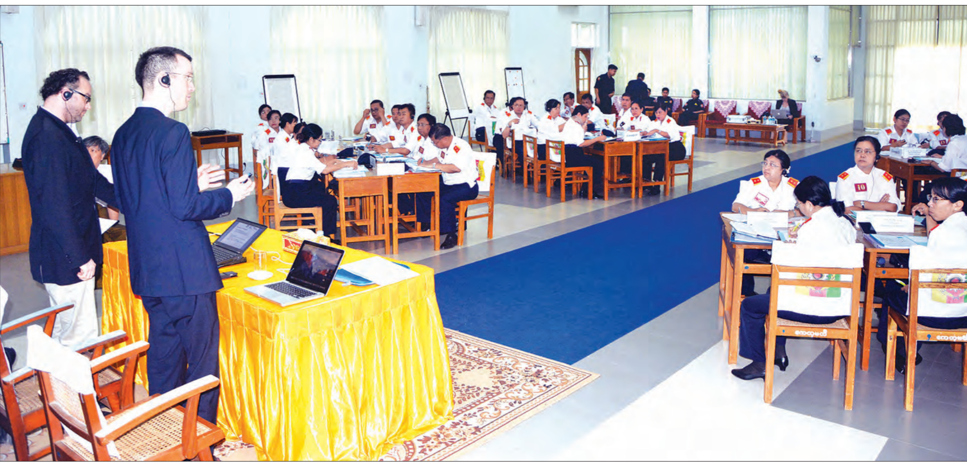
ဝန်ထမ်းများ အရည်အသွေးမြင့်မားစေရန် ဤသို့လေ့လာသင်ယူခဲ့ကြသည်

မေး ။ ။ ဝန်ထမ်းတွေ ရွေးချယ်လေ့ကျင့်တဲ့နေရာမှာကော ဘာတွေကို ဘယ်လိုပြုပြင်ပြောင်းလဲသွားမလဲဆိုတာ သိလို့ပါတယ်။ ဖြေ ။ ။ ဝန်ထမ်းလေ့ကျင့်ရေးအပိုင်းမှာ နှစ်စဉ်ပင်ဆောင်ရွက် သွားရရှိပါတယ်။ နယ်လက်တစ်က အရည်အသွေးပြည့်စုံတဲ့ ပြည်သူ့ဝန်ထမ်းကောင်းတွေ မွေးထုတ်ပေးဖို့အတွက် ဝဟိုဝန်ထမ်း တက္ကသိုလ်နှင့် နေရာမှာ Civil Services Academy (CSA) တွေကို ဖွင့်လှစ်သွားမယ်။ အဲဒီ Academy တွေကလည်း အစပျိုးပေး ပေးလား၊ တွေ့ကျင့်မှု ပေးလား (Post-graduate