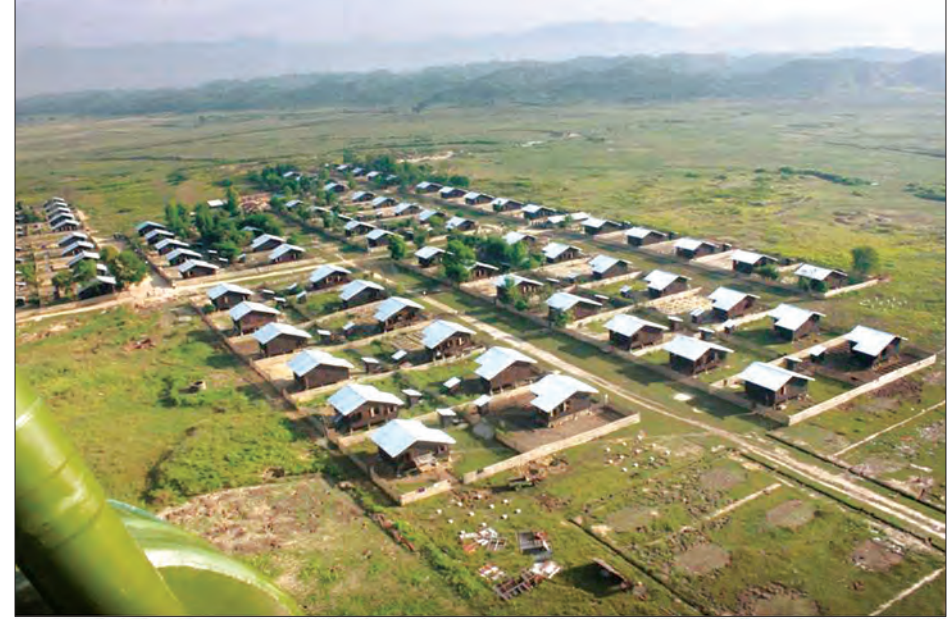
မောင်တောမြို့နယ် ရွှေရင်အေးကျေးရွာရှိ တိုင်းရင်းသားများအတွက် ဆောက်လုပ်ပေးထားသည့် လုံးချင်းအိမ်ရာများ

ဖြေ။ ။ ဖြစ်ပွားခဲ့တဲ့ ရာသီဥတုအခြေအနေအရ ရခိုင် ပြည်နယ်အတွင်းနှင့် နိုင်ငံအနှံ့အပြားမှာ သောက် သုံးရေ ရှားပါးပြတ်လပ်မှု ဖြစ်ပေါ်ခဲ့ရပါတယ်။ ဒါကြောင့်မို့လို့ ကျွန်တော်တို့ ဝန်ကြီးဌာနအနေနဲ့ ရခိုင် ပြည်နယ်အတွင်းရှိ ကျေးလက်နေပြည်သူများ လာမယ့်မိုးရာသီ မှာ ရေချိုကို စနစ်တကျ သိုလှောင်အသုံးပြုနိုင်ဖို့အတွက် စုစု ပေါင်းကျေးရွာ ၇ ရွာမှာ ရေကန် ၇၂ ကန်ကို စက်ယန္တရားတွေ အသုံးပြုကာ အကောင်အထည်ဖော်ဆောင်ရွက်ပေးလျက်ရှိ