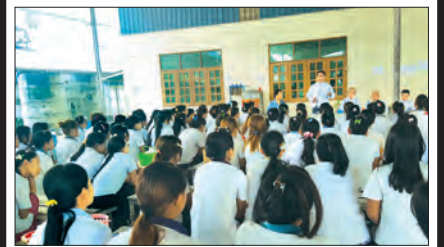
သတင်းဆောင်းပါး-သီသီမင်း စာ-၁၆၊ ၁၇

ရွှေပြောင်းအလုပ်သမားများအရေးအပါအဝင် ပြည်သူ့အကျိုးကို တိုက်ရိုက် ဖော်ဆောင်မည့် အလုပ်သမား၊ လူဝင်မှုကြီးကြပ်ရေးနှင့် ပြည်သူ့အင်အားဝန်ကြီးဌာန ရက် ၁၀၀