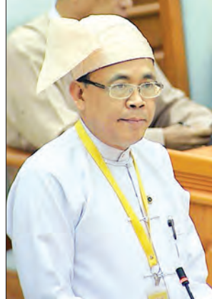
ဒုတိယဝန်ကြီး ဦးကျော်တင် ရှင်းလင်းတင်ပြစဉ်

မြန်မာနိုင်ငံ လွှတ်တော်နှင့် အမေရိကန်ကွန်ဂရက်အောက်လွှတ်တော်တို့အကြား ချစ်ခင်ရင်းနှီးသော ဆက်ဆံရေးဖော်ဆောင်ရန်၊ မြန်မာနိုင်ငံ၏ ဒီမိုကရေစီဖော်ဆောင်ရေးလုပ်ငန်းစဉ်များတွင် ဆက်လက်အားပေးကူညီရန် ကိစ္စရပ်များနှင့် စပ်လျဉ်း၍ ပြည်ထောင်စုလွှတ်တော်နာယက၊ အမျိုးသားလွှတ်တော်ဥက္ကဋ္ဌ မန်းဝင်းခိုင်သန်းသည် အမေရိကန်ကွန်ဂရက်အောက်လွှတ်တော်၏ ဒီမိုကရေစီမိတ်ဖက်အဖွဲ့ဥက္ကဋ္ဌ မစ္စတာပီတာရော့စ်ကမ်းနှင့်အဖွဲ့အား ယနေ့မနန်းလွဲ ၂ နာရီ ၁၅ မိနစ်တွင် နေပြည်တော်ရှိ အမျိုးသားလွှတ်တော် ဧည့်ခန်းမဆောင်၌ တွေ့ဆုံစဉ် ဆွေးနွေးခဲ့ကြသည်။ (အပေါ်ပုံ) တွေ့ဆုံပွဲသို့ ပြည်ထောင်စုလွှတ်တော် ဒုတိယနာယက၊ အမျိုးသားလွှတ်တော် ဒုတိယဥက္ကဋ္ဌ ဦးအေးသာအောင်၊ အမျိုးသားလွှတ်တော်မှ ကော်မတီဥက္ကဋ္ဌများ တက်ရောက်ကြသည်။ (သတင်းစဉ်)