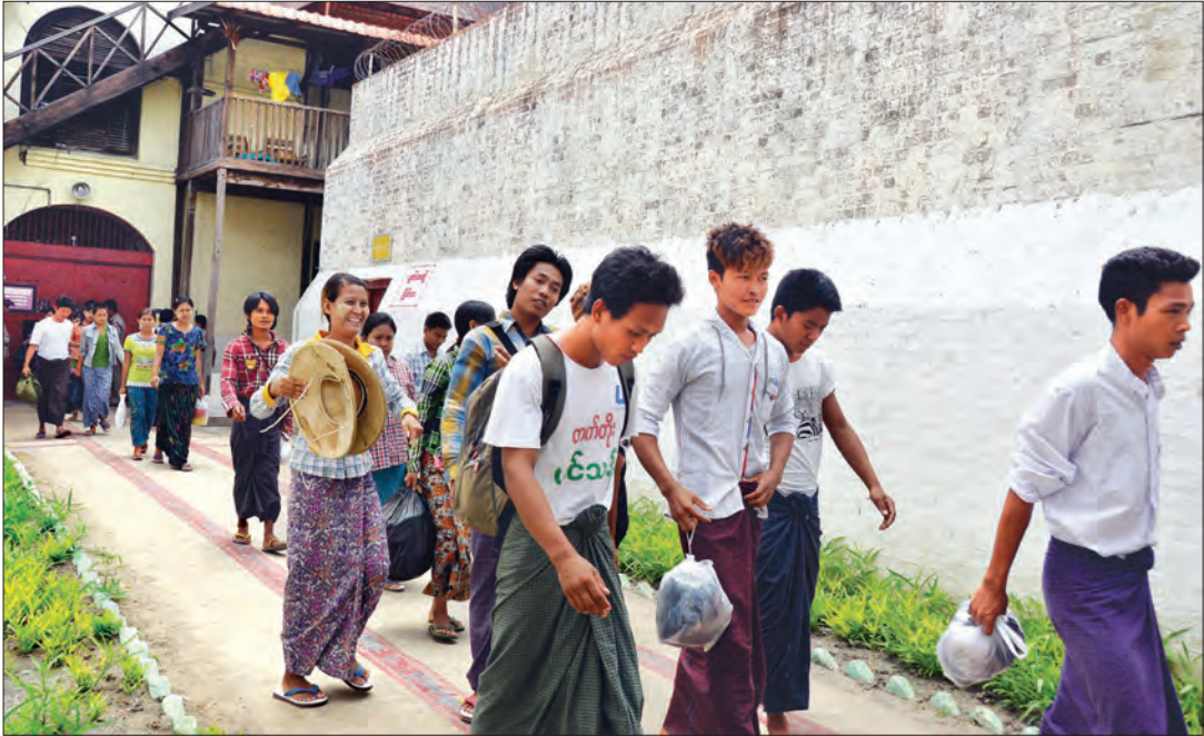
ရမည်းသင်း ဗဟိုအကျဉ်းထောင်မှ လွတ်မြောက်လာသည့် ဆန္ဒပြအလုပ်သမားများအား တွေ့ရစဉ်

သတင်း-ဇော်မင်းလတ် (မြန်မာ့အလင်း)