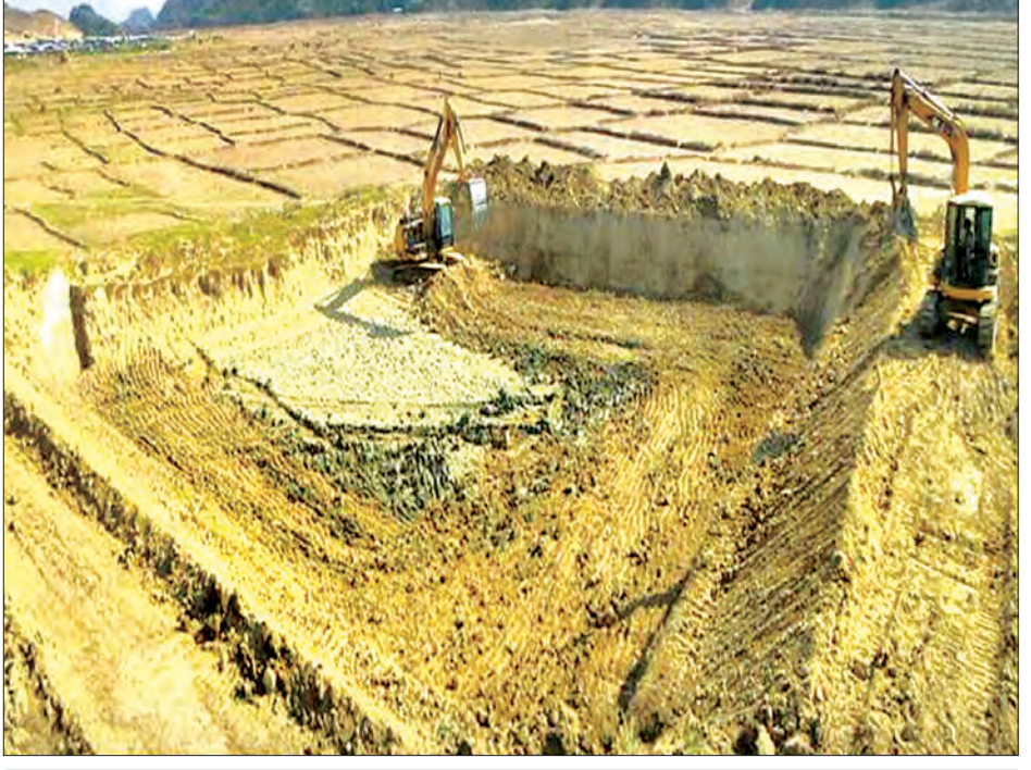
နယ်စပ်ရေးရာဝန်ကြီးဌာနမှ မြေပုံမြန်မာ့ ကံသာထွက်ကျေးရွာတွင် သောက်သုံးရေအတွက် ယန္တရားများဖြင့် ရေကန်တူးဖော်နေမှုကို တွေ့ရစဉ်