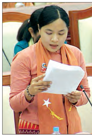
ရွှေဘိုမဲဆန္ဒနယ်မှ ဒေါက်တာ အောင်လတ် ဆွေးနွေးစဉ်

အား ပြည့်စုံစွာ မဖြန့်ဖြူးနိုင်ခြင်းများကို မည်ကဲ့သို့ စီစဉ်ဆောင်ရွက်ထားသည်၊ လျှပ်စစ်မီး ပြတ်တောက်သည့်အခါ၌ လည်း အချိန်နှင့်တစ်ပြေးညီ သတင်းထုတ်ပြန်ပေးနိုင်ခြင်း ရှိ/မရှိ၊ ပုဂ္ဂလိကကုမ္ပဏီအား လွှဲပြောင်းထားသည်ကို အများပြည်သူများ သိရှိရန် သတင်းထုတ်ပြန်ပေးနိုင်ခြင်း ရှိ/မရှိနှင့် ၎င်းပုဂ္ဂလိကကုမ္ပဏီများ၏ တာဝန်ယူမှု၊ တာဝန်ခံမှုများကို လျှပ်စစ်နှင့်စွမ်းအင်ဝန်ကြီးဌာနမှ မည်ကဲ့သို့ စီစဉ်ဆောင်ရွက်ထားသည်ကို သိရှိလိုခြင်း မေးခွန်းနှင့်စပ်လျဉ်း၍ ပြည်ထောင်စုဝန်ကြီး ဦးဖေဇင်ထွန်းက ကျောက်တံတားမြို့နယ်ကို ရန်ကုန်လျှပ်စစ်ဓာတ်အားပေးရေး ကော်ပိုရေးရှင်း (YESC) ကိုယ်စား ဓာတ်အားဖြန့်ဖြူးခြင်းလုပ်ငန်းများ ဆောင်ရွက်ရန် အာကာရီးကုမ္ပဏီလီမိတက်က ၂၀၁၅