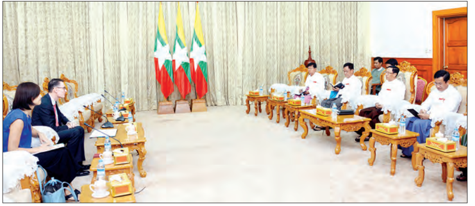
(၂)ရပ်အား ရွေးကောက်တင်မြှောက်မှုစနစ်၊ မဲရုံများ၌ မဲပေးသည့်လုပ်ငန်းစဉ်များနှင့် မဲရေတွက်ပုံတို့အား သံအမတ်ကြီးက ရှင်းလင်းပြောကြားခဲ့သည်ဟု သတင်းရရှိသည်။ (သတင်းစဉ်)

နေပြည်တော် မေ ၃၁ ပြည်ထောင်စုရွေးကောက်ပွဲ ကော်မရှင်ဥက္ကဋ္ဌ ဦးလှသိန်းသည် မြန်မာနိုင်ငံဆိုင်ရာ ဩစတြေးလျသံအမတ်ကြီး H.E.Mr.Nicholas Coppel နှင့် အဖွဲ့အား ယနေ့ နံနက် ၉ နာရီတွင် နေပြည်တော်ရှိ ပြည်ထောင်စုရွေးကောက်ပွဲကော်မရှင်ရုံး ဧည့်ခန်းမဆောင်၌ တွေ့ဆုံသည်။ (ယာဝုံ) တွေ့ဆုံစဉ် ဩစတြေးလျသံအမတ်ကြီးက ၂၀၁၅ ခုနှစ် အထွေထွေရွေးကောက်ပွဲ၌ မဲရုံမှူး၊ မဲရုံအဖွဲ့ဝင်များ သင်တန်းပေးခြင်းနှင့် မဲရုံဝန်ထမ်း လက်စွဲစာစောင်များ ပြုစုထုတ်ဝေခြင်းတို့ကို ကူညီထောက်ပံ့ပေးခဲ့မှု၊ ရွေးကောက်ပွဲကို ဩစတြေးလျ လွှတ်တော်အမတ်များနှင့် တက္ကသိုလ်များမှ လာရောက်လေ့လာခဲ့မှုနှင့် နောင်ရွေးကောက်ပွဲများ ကျင်းပရာတွင် ရွေးကောက်ပွဲဆိုင်ရာ လိုအပ်ချက်များအား ဆက်လက်ပံ့ပိုးသွားမည့်အခြေအနေတို့ကို ရှင်းလင်းပြောကြားပြီး ပြည်ထောင်စုရွေးကောက်ပွဲကော်မရှင်ဥက္ကဋ္ဌက ဩစတြေးလျနိုင်ငံ၏ ကူညီမှုများသည် ရွေးကောက်ပွဲအောင်မြင်စွာ ကျင်းပနိုင်ရေးအတွက် များစွာ အထောက်အကူပြုပါကြောင်း၊ ရွေးကောက်ပွဲကန့်ကွက်လွှာအမှုများအား Open Court ဖြင့် စစ်ဆေးဆောင်ရွက်လျက်ရှိပြီး အမှု ၁၀ မှုအား အမိန့်ချမှတ်ပြီး ဖြစ်ပါကြောင်း၊ ရွေးကောက်ပွဲကော်မရှင်အဖွဲ့ခွဲအဆင့်ဆင့်အား အသစ်ပြန်လည်ဖွဲ့စည်းသွားမည်ဖြစ်ကြောင်း၊ လက်ရှိမဲဆန္ဒရှင်စာရင်းအား Update ပြုလုပ်ဆောင်ရွက်ခြင်း၊ Voter Education နှင့် လက်စွဲစာစောင်များ ထုတ်ဝေရာတွင် ဩစတြေးလျနိုင်ငံအနေဖြင့် ဆက်လက်အကူအညီပေးစေလိုကြောင်း ပြောကြားသည်။ ယင်းနောက် ဩစတြေးလျနိုင်ငံ၏ မဲပေးမှုစနစ်၊ လွှတ်တော်