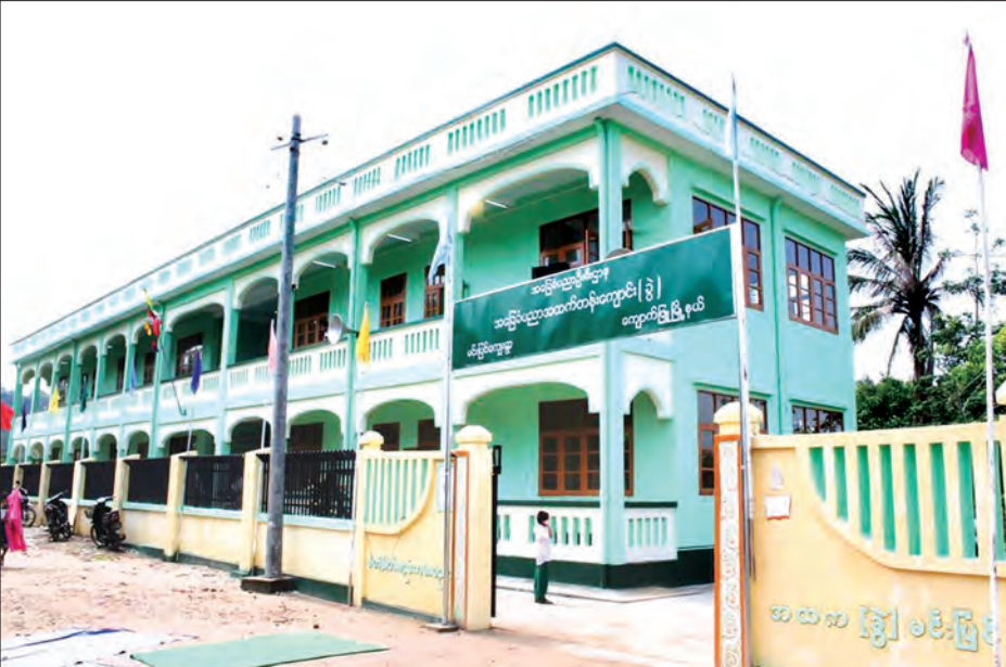
ကျောက်ဖြူမြို့နယ် အထကခွဲ (မင်းပြင်) ကျောင်းဆောင်သစ်ကို တွေ့ရစဉ်

မေး။ ။ ရခိုင်ပြည်နယ်အတွင်း ဝန်ကြီးဌာနအနေနဲ့ ဆောင်ရွက်မယ့်အခြေအနေကို သိလိုပါတယ်။ ဖြေ။ ။ ကျွန်တော်တို့ဝန်ကြီးဌာနအနေနဲ့ နိုင်ငံတော် အစိုးရရဲ့မူဝါဒလမ်းညွှန်ချက်တွေနဲ့အညီ ပြည်သူ လူထုအတွက် လိုအပ်တဲ့ အမှန်တကယ် အကျိုးသက်ရောက်မယ့် လုပ်ငန်းတွေကို ဖော်ဆောင်သွားဖို့ရှိပါတယ်။ ရခိုင်ပြည်နယ်မှာ ရွှေ့ပြောင်းလုပ်သားများ ထောက်ပံ့ရေးဗဟိုဌာန တစ်ခုကို ဖွင့်လှစ်သွားဖို့ စီစဉ်ထားပါတယ်။ အဲဒီလုပ်သားများ ဗဟိုဌာန ဖွင့်လှစ်ခြင်းအားဖြင့် ရခိုင်ဒေသမှာရှိတဲ့ နိုင်ငံခြားကို သွားရောက် အလုပ်လုပ်ကိုင်မယ့် လုပ်သားတွေနဲ့ ပြည်တွင်းမှာ အလုပ်လုပ် ကိုင်နေတဲ့ လုပ်သားတွေအတွက် သတင်းတွေကို စုံစမ်းရယူနိုင် ပါတယ်။ နိုင်ငံခြားကုမ္ပဏီတွေမှာ ရောက်ရှိနေတဲ့ လုပ်သားတွေ အတွက် သတင်းကိုရယူနိုင်သလို ပြည်ပက သတင်းတွေကိုလည်း ပြည်တွင်းမှ ပြန်ပြီးတော့ ရယူနိုင်ပါတယ်။