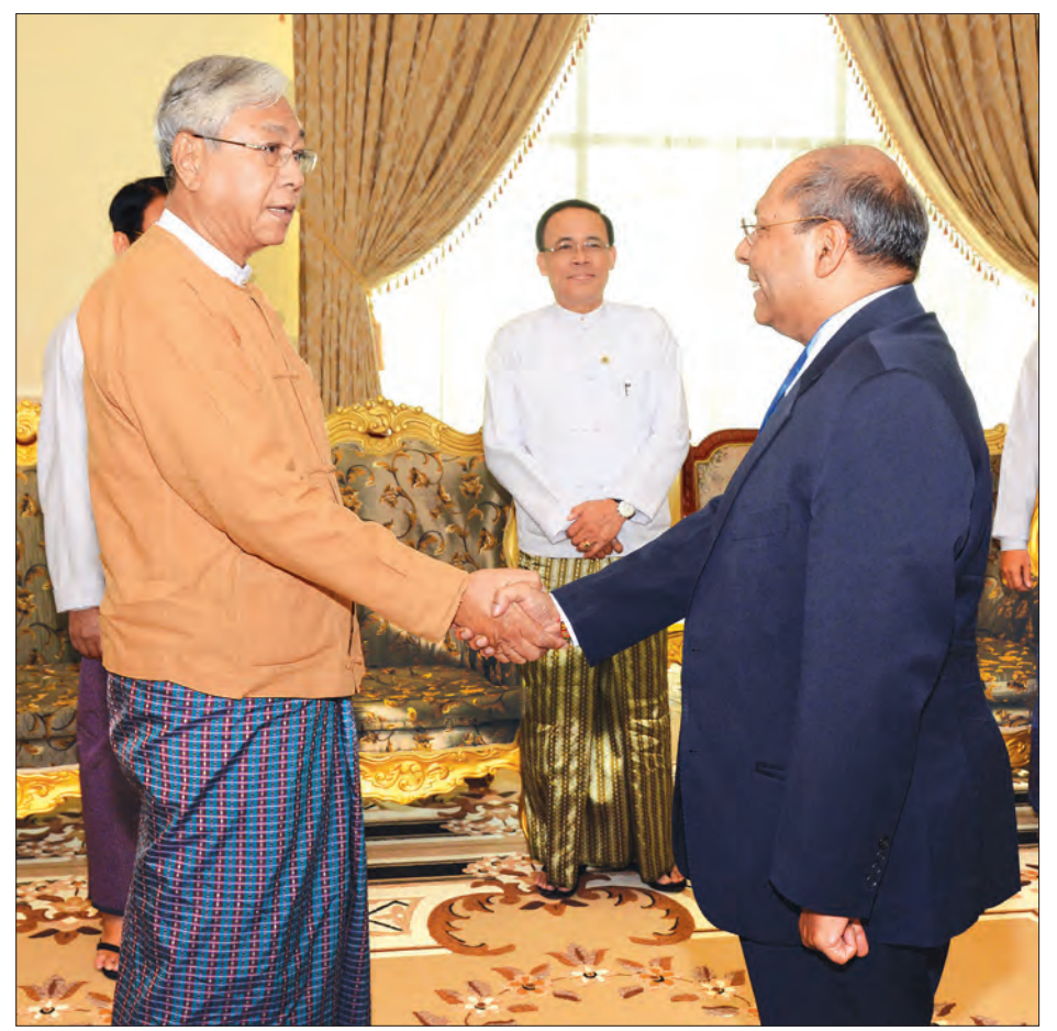
နိုင်ငံတော်သမ္မတ ဦးထင်ကျော် အိန္ဒိယနိုင်ငံသံအမတ်ကြီး မစ္စတာဂေါတမ်မူဒို ပါဒါယအား ရင်းရင်းနှီးနှီးနှုတ်ဆက်စဉ် (သတင်းစဉ်)

တာဝန်ပြီးဆုံး၍ ပြန်လည်ထွက်ခွာတော့မည့် အိန္ဒိယနိုင်ငံသံအမတ်ကြီး မစ္စတာဂေါတမ်မူဒို ပါဒါယအား နိုင်ငံတော်သမ္မတ ဦးထင်ကျော်သည် ယနေ့နံနက် ၁၁ နာရီခွဲတွင် နေပြည်တော်ရှိ နိုင်ငံတော်သမ္မတအိမ်တော်ညွှန်ခန်းမ၌ လက်ခံတွေ့ဆုံစဉ် နှစ်နိုင်ငံ ချစ်ကြည်ရင်းနှီးမှုနှင့် ယဉ်ကျေးမှုကဏ္ဍများ၌ ပူးပေါင်းဆောင်ရွက်ရေးတို့နှင့်စပ်လျဉ်း၍ ဆွေးနွေးခဲ့ကြသည်။ တွေ့ဆုံပွဲသို့ ပြည်ထောင်စုဝန်ကြီး ဒေါက်တာဇေမြင့်၊ ဒုတိယဝန်ကြီး ဦးကျော်တင်နှင့် တာဝန်ရှိသူများ တက်ရောက်ကြသည်။ (သတင်းစဉ်)