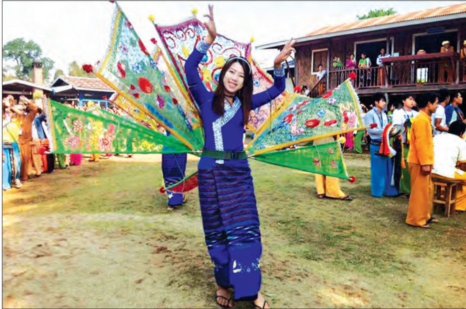
ရှမ်းရိုးရာပွဲတော်တွင် ကိန္နရီ ကိန္နရာအကဖြင့် ကပြဖျော်ဖြေစဉ်။