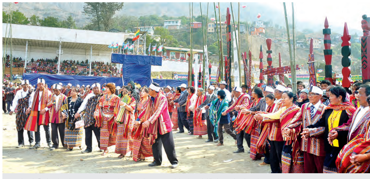
(၆၈)နှစ်ပြောက် ချင်းအမျိုးသားနေ့ အခမ်းအနားကို ဝဗုသူးမောင် အားကစားကွင်း၌ စည်ကားသိုက်မြိုက်စွာ ကျင်းပစဉ်