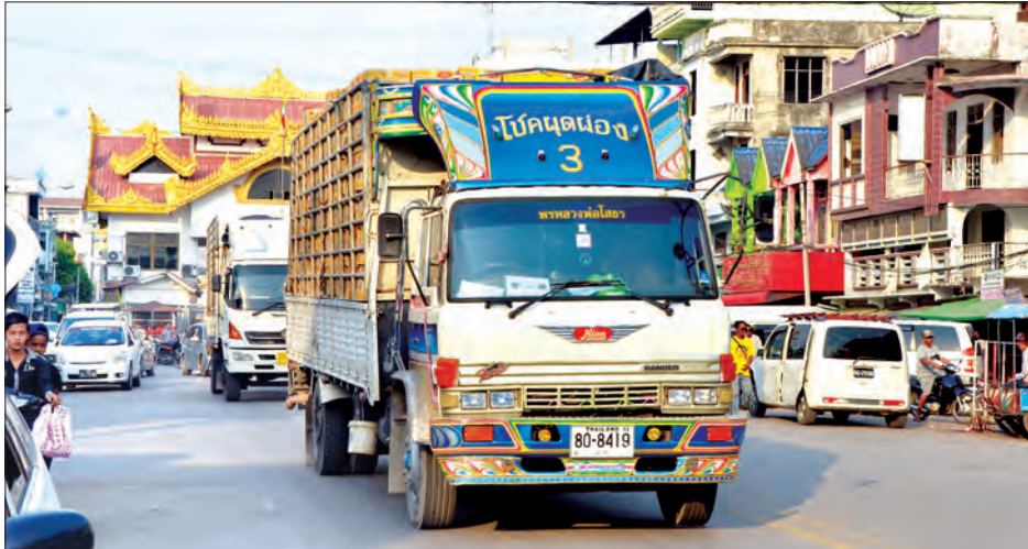
ပြည်ပမှတင်သွင်းလာသော ကုန်တင်ယာဉ်များကို မြဝတီနယ်စပ်ဒေသတွင် တွေ့ရစဉ်

လည်း သိရသည်။ အဆိုပါ အွန်လိုင်းအပြည့်အဝ အသုံးပြု ပို့ကုန်သွင်းကုန် လိုင်စင်စနစ် လျှောက်ထားခြင်းကို ဇွန် ၇ ရက်မှ စတင်ဆောင်ရွက်ပေးမည် ဖြစ်ကြောင်း နှင့် လျှောက်ထားသူ ပို့ကုန်သွင်းကုန် လုပ်ငန်းရှင်များအနေဖြင့် အချက်အလက်ပြည့်စုံပါက ၁၀ မိနစ်အတွင်း လိုင်စင်လျှောက်ထားမှု ပြီးစီးမည် ဖြစ်၍ အချိန်ကုန်ပင်ပန်းမှုများ သက်သာကာ ကုန်သွယ်မှုမြန်ဆန်လာမည်ဖြစ်သည်။