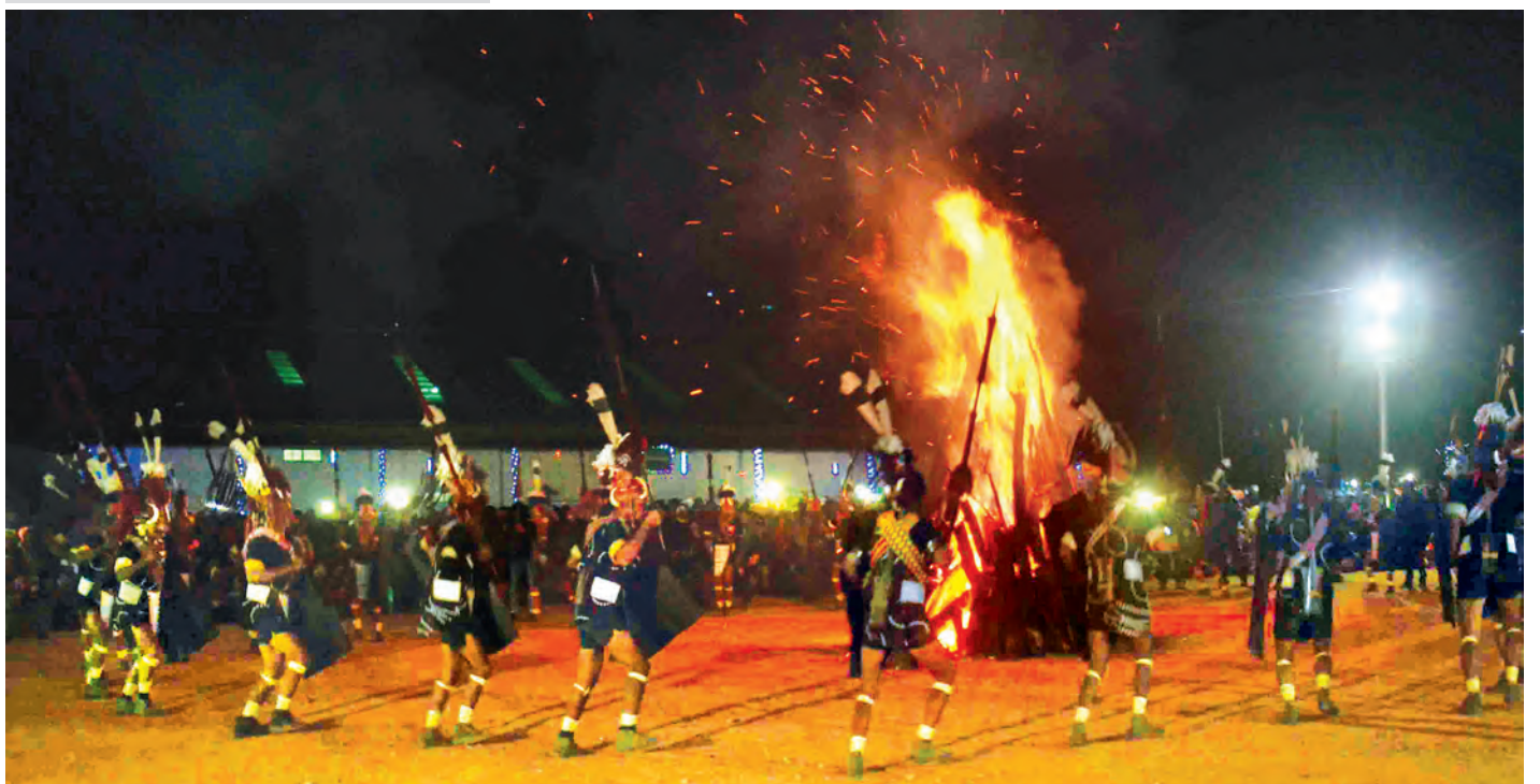
မီးပုံပွဲမှ ပျံလွင့်လာသည့် မီးစများ၏အလှနှင့်အပြိုင် ထွန်းလင်းနေသည့် နီယွန်မီးအလှကို နာဂတောင်တန်းပေါ်တွင် ဖြန့်ကြက်နိုင်ခဲ့ပြီ

ပြည်သူ့လူထုလက်ထဲမှာ ရောက်ရှိလာတဲ့အာဏာကို၊ အခွင့်အရေးကို ဒီမိုကရေစီစနစ်ကျကျ သုံးစွဲနိုင်အောင်၊ ရှေ့ဆက်ပြီးတော့ ဦးဆောင်နိုင်အောင် ပြည်သူ့လူထုအားလုံးနဲ့ တိုင်းရင်းသားအားလုံးက အချင်းချင်းချစ်ခင်ယုံကြည်ပြီး ပြည်ထောင်စုစိတ်ဓာတ်တည်ဆောက်ကြပါ။ ပြည်ထောင်စုစိတ်ဓာတ်ရှိမှ ကျွန်တော်တို့နိုင်ငံဟာ ငြိမ်းချမ်းရေးကို တည်ဆောက်နိုင်မှာ ဖြစ်ပါတယ်။