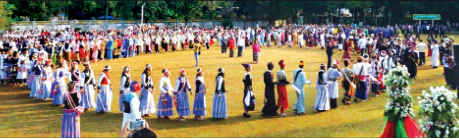
မြစ်ကြီးနားမြို့၌ (၆၈)နှစ်ပြောက် ကချင်ပြည်နယ်နေ့အခမ်းအနား ကျင်းပစဉ်

အစိုးရသစ်လက်ထက်တွင် ဝန်ကြီးဌာနများကို ပြန်လည်ပြင်ဆင် ဖွဲ့စည်းခဲ့သည်။ ယင်းတို့အနက်မှ ဝန်ကြီးဌာနအသစ်တစ်ခုဖြစ် သည့် တိုင်းရင်းသားလူမျိုးများရေးရာဝန်ကြီးဌာနကို တိုးချဲ့ ထည့်သွင်းဖွဲ့စည်းခဲ့ပြီး တိုင်းရင်းသားလူမျိုးများရေးရာဝန်ကြီး ဌာန၏ ရက် ၁၀၀အတွင်း ဆောင်ရွက်သွားမည့် လုပ်ငန်းစဉ်များနှင့် ဖွဲ့စည်းခြင်းတည်လာပုံများကို တိုင်းရင်းသားလူမျိုးများရေးရာ ဝန်ကြီးဌာန ပြည်ထောင်စုဝန်ကြီး နိုင်ငံသက်လွင်နှင့် တွေ့ဆုံ မေးမြန်းထားသည်။