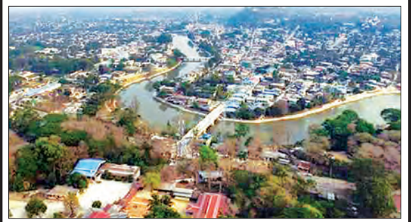
တွေ့ဆုံမေးမြန်း-ဖြိုးစန္ဒာမြင့် စာ-၁၆၊ ၁၇