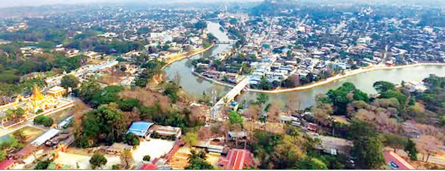
စွဲမြီးလာသည့် ကယားပြည်နယ် လွိုင်ကော်မြို့