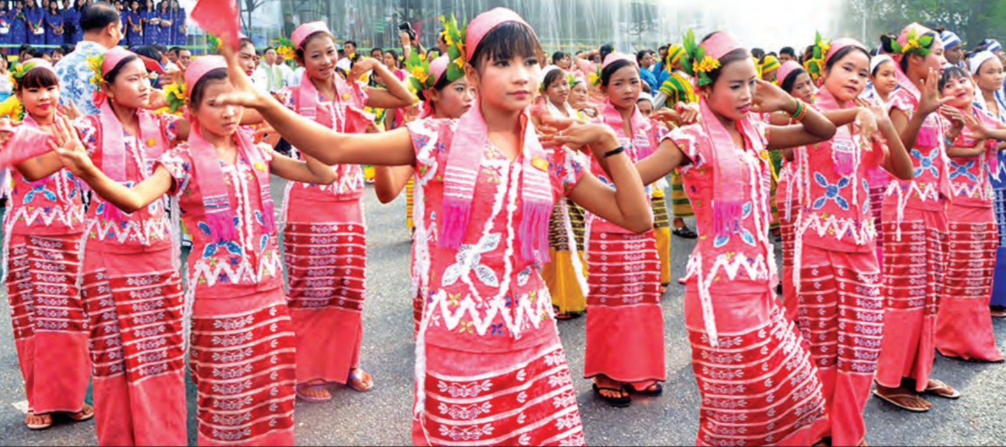
မဟာသင်္ကြန်ပွဲတော်တွင် ကရင်တိုင်းရင်းသားလူမျိုး နှစ်ဆယ့်နှစ်နှစ်အားဖြင့်