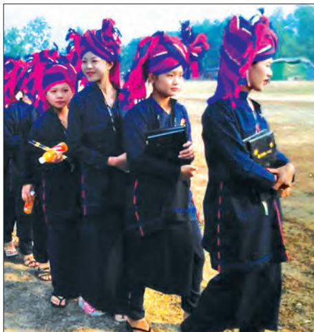
ပအိုဝ်းအမျိုးသားနေ့ပွဲတော်အခမ်းအနားတွင် ပအိုဝ်းတိုင်းရင်းသားလူမျိုးအား တွေ့ရစဉ်

ဖြေ ။ ။ တိုင်းရင်းသားလူမျိုးတွေကို ပြောပြချင်တာက ကျွန်တော်တို့ပြည်ထောင်စုမှာ တိုင်းရင်းသားလူမျိုးပေါင်းစုံစုပေါင်းပြီး နေထိုင်တဲ့ ပြည်ထောင်စုဖြစ်တဲ့ အတွက်ကြောင့် ဒီပြည်ထောင်စုသမ္မတ မြန်မာနိုင်ငံထဲမှာ ဒီလူမျိုးအားလုံးအချင်းချင်းက စည်းလုံးညီညွတ်ဖို့၊ တည်ဆောက်ထားတဲ့ ပြည်ထောင်စုကို ပြည်ထောင်စုစိတ်ဓာတ်ရှိရှိ တစ်ယောက်နဲ့တစ်ယောက် ခင်မင်ရင်းနှီးဖို့၊ လေးစားယုံကြည်ဖို့ အင်မတန်မှ အရေးကြီးပါတယ်။ ဒါကြောင့် တိုင်းရင်း