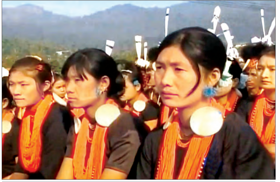
နာဂရိုးရာ နှစ်သစ်ကူးပွဲတော်အခမ်းအနားသို့ တက်ရောက်လာသော ဒေသခံတိုင်းရင်းသူများအား တွေ့ရစဉ်