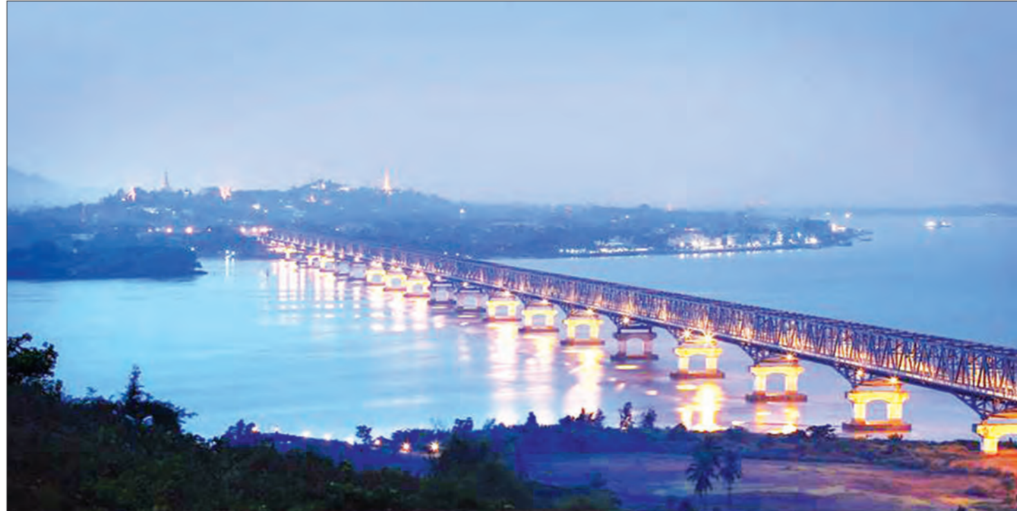
မွန်ပြည်နယ်၏ အထင်ကရပြယုတ်တစ်ခုဖြစ်သည့် သံလွင်တံတား မော်လမြိုင်