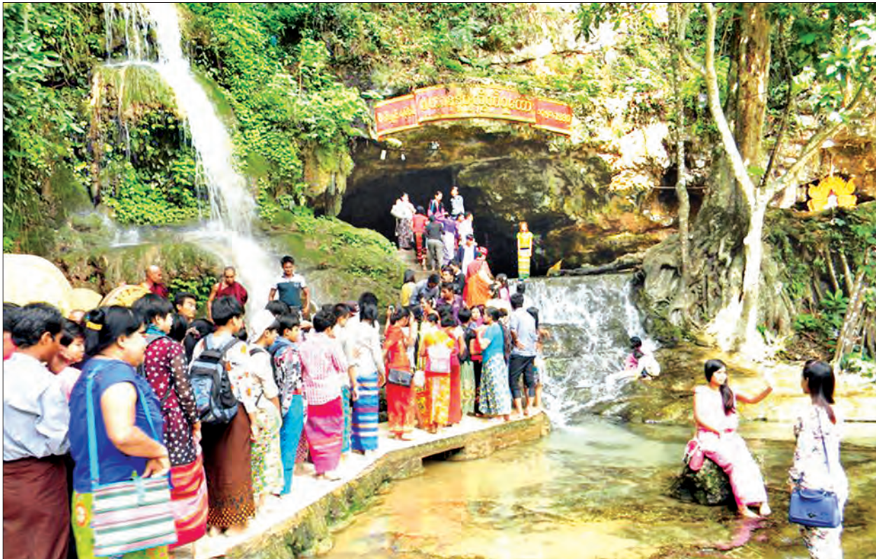
ပြင်ဦးလွင်ရှိ ပိတ်ချင်းမြောင်လိုဏ်ဂူကို လာရောက်လည်ပတ်သူများဖြင့် စည်ကားနေသည်ကို တွေ့ရစဉ်