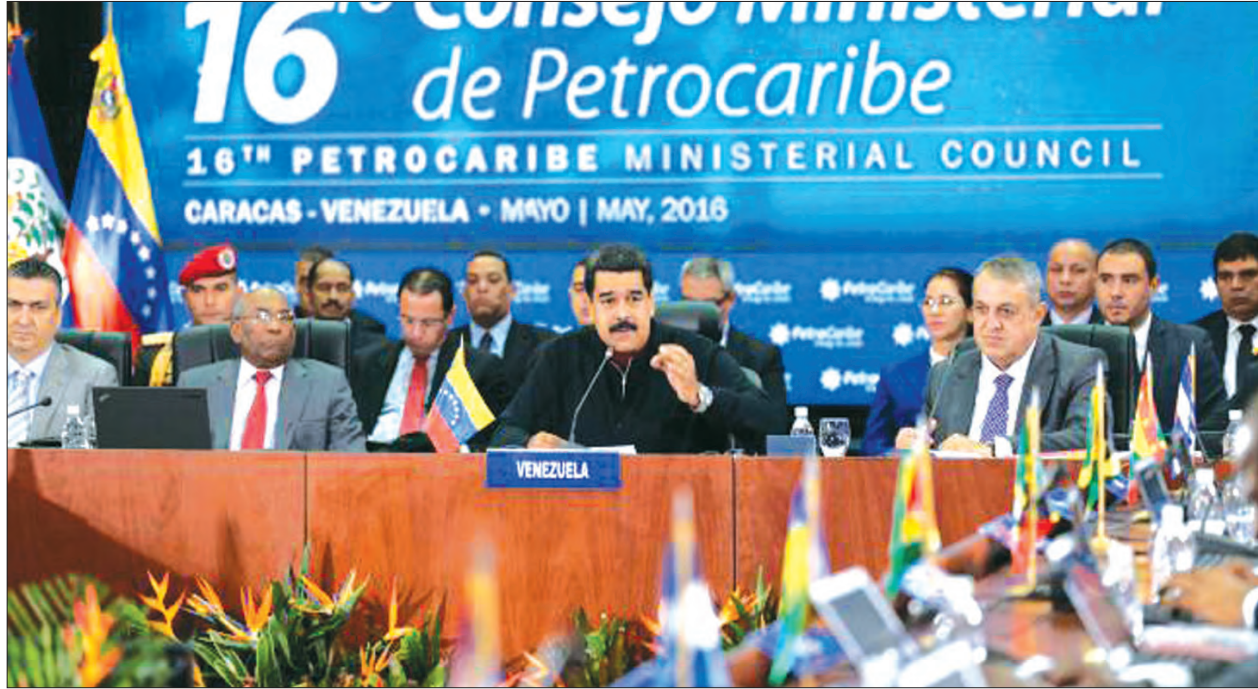
ပင်နီဇွဲလားသမ္မတ မာနူရီ မေ ၂၇ ရက်က (၁၆) ကြိမ်မြောက် ဝန်ကြီးအဆင့်ကောင်စီအစည်းအဝေး၌ ဆွေးနွေးပြောကြားစဉ်

ကရာကတ် မေ ၂၉ ပင်နီဇွဲလားအစိုးရ ထိပ်ပိုင်းခေါင်းဆောင်များနှင့် အတိုက်ခံအုပ်စုများက ၎င်းတို့သည် ခိုမိနီကန်သမ္မတနိုင်ငံ၌ ကြားဝင်စေ့စပ်ပေးသော အုပ်စုများနှင့်အတူ ပင်နီဇွဲလားနိုင်ငံအတွင်း လတ်တလော ပေါ်ပေါက်နေသော စီးပွားရေးအကျပ်အတည်းများ၊ နိုင်ငံရေးပဋိပက္ခများနှင့် ပတ်သက်၍ တွေ့ဆုံဆွေးနွေးခဲ့ကြကြောင်း ပြောသည်။ ရေနံဈေးကျဆင်းမှုနှင့် ဆိုရှယ်လစ်ပုံစံ စီးပွားရေးပြိုလဲပြီးနောက် အိုပက်အဖွဲ့ဝင်နိုင်ငံသည် စီးပွားရေး ကျဆင်းမှုများနှင့် ရင်ဆိုင်နေရသည်။ လွန်ခဲ့သောနှစ်က အတိုက်ခံအုပ်စုများသည် အဓိကနေရာများ၌ အောင်မြင်မှုများ ရရှိပြီးနောက် သမ္မတနိုင်ငံ၏ မက်ဒူရိုသည် နိုင်ငံတော်၏ ဥပဒေပြုအဖွဲ့နှင့် ဝေးကွာလာကာ မလုပ်သာမရများသာ ဖြစ်လာသည်။ အဖွဲ့နှစ်ဖွဲ့စလုံးဘက်မှ ၎င်းတို့သည် ယခင် စပိန်ဝန်ကြီးချုပ်ဟောင်း လူးဝစ် ရိုဒရီဂဲစ် ဇက်ပတာရို၊ ပနားမားသမ္မတဟောင်း မာတင်တိုရီဂျို၊ ခိုမိနီကန် သမ္မတနိုင်ငံမှလီယိုနယ် ဖာနန်ဒေတ်စ်တို့ နှင့် တွေ့ဆုံခဲ့သည်ဟု ပြောသည်။ သော