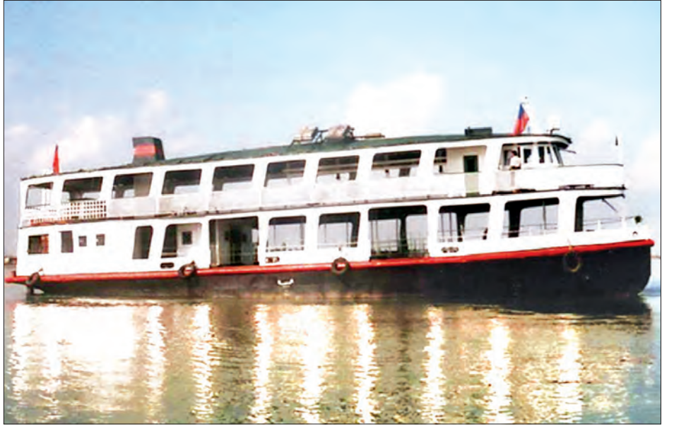
အိတ်ဖွင့်လေလံစနစ်ဖြင့် ရောင်းချသွားမည့် ရေယာဉ်တစ်စင်းကိုတွေ့ရစဉ်