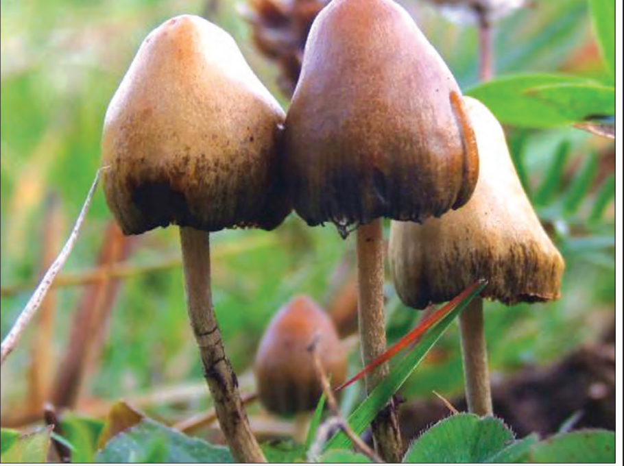
ဟော်လူးဆိုင်နီဂျဲနစ် (hallucinogenic) ဓာတ်ပစ္စည်းပါဝင်သည့် စားသုံးမှု