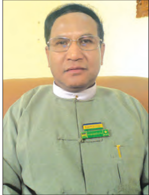
ဦးတင်မြင့် အမြဲတမ်းအတွင်းဝန် ပြည်ထဲရေးဝန်ကြီးဌာန