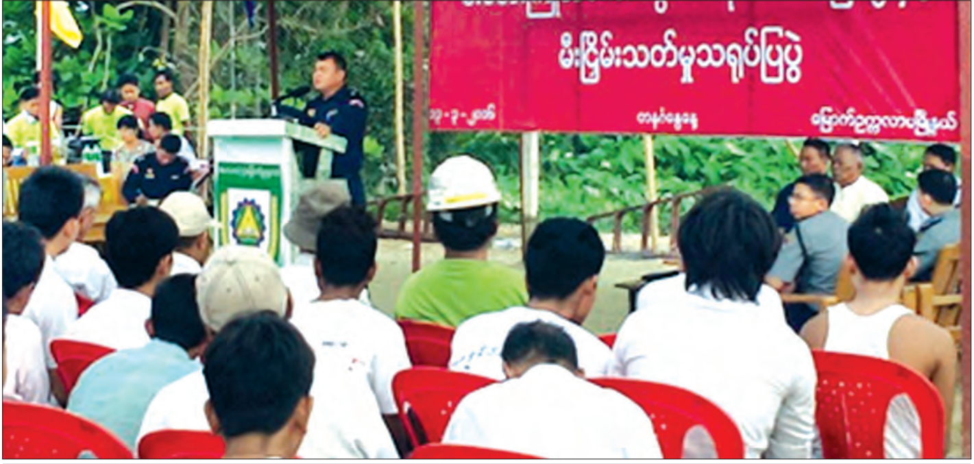
ပြည်သူများ မီးဘေးအန္တရာယ် အသိရှိစေရေးအတွက် အသိပညာပေးဟောပြောစဉ်

ပြည်သူ့ပဏ္ဍိတပြုဆောင်ရွက်မည့် ရက်ပေါင်း ၁၀၀ စီမံချက် ကို အကောင်အထည်ဖော်ရန် ကြိုတင်ပြင်ဆင်နေသည့် ဝန်ကြီး ဌာနများ၏ အစီအစဉ်နှင့် ပြောကြားချက်များသည် ပြည်သူများ အတွက် ဝမ်းမြောက်ဖွယ်ဖြစ်သည်။ မေလ ၁ ရက်နေ့ မှ ဩဂုတ် လဆန်းအထိ ဆောင်ရွက်မည့် ဝန်ကြီးဌာနများ၏ ရက် ၁၀၀ ဆောင်ရွက်ချက်များကိုမူ လက်တွေ့အကောင်အထည်ဖော်နိုင် ခြင်း ရှိ၊ မရှိ ပြည်သူများက စောင့်ကြည့်နေကြပေလိမ့်မည်။