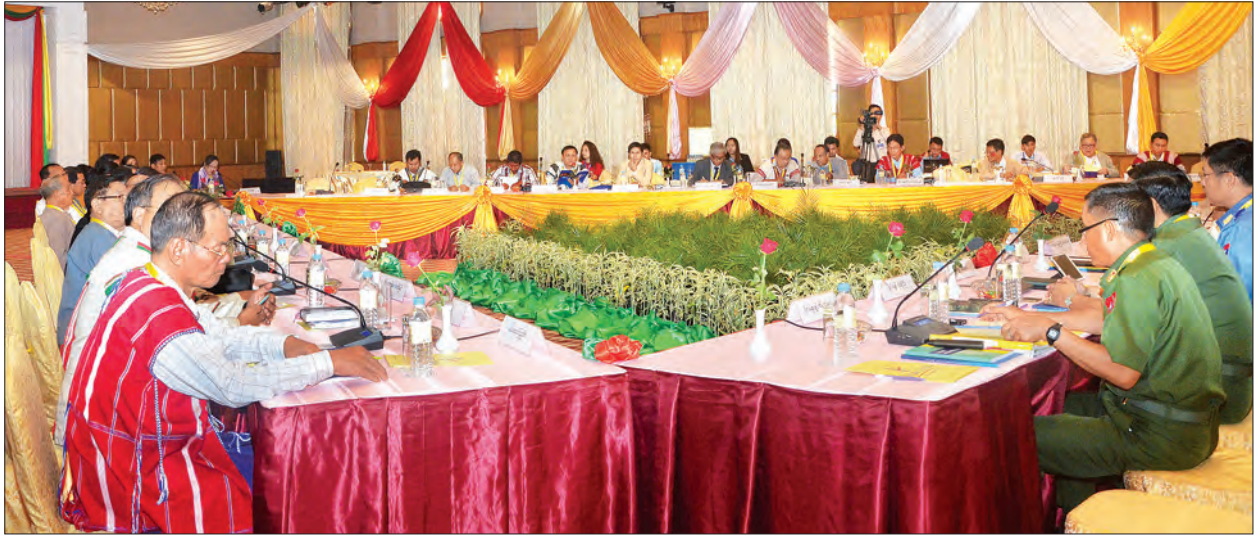
ပြည်ထောင်စု ငြိမ်းချမ်းရေးညီလာခံ (၂၁ ရာစုပင်လုံ) အကြံပြုဆင်ရေး ဆပ်ကော်မတီအစည်းအဝေးကျင်းပစဉ်

ဆိုခြင်းထက် ပူးပေါင်းဆောင်ရွက်ပြီး နိုင်ငံ၏ ငြိမ်းချမ်းရေးအတွက် ပူးပေါင်းအဖြေရှာပါက ငြိမ်းချမ်းရေးရရှိနိုင်မည်ဟု ယုံကြည်ပါကြောင်း ပြောကြားသည်။ ဒုတိယဗိုလ်ချုပ်ကြီး ရာပြည့်က NCA လက်မှတ်ထိုးခြင်းသည် တစ်ဖက်နှင့်တစ်ဖက် အကြိမ်များစွာ တွေ့ဆုံညှိနှိုင်းပြီး ယုံကြည်မှုတည်ဆောက်ထားသည့် သက်သေသားဖြစ်ပါကြောင်း ယုံကြည်မှုကို ပျောက်ကွယ်မသွားအောင် NCA အပေါ်တွင် မှတည်၍ ဆောင်ရွက်သွားရန် အားလုံးကလက်ခံထားပြီးဖြစ်ပါကြောင်း မိမိတို့ရှေးရှုနေသည့် ပန်းတိုင်သည် ထာဝရငြိမ်းချမ်းရေးရရှိရန်ဖြစ်ပါကြောင်း NCA စာချုပ်ကို အသေခံ့ ကိုင်ထားခြင်းမဟုတ်ပါကြောင်း ငြိမ်းချမ်းရေးအတွက်လိုအပ်ပါက တချို့နေရာများတွင် ပြောင်းခြင်း ပြင်ခြင်းများပြုလုပ်ခြင်းအားဖြင့် ငြိမ်းချမ်းရေးကိုပို၍ အထောက်အကူပြုသည်ဆိုပါက တိုင်းရင်းသားကိုယ်စားလှယ်များနှင့် နှစ်ဖက်ညှိနှိုင်းဆောင်ရွက်သွား၍ ရနိုင်ပါကြောင်း အဓိကက နှစ်ဖက်ယုံကြည်မှု တည်ဆောက်နိုင်ရန် အရေးကြီးပါကြောင်း NCA လက်မှတ်ထိုးခြင်းသည် နှစ်ဖက်ယုံကြည်မှု တည်ဆောက်ခြင်း