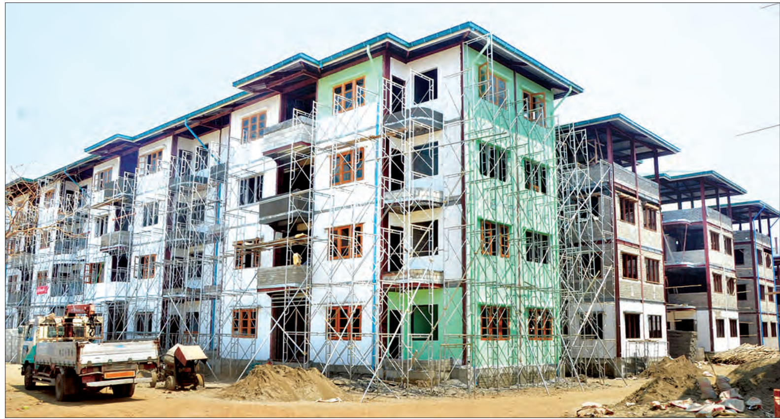
ရန်ကုန်မြို့ရှိ ဆောက်လက်စ တန်ဖိုးနည်းအိမ်ရာအဆောက်အအုံများကို တွေ့ရစဉ်