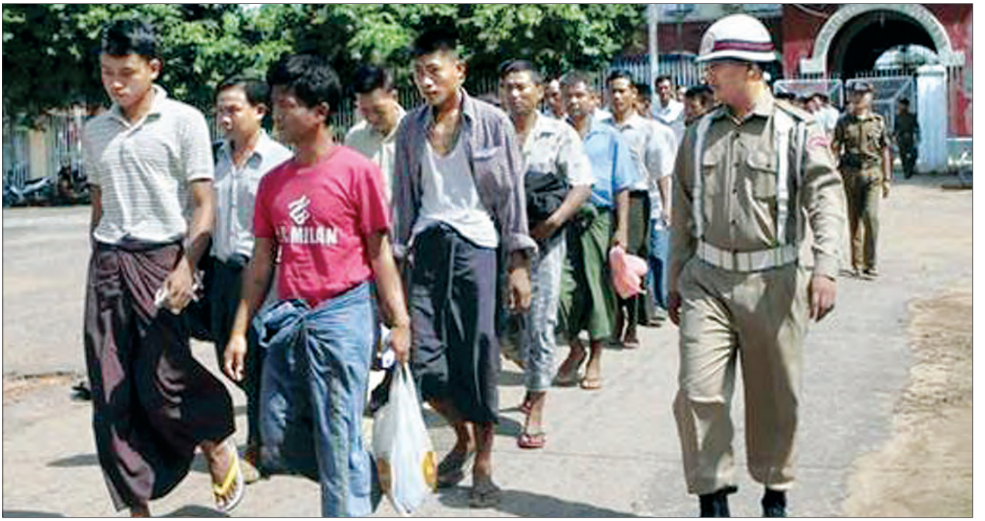
အကျဉ်းထောင်မှ ကျင့် (၄၀၁)အရ ပြန်လည်လွတ်မြောက်လာသူများကို တွေ့ရစဉ်

မီးသတ်မှုရေးလုပ်ငန်းတွေ စီမံဝင်ပျံ့နှံ့ဖို့ ရေဒီယို၊ ရုပ်မြင်သံကြား၊ သတင်းစာ၊ ဂျာနယ်၊ မဂ္ဂဇင်းတွေမှာ လှုံ့ဆော် ပညာပေးတာတွေ၊ ပညာပေးစာတမ်းနဲ့ လက်ကမ်းစာစောင် ဖြန့်ဝေပေးတာတွေ လုပ်နေတယ်။ နောက် မီးဘေးလုံခြုံရေး အသိပညာဖြန့်ဝေမှုမှာ အလယ်တန်းနဲ့အထက်တန်း ကျောင်းသား ကျောင်းသူတွေကို (School Based Fire Safety Education ) စနစ်ကျင့်သုံးပြီး မီးဘေးအန္တရာယ်