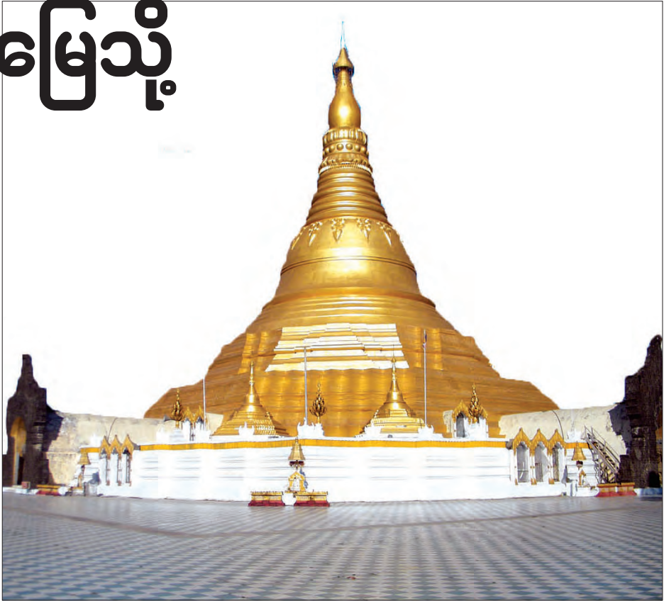
စစ်တွေမြို့ရှိ လောကနန္ဒာဘုရားကို ဖူးတွေ့ရစဉ်

ကမ်းခြေလမ်းအတိုင်း ကားကိုဖြည်းဖြည်းချင်းမောင်းနှင်လာခဲ့ရာ ရေပြင်ကိုမျက်နှာမူကာ ထိုင်ခုံအချို့ပြုလုပ်ထားသည်ကိုတွေ့ရသည်။ မော်တော်ယာဉ်ဖြင့် လာရောက်သူများ၊