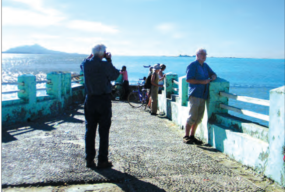
စစ်တွေမြို့ရှိ ဗျူးပွင့်ကမ်းခြေတွင် ကမ္ဘာလှည့်ခရီးသွားများ မှတ်တမ်းဓာတ်ပုံရိုက်ကူးနေစဉ်

လောကနန္ဒာဘုရားမှတစ်ဆင့် စစ်တွေလေဆိပ်သို့သွားရောက်လေ့လာခဲ့သည်။ ပြုပြင်မှုများ ပြုလုပ်ထားသဖြင့် စစ်တွေ