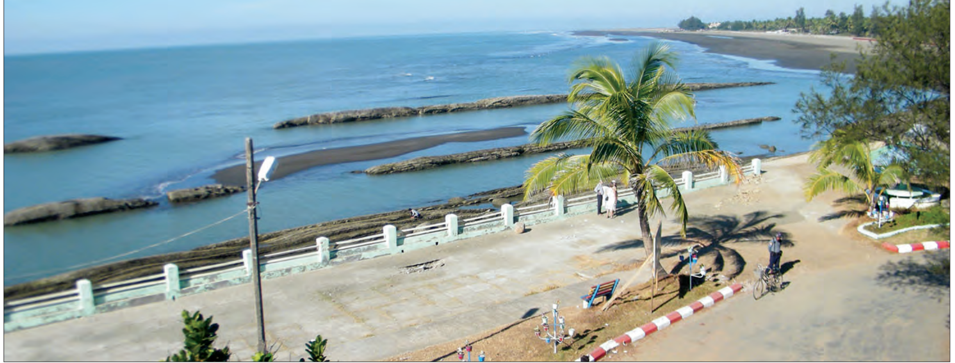
စစ်တွေမြို့ရှိ ဗျူးပွင့်အပန်းဖြေကမ်းခြေတစ်နေရာကို တွေ့ရစဉ်

မျှော်စင်ပေါ်မှ ဗျူးပွင့်ကမ်းခြေတစ်လျှောက်ကြည့်လိုက်ရာ အပေါ်စီးမှ လှပသောမြင်ကွင်းကို တစ်မူထူးခြားစွာ တွေ့မြင်ရသည်။ ဗျူးပွင့် အပန်းဖြေကမ်းခြေသည် စစ်တွေမြို့တွင် အထူးခြားဆုံးနှင့် ခရီးသွားဧည့်သည်များအတွက် ဆွဲဆောင်မှုအရှိဆုံးနေရာတစ်ခုပင်ဖြစ်