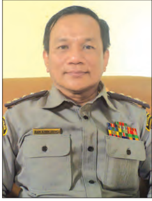
ရဲမှူးကြီး ဇော်ခင်အောင် ညွှန်ကြားရေးမှူး၊ မြန်မာနိုင်ငံရဲတပ်ဖွဲ့ဌာနချုပ်

မေ ၁၃ ရက်က မီးသတ်ဦးစီးဌာနသို့ လှူဒါန်းခံယူရန်အတွက် အပေါ့စားမီးသတ်စက်များလှူဒါန်း ရာ ပြည်ထဲရေးဝန်ကြီးဌာန ပြည်ထောင်စုဝန်ကြီး ဒုတိယဗိုလ်ချုပ်ကြီး ကျော်ဆွေ ကြည့်ရှုစဉ်