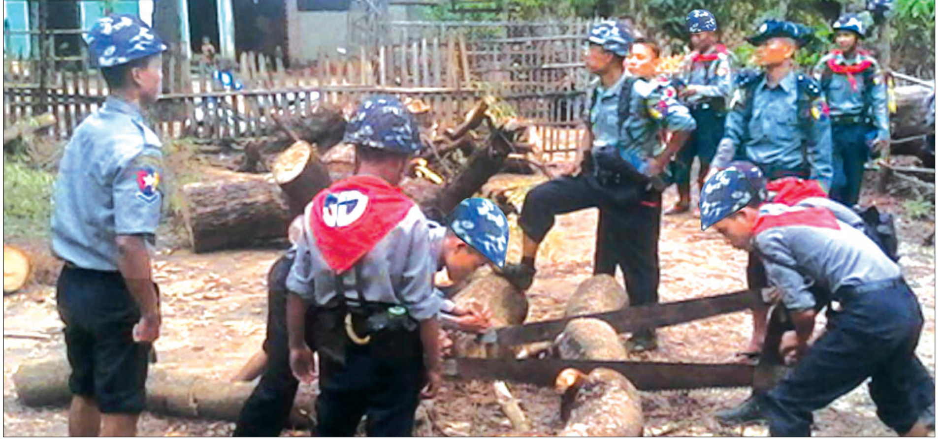
မကွေးတိုင်းဒေသကြီး၊ မင်းဘူးမြို့နယ် ကံသစ်ရွာတွင် ၂၁-၅-၂၀၁၆ ရက်နေ့က သဘာဝဘေးအန္တရာယ်ကြောင့် ပိတ်ဆို့နေသည့်လမ်းများကို အမှတ်(၂၅) လုံခြုံရေးရဲတပ်ဖွဲ့ ခွဲမှ တပ်ဖွဲ့ဝင်များက ရှင်းလင်းစဉ်