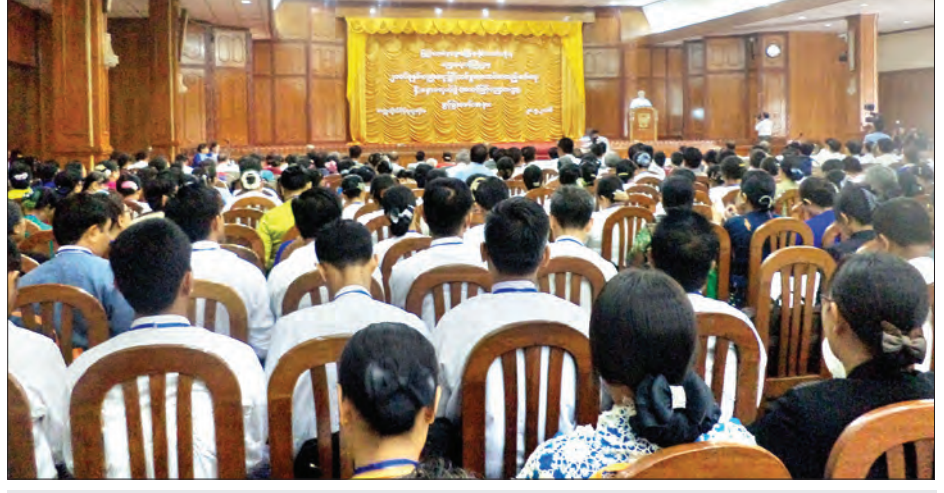
ပညာရေးဝန်ကြီးဌာန အမြဲတမ်းအတွင်းဝန် ဒေါက်တာစိုးဝင်းအမှာစကားပြောကြားနေစဉ်

သင်ယူမှုအခွင့်အလမ်း၊ ပညာအရည်အသွေး၊ ပညာရေးစနစ်၊ ပညာရေးစီမံခန့်ခွဲမှုစသော ကဏ္ဍစုံကို ဆောင်ရွက်ရာတွင် လက်ရှိအခြေအနေကို ပြည့်ပြည့်စုံစုံလွှမ်းမြဲနိုင်အောင် လေ့လာဆန်းစစ်ပြီး အားနည်းချက်၊ အားသာချက်များကို ပြုပြင်မွမ်းမံခြင်း ဖြည့်ဆည်းဆောင်ရွက်ပေးခြင်းဖြင့် ပညာရေးကဏ္ဍကို ပိုမိုအဆင့်မြှင့်တင် ဆောင်ရွက်ပေးနိုင်မည်ဖြစ်ကြောင်း ဆွေးနွေးပွဲမှ ထွက်ပေါ်လာသော ညှိနှိုင်းရရှိချက်များသည် အဆင့်မြင့်ပညာ ပြုပြင်ပြောင်းလဲရေးကို အထောက်အကူပြုနိုင်မည့် ရှေ့လုပ်ငန်းစဉ်များကို ဖော်ထုတ်ချမှတ်နိုင်မည်ဟု မျှော်လင့်ကြောင်းကို ၎င်းက ဆက်လက်ပြောကြားခဲ့သည်။