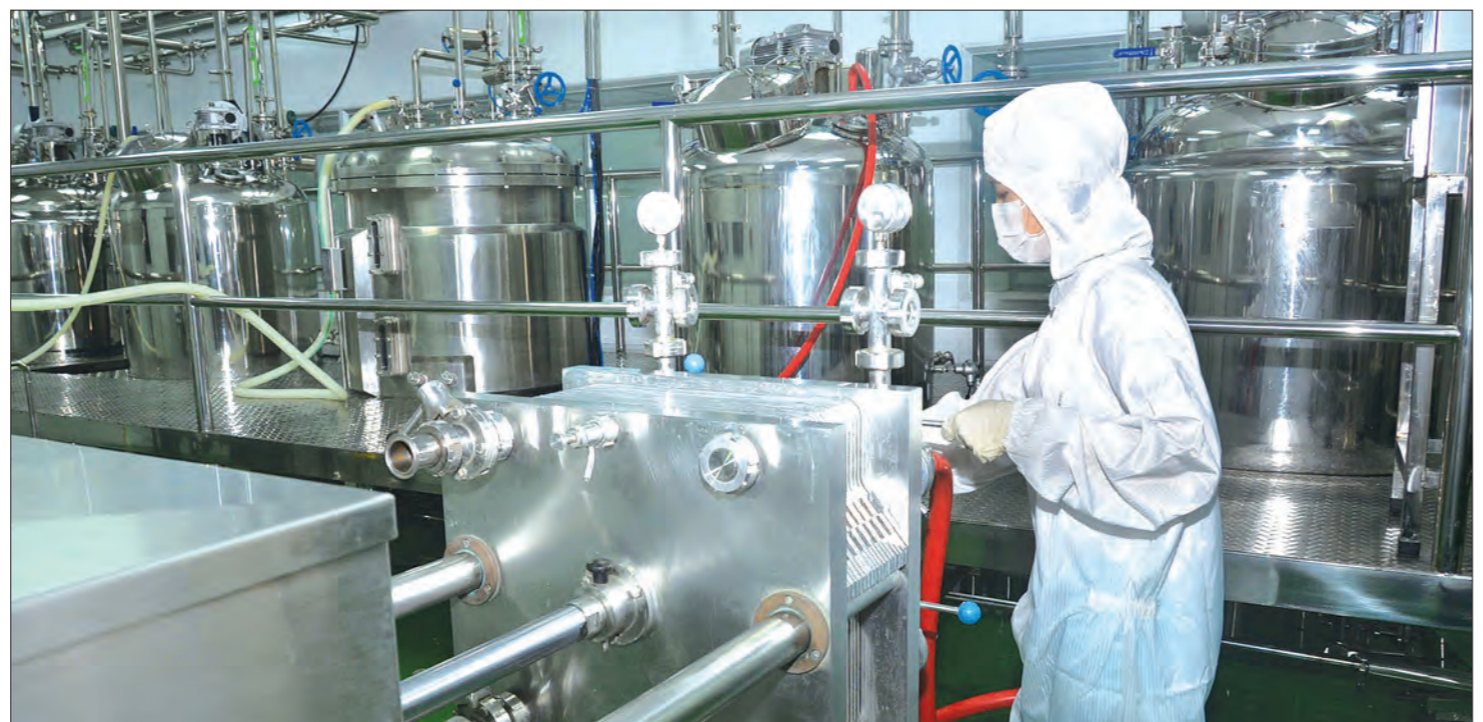
မြေဆိပ်ခြေဆေး အဆင့်ဆင့်ထုတ်ယူမှု

ပြည်သူ့အတွက် ပထမ ရက် ၁၀၀ “ပြောင်းလဲချိန်တန်ပြီ” ဟူသော ကြွေးကြော်သံနှင့်အတူ အပြောင်းအလဲကို မျှော်လင့်သော ပြည်သူများက အစိုးရသစ်တစ်ရပ်ကို ဒီမိုကရေစီနည်းကျ ရွေးချယ်တင်မြှောက်ခဲ့ကြသည်။ ပြည်သူက ရွေးချယ်တင်မြှောက်ခြင်းခံရသော ပြည်သူ့အစိုးရများ၏ တာဝန်မှာ ပြည်သူတို့၏ မျှော်လင့်ချက်နှင့် လိုအင်ဆန္ဒများကို ဖြည့်ဆည်းပေးရန် ဖြစ်သည်။ ယင်းအချက်သည် အစိုးရသစ် တိုင်းအတွက် စိန်ခေါ်မှုတစ်ခုလည်း ဖြစ်သည်။ အစိုးရသစ်သည် ယခင်အစိုးရ ဝန်ကြီးဌာနများကို လျော့တန်လျှော့၊ ပြင်တန်ပြင်၊ ပေါင်းတန်ပေါင်း စသည်ဖြင့် ပြုလုပ်ကာ ဝန်ကြီးဌာနများကို ကျယ်ကျယ် လျစ်လျစ်ဖွဲ့စည်း၍ အစရှိပြီးပြင်ပြောင်းလဲခဲ့သည်။ ပြည်သူက ကြည်ဖြူနေဆဲ အစိုးရသစ်၏ ပထမရက် ၁၀၀ အတွင်း ဆောင်ရွက်ချက်များသည် ယင်းအစိုးရ၏ အရည်အသွေးကို အကဲဖြတ်နိုင်သည့် စံတစ်ခုဖြစ်သည်။ မေ ၁ ရက်မှစတင်သည့် ရက် ၁၀၀ ကာလအတွင်း ဝန်ကြီးဌာနတစ်ခုချင်း အလိုက် ပြည်သူ့အကျိုးအတွက် ဆောင်ရွက်ကြမည့် လုပ်ငန်းများကို သတင်းရယူစုစည်းဖော်ပြ အပ်ပါသည်။