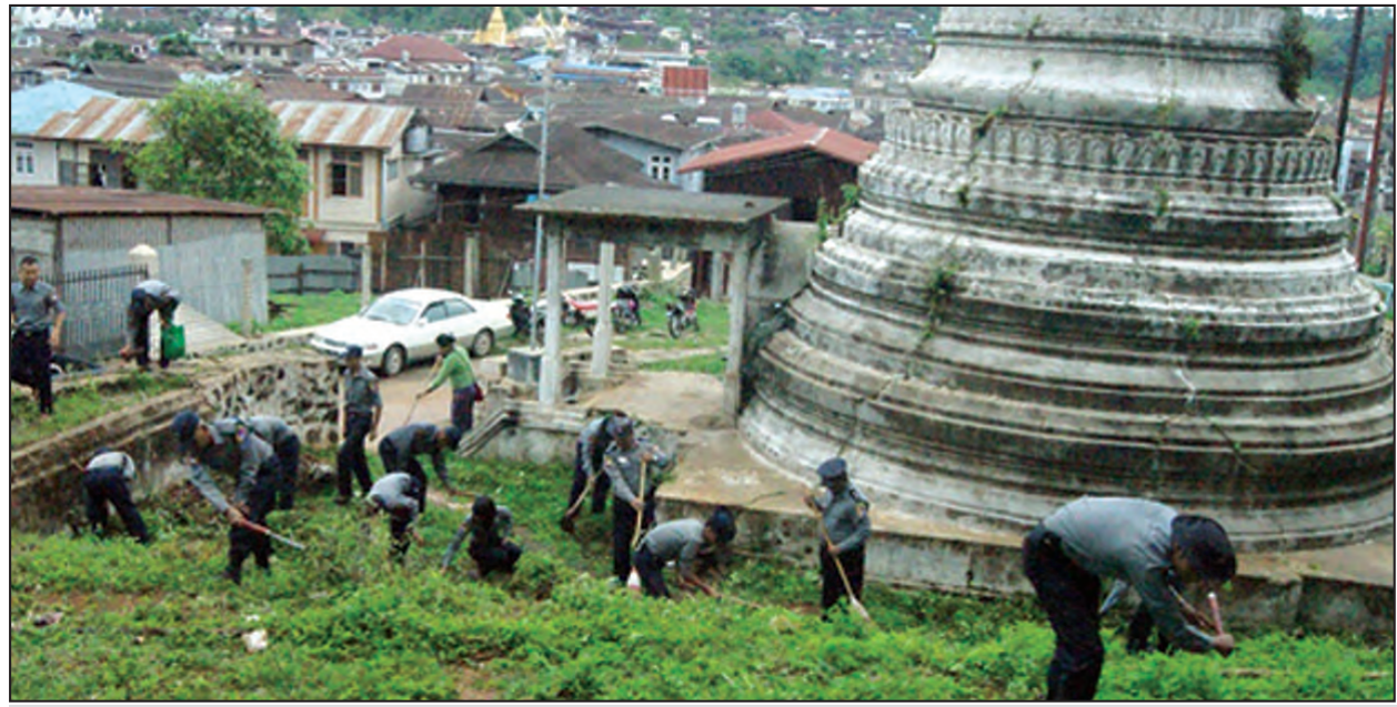
မိုးကုတ်မြို့၏ ကျက်သရေဆောင် ဘုရားတစ်ဆူဖြစ်သော ချမ်းသာကြီး ဘုရားတောင်တော်ဝန်းကျင် သန့်ရှင်းသာယာလှပရေးနှင့် ပြည်သူများ စိတ်အေးချမ်းစွာ ဘုရားဖူးနိုင်ကြရေးအတွက် မိုးကုတ်မြို့နယ် ရဲတပ်ဖွဲ့မှူးနှင့် မြို့မရဲစခန်းတို့မှ ရဲတပ်ဖွဲ့ဝင်များပူးပေါင်း၍ စုပေါင်းအမှုိုက်သိမ်းခြင်း၊ ချိုနွယ်များ ရှင်းလင်းခြင်းလုပ်ငန်းများကို မေ ၂၀ ရက်က ဆောင်ရွက်စဉ်။ နေဝါ(မိုးကုတ်)