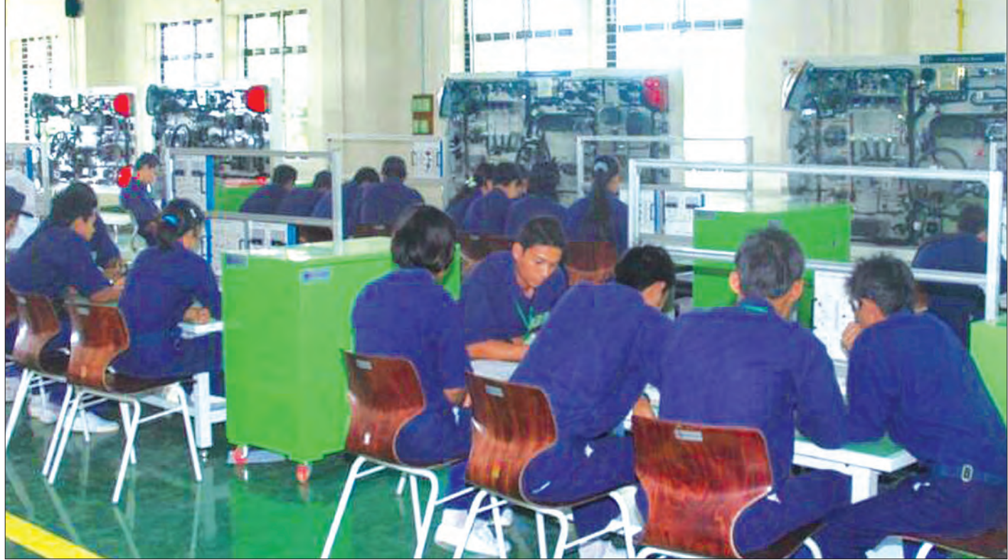
စက်မှုသင်တန်းကျောင်း၌ သင်တန်းသား၊ သင်တန်းသူများ စက်မှုနည်းပညာများ လက်တွေ့လေ့လာဆည်းပူးစဉ်။

လုပ်ငန်းတွေ ဖွံ့ဖြိုးတိုးတက်လာပြီး ကမ္ဘာ့ထုတ်လုပ်မှုကွင်းဆက် (Global Supply Chain) ကို ချိတ်ဆက်ဝင်ရောက်နိုင်ဖို့ ဆောင်ရွက်သွားရမှာ ဖြစ်ပါတယ်။ ဒါကတော့ ကာလရှည် စီမံကိန်းတွေအဖြစ် ချမှတ်ဆောင်ရွက်သွားရမှာ ဖြစ်ပါတယ်။ ဒီနေရာမှာ အရေးကြီးတဲ့အချက်ကတော့ စံချိန်စံညွှန်းနဲ့အညီ ထုတ်လုပ်နိုင်ရေးက အဓိကကျပါတယ်။ အရည်အသွေးပိုင်းကောင်းမွန်ဖို့လိုသလို ထုတ်လုပ်မှုနည်းစဉ်တွေဟာလည်း နိုင်ငံတကာ အသိအမှတ်ပြုနည်းစဉ်တွေနဲ့ ညီညွတ်ဖို့လိုပါတယ်။