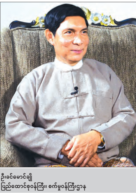
ဦးခင်မောင်ချို ပြည်ထောင်စုဝန်ကြီး၊ စက်မှုဝန်ကြီးဌာန