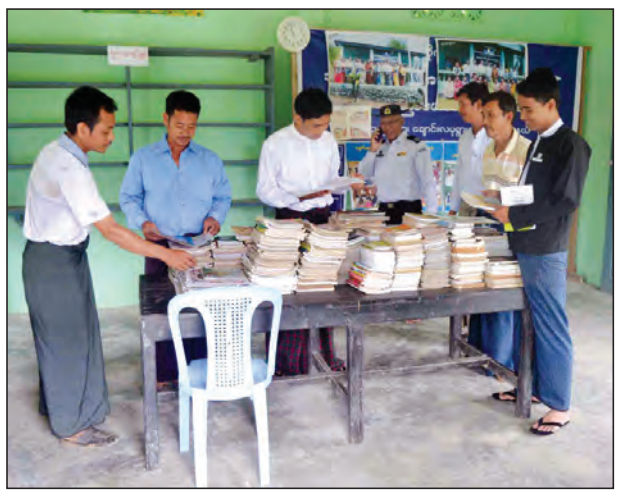
တနင်္သာရီတိုင်းဒေသကြီး တနင်္သာရီမြို့နယ်အတွင်း ကျေးရွာများမှ နိုင်ငံတော်ထောက်ပံ့ငွေဖြင့် ဆောက်လုပ်ခွင့်လွှဲထားသော စာကြည့်တိုက်များအနက် စာစတီသု နည်းပါးလျက်ရှိသော စာကြည့်တိုက်များ ပြန်လည်ရှင်သန်လာစေရန် မြို့နယ်စာကြည့်တိုက် ကြီးကြပ်မှုဧကယ်မတီဥက္ကဋ္ဌနှင့်အဖွဲ့ မေ ၂၂ ရက်က ကွင်းဆင်း ဆောင်ရွက်စဉ် နန်းသာရီ-ထိန်ဝင်း(ပြန်/ဆက်)

မော်လမြိုင် မေ ၂၄ မော်လမြိုင်မြို့နယ် ကျေးလက်ဒေသဖွံ့ဖြိုးတိုးတက်ရေးဦးစီးဌာနမှ ၂၀၁၆-၂၀၁၇ ဘဏ္ဍာရေးနှစ်တွင် မော်လမြိုင်မြို့နယ်အတွင်းရှိ ရေရှားပါးလျက်ရှိသော ညောင်ပင်ဆိပ်ရပ်ကွက်သို့ မေလ ဒုတိယပတ်က သောက်သုံးရေ ဂါလန် ၂၆၀၀ ခန့်ကို မြို့နယ်စည်ပင်သာယာရေးအဖွဲ့နှင့် မြို့နယ်ကျေးလက်ဒေသဖွံ့ဖြိုးတိုးတက်ရေးဦးစီးဌာနမှ ဝန်ထမ်းများ ပူးပေါင်းပြီး သောက်သုံးရေများကို ရေသယ်ယာဉ်များဖြင့် ဖြန့်ဝေပေးခဲ့ကြောင်း သိရသည်။ ဝေဝေ