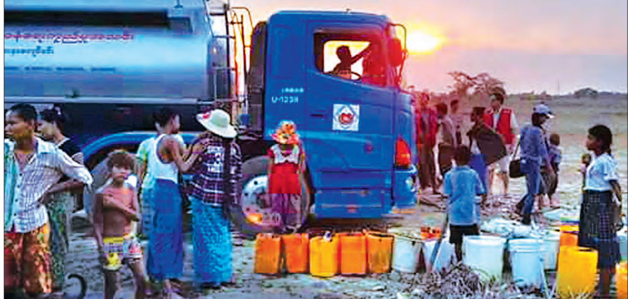
ရှင်သန်ရေးကူညီမှုအသင်းမှ သောက်ရေသုံးရေ လိုအပ်သည့်ဒေသများသို့ ရေသွားရောက်လှူဒါန်းစဉ်

တစ်ဖန် ၂၀၁၆ ခုနှစ် မေလ ၂၃ ရက်တွင် နိုင်ငံတော်၏ အတိုင်ပင်ခံပုဂ္ဂိုလ် ဒေါ်အောင်ဆန်းစုကြည်က ပရဟိတလုပ်ငန်းများနှင့်ဆက်စပ်၍ ပြည်သူ့သို့ ကျေးဇူးတင်လွှာထုတ်ပြန်ရာတွင် ယခုနှစ် မေလအတွက် ချီးကျူးဂုဏ်ပြုထိုက်သူအဖြစ် “ရှင်သန်ရေးကူညီမှုအသင်း” အား ရွေးချယ်ထုတ်ပြန်လိုက်ခြင်းသည် မြန်မာနိုင်ငံရှိ ပရဟိတလောကနှင့် ပရဟိတလောကသားတို့အတွက် အံ့အားသင့်စရာ ထုတ်ပြန်လွှာတစ်ရပ်ဖြစ်သွားသကဲ့သို့ အစိုးရသစ်က မြန်မာနိုင်ငံ၏ အနာဂတ်ပရဟိတလုပ်ငန်းများနှင့် ပရဟိတအသင်းများအတွက် ပိုမိုအသိအမှတ်ပြု လမ်းဖွင့်ပေးရာရောက်စေခဲ့ကြောင်း သုံးသပ်တင်ပြလိုက်ရပါသည်။ ။