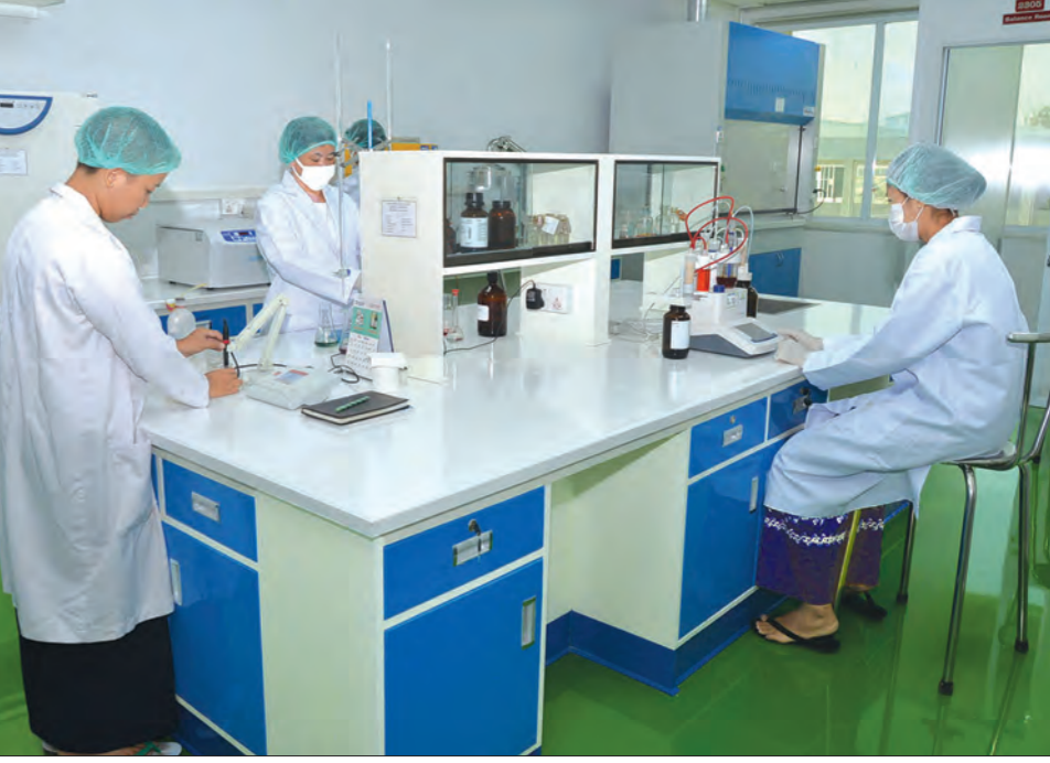
မြေဆိပ်ခြေဆေး ထုတ်ရန် ဓာတ်ခွဲခန်းသစ်နေရာ

မြန်မာနိုင်ငံရဲ့ ထုတ်ကုန်တွေ ပြည့်ပစေရန်ကို ထိုးဖောက်ဖို့၊ ပြည်တွင်းစက်မှုလုပ်ငန်းတွေမှာ အားနည်းချက်တွေ၊ အခက်အခဲနဲ့ စိန်ခေါ်မှုများစွာရှိပါတယ်။ ဒါတွေကို သေသေချာချာ လေ့လာ ဆန်းစစ်အခြေရာပြီးဖြေရှင်းသွားဖို့ လိုပါတယ်။ ကျွန်တော်တို့ အတော်ကို အားနည်းနေပေသော်လည်း အတွေ့ကို ဆောင်ရွက်သွား ရမှာပါ။ စက်မှုဝန်ကြီးဌာနက ဆေးဝါးစက်ရုံတွေအနေနဲ့ကတော့ GMP (Good Manufacturing Practice) နဲ့အညီထုတ်လုပ် ပြီး ပြည်ပဈေးကွက်ရရှိနိုင်ရေးကို ကြိုးစားဆောင်ရွက်လျက် ရှိပါတယ်။