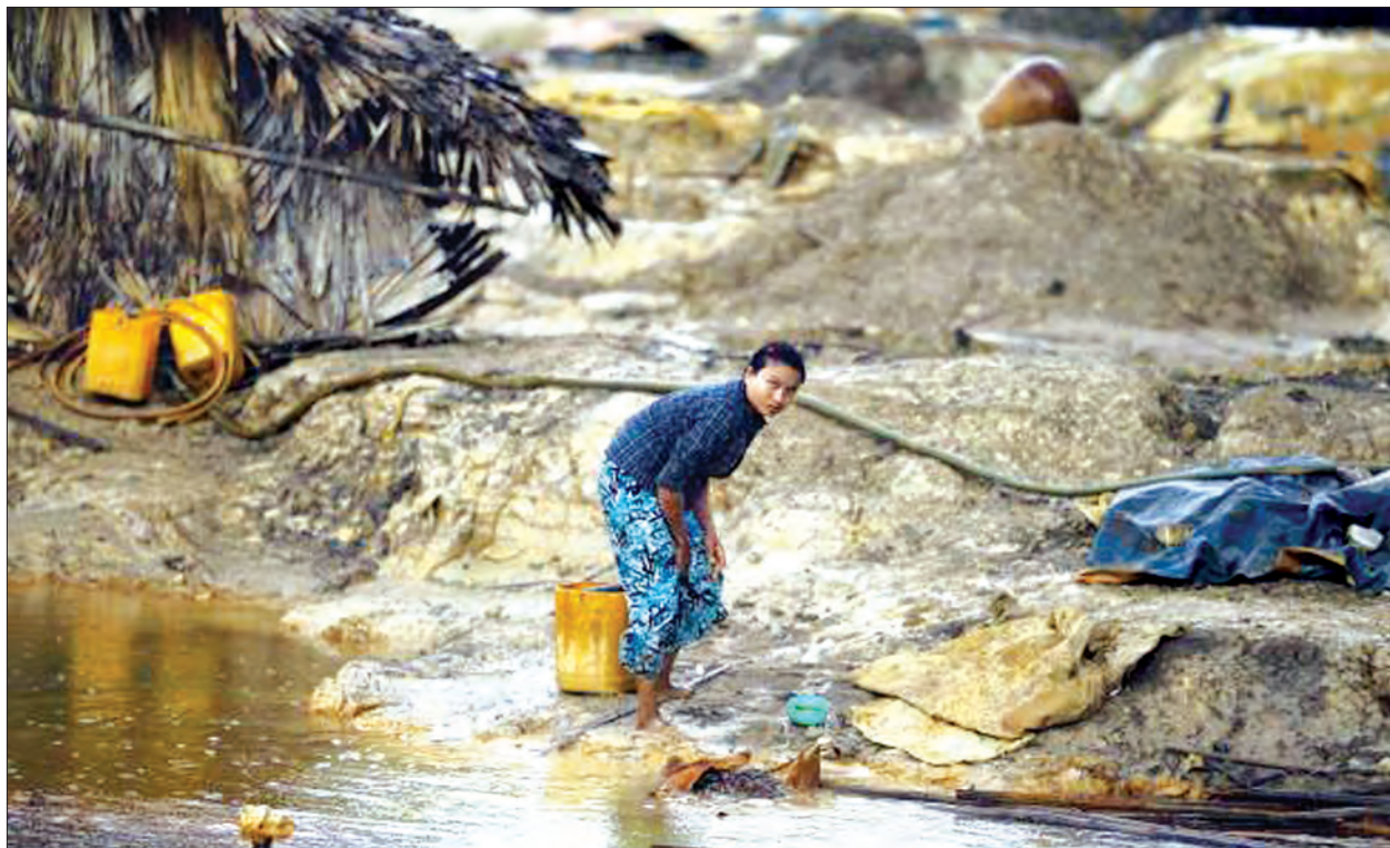
ကြေးစင်တောင် ကြေးနီစီမံကိန်းအနီးမှ စွန့်ပစ်ရေများ။