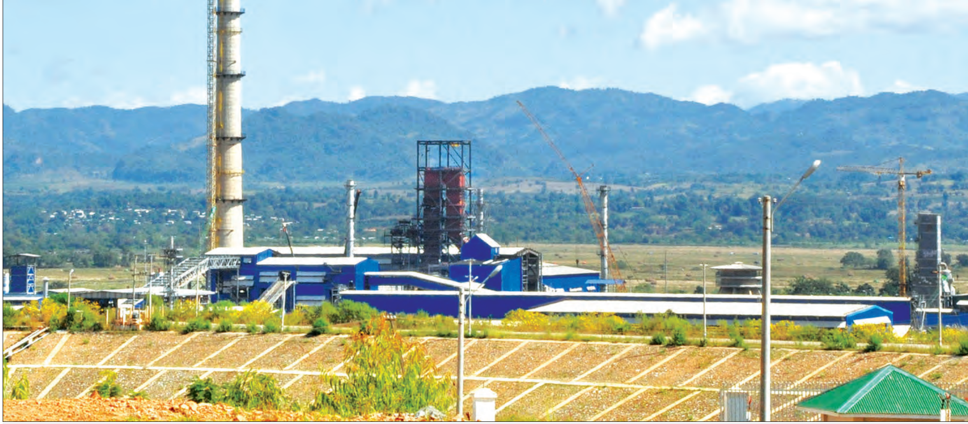
အမှတ် (၂) သံမဏိစက်ရုံ (ပင်းပက်)

အပြည်ပြည်ဆိုင်ရာ စီးပွားရေးလုပ်ငန်းကြီးတွေကလည်း ဒေသတွင်းနိုင်ငံ အသီးသီးရဲ့ ပင်ကိုယ်အားသာချက်ကို အသုံးပြုပြီး နိုင်ငံခြားကုန်ထုတ်လုပ်မှုကွင်းဆက်ပုံစံနဲ့ တစ်နိုင်ငံရဲ့ ထုတ်ကုန်ပစ္စည်းအစိတ်အပိုင်းနဲ့ အခြားနိုင်ငံကထုတ်တဲ့ ပစ္စည်းအစိတ်အပိုင်းတွေကို တတိယနိုင်ငံမှာ တပ်ဆင်တဲ့ ပုံစံမျိုးနဲ့ ဆောင်ရွက်လာကြပြီဖြစ်ပါတယ်။ ဒါကြောင့် ဒီလို ထုတ်လုပ်မှု ကွင်းဆက်မှာ စက်မှုလုပ်ငန်းတွေက ချိတ်ဆက်ပါဝင်နိုင်အောင် ကြိုးစားရမှာဖြစ်ပါတယ်။ အရည်အသွေး စံချိန်စံညွှန်းနဲ့ သုတေသနလုပ်ငန်းတွေဟာ အရေးကြီးတဲ့ အတွက် ဒီကိစ္စတွေကို အလေးထားဆောင်ရွက်သွားမှာပါ။ မူဝါဒတွေ၊ စည်းမျဉ်းလုပ်ထုံးလုပ်နည်းတွေ၊ အခွန်အကောက်ဆိုင်ရာတွေကိုလည်း Review ပြန်လည်ပြုလုပ်ပြီး သက်ဆိုင်ရာ ဝန်ကြီးဌာနအချင်းချင်း အချိတ်အဆက်မိမိ ညှိနှိုင်းဆောင်ရွက် သွားမှာဖြစ်ပါတယ်။