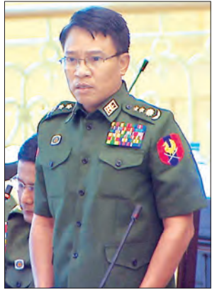
တပ်မတော်သား လွှတ်တော်ကိုယ်စား လှယ် ဝိုလ်မျိုးကြီး လှဝင်းအောင် ဆွေးနွေးစဉ်

ပါကြောင်း ဆွေးနွေးသည်။ ထို့ပြင် ဒုတိယအကြိမ် ပြင်ဆင်သည့် ရုပ်ကျေး ဥပဒေကြမ်းနှင့်စပ်လျဉ်း၍ လွှတ်တော် ကိုယ်စားလှယ် ငါးဦးက ယနေ့အစည်း အဝေးတွင် ဆက်လက်ဆွေးနွေးခဲ့ကြပြီး ဆွေးနွေးချက်များအပေါ် ပြန်လည် ကြားနာဆောင်ရွက်ရန် ဥက္ကဋ္ဌ မန်ဝင်း ခိုင်သန်းက အမျိုးသားလွှတ်တော်ဥပဒေ ကြမ်းကော်မတီကို တာဝန်ပေးအပ်လိုက် သည်။