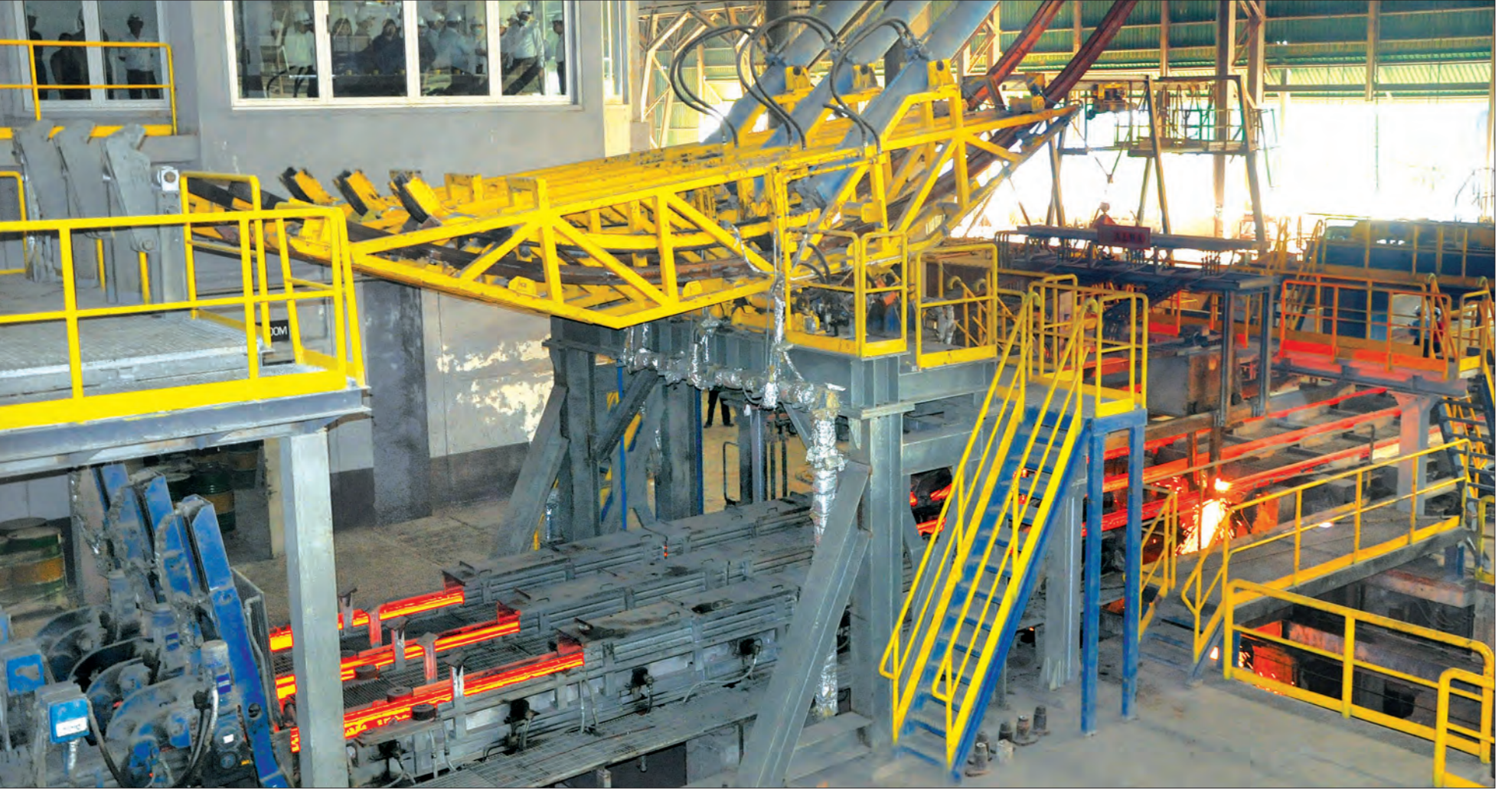
ပင်းပက်စက်ရုံမှ သံမဏိထုတ်လုပ်မှုအဆင့်ဆင့်ကို တွေ့ရမည်။

စက်မှုဝန်ကြီးဌာနသည် ရက်ပေါင်း ၁၀၀ အတွင်း စက်ရုံ စက်ရုံအလုပ်ရုံများ ဖွင့်လှစ်ရေး၊ စက်မှုကဏ္ဍနှင့် လူ့စွမ်းအား အရင်းအမြစ်ဖွံ့ဖြိုးတိုးတက်ရေး၊ အလုပ်အကိုင်အခွင့်အလမ်းများ တိုးတက်ရရှိရေး၊ စွမ်းအင်ချွေတာရေးနှင့် သဘာဝပတ်ဝန်းကျင်ထိန်းသိမ်းရေး၊ စက်ရုံစီမံကိန်းများတွင်ရှိသည့် အလုပ်ရုံ များကို အပိုင်းလိုက် အပြီးသတ်အောင် ဆောင်ရွက်ရေးတို့ကို ဖော်ဆောင်သွားမည် ဒီငါးနှစ်ကာလမှာ အသေးစားနဲ့အလတ်စားစက်မှုလုပ်ငန်းတွေ ဖွံ့ဖြိုး တိုးတက်ဖို့၊ တန်ဖိုးမြှင့် Value-added ထုတ်ကုန်တွေ ပိုမိုထုတ် လုပ်နိုင်ဖို့၊ အလားအလာရှိတဲ့ စက်မှုလုပ်ငန်းတွေကနေ ပြည်ပပိုကုန်တင်ပို့နိုင်ဖို့ နဲ့စက်မှု လုပ်ငန်းတွေကနေ သဘာဝပတ်ဝန်းကျင်ထိခိုက်ခြင်းမရှိအောင် အလေးထား ဆောင်ရွက်သွားမယ်။ စက်မှုလုပ်ငန်းတွေ ဖွံ့ဖြိုးတိုးတက်လာတာနဲ့အညီ အလုပ်အကိုင်အခွင့်အလမ်းတွေ ပိုမိုလာမှာ ဖြစ်ပါတယ်။