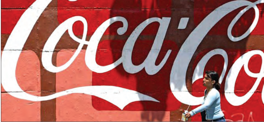
ကရာကတ် မေ ၂၄ ပင်နီဇွဲလားနိုင်ငံ၌ အစားအစာနှင့် စွမ်းအင်ပြတ်တောက်မှုများမြင့်တက်နေချိန်တွင် သကြား ပြတ်လပ်မှုသည်ကိုကာကိုလာထုတ်လုပ်မှုကိုရပ်တန့်ရန်ဖိအားတစ်ရပ်ဖြစ်လာသည်။

ပင်နီဇွဲလားတွင် ကုန်ကြမ်းပြတ်တောက်မှုကြောင့် ကိုကာကိုလာထုတ်လုပ်မှုကို ယာယီ ရပ်တန့် ရလိမ့်မည်ဟု တာဝန်ရှိသူများက ပြောသည်။ နိုင်ငံ၏အကြီးဆုံး အဖျော်ယမကာကုမ္ပဏီဖြစ်သည့် အမ်ပရီဆာပိုလာကုမ္ပဏီက ဘာလီစပရတ်တောက်မှုကြောင့် လုပ်ငန်းရပ်ဆိုင်းလိုက်ပြီးနောက် ကိုကာကိုလာထုတ်လုပ်မှုကို ရပ်ဆိုင်းရ တော့မည် သတင်းထွက်ပေါ်လာခြင်းဖြစ်သည်။