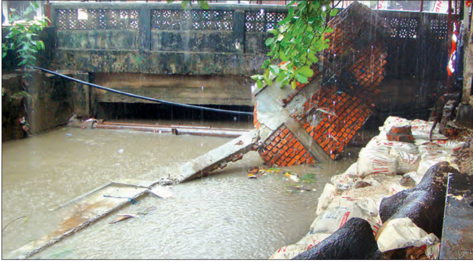
မေ ၂၃ ရက်က ထပ်မံပြုကျသောနေရာကို တွေ့ရစဉ်

စမ်းချောင်းမြို့နယ် အောင်ချမ်းသာရပ်ကွက်နှင့် စမ်းချောင်း (တောင်) ရပ်ကွက်အကြားရှိ အောင်ချမ်းသာရေနုတ်မြောင်းကြီးမှာ မေ ၂၂ ရက် မွန်းလွဲ ၂ နာရီခန့်က အလယ်မြောင်းကူးတံတား အနီးမှ ပေ ၂၀၀ ခန့် ပြိုကျခဲ့ပြီး မေ ၂၃ ရက်ညနေ ၅ နာရီကျော် ခန့်တွင် ဗဟိုလမ်းဘက်ခြမ်းအနီးမှ ပေ ၁၅၀ ခန့် ထပ်မံပြုကျမှု ဖြစ်ခဲ့သည်။