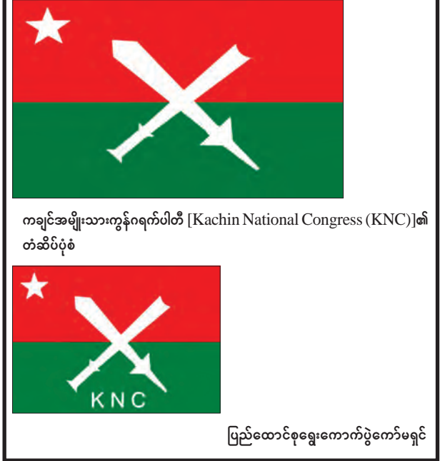
ကချင်အမျိုးသားကွန်ဂရက်ပါတီ [Kachin National Congress (KNC)]၏ တံဆိပ်ပုံစံ

၁။ နိုင်ငံရေးပါတီများ မှတ်ပုံတင်ခြင်းဥပဒေ ပုဒ်မ ၉ အရ နိုင်ငံရေးပါတီအဖြစ် မှတ်ပုံတင်ခွင့်ပြုထားပြီးဖြစ်သည့် ကချင်ပြည်နယ်၊ မြစ်ကြီးနားမြို့၊ ဒုကထောင် ရပ်ကွက်၊ အမှတ်(၆၉)တွင် ပါတီရုံးချုပ်တည်ရှိသော ကချင်အမျိုးသားများ ဒီမိုကရေစီကွန်ဂရက်ပါတီသည် ယင်းတို့၏ ပါတီအမည်အား ကချင်အမျိုးသား ကွန်ဂရက်ပါတီ [Kachin National Congress (KNC)] ဟု အမည်ပြောင်းလဲ ခွင့်ပြုပါရန်နှင့် ပါတီအလံနှင့်တံဆိပ်ကိုလည်း ဖော်ပြပါအတိုင်း ပြောင်းလဲအသုံးပြု မည်ဖြစ်ကြောင်း ပြည်ထောင်စုရွေးကောက်ပွဲကော်မရှင်သို့ တင်ပြလာပါသည်။ ၂။ ယင်းသို့ တင်ပြလျှောက်ထားလာသည့် ကချင်အမျိုးသားကွန်ဂရက်ပါတီ [Kachin National Congress (KNC)] ဟူသည့် အမည်နှင့် ယင်းအဖွဲ့ အစည်းက အသုံးပြုမည့် ပါတီအလံနှင့် တံဆိပ်တို့ကို ကန့်ကွက်လိုက် ယခု ကြေညာသည့်နေ့မှစ၍ (၇)ရက်အတွင်း ခိုင်လုံသောအထောက်အထားများဖြင့် ပြည်ထောင်စုရွေးကောက်ပွဲကော်မရှင်သို့ လာရောက်ကန့်ကွက်နိုင်ပါကြောင်း၊ နိုင်ငံရေးပါတီများ မှတ်ပုံတင်ခြင်းနည်းဥပဒေ ၁၄(ဃ)အရ အများသိစေရန် ကြေညာအပ်ပါသည်။ ကချင်အမျိုးသားကွန်ဂရက်ပါတီ [Kachin National Congress (KNC)]၏ အလံပုံစံ