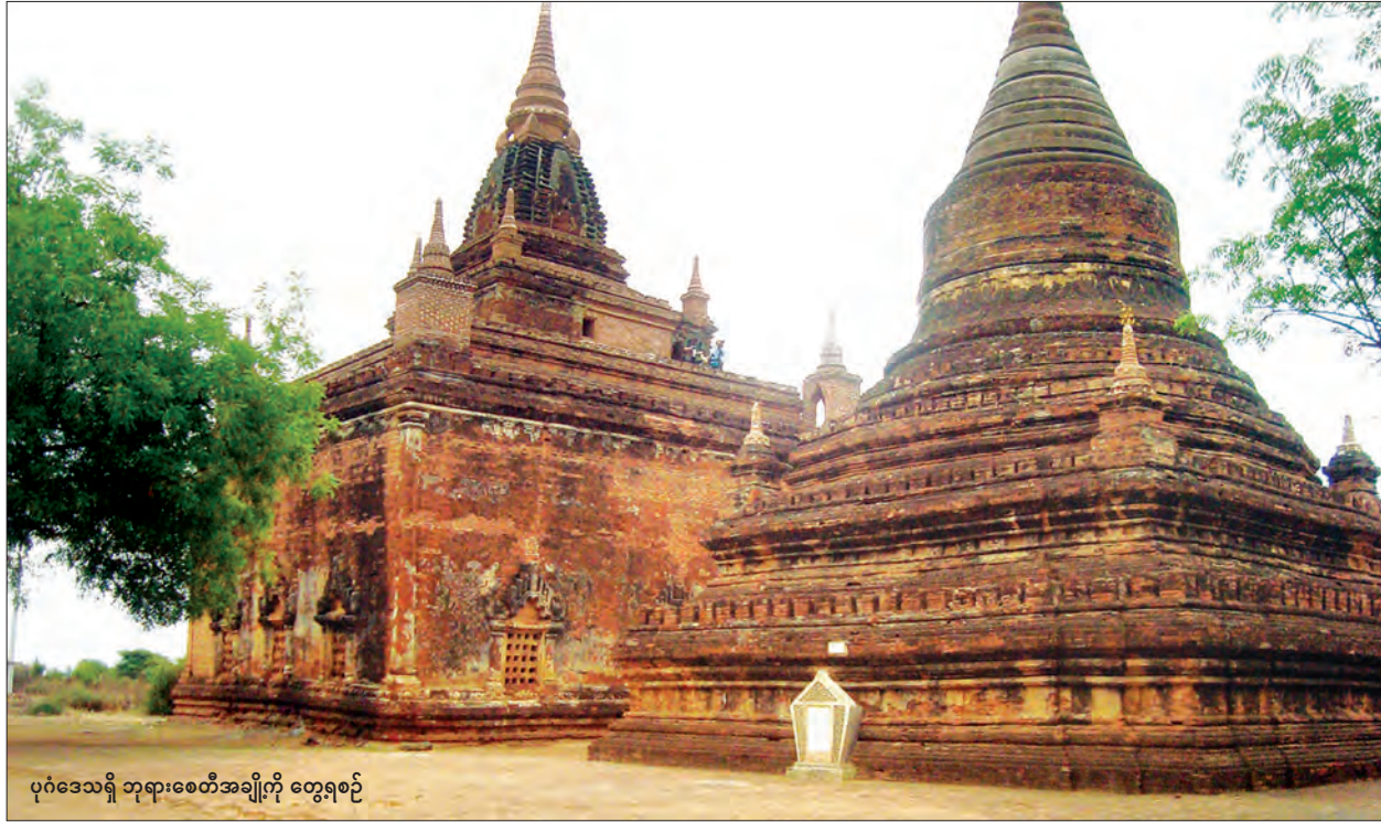
ပုဂံဒေသရှိ ဘုရားစေတီအချို့ကို တွေ့ရစဉ်

ပုဂံသည် အနော်ရထာမင်းကြီးတည်ထောင်ခဲ့သော ပထမမြန်မာနိုင်ငံတော် ဖြစ်သည်။ ပုဂံတွင် မင်း ၅၅ ဆက်အုပ်စိုးခဲ့သည်။ ပုဂံမင်း ၅၅ ဆက်တွင် ဘုရားစေတီ ပုထိုးများ တည်ထားကိုးကွယ်ခဲ့ရာ ပုဂံခေတ်က ဘုရားစေတီ ၅၀၀၀ ကျော်ခန့်ရှိခဲ့ သည်။