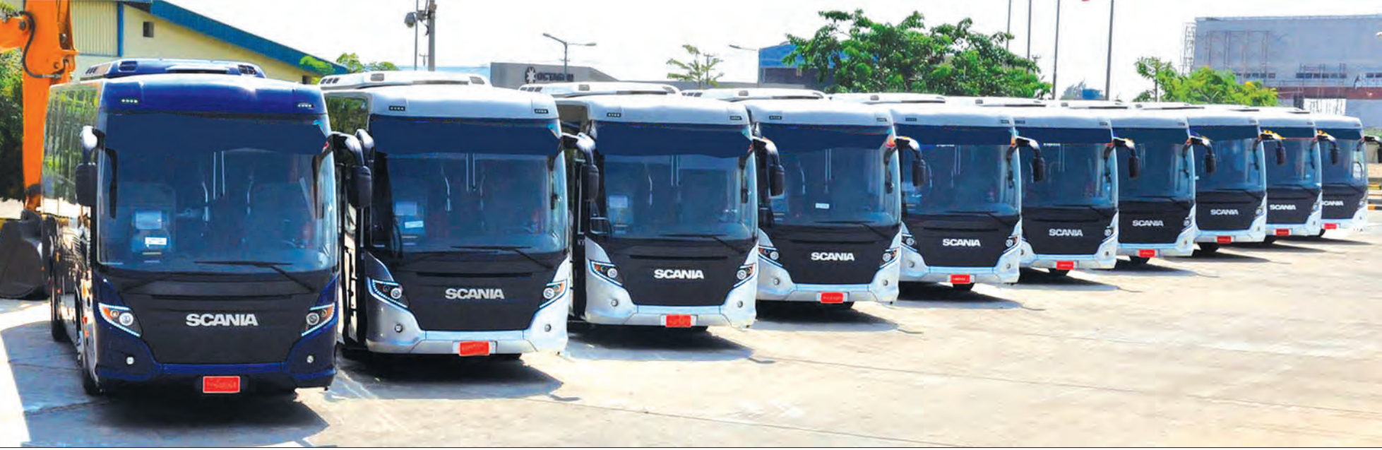
ပြည်တွင်းမှ စရီးသည်ပို့ဆောင်ရေးလုပ်ငန်း အဆင်ပြေစေရန် ပြည်ပမှ တင်သွင်းလာသည့် စရီးသည်တင်ယာဉ်များ ဓာတ်ပုံ-တန်ဖိုး (မြန်မာ့အလင်း)

ပြည်သူ့အတွက် ပထမ ရက် ၁၀၀ “ပြောင်းလဲချိန်တန်ပြီ” ဟုသော ကြွေးကြော်သံနှင့်အတူ အပြောင်းအလဲကို မျှော်လင့်သော ပြည်သူများက အစိုးရသစ်တစ်ရပ်ကို ဒီမိုကရေစီနည်းကျ ရွေးချယ်တင်မြှောက်ခဲ့ကြသည်။ ပြည်သူက ရွေးချယ်တင်မြှောက်ခြင်းခံရသော ပြည်သူ့အစိုးရများ၏ တာဝန်မှာ ပြည်သူတို့၏ မျှော်လင့်ချက်နှင့် လိုအင်ဆန္ဒများကို ဖြည့်ဆည်းပေးရန် ဖြစ်သည်။ ယင်းအချက်သည် အစိုးရသစ် တိုင်းအတွက် စိန်ခေါ်မှုတစ်ခုလည်း ဖြစ်သည်။ အစိုးရသစ်သည် ယခင်အစိုးရ ဝန်ကြီးဌာနများကို လျှော့တန်လျှော့၊ ပြင်တန်ပြင်၊ ပေါင်းတန်ပေါင်း စသည်ဖြင့် ပြုလုပ်ကာ ဝန်ကြီးဌာနများကို ကျစ်ကျစ် လျစ်လျစ် စည်း၍ အစပျိုးပြုပြင်ပြောင်းလဲခဲ့သည်။ ပြည်သူက ကြည်ဖြူနေဆဲ အစိုးရသစ်၏ ပထမရက် ၁၀၀ အတွင်း ဆောင်ရွက်ချက်များသည် ယင်းအစိုးရ၏ အရည်အသွေးကို အကဲဖြတ်နိုင်သည့် စံတစ်ခုဖြစ်သည်။ မေ ၁ ရက်မှစတင်သည့် ရက် ၁၀၀ ကာလအတွင်း ဝန်ကြီးဌာနတစ်ခုချင်းအလိုက် ပြည်သူ့အကျိုးအတွက် ဆောင်ရွက်ကြမည့် လုပ်ငန်းများကို သတင်းရယူ စုစည်းဖော်ပြအပ်ပါသည်။