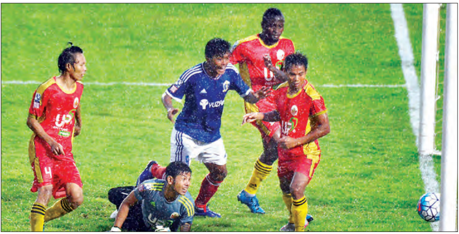
Southern အတွက် ဒုတိယဂိုးကို ရန်နိုင်ငံထွေး သွင်းယူလိုက်စဉ်