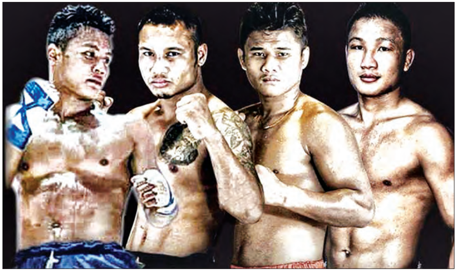
မြန်မာပြည်ရဲ့ ပထမတန်းရိုးရာလက်ဝှေ့လောကရဲ့ ကျားလေးဦး

အဆိုပါ လက်ဝှေ့ပြိုင်ပွဲတွင် မြန်မာ့ ရိုးရာလက်ဝှေ့လောက၏ နောင်အနာဂတ် အလွတ်တန်း ချန်ပီယံဖြစ်လာမည့် ပထမ တန်း စာမျက်နှာ ၃ ကော်လံ ၃