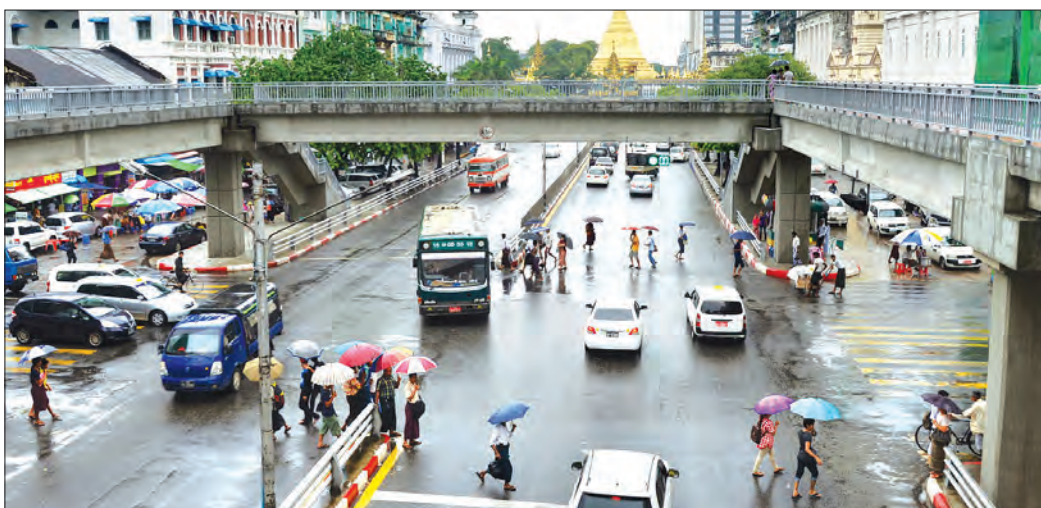
ရန်ကုန်မြို့လယ်တွင် ယာဉ်အန္တရာယ် ကင်းရှင်းရေးအတွက် လူကူးခုံးကျော်တံတား တည်ဆောက်ထားသော်လည်း ခုံးကျော်တံတားပေါ်မှ ဖြတ်သန်းသွားလာခြင်း မရှိဘဲ စည်းကမ်းမဲ့စွာ သွားလာနေကြသည်ကို မေ ၂၃ ရက်က တွေ့ရစဉ်