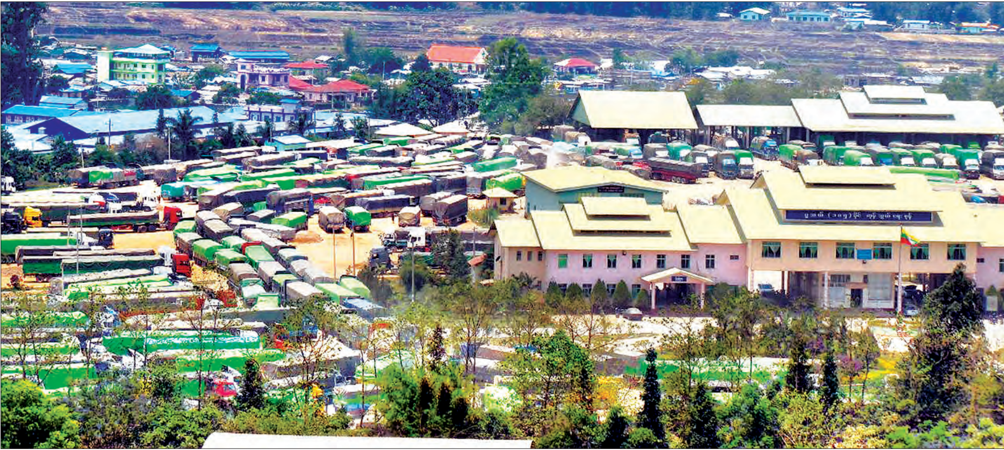
မူဆယ်မြို့နယ် မိုင်ယု ၁၀၅ မိုင်ရှိ ကုန်သွယ်ရေးဇုန်မြင်ကွင်းကို တွေ့ရစဉ်။

“နယ်စပ်ဒေသက ဒေသခံကုန်သည်ငယ်တွေအတွက် တစ်ဦးချင်း ကုန်သွယ်မှုလုပ်ငန်းရှင်ကတ်နဲ့ ခွင့်ပြုဆောင်ရွက်ပေးတာတို့ တစ်ရက်ကို ကျပ်သိန်း ၂၀ နှုန်းနဲ့ ၅ ရက်ကို သိန်း ၃၀ နှုန်း၊ ကုန်သွယ်မှုပြုထားရာကနေ အခုခံမိချက်မှာ တစ်ရက်ကို ကျပ်သိန်း ၃၀ နဲ့ ၅ ရက်စာကျပ်သိန်း ၁၅၀ အထိ တိုးမြှင့်ဆောင်ရွက်ခွင့်ပြုပေးသွားမှာဖြစ်ပါတယ်။ ဒီလိုဆောင်ရွက်ပေးတဲ့အတွက် ကိုယ်ပိုင်ကုမ္ပဏီမထူထောင်နိုင်သေးတဲ့ နယ်စပ်ဒေသမှာရှိတဲ့ ဒေသခံကုန်သည်ငယ်တွေအနေနဲ့ လုပ်ငန်းကို ပိုမိုတိုးချဲ့နိုင်ပြီး အတွေ့အကြုံနဲ့ အခွင့်အလမ်းတွေ ပိုမိုရရှိလာမှာဖြစ်သလို နိုင်ငံတော်အတွက်လည်း အခွန်အခပိုမိုရရှိလာမှာဖြစ်တဲ့အတွက် ကုန်သွယ်မှုမစာတလည်း တိုးတက်လာမှာဖြစ်ပါတယ်” ဟု ပြည်ထောင်စုဝန်ကြီး ဒေါက်တာ