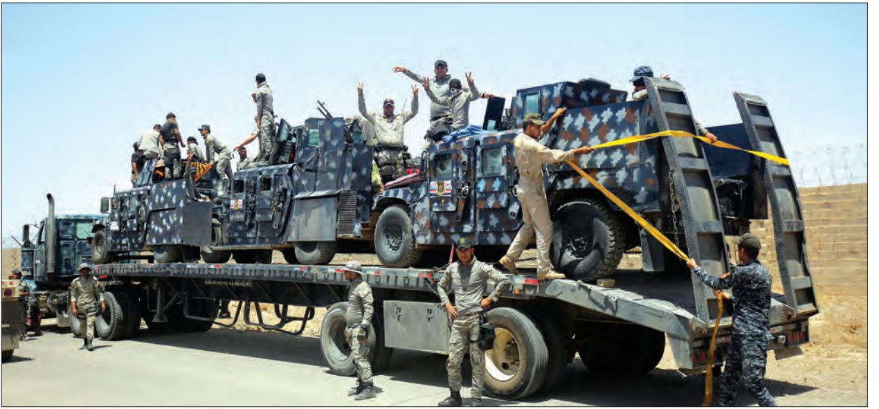
မြို့မှ ထွက်ပြေးနိုင်စွမ်းမရှိသည့် မိသားစုများသည် ၎င်းတို့၏ နေအိမ်၌ သတိပေးမှုများ ပြုလုပ်ထားသည်။ အလံဖြူအမှတ်အသားများထားရှိရန် အီရတ်တပ်ဖွဲ့က ရုပ်မြင်သံကြားမှတစ်ဆင့် (ရိုက်တာ)

အီရတ်တပ်ဖွဲ့ဝင်များ၊ ရဲများနှင့် လေကြောင်းမှ မဟာမိတ်တပ်များသည် လွန်ခဲ့ သည့်နှစ်ကတည်းက ဖော်လူဂျာမြို့ကို ဝိုင်းထားသဖြင့် အိုင်အက်စ်တို့က ဒေသခံများ ထွက်ပြေးခြင်းမရှိအောင် ပိတ်ဆို့ထားသည်။