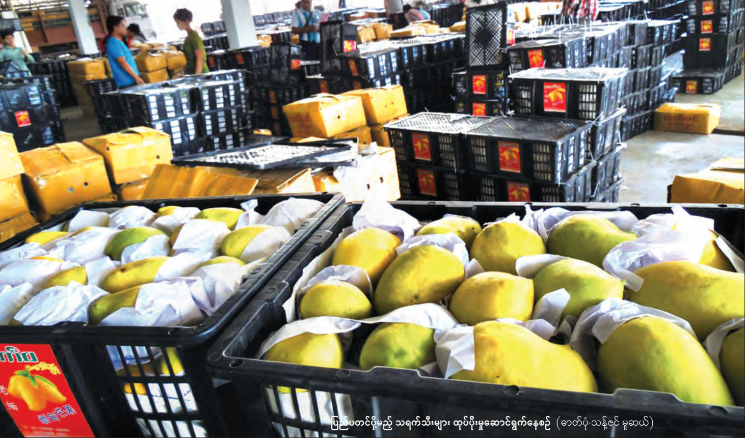
ပြည်ပတင်ပို့မည့် သရက်သီးများ ထုပ်ပိုးမှုဆောင်ရွက်နေစဉ်။

သန်းမြိုင်က ရင်းပြုသည်။ ပို့ကုန်သွင်းကုန်လိုင်စင် လျှောက်ထားမှု ရန်ကုန်တွင်လည်း ပြင်ဆင်ဖြေလျှော့ ဆောင်ရွက်ပေးမည်ဟု ဆိုသည်။ အလားတူ ပို့ကုန်သွင်းကုန်ကဏ္ဍတွင် လိုင်စင်လျှောက်ထားမှုကို နေပြည်တော်ရုံးချုပ်နည်းတူ ရန်ကုန်တွင်လည်း ပြင်ဆင်ဖြေလျှော့ကာ ဆောင်ရွက်ပေးသွားမည်ဟု ပြည်ထောင်စုဝန်ကြီးက ပြောသည်။