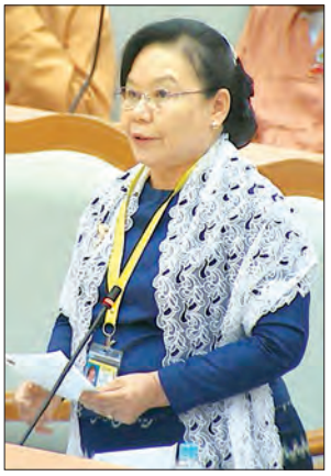
မြန်မာနိုင်ငံတော်ပဟိုဘဏ် ဒုတိယဥက္ကဋ္ဌ ဒေါ်ခင်စောဦး

ကြောင်း ပြန်လည်ဆွေးနွေးသည်။ ထို့ပြင် တိုင်းရင်းသားရေးရာ ဝန်ကြီးဌာန ပြည်ထောင်စုဝန်ကြီး ဦးနိုင် သက်လွင်က တိုင်းရင်းသားရေးရာနှင့် ပတ်သက်၍ တိုင်းရင်းသားလူမျိုးများ ရေးရာဝန်ကြီးဌာနနှင့် တိုင်းရင်းသား ရေးရာ ဝန်ကြီးဌာနဟူ၍ မသဲမကွဲဖြစ်ခဲ့ ပါကြောင်း၊ ၂၀၁၅ ခုနှစ် ဖေဖော်ဝါရီ ၂၄ ရက်တွင် ပြဋ္ဌာန်းခဲ့သည့် ပြည်ထောင်စု လွှတ်တော်ဥပဒေအမှတ်(၈)၌ တိုင်းရင်း သားရေးရာနှင့်ပတ်သက်၍ တိုင်းရင်းသား လူမျိုးများအခွင့်အရေး ကာကွယ်စောင့် ရှောက်ရေးဥပဒေဟု သတ်မှတ်ခဲ့ပါ ကြောင်း၊ ထို့ပြင် ပြည်ထောင်စုအစိုးရ