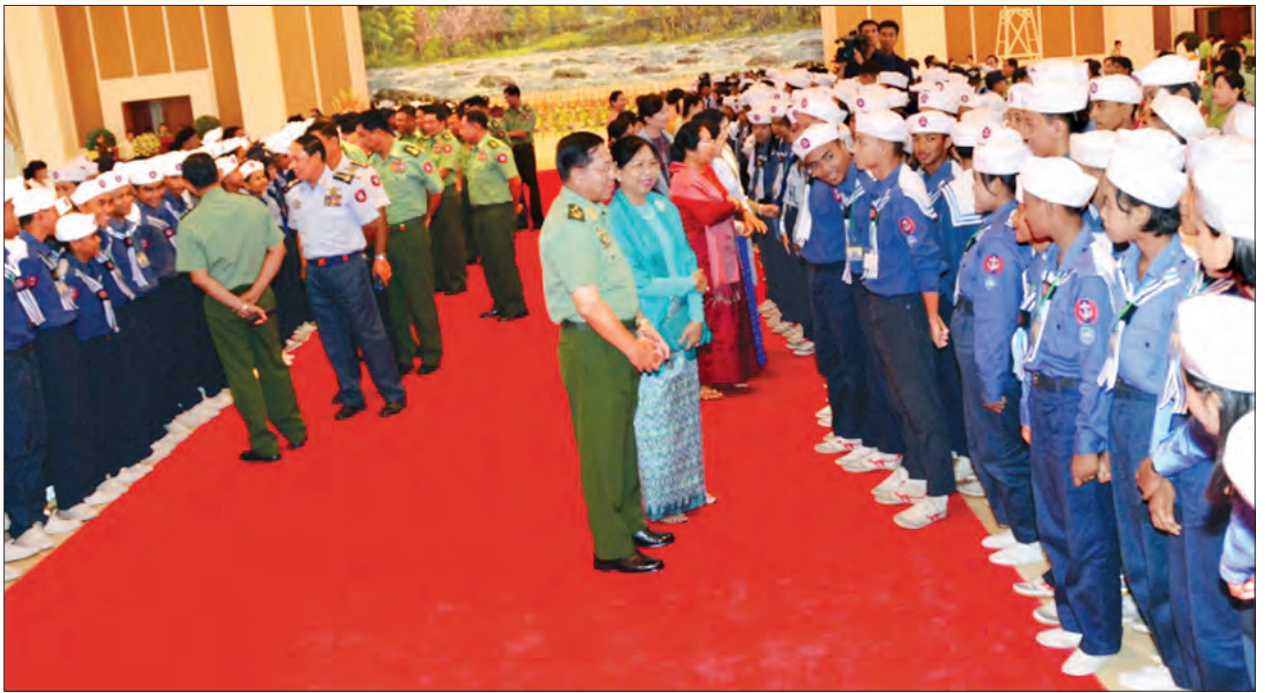
တပ်မတော်ကာကွယ်ရေးဦးစီးချုပ် ဗိုလ်ချုပ်မှူးကြီး မင်းအောင်လှိုင်နှင့် အဖွဲ့ဝင်များ ရေကြောင်း/လေကြောင်း လူငယ်မောင်မယ်များအား ရင်းရင်းနှီးနှီး နှုတ်ဆက်စဉ်

သင်တန်းများကို ၂၀၁၄ ခုနှစ်မှ စတင်ဖွင့် လှစ်ခဲ့ပြီး ၂၀၁၅ ခုနှစ်တွင် အခြေခံ သင်တန်းတက်ပြီးသော လူငယ်များ အတွက် တန်းမြင့်သင်တန်းများကို