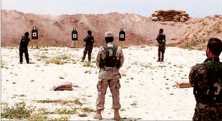
အမေရိကန်တပ်ဖွဲ့ဝင်များက အက်စ်ဒီအက်စ်တပ်ဖွဲ့ဝင်များကို စစ်ရေးလေ့ကျင့်ပေးနေစဉ်

သမား ၂၅၀၀၀၊ အာရပ်တိုက်ခိုက်ရေး သမား ၅၀၀၀ ပါဝင်သည်။ အဆိုပါ တပ်ဖွဲ့အတွင်း အာရပ်တပ်ဖွဲ့ဝင် အင်အား တိုးတက်လာနိုင်သည်ဟု အမေရိကန်တို့က မျှော်လင့်ထားသည်။ အာရပ်တိုက်ခိုက်ရေးသမားများက ဗိုလ်ချုပ် ဘိုတယ်၏ ခရီးစဉ်အတွင်း ၎င်းတို့အနေဖြင့် အကူအညီများ ပိုမိုလိုအပ်ကြောင်း မီဒီယာများကို ပြောသည်။ အက်စ်ဒီအက်စ်မှ ဒုတိယတပ်မှူး Qarhaman Hasan က မော်တာ သေနတ်များ၊ ခုံးကျည်များ၊ လောင်ချာများ၊