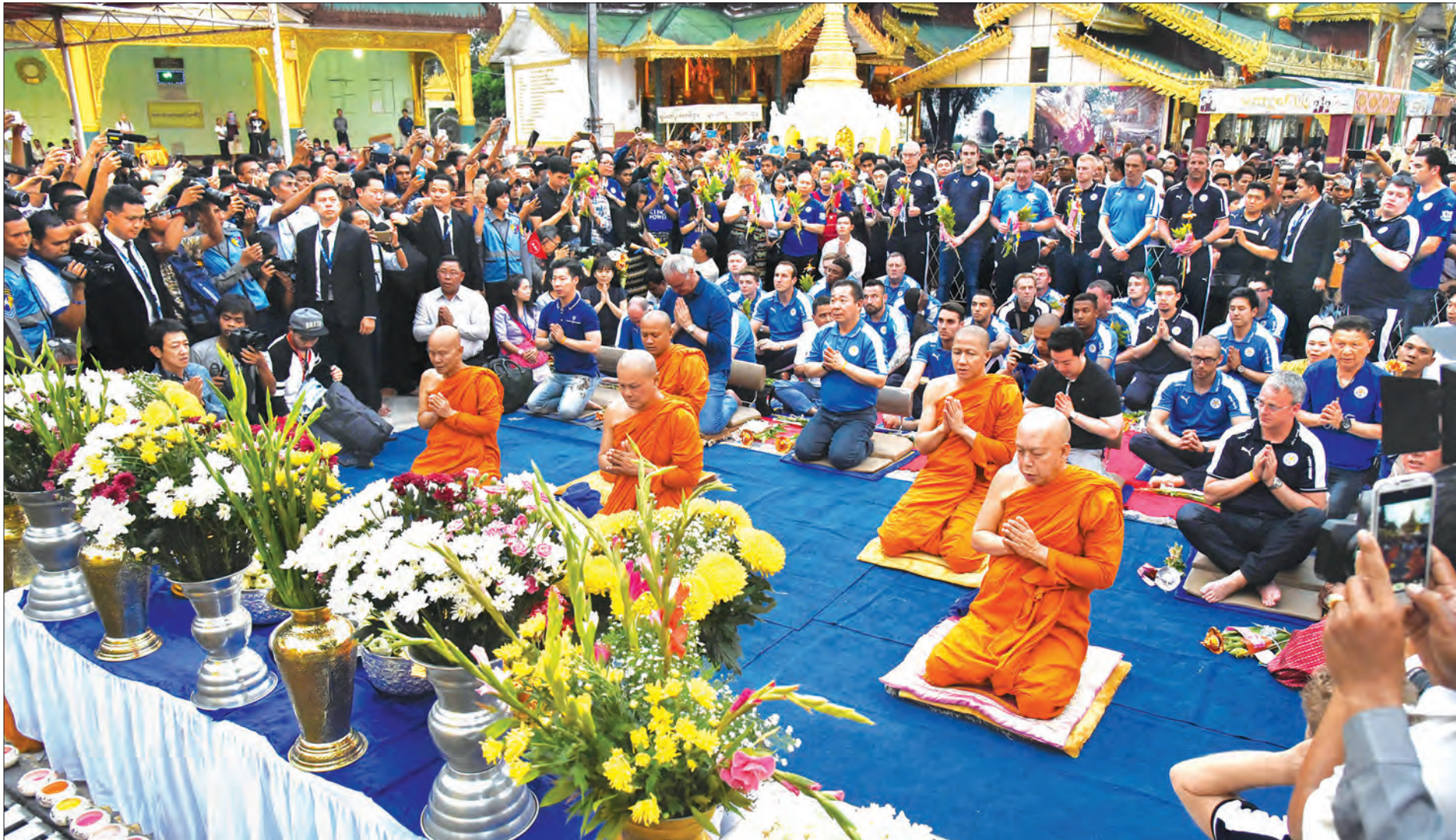
ကျောစိုးမှ ပြုလုပ်သည့်အစီအစဉ်တွင် ကစမ်းမပေါက်ခဲ့သည့် ကံထူးရှင် ငါးဦးနှင့်လည်း အမှတ်တရဓာတ်ပုံရိုက်ခဲ့သည်။ လက်စတာ အသင်းသည် ယင်းမှတစ်ဆင့် ရွှေတိဂုံစေတီတော်သို့ သွားရောက် ဖူးမြော်ခဲ့ပြီး အောင်မြေအနီး၌ ဆုတောင်းမှုများ ပြုလုပ်ကာ လက်ယာရစ်ပူဇော်ခဲ့ကြသည်။ ပရိမိယာလိဂ်ချန်ပီယံအသင်း၏ မြန်မာပြည်ခရီးစဉ်ကို မြန်မာဘောလုံးပရိသတ်များ စိတ်ဝင်တစားရိုခဲ့ပြီး ဘောလုံးသမားများနှင့် အမှတ်တရဓာတ်ပုံရိုက်ကူးခြင်းများ ပြုလုပ်ခဲ့သည်။ လက်စတာအသင်းတွင် ယူရိုပြိုင်ပွဲကြောင့် နာမည်ကြီးကစားသမားများ ပါဝင်လာနိုင်ခြင်းမရှိဘဲ ရှုပါဇာ၊ ဆင်ပဆင် စသည့်ကစားသမားများသာ ပါဝင်လာခဲ့သည်။ လက်စတာအသင်း၏ မြန်မာပြည်ခရီးစဉ်မှာ လေးနာရီသာကြာမြင့်ခဲ့ပြီး ည ၈ နာရီတွင် အထူးစီမံထားသည့် Air Asia လေကြောင်းလိုင်းဖြင့် ပြန်လည်ထွက်ခွာသွားသည်။ ထိုင်းနိုင်ငံမှ ဘုန်းတော်ကြီးများ၊ ပရိမိယာလိဂ်ချန်ပီယံလက်စတာအသင်းပိုင်ရှင်၊ အုပ်ချုပ်မှုနည်းပြအဖွဲ့နှင့် အသင်းသားများ ရွှေတိဂုံစေတီတော်အား ဖူးမြော်ကြည့်ညှိနေမှုကို ထွေရစဉ်