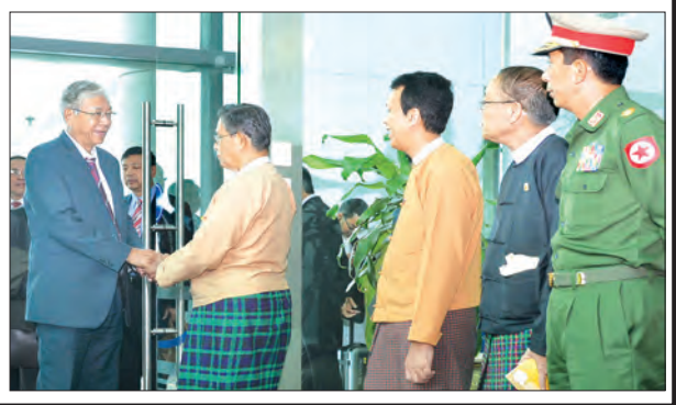
စာမျက်နှာ - ၃

နိုင်ငံတော်သမ္မတ ဦးထင်ကျော် ရုရှား - အာဆီယံ ဆက်ဆံရေး နှစ် ၂၀ ပြည့်အထိမ်းအမှတ် ထိပ်သီးအစည်းအဝေးသို့ တက်ရောက်ခဲ့ ပြီး ပြန်လည်ရောက်ရှိ