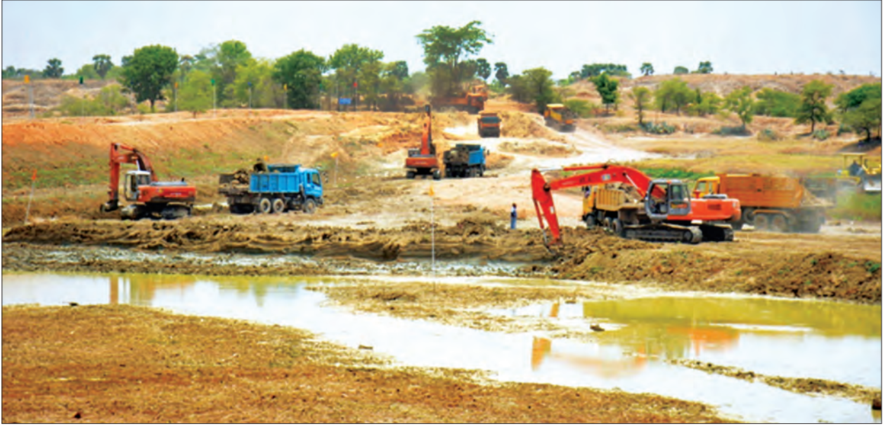
ညောင်ဦးမြို့နယ် ငါးသရောက်ကျေးရွာ အရှေ့မြောက်ဘက် ပျဉ်းပင်ရွာအနီးရှိ ပြားဆည်ပြုပြင်နေမှုကို တွေ့ရစဉ်

ပြည်ထောင်စုဝန်ကြီးက ဆည်များတည်ဆောက်ခဲ့စဉ်က ဒေသနေပြည်သူများ၏ အကျိုးစီးပွားအတွက် မျှော်မှန်းတည်ဆောက်ခဲ့ခြင်းဖြစ်သကဲ့သို့ ယခုကဲ့သို့ မိုးခေါင်မှုများ ဆက်လက်ဖြစ်ပေါ်နေပြီး ဆည်တံမံအနေဖြင့် အကျိုးပြုနိုင်မှုမရှိတော့ပါက အဆိုပါဆည်တံမံ၏ ထိန်းသိမ်းစရိတ်သည် နိုင်ငံတော်အတွက် ဝန်ထုပ်ဝန်ပိုးမဖြစ်စေရေးနှင့် ဒေသနှင့် အဆင်ပြေသင့်တော်မည့် စိုက်ပျိုးမြေအဖြစ် ပြန်လည်အသုံးပြုနိုင်ရေး စီမံဆောင်ရွက်ရန်လိုအပ်မည်ဖြစ်ကြောင်း၊ ဒေသအတွက်လိုအပ်လာမည့် သောက်သုံးရေနှင့် စိုက်ပျိုးရေးအတွက် မြေအောက်ရေထုတ်ယူအသုံးပြုနိုင်ရေးအပါအဝင် နည်းလမ်းများ ရှာဖွေကြံဆဆောင်ရွက်ကြရေးတို့ကို ဆွေးနွေးမှာကြားသည်။