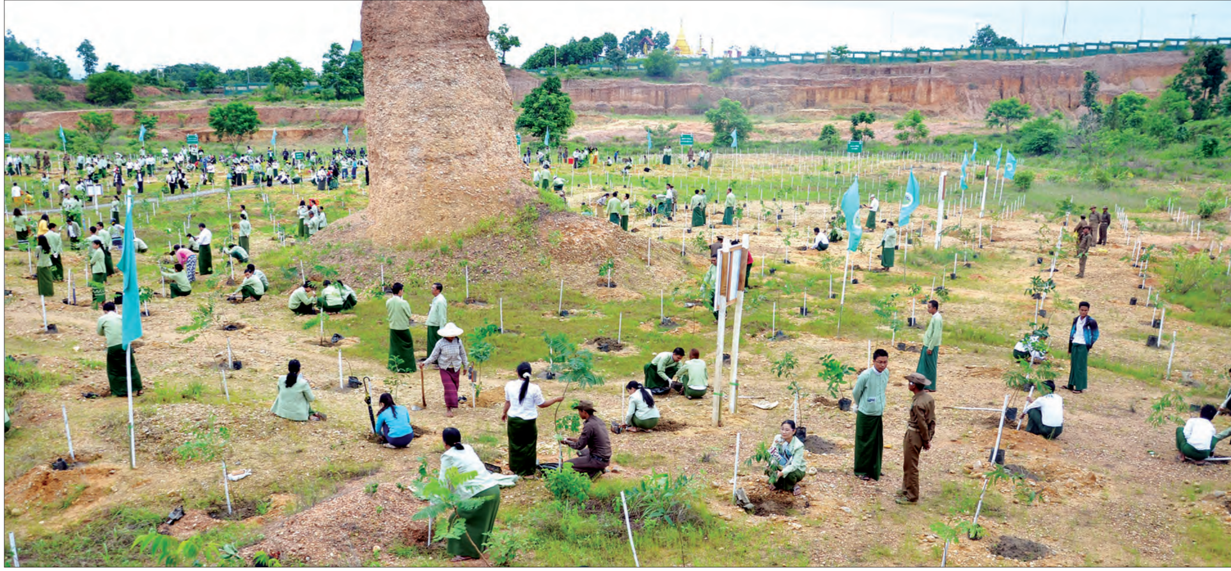
သဘာဝပတ်ဝန်းကျင်ထိန်းသိမ်းရေးနှင့် စီမံကိန်းဗဟိုဌာနမှ ပြည်သူများ သစ်ပင်များကို ပြန်လည်စိုက်ပျိုးနေကြစဉ်

သွားမယ်။ နိုင်ငံရဲ့ လောင်စာလိုအပ်ချက်ကို သစ်တောကဏ္ဍကနေ ထုတ်ယူသုံးစွဲမှု လျော့နည်းစေဖို့ ဆောင်ရွက်သွားမယ်။ ပြီးတော့