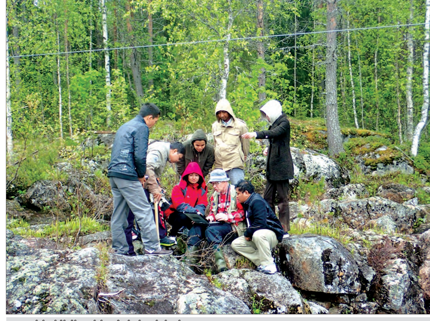
သဘာဝပတ်ဝန်းကျင်ထိန်းသိမ်းရေးလုပ်ငန်းများကို ကွင်းဆင်းဆောင်ရွက်နေစဉ်

ဒီအလုပ်ရုံဆွေးနွေးပွဲက တစ်ဆင့် သစ်ထုတ်လုပ်မှု ရပ်နားတာ၊ လျှော့ချတာနဲ့ ပတ်သက်လို့ ဖြစ်ပေါ်လာနိုင်တဲ့ အားနည်းချက်၊ အားသာချက်တွေကို social aspect၊ economic aspect၊ environmental aspect ဒီလိုဘက်ပေါင်းစုံကနေကြည့်ပြီး ဆုံးဖြတ်သွားမှာပါ။ ရလာတဲ့ ဆွေးနွေးရလဒ်တွေကို အခြေခံပြီး သစ်ထုတ်လုပ်မှု ရပ်နားတာ၊ လျှော့ချတာနဲ့ သစ်တောသယံဇာတ