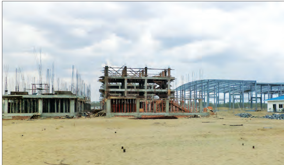
တည်းကုန်းတွင် တည်ဆောက်နေသည့် နိုင်ငံတကာအဆင့်မီ ဟင်းသီးဟင်းရွက်၊ ပန်းမန် လက်ကားဈေးသစ်ကြီး

ရန်ကုန်တိုင်းဒေသကြီး အင်းစိန်မြို့နယ် တည်းကုန်းဘူတာအနီးရှိ မြေ ၈၃ ဒဿ ၇၃ ဧက ကျယ်ဝန်းသော နိုင်ငံတကာအဆင့်မီ ဟင်းသီးဟင်းရွက် ပန်းမန်လက်ကားဈေးသစ်ကြီးကို ဒဂုန်အင်တာနေရှင်နယ်ကုမ္ပဏီလီမိတက်မှ ဖွဲ့စည်းသော Myanmar Argo Exchange Public Ltd မှ အုပ်ချုပ်မှုကိစ္စများ ဆောင်ရွက်မည်ဖြစ်ပြီး ရန်ကုန်မြို့တော် စည်ပင်သာယာရေးကော်မတီမှ ကိုယ်စားလှယ်တစ်ဦး ဒါရိုက်တာအဖြစ် ပါဝင်ကာ နိုင်ငံတကာအဆင့်မီ အဆင့်မြင့်လက်ကားဈေးကြီးအဖြစ် ဆောက်လုပ်သွားမည်ဖြစ်ကြောင်း သိရသည်။