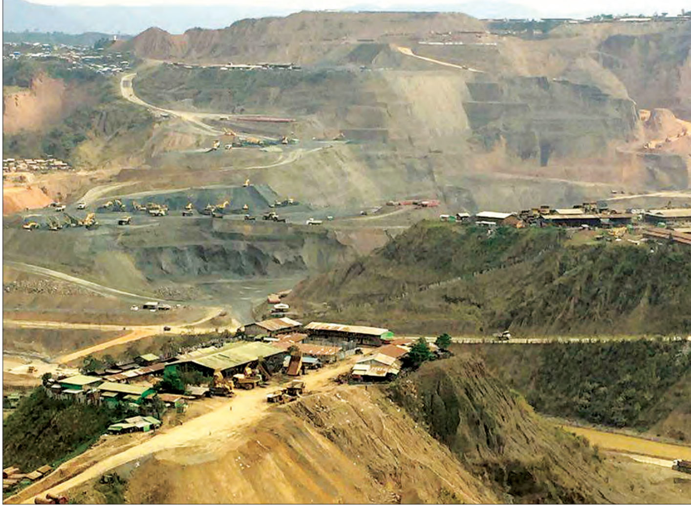
ကချင်ပြည်နယ် ဖားကန့်ရတနာနယ်မြေ၏ မြင်ကွင်း။

ပြည်ထောင်စုဝန်ကြီးဦးအုန်းဝင်း ကိုယ်တိုင်သွားရောက်ခဲ့ပါ တယ်။ ပြီးတော့ ဥရုချောင်း ရေစီးရေလာကောင်းမွန်အောင်၊ သဘာဝပတ်ဝန်းကျင် ပျက်စီးမှုတွေကို အမြန်ဖြစ် အပင်တွေ စိုက်ပျိုးပြီး တောဖုံးလွှမ်းတဲ့အထိ အဆင့်ဆင့် ဆောင်ရွက်နိုင် အောင် ညွှန်ကြားထားပါတယ်။ လက်ရှိအနေနဲ့ကတော့ လုပ်ကွက်အသစ်တွေ ချထားမှုကို ပိတ်ပင်ထားပါတယ်။ တူးဖော်ဆဲလုပ်ကွက်တွေကို ပိုပြီးစနစ် ကျတဲ့ တူးဖော်မှုစနစ်တွေ အသုံးပြုနိုင်ရေး ဆောင်ရွက်သွားမယ်။ EIA၊ SIA တွေ ရေးဆွဲတာမျိုး မရှိခဲ့တဲ့အတွက် ပတ်ဝန်းကျင် စီမံခန့်ခွဲမှုအစီအစဉ် (EMP) ကို မှော်အလိုက် ရေးဆွဲနိုင်ဖို့ ပတ် ဝန်းကျင်ထိန်းသိမ်းရေးဦးစီးဌာနနဲ့ ညှိနှိုင်းဆောင်ရွက်လျက်ရှိ ပါတယ်။ ပြီးတော့ လုံခြုံရေးအဖွဲ့အစည်းတွေ၊ လုပ်ငန်းဆောင်ရွက်တဲ့ ကုမ္ပဏီတွေ၊ ဒေသခံပြည်သူ၊ ရပ်မိရပ်ဖ၊ အစိုးရအဖွဲ့တွေနဲ့ ကျယ်ကျယ်ပြန့်ပြန့် ဆွေးနွေးအမြေရှာ ဖြေရှင်းရမှာဖြစ်ပါတယ်။ ဒေသတွင်း တရားဥပဒေစိုးမိုးရေး အားနည်းချက်ကြောင့် ရေ မဆေးကျောက် ရာဇဝေသုတွေဟာ ၂၀၁၂ ကနေ ၂၀၁၅ ခုနှစ်အတွင်း လူဦးရေနှစ်သောင်းကနေ သုံးသိန်းနီးပါးအထိ တိုးပွားလာတယ်။ ဒီအပေါ်မှာ စနစ်တကျကိုင်တွယ်ဆောင်ရွက် နိုင်ခဲ့ခြင်းမရှိဘူး။ တရားဥပဒေစိုးမိုးရေးကိုစွဲအပြင် လူမျိုးရေး၊ နိုင်ငံရေးတို့နဲ့လည်း ဆက်နွှယ်နေတဲ့အတွက် နူးနူးညည်ည သိမ်သိမ်မွေ့မွေ့လုပ်ဆောင်ရမယ်။