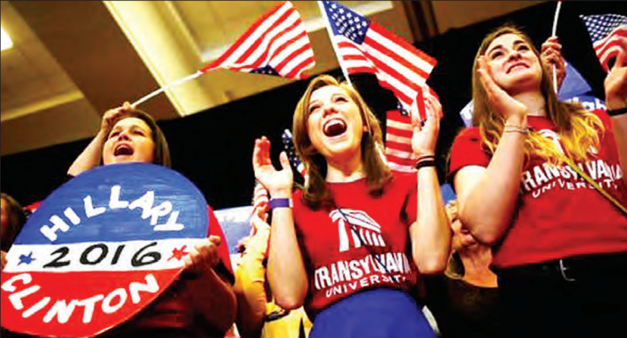
အချိန်နှစ်ရက်ကြာခဲ့သော ကလင်တန်သည် နိုင်ငံဘာ အော်ရီဂွန်နှင့် ဝါဟီအတွက် သမ္မတလောင်း ဖြစ်လာနိုင်သော်လည်း ၎င်းအနေဖြင့် သေချာစေရန် ကိုယ်စားလှယ်အရေအတွက် ၁၀၀ ကျော် လိုအပ်နေသေးသည်။

ဒီမိုကရက်တစ် အကြိုလှုပ်ရှားမှုများကို နှစ်ပတ်ကြာ ခေတ္တရပ်စဲထားမည်ဖြစ်ပြီး ကယ်လီဖိုးနီးယားအပါအဝင် အဓိက ယှဉ်ပြိုင်ပွဲများကို ဇွန် ၇ ရက်တွင် ပြုလုပ်သွားဖွယ်ရှိသည်။ ကင်တပ်ကီပြည်နယ်၌ မဲဆွယ်စည်းရုံးပွဲအတွက်