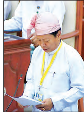
ပြည်ထောင်စု ဝန်ကြီး သူရဦးအောင်ကို ဖြေကြားစဉ်

အစည်းအဝေးတွင် စိုက်ပျိုးရေး၊ မွေးမြူရေးနှင့် ဆည်မြောင်းဝန်ကြီးဌာန ပြည်ထောင်စုဝန်ကြီး ဒေါက်တာ အောင်သူက ရှမ်းပြည်နယ်အရေပိုင်း မိုင်းဖြတ်မြို့နယ် မွန်ကကျောင်းကျေးရွာ အုပ်စု မခန်းကျေးရွာမှ ဟိုပေါကျေးရွာ အထိ ၁၅ မိုင် မြေသားလမ်း အဆင့်မြှင့် တင်ခြင်းလုပ်ငန်းကို ကျေးလက်ဒေသ ဖွံ့ဖြိုးတိုးတက်ရေးဦးစီးဌာန၏ ၂၀၁၆- ၂၀၁၇ ဘဏ္ဍာရေးနှစ်တွင် ပါဝင်ခြင်းမရှိ သည့်အတွက် လတ်တလောဆောင်ရွက် ပေးနိုင်ခြင်း မရှိပါကြောင်း၊ ၂၀၁၇-၂၀၁၈ ဘဏ္ဍာရေးနှစ်တွင် ပြုချက်ရှိရေး လျာထား တင်ပြတောင်းခံသွားမည် ဖြစ်ပါကြောင်း မိုင်းဖြတ်မဲဆန္ဒနယ်မှ ဦးလင်းဇော်ထွန်း၏ မေးမြန်းချက်အပေါ် ဖြေကြားသည်။