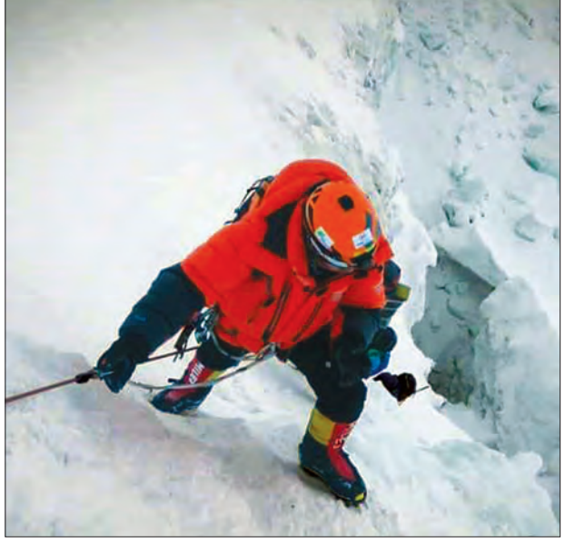
မြန်မာတောင်တက်သမားတစ်ဦးကို တွေ့ရစဉ်

မျိုးမင်းသိန်း(မရမ်းကုန်း)၊ ဓာတ်ပုံ - ခြေလျင်နှင့်တောင်တက်အဖွဲ့ချုပ်