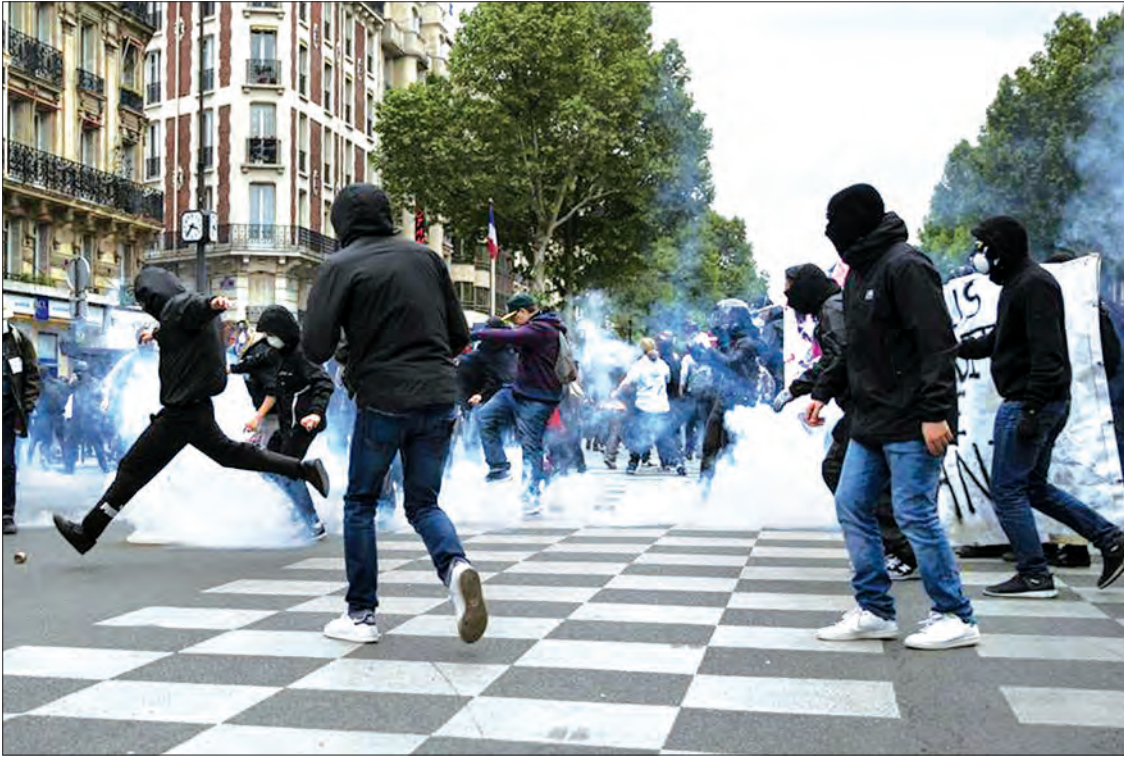
ပါရီမြို့၌ ကန့်ကွက်ဆန္ဒပြနေ သူများမှာ တောင်ပိုင်းမြို့တော် မာဆယ်လီ၌ လူပေါင်း ၆၈၀၀ မှ ၈၀၀၀ ကြားရှိပြီး ပြင်သစ်နိုင်ငံ အလယ်ပိုင်း တောင်ပိုင်း နန်တီ၌ ဆန္ဒပြသူ ၁၀၀၀၀ ရှိပြီး ဆန္ဒပြမှုဖြစ်မြောက်ရေး အဖွဲ့က ပြောသည်။ (ဆင်ဟွာ)

ယခုပြုလုပ်မည့် ပြုပြင်ပြောင်းလဲမှု အကျိုး သက်ရောက်မှုရှိစေရန် အချိန် များစွာယူရမည်ဟု ၎င်းက ထပ်လောင်း ပြောခဲ့သည်။