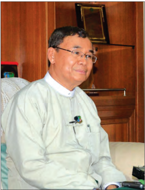
ဦးအုန်းဝင်း၊ ပြည်ထောင်စုဝန်ကြီး၊ သယံဇာတနှင့် သဘာဝပတ်ဝန်းကျင် ထိန်းသိမ်းရေးဝန်ကြီးဌာန

“ပြောင်းလဲချိန်တန်ပြီ” ဟူသော ကြွေးကြော်သံနှင့်အတူ အပြောင်းအလဲကို မျှော်လင့်သော ပြည်သူများက အစိုးရသစ်တစ်ရပ်ကို ဒီမိုကရေစီနည်းကျ ရွေးချယ်တင်မြောက်ခဲ့ကြသည်။ ပြည်သူက ရွေးချယ်တင်မြောက်ခြင်းခံရသော ပြည်သူ့အစိုးရများ၏ တာဝန်မှာ ပြည်သူတို့၏ မျှော်လင့်ချက်နှင့် လိုအင်ဆန္ဒများကို ဖြည့်ဆည်းပေးရန် ဖြစ်သည်။ ယင်းအချက်သည် အစိုးရသစ်တိုင်းအတွက် စိန်ခေါ်မှုတစ်ခုလည်းဖြစ်သည်။ အစိုးရသစ်သည် ယခင်အစိုးရ ဝန်ကြီးဌာနများကို လျှော့တန်လျှော့၊ ပြင်တန်ပြင်၊ ပေါင်းတန်ပေါင်း စသည်ဖြင့် ပြုလုပ်ကာ ဝန်ကြီးဌာနများကို ကျစ်ကျစ် လျစ်လျစ်ဖွဲ့စည်း၍ အစရှိပြုပြင်ပြောင်းလဲခဲ့သည်။ ပြည်သူက ကြည်ဖြူနေဆဲ အစိုးရသစ်၏ ပထမရက် ၁၀၀ အတွင်း ဆောင်ရွက်ချက်များသည် ယင်းအစိုးရ၏ အရည်အသွေးကို အကဲဖြတ်နိုင်သည့် စံတစ်ခုဖြစ်သည်။ မေ ၁ ရက်မှစတင်သည့် ရက် ၁၀၀ ကာလအတွင်း ဝန်ကြီးဌာနတစ်ခုချင်း အလိုက် ပြည်သူ့အကျိုးအတွက် ဆောင်ရွက်ကြမည့် လုပ်ငန်းများကို သတင်းရယူ စုစည်းဖော်ပြအပ်ပါသည်။