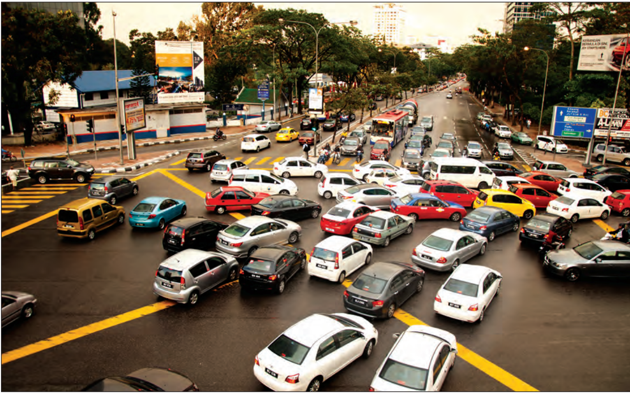
ယာဉ်ကြောပိတ်ဆို့နေသော မလေးရှားနိုင်ငံ ကွာလာလမ်ပူမြို့တစ်နေရာ

အကယ်၍ လမ်းကွန်ရက်နှင့် လိုက်လျောညီထွေမဖြစ်ဘဲ မော်တော်ကားများကို ထပ်မံတိုးချဲ့တင်သွင်းကာ ပြေးဆွဲမောင်းနှင်စေမည်ဆိုလျှင် ကာလတိုအတွင်း၌ပင် ယာဉ်ကြောကျပ်ခြင်းပြဿနာ ပေါ်ပေါက်လာလိမ့်မည် ဖြစ်သည်။ မောင်းနှင် အသုံးပြုနေသော မော်တော်ကားအစီးရေနှင့် လမ်းကွန်ရက်တို့ သဟဇာတဖြစ်လျှင်