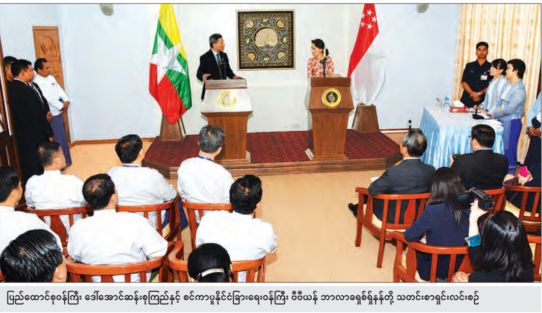
ပြည်ထောင်စုဝန်ကြီး ဒေါ်အောင်ဆန်းစုကြည်နှင့် စင်ကာပူနိုင်ငံခြားရေးဝန်ကြီး ဝိဇီယန် ဘာလာခရစ်ရှ်နန်တို့ သတင်းစာရှင်းလင်းစဉ်

သကဲ့သို့ မြန်မာလူငယ်များအတွက် ပညာရေးနှင့် သက်မွေးပညာသင်တန်းများဖွင့်လှစ်ပေးပြီး အလုပ် အကိုင်အခွင့်အလမ်းများ ဖော်ဆောင်ပေးမည်ဖြစ်ပါ ကြောင်း ပြောကြားသည်။ ပြည်ထောင်စုဝန်ကြီး ဒေါ်အောင်ဆန်းစုကြည်က မြန်မာနိုင်ငံအပေါ် ပိတ်ဆို့မှုများနှင့်ပတ်သက်၍ စိုးရိမ်စရာမရှိပါကြောင်း၊ ထိုပိတ်ဆို့မှုများအချိန် တန်ပါက ရုပ်သိမ်းသွားမည်ဟု ယုံကြည်ပါကြောင်း၊ မိမိတို့အနေဖြင့် အခက်အခဲအဟန့်အတားများကို ကျော်လွှားနိုင်လိမ့်မည်ဟု ယုံကြည်ပါကြောင်း၊ မြန်မာနိုင်ငံအနေဖြင့် အမေရိကန်ပြည်ထောင်စုနှင့် မဟာမိတ်နိုင်ငံအဖြစ် ဆက်လက်ရပ်တည်သွားရန် ဆန္ဒရှိပါကြောင်း ပြန်လည်ရှင်းလင်းဖြေကြားသည်။ ညပိုင်းတွင် မြန်မာ-စင်ကာပူ နှစ်နိုင်ငံ သံတမန်ဆက်ဆံရေး ထူထောင်သည့် နှစ်(၅၀) ပြည့်အထိမ်းအမှတ် ညစာစားပွဲကို Park Royal ဟိုတယ်၌ ပြုလုပ်ခဲ့သည်။ (သတင်းစဉ်)