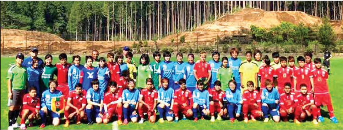
မြန်မာအမျိုးသမီးအသင်းအား Shizuoka တက္ကသိုလ်အသင်းနှင့် ခြေစမ်းပွဲမကစားမီ တွေ့ရစဉ်

ရန်ကုန် မေ ၁၈ ၂၀၁၆ ရာသီ ပိုလ်ချုပ်အောင်ဆန်းခိုင်း ရုံး / ထွက် ဘောလုံးပြိုင်ပွဲ ပထမအဆင့် (ပထမနေ့) ပွဲစဉ်များကို ယနေ့ညနေပိုင်းက စတင် ကျင်းပရာ ရခိုင်၊ မြဝတီနှင့် Southern အသင်းတို့ ဒုတိယအဆင့် တို့ တက်ရောက်သွားသည်။