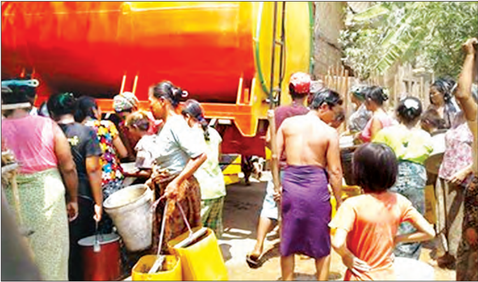
ငန်းစပ်ကျေးရွာ ပြည်သူများအတွက် အလှူရှင်များက ရေများလာရောက်လှူဒါန်းမှုကို တွေ့ရစဉ်

ယခုနှစ်နှစ်ရာသီ အပူဒဏ်ပြင်းထန်မှုကြောင့် မြန်မာနိုင်ငံ နေရာ အနှံ့အပြားတွင် သောက်ရေသုံးပေးရန်အတွက် အခက်အခဲများ ရင်ဆိုင်နေရသည်ကို သတင်းမီဒီယာများက ကြားနေရသည်။ သည်မြေ၊ သည်ရေ၊ သည်တစ်မိုးအောက်တွင် တည်ရှိသော နိုင်ငံ၏ မြို့တော် နေပြည်တော်တစ်ဝိုက်သည်လည်း အခြားဒေသ များကဲ့သို့ပင် အပူရှိန်ပြင်းထန်မှုကို ခံစားနေရသည်။ သို့သော် သောက်ရေသုံးပေးရန်အတွက် အခက်အခဲကြီးကြီးမားမား ပြောဆိုသံ မကြားရ။ အကယ်၍ အခက်အခဲရှိလာသည်တိုင် မြို့တော်ဖြစ်သောကြောင့် လည်းကောင်း၊ မြို့တော်နှင့် အနီး အနားနှင့် တည်ရှိနေသောကြောင့် လည်းကောင်း အစစ အရာရာ ပြည့်စုံမှုရှိ၍ တစ်နည်းမဟုတ် တစ်နည်းဖြင့် ဖြစ်စေ၊ သက်ဆိုင်ရာတာဝန်ရှိသူများ သိရှိကူညီပေးခြင်းဖြင့်ဖြစ်စေ အဆင်ပြေနိုင်စရာရှိသည်။ ထို့ကြောင့် နေပြည်တော်နယ်နိမိတ်၊ ပရိသတ်အစပ်တွင် ရေအခက်အခဲဖြစ်နေကြောင်း မိတ်ဆွေ တစ်ယောက်ဆီမှ ကြားလိုက်ရချိန်တွင် ယုံရက်ခက် ဖြစ်သွားခဲ့ ရသည်။ မိတ်ဆွေဖြစ်သူက မနေ့တစ်နေ့ကပင် သောက်ရေသန့် ဘူးများ သွားရောက်လှူထားပြီးဖြစ်ကြောင်း၊ အခုလည်း သုံးရေ အခက်အခဲက ပို၍ကြီးမားနေကြောင်း သိရသဖြင့် အခြေအနေ ကို သွားရောက်မေးမြန်းရန် ထိုကျေးရွာသို့ သွားမည်ဟု ဆိုလာ သောအခါ စိတ်ပါဝင်စားမှုရှိနေသော စာရေးသူ အဖော်လိုက်ပါ သွားခဲ့သည်။