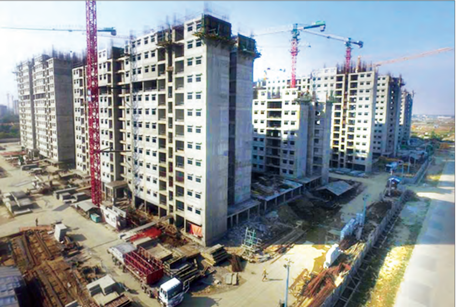
ဆောက်လုပ်ရေးဝန်ကြီးဌာန မြို့ပြနှင့် အိမ်ရာဖွံ့ဖြိုးရေးဦးစီးဌာနက တာဝန်ယူတည်ဆောက်နေသည့် ဒဂုံမြို့သစ်(အိမ်ကမ်း)မြို့နယ်ရှိ တန်ဖိုးအသင့်အတင့် ရေဝက်-ရတနာ အဆင့်မြင့်အိမ်ရာ စီမံကိန်းလုပ်ငန်းနှင့် တစ်နေရာ (ဓာတ်ပုံ-ဆောက်လုပ်ရေး)

ကမ္ဘာ့ဘဏ်၊ အာရှစံ့မြီးရေးဘဏ်၊ ဂျပန်အပြည်ပြည် ဆိုင်ရာ ပူးပေါင်းဆောင်ရွက်ရေးအေဂျင်စီတို့မှ အဖွဲ့များနှင့် ကွင်းဆင်းစစ်ဆေးမှုများပြုလုပ်ကာ လာမည့်နှစ်များတွင်လည်း ရောင်းငွေနှင့် နိုင်ငံတကာအကူအညီများယူကာ လမ်းများတိုးတက် အောင် လုပ်ဆောင်သွားရန်လည်း စီမံဆောင်ရွက်လျက်ရှိကြောင်း နှင့် အဆိုပါ လမ်းမကြီးများအပြင် အတွင်းလမ်းများကိုလည်း တတ်နိုင်သမျှ လာမည့်နှစ်များအတွင်း ရန်ပုံငွေအခြေအနေပေါ်