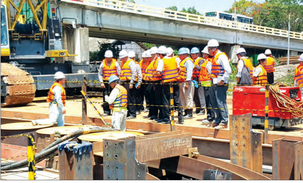
မင်္ဂလာတောင်ညွန့်မြို့နယ်နှင့် ဒေါပဲမြို့နယ်တို့ကို ဆက်သွယ်ထားသော လေးလမ်းသွား သာကေတတံတားသစ် တည်ဆောက်ရေး လုပ်ငန်းခွင်သို့ မေ ၈ ရက်က ပြည်ထောင်စုဝန်ကြီး ဦးဝင်းနိုင် သွားရောက်ကြည့်ရှုစစ်ဆေးခဲ့သည်

တစ်ခန်းကို ပေ ၄၀၀ လောက်ရှိတဲ့ အခန်းဆောက်ကြည့်မယ်။ အဲဒီမှာ သုံးရတဲ့ပစ္စည်းတွေ၊ စံချိန်စံညွှန်းတွေ၊ ဆောက်ရတဲ့ အချိန်ကာလတွေ ကုန်ကျရေပိုက်တွေ အားလုံးကိုတွက်ချက်ပြီးတော့ လုပ်သွားမှာပါ။ ကျွန်တော်ရည်ရွယ်ချက်ကတော့ တတ်နိုင် သလောက် သိန်း ၁၀၀ အောက်ကိုရနိုင်သမျှ ဆောက်ပေးသွားမှာပါ။ အဲဒါမှာ နောက်ပိုင်းသိန်း ၁၀၀ နဲ့ရအောင် မဆောက်ပေးနိုင်ဘူး ဆိုတိုက်စွာကို ချေဖျက်ပေးလို့ရမှာပါ။ အဲဒီလို ဆောက်လို့ရတယ် ဆိုတာကိုလည်း ဆောက်လုပ်ရေးဝန်ကြီးဌာနအနေနဲ့ ဆောင်ရွက်ဖို့ ရှိပါတယ်” ဟု ပြည်ထောင်စုဝန်ကြီး ဦးဝင်းနိုင်က ပြောကြား ခဲ့သည်။