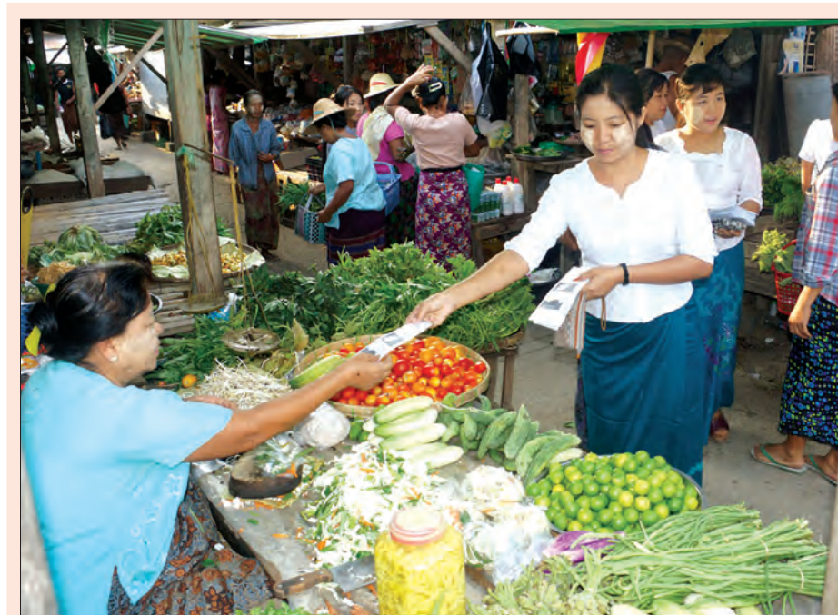
အယ်နီညိုကာလ သဘာဝဘေးအန္တရာယ်တစ်ခုဖြစ်သော မုန်တိုင်းဘေးအန္တရာယ်အကြောင်း အသိပညာပေးလက်ကမ်း စာစောင်များကို သရက်ခရိုင် ကမမြို့နယ် ပြန်ကြားရေးနှင့်ပြည်သူ့ဆက်ဆံရေးဦးစီးဌာနမှ ဦးစီးမှူးနှင့် ဝန်ထမ်းများက ဒေသခံပြည်သူများအား မေ ၁၆ ရက်က ဖြန့်ဝေပေးစဉ်။ (ပညာပေး လက်ကမ်းစာစောင်များကို ရပ်ကွက်/ကျေးရွာ အုပ်ချုပ်ရေးမှူးများနှင့် ဌာနဆိုင်ရာများသို့လည်း ဖြန့်ဝေပေးထားကြောင်း သိရသည်။) ကျော်ဇေယျဝင်း (ကမ)