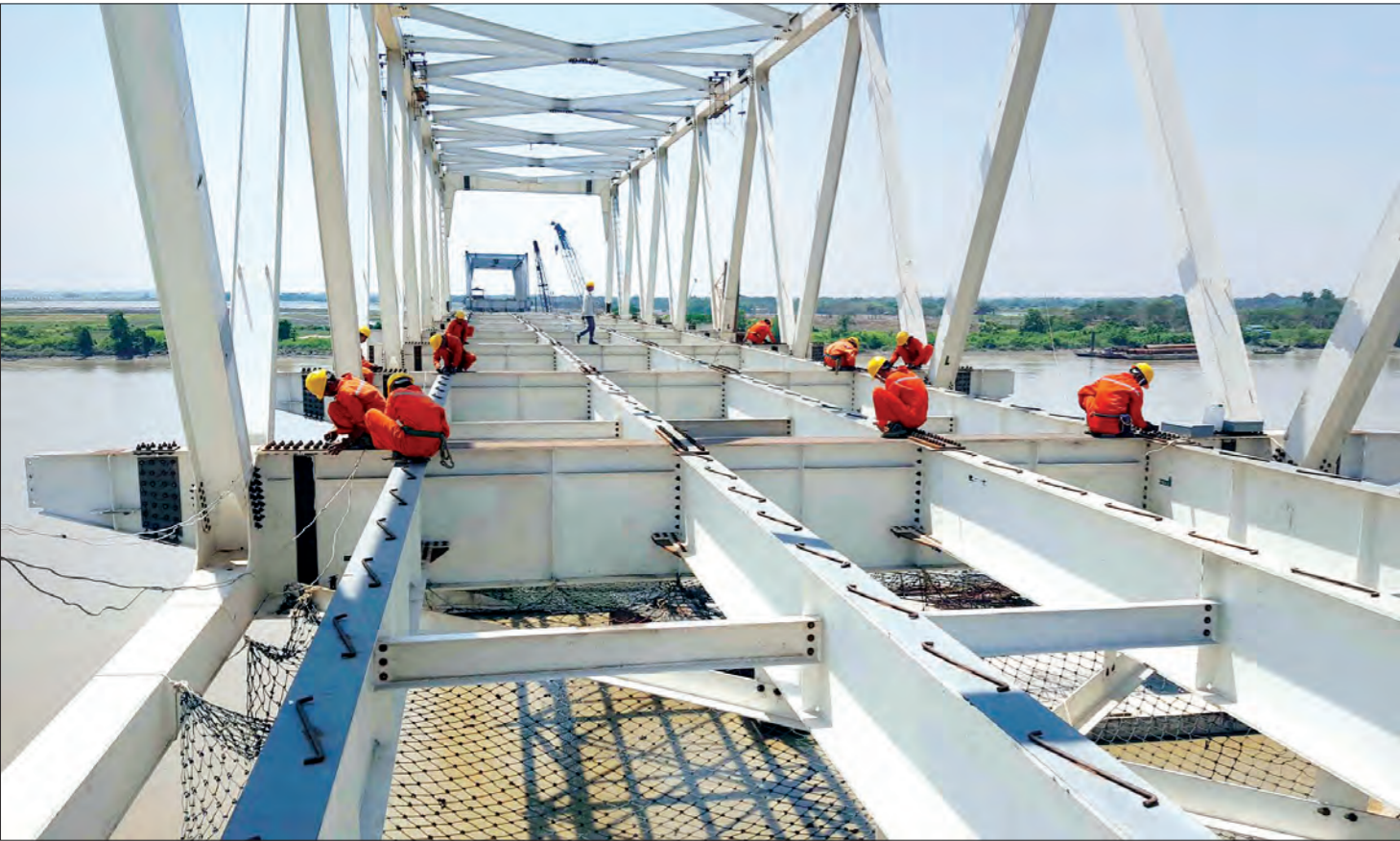
ရန်ကုန်မြောက်ပိုင်းခရိုင် ထန်းတပင်မြို့နယ်ရှိ ကုက္ကိုတံတား ထန်းတပင်ဘက်ကမ်း ချဉ်းကပ်တံတား ရေလယ်တိုင်များတွင် သံပေါင်ရက်မတင်ရန် ဆောက်လုပ်ရေးဝန်ထမ်းများ ဤသို့ဆောင်ရွက် ခဲ့သည်

ရက် ၁၀၀ ကာလအတွင်းတွင် တံတားကြီးများကိုလည်း ကြိုခိုင်မှုစစ်ဆေးသွားမည်ဖြစ်ပြီး ယင်းသို့ ဆောင်ရွက်မည့် အကြောင်းနှင့် စပ်လျဉ်း၍လည်း ပြည်ထောင်စုဝန်ကြီး ဦးဝင်းနိုင် က “ စစ်ဆေးတဲ့အခါမှာလည်း ပုံမှန်စစ်ဆေးတဲ့နည်းတွေလည်း သုံးသလို ခေတ်မီတဲ့နည်းစနစ်တွေလည်း သုံးမယ်။ အခု တံတားတွေစစ်ဖို့အတွက် ခေတ်မီယန္တရားတွေ ဝယ်ထားတာ ရှိပါတယ်။ တံတားအောက်ခြေတွေပါ ပိုမိုပြီးတော့ နစ်မိတာကစ