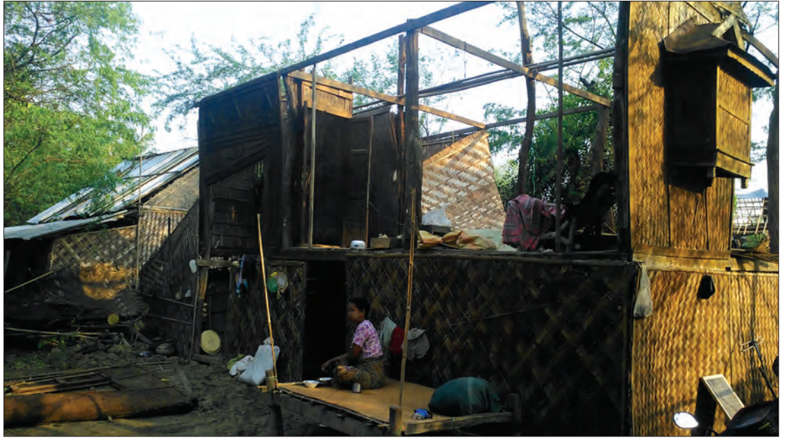
လေပြင်းဒဏ်ကြောင့် ပျက်စီးသွားသော နေအိမ်တစ်အိမ်ကို တွေ့ရစဉ်

ကျောက်စစ်ပုံကျေးရွာတွင် ပြိုလဲပျက်စီးသည့် နေအိမ် ရှစ်လုံးနှင့် အမိုးလန်ပျက်စီးသည့်နေအိမ် အလုံး ၁၀၀ အထိ ရှိခဲ့၍ မင်းဘူးမြို့နယ်တွင် အများဆုံးပျက်စီးခဲ့သည့် ကျေးရွာဖြစ်သည်။ ကျောက်စစ်ပုံကျေးရွာနေ ပြည်သူတစ်ဦးက “လေတိုက်ခတ်တာ ညနေ ၅ နာရီကျော် လောက်က စတိုက်တာ။ မိုးလည်းရွာလာတယ်။ လေကပြင်းလွန်တော့ ရွာအရှေ့ပိုင်းကအိမ်တွေ အများဆုံးပျက်စီးသွားတယ်။ လေတိုက်ချိန် ၁၀ မိနစ်ပဲကြာတယ်။ နွားတင်းကုတ်တွေပြိုကျတော့ နွားအချို့ ထိခိုက်ဒဏ်ရာရတာတွေရှိတယ်။ အသေအပျောက်တွေမရှိပါဘူး” ဟု ပြောသည်။ အဆိုပါ မိုးသက်လေပြင်းတိုက်ခတ်သဖြင့် ပျက်စီးခဲ့သောကျေးရွာများသို့ မြို့နယ်အုပ်ချုပ်ရေးမှူး ဦးဆောင်သော ဌာနဆိုင်ရာများ၊ လူမှုရေး အသင်းအဖွဲ့ဝင်များ၊ မြို့နယ်မီးသတ်တပ်ဖွဲ့ဝင်များက မေ ၁၆ ရက်တွင် သွားရောက်ခဲ့ပြီး ရှင်းလင်းရေးနှင့် လေဘေးသင့်ပြည်သူများ ယာယီနေထိုင် နိုင်ရေးတို့အတွက် ကူညီဆောင်ရွက်ပေးလျက် ရှိကြောင်း သိရသည်။