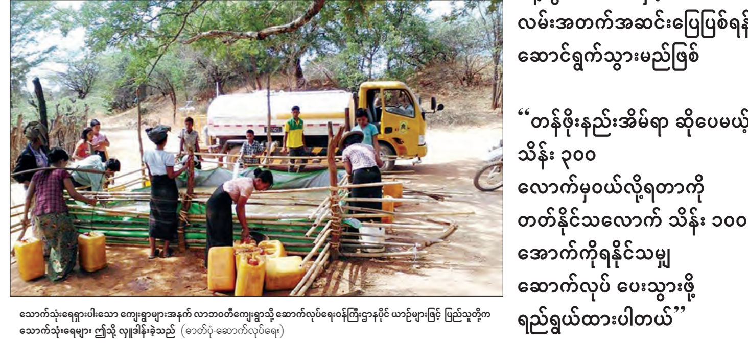
သောက်သုံးရေရှားပါသော ကျေးရွာများအနက် လာဘာတီကျေးရွာသို့ ဆောက်လုပ်ရေးဝန်ကြီးဌာနပိုင် ယာဉ်များဖြင့် ပြည်သူတို့က သောက်သုံးရေများ ဤသို့ လျှောက်ချခဲ့သည်