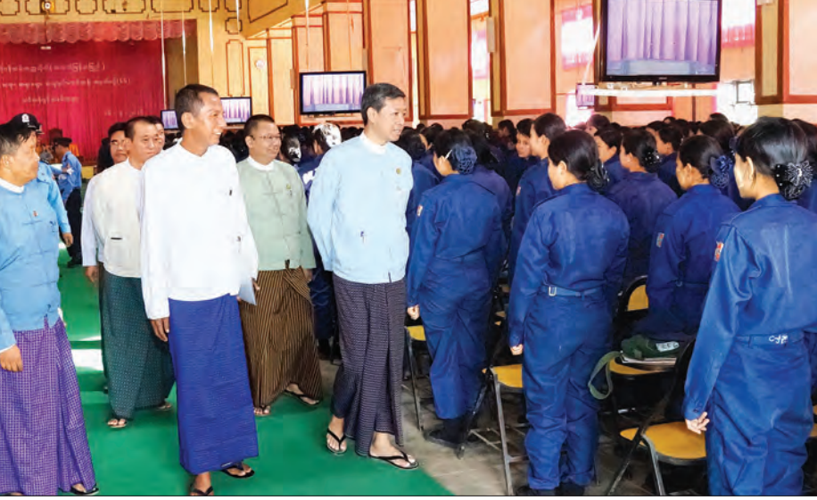
ပညာရေးဝန်ကြီးဌာနအနေဖြင့် ပြည်သူ့ ပြည်သားများ၏ စွမ်းအင်များ၊ အရည် အချင်းများ မြှင့်တင်ပေးနိုင်ရန်အတွက် တန်ဖိုးမြင့်မားသည့် လူသားအရင်းအမြစ် များကို မွေးထုတ်ပေးရမည်ဖြစ်ကြောင်း ယနေ့ နံနက် ၉ နာရီက ဗဟိုဝန်ထမ်း တက္ကသိုလ် (အထက်မြန်မာပြည်)၌ ကျင်းပသည့် အခြေခံပညာ ဆရာ ဆရာမ များ အထူးမွမ်းမံသင်တန်း အမှတ်စဉ် (၆၆)ဖွင့်ပွဲအခမ်းအနားတွင် ပညာရေး ဝန်ကြီးဌာန ပြည်ထောင်စုဝန်ကြီး ဒေါက်တာမျိုးသိမ်းကြီး တက်ရောက် အမှာစကား ပြောကြားသည်။

သားအားလုံး အရည်အသွေးပြည့်ဝသည့် လူစွမ်းအားအရင်းအမြစ်များ ပေါ်ထွန်း လာရန်အတွက် ပညာရေးကဏ္ဍဖွံ့ဖြိုး တိုးတက်အောင် ဆောင်ရွက်ကြရမည် ဖြစ်ကြောင်း။ ပြည်သူ့လူထုကို တင်ပြခဲ့သည့် ပညာရေးမူဝါဒအပေါ် အခြေခံပြီး ရှေးဦးကလေးသူငယ် ပြုစုစောင့်ရှောက် ရေးစီမံကိန်းများကို ရေးဆွဲအကောင် အထည်ဖော် ဆောင်ရွက်သွားမည် ဖြစ်သလို နိုင်ငံသူ နိုင်ငံသားအားလုံး အနည်းဆုံး မူလတန်းပညာကို တတ် မြောက်ပြီး ဆက်လက်ပညာသင်ကြား နိုင်ရေးအတွက် အဆင့်ဆင့်တိုးမြှင့် သင်ယူခွင့်ရရှိအောင် ကြိုးပမ်းဆောင် ရွက်ပေးမည်ဖြစ်ကြောင်း၊ ပညာသင်ယူ ရန်အခက်အခဲရှိသည့် ကာယ၊ ဉာဏစွမ်း ရည် အားနည်းသော ကလေးများနှင့် ဆင်းရဲနွမ်းပါးသောကလေးများ၊ ခက်ခဲ ဝေးလံသည့် ဒေသများမှကလေးများ အတွက် အလေးထားသည့်ပညာရေး အစီစဉ်များကို ဦးစားပေး ဖော်ဆောင်