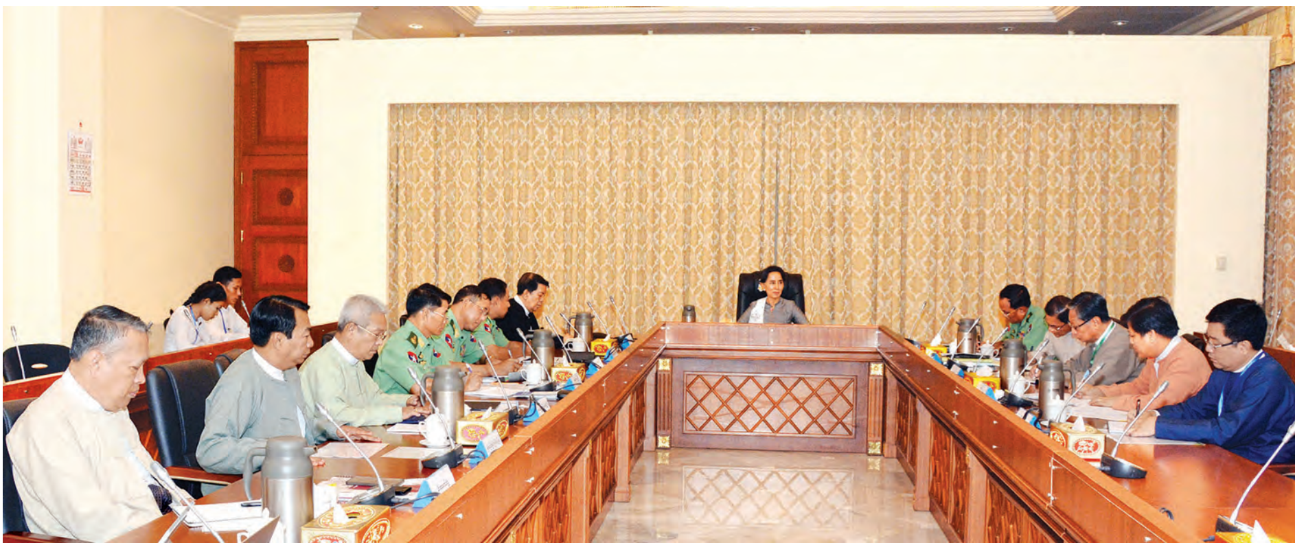
အမျိုးသားရင်ကြားစေ့ရေးနှင့် ငြိမ်းချမ်းရေးဗဟိုဌာန (National Reconciliation and Peace Centre-NRPC) ဖွဲ့စည်းရေးနှင့် နှစ်ဆယ့်တစ်ရာစု ပင်လုံညီလာခံ အကြံပြုဆင်ခြင်ဆိုင်ရာ ညှိနှိုင်းအစည်းအဝေးကျင်းပစဉ် (သတင်းစဉ်)