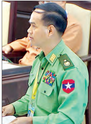
ပြည်ထဲရေးဝန်ကြီးဌာန ဒုတိယဝန်ကြီး ဝိုလ်ချုပ် အောင်စိုး မြေကြားစဉ်

မြေပြင်၌စစ်ဆေးစဉ် ခိုင်မာသည့် သက်သေ အထောက်အထား တစ်စုံ တစ်ရာ သိမ်းဆည်းရမိမှုမရှိခြင်း၊ ပတ် ဝန်းကျင် မျက်မြင်သက်သေ ထွက်ဆိုချက် ရယူနိုင်မှု မရှိခြင်းတို့ကြောင့် သက်ဆိုင် ရာအုပ်ချုပ်ရေး အဖွဲ့အစည်းအနေဖြင့် ပြစ်မှုကြောင်းအရ အရေးယူခြင်းမပြုဘဲ အုပ်ချုပ်ရေးနည်းလမ်းအရ ဆိုင်မိန့် နေရာဖြစ်သူကို သက်ဆိုင်ရာမြို့နယ် အထွေထွေအုပ်ချုပ်ရေး ဦးစီးဌာန၌ ခေါ်ယူ၍ ဝန်ခံကတိပြုသတိပေးမှတ် တမ်းတင် လက်မှတ်ရေးထိုးစေခဲ့ပါ ကြောင်း၊ ထို့ပြင် မြေငှားရမ်းပေးခဲ့သည့် ရန်ကုန်မြို့တော်စည်ပင်သာယာရေး ကော်မတီ ပန်းဥယျာဉ်နှင့် အားကစား