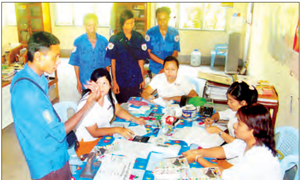
မထသ(ပဟို) ယာဉ်လုပ်သားများ အခြေခံသင်တန်း၌ သင်မောင်းလိုင်စင်များ ထုတ်ပေးစဉ်