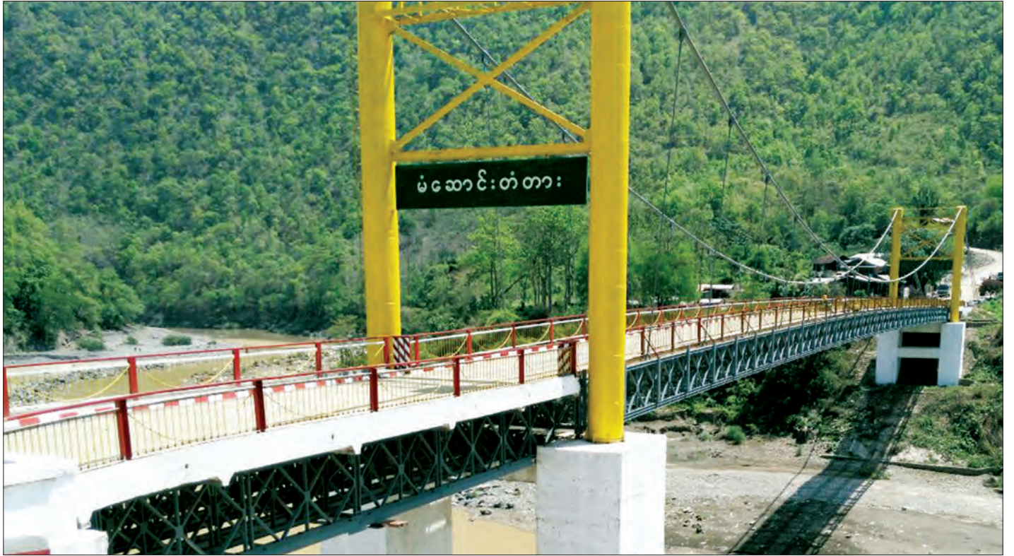
ရာနှုန်း ဆောင်ရွက်ပြီးဖြစ်ပါတယ်။ တံတားတွေ ပြုပြင်ထိန်းသိမ်းခြင်းလုပ်ငန်းတွေကို သတ်မှတ်စံချိန်စံညွှန်းနဲ့ အမိမြစ်ရေး သတ်မှတ်ကာလအတွင်း အမြန်ပြီးစီးရေးကို (မုံရွာ)မှ တာဝန်ရှိသူတစ်ဦးက ပြောသည်။ ရိုးချမ်း-မုံရွာ

ဒါ့အပြင် ချင်းပြည်နယ်က မဲဆောင်းတံတား ရေရှည်တည်တံ့ခိုင်မြဲရေးအတွက် တံတား ဆေးသုတ်တယ်၊ ကွဲအက်နေတဲ့ နေရာတွေကို ဂဟေဆက်တယ်။ ဗားရ်တံတားကိုလည်း ဆေးသုတ်ခြင်းလုပ်ငန်း၊ တောင်ကျရေလှောင်က တံတားတိုင်တွေ၊ သစ်တုံးတွေ တိုက်မိလို့ပွဲထွက်တဲ့ နေရာတွေကို ပြန်လည်ပြုပြင်ခြင်း၊ တံတားအပေါက်တွေ ပြုပြင်ခြင်းလုပ်ငန်း တွေ ၁၀၀