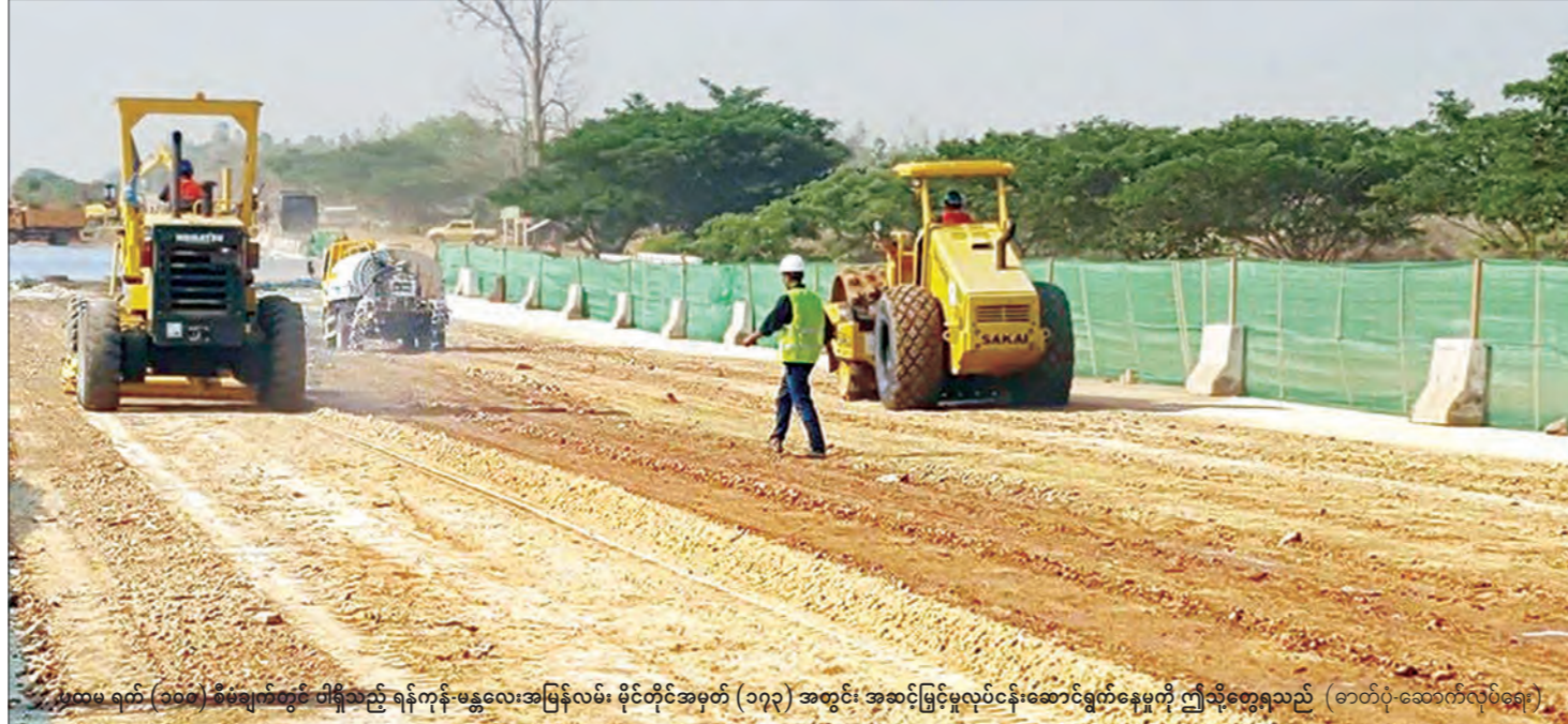
ပထမ ရက် (၁၀၀) စီမံချက်တွင် ပါရှိသည့် ရန်ကုန်-မန္တလေးအမြန်လမ်း မိုင်တိုင်အမှတ် (၁၇၃) အတွင်း အဆင့်မြင့်မူလုပ်ငန်းဆောင်ရွက်နေမှုကို ဤသို့တွေ့ရသည် (ဓာတ်ပုံ-ဆောက်လုပ်ရေး)

ပြည်သူ့အတွက် ပထမ ရက် ၁၀၀ “ပြောင်းလဲချိန်တန်ပြီ” ဟူသော ကြွေးကြော်သံနှင့်အတူ အပြောင်းအလဲကို မျှော်လင့်သော ပြည်သူများက အစိုးရသစ်တစ်ရပ်ကို ဒီမိုကရေစီနည်းကျ ရွေးချယ်တင်မြှောက်ခဲ့ကြသည်။ ပြည်သူက ရွေးချယ်တင်မြှောက်ခြင်းခံရသော ပြည်သူ့အစိုးရများ၏ တာဝန်မှာ ပြည်သူတို့၏ မျှော်လင့်ချက်နှင့် လိုအင်ဆန္ဒများကို ဖြည့်ဆည်းပေးရန် ဖြစ်သည်။ ယင်းအချက်သည် အစိုးရသစ် တိုင်းအတွက် စိန်ခေါ်မှုတစ်ခုလည်း ဖြစ်သည်။ အစိုးရသစ်သည် ယခင်အစိုးရ ဝန်ကြီးဌာနများကို လျှော့တန်လျှော့၊ ပြင်တန်ပြင်၊ ပေါင်းတန်ပေါင်း စသည့်ဖြင့် ပြုလုပ်ကာ ဝန်ကြီးဌာနများကို ကျစ်ကျစ် လျှစ်လျစ်ဖွဲ့စည်း၍ အစပျိုးပြုပြင်ပြောင်းလဲခဲ့သည်။ ပြည်သူက ကြည်ဖြူနေဆဲ အစိုးရသစ်၏ ပထမရက် ၁၀၀ အတွင်း ဆောင်ရွက်ချက်များသည် ယင်းအစိုးရ၏ အရည်အသွေးကို အကဲဖြတ်နိုင်သည့် စံတစ်ခုဖြစ်သည်။ မေ ၁ ရက်မှစတင်သည့် ရက် ၁၀၀ ကာလအတွင်း ဝန်ကြီးဌာနတစ်ခုချင်း အလိုက် ပြည်သူ့အကျိုးအတွက် ဆောင်ရွက်ကြမည့် လုပ်ငန်းများကို သတင်းရယူစုစည်းဖော်ပြ အပ်ပါသည်။