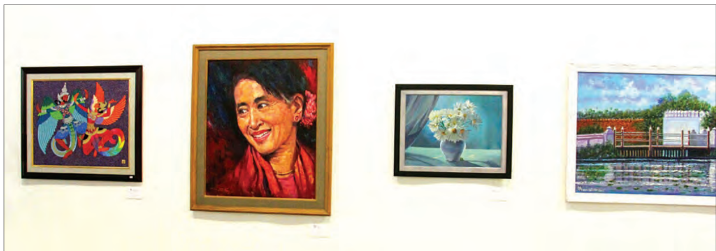
မြန်မာ့အတွင်းပြသထားသည့် ပန်းချီကားများ

ဖြေ။ ။ ကျွန်တော်တို့ စပြီး အစည်းအဝေးလုပ်ကတည်း က ဒီကိစ္စကို အပြတ်လှူမလား၊ ဘယ်လိုပုံစံနဲ့ လှူမလဲဆိုပြီး ကျွန်တော်တို့ စည်းဝေးဆုံးဖြတ်လိုက်တယ်။ တော်တော်များများက ၅၀ ရာခိုင်နှုန်း လှူမယ်ဆိုတဲ့ ဆုံးဖြတ်ချက်ရတယ်။ အဲဒီတော့ ရောင်းရတဲ့ငွေရဲ့ ၅၀ ရာခိုင်နှုန်း သွားလှူမှာပါ။ ရန်ပုံငွေပွဲတွေ တော်တော် များများ အပြတ်လှူကြတာလည်းများတယ်။ လှူကြတဲ့ အခါ ဘယ်လိုဖြစ်မလဲဆိုတော့ ကျွန်တော်အထင် ပန်းချီ ဆရာတွေက အပြတ်လှူကြတဲ့အခါကျတော့ ကိုယ့်မှာ ရှိတဲ့ကား၊ နောက်ပြီးတော့ ကားကောင်းကောင်းတွေ သိပ်မလှူဘူးလေ။ တစ်သိန်း၊ တစ်သိန်းခွဲတန်လေးတွေ ဆိုတော့ အဲဒီမှာ တင်ရတဲ့သူလည်း အရည်အသွေး ကောင်းကောင်း မရဘူး။ ကျွန်တော်တို့က ရတဲ့သူလည်း အရည်အသွေးကောင်းကောင်း ရစေချင်တယ်။ အဲဒါကြောင့် ဗိုလ် အပြတ်မလှူဘူး။ ၅၀ ရာခိုင်နှုန်းလှူမယ်။ အဲဒီ တော့ ဒီပြပွဲမှာရှိတဲ့ ပန်းချီကားတွေကိုလည်း ပန်းချီ ဆရာတွေကိုအသစ်ရေးခိုင်းတယ်။ ကျွန်တော်တို့က ရှိပြီး သားအဟောင်းနဲ့ပြတာကို မလိုချင်ဘူး။ နောက်ပြီး ကျွန်တော်တို့က ဘာဖြစ်ချင်တာလဲဆိုတော့ အခုနေ ရေ