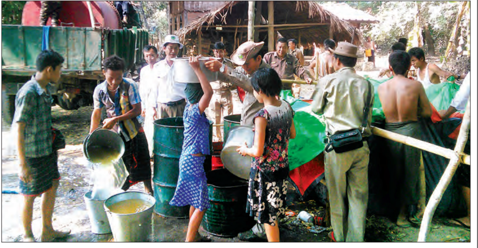
အိမ်ထောင်စု ၁၈၀ လူဦးရေ ငါးရာကျော် သစ်တောဌာနပိုင် မော်တော်ယာဉ် သွားရောက်လှူဒါန်းခဲ့ကြောင်း သိရသည်။ အတွက် သောက်သုံးရေများအား များဖြင့် ရေဂါလန်နှစ်ထောင်ကျော် ကို