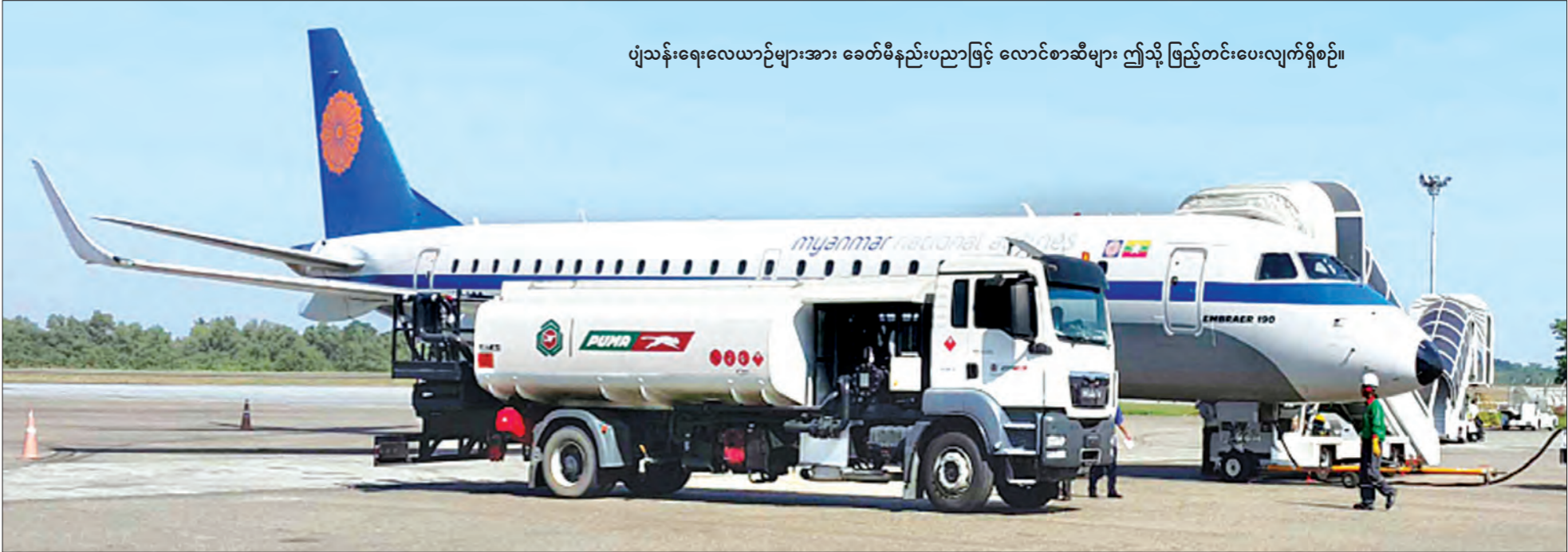
ပျံသန်းရေးလေယာဉ်များအား ခေတ်မီနည်းပညာဖြင့် လောင်စာဆီများ ဤသို့ ဖြည့်တင်းပေးလျက်ရှိစဉ်။

“ပြောင်းလဲချိန်တန်ပြီ” ဟူသော ကြွေးကြော်သံနှင့်အတူ အပြောင်းအလဲကို မျှော်လင့်သော ပြည်သူများက အစိုးရသစ်တစ်ရပ်ကို ဒီမိုကရေစီနည်းကျ ရွေးချယ်တင်မြှောက်ခဲ့ကြသည်။ မိမိတို့အား ရွေးချယ်တင်မြှောက်ခြင်းခံရသော ပြည်သူ့အစိုးရများ၏ တာဝန်မှာ ပြည်သူတို့၏ မျှော်လင့်ချက်နှင့် လိုအင်ဆန္ဒများကို ဖြည့်ဆည်းပေးရန် ဖြစ်သည်။ ယင်းအချက်သည် အစိုးရသစ်တိုင်းအတွက် စိန်ခေါ်မှုတစ်ခုပင် ဖြစ်သည်။ အစိုးရသစ်သည် ယခင်အစိုးရ ဝန်ကြီးဌာနများကို လျှော့တန်လျှော့၊ ပြင်တန်ပြင်၊ ပေါင်းတန်ပေါင်း စသည်ဖြင့် ပြုလုပ်ကာ ဝန်ကြီးဌာနများကို ကျစ်ကျစ်လျစ်လျစ်ဖွဲ့စည်း၍ အစပျိုးပြုပြင်ပြောင်းလဲ ပြုခဲ့သည်။ ပြည်သူက ကြည်ဖြူနေဆဲ အစိုးရသစ်၏ ပထမရက် ၁၀၀ အတွင်း ဆောင်ရွက်ချက်များသည် ယင်းအစိုးရ၏ အရည်အသွေးကို အကဲဖြတ်နိုင်သည့် စံတစ်ခုဖြစ်သည်ဟု ဆိုထားရာ “လျှပ်စစ်နှင့်စွမ်းအင်ဝန်ကြီးဌာန” နှင့်စပ်လျဉ်း၍ မြန်မာ့အလင်း သတင်းအဖွဲ့တို့ သတင်းဆောင်းပါးကို တင်ပြအပ်ပါသည်။