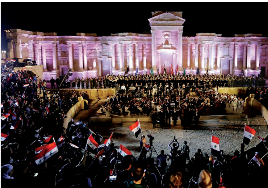
များ ဆေးရုံဝင်းကို ဝင်ရောက်စီးနင်းခဲ့စဉ်က ဆီးရီးယားတပ်ဖွဲ့ဝင် ၂၆ ဦးသေဆုံးခဲ့ကြောင်း ဗြိတိန်အခြေစိုက် စောင့်ကြည့်ရေး အဖွဲ့က ပြောသည်။ ဆင်ယာ

ဆီးရီးယားတပ်ဖွဲ့နှင့် အိုင်အက်စ် စစ်သွေးကြွများကြား စနေနေ့ နံနက် ပိုင်းက တိုက်ပွဲများ အပြင်းအထန် ဖြစ်ပွားခဲ့သည်။ အိုင်အက်စ်စစ်သွေးကြွ