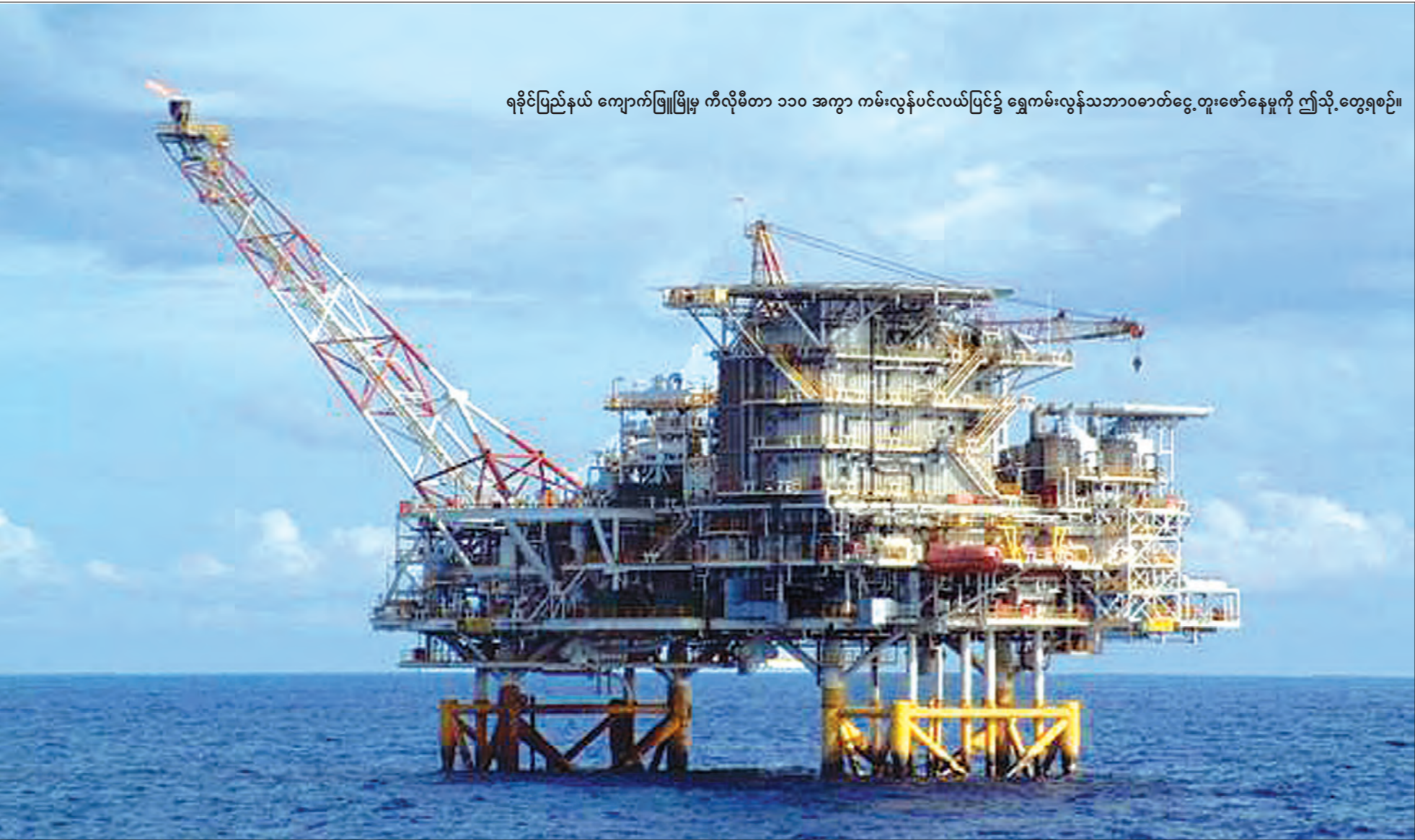
ရခိုင်ပြည်နယ် ကျောက်ဖြူမြို့မှ ကီလိုမီတာ ၁၁၀ အကွာ ကမ်းလွန်ပင်လယ်ပြင်၌ ရွှေကမ်းလွန်သဘာဝဓာတ်ငွေ့ တူးဖော်နေမှုကို ဤသို့ တွေ့ရစဉ်။

သတင်းဆောင်းပါး - မေဦးမိုး၊ ဓာတ်ပုံ-လျှပ်စစ်နှင့်စွမ်းအင်