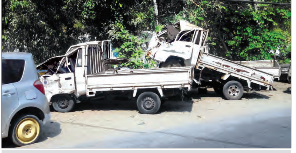
ယာဉ်တိုက်မှုဖြစ်ပွားသည့် မော်တော်ယာဉ်များအား သိမ်းဆည်းထားသည်ကို တွေ့ရစဉ်

ယင်းယာဉ်မတော်တဆမှုများတွင် မူးယစ်ရမ်းကားမောင်းနှင်မှုကြောင့် ၂၄ မှု၊ မဆင်မခြင်မောင်းနှင်မှုကြောင့် ၄၈၄ မှု၊ လမ်းစည်းကမ်းဖောက်ဖျက်မှုကြောင့် ၁၉၇ မှု၊ ယာဉ်မောင်းမကျွမ်းကျင်မှုကြောင့် ၉၂ မှု၊ ဝေပုံမကျောင့် ၅၂ မှု၊ သက်ငယ်