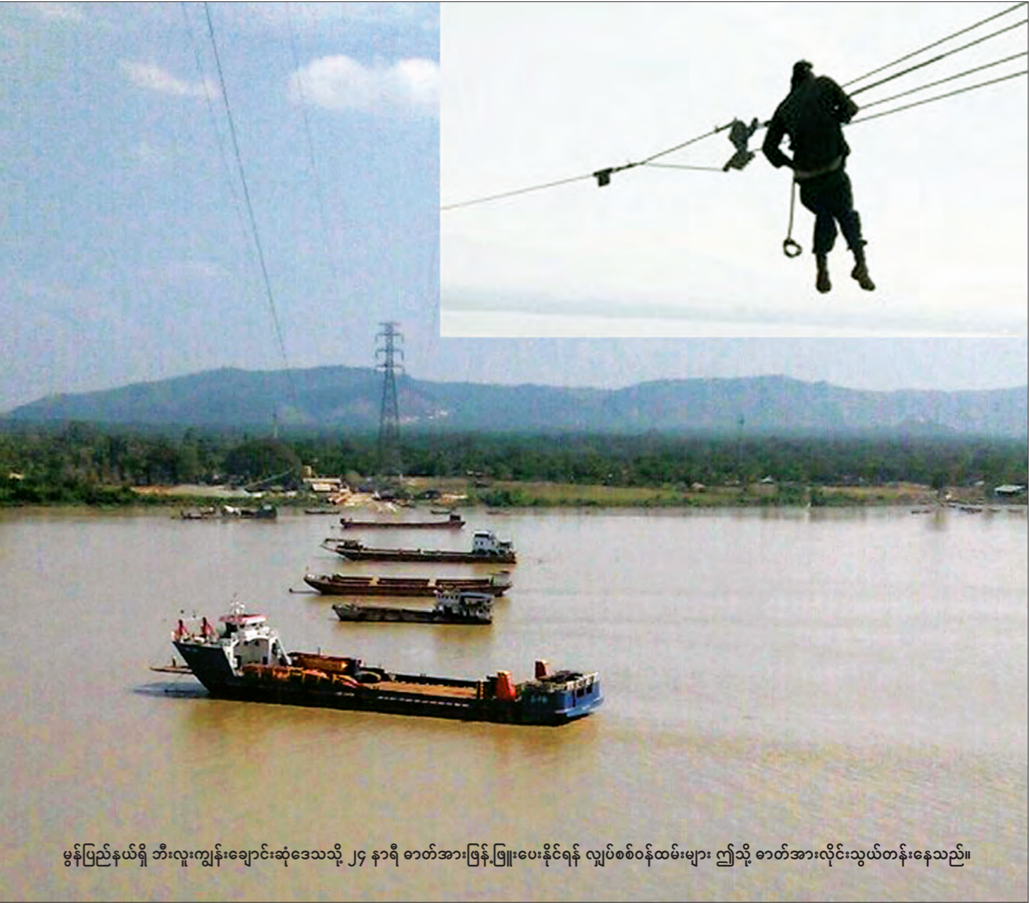
မွန်ပြည်နယ်ရှိ တီးလူးကျွန်းချောင်းဆုံဒေသသို့ ၂၄ နာရီ ဓာတ်အားဖြန့်ဖြူးပေးနိုင်ရန် လျှပ်စစ်ဝန်ထမ်းများ ဤသို့ ဓာတ်အားလိုင်းသွယ်တန်းနေသည်။

ပျောက်ဆုံးတာတွေ၊ လျော့နည်းတာတွေကို သွယ်တန်းပေးတဲ့ ပိုက်တွေ ပြင်ဆင်တပ်ဆင်မယ်။ တည်ငြိမ်တဲ့ မိုအားနဲ့ ဖြန့်နိုင်အောင်လုပ်ဆောင်မယ်။ ဝန်ထမ်းတွေအားလုံးလည်း မရပ်မနား အလုပ်လုပ်နေကြတာကို မြင်ရမှာပါ။ ရက်ပေါင်း ၁၀၀ အတွင်း အဓိကအနေနဲ့ မေလ ၁၈ ရက်နေ့တွင် မော်လမြိုင်သဘာဝဓာတ်ငွေ့သုံး ဓာတ်အားပေးစက်ရုံမှာရှိတဲ့ စွန့်ပစ်အပူသုံး ဓာတ်အားပေးစက်ကနေ ၃၀ မဂ္ဂါဝပ်နဲ့ မေလ ၃၀ ရက်နေ့၌ မြင်းမြဲသဘာဝဓာတ်ငွေ့သုံး ဓာတ်အားပေးစက်ကနေ ၁၃၃ မဂ္ဂါဝပ် ထုတ်ပေးနိုင်မယ်” ဟု ပြည်ထောင်စုဝန်ကြီးက လျှပ်စစ်ဓာတ်အား ထုတ်လုပ်ရေးအတွက် ရက်ပေါင်း ၁၀၀ အတွင်း ဆောင်ရွက်မှုကို ရှင်းပြသည်။ ထို့ပြင် ဓာတ်အားပိုလွှတ်ရေးအနေဖြင့် ၆၆ ကေပွီ ဟားခါး-ဇလမ်း ဓာတ်အားလိုင်း ဇလမ်းဓာတ်အားခွဲရုံလုပ်ငန်း၊ တောင်ကုတ်-မအီ ဓာတ်အားလိုင်း မအီဓာတ်အားခွဲရုံ လုပ်ငန်း၊ ကျောက်ဖြူ ဓာတ်အားခွဲရုံမှ ကျောက်ဖြူ SEZ သို့ ဓာတ်အားလိုင်းနှင့် ဓာတ်အားခွဲရုံများကို ရက်ပေါင်း ၁၀၀ အတွင်း ပြီးစီးနိုင်ရေး ဆောင်ရွက်နေသည့်အပြင် ၂၃၀ ကေပွီ မန်း-အိမ် ဓာတ်အားလိုင်း လုပ်ငန်းကိုလည်း အရှိန်အဟုန်ဖြင့်ကာ အမြန်ဆုံးပြီးစီးနိုင်ရေး ဆောင်ရွက်နေကြောင်းသိရသည်။