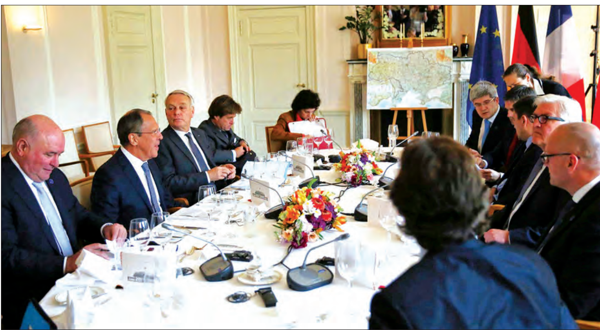
ရုရှား၊ ပြင်သစ်၊ ယူကရိန်းနှင့် ဂျာမနီ နိုင်ငံခြားရေးဝန်ကြီးများ ဘာလင်မြို့၌ မေ ၁၁ ရက်က ဆွေးနွေးစဉ်