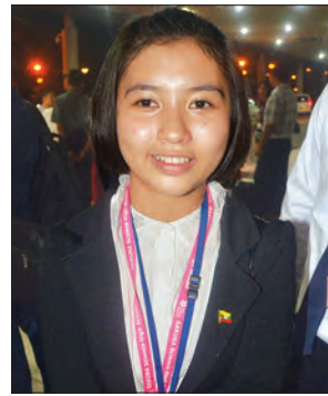
မဖူးပွင့်ခိုင်

အထက်ကရ တက္ကသိုလ်တွေမှာ သိပ္ပံနည်းပညာတွေနဲ့ ပတ်သက်ပြီး လေ့လာရေးလုပ်ရတယ်။ ပြီးတော့ နိဘယ်ဆုရှင်တွေရဲ့ ဟောပြောချက်တွေကို နားထောင်ရတယ်။ လက်တွေ့လုပ်ဆောင်ချက်တွေ လုပ်ခဲ့ရပါတယ်။ ဂျပန်နိုင်ငံက အဆင့်မီ သိပ္ပံနည်းပညာတွေကို လေ့လာခွင့်ရခဲ့တယ်။ ကလေးတွေကတော့ သူတို့ပါသနာပါတဲ့ ပညာရပ်တွေကို လေ့လာခွင့်ရတဲ့အတွက် ပျော်နေကြတယ်။ အဲဒီလိုတက္ကသိုလ်မှာ တက်ချင်တဲ့စိတ်တွေ ပေါ်နေကြတယ်။ ကျွန်တော်တို့ နိုင်ငံအနေနဲ့ ကျောင်းသားကျောင်းသူတွေကို ဒီလိုအစီအစဉ်မျိုး များများလုပ်ပေးဖို့လိုတယ်။ အတွေ့အကြုံအသစ်တွေက သူတို့လေးတွေ ကြိုးစားချင်စိတ် ပိုဖြစ်လာစေမယ်။ နိုင်ငံတကာရဲ့ ပညာရေးတွေကိုလည်း သိရှိခွင့်ရပြီး ပညာရေးပိုင်းမှာ ပိုပြီး အမြင်ကျယ်လာစေမှာပါ။