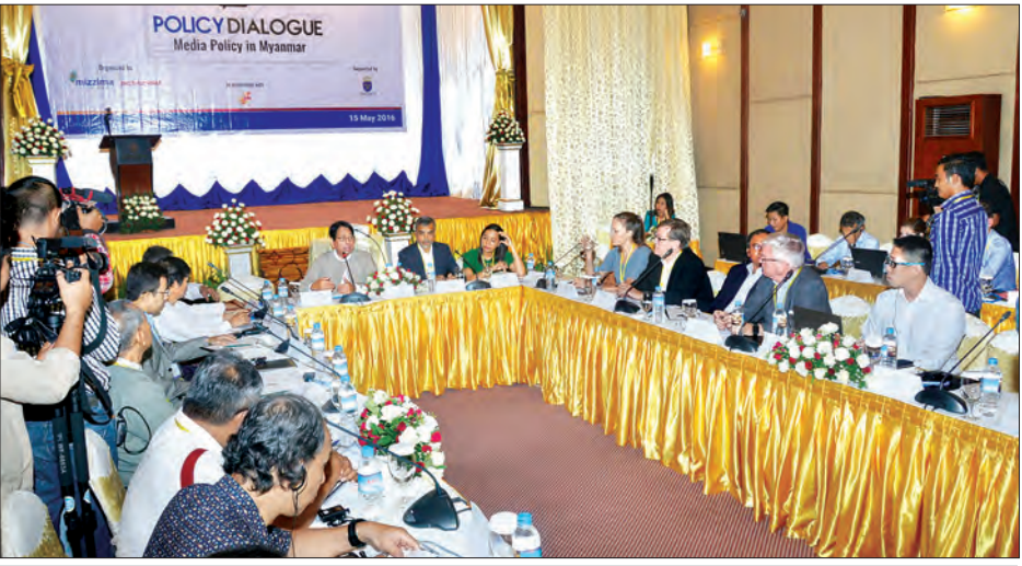
ဒုတိယအကြိမ် မြန်မာ့မီဒီယာမူဝါဒဆိုင်ရာ Policy Dialogue ဆွေးနွေးပွဲ ကျင်းပစဉ်

ပြည်သူ့အစိုးရအကြား ဆက်သွယ်ရေးလမ်းကြောင်းအဖြစ် အသုံးပြုနေတာဖြစ်ပါတယ်။ အစိုးရသစ်ရဲ့ ရပ်တည်ပုံသဘောထားကို ဖော်ပြချင်ပါတယ်။ ပြည်သူ့ကို မျက်နှာမူဖို့ဆိုတဲ့အချက်ကို ဖြစ်ပါတယ်။ ပြည်သူရဲ့ ပြောဆိုချက်တွေကို နားထောင်မှတ်သားရပါတယ်။ ပြည်သူက မေးမြန်းလာတာတွေနဲ့ ဝေဖန်ထောက်ပြတာတွေကို ရှင်းလင်းဖြေကြားဖို့၊ မေးမြန်းချက်နဲ့ ဝေဖန်ထောက်ပြတာတွေကို နားထောင်ပြီး ပြုပြင်မှုတွေလုပ်ဆောင်ရမှာ ဖြစ်ပါတယ်။ ပြည်သူရဲ့ သဘောထားတွေကို လွှတ်တော်များ၊ အစိုးရများက ပြည်သူ့ဆန္ဒကို အကောင်အထည်ဖော်ပေးတာနဲ့ ပိုပြီးဖွံ့ဖြိုးတိုးတက်လာမယ်။ ပြည်သူ့မျက်နှာမူတဲ့ မီဒီယာမျိုးဖြစ်အောင် ကြိုးပမ်းဆောင်ရွက်နေပါတယ်”ဟု ပြောသည်။ ယနေ့ကျင်းပသည့် “Policy Dialogue” မြန်မာနိုင်ငံ၏ မီဒီယာဖွံ့ဖြိုးတိုးတက်မှု နိုင်ငံပိုင်မီဒီယာများ၏ အကူအပြောင်၊ မြန်မာနိုင်ငံရှိ ရုပ်သံ၊ ရေဒီယိုမီဒီယာလုပ်ငန်းဟူသည့် ကဏ္ဍသုံးခုအတွက် အဓိကထားပြီး ဆွေးနွေးခဲ့ခြင်းဖြစ်သည်။ တိုင်းရင်းသားမီဒီယာများ၏ လက်ရှိအခြေအနေများ