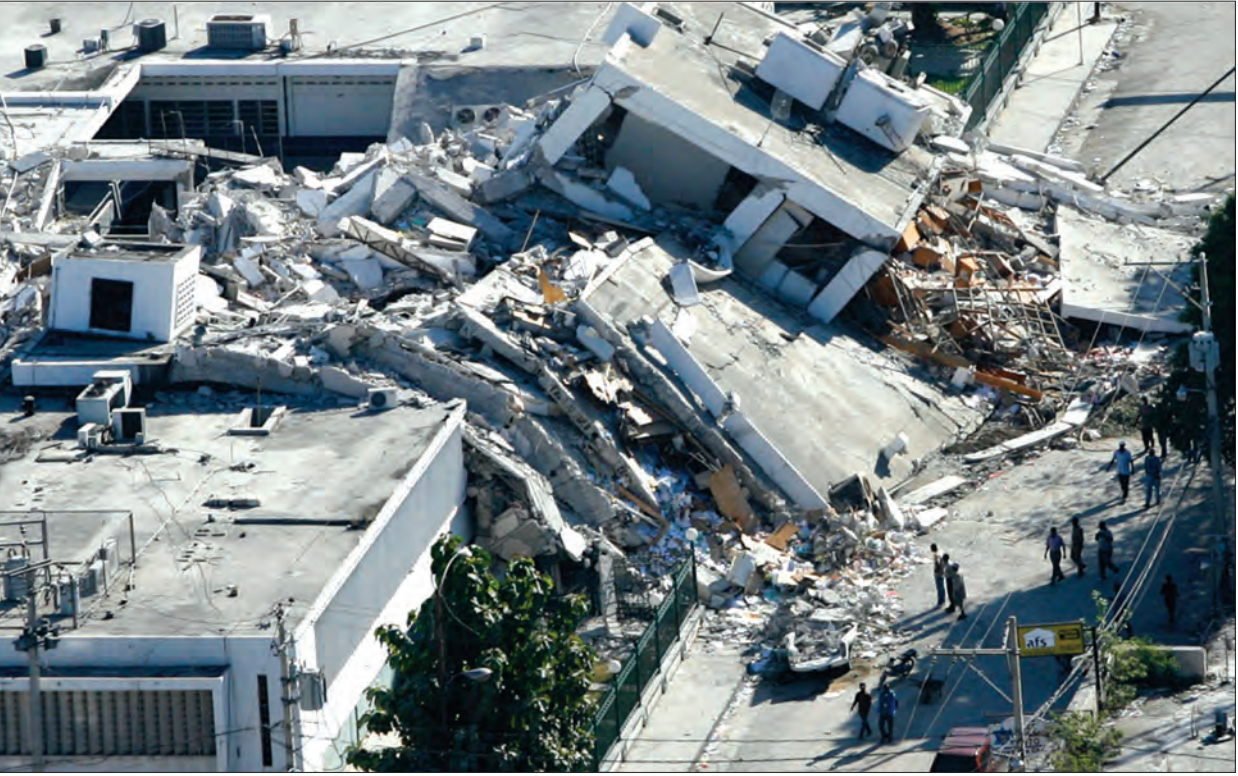
၂၀၁၀ ခုနှစ်က လှုပ်ခတ်ခဲ့သော ဟေတီငလျင်ကြောင့် ပျက်စီးသွားသည့် အဆောက်အအုံများ။

ကမ္ဘာပေါ်ရှိ ပြတ်ရွေ့ကြောင်းကြီးများအနက် San Andreas Fault သည် အလွန်ထင်ရှားသော ကမ္ဘာသို့ ပြတ်ရွေ့ကြောင်းကြီးဖြစ်သည်။ ယင်းပြတ်ရွေ့ကြောင်းသည် အမေရိကန်ပြည်ထောင်စု အနောက်ဘက်ကမ်းခြေရှိ ကယ်လီဖိုးနီးယားပြည်နယ် အတွင်း၌တည်ရှိသည်။ ကယ်လီဖိုးနီးယားပြည်နယ်ကြီးသည် ကျောက်ချပ်လွှာကြီး နှစ်ခုပေါ်၌ ရွေ့လျက်တည်ရှိနေသည်။ ပစ်ဖိတ်ကျောက်ချပ်လွှာပေါ်၌ တစ်စိတ်တစ်ပိုင်းတည်ရှိနေပြီး မြောက်အမေရိကကျောက်ချပ်လွှာပေါ်၌ ကျန်အစိတ်အပိုင်းက တည်ရှိနေသည်။ ကယ်လီဖိုးနီးယားပြည်နယ်ကို ဆန်အန်ဒရီးစ်ပြတ်ရွေ့ကြောင်းကြီးက ပိုင်းခြားထားလျက်ရှိသည်။