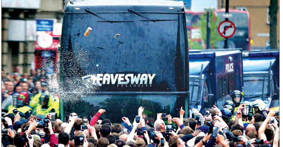
မန်ယူအသင်းသားများ စီးလာသော ယာဉ်အား ဝက်စ်ဟမ်းပရိသတ်များ ဟန့်တားနှောင့်ယှက်စဉ်