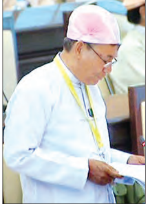
ပြည်ထောင်စုဝန်ကြီး ဦးအုန်းဝင်း ဖြေကြားစဉ်

လုံးခင်း၊ ဖားကန့် ရတနာနယ်မြေရှိ ကျောက်စိမ်းရိုင်း သယ်ယူပို့ဆောင်ရေး သားစဉ်မြေးဆက် အသုံးပြုနိုင်ရေး၊ အတိုင်းအဆမဲ့ ကျောက်စိမ်းတူးဖော်မှု မရှိစေရေး၊ မြေစာပုံ ပြိုကျပြီး မြေစာပိသည့် ဖြစ်စဉ်များ ဖြစ်ပွားမှုမရှိစေရန်နှင့် သဘာဝပတ်ဝန်းကျင်ထိခိုက်ပျက်စီးမှု မရှိစေရန်အတွက် ဝန်ကြီးဌာနအနေဖြင့် ဥပဒေနှင့်အညီ အစီအမံများရေးဆွဲ၍ အလေးထား ဆောင်ရွက်လျက်ရှိပါကြောင်း သယ်ယူပို့ဆောင်သည့် သဘာဝပတ်ဝန်းကျင် ထိန်းသိမ်းရေး ဝန်ကြီးဌာန ပြည်ထောင်စုဝန်ကြီး ဦးအုန်းဝင်းက မေ ၁၁ ရက်တွင် ကျင်းပသည့် ဒုတိယအကြိမ် အမျိုးသားလွှတ်တော် ပထမပုံမှန်အစည်းအဝေး ၂၅ ရက်မြောက်နေ့တွင် ကချင်ပြည်နယ် မဲဆန္ဒနယ်အမှတ်(၉)မှ ဦးခင်မောင်မြင့်၏ မေးခွန်းနှင့်စပ်လျဉ်း၍ ဖြေကြားသည်။