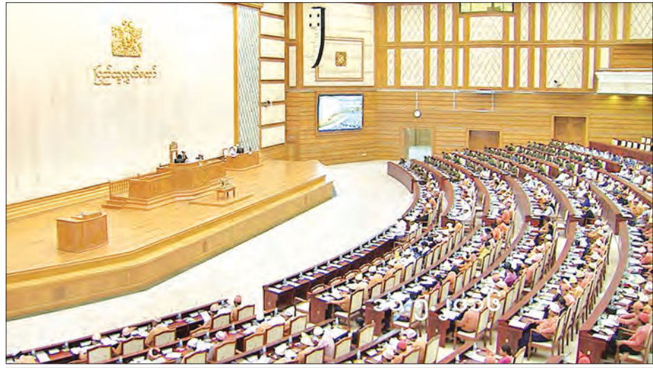
ဒုတိယအကြိမ် ပြည်သူ့လွှတ်တော် ပထမပုံမှန်အစည်းအဝေး ၂၅ ရက်မြောက်နေ့ ကျင်းပစဉ်

ဒုတိယဝန်ကြီးက ၂၀၁၅ ခုနှစ် ဧူလိုင်လလယ်ခန့်မှစ၍ မိုးရေချိန်စုံမျှန်သစ်ရွာသွန်းခြင်း၊ ဆိုင်ကလုန်းမုန်တိုင်း (ကိုမန်)၏ အရှိန်ကြောင့် မြန်မာနိုင်ငံ အနှံ့အပြားတွင် မိုးသည်ထန်စွာရွာသွန်းခြင်းများဖြစ်ပေါ်ခဲ့သဖြင့် မိုးညိုမြို့နယ်ရှိ ဧရာဝတီမြစ် အရှေ့ဘက် ကမ်းတာသည် စိုးရိမ်ရေမှတ်အထက် ငါးပေခန့် ကျော်လွန်မြင့်တက်ခဲ့ပြီး တာတစ်တွင် ထူးပေါက်များပေါက်ခြင်း၊ တာအိတာလျှော့ခြင်း၊ တာပေါ်ရေကျော်ခြင်းများ ဖြစ်ပေါ်ခဲ့ကြောင်း၊ ထို့အတူ ဧရာဝတီမြစ်၏ မြစ်ခွဲတစ်ခုဖြစ်သော မြစ်မခမြစ်၏ အနောက်ဘက် ကမ်းနှင့် အရှေ့ဘက်ကမ်းမှ ရေတေးကာကွယ်ရေးတာများတွင်လည်း မြစ်ရေမှတ်များမှာ စိုးရိမ်ရေမှတ်များထက် ပိုမိုကျော်လွန် မြင့်တက်ခဲ့သဖြင့် အရေးပေါ် ရေတေးကာကွယ်ရေးလုပ်ငန်းများ ဆောင်ရွက်ခဲ့ကြောင်း၊ ရေတေးကာကွယ်ခြင်းလုပ်ငန်းများ ဆောင်ရွက်သော်လည်း မြစ်မခအနောက်