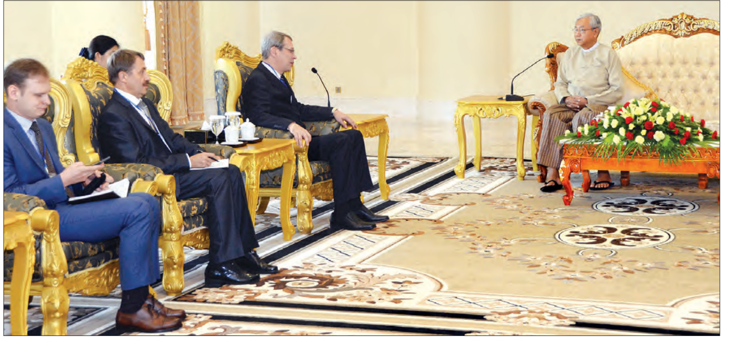
နိုင်ငံတော်သမ္မတ ဦးထင်ကျော် ရုရှားသံအမတ်ကြီး မစ္စတာ ဟစ်လီ ဘီ ပေါ့စ်ပီ လော့ဗ်နှင့် အဖွဲ့အား လက်ခံတွေ့ဆုံစဉ်