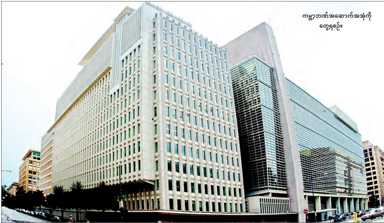
ကမ္ဘာ့ဘဏ်အဆောက်အအုံကို တွေ့ရစဉ်။

ကြာသပတေးနေ့နံနက်တွင် ကမ္ဘာ့ထိပ်တန်းပုဂ္ဂိုလ်များ ရောက်လာကြပေတော့မည်။ ဝါရှင်တန်မှ အမေရိကန်နိုင်ငံခြားရေးဝန်ကြီး ရွှန်ကယ်ရီနှင့် အခြားအရေးကြီးပုဂ္ဂိုလ်များဖြစ်သည် (အိုင်အမ်အက်စ်)မှ အကြီးအကဲ၊ (ကမ္ဘာ့ဘဏ်)မှ အကြီးအကဲတို့သည် ဝါရှင်တန်မှ တဖွဲဖွဲဆိုင်ဆိုင်ရောက်လာတော့မည်ဖြစ်သည်။ ဖိဖာနှင့် ယူအီးအက်စ်အေတို့ကလည်း ၎င်းတို့၏ ပျူရီကရက်အရာရှိများကို စေလွှတ်လိုက်မည်ဖြစ်ကြောင်း သိရသည်။ စီးပွားရေးထိပ်သီးခေါင်းဆောင်များသည် ၎င်းတို့၏နောက်လိုက်များနှင့်အတူ လာရောက်စုရုံးကြမည်ဖြစ်သည်။ ၎င်းတို့အားလုံး ခမ်းနားထည်ဝါလှသော လန်ဒန်မြို့တော် အဆောက်အအုံတွင် ဒေပစ်ကင်မရွန်းအပါအဝင် နိုင်ငံပေါင်း ၄၀ မှခေါင်းဆောင်များနှင့် လာရောက်တွေ့ဆုံကြခြင်းဖြစ်ပြီး အလွန်တရာကြီးကျယ်စွာထွေးသော စကားစစ်ပွဲကြီးတွင် ပါဝင်ဆွေးနွေးနေကြခြင်းဖြစ်သည်။ အဆိုပါစကားစစ်ပွဲကြီးမှာ ဟောင်းမသွားနိုင်သည့် ကမ္ဘာ့အရင်းရှင်စနစ်အကြောင်းဖြစ်ပြီး တစ်နေ့နီးပါးကြာမြင့်ခဲ့သည်။ ထို့အပြင် ယင်းဆွေးနွေးပွဲသည် ကမ္ဘာ့အကျင့်ပျက်ခြစားမှု တိုက်ဖျက်ရေးဆွေးနွေးပွဲကို ဦးတည်ဆွေးနွေးခြင်းပင်ဖြစ်ပြီး ကင်မရွန်းက ပထမဆုံးအကြိမ်ကျင်းပသည့် ယင်းဆွေးနွေးပွဲတွင် “အကျင့်ပျက်ခြစားမှုက လုပ်ငန်းခွင်ကိုဖျက်ဆီးပြီး ဆင်းရဲတွင်းသို့တွန်းပို့နေသည့် ထောင်ချောက်ဖြစ်ကာ ပြည်သူလူထုကို အကြမ်းဖက်အုပ်စုအသွင်ဖြစ်ပေါ်စေရုံသာမက ယင်းအကျိုးဆက်ကြောင့် လုံခြုံရေးဆိုင်ရာအောက်ခြေလှိုက်စားပြီး ယိုင်နဲ့မှုကိုပါ ဖြစ်ပေါ်စေနိုင်ကြောင်း” ပြောခဲ့သည်။