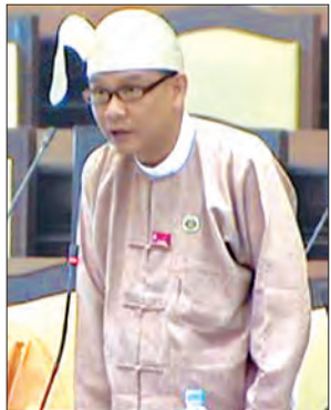
ရန်ကုန်တိုင်းဒေသကြီး မဲဆန္ဒနယ် အမှတ်(၃)မှ ဒေါက်တာမြတ်ဉာဏစိုး

အစီရင်ခံစာ၌ တည်ဆဲငြိမ်းချမ်းစွာ စုဝေးခွင့်နှင့် ငြိမ်းချမ်းစွာစီတန်းလှည့်လည်ခွင့်ဆိုင်ရာဥပဒေတွင် ငြိမ်းချမ်းစွာစုဝေးခွင့်နှင့် ငြိမ်းချမ်းစွာစီတန်းလှည့်လည်ခွင့် ပြုလုပ်လိုပါက သက်ဆိုင်ရာ မြို့နယ်ရဲစခန်းသို့ ခွင့်ပြုချက် တင်ပြ တောင်းခံပြီး ခွင့်ပြုချက်ရရှိမှသာ ငြိမ်းချမ်းစွာစုဝေးခြင်းနှင့် ငြိမ်းချမ်းစွာ စီတန်းလှည့်လည်ခြင်းကို ဆောင်ရွက် နိုင်မည်ဖြစ်ကြောင်း၊ ၂၀၀၈ ခုနှစ် ဖွဲ့စည်းပုံ အခြေခံဥပဒေ ပုဒ်မ ၃၄၇ အရ ငြိမ်းချမ်းစွာစုဝေးခွင့်နှင့် ငြိမ်းချမ်းစွာစီတန်းလှည့်လည်ခွင့်သည် နိုင်ငံသားတို့၏ မူလအခွင့်အရေး ဖြစ်သည်နှင့်အညီ မိမိတို့၏ အခွင့်အရေးကို လွတ်လပ်စွာ ဆောင်ရွက်နိုင်ရန်အတွက် ပြင်ဆင်သည့် ဥပဒေ၏ အပိုဒ် ၂၊ အပိုဒ်ခွဲ(က)တွင်