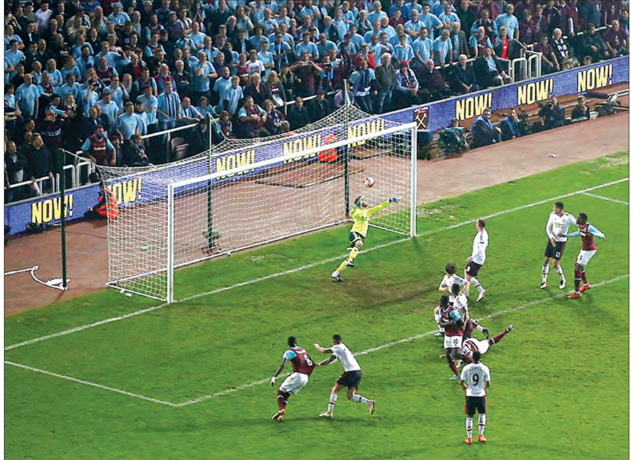
ဝက်စ်ဟမ်းအသင်းအတွက် အနိုင်ဂိုးကို ဝင်စတန်ရိုက် ခေါင်းတိုက်သွင်းယူစဉ်

အင်္ဂလန်ပရီမီယာလိဂ် ပွဲကျန် ပွဲစဉ် တစ်ပွဲဖြစ်သော ဝက်စ်ဟမ်းနှင့် မန်ယူအသင်းတို့သည် မေ ၁၁ ရက် နံနက်ပိုင်းက ယှဉ်ပြိုင်ကစားခဲ့ရာ အိမ်ရှင် ဝက်စ်ဟမ်းအသင်း သုံးဂိုး-နှစ်ဂိုးဖြင့် အနိုင်ရရှိခဲ့သည်။ ယင်းပွဲတွင် ဝက်စ်ဟမ်းအသင်းသည် ၄-၄-၂ ပုံစံဖြင့် တိုက်စစ်ပိုင်းတွင် ဆာခိုနှင့် ကာရိုးလ်တို့ကို ထားရှိခဲ့ပြီး ဧည့်သည်မန်ယူအသင်းသည် ၄-၀-၄-၁ ကစားကွက်ဖြင့် လူငယ်ကစားသမား ရက်ချီဖိုဒ်ကို အထောက်အပံ့ပေးပေးခဲ့သည်။ ပွဲချိန် ၁၀ မိနစ်တွင် တိုက်စစ်မှူး ဆာခို၏သွင်းဂိုးဖြင့် ဝက်စ်ဟမ်းအသင်း ဦးဆောင်ဂိုးရရှိခဲ့သည်။ ဒုတိယပိုင်း ၅၁ မိနစ်တွင် မာရှယ်က မန်ယူအတွက် ချေပဂိုးသွင်းယူခဲ့ပြီး ၇၂ မိနစ်တွင် မာရှယ်က ထပ်မံသွင်းယူခဲ့ရာ မန်ယူအသင်း ဦးဆောင်ဂိုးပြန်လည်ရရှိခဲ့သည်။ ပွဲချိန် ၇၆ မိနစ်တွင် နောက်တန်းကစားသမား အန်တိုနီအို ခေါင်းတိုက်သွင်းယူခဲ့၍ အိမ်ရှင်ဝက်စ်ဟမ်းအသင်း ချေပဂိုး ပြန်လည်ရရှိခဲ့သည်။ အိမ်ရှင်ဝက်စ်ဟမ်း အတွက်အဖိုးတန်အနိုင်ဂိုးကို ပွဲချိန် ၈၁ မိနစ်တွင် နောက်တန်းကစားသမား စာမျက်နှာ ၁၄ ကော်လံ ၄ ❖