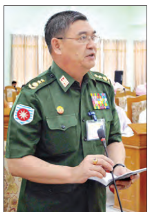
ရခိုင်ပြည်နယ်လုံခြုံရေးနှင့် နယ်စပ်ရေးရာဝန်ကြီး ဝိုလ်မျိုးကြီး ထိန်လင်း

စစ်တွေ မေ ၁၁ မေ ၁၀ ရက်က ကျင်းပသည့် ဒုတိယအကြိမ် ရခိုင်ပြည်နယ်လွှတ်တော် အထူးအစည်းအဝေး ဒုတိယနေ့တွင် ကျောက်ဖြူမြို့နယ် မဲဆန္ဒနယ်အမှတ်(၁) မှ ပြည်နယ်လွှတ်တော်ကိုယ်စားလှယ် ဦးကျော်လွင်က တင်သွင်းခဲ့သော စစ်ဘေးရှောင်ဒုက္ခသည်များကို ကူညီစောင့်ရှောက်ပေးရန် အစိုးရကို တိုက်တွန်းကြောင်း အဆိုအား ယနေ့ကျင်းပသော ရခိုင်ပြည်နယ်လွှတ်တော် တတိယနေ့တွင် အတည်ပြုလိုက်ကြောင်း သိရသည်။