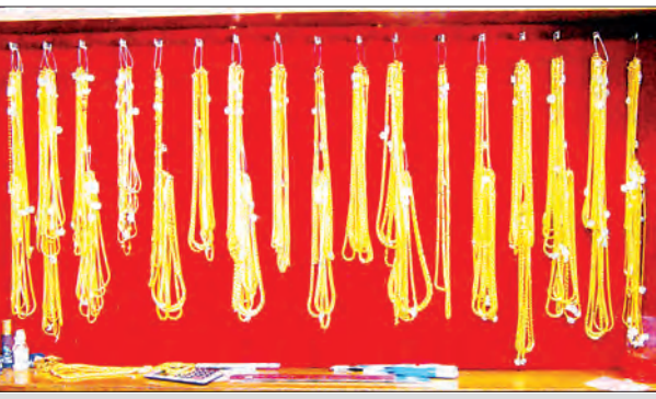
ရန်ကုန်မြို့၊ ရွှေဆိုင်တစ်ဆိုင်၌ အေးကျင်းပြသထားသော ရွှေထည်ပစ္စည်းများအား တွေ့ရစဉ်

မြန်မာရွှေဈေးကွက်မှာ ကမ္ဘာ ရွှေဈေးပေါ်တွင် မှီနေရသည့်အတွက် ကမ္ဘာရွှေဈေး ကျဆင်းခြင်းနှင့်အတူ မြန်မာရွှေဈေးသည်လည်း လိုက်ပါ