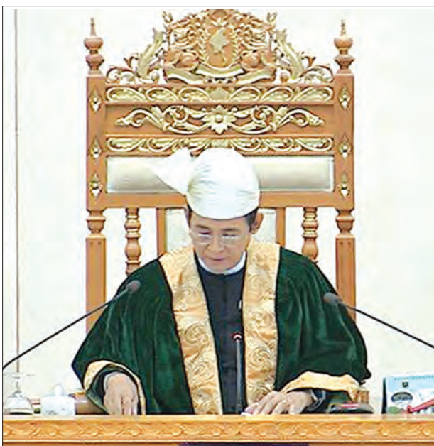
ပြည်သူ့လွှတ်တော်ဥက္ကဋ္ဌ ဦးဝင်းမြင့်

ယင်းအချက်များသည် အဆိုနှင့်ပတ်သက်၍ ကန့်သတ်ထားသည့် ပြည်ထောင်စုမပြိုကွဲရေး၊ တိုင်းရင်းသားစည်းလုံးညီညွတ်မှု မပြိုကွဲရေးနှင့် အချုပ်အခြာအာဏာ တည်တံ့ခိုင်မြဲရေးကို ထိခိုက်စေသောအဆို မဖြစ်စေရ။ လွှတ်တော်အစည်းအဝေး၌ ဆုံးဖြတ်ပြီးသောကိစ္စတစ်ရပ်ရပ်နှင့် သဘောချင်းတူညီသည့်ကိစ္စမပါရှိစေရ စသည့် အချက်များနှင့် ညီညွတ်ခြင်းမရှိသည့်အတွက်