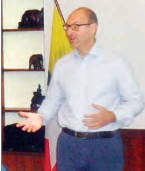
အီးယူသံအမတ်ကြီး မစ္စတာ ရိုလန် ကိုဘီယာ

ဥရောပသမဂ္ဂ(အီးယူ)အနေဖြင့် ကမ္ဘာ တစ်ဝန်း လုံခြုံရေး၊ တည်ငြိမ်ရေး၊ ကြွယ်ဝ ရေးတို့ကို အလေးထားဆောင်ရွက်လျက် ရှိရာ ဒီမိုကရေစီနိုင်ငံတစ်နိုင်ငံ ထူထောင် ရာတွင် မြန်မာနိုင်ငံနှင့်တကွ မြန်မာ နိုင်ငံသူ နိုင်ငံသားအားလုံးကို ထောက်ပံ့ ကူညီရန် သဒ္ဓါဥာဏ်အကြောင်း မြန်မာနိုင်ငံဆိုင်ရာ အီးယူသံအမတ် ကြီး မစ္စတာ ရိုလန်ကိုဘီယာက ပြောသည်။ “ကျွန်တော်တို့ အီးယူအနေနဲ့ မြန်မာနိုင်ငံဖွံ့ဖြိုးရေးထောက်ပံ့မှုအဖြစ် ၂၀၁၄ ခုနှစ်မှ ၂၀၂၀ ပြည့်နှစ်အထိ ယူရို သန်း ၁၀၀၀ (တစ်ဘီလီယံ)ကို အီးယူ က လျာထားသတ်မှတ်ပေးထားပါသည်။