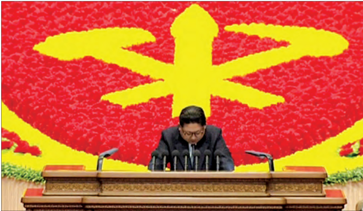
အလုပ်သမားပါတီကွန်ဂရက်အစည်းအဝေး၌ ကင်ဂျုံအန်းမိန့်ခွန်းပြောကြားနေစဉ်

သို့ပေမယ့်လည်း ချူကလီးယားလက်နက်နိုင်ငံတွေအနေနဲ့ သူ့နိုင်ငံရဲ့ အချုပ်အခြာအာဏာကို ထိပါးစော်ကားခြင်းမရှိဘူးဆိုရင် ချူကလီးယားလက်နက်ကို ထုတ်သုံးမှာမဟုတ်ဘူးလို့ မြောက်ကိုရီးယားခေါင်းဆောင်ကင်ဂျုံအန်းက ထုတ်ဖော်ပြောဆိုလိုက်ပါတယ်။ သူ့နိုင်ငံဟာ ချူကလီးယားအရေးထက် နိုင်ငံစီးပွားရေး ပြန်လည်ဦးမော့လာစေဖို့ ငါးနှစ်တာစီးပွားရေးစီမံကိန်းတစ်ရပ်ချမှတ်ဖော်ဆောင်သွားမယ်လို့ ကင်ဂျုံအန်းက ဆိုပါတယ်။