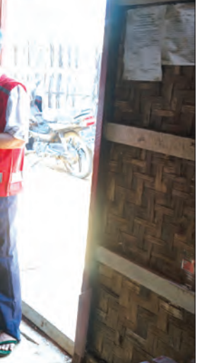
ဝမ်းတွင်း(ဝမ်းတွင်း)

အထောက်အကူပြုအဖွဲ့ဥက္ကဋ္ဌနှင့် တာဝန် ရှိသူများကလည်း လိုအပ်သည်များကို လိုက်ပါကူညီပေးခဲ့ကြောင်း သိရသည်။