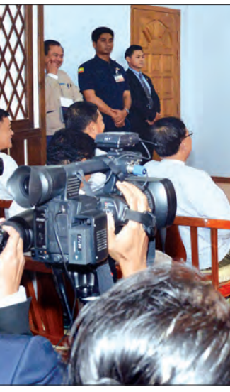
ပြည်ထောင်စုဝန်ကြီး ဒေါ်အောင်ဆန်းစုကြည်နှင့် ထိုင်းနိုင်ငံ နိုင်ငံခြားရေးဝန်ကြီး မစ္စတာ ဒွန် ပရာမွတ်ဝီနိုင်တို့ သတင်းစာရှင်းလင်းပွဲ ပြုလုပ်စဉ်

ကြောင်း မိမိတို့နှစ်နိုင်ငံ ပူးပေါင်းဆောင် ရွက်ရေး မြန်မာ - ထိုင်း - ဂျပန် ပူးပေါင်း ဆောင်ရွက်ရေးကိစ္စများ ဆွေးနွေးခဲ့ပါ ကြောင်း ပြောကြားသည်။ ထို့နောက် သတင်းမီဒီယာများ