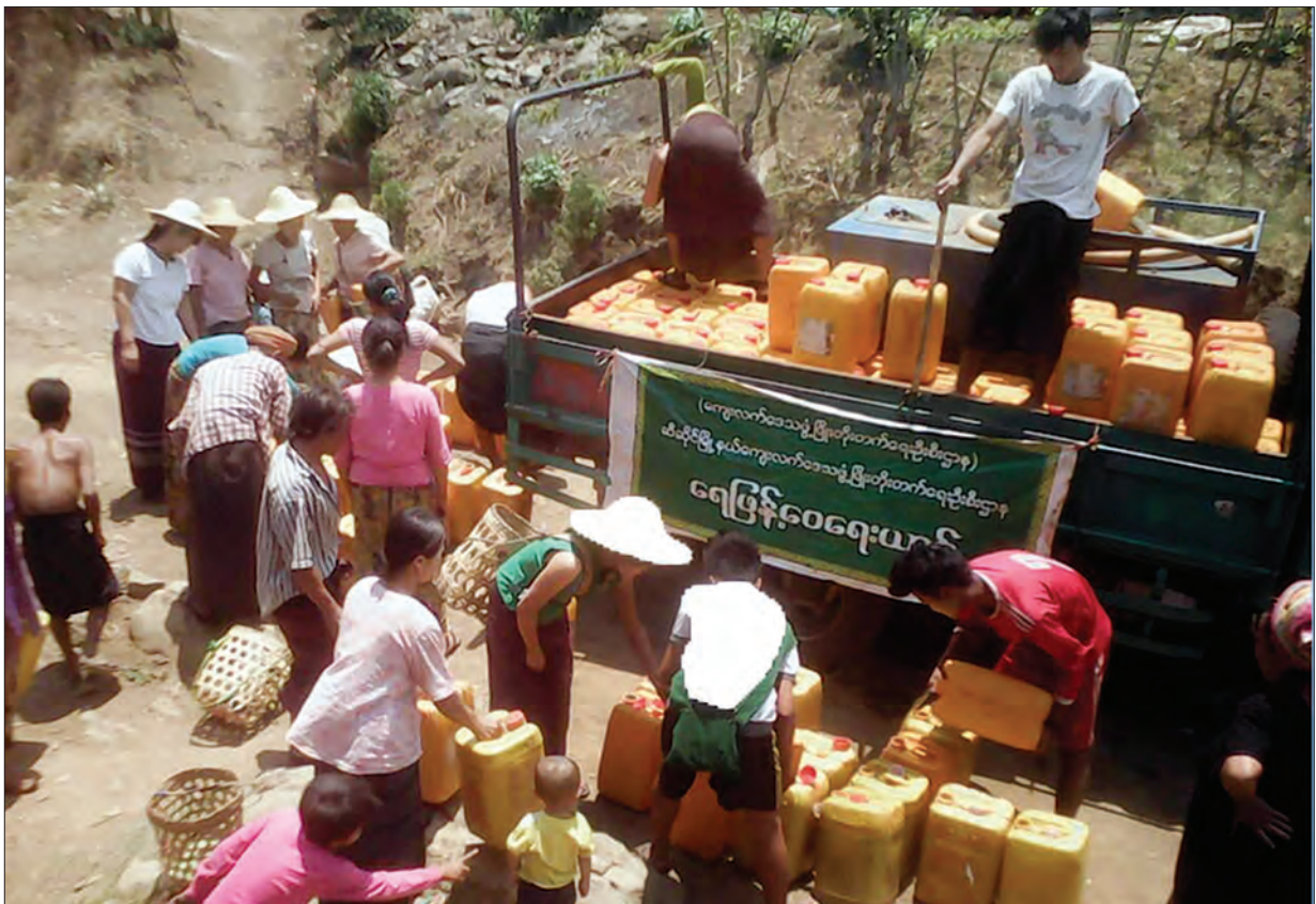
ကျေးလက်ဒေသဖွံ့ဖြိုးတိုးတက်ရေးဦးစီးဌာနနှင့် ဌာနဆိုင်ရာများ၊ အလှူရှင်များ စုပေါင်းရေလှူဒါန်းစဉ်

ထိုကဲ့သို့ ဖြန့်ဝေရာတွင် ကျေးလက်ဒေသဖွံ့ဖြိုးတိုးတက်ရေးဦးစီးဌာနအဖွဲ့