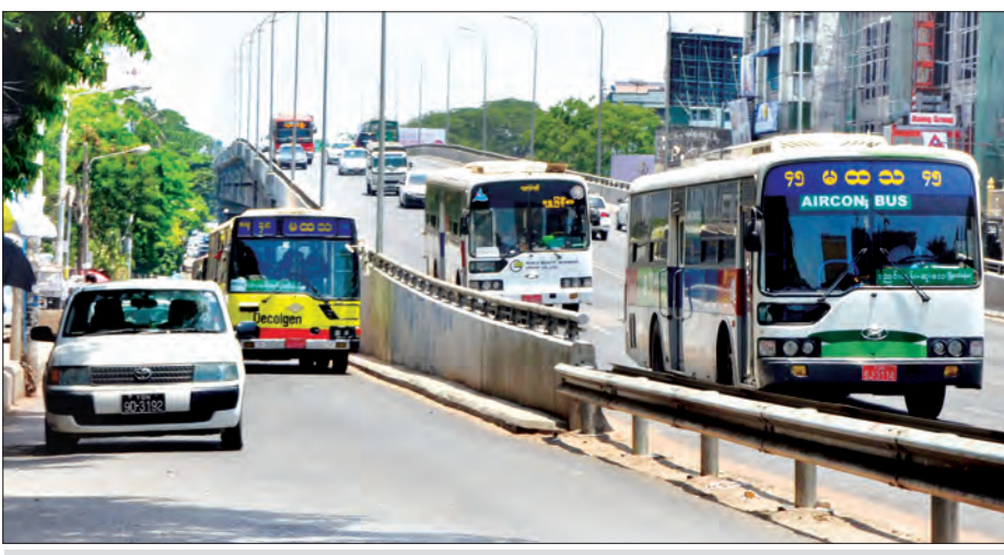
မြန်မာ့ခုံးကျော်တံတားတွင် ခရီးသည်ယာဉ်များ ပြေးဆွဲလျက်ရှိစဉ်

သတင်း-မြင့်မောင်စိုး၊ ဓာတ်ပုံ-တင်စိုး(မြန်မာ့အလင်း) ရန်ကုန် မေ ၉ ရန်ကုန်မြို့တွင် ယာဉ်ကြောကျပ်တည်းမှုကို ဖြေရှင်းနိုင်မည့် အစိတ်အပိုင်းတစ်ရပ်အဖြစ် ကားလမ်းကူးခုံးကျော်တံတားများ တည်ဆောက်ထားသော်လည်း အချို့သောဘတ်စ်ကားများမှာ ခရီးသည်ရလိုမှုအတွက် ခုံးကျော်တံတားမှ ဖြတ်သန်းခြင်းမရှိဘဲ အောက်လမ်းမှသွားနေခြင်းကြောင့် ယာဉ်ကြောပိတ်ဆို့မှုကို ဖြစ်စေနိုင်ကြောင်း ရန်ကုန်တိုင်းဒေသကြီးယာဉ်ထိန်းတပ်ဖွဲ့မှ တာဝန်ရှိသူတစ်ဦးက ပြောသည်။ “မ.ထ.သ ယာဉ်လိုင်းတွေအနေနဲ့ သတ်မှတ်လမ်းကြောင်းအတိုင်း မောင်းနှင်ရပါတယ်။ သတ်မှတ်လမ်းကြောင်းအတိုင်း မောင်းနှင်ခြင်းမရှိတဲ့ ယာဉ်မောင်းတွေကို ယာဉ်မောင်းလိုင်စင် ခြောက်လပိတ်သိမ်းတဲ့အထိ အရေးယူဆောင်ရွက်လျက် ရှိပါတယ်။ ခုံးကျော်တံတားပေါ်ကသွားရမယ့် ဘတ်စ်ကားတွေ ပုံမှန် စာမျက်နှာ ၆ ကော်လံ ၁ ❖