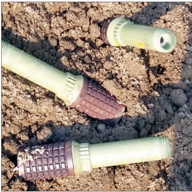
ရဲကင်းအနီး တွေ့ရှိသည့် လက်ပစ်ပုံးသုံးလုံးကို တွေ့ရစဉ်