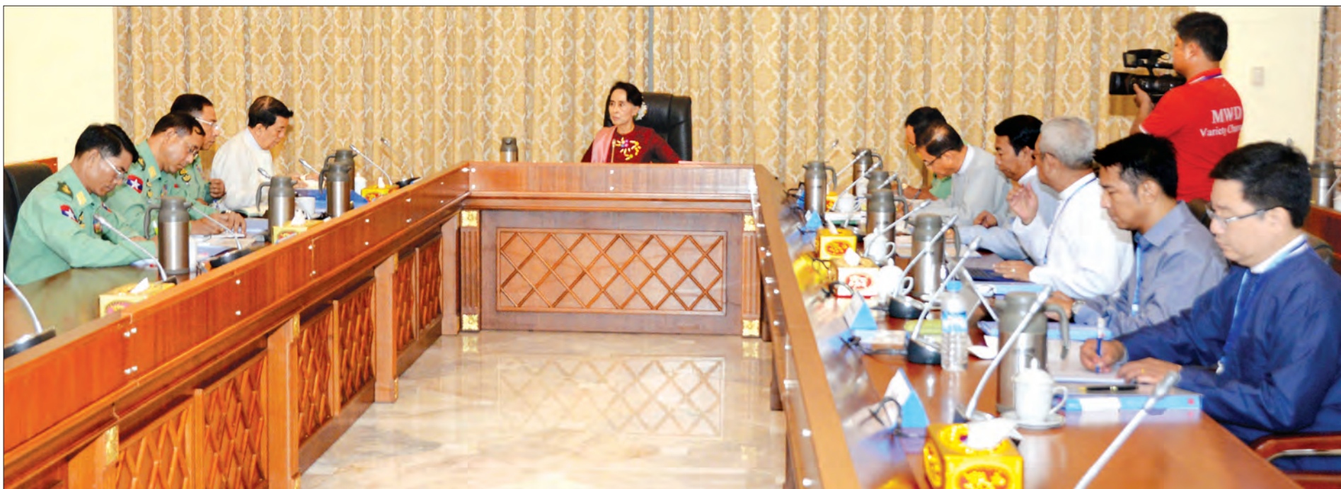
အမျိုးသားရင်ကြားစေ့ရေးနှင့် ငြိမ်းချမ်းရေးပဟိံဋ္ဌာန (National Reconciliation and Peace Centre – NRPC) ဖွဲ့စည်းရေးဆိုင်ရာ ညှိနှိုင်းအစည်းအဝေး ကျင်းပစဉ်

နေပြည်တော် မေ ၉ အမျိုးသားရင်ကြားစေ့ရေးနှင့် ငြိမ်းချမ်းရေးပဟိံဋ္ဌာန (National Reconciliation and Peace Centre – NRPC) ဖွဲ့စည်းရေးဆိုင်ရာ ညှိနှိုင်းအစည်းအဝေးကို ယနေ့ နံနက်ပိုင်းတွင် နိုင်ငံတော်သမ္မတအိမ်တော်၌ ကျင်းပရာ နိုင်ငံတော်၏ အတိုင်ပင်ခံ ပုဂ္ဂိုလ် ဒေါ်အောင်ဆန်းစုကြည်က အမျိုးသားရင်ကြားစေ့ရေးနှင့် ငြိမ်းချမ်းရေးလုပ်ငန်းစဉ် အဆင့်တိုင်းတွင် ပါဝင်သင့် ပါဝင်ထိုက်သူ များ ပါဝင်ခွင့်ရရှိရေး ဦးတည်ဆောင်ရွက်သွားကြရန် ပြောကြားသည်။