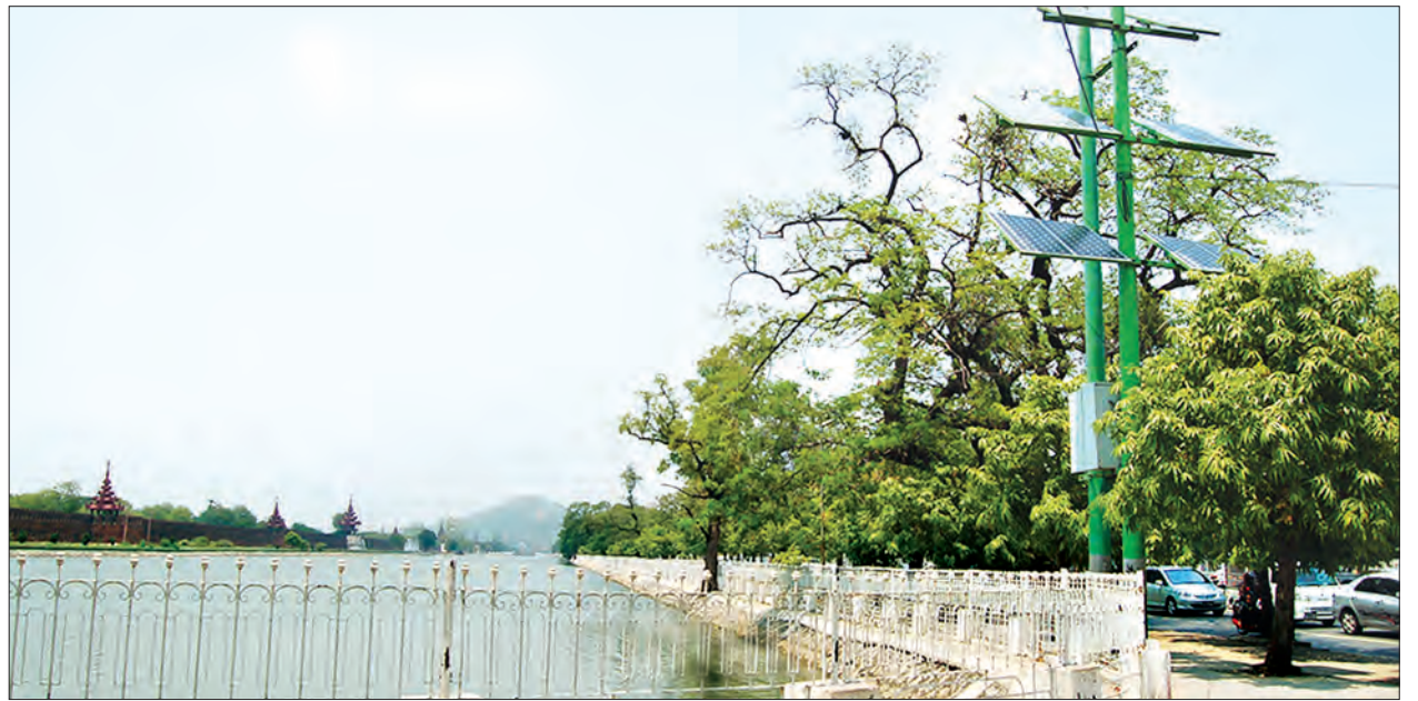
မန္တလေးမြို့ ကျင်းပသည့် လျှပ်စစ်ဆိုလာပြပွဲများ တပ်ဆင်ထားမှုကို တွေ့ရစဉ်

မေ ၁၅ ရက်တွင်လည်း မန္တလေးမြို့ဟိုတယ် ရွှေပြည်သာတွင် ဆိုလာထုတ်ကုန် ပစ္စည်းများပြပွဲကိုကျင်းပမည်ဖြစ်ရာ လုပ်ငန်းသုံး၊ အိမ်သုံးစနစ်များ၊ မြေအောက်ရေနှင့် အခြားရေအရင်းအမြစ်များမှ ရေတင်ခြင်းဆောင်ရွက်ရန်စနစ်များ စည်ပင်သာယာ လုပ်ငန်းများဖြစ်သည့် ယာဉ်လမ်းကြောင်းပြမီးနှင့် လမ်းမီးစနစ်များ၊ စက်ရုံ၊ အလုပ်ရုံ သုံးစနစ်များ၊ အရေးပေါ်သုံး၊ တောတောင်၊ ဒေသသုံးမီးအိမ်နှင့် လက်နိပ်ဓာတ်မီးသုံးစနစ်