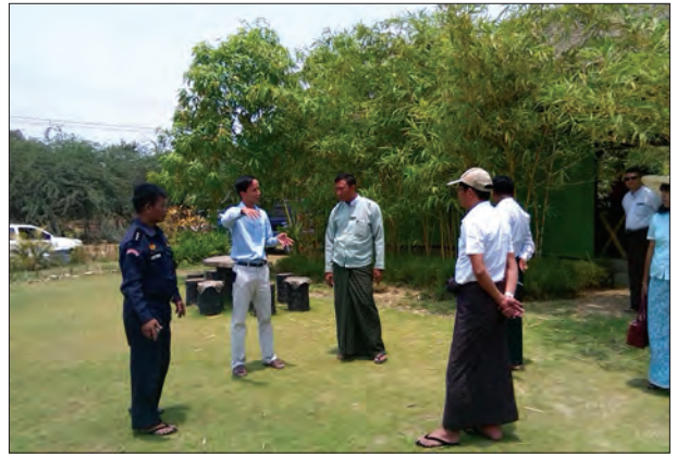
အပူရောင်နားနေစခန်း တည်ဆောက်မည့်နေရာတွင် ဆွေးနွေးနေစဉ်

မင်းဘူးမြို့နယ်သည် နှစ်စဉ် မြန်မာနိုင်ငံ၏ အပူချိန်အများဆုံးမြို့များထဲတွင် တစ်မြို့ အပါအဝင်ဖြစ်ပြီး ယခုနှစ် အယ်နီညီရာသီဥတုကာလတွင် အပူချိန်သည် ၄၆ ဒီဂရီ စင်တီဂရိတ်အထိ မြင့်တက်လျက်ရှိသည်။ တင်ထွန်းဦး(မင်းဘူး)