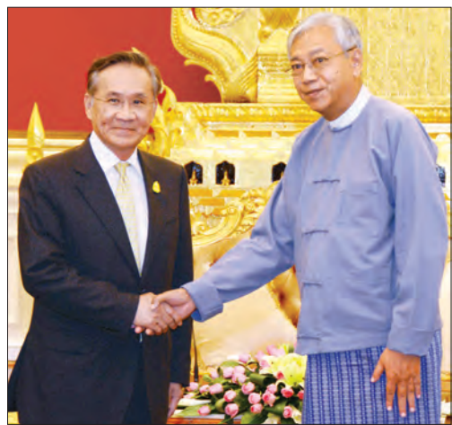
စာမျက်နှာ-၃

နိုင်ငံတော်သမ္မတ ဦးထင်ကျော်နှင့် ထိုင်းနိုင်ငံဝန်ကြီးချုပ်၏ အထူးကိုယ်စားလှယ် ထိုင်းနိုင်ငံခြားရေးဝန်ကြီးတို့ ဆွေးနွေး “ ထိုင်းနိုင်ငံတွင် ရောက်ရှိနေကြသည့် မြန်မာနိုင်ငံသားအလုပ်သမားများ အပေါ် အလုပ်သမားအခွင့်အရေးများ တန်းတူပေးစေလိုကြောင်း ပြောကြား”