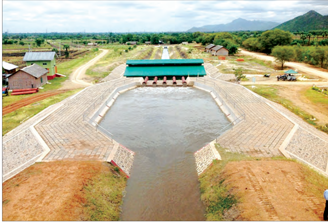
ရွှေလုံဗိုလ်မြစ်ရေတင် စီမံကိန်းအား တွေ့ရစဉ်

သတင်း ရဲခေါင်ညွှန်၊ မြတ်သန္တမောင် ရန်ကုန် မေ ၉ မြန်မာနိုင်ငံတစ်ဝန်းတွင် ဆောင်ရွက်ပြီး ဆောင်ရွက်ဆဲ မြစ်ရေတင်လုပ်ငန်း ၃၇၉ ခု ရှိသည့်အနက် မြစ်ရေတင်လုပ်ငန်း ၁၇၀ ကို ဖျက်သိမ်းရန် စီစဉ်လျက်ရှိကြောင်း ဆည်မြောင်းနှင့်ရေအသုံးချီစီမံခန့်ခွဲရေးဦးစီးဌာန ညွှန်ကြားရေးမှူးချုပ် ဦးကျော်မြင့်လှိုင်ထံမှ သိရသည်။ “မြစ်ရေတင်လုပ်ငန်းပေါင်း ၃၇၉ ခု ရှိတဲ့အထဲကမှ ၁၇၀ ကို ကျွန်တော်တို့ လုံးဝဖျက်သိမ်းဖို့ အနေအထားရှိပါတယ်။ ဖျက်သိမ်းမယ့် မြစ်ရေတင်လုပ်ငန်းတစ်ခုချင်းအလိုက်လည်း စာအုပ်ပေါင်း ၁၇၀ လုပ်ပြီး တင်ပြထားပါတယ်။ ဝန်ကြီးကလည်း လက်ခံထားတယ်။ အစိုးရအဖွဲ့ကို ဆက်တင်သွားမယ်” ဟု ဦးကျော်မြင့်လှိုင်က ပြောသည်။ မြန်မာတစ်နိုင်ငံလုံးရှိ ဆောင်ရွက်ပြီး ဆောင်ရွက်ဆဲ မြစ်ရေတင် စီမံကိန်းများတွင် လျှပ်စစ်ဓာတ်အား တစ်ဆက်တစ်စပ်တည်းရရှိမှု လျော့နည်းခြင်း၊ ဦးအား စာမျက်နှာ ၈ ကော်လံ ၅ ❖