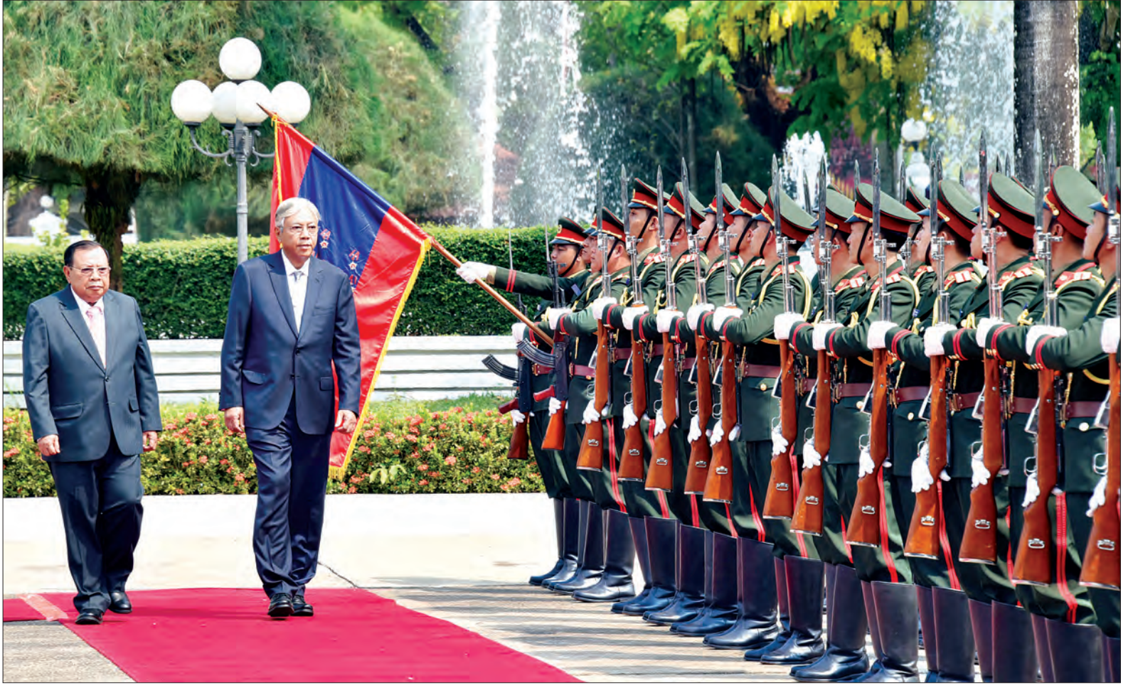
နိုင်ငံတော်သမ္မတ ဦးထင်ကျော်နှင့် လာအိုပြည်သူ့ဒီမိုကရက်တစ်သမ္မတနိုင်ငံ သမ္မတ မစ္စတာ ဘွန်ညိုပိုရာချစ်တို့ ဂုဏ်ပြုတပ်ဖွဲ့အား စစ်ဆေးစဉ်

ထို့ပြင် နိုင်ငံတော်သမ္မတက မြန်မာနှင့် လာအို နှစ်နိုင်ငံသည် ရှေးယခင်က တည်းက ငြိမ်းချမ်းစွာ ယှဉ်တွဲနေထိုင် လာကြသည့် နိုင်ငံများဖြစ်ကြောင်း၊ သို့ဖြစ်ရာ နှစ်နိုင်ငံအကြား အပြန်အလှန် အားပေးထောက်ခံမှုများ ပြုလုပ်ခဲ့ကြပါကြောင်း၊ နှစ်နိုင်ငံအကြား သံတမန် ဆက်သွယ်မှုသည် နှစ်ပေါင်း ၆၀ ကျော် ပြီးဖြစ်ပါကြောင်း၊ ထို့အတွက် ချစ်ကြည် ရင်းနှီးမှုနှင့် ပူးပေါင်းဆောင်ရွက်မှုများကို ပိုမိုခိုင်မာစွာ ဆောင်ရွက်သွားရန် ဖြစ်ပါကြောင်း၊ နယ်နိမိတ်အားဖြင့် မိုင်ပေါင်း ၁၄၀ ကျော် ထိစပ်နေပြီး