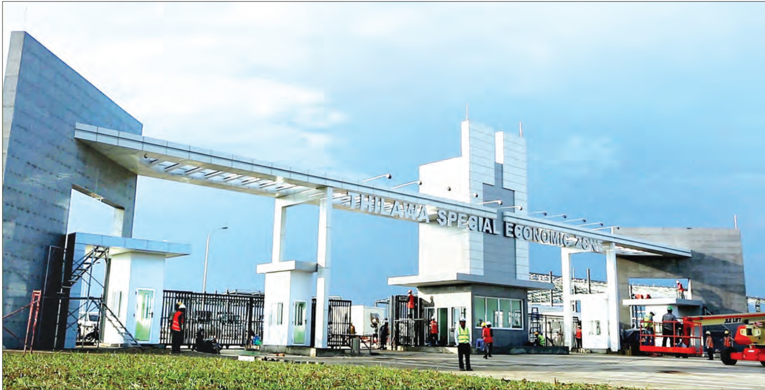
သတင်း-ရဲခေါင်ညွန့်၊ မြတ်သန္တာမောင်