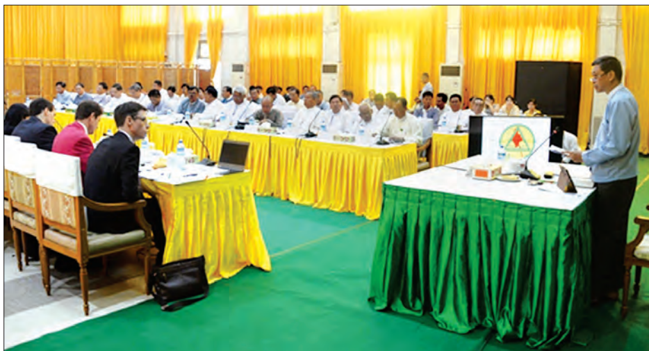
ဒေါက်တာစိုးဝင်းက ပညာရေးဝန်ကြီးဌာနအောက်ရှိ ဦးစီးဌာနများ ပြန်လည်ဖွဲ့စည်းခြင်းဆိုင်ရာများကို လည်းကောင်း၊ ညွှန်ကြားရေးမှူးချုပ် ဒေါက်တာခိုင်မြဲက Alternative

ပညာရေးဝန်ကြီးဌာနနှင့် ပညာရေးဖွံ့ဖြိုးမှုမိတ်ဖက်အဖွဲ့အစည်းများ ပူးပေါင်းဆောင်ရွက်ရေး ညှိနှိုင်းဆွေးနွေးပွဲကို ယနေ့နံနက် ၉ နာရီတွင် နေပြည်တော် ရုံးအမှတ် (၂၀) ရှိ ပညာရေးဝန်ကြီးဌာန ဝန်ကြီးရုံး အစည်းအဝေးခန်းမ၌ ကျင်းပရာ ပညာရေးဝန်ကြီးဌာန ပြည်ထောင်စုဝန်ကြီး ဒေါက်တာမျိုးသိမ်းကြီး တက်ရောက်အမှာစကားပြောကြားသည်။ (ယာပုံ)