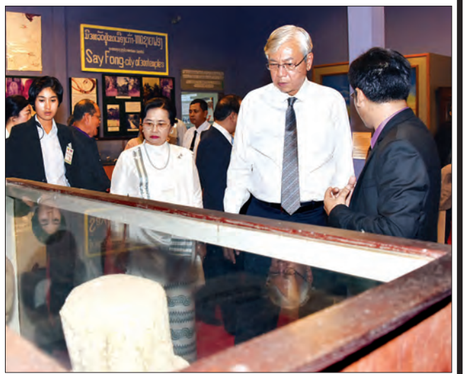
နိုင်ငံတော်သမ္မတ ဦးထင်ကျော်နှင့် ဇနီး လာအိုနိုင်ငံ အမျိုးသားပြတိုက်၌ ကြည့်ရှုလေ့လာကြစဉ် (ယာပုံ)