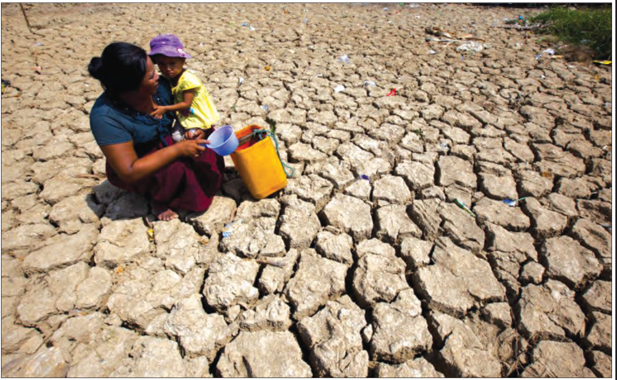
တွဲတေးမြို့နယ်အတွင်းရှိ ရေပြတ်လပ်နေသော ကျေးရွာတစ်ရွာ၏ မြင်ကွင်း

ဂေဟစနစ်တစ်ခုလုံး ပျက်ယွင်းသွားခြင်းပါပဲ။ ဒီနှစ်အတွင်း မြန်မာပြည်အနှံ့မှာ နွေရာသီကာလ သောက်သုံးရေရှားပါးပြတ်လပ်မှုများ ပိုမိုဖြစ်ပေါ်လာတာဟာလည်း သစ်တောပြုန်းတီးမှုရဲ့ အခြေခံအကြောင်းတရားလို့ ဆိုနိုင်ပါတယ်။ အချို့ဒေသတွေမှာ သနားစရာကောင်းလောက်အောင် ရေရှားပါးပြတ်လပ်မှုတွေ ကြုံတွေ့ခဲ့ပါတယ်။ လူတွေသာမကဘဲ တိရစ္ဆာန်တွေပါ သောက်သုံးရေ အခက်ကြုံခဲ့ကြတာ သတင်းစာတွေမှာ နေ့စဉ် တွေ့မြင်နေရပါတယ်။ အချို့ဒေသတွေကျတော့ လေပြင်းတွေတိုက်ခတ်မှုခံရပါတယ်။ အချို့ဒေသတွေမှာ ထန်းသီးလောက်ရှိတဲ့ မိုးသီးတွေကြွေကျပြီး လူတွေ၊ တိရစ္ဆာန်တွေ သေကြေပျက်စီးကုန်ပါတယ်။ အချို့ဒေသတွေမှာ မိုးကြိုးတွေ ပစ်ပါတယ်။ ဒါတွေဟာ တကယ်တော့ သစ်ပင်သစ်တောနဲ့ အနီးသဟဲပြုနေတဲ့ လူတွေရဲ့ မှားယွင်းတဲ့လုပ်ဆောင်မှုတွေကြောင့် ညံ့ဖျင်းသေးသိမ်တဲ့ စီးပွားရေးလောက ဝိသမစိတ်တွေနဲ့ သစ်တောတွေခတ်ခဲ့တာကြောင့် ဂေဟစနစ်ကြီး ပျက်စီးယိုယွင်းခဲ့ခြင်းလို့ ဆိုရမှာပါ။