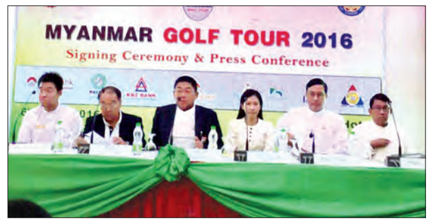
ပတ်လုံး ပြိုင်ပွဲကျင်းပရာမြို့ကြီးများသို့ လိုက်လံကစားသည့် ဂေါက်သီးအားကစားသမား ၂၀၀ခန့်ရှိပြီး နောက်ဆုံး ၂၀၁၅ ခုနှစ်တွင် အကောင်းဆုံးကစားသမားအဖြစ် ပရော်ဖက်ရှင်နယ် အဆင့်

၍သာ ၂၀၁၆ ခုနှစ် ပြည်တွင်းပတ်လည် ဂေါက်သီးရိုက်ပြိုင်ပွဲကို စည်ကားသိုက်မြိုက်စွာ ကျင်းပနိုင်ခြင်းဖြစ်ကြောင်း၊ ဂေါက်သီးလောက တိုးတက်အောင်ကူညီပေးရာလည်းရောက်ကြောင်းနှင့် ပံ့ပိုးပေးသည့် ဘဏ်များကုမ္ပဏီ လုပ်ငန်းများ ဆတတ်ထမ်းပိုး တိုးတက်အောင်မြင်ပါစေကြောင်း နှုတ်ခွန်းဆက်ပြောကြားခဲ့ပြီး မြန်မာနိုင်ငံ ဂေါက်သီးအဖွဲ့ချုပ်ဥက္ကဋ္ဌ ဦးအောင်ကြည်က ပြိုင်ပွဲနှင့်ပတ်သက်၍ ရှင်းလင်းတင်ပြသည်။ မြန်မာနိုင်ငံ၌ ပြည်တွင်းပတ်လည် ဂေါက်သီးရိုက်ပြိုင်ပွဲကို ၁၉၉၇ခုနှစ်မှစ၍ ၂၀၁၅ခုနှစ် အထိ ကျင်းပနိုင်ခဲ့ပြီး တစ်နှစ်