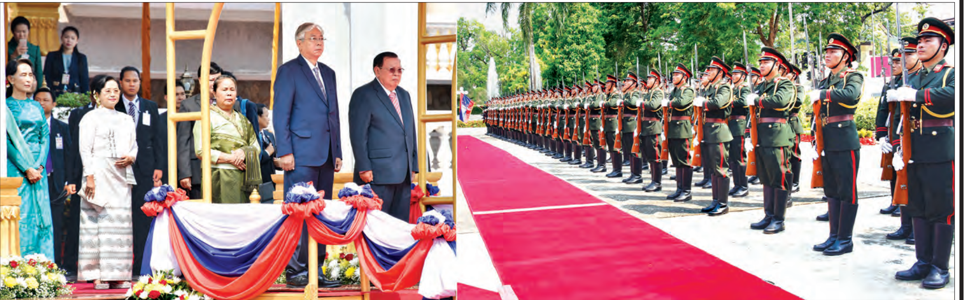
နိုင်ငံတော်သမ္မတ ဦးထင်ကျော်နှင့် လာအိုပြည်သူ့ဒီမိုကရက်တစ် သမ္မတနိုင်ငံ သမ္မတ မစ္စတာ ဘွန်ညိုရာချစ်တို့ ဂုဏ်ပြုတပ်ဖွဲ့၏ အလေးပြုခြင်းကို ခံယူကြစဉ်