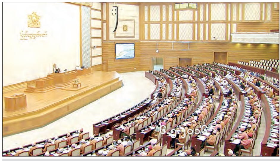
ဒုတိယအကြိမ်ပြည်သူ့လွှတ်တော် ပထမပုံမှန်အစည်းအဝေး (၂၃)ရက် မြောက်နေ့ ကျင်းပစဉ်

သည် မြန်မာနိုင်ငံအတွင်းသို့ တရားမဝင် လာရောက်အခြေချနေထိုင်သည့် မည်သူ ကိုမဆို တားမြစ်ကာကွယ်နိုင်ပြီး နိုင်ငံ သားဖြစ်ထိုက်သူများကိုလည်း ဥပဒေနှင့် အညီ ခွင့်ပြုထားရှိသဖြင့် ဤဥပဒေဖြင့် စစ်ဆေးပါက အတု၊ အစစ်၊ အရောအနှော ခွဲခြမ်းစိတ်ဖြာနိုင်မည် ဖြစ်ပါကြောင်း။ ယခုလက်ရှိ အခြေအနေတွင် မြန်မာနိုင်ငံ၏နိုင်ငံသား ဟုတ်/မဟုတ် မခွဲခြားနိုင်သဖြင့် ယာယီသက်သေခံ လက်မှတ် (အဖြူကတ်) ထုတ်ပေးသော ဦးရေမှာ ရခိုင်ပြည်နယ်အတွင်း ၄၉၂၆၃၄ ဦးရှိကြောင်း၊ ထို့ပြင် မည်သည့် လက်မှတ်အမျိုးအစားကိုမျှ ကိုင်ဆောင်ထားခြင်းမရှိသောသူများ လည်း များစွာရှိနေနိုင်ကြောင်း၊ ယခုအခါ နိုင်ငံတော်သမ္မတ၏ အမိန့်စာအမှတ် (၁၉/၂၀၁၅)ဖြင့် ယာယီသက်သေခံ လက်မှတ်(အဖြူကတ်)များ၏ သက်တမ်း ကို မတ် ၃၀ ရက် နောက်ဆုံးသတ်မှတ်ပြီး ဖြစ်ပါကြောင်း။ ထို့ကြောင့် အထောက်အထား တစ်စုံတစ်ရာမရှိသည့်သူများအား နိုင်ငံ သား၊ ဧည့်နိုင်ငံသား၊ နိုင်ငံသားပြုခွင့်ရသူ၊ နိုင်ငံခြားသားစသည်ဖြင့် တစ်မျိုးမျိုး သတ်မှတ်နိုင်ရန်အတွက် ၁၉၈၂ ခုနှစ် မြန်မာနိုင်ငံသားဥပဒေဖြင့် ထိရောက် မြန်ဆန်စွာ အကောင်အထည်ဖော် ဆောင်ရွက် အထူးလိုအပ်လျက်ရှိပါ ကြောင်း လွှတ်တော်သို့တင်ပြခဲ့သည်။ ၁၉၈၂ ခုနှစ် မြန်မာနိုင်ငံသား ဥပဒေတွင် နိုင်ငံသားဖြစ်ထိုက်သူကို နိုင်ငံသားအဖြစ်လည်းကောင်း၊ ဧည့်နိုင်ငံ သားဖြစ်ထိုက်သူများကို ဧည့်နိုင်ငံသား အဖြစ် လည်းကောင်း၊ နိုင်ငံသားပြုခွင့် ရရှိသူကို ပြုနိုင်သောအဖြစ်လည်း ကောင်း ဥပဒေလုပ်ထုံးလုပ်နည်းများ နှင့်အညီ မျှတသောရပိုင်ခွင့်၊ အခွင့် အရေးများကို ပေးထားကြောင်း၊ ယင်းဥပဒေပုဒ်မ(၁၈)တွင် မရှိသေးသော နည်းဖြင့် နိုင်ငံသားအဖြစ်ကို ရယူပါက ထောင်ဒဏ် ဆယ်နှစ်နှင့် ငွေဒဏ်