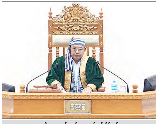
အမျိုးသားလွှတ်တော်ဥက္ကဋ္ဌ မန်းဝင်းခိုင်သန်း

နေပြည်တော် မေ ၆ ဒုတိယအကြိမ် အမျိုးသားလွှတ်တော် ပထမပုံမှန်အစည်းအဝေး (၂၁) ရက် မြောက်နေ့ကို ယနေ့နံနက် ၁၀ နာရီတွင် နေပြည်တော်ရှိ အမျိုးသားလွှတ်တော် အစည်းအဝေးခန်းမ၌ ကျင်းပရာ ပြည်သူ့ ကောင်စီ အဆင့်ဆင့်နှင့် အလုပ်အမှု ဆောင်အဖွဲ့ အဆင့်ဆင့်တို့၏ တာဝန်နှင့် လုပ်ပိုင်ခွင့်ဥပဒေကိုရုပ်သိမ်းသည့် ဥပဒေ ကြမ်းနှင့်စပ်လျဉ်း၍ အမျိုးသား လွှတ်တော်ဥပဒေကြမ်း ကော်မတီ၏ အစီရင်ခံစာကို ကော်မတီဝင် မန္တလေး တိုင်းဒေသကြီး မဲဆန္ဒနယ်အမှတ်(၄)မှ ဒေါ်လှဌေး(ခ)ဒေါ်အုန်းကြည်က ဖတ် ကြားတင်ပြရာ အမျိုးသားလွှတ်တော် ဥက္ကဋ္ဌက ဥပဒေကြမ်းနှင့်စပ်လျဉ်း၍ ဆွေးနွေးလိုသည့် လွှတ်တော်ကိုယ်စား လှယ်များရှိပါက အမည်စာရင်း တင်သွင်း နိုင်ကြောင်း ကြေညာသည်။ ထို့ပြင် ဥပဒေကြမ်းကော်မတီ