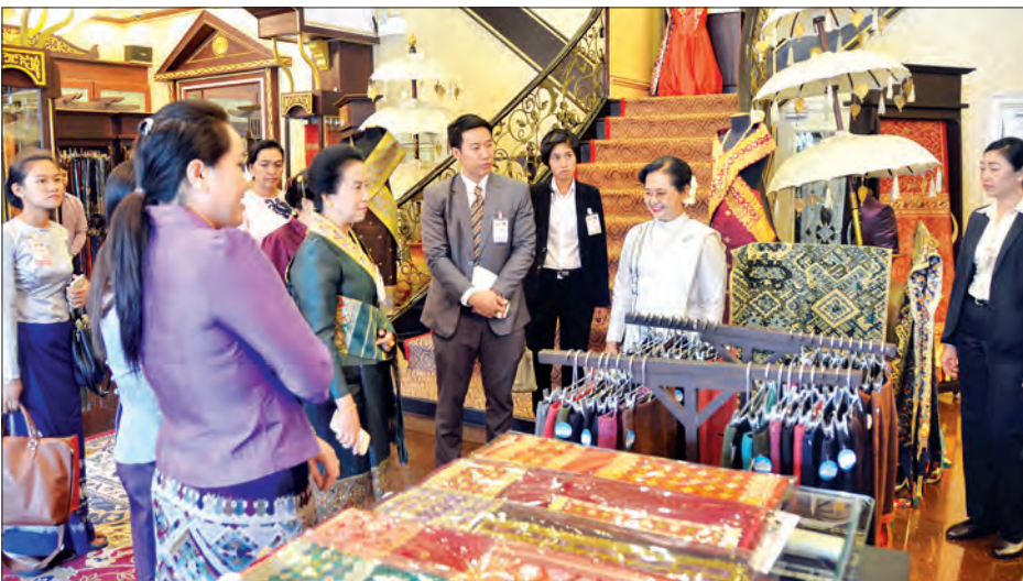
နိုင်ငံတော်သမ္မတ ဦးထင်ကျော်၏ ဇနီး Ammalin Lao Silk Handicraft အတွင်း ပြသထားသောပစ္စည်းများကို ကြည့်ရှုလေ့လာကြစဉ် (ဝဲပုံ)