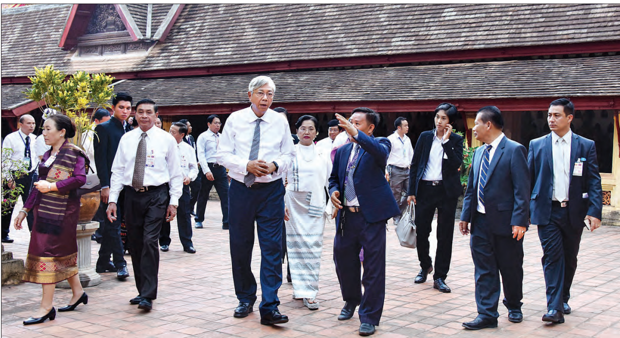
နိုင်ငံတော်သမ္မတ ဦးထင်ကျော်နှင့် ဇနီး လာအိုနိုင်ငံ ဆီဆာကတ်ကျောင်းတော်အတွင်း ကြည့်ရှုလေ့လာကြစဉ်