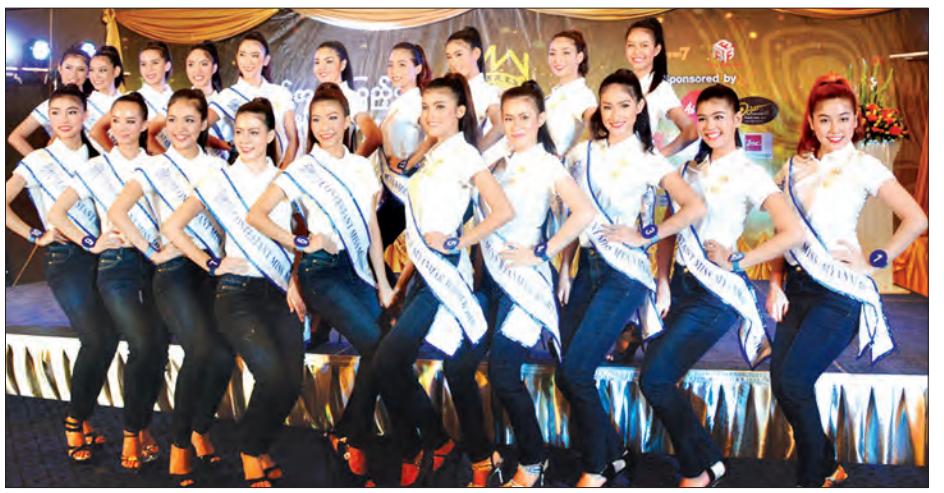
Miss Myanmar World 2016 ၏ နောက်ဆုံးဆန်ခါတင်ရွေးချယ်ခံရသည့် အလှမယ်တချို့ကိုတွေ့ရစဉ်