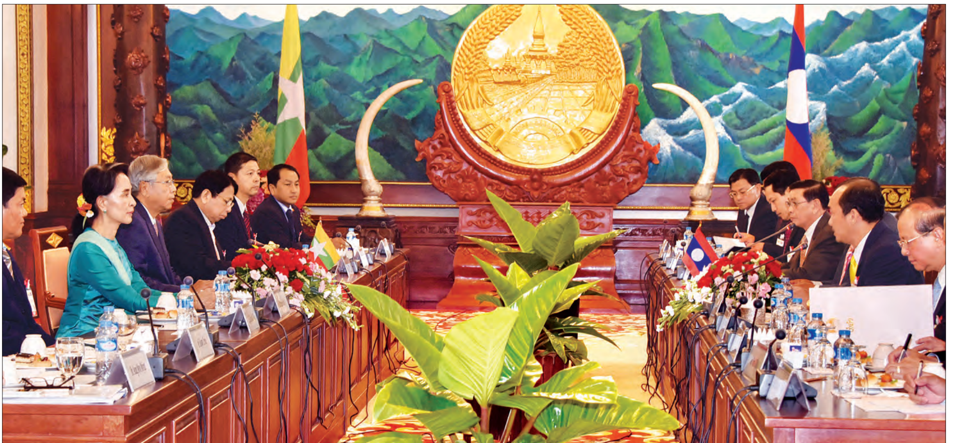
မြန်မာ-လာအို နှစ်နိုင်ငံဆွေးနွေးပွဲ ကျင်းပစဉ်