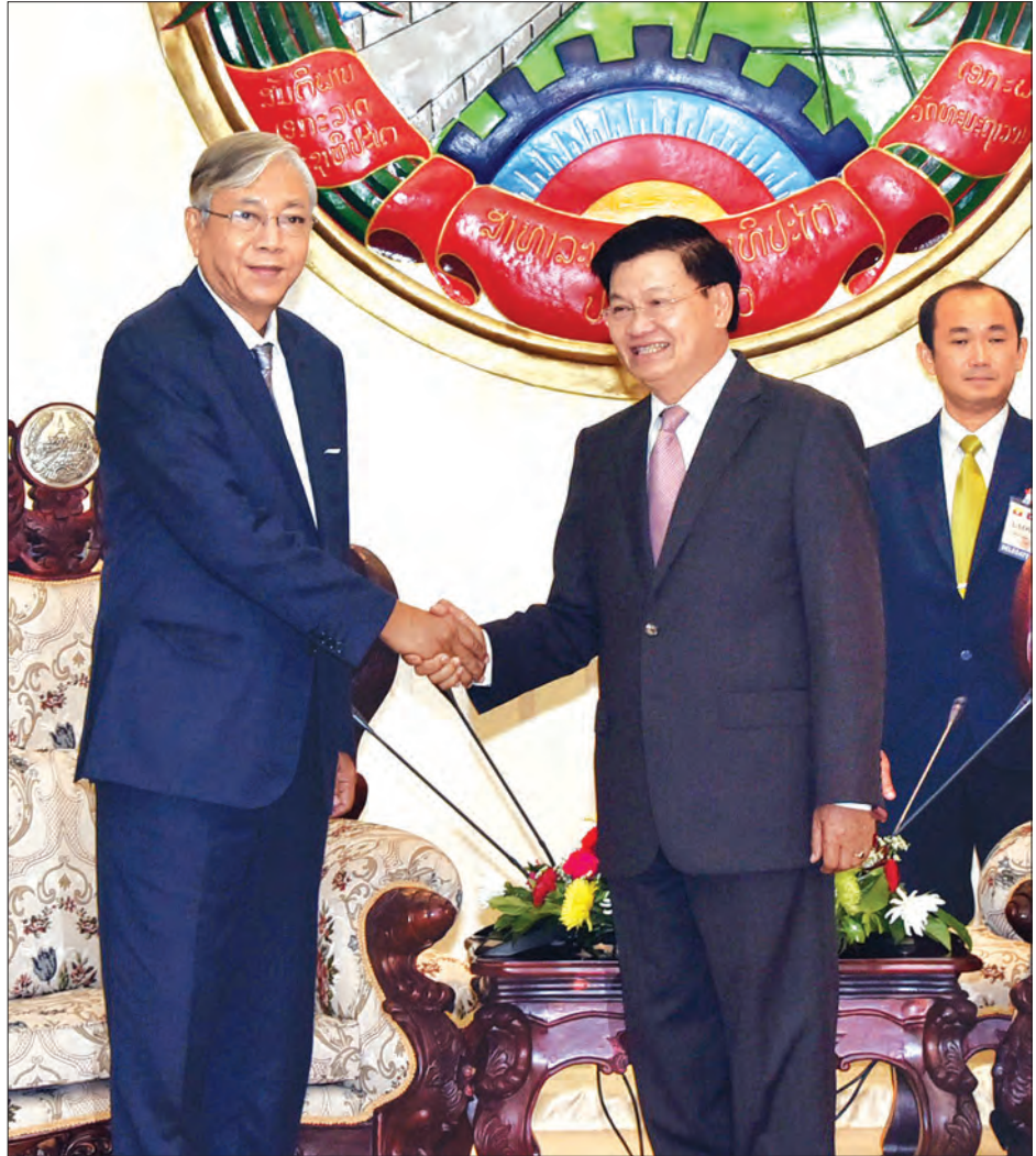
နိုင်ငံတော်သမ္မတ ဦးထင်ကျော်နှင့် လာအိုနိုင်ငံဝန်ကြီးချုပ် မစ္စတာ ထောင်လွန်း ဆီဆိုလစ်တို့ ရင်းရင်းနှီးနှီး နှုတ်ဆက်စဉ်

မည်သည့်ပြဿနာမျှမရှိခဲ့ဘဲ တစ်ဦးနှင့် တစ်ဦး အလွန်ရင်းနှီးကြသည့် နိုင်ငံများ ဖြစ်ကြပါကြောင်းနှင့် ရှိရင်းစွဲ ရင်းနှီး ချစ်ကြည်မှုကို ဆက်လက်တိုးပွားစေရန် အတွက် နှစ်နိုင်ငံပြည်သူများ လက်တွဲ ဆောင်ရွက်သွားရန် လိုအပ်ပါကြောင်း ပြောကြားခဲ့သည်။