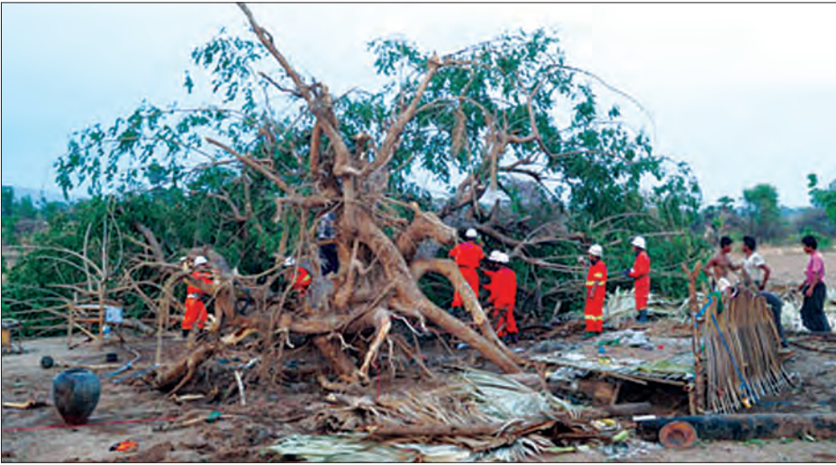
နာရီခွဲတွင် လမ်းပိတ်ဆို့နေမှုအား ဖယ်ရှားနိုင်ခဲ့ကြောင်း သိရသည်။

မန္တလေးတိုင်းဒေသကြီး ကျောက်ပန်းတောင်းမြို့နယ်တွင် ဧပြီ ၃၀ ရက် ညနေ ၄ နာရီ ၁၅မိနစ်ခန့်က ကျောက်ပန်းတောင်းမြို့နယ်၏ အနောက်မြောက်ဘက်မှ ရုတ်တရက် လေပြင်းများတိုက်ခတ်မှုကြောင့် ကျောက်ပန်းတောင်း-ရေနံချောင်းသွား ကားလမ်းပေါ်တွင် သစ်ပင်အချို့ပြိုလဲ၍ (ယာဝုံ) ခေတ္တမျှ လမ်းပိတ်ဆို့မှုဖြစ်ပေါ်ခဲ့ပြီး ကျေးရွာအချို့တွင်လည်း လူနေအိမ်များ အမိုးလန်ပျက်စီးမှုဖြစ်ပေါ်ခဲ့ကြောင်း သိရသည်။