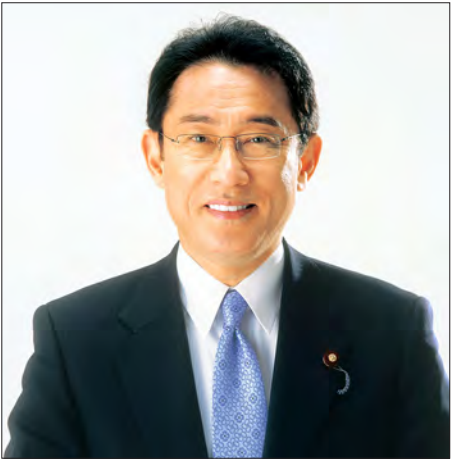
ဂျပန်နိုင်ငံခြားရေးဝန်ကြီး H.E.Mr Fumio KISHIDA

မေး။ ။ မြန်မာနိုင်ငံနဲ့ ဂျပန်နိုင်ငံအကြားမှာ နှစ်ပေါင်းရှည်ကြာစွာ ချစ်ကြည်ရင်းနှီးမှုကို တည်ဆောက်လာခဲ့ပါတယ်။ ဂျပန်-မြန်မာ နှစ်နိုင်ငံ ဆက်ဆံရေးအပေါ်လည်း ဝန်ကြီးရဲ့ အကျိုးပြုသုံးသပ်ချက်ကို သိချင်ပါတယ်။ နောက်တစ်ခါ ဒီတစ်ခေါက် မြန်မာနိုင်ငံ အလည်အပတ်ခရီးစဉ်ကနေ ဂျပန်-မြန်မာ နှစ်နိုင်ငံဆက်ဆံရေး ပိုမိုတိုးတက်လာမယ့် အလားအလာကို သိပါရစေ။