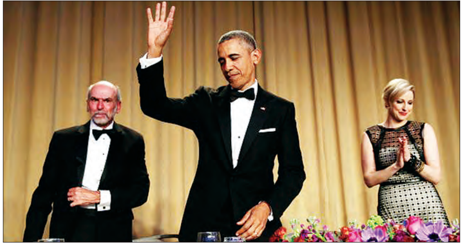
ရသူ ဂျိုးအားနက်က သတင်းထောက် များကို ပြောသည်။

ပျော်စရာများကို ဖန်တီးပေးထား သော ညစာစားပွဲဦးစားပေးအစီအစဉ် ခုနစ်ခုကို သမ္မတက အံ့အားသင့်စေရန် ဆောင်ရွက်ထားသဖြင့် ထုတ်ပြန်ထား ခြင်းမရှိကြောင်း အိမ်ဖြူတော်ပြောခွင့်