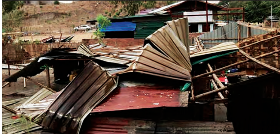
စလင်း မေ ၁