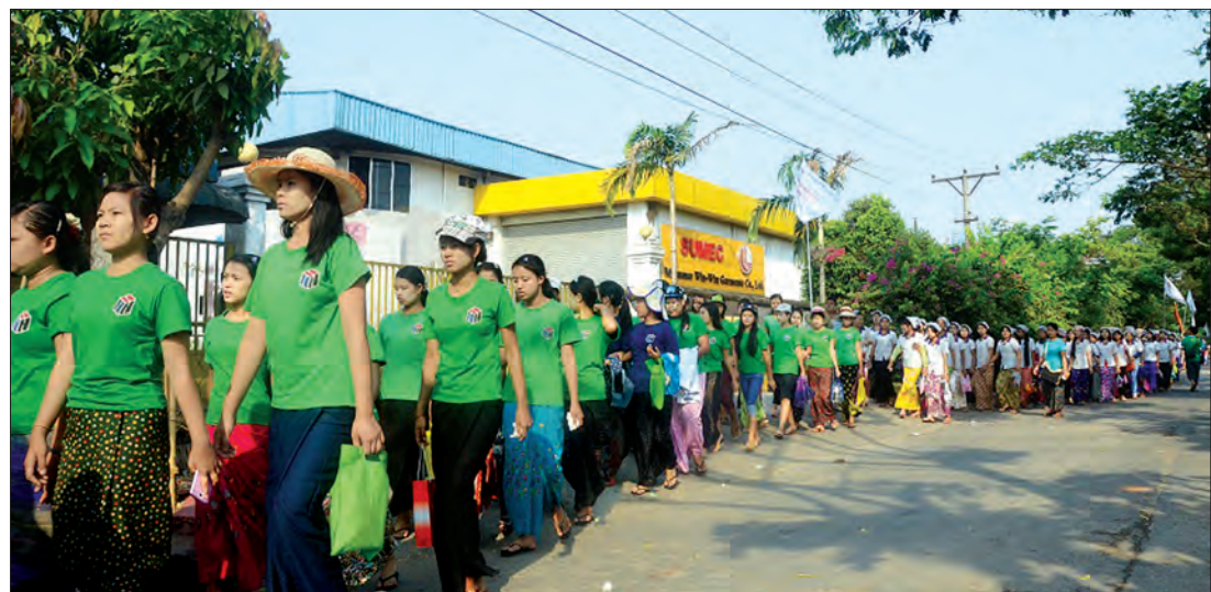
စာမျက်နှာ ၅ ကော်လံ ၁ ◆

ရန်ကုန် မေ ၁ မေလ ၁ ရက်နေ့တွင် ကျရောက်သည့် အပြည်ပြည်ဆိုင်ရာ အလုပ်သမားနေ့ အထိမ်းအမှတ် အခမ်းအနားကို ရန်ကုန်တိုင်း ဒေသကြီး လှိုင်သာယာမြို့နယ် စက်မှုဇုန်(၂)ရိ အားကစား ကွင်း၌ ယနေ့နံနက်က စည်ကားသိုက်မြိုက်စွာ ကျင်းပသည်။ အခမ်းအနား မစတင်မီ လှိုင်သာယာမြို့နယ်ရှိ စက်ရုံ၊ အလုပ်ရုံ ၁၅ ရုံ မှ အလုပ်သမား ၁၅၀၀ ခန့်က အဆိုပါမြို့နယ် ရှိ နဝဒေမှတ်တိုင်၌ နံနက် ၆ နာရီခန့်မှစတင်၍ လူများစုဝေးကာ နံနက် ၈ နာရီတွင် သက်ဆိုင်ရာ အလုပ်သမားသမဂ္ဂအလံများကို ကိုင်ဆောင်၍ အပြည်ပြည်ဆိုင်ရာ အလုပ်သမားနေ့ကို ဂုဏ်ပြု သည့်အနေဖြင့် အခမ်းအနားကျင်းပမည့်နေရာသို့ လမ်းလျှောက် ချီတက်ခဲ့ကြသည်။