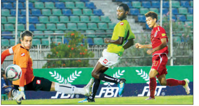
လက်ရွေးစင်အသင်းနှင့် MNL ညွှန်ပေါင်းအသင်းတို့ယှဉ်ပြိုင်ကစားနေစဉ်

သတင်း-အေကေလင်း