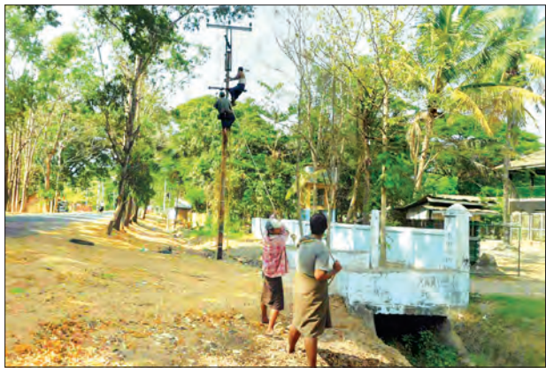
ပဲခူးတိုင်းဒေသကြီးအနောက်ပိုင်း ပြည်ခရိုင် ပုတီးကုန်းမြို့တွင် လျှပ်စစ် အန္တရာယ်ကင်းရှင်းရေးနှင့် ဓာတ်အားပြတ်တောက်မှု လျော့နည်းရေးအတွက် ရဲစခန်း (မြို့မ) ထရန်စဖော်မာမှ အထက်ကျောင်းရေထိ ကြေးကြိုး HDBC No.8 များကို HDBC No.4 ကြေးကြိုးများဖြင့်လှဲလှယ်ခြင်း၊ ၁၁ ကေစီ လိုင်းနှင့် မလွတ်ကင်းသော သစ်ပင်သစ်ကိုင်းများကို ခုတ်ထွင်ရှင်းလင်းခြင်း တို့ကို မြို့လျှပ်စစ်မှူးနှင့် လိုင်းဝန်ထမ်းများက ဆောင်ရွက်စဉ် (မြို့နယ် ပြန်/ဆက်)