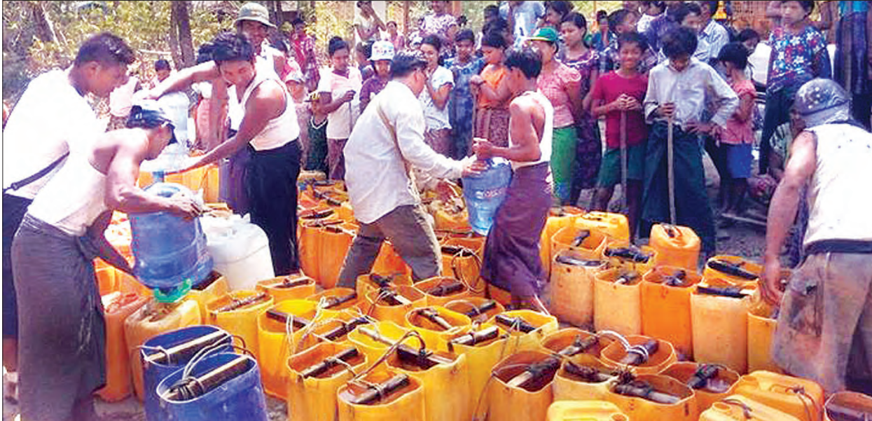
ရန်ကုန်တိုင်းဒေသကြီး သုံးခွမြို့နယ်အတွင်းရှိ သောက်သုံးရေအခက်အခဲရှိသော ကျေးရွာများတွင် သန့်ရှင်းသော သောက်သုံးရေရရှိ စေရန်နှင့် သောက်သုံးရေပြတ်လပ်မှုမရှိစေရေးအတွက် စေတနာအလှူရှင်များက ကျေးရွာအရောက်သွားရောက်လှူဒါန်းလျက်ရှိရာ ဧပြီလနောက်ဆုံးပတ်က ကိုဌေးလှိုင်ဦးဦးဆောင်သော ကိုရီးယားနိုင်ငံရောက်သုံးခွမြို့သားများအဖွဲ့က စေတနာကျေးရွာသို့ သွားရောက်ကာ ရေဖြန့်ဝေလှူဒါန်းခဲ့ကြစဉ်။ ကိုကျော်(သုံးခွ)

ဘားအံ ကရင်ပြည်နယ် ခရိုင်သုံးခရိုင်အတွင်းရှိ ကျေးရွာ ၂၃ ရွာတွင် ကျေးလက်ဒေသဖွံ့ဖြိုးတိုးတက်ရေးဦးစီးဌာနမှ သောက်သုံးရေဖြန့်ဝေပေးခြင်းကို ဆောင်ရွက်လျက်ရှိရာ ဧပြီလ ၃၀ ရက်က ဘားအံမြို့ လျာကာကျေးရွာတွင် သောက်သုံးရေဖြန့်ဝေပေးခဲ့ကြောင်း သိရသည်။ အဆိုပါကျေးရွာ ၂၃ ရွာသို့ ကွင်းဆင်း၍ ရေပြတ်လပ်မှုသတင်းများရယူကာ ယာယီရေသိုလှောင်ကန်များ ဆောက်လုပ်ပြီး ရေဖြန့်ဝေခြင်းလုပ်ငန်းများ ဆောင်ရွက်ပေးလျက်ရှိကြောင်း သိရသည်။ နေမျိုးလွင်( ပြန်/ဆက်)