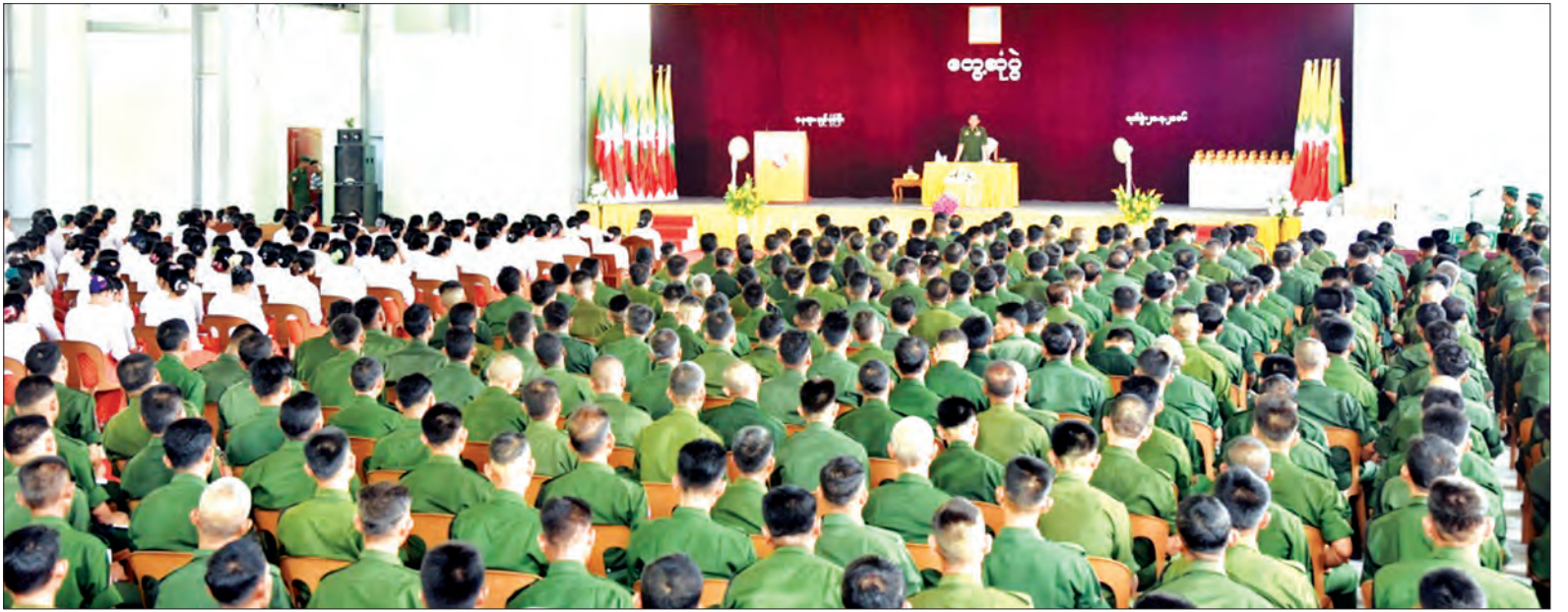
တပ်မတော်ကာကွယ်ရေးဦးစီးချုပ် ဗိုလ်ချုပ်မှူးကြီးမင်းအောင်လှိုင် ပျဉ်းပုံကြီးတပ်နယ်မှ အရာရှိ၊ စစ်သည်၊ မိသားစုများနှင့် တွေ့ဆုံအမှာစကားပြောကြားစဉ်

တပ်မတော်၏ အဓိကတာဝန်မှာ တိုင်းပြည်ကိုကာကွယ်ရန်၊ ပြည်သူ့ လူထုကို စောင့်ရှောက်ရန်နှင့် နိုင်ငံ ဖွံ့ဖြိုးတိုးတက်ရေး လုပ်ငန်းများတွင် ကူညီဆောင်ရွက်ရန် ဖြစ်ကြောင်း၊ ထိုသို့ လုပ်ဆောင်ရာတွင် ခေါင်းဆောင်များ၏ မှန်ကန်သော ဦးဆောင်မှု၊ ညီညွတ်မှုတို့သည် အုပ်ချုပ်မှုအောက်တွင် လက်အောက် မှလည်း တရားနည်းလမ်းကျစွာ တိုက်တွန်း မှာကြားချက်များကို အလေးထား လိုက်နာရမည်ဖြစ် ကြောင်း၊ လက်ရှိတာဝန်ထမ်းဆောင် နေသည့် ကာလတွင် မိမိတို့အားလုံး ထိုက်ထိုက်တန်တန် ကြိုးစားလုပ် ဆောင်ရန် တိုက်တွန်းလိုကြောင်း တပ်မတော်ကာကွယ်ရေး ဦးစီးချုပ် ဗိုလ်ချုပ်မှူးကြီး မင်းအောင်လှိုင်က ပျဉ်းပုံကြီးတပ်နယ်မှ အရာရှိ၊ စစ်သည်၊ မိသားစုများနှင့် တွေ့ဆုံစဉ် ထည့်သွင်းပြောကြားသည်။