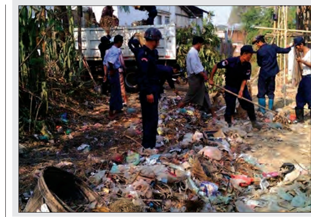
မကျေးတိုင်းဒေသကြီး၊ သရက်ခရိုင် အောင်လံမြို့ ဈေးကုန်းရပ်ကွက်ဘုန်းကြီးကျောင်း လမ်းပေါ်တွင် စည်းကမ်းမဲ့စွန့်ပစ်ထားသော အမှိုက်များအား မြို့နယ်စည်ပင်သာယာရေးအဖွဲ့ ဝန်ထမ်းများ၊ ရပ်ကွက်အရန် မီးသတ်တပ်ဖွဲ့ဝင်များ ဧပြီ ၂၆ ရက်က စုပေါင်းသန့်ရှင်းရေး ဆောင်ရွက်ပေးခဲ့စဉ်။