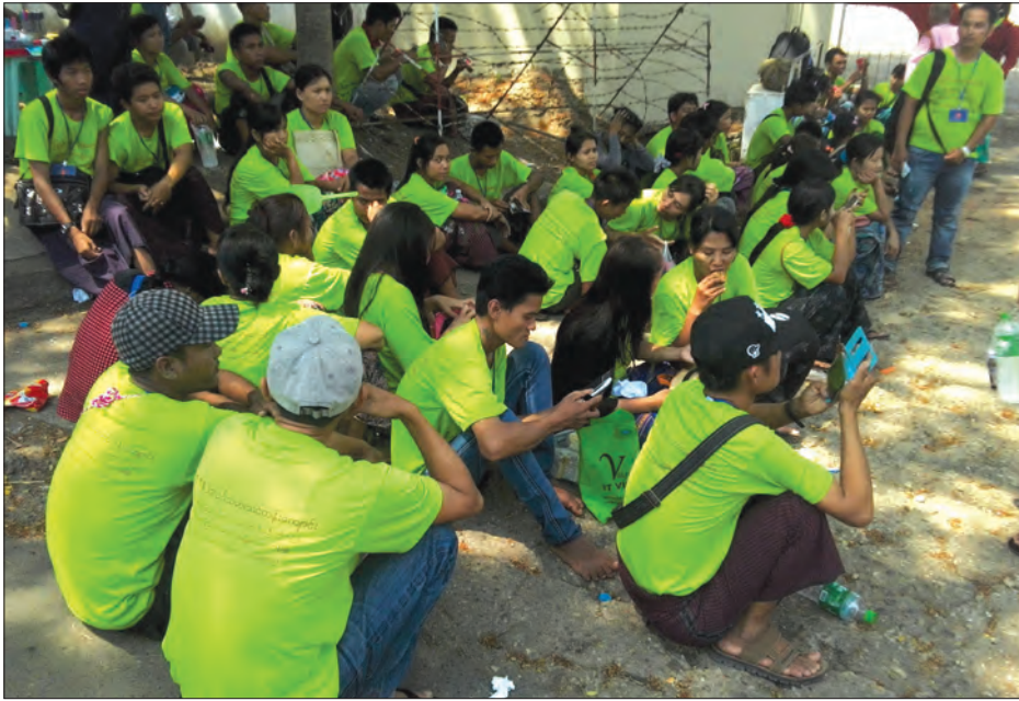
နတ်မောက်မြို့နယ် ရွှေပန်းတောကျေးရွာမှ လူငယ်လူရွယ်များ ဧပြီ ၂၅ ရက်က မြန်မာနိုင်ငံကူးလက်မှတ်များ စောင့်ဆိုင်းနေစဉ်။

“ကျွန်ုပ်တို့က အခုရွာမှာ အလုပ်မလုပ်ကြတော့ဘူး။ ရွာမှာက တစ်နေ့လုပ်ခ ငွေကျပ် ၃၀၀၀ ပဲရတာ။ အဲဒါနဲ့တိုင်းအလုပ် မရှိဘူး။ အခုလို မိုးကခေါင်၊ နေကပူဆိုရင် ဘာအလုပ်မှ မရှိတာ။ ရှိတာလေးထိုင်စားပြန်တော့လည်း အကြွေးတင်လို့ မပြီးတော့ဘူး။ အခုရွာမှာက လူငယ်တွေ ထိုင်းကို သွားတယ်။ နည်းနည်းအဆင်ပြေရင် မလေးကိုသွားတယ်။ ဘာပဲပြောပြော ကျွန်ုပ်တို့ ဟိုမှာတစ်လ ဘတ် ၆၀၀၀ လောက်ရတယ်။ ဘတ်ငွေ အတက်အကျအပေါ် မူတည်ပြီး ငွေကျပ်နှစ်သိန်းကနေ သုံးသိန်းလောက်တော့ရတယ်။ ရွာ