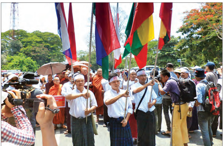
ရိုဟင်ဂျာလူမှုအသိုက်အဝန်းဟု သုံးစွဲခဲ့ခြင်းကြောင့် စိတန်းဆန္ဒထုတ်ဖော်စဉ်