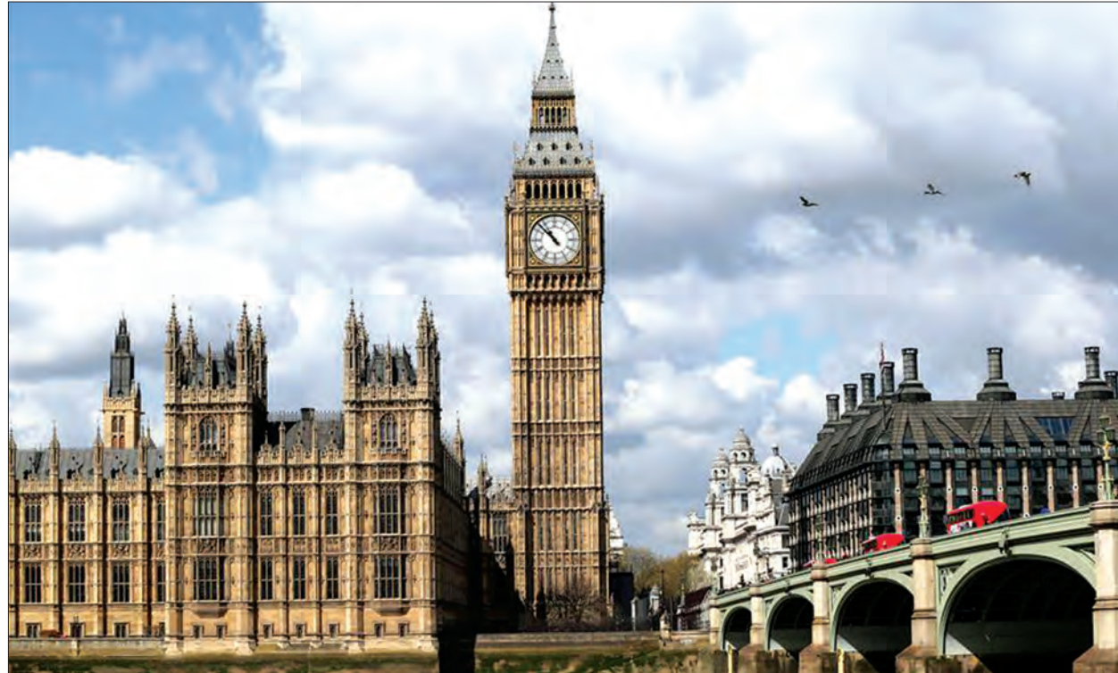
ဗြိတိန်နိုင်ငံ လန်ဒန်မြို့လယ်ရှိ နာမည်ကျော် ဘစ်ဘန်နာရီစင်ကြီးကို ဧပြီ ၂၇ ရက်က ရိုက်ထားသောဓာတ်ပုံတွင် တွေ့ရစဉ်။

လန်ဒန်ရှိနာမည်ကျော် ဘစ်ဘန်နာရီစင်ကြီး ပြန်လည်ပြုပြင်မွမ်းမံရန်အတွက် အမေရိကန်ဒေါ်လာ ၄၃ သန်း ကုန်ကျမည်ဖြစ်ကြောင်း ဗြိတိန်ပါလီမန်က အင်္ဂါနေ့တွင် ထုတ်ပြန်ကြေညာခဲ့သည်။ နာရီစင်ကြီးပြန်လည်ပြုပြင်မွမ်းမံရန်အတွက် သုံးနှစ်ကြာမည်ဖြစ်ပြီး ၂၀၁၇ ခုနှစ်အစောပိုင်းတွင် စတင်ရန်ခန့်မှန်းထားသည်။ ဘစ်ဘန်နာရီစင်ကြီး ပြန်လည်ပြုပြင်နေချိန်တွင် ယင်းနာရီစင်မှ နာရီသံ ကြားရမည်မဟုတ်ကြောင်း သိရသည်။ (ဆင်ဟွာ)