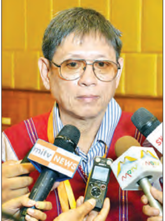
စောအိုင်းဇော်မိုး

ငြိမ်းချမ်းရေးဆိုတာ အစိုးရတစ်ဖွဲ့တည်းရဲ့ လုပ်ငန်း စဉ်မဟုတ်ပါဘူး။ နိုင်ငံတော်ရဲ့လုပ်ငန်းစဉ်ပါ။ ဆိုလိုတာ က အစိုးရပြောင်းသွားလည်း ငြိမ်းချမ်းရေးအောင်မြင်ဖြစ် ထွန်းသည်အထိ ဆက်ပြီးသယ်ဆောင်သွားရမှာ ဖြစ် ပါတယ်။ အရင်အစိုးရလက်ထက်က အစပျိုးနိုင်ခဲ့တဲ့ ငြိမ်းချမ်းရေးလုပ်ငန်းစဉ်တွေကို ယခုအစိုးရက ဆက် လက်သယ်ဆောင်သွားဖို့ ဖြစ်ပါတယ်။