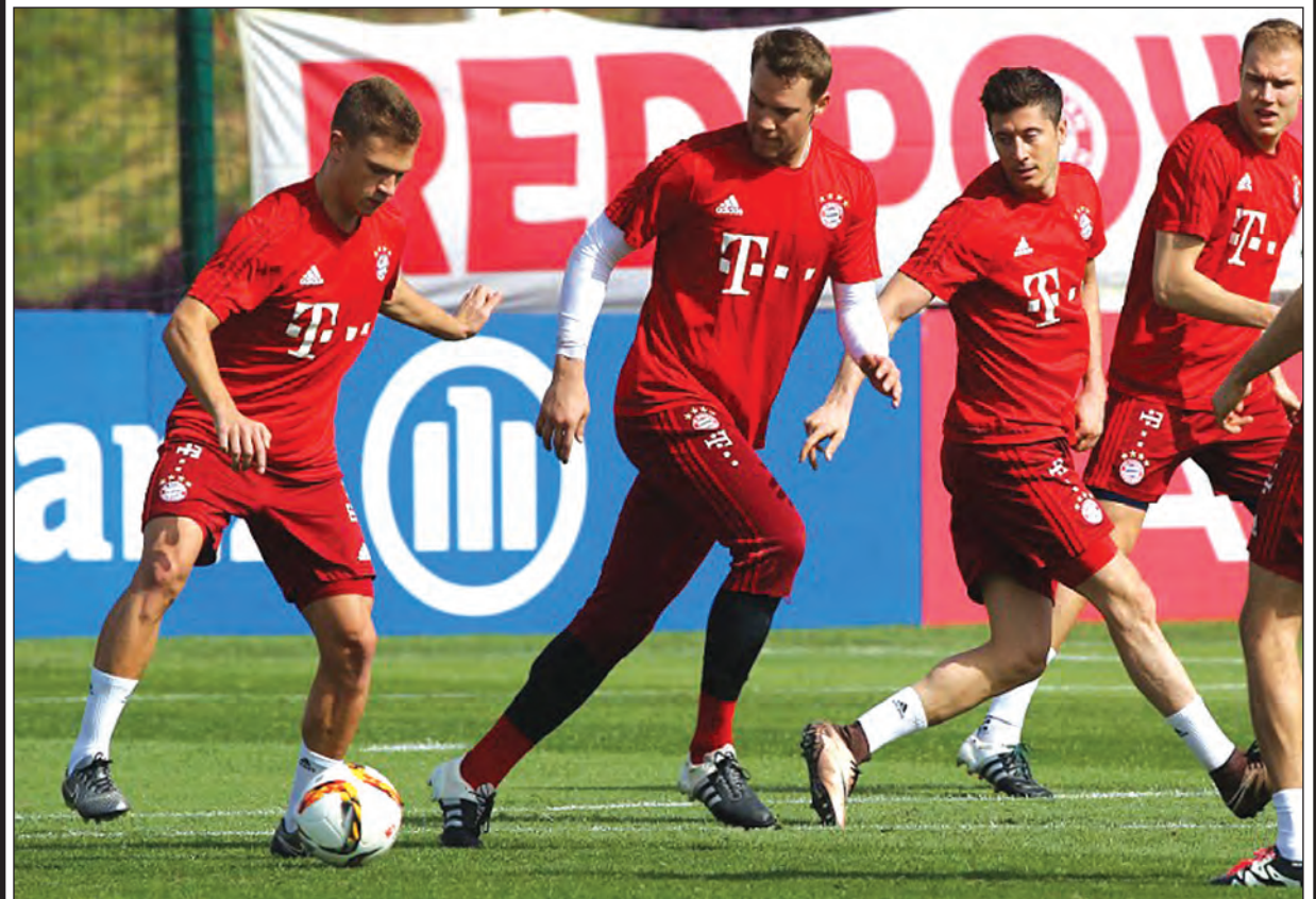
ဂျာမနီမြောက် ဘွန်ဒက်လီဂါပွဲစဉ်(၃၂)ကို ဧပြီ ၃၀ ရက်မှာ ကစားဖို့ရှိနေပြီး ရာသီကုန် ပန်းဝင်ချိန်နီးကပ်လာတာနဲ့အမျှ အသင်းတိုင်း ခြေကုန်ဖွင့်ပြီး ယှဉ်ပြိုင်နေကြပြီဖြစ်ပါတယ်။ သုံးနှစ်ဆက်တိုက် ဘွန်ဒက်လီဂါကို ဆွတ်ခူးနိုင်ရေးအတွက် အားထုတ်နေတဲ့ တိုင်ယန်မြူးနစ်တို့ကတော့ ပွဲတိုင်း အမှားအယွင်းမခံတော့ဘဲ ပြိုင်ဘက်တိုင်းကို အလေးထားကစားနေတာမို့ ဒီတစ်ပတ်ပွဲစဉ်မှာလည်း နိုင်ပွဲဆက်ဦးမယ့်အနေအထားရှိနေပြန်ပါတယ်။

တိုင်ယန်မြူးနစ်နှင့်ဂလာဘတ် တိုင်ယန်မြူးနစ်တို့က ဂလာဘတ်နဲ့ဆုံတိုင်း ရှုံးပွဲမရှိခဲ့ပေမယ့် အခုနောက်ဆုံးနှစ်ပွဲကစားခဲ့ရာ မှာ နှစ်ပွဲစလုံးရှုံးထားခဲ့တာမို့ ဒီပွဲကို သတိကြီးကြီး ထားပြီး ကစားမှရပါလိမ့်မယ်။ လောလောဆယ် မှာတော့ တိုင်ယန်မြူးနစ်တို့က ဘွန်ဒက်လီဂါမှာ ငါးပွဲဆက်တိုက်နိုင်ပွဲရရှိနေတာမို့ အခုပွဲမှာလည်း အိမ်ကွင်းဖြစ်တာကြောင့် နိုင်ပွဲရအောင် ပုံဖော်ပါ လိမ့်မယ်။ ဂလာဘတ်တို့ကတော့ ခြေစွမ်းကျဆင်း နေပြီး ရှုံးပွဲတွေ ဆက်တိုက်ကြုံတွေ့နေရတာမို့ အခုပွဲမှာ တိုင်ယန်မြူးနစ်တို့ရဲ့အောင်ပွဲဖြစ်သွား ပါလိမ့်မယ်။