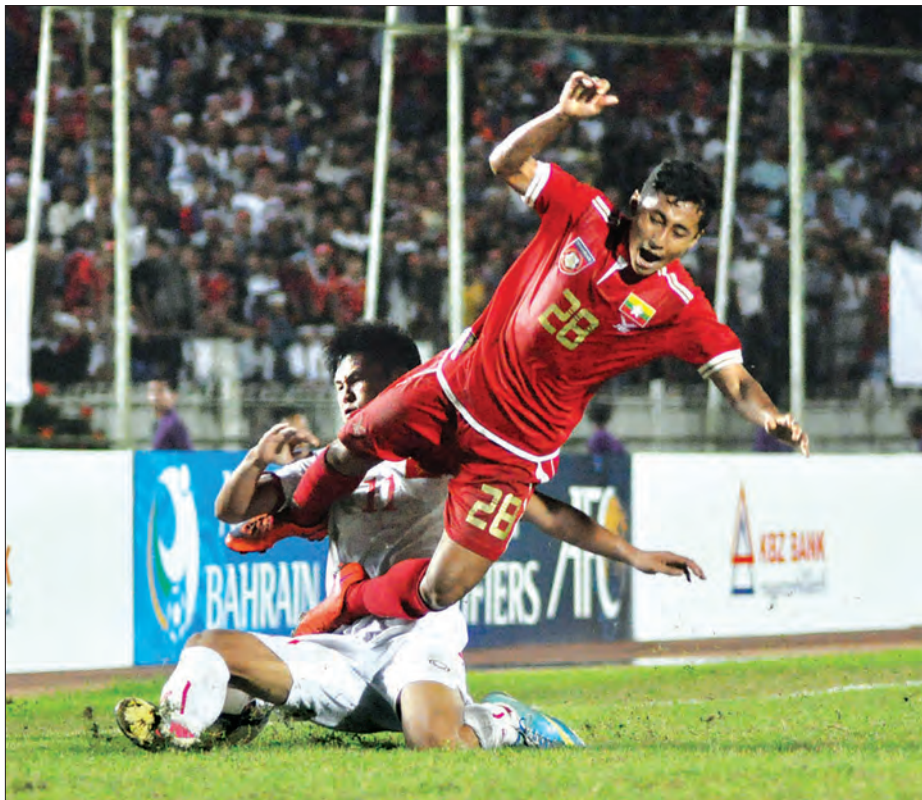
၂၀၁၅ ခုနှစ်က အာရှခြေစစ်ပွဲတွင် မြန်မာအသင်း ယှဉ်ပြိုင်နေစဉ်

သတင်း-ညိုမြတ်သော်တာ၊ ဓာတ်ပုံ-မိုးသော်ဇင်