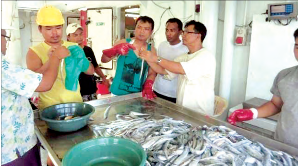
၂၀၁၅ ခုနှစ်က နော်ဝေငါးသုတေသနပညာရှင်များ လာရောက်သုတေသနပြုစဉ် သတင်း-မောင်စိန်လွင်၊ ဓာတ်ပုံ-မင်းထက်