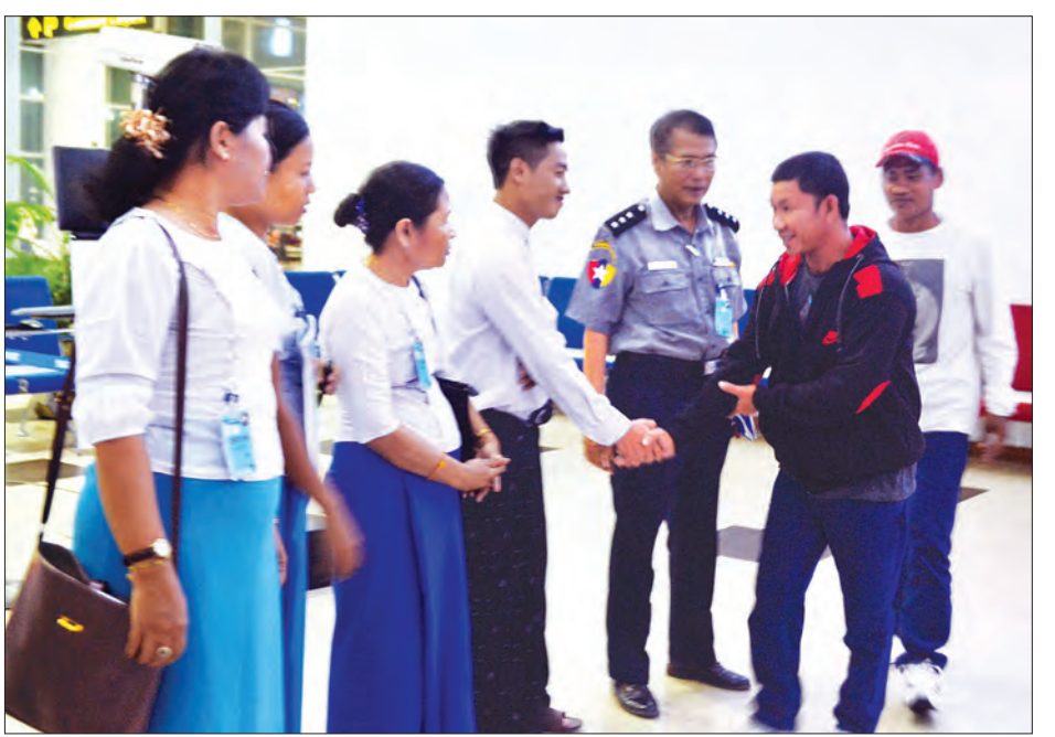
အင်ဒိုနီးရှားနိုင်ငံတွင် လူကုန်ကူးခံရသူ မြန်မာအမျိုးသားနှစ်ဦး ဧပြီ ၂၇ ရက် ညနေပိုင်းက ထိုင်းလေကြောင်းလိုင်းဖြင့် မြန်မာနိုင်ငံသို့ ပြန်လည်ရောက်ရှိလာရာ ရန်ကင်းတိုင်းဒေသကြီး လူမှုဝန်ထမ်းဦးစီးဌာနမှ ဒုတိယဥက္ကဋ္ဌကြားရေးမှူး နှင့် တာဝန်ရှိသူများ၊ လူကုန်ကူးမှုတားဆီးနှိမ်နင်းရေးရဲတပ်ဖွဲ့မှ တာဝန်ရှိသူများ၊ IOM(Myanmar) မှ တာဝန်ရှိသူများက ရန်ကင်းအပြည်ပြည်ဆိုင်ရာလေဆိပ်၌ ကြိုဆိုကြစဉ် မျိုးမင်းသိန်း(မရမ်းကုန်း) များ ဖမ်းဆီးခံရမှုများနှင့် ပတ်သက်၍

တာချီလိတ် ဧပြီ ၂၇ ထိုင်းနိုင်ငံ၌ နေထိုင်အလုပ်လုပ်ကိုင်နေသည့် မြန်မာ လုပ်သားများမှ ထိုင်းနိုင်ငံတွင် ဆက်လက်နေထိုင်လိုခြင်း မရှိတော့ဘဲ အမိန့်ထုတ်ပေးရန် အခက်အခဲ ဖြစ်ပေါ်လျက်ရှိရာ ထိုင်းနိုင်ငံဆိုင်ရာ မြန်မာကောင်စစ် ဝန်ထုပ်ထွေးရုံးမှ အထူးစောင့်ရှောက်ရေးနှင့် စေတနာ့စိုက်ရေး ကော်မတီ (CNCMC) တို့၏ အကူအညီဖြင့် ဧပြီ ၂၇ ရက်တွင် ပြန်လည်ရောက်ရှိခဲ့ကြသည်။