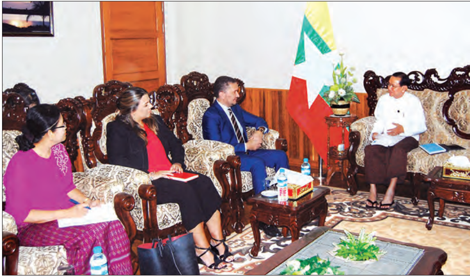
အရေးတန်းတူညီမျှမှုနှင့် အရည်ပေးအပ်ခြင်းတို့အပေါ် စစ်တမ်း ဆောင်ရွက်ထားရှိမှု အခြေအနေ၊ အချင်းအပေါ်မူတည်၍ တာဝန် ကောက်ယူရေးဆိုင်ရာ အစီရင်ခံစာ ဗဟိုဝန်ထမ်းတက္ကသိုလ်များတွင် ဖွင့်

ပြည်ထောင်စုရာထူးဝန်အဖွဲ့ဥက္ကဋ္ဌ ဒေါက်တာ ဝင်းသိမ်းသည် ကုလသမဂ္ဂ ဖွံ့ဖြိုးမှုအစီအစဉ် (United Nations Development Programme - UNDP) မှ Country Director ဖြစ်သူ Mr. Toily Kurbanov ခေါင်းဆောင်သော ကိုယ်စားလှယ် အဖွဲ့အား ဧပြီ ၂၆ ရက် မွန်းလွဲ ၁ နာရီတွင် နေပြည်တော် ပြည်ထောင်စု ရာထူးဝန်အဖွဲ့ဥက္ကဋ္ဌရုံး ဧည့်ခန်းမ၌ တွေ့ဆုံသည်။ (ယာဝုံ)