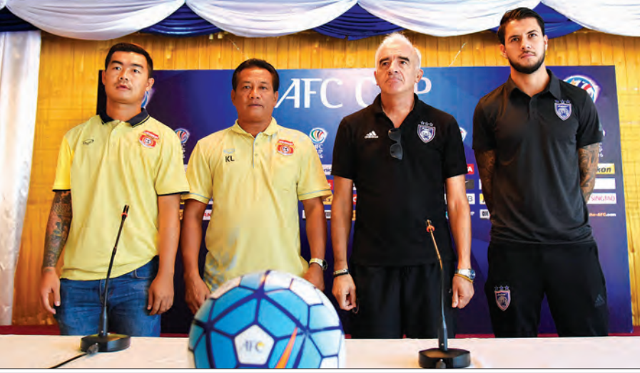
ဧရာဝတီနှင့် ဂျီဟိုဒါရူးလ်အသင်းနည်းပြနှင့် ကစားသမားများအား ပွဲကြိုသတင်းစာရှင်းလင်းပွဲတွင် တွေ့ရစဉ် ဓာတ်ပုံ-ဖိုးသော်ဇင်

ရန်ကုန် ဧပြီ ၂၆ ၂၀၁၆ ရာသီ AFC Cup ပြိုင်ပွဲ အုပ်စုပွဲစဉ်(၅)အဖြစ် ယှဉ်ပြိုင် ကစားမည့် ဧရာဝတီအသင်းနှင့် မလေးရှားကလပ် ဂျီဟိုဒါရူးလ်အသင်း တို့၏ ပွဲကြိုသတင်းစာရှင်းလင်းပွဲကို ယနေ့နံနက်ပိုင်းက MFF ရုံး၌ ပြုလုပ် သည်။