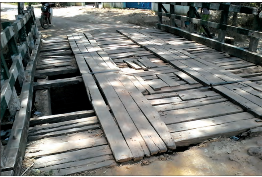
များ စိုးရိမ်လျက်ရှိကြောင်း သိရသည်။

တိုက်ကြီးမြို့ အိုးတန်းရပ် နတ်စဉ်လမ်းတွင် စည်ပင်သာယာမှု တာဝန်ယူဆောင်ရွက်ထားသော တံတားမှာ ယခုအခါ အခင်းများပျက်စီးကျိုးပေါက်နေသည်မှာ ကြာမြင့်စွာရှိ တံတားပေါ်တွင် သွားလာနေကြသော ကား၊ ဆိုင်ကယ် စက်ဘီးများ ကျုံ့ကျခြင်းတို့ဖြစ်ပေါ်လျက်ရှိပါသည်။ “ဒီတံတားက မိုးတွင်းထဲက ကျိုးတာပါ။ ညဘက်ဆိုရင် ဆိုင်ကယ်၊ ကား၊ စက်ဘီးတွေ ခဏခဏ ပြုတ်ကျတယ်။ ကုန်ကားတွေ ကုန်နဲ့ဖြတ်တော့ပိုကျိုးတာပေါ့။ တာဝန်ရှိသူတွေကိုပြောတော့ စည်ပင်သာယာ ဘတ်လျက်မကျသေးလို့ ပြောတယ်။ ကျွန်တော်တို့ကတော့ အမြန်ပြင်ပေးစေချင်ပါတယ်” ဟု ရပ်ကွက်နေသူတစ်ဦးက ပြောသည်။ နတ်စဉ်လမ်းတံတားပေါ်တွင် ဝင်ကားများ၊ အခြားကုန်တင်ကားများ ဖြတ်သွားမှုကြောင့် ဝန်နှင့် ဤ မီးဘေးအန္တရာယ် ကြုံတွေ့ပါက တံတားခံနိုင်အား မမျှတမှုကြောင့် လည်း မီးသတ်ကားများ မသွားပျက်စီးခြင်းဖြစ်သည်။ နွေရာသီဖြစ်