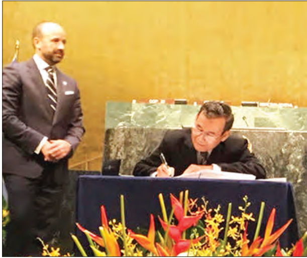
ရာသီဥတုပြောင်းလဲရေးဆိုင်ရာ ပါရီသဘောတူညီချက် လက်မှတ်ရေးထိုးပွဲ အခမ်းအနား၌ ပြည်ထောင်စုဝန်ကြီး ဦးအုန်းဝင်း နိုင်ငံကိုယ်စားပြု လက်မှတ်ရေးထိုးစဉ်

အမေရိကန်ပြည်ထောင်စု နယူးယောက်မြို့ရှိ ကုလသမဂ္ဂရုံးချုပ်၌ ဧပြီ ၂၁ ရက်က ကျင်းပသည့် စဉ်ဆက်မပြတ်ဖွံ့ဖြိုးတိုးတက်မှု ရည်မှန်းချက်ဆိုင်ရာ ၂၀၃၀ အစီအစဉ်အား အကောင်အထည်ဖော်ရေးဆိုင်ရာ အဆင့်မြင့်အစည်း အဝေးနှင့် ၂၀၁၆ ခုနှစ် ဧပြီ ၂၂ ရက်တွင် ကျင်းပသည့် ရာသီဥတုပြောင်းလဲ မှုဆိုင်ရာ ပါရီသဘောတူညီချက် လက်မှတ်ရေးထိုးပွဲ အခမ်းအနားသို့ သယ်ဇာတနှင့် သဘာဝပတ်ဝန်းကျင်ထိန်းသိမ်းရေးဝန်ကြီးဌာန ပြည်ထောင်စု ဝန်ကြီး ဦးအုန်းဝင်းနှင့်အဖွဲ့ တက်ရောက်ခဲ့သည်။