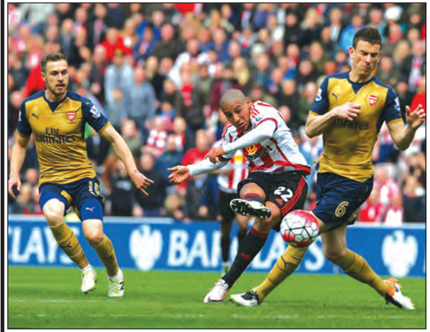
ကောင်းမြတ်သူ ➤ စုစည်းသည့်

ပရီမီယာလိဂ်မှာ တန်းဆင်းလွတ်ဖို့အခြေအနေကောင်းနေတဲ့ ဆန်းဒါးလန်းဟာ အတော်လေးစိတ်ဝင်စားစရာကောင်းနေတာပါ။ လောလောဆယ်မှာတော့ ဆန်းဒါးလန်းက အာဆင်နယ်ကို ဂိုးမရှိ သရေကစားပြီးတဲ့နောက် တန်းဆင်းလွတ်မြောက်လာပါတယ်။ သို့ပေမယ့် အောက်ဆုံးသုံးသင်းအနက် နော့ဝစ်ချ်နဲ့ နယူးကာဆယ်တို့က အမှတ်တူတွေနဲ့ ကပ်လိုက်နေတာကြောင့် လာမယ့်လက်ကျန်ပွဲသုံးပွဲဟာ အဆုံးအဖြတ်ဖြစ်လာဖို့ရှိပါတယ်။ အက်စ်တွန်ဗီလာကတော့ အောက်ဆုံးမှာ ရမှတ် ၁၆ မှတ်နဲ့ တန်းဆင်းဖို့သေချာနေတာပါ။ နယူးကာဆယ်နဲ့ နော့ဝစ်ချ်တို့ကတော့ ဆန်းဒါးလန်းရဲ့အဓိကပြိုင်ဘက်အနေအထားမှာရှိပါတယ်။ ဒီသုံးသင်းထဲက လက်ကျန်ပွဲမှာ အနိုင်ကစားနိုင်တဲ့အသင်းက တန်းဆင်းလွတ်မြောက်သွားမှာဖြစ်ပါတယ်။ ဆန်းဒါးလန်းကတော့ တန်းဆင်းလွတ်ဖို့အခြေအနေကောင်းနေပါတယ်။