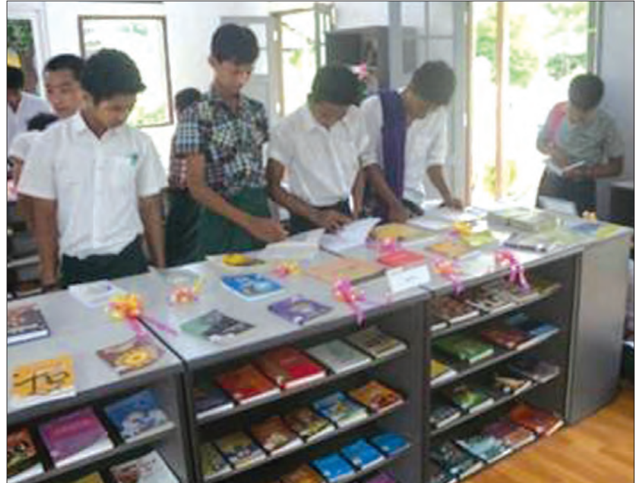
ကျေးမူးမြို့နယ် ဒေါ်ခင်ကြည်ဖောင်ဒေးရှင်း စာကြည့်တိုက်အတွင်း ကျောင်းသားလူငယ်များ စာအုပ်စာစောင်များ လာရောက်ငှားရမ်းဖတ်ရှုကြစဉ်

ယနေ့ ၂၁ ရာစုတွင် စာကြည့်တိုက်များသည် ရင်းနှီးမြုပ်နှံလျှင် မြှုပ်နှံသလောက် အကျိုးရှိသည့် အကောင်းဆုံးသော လုပ်ငန်းကိုင်ဖက်များဖြစ်သည်ဟု ကမ္ဘာ့နိုင်ငံအများစုက လက်ခံထားကြသည်။ မြန်မာနိုင်ငံတွင် စာကြည့်တိုက်များ ပုံစံအမျိုးမျိုးဖြင့် တည်ရှိနေကြသော်လည်း ရေရှည်တည်တံ့ခိုင်မြဲရန် အခက်