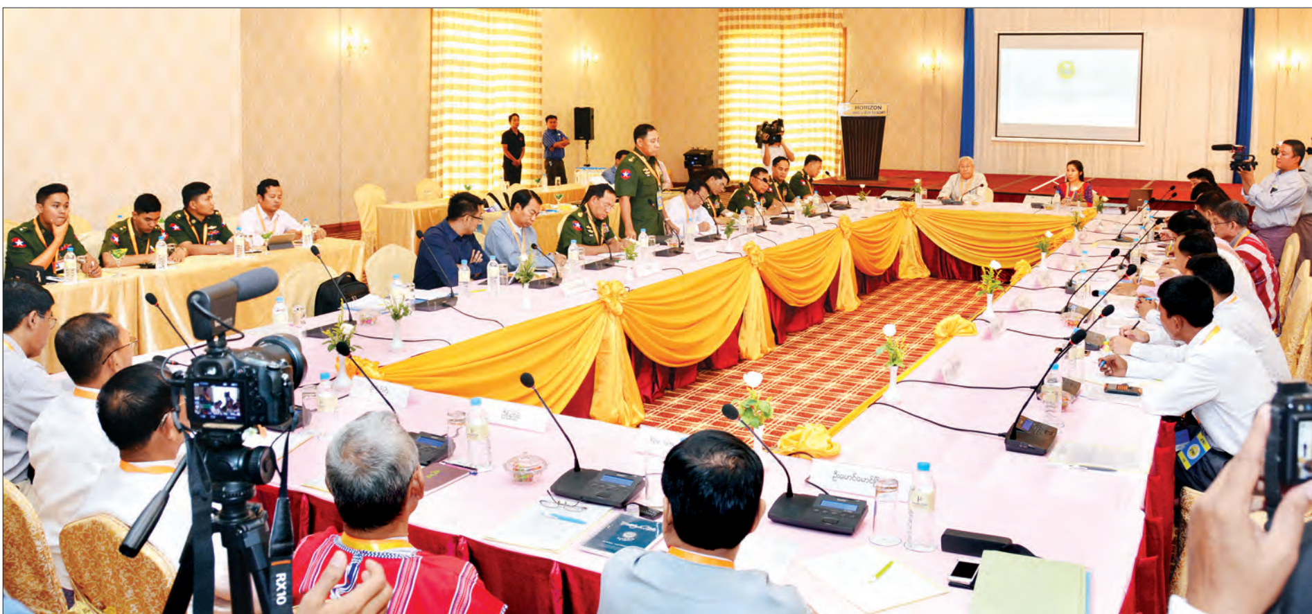
ပြည်ထောင်စုအဆင့် ပစ်ခတ်တိုက်ခိုက်မှုရပ်စဲရေးဆိုင်ရာ ပူးတွဲစောင့်ကြည့်ရေးကော်မတီ (JMC) ၏ ပဉ္စမအကြိမ်အစည်းအဝေး ကျင်းပစဉ်