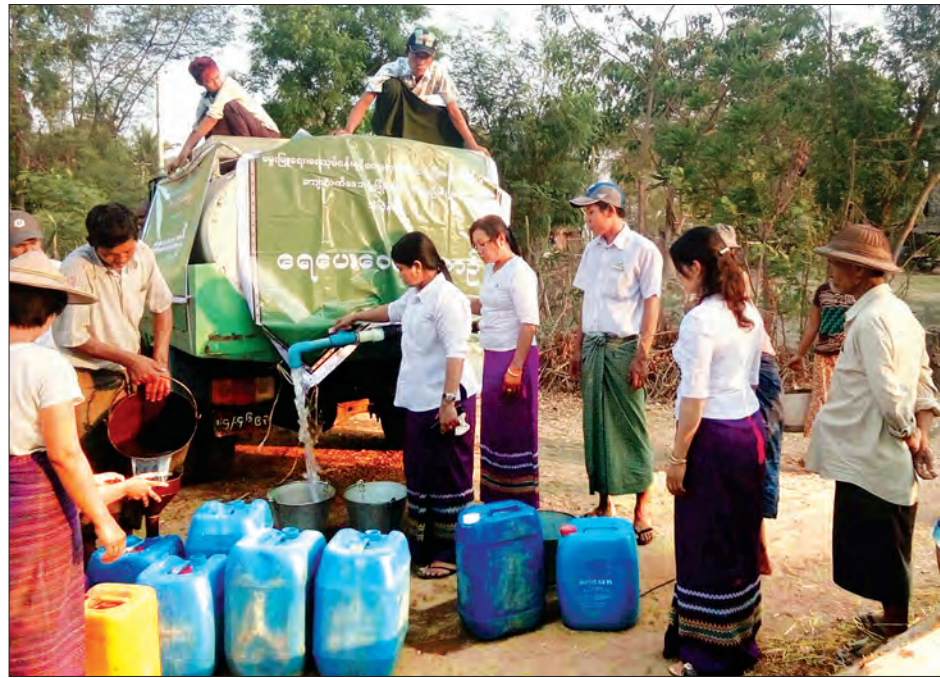
ပဲခူးတိုင်းဒေသကြီး ပြည်ခရိုင် သဲကုန်းမြို့နယ်အတွင်း အယ်နီညီရာသီဥတုအကျိုးသက်ရောက်မှုကြောင့် သောက်သုံးရေပြတ်လပ်မှုဖြစ်ပေါ်စေရေးအတွက် သဲကုန်းမြို့နယ် ကျေးလက်ဒေသဖွံ့ဖြိုးတိုးတက်ရေးဦးစီးဌာန မှ ရေရှားပါးသောကျေးရွာများသို့ သောက်သုံးရေများဖြန့်ဝေပေးလျက်ရှိရာ မြို့နယ်ဦးစီးမှူးနှင့် ဝန်ထမ်းများ ဧပြီ ၂၆ ရက်က သန္ဓေပင်အုပ်စု၊ နွယ်ကောက်အုပ်စု၊ သောင်းမဲလေးကျေးရွာအိမ်ထောင်စုများအတွက် သောက်သုံးရေ ဖြန့်ဝေပေးစဉ် (မြို့နယ် ပြန်/ဆက်)