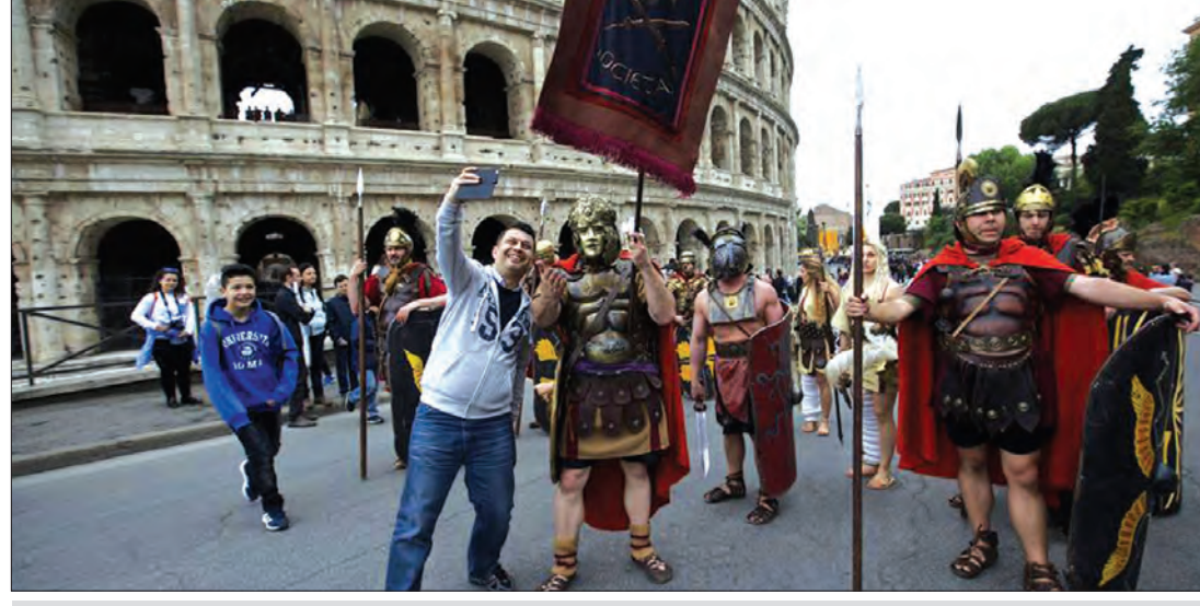
ဧပြီ ၂၄ ရက်က အီတလီမြို့တော် ရောမရှိ ရိုမန်ဂိုရစ်စစ်ရေးပြအခမ်းအနား၌ စစ်သားများဝင်ရောက်ပါဝင်သရုပ်ပြခဲ့ကြသည်။ ဘီစီ ၇၅၃ ခုနှစ်က ရိုမူလက်စ်တည်ထောင်ခဲ့သော ရောမပြည်သည် ၂၇၆၉ ခုနှစ်ထိသို့ ဝင်ရောက်လာခဲ့ပြီဖြစ်သည်။ ရောမပြည်မွေးဖွားလာခြင်းကို ဝတ်စုံများဝတ်ဆင်ခြင်း၊ ကြီးမြတ်သော ရောမအင်ပါယာအဆောင်အယောင်များ ဆင်ယင်ထုံးစံဖြင့် ပြည့်သူများက ဝင်ရောက်ဆင်နွှဲခဲ့ကြစဉ်။ (ဆင်ဟွာ)

ဝါရှင်တန် ဧပြီ ၂၅ အမေရိကန်သမ္မတ ဘားရက်အိုဘားမားသည် ဆီးရီးယားရှိ စစ်သွေးကြွများနှင့် အိုင်အက်စ်အဖွဲ့ကို နှိမ်နင်းရာတွင် အထောက်အကူပြုရန် တပ်ဖွဲ့ဝင် ၂၅၀ ကို ဆီးရီးယားသို့ စေလွှတ်မည်ဖြစ်သည်ဟု အာဏာပိုင်များက ပြောသည်။ ဆီးရီးယားနိုင်ငံအရှေ့မြောက်ဘက်ရှိ ကာဒူများနှင့်ပူးပေါင်း၍ ဆွန်နီအာရပ်များကို ပိုမိုအထောက်အကူပြုနိုင်ရေးရည်ရွယ်၍ စေလွှတ်ခြင်းဖြစ်သည်။ ယခုအစီအစဉ်၌ ဆီးရီးယားရှိ စစ်မက်ဖြစ်ပွားမှုမရှိသောနေရာများတွင် အမေရိကန်တပ်ဖွဲ့ဝင် ၃၀၀ ကို တပ်ဖြန့်ချိထားမည်ဖြစ်သည်။ ဘီဘီစီနှင့် အင်တာပျူးတွင် မစ္စတာအိုဘားမားက မြေပြင်တပ်ဖွဲ့ဝင်များ ဆီးရီးယားသို့ ထပ်မံစေလွှတ်မည်ဟု ပြောသည်။ ယင်းအင်တာပျူး၌ အိုဘားမားက ဆီးရီးယားသို့ စစ်ရေးအရ အကူအညီပေးခြင်းမှာ ရှုပ်ထွေးလှပြီး ဆီးရီးယားပဋိပက္ခကို ဖြေရှင်းနိုင်မည်မဟုတ်ဟု ပြောသည်။ ယခုစေလွှတ်မည့်အဖွဲ့မှာ ဆေးကုသမှုနှင့် ထောက်ပံ့ရေးဝန်ဆောင်မှုလုပ်ငန်းများကို ဆောင်ရွက်မည်တပ်ဖွဲ့ဖြစ်ကြောင်း သိရသည်။ တရားဝင်ကြေညာချက်ကိုမူ သမ္မတအိုဘားမား ဟန်နီဗာသို့ တနင်္လာနေ့၌ သွားရောက်စဉ် ကြေညာမည်ဟု မျှော်လင့်ရသည်။ ဟန်နီဗာ၌ ဗြိတိန်၊ ဂျာမနီ၊ ပြင်သစ်နှင့် အီတလီနိုင်ငံများမှ ခေါင်းဆောင်များနှင့်အတူ ဆီးရီးယားအရေးဆွေးနွေး ကြမည်ဖြစ်သည်။ (ဘီဘီစီ)