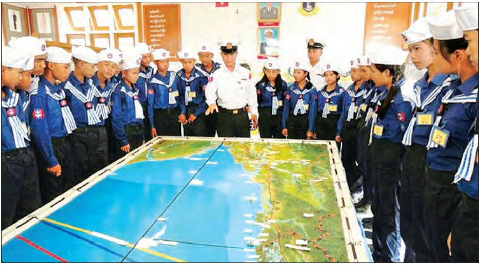
ရေကြောင်းလူငယ်အခြေခံသင်တန်းနှင့် အဆင့်မြှင့်သင်တန်းရှိ ကျောင်းသား ကျောင်းသူများအား သင်ကြားပို့ချစဉ်

အဆိုပါ ရေကြောင်းလူငယ် အခြေခံသင်တန်း အမှတ်စဉ်(၁/၂၀၁၆) ကို သင်တန်းသား သင်တန်းသူ ၆၃ ဦးဖြင့် လည်းကောင်း၊ ရေကြောင်းလူငယ်တန်းမြှင့်သင်တန်း အမှတ်စဉ်(၁/၂၀၁၆) ကို သင်တန်းသား သင်တန်းသူ ၂၇ ဦးဖြင့် လည်းကောင်း ယနေ့ နံနက်ပိုင်းတွင် ဧရာဝတီရေတပ်စခန်းဌာနချုပ် ရတနာပုံခန်းမ၌ဖွင့်လှစ်ရာ စစ်ဦးစီးအရာရှိချုပ်(ရေ) ဗိုလ်မှူးချုပ် မိုးအောင် တက်ရောက်၍ အဖွင့်အမှာစကားပြောကြားပြီး ဖွင့်လှစ်ပေးခဲ့ခြင်းဖြစ်သည်။