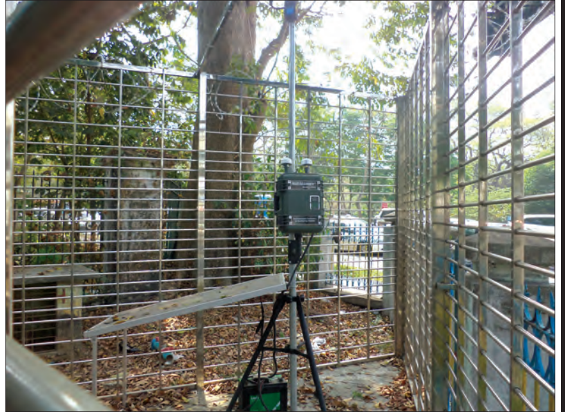
ကမာရွတ်မြို့နယ် လှည်းတန်းမီးဖိုခန်းအနီးတပ်ဆင်ထားသော လေထုအရည်အသွေး တိုင်းတာရေးစက်

မော်တော်ယာဉ်များ၊ စက်ရုံအလုပ်ရုံများ၊ လူနေအိမ်နှင့် ဆောက်လုပ်ရေးလုပ်ငန်းများမှ ထုတ်လွှတ်သော ဓာတ်ငွေ့များကြောင့် လေထုညစ်ညမ်းမှုကို ဖြစ်ပေါ်စေသည်။ လေထုလွှာအတွင်း မလိုလားအပ်သည့် ဓာတ်ပစ္စည်းနှင့် အခြားအရာများပါဝင်နေမှုကြောင့် လေထုအရည်အသွေးကျဆင်းခြင်းကို လေထုညစ်ညမ်းမှုဟူ၍ ပညာရှင်များက အဓိပ္ပာယ်ဖွင့်ဆိုထားသည်။