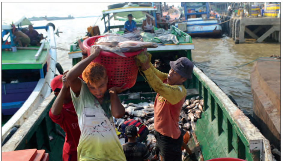
ကြည့်မြင်တိုင်ငါးဈေးဆိပ်ကမ်းနှင့် အဝယ်ခိုင်များမှ သယ်ယူပို့ဆောင်နေသော လုပ်သားများ။

ငါးခူ၊ ငါးကျည်း၊ ငါးကြင်း၊ ငါးမြစ်ချင်း၊ ငါးခေါင်းပွ၊ ငါးသလောက်၊ ကတ်သပေါင်း၊ ငါးပြေမများမှာ အမြင့်ဆုံး ပိဿာဈေး ငွေကျပ် ၈၀၀၀၊ ငွေကျပ် ၇၀၀၀၊ အနိမ့်ဆုံးပိဿာဈေးမှာ ငွေကျပ် ၂၅၀၀ ရှိကြောင်း၊ ပုစွန်ဖော့ချိတ် ငွေကျပ် ၈၅၀၀၊ ပုစွန်ကျော့ ငွေကျပ် ၄၅၀၀ အရောင်းအဝယ်ဖြစ်၍ ရောင်းသူဝယ်သူများ ကြည့်မြင်တိုင်ငါးဈေးတွင် စည်ကားများပြားလျက်ရှိကြောင်း သိရသည်။ မျိုးမင်းသိန်း(မရမ်းကုန်း)