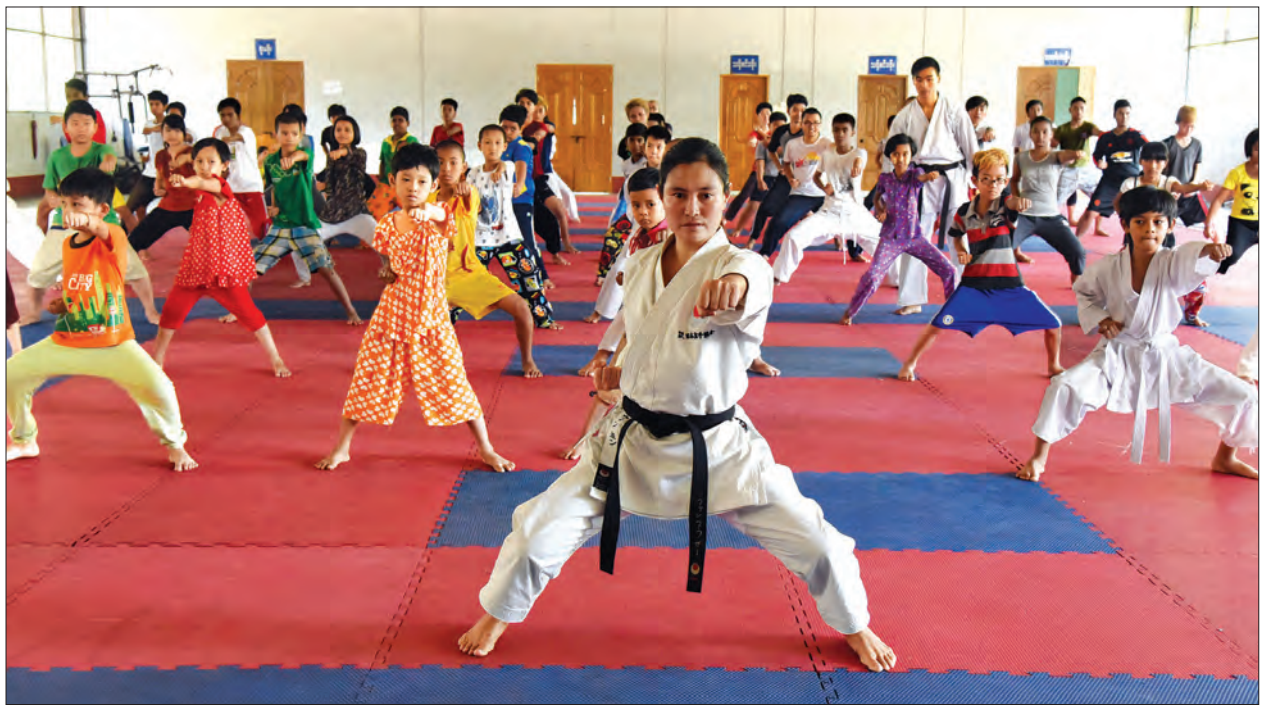
တိုက်ကွမ်ဒိုသင်တန်းတွင် သင်တန်းဆရာက သင်ကြားပြသနေစဉ်

လည်းဖြစ်ပါသည်။ ယင်းသင်တန်း ကို မေ ၂၀ ရက်အထိ ဖွင့်လှစ်သွားမည်ဖြစ်ပြီး သင်တန်းစတင်သည့် ဧပြီ ၂၅ ရက်က အား/ကာ သိပ္ပံ(ရန်ကုန်)ကျောင်းအုပ်ကြီး ဦးစိုးအောင်နှင့် တာဝန်ရှိသူများက လိုက်လံကြည့်ရှုခဲ့ကြပါသည်။ ယခုဖွင့်လှစ်နေသည့် နွေရာသီသင်တန်းများတွင် တက်ရောက်နေသူ သင်တန်းသား သင်တန်းသူ ၅၁၅ ဦးရှိပြီး ဘောလုံးအားကစားနည်း၌ အမျိုးသား ၁၀၈ ဦး၊ အမျိုးသမီးနှစ်ဦးစုစုပေါင်း ၁၂၀ ဖြင့် အများဆုံးတက်ရောက်လျက်ရှိပါသည်။ ရေကူးအားကစားနည်း၌ ၈၁ ဦး၊ ကရာတေးဒိုအားကစားနည်း၌ ၅၈ ဦး၊ ဘတ်စကက်ဘောအားကစားနည်း၌ ၄၅ ဦး၊ တိုက်ကွမ်ဒိုအားကစားနည်း၌ ၃၇ ဦး၊ တင်းနစ်အားကစားနည်း၌ ၃၁ ဦး၊ ဝူရှူးနှင့် ကြက်တောင်အားကစားနည်း၌ ၂၅ ဦးစီ၊ စားပွဲတင်တင်းနစ် အားကစားနည်း၌ ၁၈ ဦး၊ သေနတ်ပစ်အားကစားနည်း၌ ၁၅ ဦး၊ လက်ဝှေ့နှင့်ဖူဆယ်အားကစားနည်း၌ ၁၄ ဦးစီ၊ ကျွမ်းဘား၊ ဂျူဒိုနှင့် ဘော်လီဘောအားကစားနည်းတို့၌ ရှစ်ဦးစီ၊ ပိုက်ကော်ခြင်းအားကစားနည်း၌ ငါးဦးတို့တက်ရောက်လျက်ရှိပါသည်။