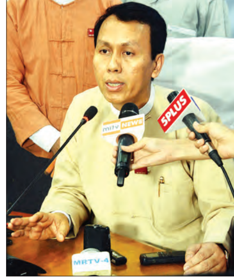
ရန်ကုန်တိုင်းဒေသကြီး ဝန်ကြီးချုပ် ဦးဖိုးမင်းသိန်း

တိုးတက်ရာတိုးတက်ကြောင်း လုပ်ချင်တယ်။ အခြေအနေအကြောင်းကြောင်းကြောင့် ဒီလိုဖြစ်နေတယ်ဆိုရင် ကျွန်တော်တို့အစိုးရမှာတာဝန်ရှိတယ်။ ဒီကျေးကျွဲနဲ့ ပတ်သက်လို့ ကျွန်တော်တို့တစ်တွေ နယ်မြေတွေထဲထိ အောင်ဆင်းပြီး ပူးပေါင်းဆောင်ရွက်ပါမယ်။ ရွှေ့ပြောင်းလုပ်သား တော်တော်များအတွက် ဒီပြဿနာဖြေရှင်းရမှာပါ။ တိုက်ခန်းဆောက်ပေး၊ ငှားပေးလို့လည်း အဆင်မပြေနိုင်ဘူး။ သူတို့ဟာ စက်ရုံတွေအတွက်လည်း အသုံးတည့်တဲ့ အလုပ်သမားတွေဖြစ်သလို ကျွန်တော်တို့ နိုင်ငံသားတွေ