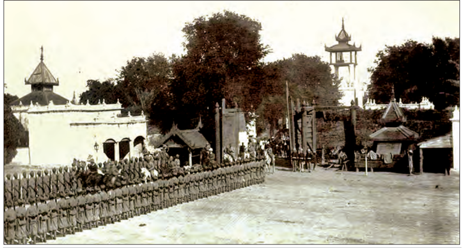
နယ်ချဲ့အင်္ဂလိပ်အစိုးရခေတ် မန္တလေးနန်းတွင်းရှိ အင်္ဂလိပ်စစ်တပ်

ဒီတော့ မြန်မာတစ်မျိုးသားလုံးရဲ့ အမျိုးသားလက္ခဏာအသွင် အထင်အရှားကျန်ရစ်ကာ တန်ဖိုးထားအပ်တဲ့ မန္တလေးနန်းမြို့ကြီးအတွင်း အင်္ဂလိပ်က စစ်တပ်များနေရာပေး ချထားတပ်စွဲခဲ့ခြင်းကို အကြောင်းပြချက်များနှင့် နိုင်ငံလွတ်လပ်ရေးရခဲ့သော်လည်း မြန်မာတပ်မတော်က ကျေနပ်စွာ လက်လွှဲခံယူခဲ့တယ်။ နောက်ပိုင်း ဖဆပလ ခေတ်၊ အိမ်စောင့်အစိုးရခေတ်၊ တော်လှန်ရေး အစိုးရခေတ်၊ လမ်းစဉ်ပါတီခေတ်၊ တပ်မတော်အစိုးရခေတ်ထိ ခေတ်တစ်မျိုးမျိုး စံနစ်အမျိုးမျိုးပြောင်းခဲ့ပြား။ ဒီအမွေဆိုးကို ကျေနပ်စွာ ထွေးပိုက်ထားဆဲပါပဲ။ ရှစ်လေးလုံး အရေးတော်ပုံအပြီး တပ်မတော်အာဏာသိမ်း နန်းတွင်းမှာရှိတဲ့ စစ်တပ်များရဲ့ လုံခြုံရေးကို ပိုပြီးဆောင်ရွက်လာပါတယ်။ ၁၉၅၈ ခုနှစ်ကတည်းက တည်ဆောက်ခဲ့တဲ့ တောင်ဘက်ကျိုးနှင့် မြို့ရိုးကြားက “မန်းသီတာ”အမည်ရှိ လူထုအပန်းဖြေဥယျာဉ်ကြီးကို ဖျက်သိမ်းလိုက်တယ်။ နန်းတွင်းကဖြစ်တဲ့ မတ္တရာရထားလမ်းကို ဖျက်သိမ်းလိုက်တယ်။ အပန်းဖြေပေါင်းကူးတံတားတွေလည်း ဖျက်သိမ်းလိုက်တယ်။ ကျိုးကိုပြန်လည် တူးဖော်ပြီး သံပန်းအကာအရံတွေတာလိုက်တယ်။ နန်းမြို့တွင်း အဝင်အထွက်တွေကို ကျပ်တည်းစွာ ကန့်သတ်လိုက်တယ်။