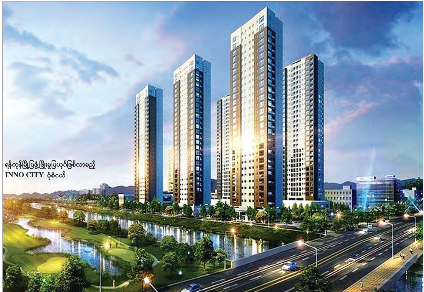
ရန်ကုန်မြို့ပြဖွံ့ဖြိုးမှုပြယုဂ်ဖြစ်လာမည့် INNO CITY ဝုံစံငယ်