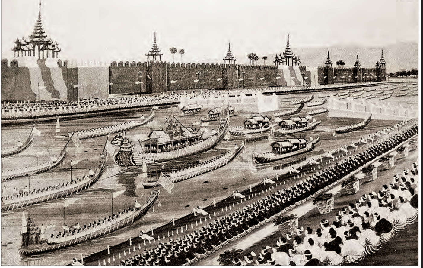
ကုန်းဘောင်ခေတ် မင်းခမ်းမင်းနားဖြစ်သည့် ရေခင်းသဘင် သရုပ်ဖော်ပုံ

နယ်ချဲ့စစ်တပ်က မန္တလေးနေပြည်တော်ကို သိမ်းပိုက်၊ ရှင်ဘုရင်နှင့်တကွ မိဖုရားအခြွေအရံတွေ ဖမ်းဆီးပြီး အိန္ဒိယပို့၊ လွှတ်တော်ကို ဖျက်သိမ်း၊ အချုပ်အခြာအာဏာပိုင်မှုအမှတ်အသား ရတနာပုံက ဒေါင်းအလံကို ဖြုတ်ချပြီး ယူနိုက်တက်အလံ လွှင့်ထူလိုက်တာနှင့် တစ်ပြိုင်နက် “ရွှေမုန်ကင်း အစစ်က၊ ထင်းဖြစ်ခဲ့” ရတာပါပဲ။ တစ်ချိန်က လုံခြုံရေးရဲမက်အဆင့်ဆင့်ကို ဖြတ်သန်းခွင့်ပြုမှု ရှေ့တော်မောက် ခစားရောက်ရတာ၊ မော်ဖူးစေဆိုမှ မျက်နှာမော့ခွင့်ရတဲ့ သီဟာသနပလ္လင်ရှေ့မှာ နယ်ချဲ့စစ်ဗိုလ်ချုပ်တွေ ဖန်ခွက်ချင်းတေ