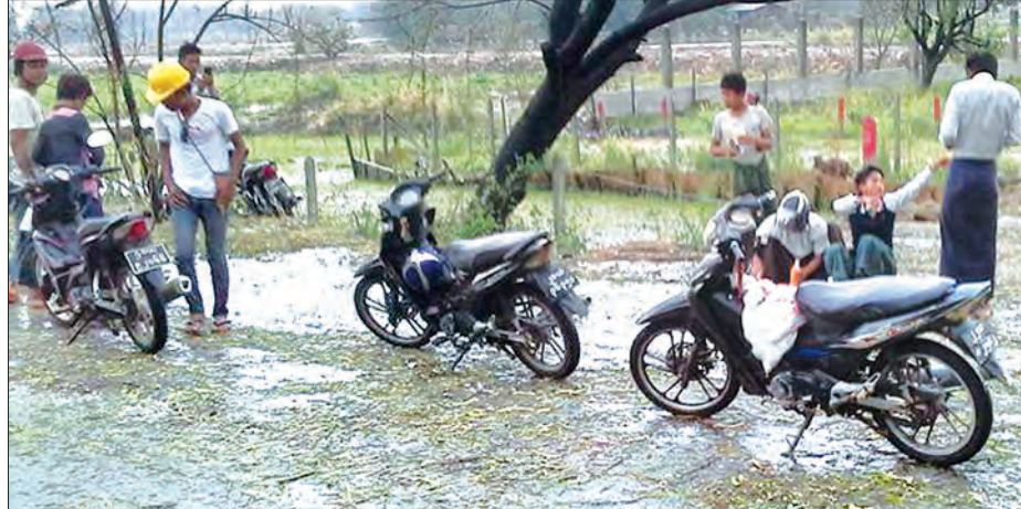
ရန်ကုန်-မန္တလေးလမ်းဟောင်း စွယ်တော်ဘုရားအနီးတွင် မိုးသီးများကြေကျနေစဉ်

မန္တလေး ဧပြီ ၂၂ မန္တလေးမြို့တွင် သင်္ကြန်မတိုင်မီက အပူချိန်မြင့်မားခဲ့ရာက ဧပြီ ၂၂ ရက် ညနေ ၃ နာရီခွဲခန့်တွင် မိုးရွာသွန်းပြီး တချို့မြို့နယ်များရှိ ရပ်ကွက်များတွင် မိုးသီးများကျဆင်းခဲ့၍ မိုးကြိုးပစ်ခြင်း၊ လေတိုက်ခြင်းများရှိခဲ့ပြီး နေ့အပူချိန် လျော့ကျခဲ့ကြောင်း သိရသည်။