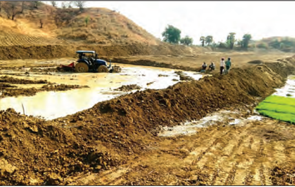
ကျေးရွာနေ ဒေသခံတောင်သူများ၏ ပြောကြားချက်များအရ သိရသည်။ ညွှန်တိုး(ပေါက်)

ပေါက် ဧပြီ ၂၂ မကွေးတိုင်းဒေသကြီး ပေါက်မြို့နယ် ရှားပင်ရေကျေးရွာ အနီးတစ်ဝိုက်၌ ၁၂ ရာသီမပြတ် မြေအောက်ရေလျှံတွင်းများ ထွက်ပေါ်လျက်ရှိပြီး အဆိုပါ ရေလျှံတွင်းများ ပေါ်ပေါက်လာခြင်းကြောင့် စိုက်ပျိုးရေးလုပ်ငန်းများအတွက် အထောက်အကူဖြစ်လျက်ရှိကြောင်း သိရသည်။ အဆိုပါ ရေလျှံတွင်းများသည် အနက်ပေ ၂၄၀ ကျော်မှ ထွက်ပေါ်ခြင်းဖြစ်ပြီး နှစ်လက်မ၊ သုံးလက်မ၊ လေးလက်မ ပိုက်တွင်းများဖြင့် မြေအောက်ရေများကို စဉ်ဆက်မပြတ်ရရှိနေကြောင်း၊ ရေလျှံတွင်းရေများ လုံလောက်စွာရရှိနေခြင်း ကြောင့် ပတ်ဝန်းကျင်ရှိ လယ်ယာမြေများတွင် နွေစပါးများကို စိုက်ပျိုးလျက်ရှိပြီး ခေတ်မီစက်ယန္တရားကြီးများဖြင့် လယ်မြေကေသစ်များကိုလည်း တိုးချဲ့ ဖော်ထုတ်လျက်ရှိကြောင်း၊ အဆိုပါလယ်ယာများတွင် နွေစပါး၊ မိုးစပါးများကို စိုက်ပျိုးရာတွင် ရေအတွက် ကုန်ကျစရိတ်သက်သာသဖြင့် မြေဆီမြေညီဇာများ စသည့် အခြားသွင်းအားစုများကို ပိုမိုထည့်သွင်းစိုက်ပျိုးနိုင်ပြီး ယခုနှစ် စပါး အထွက်နှုန်းသည် ယခင်နှစ်များကထက် ပိုကောင်းလာနိုင်ကြောင်း ရှားပင်ရေ