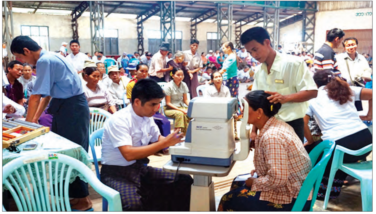
ရန်ကုန်မြို့၊ ကြည့်မြင်တိုင်မြို့နယ် သာဓုကျောင်းတိုက် ဓမ္မပါလမောင်ဒေးရှင်းမှ ဓမ္မပါလဆရာတော် ဦးဆောင်သော ကျန်းမာရေးအထောက်အပံ့အဖွဲ့သည် ဧပြီ ၂၀ ရက်က စစ်ကိုင်းတိုင်းဒေသကြီး ပင်လည်ဘူးမြို့၊ မြို့နယ်အားကစားခန်းမ၌ မျက်စိဝေဒနာရှင်များကို အခမဲ့ စမ်းသပ်စစ်ဆေး ကုသပေးစဉ် (မြို့နယ် ပြန်/ဆက်)