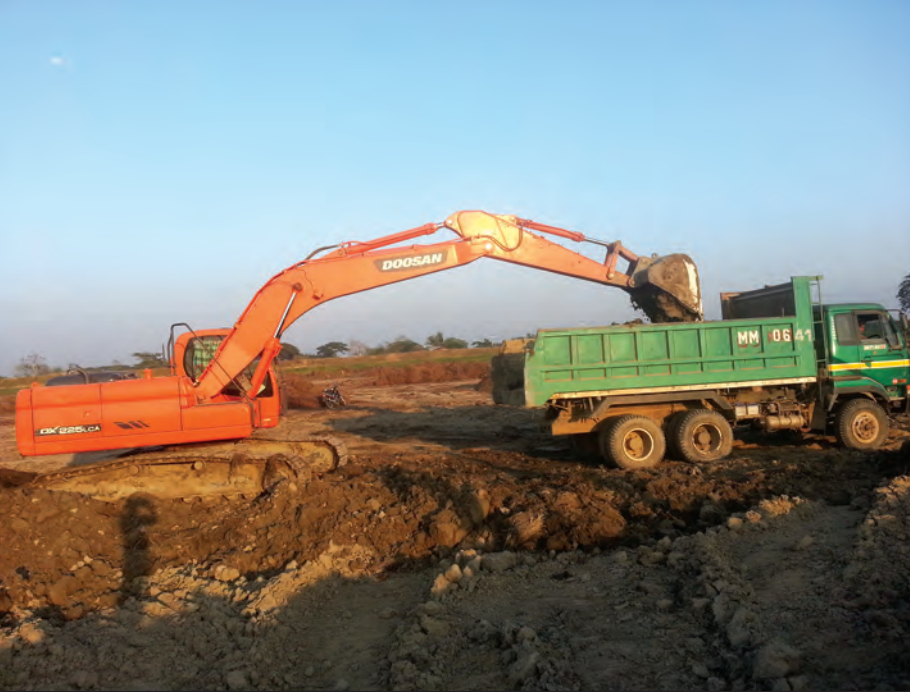
ကိုကျော်(သုံးခွ)

သောက်သုံးရေအတွက် ရေတိုင်ငုတ်များဖြင့် ရေဖြန့်ဝေပေးနေသော ရေကန်ကြီးဖြစ်ကာ လွန်ခဲ့သော နှစ်ပေါင်း ၂၀ ကျော်က စတင်တူးဖော်၍ အသုံးပြုခဲ့ခြင်းဖြစ်ကြောင်း၊ ယခုအခါ နှစ်ကာလရှည်ကြာလာသည်နှင့်အမျှ နုန်းမြေများ ပိုချမှုကြောင့် တိမ်ကောလာခြင်း၊ ကန်အတွင်း ရေမသန့်ရှင်းမှုများ ဖြစ်လာခြင်းတို့ကြောင့် ရန်ကုန်တိုင်းဒေသကြီး အစိုးရ၏ ခွင့်ပြုရန်ပုံငွေဖြင့် စိန်သဟာကုမ္ပဏီက တာဝန်ယူ၍ ပြန်လည်တူးဖော်ခြင်းဖြစ်ကြောင်း သိရသည်။ ရေကန်ကြီးကို စက်ယန္တရားများ၊ မြေသယ်ယာဉ်များဖြင့် တူးဖော်လျက်ရှိပြီး မိုးမကျမီ လုပ်ငန်းများ ပြီးစီးရန် ဆောင်ရွက်လျက်ရှိရာ ရေကန်ကြီး တူးဖော်ပြီးစီးပါက နောင်နှစ်များတွင် ရေကန်ပတ်ဝန်းကျင် ပိုမိုသာယာလှပလာမည်ဖြစ်သလို ကျန်းမာရေးနှင့်ညီညွတ်သော ရေကောင်းရေသန့်များကို ပိုမိုသိုလှောင်နိုင်မည်ဟု သိရသည်။