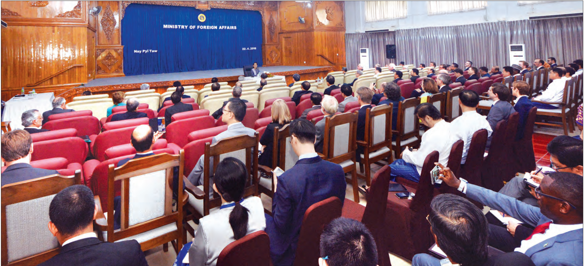
ပြည်ထောင်စုဝန်ကြီး ဒေါ်အောင်ဆန်းစုကြည် မြန်မာနိုင်ငံဆိုင်ရာ ပြည်တွင်းပြည်ပအခြေစိုက် သံတမန်များအား မြန်မာနိုင်ငံ၏ နိုင်ငံခြားရေးမူဝါဒနှင့်စပ်လျဉ်း၍ ရှင်းလင်းပြောကြားစဉ်