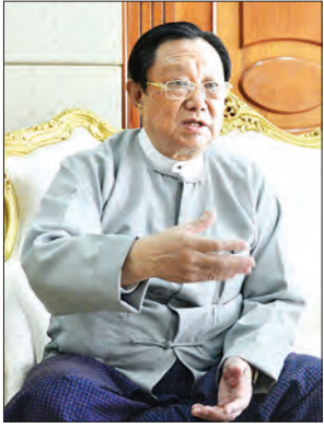
ဦးသန်းလွင်

အစိုးရသစ်တက်လာပြီးနောက်ပိုင်း မြန်မာကျပ်ငွေတန်ဖိုးမြင့်တက်လာကာ ဒေါ်လာငွေ တန်ဖိုးကျဆင်းသွားခြင်းသည် ဗဟိုဘဏ်၏ ကြိုးပမ်းချက်ကြောင့်ဟု ဆိုလျှင် မှန်သင့်သလောက်မှန်သော်လည်း အဓိကမှာ နိုင်ငံရေးပြောင်းလဲမှုကြောင့်ဖြစ်ကြောင်း စီးပွားရေးပညာရှင်များက သုံးသပ်ထားသည်။