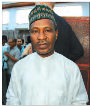
နိုင်ဂျီးရီးယားသံအမတ်ကြီး ကာဘီရူဘယ်လ်လာ

အလားတူ မြန်မာနိုင်ငံဆိုင်ရာ အစွဲအမတ်ကြီး မစ္စတာ ဒန်နီရယ် ဇွန်ရှိုင်းက “မြန်မာနိုင်ငံမှာ မှန်ကန်တဲ့ နိုင်ငံခြားရေးမူဝါဒ ရှိပါတယ်။ အခု နိုင်ငံခြားရေးဝန်ကြီး ဒေါ်အောင်ဆန်းစုကြည်နဲ့ တွေ့ဆုံရာမှာလည်း သူက မှန်ကန်တဲ့ လမ်းကြောင်းကနေ ပိုပြီးကောင်းမွန်အောင် လုပ်နိုင်မယ်လို့ ထင်မြင်ပါတယ်”ဟု ပြောကြားခဲ့သည်။ မြန်မာနိုင်ငံဆိုင်ရာ အီးယူ သံအမတ်ကြီး မစ္စတာ ရိုလန်ကိုဘီယာက “ဒီနေ့အခမ်းအနားကို လာရောက် ရတဲ့အတွက် ဝမ်းသာပါတယ်။ မြန်မာနိုင်ငံရဲ့ နိုင်ငံခြားရေးဝန်ကြီးမှာ အလွန်ကြီးလေးတဲ့ တာဝန်တွေနဲ့ အတူ နိုင်ငံတကာကလည်း အခု အချိန်ဟာ မြန်မာနိုင်ငံရဲ့ နိုင်ငံခြားရေးမူဝါဒကို ပိုပြီးစိတ်ဝင်စားနေတယ်လို့ ထင်ပါတယ်။ ဒီလို နိုင်ငံခြားရေး မူဝါဒတွေကနေတစ်ဆင့်