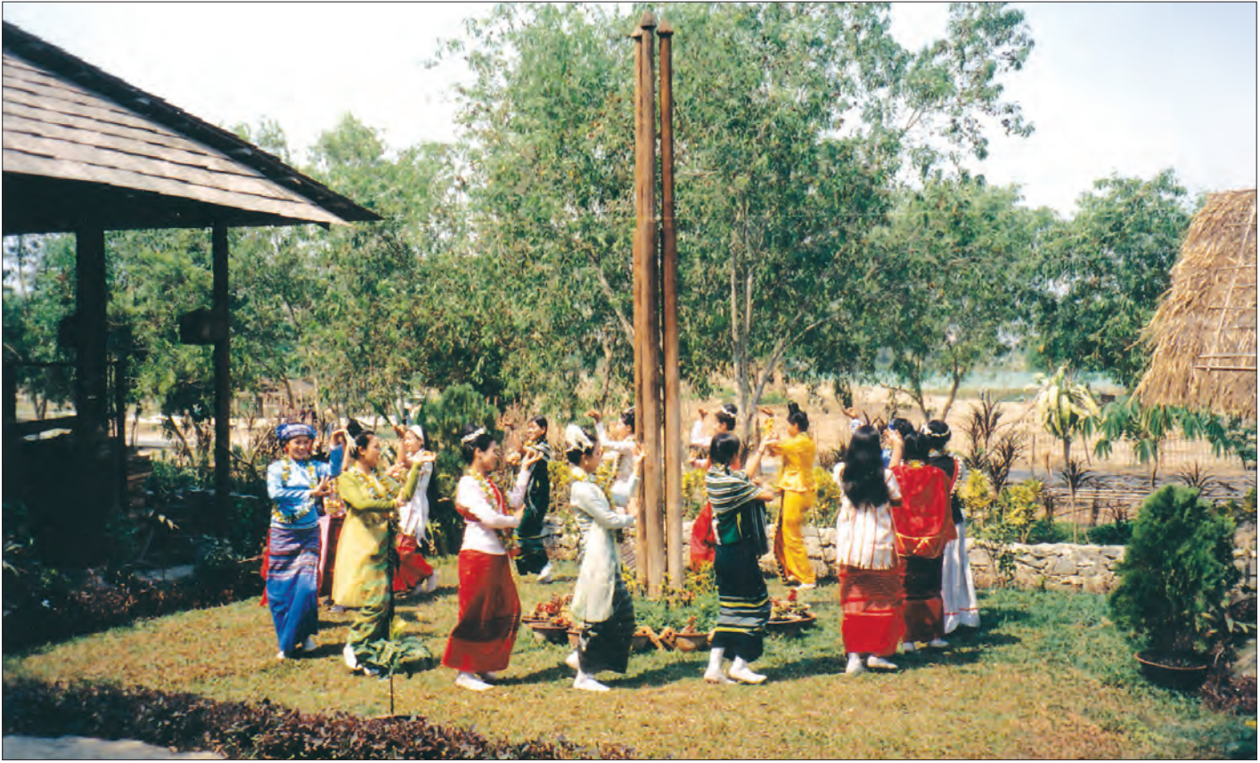
တိုင်းရင်းသားသွေးချင်းများ စည်းလုံးညီညွတ်စွာ ပျော်ပျော်ပါးပါးကခုန်မြူးထူးနေကြစဉ်