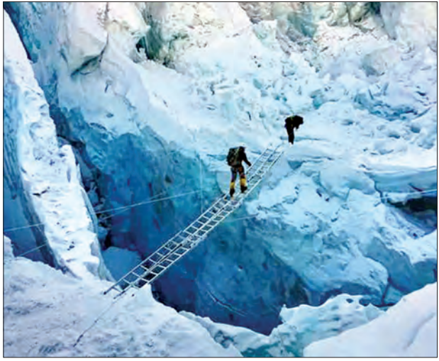
မြန်မာတောင်တက်သမားသုံးဦး ဝေရက်တောင်သို့ ကြိုးစားတက်ရောက်နေစဉ်

တောင်တက်စခန်း(၁) (Camp-1)သို့ ရောက်ရှိအိပ်စက်ခဲ့ကြသည်။ ယင်းနောက် ဧပြီ ၂၂ ရက်တွင် တောင်တက်စခန်း(၂) (Camp-2)သို့ တက်ရောက်ပြီး ထိုမှတစ်ဆင့် တောင်တက်စခန်း(၁)သို့ ပြန်လည် ဆင်းသက်ကာ ညအိပ်မည်ဖြစ်ပြီး ဧပြီ ၂၃ ရက်တွင် တောင်ခြေစခန်းသို့ ပြန်လည်ဆင်းသက်ကြမည် ဖြစ်ကြောင်း မြန်မာနိုင်ငံ ခြေလျင်တောင်တက်အဖွဲ့ချုပ်မှ သိရသည်။ ကမ္ဘာ့အမြင့်ဆုံး ဝေရက်တောင်သည် လက်ရှိအချိန်၌ ပေပေါင်း ၂၉၀၀၇ ပေမြင့်ကြောင်း အိန္ဒိယသင်္ချာပညာရှင် Radhanath Sikdar ၏ တွက်ကိန်းအရ သိရသည်။ စိုးဝင်း(SP)