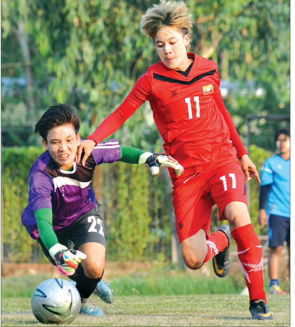
မြန်မာအမျိုးသမီးအသင်းလေ့ကျင့်မှုများပြုလုပ်နေစဉ်

ရန်ကုန် ဧပြီ ၂၂ မြန်မာနိုင်ငံက အိမ်ရှင်အဖြစ်လက်ခံကျင်းပမည့် ၂၀၁၆ အာဆီယံအမျိုးသမီး ဘောလုံးပြိုင်ပွဲယှဉ်ပြိုင်ရန် မြန်မာအမျိုးသမီးဘောလုံးအသင်းသည် ပဏာမ ကစားသမား ၂၆ ဦးဖြင့် လေ့ကျင့်ပြင်ဆင်မှုများပြုလုပ်လျက်ရှိသည်။ ပြိုင်ပွဲစတင်ရန် သုံးလကျော်သာလိုသောကြောင့် မြန်မာအမျိုးသမီး ဘောလုံးအသင်းမှာ လေ့ကျင့်ပြင်ဆင်မှုများ ပြင်းပြင်းထန်ထန်ပြုလုပ်လျက် ရှိပြီး နိုင်ငံတကာခြေစမ်းပွဲများ စတင်ကစားတော့မည်ဖြစ်သည်။ မြန်မာ အမျိုးသမီးဘောလုံးအသင်းသည် မေလမှစတင်ကာ ခြေစမ်းပွဲများ ယှဉ်ပြိုင်မည်ဖြစ်ပြီး ဂျပန်ခြေစမ်းခရီးစဉ်သွားရောက်ရန်အတွက် အပြီးသတ် ပြင်ဆင်မှုများ ပြုလုပ်လျက်ရှိသည်။ မြန်မာအမျိုးသမီးဘောလုံးအသင်းသည် သင်္ကြန်ကာလအတွင်း လေ့ကျင့်မှုများရပ်နားခဲ့သော်လည်း ဧပြီ ၁၉ ရက်မှ ပြန်လည်လေ့ကျင့်လျက်ရှိပြီး ဂျပန်ခရီးစဉ်အတွက် အပြီးသတ်လူစာရင်း ၂၃ ဦးကို မကြာမီရက်ပိုင်းအတွင်း ထုတ်ပြန်ကြေညာသွားမည်ဖြစ်သည်။ မြန်မာအမျိုးသမီးဘောလုံးအသင်းသည် ပြိုင်ပွဲအကြိုပြင်ဆင်မှုများအဖြစ် မေ ၅ ရက်မှ ၂၅ ရက်အထိ ဂျပန်နိုင်ငံအိုဆာကာမြို့၌ လေ့ကျင့်မှုများ ပြုလုပ်သွားမည်ဖြစ်ပြီး ဂျပန်အမျိုးသမီးကလပ်အသင်းများနှင့် ခြေစမ်းပွဲ လေးပွဲ ယှဉ်ပြိုင်ကစားမည်ဖြစ်သည်။ မြန်မာအမျိုးသမီးအသင်းသည် ဂျပန် ခရီးစဉ်အပြီးတွင် တောင်ကိုရီးယား လက်ရွေးစင်အမျိုးသမီးအသင်းနှင့် ဇွန် ၄ ရက်နှင့် ၆ ရက်တို့တွင် သုဝဏ္ဏကွင်း၌ ခြေစမ်းကစားမည်ဖြစ်ပြီး ပြိုင်ပွဲ မတိုင်မီ ထိုင်းလက်ရွေးစင်အသင်းနှင့် ထပ်မံခြေစမ်းမည်ဖြစ်သည်။ စာမျက်နှာ ၉ ကော်လံ ၃