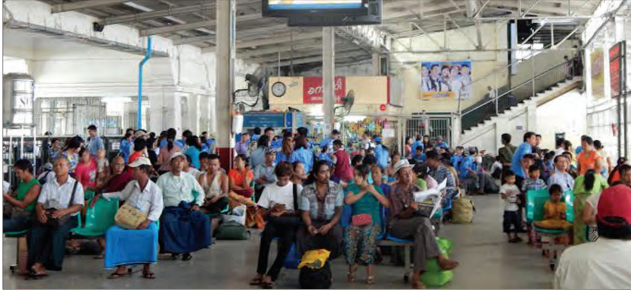
ရန်ကုန်ဘူတာကြီး၌ စောင့်ဆိုင်းနေသည့် ရထားစီးခရီးသည်များ

ရန်ကုန် ဧပြီ ၂၂ ၁၃၇၃ ခုနှစ် မဟာသင်္ကြန်မတိုင်မီ ကာလဖြစ်သော ဧပြီ ၉ ရက်မှ ၁၃ ရက်အတွင်း သင်္ကြန်အထူးရထားစီးခရီးသည်ဦးရေမှာ ပုံမှန်လိုက်ပါ စီးနင်းသူဦးရေထက် အဆပေါင်း သုံးဆအထိ စံချိန်တင်မြှင့်တက်ခဲ့ပြီး ရန်ကုန်-မန္တလေး သင်္ကြန်အထူးရထားတွဲဆိုင်းအား သုံးစင်းအထိ တိုးချဲ့ပြေးဆွဲပေးခဲ့ကြောင်း မြန်မာ့မီးရထားမှ သိရသည်။ မဟာသင်္ကြန်မတိုင်မီ ကာလ