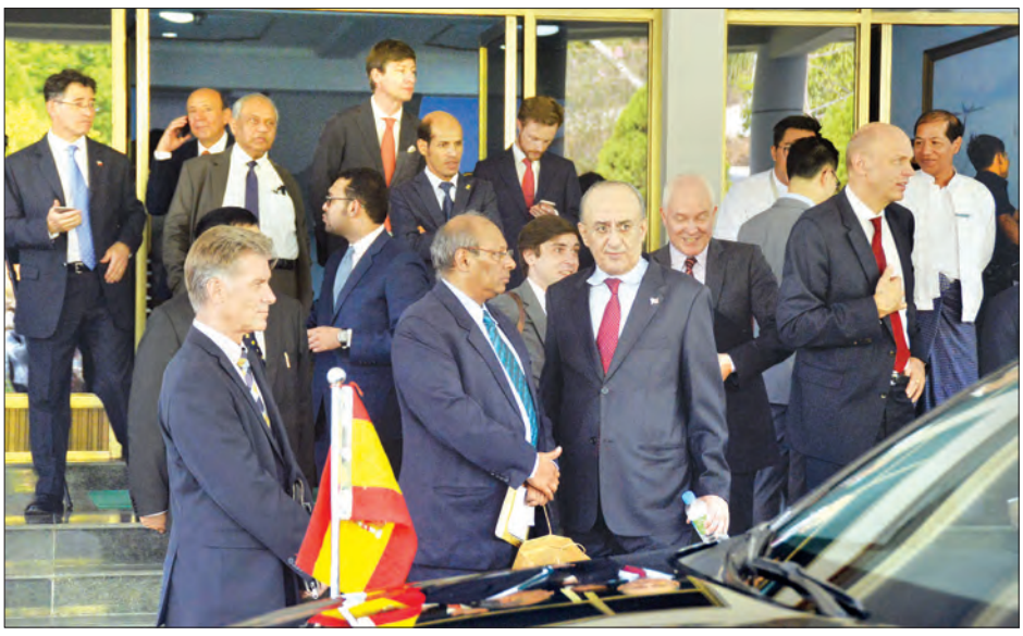
မြန်မာနိုင်ငံ၏ နိုင်ငံခြားရေးမူဝါဒရှင်းလင်းပွဲသို့ တက်ရောက်လာသော မြန်မာနိုင်ငံဆိုင်ရာ ပြည်တွင်း ပြည်ပ အခြေစိုက် သံတမန်များအား တွေ့ရစဉ်

ငြိမ်းချမ်းစွာ အတူယှဉ်တွဲနေထိုင်ရေး မူကြီး ဝါးချက်အပေါ် အခြေခံကာ ဘက်မလိုက်မူဝါဒကို ကျင့်သုံးခဲ့ပါကြောင်း၊ မြန်မာနိုင်ငံ၏ အာဆီယံ ဥက္ကဋ္ဌအဖြစ် အောင်မြင်စွာ အိမ်ရှင်အဖြစ် လက်ခံကျင်းပနိုင်ခဲ့မှုသည် ဒေသတွင်းနိုင်ငံများနှင့် ပေါင်းစပ်လိုသော ပြင်းပြသည့်ဆန္ဒကို ထင်ဟပ်စေပါကြောင်း၊ မြန်မာနိုင်ငံသည် အာဆီယံနိုင်ငံများသာမက နိုင်ငံတကာ အသိုင်းအဝိုင်းတွင်ပါ ယုံကြည်အားထားရသော မိတ်ဖက်နိုင်ငံ ဖြစ်လာကြောင်းဖြင့် နှုတ်ခွန်းဆက်သဝက်လွှာကို ဖတ်ကြားသည်။ ဆက်လက်၍ ၎င်းက မြန်မာနိုင်ငံတွင် ဖြစ်ပွားနေသော ငွေကြေးခဝါချမှုနှင့် ပတ်သက်၍ မေးမြန်းရာ ဒေါ်အောင်ဆန်းစုကြည်က မြန်မာ