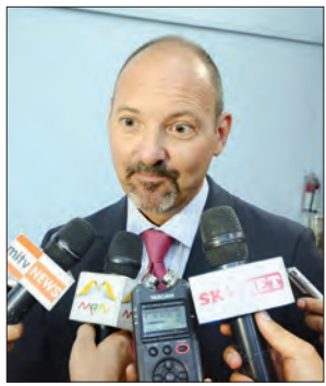
အိဗရသံအမတ်ကြီး မစ္စတာ ရိုလန်ကိုဘီယာ

နိုင်ငံအစိုးရအနေဖြင့် ငွေကြေးခဝါ ချမှုကို ဘက်ပေါင်းစုံမှ တိုက်ဖျက် နေကြောင်းနှင့် ငွေကြေးခဝါချမှု ပပျောက်အောင် လိုအပ်သော အရေးယူဆောင်ရွက်မှုများ တိုး၍ လုပ်ဆောင်သွားမည် ဖြစ်ကြောင်း ဖြေကြားသည်။ ယင်းနောက် တွေ့ဆုံပွဲသို့ တက်ရောက်လာကြသည့် ဂျာမနီ၊ တူရကီ၊ နီပေါ၊ တောင်အာဖရိက၊ ဒိန်းမတ်နှင့် ဘယ်လာရစ်နိုင်ငံတို့မှ သံအမတ်ကြီးများနှင့် သံတမန်အကြီးအကဲများက သိရှိလိုသည်များကို မေးမြန်းကြရာ ပြည်ထောင်စုဝန်ကြီး ဒေါ်အောင်ဆန်းစုကြည်က ပြန်လည် ဖြေကြားခဲ့သည်။ အခမ်းအနား အပြီးတွင် ပြည်ထောင်စုဝန်ကြီး ဒေါ်အောင်ဆန်းစုကြည်သည် အာဆီယံနိုင်ငံများမှ သံအမတ်ကြီးများအား တွေ့ဆုံရာ သံအမတ်ကြီးများက မြန်မာနိုင်ငံနှင့်