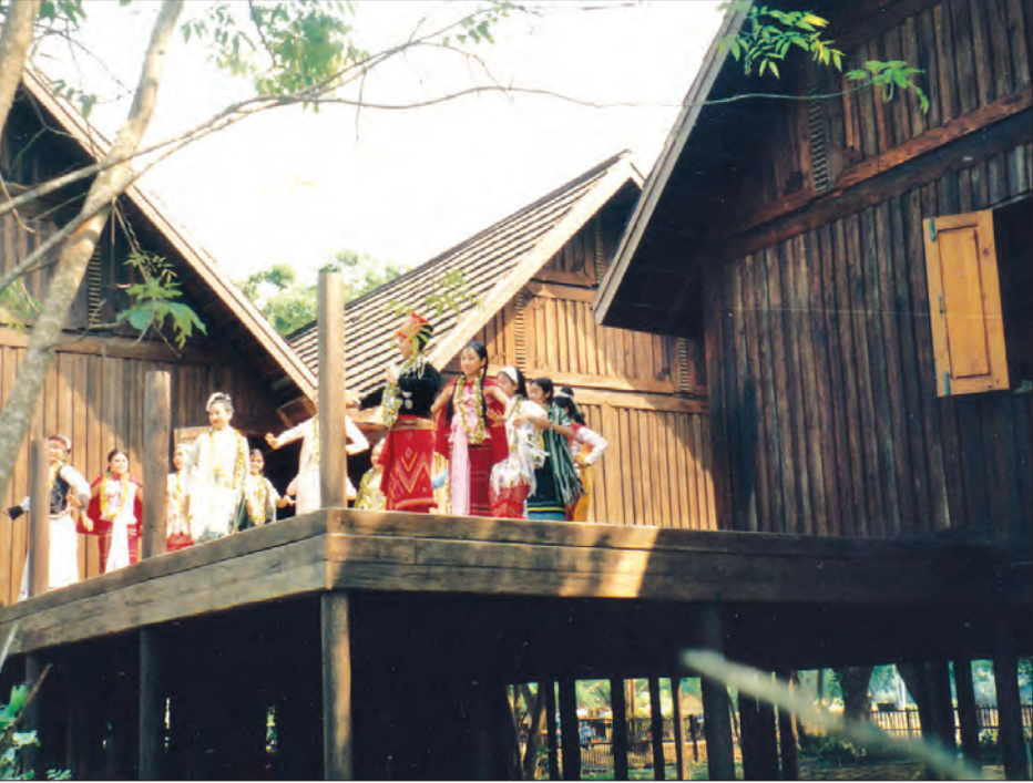
တိုင်းရင်းသားရိုးရာ အိမ်များ၌ တိုင်းရင်းသူများ ဝတ်စုံအပြည့်ဖြင့် ကပြနေမှုကို မြင်တွေ့ရပုံ

ဘာပဲဖြစ်ဖြစ်လေ သင်္ကြန်ကာလရောက်တိုင်း နယ်စပ် သင်္ကြန်သီချင်းလေးတွေကို ပြန်လည်ကြားယောင်မိတယ်။ သတိရတယ်။ ရေစက်ဆုံခဲ့ဖူးတဲ့ တိုင်းရင်းသားယဉ်ကျေးမှု အဖွဲ့တွေကို လွမ်းတယ်။ တစ်ခါတုန်းက နယ်စပ်ဒေသ မှာ...။