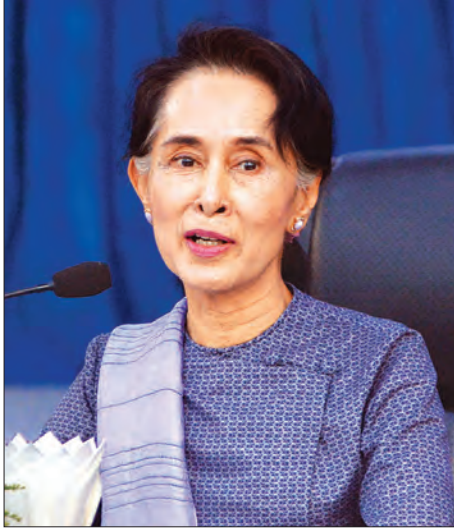
ပြည်ထောင်စုဝန်ကြီး ဒေါ်အောင်ဆန်းစုကြည် သံတမန်များအား မြန်မာနိုင်ငံ၏ နိုင်ငံခြားရေးမူဝါဒရှင်းလင်းပြောကြားစဉ်

၁၉၄၈ ခုနှစ် လွတ်လပ်ရေးရပြီး ကတည်းက မိမိတို့နိုင်ငံအနေဖြင့် ကမ္ဘာ့နိုင်ငံများနှင့် ချစ်ကြည်ရင်းနှီးမှု မူဝါဒတစ်ရပ်ကို ချမှတ်ခဲ့ပါကြောင်း၊ နိုင်ငံများအကြား ဆက်ဆံရေး အလျင်အမြန် တည်ဆောက်နိုင်မှု သည် အဆိုပါနိုင်ငံများအကြား ပိုမို ကောင်းမွန်သောဆက်ဆံရေး တည်ဆောက်နိုင်ခြင်းပင် ဖြစ်ပါကြောင်း၊ မိမိတို့ နိုင်ငံသည် အင်အားကြီးနိုင်ငံ တစ်နိုင်ငံ မဟုတ်ပါကြောင်း၊ သို့သော်လည်း အားလုံးနှင့် ပတ်သက်သော ပြဿနာများကို ရိုးသားမှု၊ စိတ်ရင်းစေတနာကောင်းများဖြင့် ချဉ်းကပ်မှုဖြင့် ကမ္ဘာကို ဦးဆောင်နိုင်လိမ့်မည်ဟု မျှော်လင့်ပါကြောင်း၊ မိမိတို့ နိုင်ငံအနေဖြင့် အခြားနိုင်ငံများမှ လေ့လာသင်ယူစရာများစွာ ရှိပါကြောင်း၊ မြန်မာနိုင်ငံသည် ယခုအချိန်မှစ၍ ခရီးသစ်စတင်ခြင်း ဖြစ်ပါကြောင်း၊ ပြဿနာများကို အပြန်အလှန် လေးစားမှု၊ ညှိနှိုင်းဆွေးနွေးမှုဖြင့် ဖြေရှင်းနိုင်ပါကြောင်း၊ မြန်မာနိုင်ငံသည် ၁၉၄၈ ခုနှစ် လွတ်လပ်ရေးရပြီး ချိန်ကတည်းက ကုလသမဂ္ဂအဖွဲ့သို့ ဝင်ရောက်ခဲ့ပါကြောင်း၊ ကမ္ဘာပေါ်တွင် ဖြစ်ပွားနေသော ပြဿနာတိုင်းကို အကျိုးအကြောင်း၊ စိတ်ကောင်းစေတနာကောင်းဖြင့် ဖြေရှင်းနိုင်မည်ဟု ယုံကြည်ပါကြောင်း၊ ကျန်ရှိသော ကမ္ဘာ့နိုင်ငံများနှင့် သင့်မြတ်ပြီး ကောင်းမွန်သော ဆက်ဆံရေးလည်း တည်ဆောက်လိုပါကြောင်း၊ ပြဿနာ