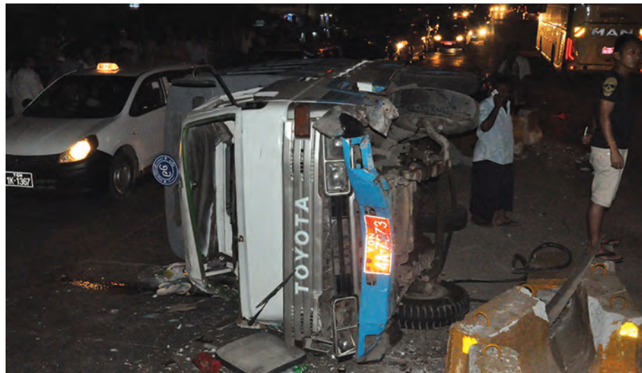
မရမ်းကုန်းမြို့နယ် (၁)ရပ်ကွက်၌ဖြစ်ပွားသော ယာဉ်မတော်တဆမှုတစ်ခု

ယာဉ်မတော်တဆမှုနှင့် သေဆုံးမှုလျော့ချရေးအဖွဲ့မှ နေ့စဉ် ခရီးသွားပြည်သူများနှင့် ယာဉ်မောင်းသူများအတွက် လိုက်နာရမည့် သုတေသန