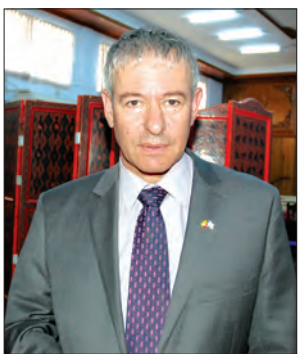
အစ္စရေးသံအမတ်ကြီး မစ္စတာ ဒန်နီရယ် ဇွန်ရှိုင်း

ထိုသို့သော ချဉ်းကပ်မှု ပုံစံသစ်ဖြင့် လျှောက်လှမ်းရာတွင် ဖြစ်ပေါ်လာသော ပြဿနာများကို အချင်းချင်း ချစ်ကြည်ရင်းနှီးမှု၊ နားလည်မှုဖြင့် ဖြေရှင်း ဆောင်ရွက်သွားကြရမည် ဖြစ်ပါကြောင်း၊ မိမိတို့နိုင်ငံ၏ နိုင်ငံခြားရေးမူဝါဒကိုလည်း အပြန်အလှန် ချစ်ကြည်ရင်းနှီးမှု၊ နားလည်မှု ရှိသော ဆက်ဆံရေးဖြင့် ဆက်လက် ဆောင်ရွက်သွားမည် ဖြစ်ပါကြောင်း ပြောကြားခဲ့သည်။ ထို့နောက် မြန်မာနိုင်ငံဆိုင်ရာ သံတမန်များအဖွဲ့ နာယက မြန်မာနိုင်ငံဆိုင်ရာ စင်ကာပူသံအမတ်ကြီး မစ္စတာ ရောဘတ်ချွာက နိုင်ငံတော်၏ အတိုင်ပင်ခံပုဂ္ဂိုလ်အဖြစ် ခန့်အပ်ခံရသည့်အတွက် ဒေါ်အောင်ဆန်းစုကြည်အား ဂုဏ်ပြုပါကြောင်း၊ မြန်မာနိုင်ငံသည် နိုင်ငံတကာ အသိုင်းအဝိုင်းအတွင်း ဂုဏ်သိက္ခာ ရှိစွာ ပြန်လည်ဝင်ဆံ့လာပြီး