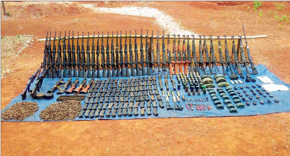
ဧပြီ ၂ ရက်မှ ၄ ရက်အထိ တပ်မတော်က ဖော်ထုတ်သိမ်းဆည်းရမိသော လက်နက်မျိုးစုံ ၄၈ လက်နှင့် ခဲယမ်း၊ မိုင်း၊ လက်ပစ်ခဲ၊ ကျည်အိမ်၊ ဆက်သွယ်ရေးစက်နှင့် စာရွက်စာတမ်းများကို တွေ့ရစဉ်

မူးယစ်ဆေးဝါးသုံးစွဲသည်ဟုအကြောင်းပြကာ ဖမ်းဆီးခေါ်ဆောင်ခြင်းနှင့် ကျေးရွာများမှဆက်ကြေး၊ ရိက္ခာကောက်ခံခြင်းတို့ ဆောင်ရွက်ခဲ့ရာ ယင်း လုပ်ဆောင်ချက်များကို ကာကွယ်ပေးရန်အကြောင်းပြု၍ ယခုနှစ် နှစ်ဆန်း ပိုင်းတွင် SSA (ဝမ်ဟိုင်း)အဖွဲ့သည် နယ်မြေကျော်လွန် ဝင်ရောက်လှုပ်ရှား