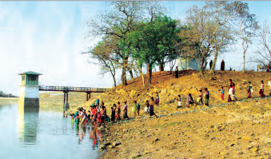
ဝမ်းတွင်းမြို့နယ် တောင်ပုလရေလှောင်တံတံအတွင်းရှိဆည်ရေကို ဒေသခံများက သောက်သုံးရေ သယ်ယူသုံးစွဲ နေမှုကို တွေ့ရစဉ်

မိတ္ထီလာခရိုင်နှင့် ရမည်းသင်းခရိုင်အတွင်းရှိ ဒေသခံ ပြည်သူများအတွက် အဓိကအရေးကြီးသည့် ရေလိုအပ် ချက်ကို ဆည်၊ ကန်၊ တာတမံများ၊ ရေကန်များမှ ရယူ အသုံးပြုနိုင်ရန် မိတ္ထီလာခရိုင် လက်ထောက်ညွှန်ကြား ရေးမှူးရုံး ဆည်မြောင်းနှင့် ရေအသုံးချမှုစီမံခန့်ခွဲရေး ဦးစီးဌာနက ဆောင်ရွက်ပေးလျက်ရှိသည်။ ယခုနှစ်သည် ရာသီဥတုပြောင်းလဲမှုအရ အယ်နီညို ရိုက်ခတ်မှုကြောင့် မိတ္ထီလာခရိုင်နှင့် ရမည်းသင်းခရိုင် အတွင်းရှိ ဆည်/ကန်ငယ်များအတွင်း မိုးခေါင်ပြီး ရေဝင် ရောက်မှုနည်းပါးခြင်း၊ မြေအောက်ရေလျော့နည်းလာခြင်း များ ဖြစ်ပေါ်လာသဖြင့် ဆည်၊ ကန်၊ တာတမံများမှ စိုက်ပျိုးရေးနှင့် သောက်သုံးရေ အလေအလွင့်မရှိ အကျိုး ရှိစွာ သုံးစွဲနိုင်ရေးအတွက် စီမံချက်များချမှတ်၍ ဆောင်ရွက်နေသည်။ မိတ္ထီလာမြို့နယ်တွင် ဆည်/ကန် ကိုးခု၊ သာစည်မြို့ နယ်တွင် ဆည်/ကန် ရှစ်ခု၊ ဝမ်းတွင်းမြို့နယ်တွင် ဆည်/ ကန် ၁၃ ခု၊ မလှိုင်မြို့နယ်တွင် ဆည်/ကန် ငါးခုရှိပြီး ရမည်းသင်းခရိုင် ရမည်းသင်းမြို့နယ်တွင် ဆည်/ကန် ၁၀ ခု၊ ပျော်ဘွယ်မြို့နယ်တွင် ဆည်/ကန် ၁၀ ခု စုစုပေါင်း ဆည်/ကန် ၅၅ ခုရှိသည်။ ထို ဆည်/ကန် ၅၅ ခုမှ မိတ္ထီလာကန်နှင့် မုန်တိုင် ဆည်တို့တွင် စုစုပေါင်းရေပမာဏ ၁၂၇၈၉ ဧကပေ သို့လှောင်ထားသည်။ မိတ္ထီလာမြို့ ပြည်သူ ၃၂၆၀၀၀ အတွက် လူတစ်ဦးလျှင် တစ်နေ့ ရေဂါလန် ၂၀ နှုန်းဖြင့် ခုနစ်လအတွက် ဧကပေ ၅၀၄၀ နှင့် မုန်တိုင်ရေလှောင် တံတံတွင် နေ့စဉ်ဧကပေ ၃၀၀ အတွက် ၃၁၅ ဧကပေ ပေးရ မည်ဖြစ်၍ အောက်တိုဘာလကုန်တွင် ရေပမာဏ ဧက ပေ ၅၈၅၀ ကျန်မည်ဖြစ်၍ သောက်သုံးရေနှင့် စိုက်ပျိုးရေး ဖူလုံစွာ ရှိထားပြီးဖြစ်သည်။