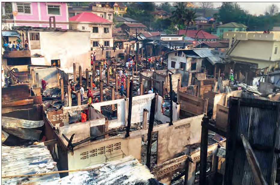
ပေးရန် လာရောက်တောင်းဆိုရာမှ စကားအချေအတင်ဖြစ်ကာ ဒေါသလတ်ထဲမှ ဇနီးဖြစ်သူ၏ အမွေကို

မိသားစု အမွေကိစ္စကား အချေအတင်ဖြစ်ရာမှ ဒေါသထိန်းနိုင်သော ထိုင်းနိုင်ငံသားတစ်ဦး၏ ရက်စက်သည့်လုပ်ရပ်ကြောင့် နိုင်ငံခြားသားများ အထူးစိတ်ဝင်စားစွာ လာရောက်လေ့လာကြသော တာချီလိတ်မြို့ရှိ တိုင်းငေါင်းရွာလေးမှာ မိနစ်ပိုင်းအတွင်း ပြာပုံဘဝသို့ ရောက်ရှိခဲ့ရသောဖြစ်စဉ်တစ်ရပ် ဧပြီ ၉ ရက် ညနေ ၆ နာရီ ၄၅ မိနစ်ခန့်က ဖြစ်ပွားခဲ့သည်။