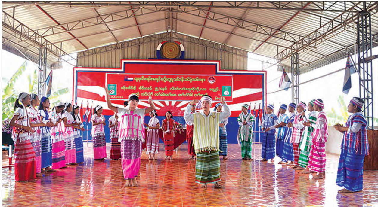
နွေရာသီ ကရင်စာပေနှင့် ယဉ်ကျေးမှုသင်တန်းဆင်းပွဲအခမ်းအနားတွင် ကရင်တိုင်းရင်းသား တိုင်းရင်းသူများ ရိုးရာအကဖြင့်ဖျော်ဖြေစဉ်

ကရင်တိုင်းရင်းသူ၊ တိုင်းရင်းသားများအနေဖြင့် ကိုယ့်မြို့၊ စည်ပင်တိုးတက်အောင်ဆောင်ရွက်ရင်း၊ ကိုယ့်အမျိုး၊ ကိုယ့်စာပေတိုးတက်အောင်ဆောင်ရွက်ရင်းဖြင့် ကိုယ့်ပြည်နယ် တိုးတက်အောင် ဆောင်ရွက်သွားရမည်ဖြစ်ကြောင်း ပြည်ထောင်စုလွှတ်တော်နာယက၊ အမျိုးသားလွှတ်တော်ဥက္ကဋ္ဌ မန်းဝင်းခိုင်သန်းက ဧပြီ ၁၀ ရက် နံနက် ၉ နာရီက ကရင်ပြည်နယ် မြဝတီခရိုင် မြဝတီမြို့ အမှတ်(၃)ရပ်ကွက်ရှိ မြို့နယ် ကရင်စာပေနှင့် ယဉ်ကျေးမှုတိုးတက်ပြန့်ပွားရေးအသင်းရုံး၌ ကျင်းပသည့် ၂၀၁၆ ခုနှစ် နွေရာသီ ကရင်စာပေနှင့် ယဉ်ကျေးမှုသင်တန်းဆင်းပွဲအခမ်းအနားတွင် ပြောကြားခဲ့သည်။