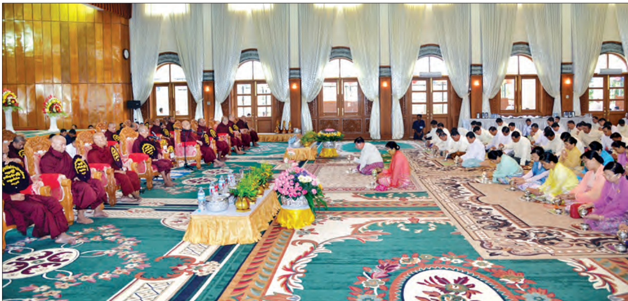
မိသားစုများက လှူဖွယ်ပစ္စည်းများ လောင်းလှူကြသည်။ ထို့နောက် ဧည့်ပရိသတ်များသည် မဟာဝိဇိတာရုံဆရာတော်ကြီးထံမှ ကိုးပါးသီလ ခံယူဆောက်တည်ကြပြီး တပ်မတော်ကာကွယ်ရေးဦးစီးချုပ်နှင့်ဇနီးတို့က မဟာဝိဇိတာရုံ ဆရာတော်ကြီးထံ လှူဖွယ်ပစ္စည်းများ ဆက်ကပ်လှူဒါန်းကြသည်။ ထို့နောက် မင်္ဂလာဇယျာပီဥ တက္ကသိုလ် ကျောင်းတိုက်ဆရာတော်

ကာကွယ်ရေးဦးစီးချုပ်ရုံး (ကြည်း) အနော်ရထာခန်းမ၌ ဥပစာ၌ မန္တလေးမြို့ မဟာဝိဇိတာရုံကျောင်းတိုက် ပဓာနနာယကဆရာတော် အဘိဓမ္မာရဋ္ဌဂုရု ဘန္တုဝိစာရိန္ဒာ ဘိဝံသအမျိုးပြုသော သံဃာတော် ၁၈ ပါးနှင့် ဒုလ္လဘရဟန်း ၂၃၀ အား သိမ်ဆင်းအလှူတော်အဖြစ် လှူဖွယ်ပစ္စည်းများ လောင်းလှူကြပြီး ရှင်သာမဏေ ၃၆ ပါးကိုလည်း လှူဖွယ်ပစ္စည်းများ လောင်းလှူကြသည်။ ထို့နောက် ကြွရောက်တော်မူလာကြသည့် သံဃာတော်များ၊ ဒုလ္လဘရဟန်းများနှင့် ရှင်သာမဏေများအား တပ်မတော်ကာကွယ်ရေးဦးစီးချုပ်နှင့် ဧည့်ပရိသတ်များက နေ့ဆွမ်းဆက်ကပ်လှူဒါန်းကြသည်။ ယင်းနောက် ဒုလ္လဘရဟန်းများနှင့် ရှင်သာမဏေများအား ကာကွယ်ရေး ဦးစီးချုပ်ရုံး(ကြည်း၊ ရေ၊ လေ) ရုံး/ဌာနများမှ အရာရှိ၊ စစ်သည်၊