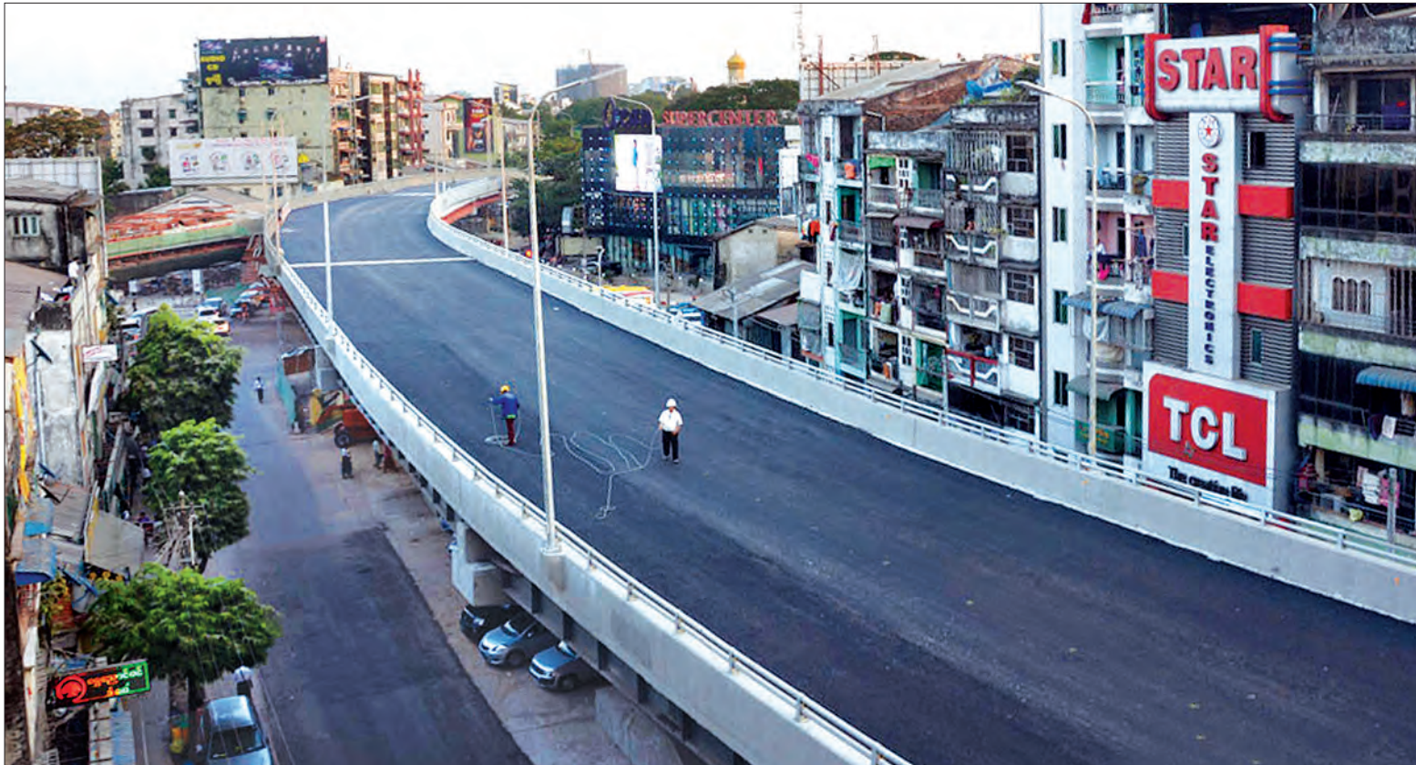
သင်္ကြန်အကျနေ့တွင် စတင်ဖြတ်သန်းသွားလာခွင့်ပြုမည့် တာမွေလမ်းဆုံခုံးကျော်တံတား ဦးချစ်မောင်လမ်းဘက်ခြမ်းကို တွေ့ရစဉ်

သတင်း-မောင်စိန်လွင်(မြန်မာ့အလင်း)