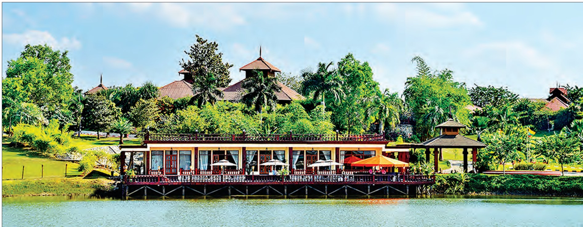
နေပြည်တော်ရှိ Aureum Palace ဟိုတယ်အား တွေ့ရစဉ်