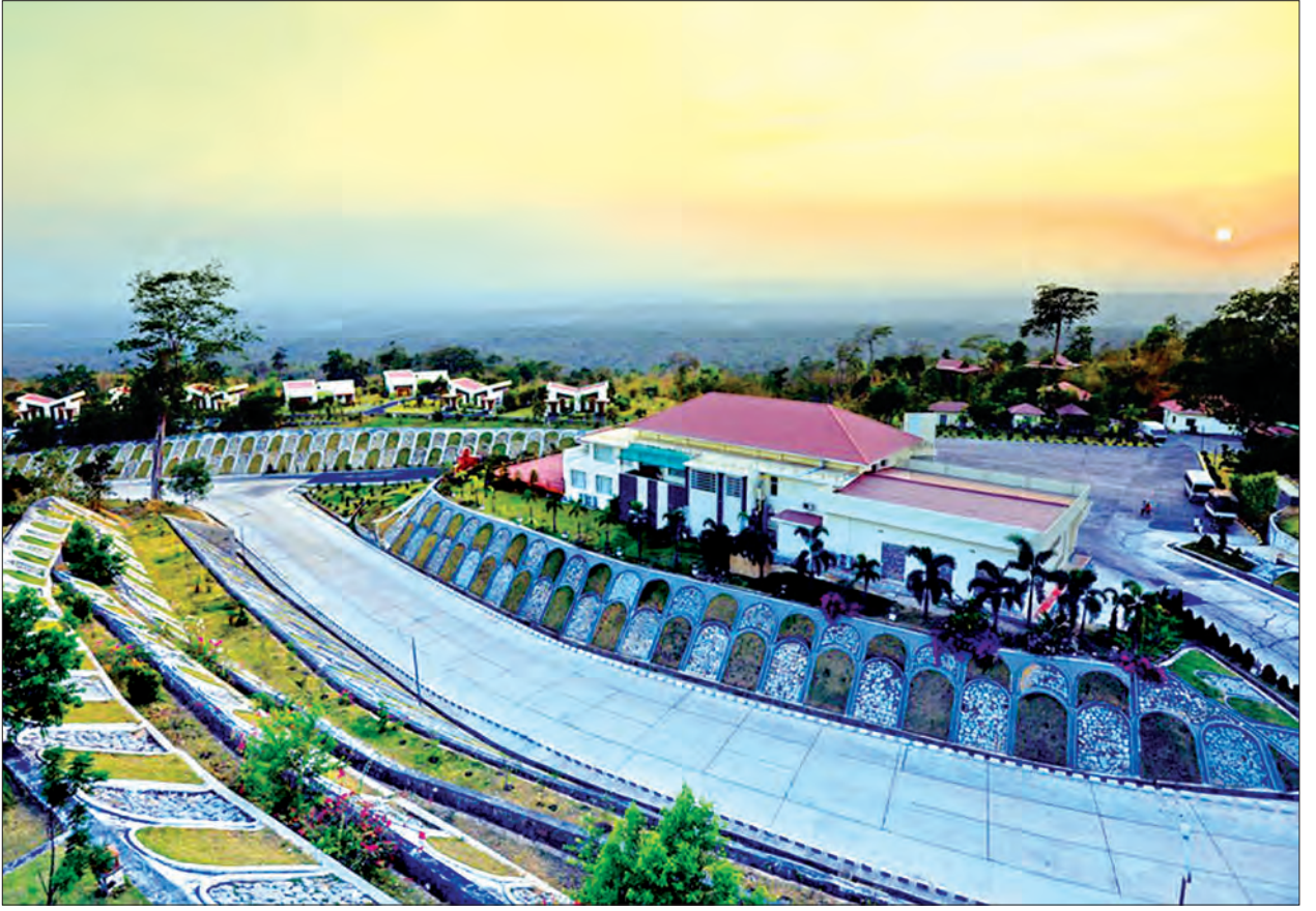
နေပြည်တော်သို့လာရောက်သည့် ပြည်တွင်း ပြည်ပခရီးသွားဧည့်သည်များ အနားယူတည်းခိုနိုင်သည့် Mount Pleasant ဟိုတယ်

“MICE မားကတ်ကို ရည်ရွယ်တည်ဆောက်ထားတဲ့အတွက်