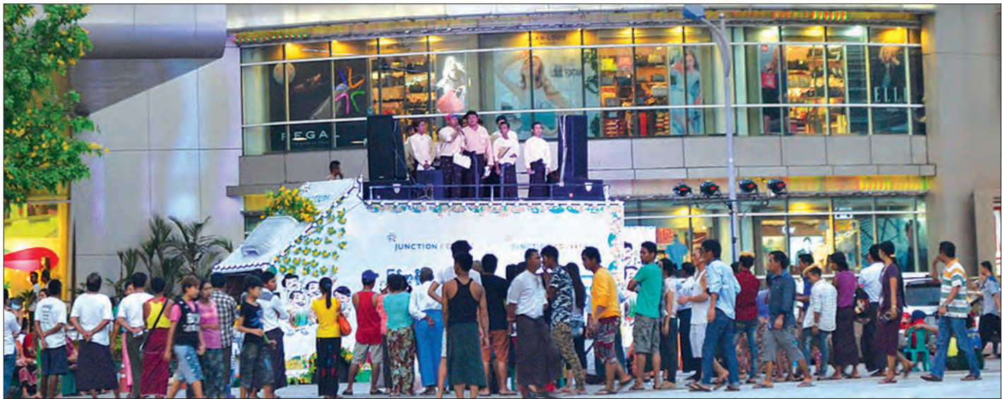
ရန်ကုန်မြို့၊ လှည်းတန်း Junction Square ၌ ကြယ်သီးဦးဆောင်သော သင်္ကြန်သံချပ်အဖွဲ့က မော်တော်ယာဉ်ပေါ်မှ သင်္ကြန်သံချပ်များဖြင့် ပရိသတ်များအား ဖျော်ဖြေစဉ်

မှာပဲကြည့်၊ ရန်ကုန်တိုင်းဒေသကြီး ဝန်ကြီးချုပ်သစ်က သံချပ်တွေနဲ့ပတ်သက်ပြီး ဘာမှပတ်ပတ်တားဆီးတာမျိုး မလုပ်ထားဘူးလို့ ပြောတယ်”ဟု အသက် ၆၀ ကျော်အဘိုးဦးတင်ကျော်က သင်္ကြန်သံချပ်နှင့် ပတ်သက်၍ ရှေးဟောင်းနောင်းမြစ်များကို ပြန်လည်ရင်ဖွင့်ခဲ့သည်။ သတင်း-စိန်လွင်အောင် (မြန်မာ့အလင်း)