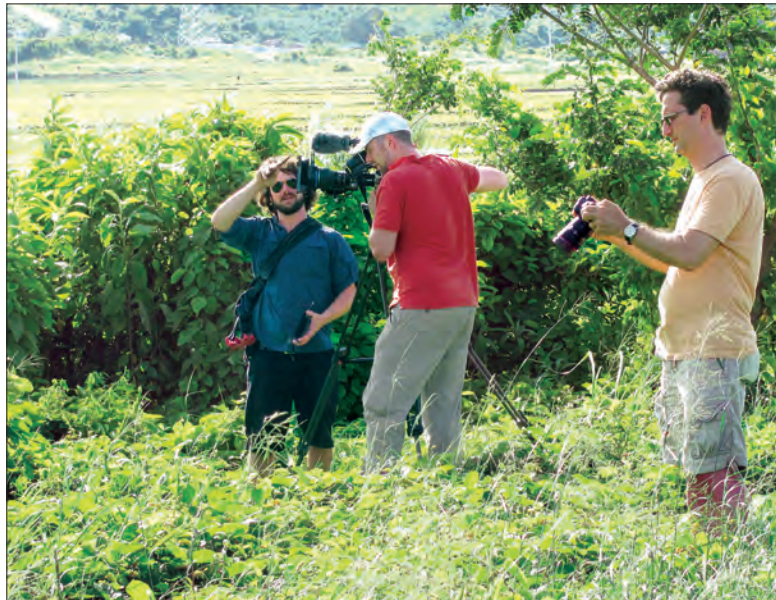
နေပြည်တော်ပတ်ဝန်းကျင် ဓာတ်ပုံနှင့်ဗီဒီယိုမှတ်တမ်းတင်ရိုက်ကူးနေသည့် နိုင်ငံခြားသားဧည့်သည်များ