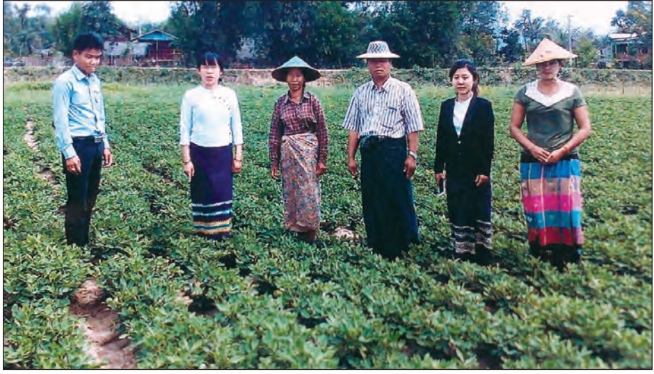
မြို့သစ် ဧပြီ ၈ မကွေးတိုင်းဒေသကြီး မြို့သစ်မြို့နယ် ယင်း(၃) ကာကွယ်တောအတွင်းရှိ သဘာဝတောထိန်းသိမ်းကာကွယ်ခြင်း ဧက (၁၀၀၀)မှစတင်ပြီးဆောင်ရွက်သည့်အပင်ပူးခွာခြင်း၊ ပင်စည်မှအကိုင်းအခက်များ ရှင်းလင်းခြင်းလုပ်ငန်းမှ ထွက်ရှိသည့်ထင်း ၄ ဒသမ ၂၇၆၈ ကုပတန်အား ရေပြည်ကျေးရွာအုပ်စုနတ်ရွာကျေးရွာမှအိမ်ထောင်စု ၈၄ စုရှိ ဒေသခံကျေးလက်ပြည်သူများအား အခမဲ့ဖြန့်ဝေပေးအပ်ခဲ့ကြောင်း သိရသည်။ ထို့အပြင် အပူပိုင်းဒေသစီမံကိန်းစီမံခန့်ခွဲရေး ဦးစီးဌာနအနေဖြင့် စိုက်ခင်းများတည်ထောင်ခြင်း၊ သဘာဝတောကျန်များထိန်းသိမ်းကာကွယ်ခြင်း၊ ထင်းအစားထိုးအခြားလောင်စာအသုံးချရေးလုပ်ငန်းများကို တိုးချဲ့ဆောင်ရွက်ခြင်း၊ ရေရရှိရေးအကောင်အထည်ဖော်ဆောင်ရွက်ခြင်းစသည့် လုပ်ငန်းကြီး (၄) ရပ်ကို အကောင်အထည်ဖော်ဆောင်ရွက် ဆောင်ရွက်လျက်ရှိကြောင်း သိရသည်။