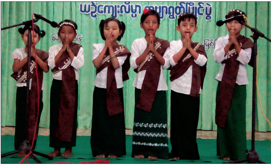
ကျောင်း ၁၆ ကျောင်းမှ မူလတန်း အဆင့်ကျား ၁၆ သင်း၊ မ ၁၆ သင်းတို့က မြတ်မင်္ဂလာစာအုပ်ထဲမှ ကြိုက်နှစ်သက်ရာ ကဗျာများဖြင့် ရွေးချယ်ယဉ်ကျေးမှုပြိုင်ပွဲကြိုကြောင်း၊ ယင်းပြိုင်ပွဲကို ကချင်ပြည်နယ်အစိုးရအဖွဲ့ကြီးကြပ်မှုဖြင့် ကချင်ပြည်နယ် သာသနာ့နှင့် ဝတ်မှုန် ဝန်ကြီးဌာနမှ ပုဒ္ဒဘာသာသာသနာရေးရာအဖွဲ့မှ ဦးစီးပြီးပြုလုပ်ဆောင်ရွက်ခဲ့ကြောင်း သိရသည်။