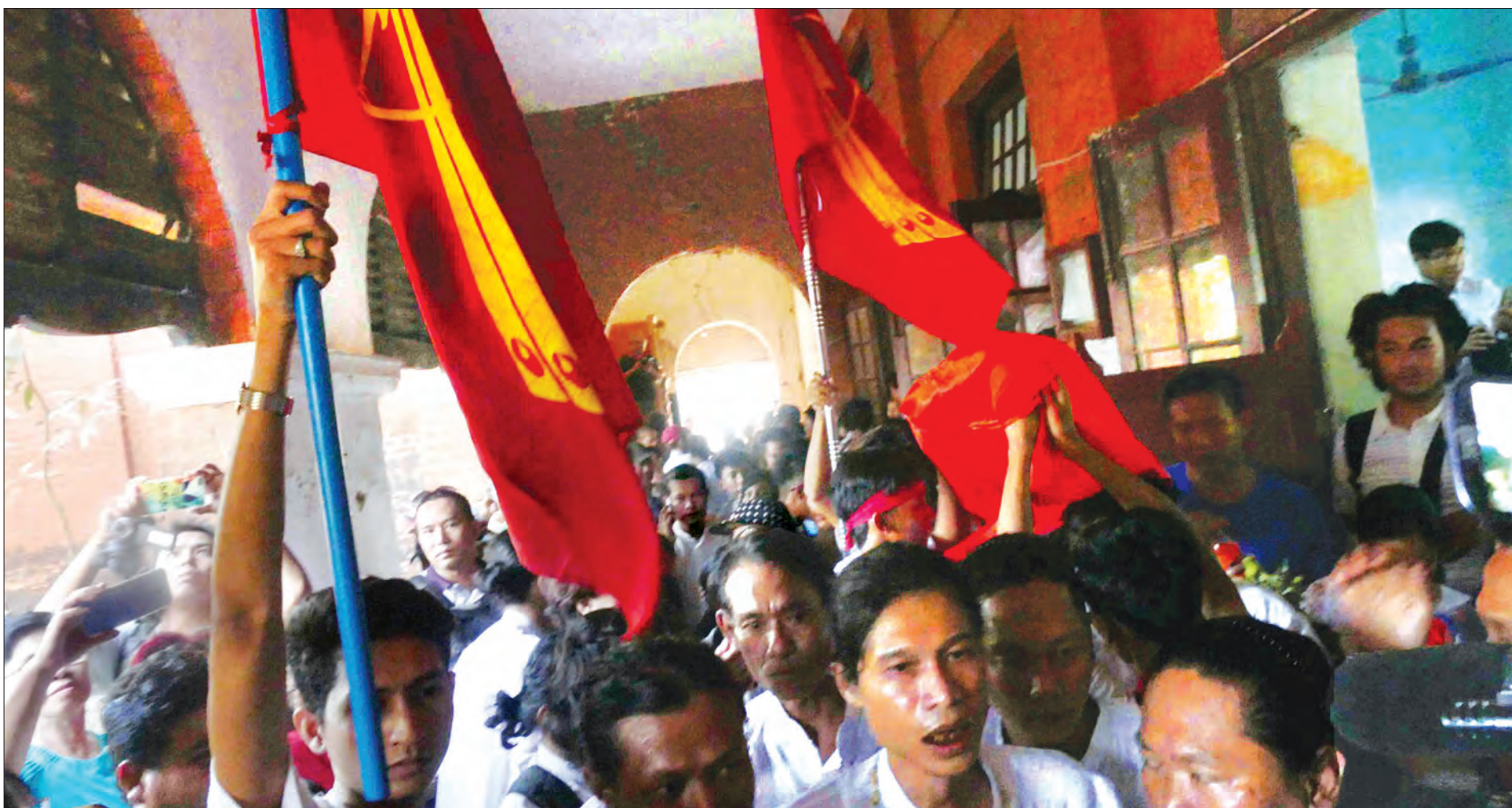
နိုင်ငံရေးအကျဉ်းသားများ၊ နိုင်ငံရေးတက်ကြွလှုပ်ရှားသူများ၊ နိုင်ငံရေးနှင့်ဆက်နွယ်ပြီး အမှုရင်ဆိုင်နေကြရသူများ၊ အမှုရင်ဆိုင်နေရဆဲ ကျောင်းသား ကျောင်းသူများ ပြန်လည်လွတ်မြောက်လာသည်ကို တွေ့ရစဉ်