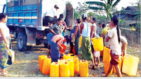
သနပ်ပင်မြို့နယ်အတွင်းရှိ ရေပြတ်လပ်မှုဖြစ်ပေါ်နေသည့် ကျေးရွာအချို့အား ရေဖြန့်ဝေပေးနေမှုကြောင့်

အချို့ပျေ။ အဆိုးဆုံးသနပ်ပင်မြို့နယ်ထဲက ကျေးရွာအချို့ဆိုရင် တုံ့ကင်တွေကရေငန်ပဲထွက်တယ်။ ကန်တွေခန်းခြောက်ကုန်တယ်။ အဲဒီတော့ သောက်ရေ ယာယီကန်တွေ ပြုလုပ်ပေးပြီး ရေဖြည့်ပေးထားပါတယ်။ နောက်ထပ် ကျေးရွာတွေအတွက်လည်း ရေပြတ်လပ်မှု ဖြစ်ပေါ်လာတာနဲ့ တစ်ပြိုင်နက် သက်ဆိုင်ရာ မြို့နယ် ကျေးလက်ဒေသဖွံ့ဖြိုးတိုးတက်ရေး ဦးစီးဌာနကို ဆက်သွယ်အကူအညီ