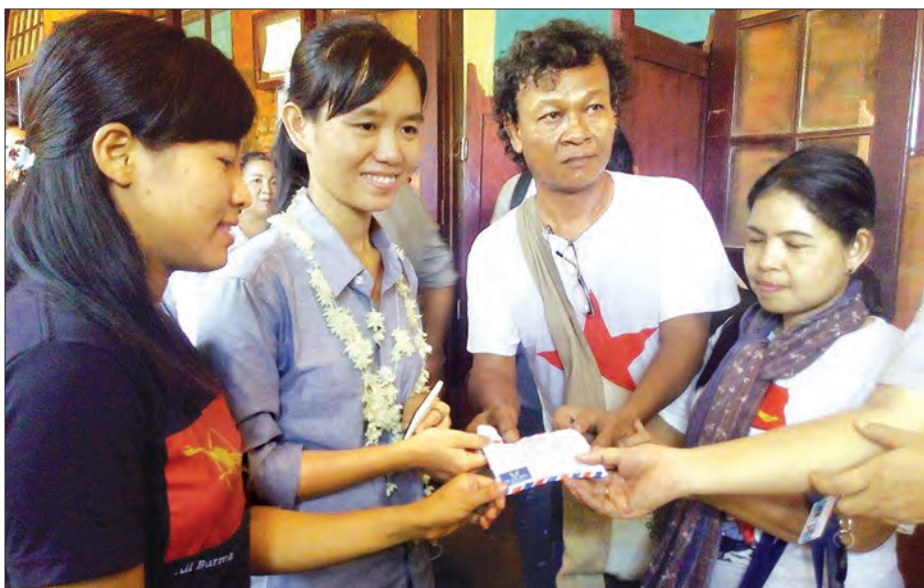
ပြန်လည်လွတ်မြောက်လာသည့် နိုင်ငံရေးအကျဉ်းသားများအား ထောက်ပံ့ငွေများ ပေးအပ်စဉ်

အမျိုးသားပညာရေးဥပဒေပြင်ဆင်ရန် ဆန္ဒပြခဲ့သည့် ကျောင်းသားများနှင့်ဝန်းရံပြည်သူများသည် သပိတ်စစ်ကြောင်းချီတက်ဆန္ဒပြခဲ့သဖြင့် ဖမ်းဆီးထိန်းသိမ်းခံခဲ့ရသည်။ ပြည်သူလူထု ရွေးကောက်တင်မြောက်လိုက်သည့် အရပ်သားအစိုးရလက်ထက် ၂၀၁၆ ခုနှစ် ဧပြီ ၈ ရက်နေ့တွင် ကျောင်းသားများနှင့် ဝန်းရံပြည်သူများ လွတ်မြောက်ခဲ့ကြသည်။ အဆိုပါကျောင်းသားများ လွတ်မြောက်မှုနှင့်ပတ်သက်ပြီး မေးမြန်းထားသည်များကို ဖော်ပြလိုက်ပါသည်။