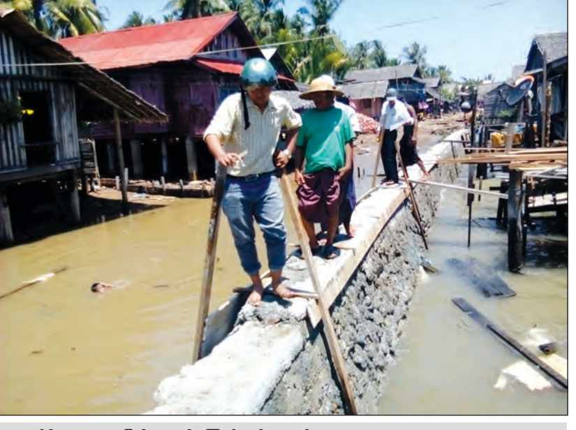
ကျောက်စီရေကာနံရံ ပြီးစီးနေမှုကို ကြည့်ရှုစစ်ဆေးစဉ်

လူထုပဟိုပြုစီမံကိန်းအရ ပထော်ကျေးရွာ ၁၅၀ သိန်းကျော်ဖြင့်လည်းကောင်း၊ အရှည် ၁၅၀၀ ပေ ရေပိုက်သွယ်တန်းခြင်းကို ငွေကျပ် ၇၀ သိန်းကျော်ဖြင့်လည်းကောင်း၊ မအိုင်ကျေးရွာတွင် အလျားပေ ၆၀၊ အနံ ပေ ၃၀ ရှိ တစ်ထပ်စာသင် ကျောင်းဆောင်သစ်ကို ငွေကျပ် ၂၂၉ သိန်းကျော် ဖြင့်လည်းကောင်း၊ လင်မလိုငယ်ကျေးရွာတွင် အလျားပေ ၆၀၊ အနံ ပေ ၃၀ ရှိ တစ်ထပ်စာသင်