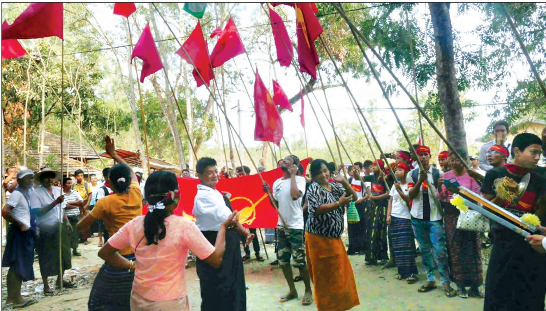
နိုင်ငံရေးအကျဉ်းသားများ၊ နိုင်ငံရေးတက်ကြွလှုပ်ရှားသူများ၊ နိုင်ငံရေးနှင့်ဆက်နွှယ်ပြီး အမှုရင်ဆိုင်နေကြရသူများ လွတ်မြောက်လာ၍ ပျော်ရွှင်နေသည်ကို တွေ့ရစဉ်