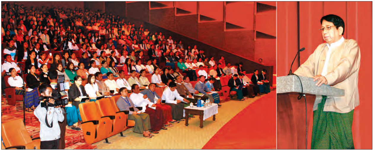
ပြည်ထောင်စုဝန်ကြီး ဒေါက်တာဖေမြင့် မြန်မာ့အသံနှင့် ရုပ်မြင်သံကြားမှ ဝန်ထမ်းများတွေ့ဆုံပွဲ၌ အမှာစကားပြောကြားစဉ်

တစ်ချိန်တည်းတွင် အစိုးရဘက်မှ ပြောရုံသာမကဘဲ အများပြည်သူဘက်မှလည်း အစိုးရပိုင်းအဆင့်ဆင့်ရှိပုဂ္ဂိုလ်များ လုပ်ကိုင်ဆောင်ရွက်နေသည်များထဲမှ ချို့ယွင်းမှု၊ တိမ်းစောင်းမှု၊ ချွတ်ချော်မှု၊ လွဲမှားမှုများရှိလျှင် ဝေဖန်ထောက်ပြရန်ဖြစ်ကြောင်း။