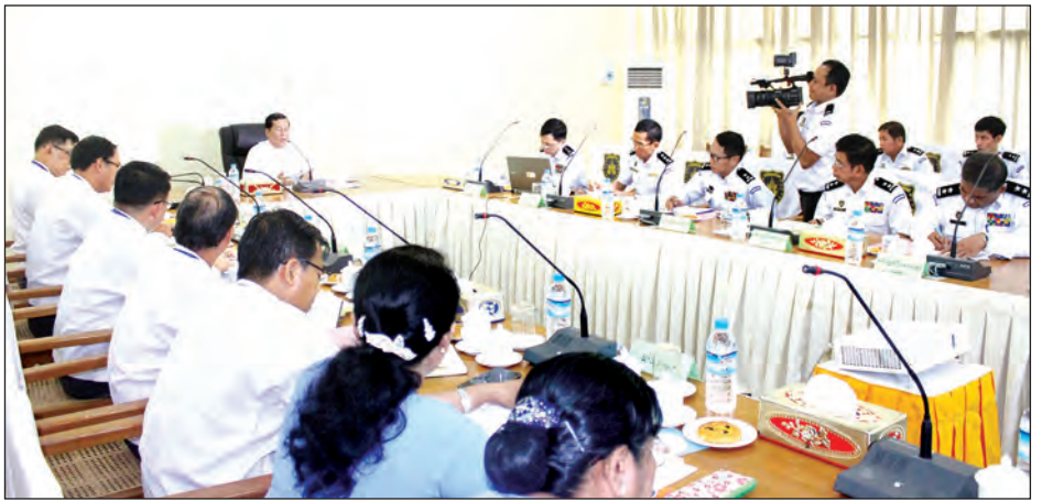
လိုအပ်သည်များ ညှိနှိုင်းဖြည့်ဆည်းဆောင်ရွက်ပေးပြီး လက်တွေ့ကျသော ဆောင်ရွက်ချက်များဖြစ်စေရေးနှင့် အခြားမိတ်ဖက် အဖွဲ့အစည်းများနှင့် လည်း ပေါင်းစပ်ညှိနှိုင်းဆောင်ရွက်ကြရေး နိဂုံးချုပ်အမှာစကားပြောကြားကာ အစည်းအဝေးကို ရုပ်သိမ်းလိုက်ကြောင်း သတင်းရရှိသည်။ (သတင်းစဉ်)

ဆည်း ဆောင်ရွက်ပေးနိုင်မည့် လုပ်ငန်းများဖြစ်ရန်လိုကြောင်း၊ ဟန်ပြ ဆောင်ရွက်ခြင်းမျိုးမဟုတ်ဘဲ ထိထိရောက်ရောက် ဆောင်ရွက်နိုင်မည့် လက်တွေ့ကျသော လုပ်ငန်းများကို ဌာနအလိုက် ရှင်းလင်းတင်ပြကြရန် လိုကြောင်းဖြင့် ရှင်းလင်းပြောကြားသည်။ ထို့နောက် ဌာနအလိုက်တာဝန်ခံ ညွှန်ကြားရေးမှူးချုပ်များက လက်ရှိ လုပ်ငန်းဆောင်ရွက်နေမှု အခြေအနေများနှင့် ဆက်လက်ဆောင်ရွက်မည့် ရှေ့လုပ်ငန်းစဉ်များကို အသီးသီး ရှင်းလင်းတင်ပြကြသည်။ ယင်းနောက် ရှင်းလင်းတင်ပြချက်များအပေါ် ပြည်ထောင်စုဝန်ကြီးက