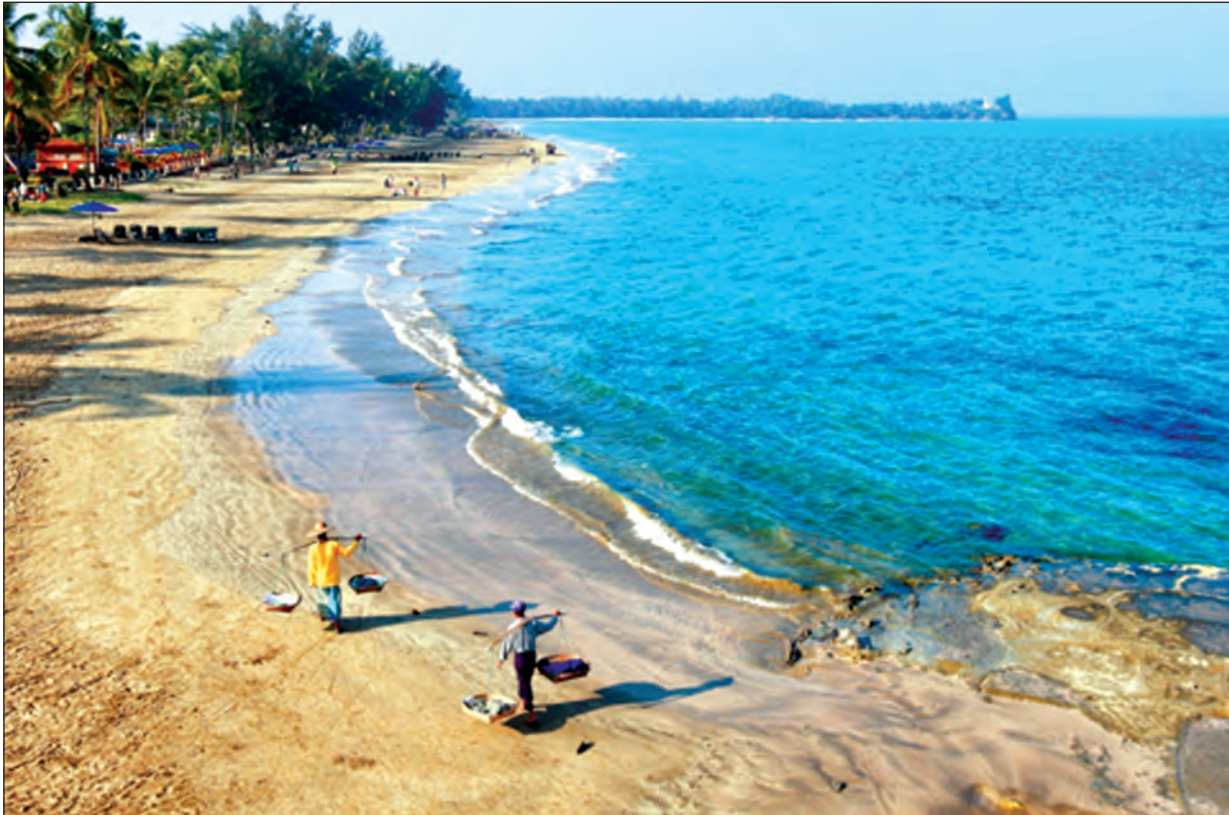
မြန်မာနိုင်ငံ ကမ်းခြေတစ်ခု၏ သဘာဝအလှအပများ။

ယနေ့ကမ္ဘာကြီးတွင် စက်မှုလုပ်ငန်းများ ဖွံ့ဖြိုးတိုးတက်လာခြင်း၊ စက်တပ်ယာဉ်များ အသုံးပြုမှုများ ပြားလာခြင်း၊ သစ်တောများပြုန်းတီးလာခြင်း၊ မြေပေါ်မြေအောက် သယံဇာတများကို အလွန်အကျွံထုတ်ယူသုံးစွဲလာခြင်းတို့ကြောင့် ဂေဟစနစ်များပျက်စီးယိုယွင်းကာ ကမ္ဘာကြီးအနေဖြင့် ရာသီဥတုဖောက်ပြန်မှုများကို တစ်နှစ်ထက်တစ်နှစ် ပိုမိုရင်ဆိုင်ကြုံတွေ့လာရပြီး ပူပြင်းခြောက်သွေ့မှုကြောင့် မြစ်ချောင်းများတိမ်ကောပျက်စီးမှု၊ ရေအရင်းမြစ်များ ပျောက်ကွယ်မှု၊ မြေအောက်ရေများ ခန်းခြောက်မှု၊ ဆားငန်ရေများ တိုးဝင်ကာရေချိမ့်ရေငန်အဖြစ် ပြောင်းလဲမှု၊ ရေတွင် လူတို့သောက်သုံးရန်မသင့်သော သတ္တုဓာတ်များပါဝင်နေမှုစသော ရာသီဥတုပြောင်းလဲမှုဆိုင်ရာဖြစ်စဉ်များဖြင့် သဘာဝပတ်ဝန်းကျင်များ ယိုယွင်းလာခဲ့ပါသည်။