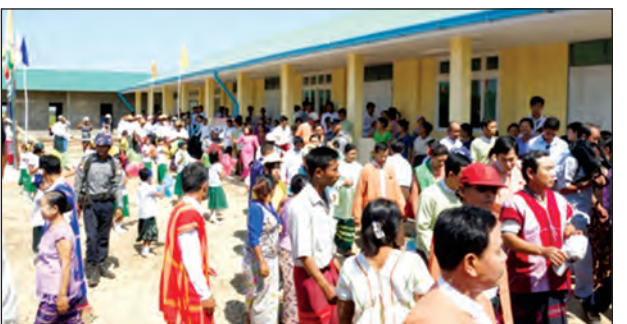
ဒေသကြီးဝန်ကြီးချုပ် ဦးမန်းဂျော်နှင့် တိုင်းဒေသကြီး တိုင်းရင်းသားဝန်ကြီးများ၊ တိုင်းဒေသကြီးလွှတ်တော်ကိုယ်စားလှယ်များ၊ ဂျပန်နိုင်ငံမှ အလှူရှင်များ၊ ဒေသခံပြည်သူများ တက်ရောက်ခဲ့ကြပြီး တိုင်းဒေသကြီးဝန်ကြီးချုပ်နှင့် ဂျပန်နိုင်ငံမှ အလှူရှင် Mr.Ohtake ၊ Nippon Foundation မှ Mrs. Tanaka Mari နှင့် တာဝန်ရှိသူများက ဖဲကြီးဖြတ်ဖွင့်လှစ်ခဲ့သည်။

ကျောင်းဆောင်သစ်များဖွင့်ပွဲနှင့် လွှဲပြောင်းပေးအပ်ပွဲတွင် ဧရာဝတီတိုင်း