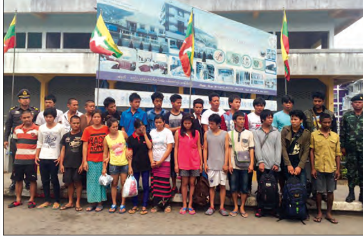
မတ် ၂၉ ရက်က ထိုင်းနိုင်ငံမှ ပြန်လည်လွှဲပြောင်းသော မြန်မာလုပ်သားများ။