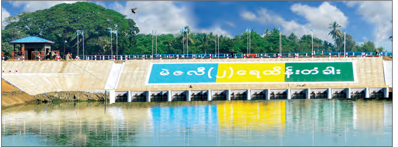
ထို့ပြင်လာမည့် ၂၀၁၇ - ၂၀၁၈ ခုနှစ်၌ နယ်သာလန်နိုင်ငံမှနည်းပညာအကူ အညီရယူကာ မြန်မာအင်ဂျင်နီယာများဖြင့် လိုင်မြစ်ဝအနီး၌ ရေထိန်းတံခါး ကြီးအား တည်ဆောက်ရန်ရှိကြောင်း စိုက်ပျိုးရေး၊ မွေးမြူရေးနှင့် ဆည်မြောင်း ဝန်ကြီးဌာနမှ ထပ်မံသိရသည်။

ညောင်တန်း ဧပြီ ၄ ရေဝတ်တိုင်းဒေသကြီး ညောင်တန်းမြို့နယ် မဲလီရွာမကျေးရွာအနီးရှိ ကုတ္တိုမြစ်မှ ပေ ၁၀၀၀ အကွာ၌ရှိသော နိုင်ငံတော်ရန်ပုံငွေကျပ် ၄ ဒသမ ၉ ဘီလီယံကျော်ကုန်ကျခံတည်ဆောက်လျက်ရှိသည့် မဲလီ (၂) ရေထိန်းတံခါး တည်ဆောက်ရေးစီမံကိန်းမှာ ယခုအခါတည်ဆောက်မှုစီမံကိန်း ရာနှုန်း ပြည့်ဆောင်ရွက်ပြီးစီးနေပြီဖြစ်သောကြောင့် ဒေသခံများအတွက်အကျိုးဖြစ် ထွန်းစေတော့မည်ဖြစ်သည်။ (ယာပုံ)