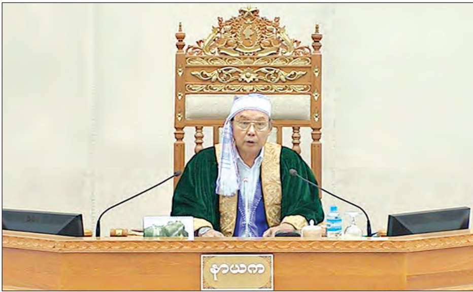
ပြည်ထောင်စုလွှတ်တော်နာယက မန်းဝင်းခိုင်သန်း