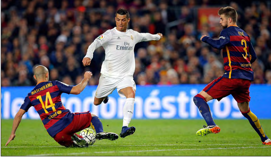
စီရော်နယ်ဒိုရဲ့ ဒီအနိုင်ဂိုးဟာ ယခုနှစ် ရာသီအတွက် ၄၂ ဂိုးမြောက် ဖြစ်ပြီး စပိန်လာလီဂါမှာ ၂၉ ဂိုးမြောက်ဂိုး ဖြစ်ပါတယ်။ သို့ပေမယ့် ဘာစီလိုနာက မြောက်မှတ် အသာနဲ့ ဦးဆောင်နေဆဲဖြစ်ပါတယ်။

စပိန်လာလီဂါမှာ ဦးဆောင်နေတဲ့ ဘာစီလိုနာအသင်းရဲ့ ၃၉ ပွဲ ဆက်တိုက် ရှုံးပွဲမရှိ စံချိန်ကို ရိုးရဲမက်ဒရစ် နာမည်ကျော် တိုက်စစ်မျှား စီရော်နယ်ဒိုက နောက်ကျ ဂိုးသွင်းပြီး ရပ်တန့်ပေးခဲ့ပါတယ်။ အဲဒီပွဲမှာ စီရော်နယ်ဒိုက နောက်ကျ ဂိုးသွင်းပြီး ဘာစီလိုနာကို နှစ်ဂိုး-တစ်ဂိုးနဲ့ ရိုးရဲမက်ဒရစ်က အနိုင်ရစေခဲ့ပါတယ်။ ဒီပွဲမှာ ဂျရတ် ပီကေးက ဘာစီလိုနာအတွက် ဦးဆောင်ဂိုး သွင်းယူပေးခဲ့ပေမယ့် ဒုတိယပိုင်းမှာ ဘင်ဖီကာ ပြန်လည်ချေပခဲ့ပါတယ်။ ရိုးရဲမက်ဒရစ်က ရာမိုစ်ဟာ နှစ်ဝါ တစ်နိန့် ထွက်ခဲ့ရပေမယ့် အဓိက ကစားသမားတွေဖြစ်တဲ့ စီရော်နယ်ဒို၊ ဂါရက်ဘေးနဲ့ ဘင်ဖီမာတို့ခြေစွမ်းပြ ကစားနိုင်ခဲ့တဲ့အတွက် ဇီဒန်းရဲ့ ရိုးရဲမက်ဒရစ်ဟာ ဘာစီလိုနာရဲ့ ရှုံးပွဲမရှိ စံချိန်ကို ရပ်တန့်နိုင်ခဲ့ပါတယ်။