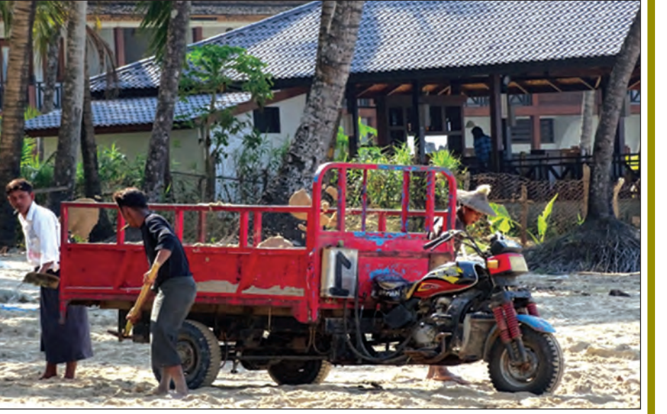
ကမ်းခြေတစ်ခုတွင် သဲတူးဖော်ရန် ပြင်ဆင်နေစဉ်။

ရာတွင် ပြည်သူလူထု၏ အသိတရား ပိုမိုမြှင့်တင်ပေးရန်အတွက် အသိအမြင်ကြွယ်ဝမှု၊ ပူးပေါင်း ပါဝင်မှုသည် အဓိကကျပါသည်။ တောင်တစ်တောင်ကို ဖြိုချရန် အတွက် ကျောက်ခဲတစ်လုံးမှ အစ ပြုပါသည်။ သစ်ပင်တစ်ပင် ခုတ်ယူ ခြင်းမှအစပြု၍ သစ်တောတစ်ခုလုံး