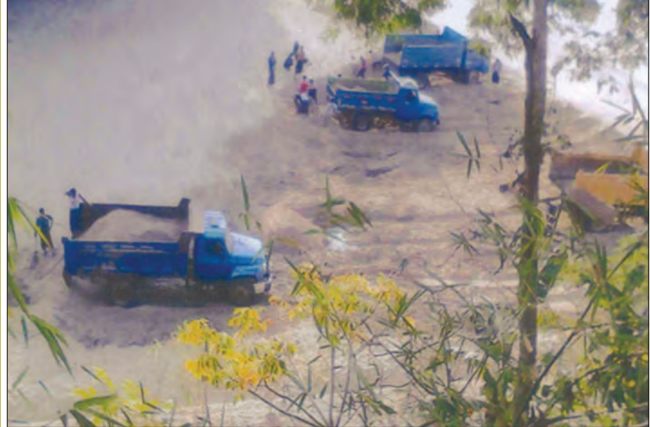
ကမ်းခြေတစ်ခုတွင် စီးပွားဖြစ် သဲတူးဖော်သည့်လုပ်ငန်းများ လုပ်ကိုင်နေစဉ်။