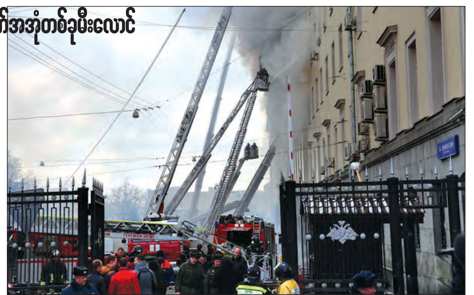
အဆောက်အအုံတစ်ခုသို့ ရွှေ့ပြောင်းထားပြီးဖြစ်၍ မီးလောင်ခြင်းမရှိဟု ဝန်ကြီးဌာနက ပြောသည်။ ကျွမ်းမှုကြောင့် ဌာန၏ အဓိလုပ်ငန်းများကို ထိခိုက် (ဆင်ဟွာ)

မော်စကို ဧပြီ ၄ ရုရှားနိုင်ငံ မော်စကိုမြို့လယ်ကောင်ရှိ ရုရှားကာကွယ်ရေးဝန်ကြီးဌာနမှ အဆောက်အအုံတစ်ခု တနင်္ဂနွေနေ့က မီးလောင်ကျွမ်းခဲ့ရာ နာရီပေါင်းများစွာ မီးငြိမ်းသတ်ခဲ့ပြီးနောက် မီးငြိမ်းသွားသည်။ ထိုခိုက်ဒဏ်ရာရရှိသူ တစ်ဦးမျှမရှိကြောင်း သိရသည်။ မော်စကို စံတော်ချိန် ၄ နာရီခွဲတွင် အဆောက်အအုံဥပစာတစ်ခုလုံး မီးလောင်ကျွမ်းခြင်းမခံရအောင် ထိန်းချုပ်နိုင်ခဲ့သည်ဟု ရုရှားနိုင်ငံ အရေးပေါ်အခြေအနေဖြေရှင်းရေး ဝန်ကြီးဌာနမှ ဒုတိယအကြီးအကဲက ပြောသည်။ မော်စကိုစံတော်ချိန် နံနက် ၁၀ နာရီဝန်းကျင်က အဆောက်အအုံ၏ ဒုတိယအထပ်မှစတင်၍ မီးလောင်ကျွမ်းခဲ့ပြီး လျှပ်စစ်ရှောင်ခိုရာမှ လောင်ကျွမ်းခြင်းဖြစ်သည်ဟု ကာကွယ်ရေးဝန်ကြီးဌာန သတင်းထုတ်ပြန်ချက်ကို ကိုးကား၍ တက်(စ်) သတင်းဌာနမှ ဖော်ပြသည်။ အဆောက်အအုံမှာ ဟောင်းနွမ်းနေပြီး လေပြင်းများလည်း တိုက်ခတ်နေသောကြောင့် စတုရန်းမီတာ ၃၅၀၀ ခန့် မီးလောင်ကျွမ်းခဲ့သည်။ အနီးအနားရှိအဆောက်အအုံများ မီးကူးစက်လောင်ကျွမ်းမှုမရှိအောင် မီးသတ်သမားများက ကြိုးစားငြိမ်းသတ်ခဲ့သည်။ အဓိကဌာနများကို