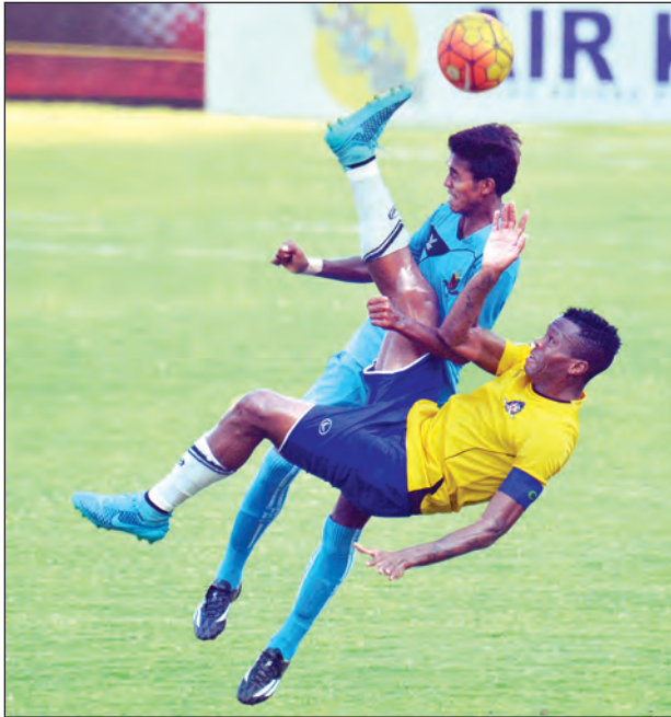
မကွေးအသင်းနှင့်ဟံသာဝတီအသင်းတို့ အကြိတ်အနယ် ယှဉ်ပြိုင်နေစဉ်။