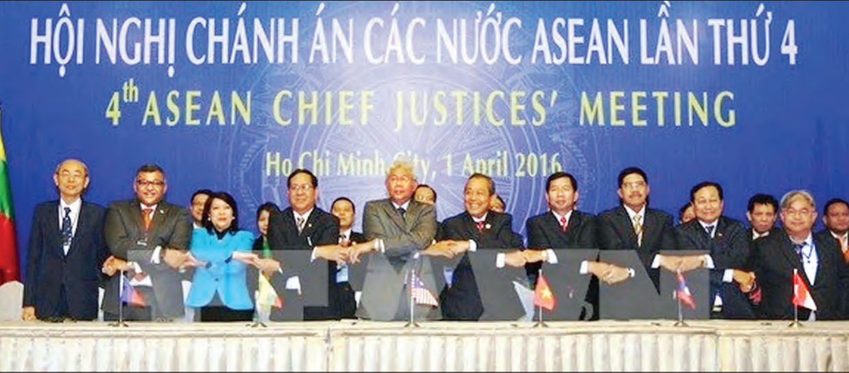
ရေးအဖွဲ့ ဖွဲ့စည်း၍ အစီရင်ခံစာတင်ပြရေးဆောင်ရွက်ရန် စသည်ဖြင့် ပါဝင်သည်။ အာဆီယံတရားသူကြီးချုပ်များ အစည်းအဝေးသည် အာဆီယံဒေသ

ထို့ပြင် “ဟိုချီမင်းမြို့ ကြေညာချက်” ကို သဘောတူထုတ်ပြန်ခဲ့ပြီး ယင်းကြေညာချက်တွင် အာဆီယံမူဘောင်အတွင်း အုပ်ချုပ်ရေးနှင့် ဥပဒေပြုရေးဆိုင်ရာ ပူးပေါင်းဆောင်ရွက်မှုများနှင့် တရားစီရင်ရေး အဖွဲ့အစည်းများအကြား ထိရောက်ခိုင်မာသည့် တရားဝင်ပူးပေါင်းဆောင်ရွက်မှုအတွက် အာဆီယံတရားသူကြီးချုပ်များ အစည်းအဝေးကို “အာဆီယံတရားသူကြီးချုပ်များကောင်စီ”ဟု အမည်ပြောင်းလဲရန်၊ အာဆီယံတရားသူကြီးချုပ်များကောင်စီအား အာဆီယံပဋိညာဉ်စာတမ်းနှင့်အညီ သီးခြားရပ်တည်မှုဖြစ်ပေါ်ရေးအတွက် ဆောင်ရွက်ရန်၊ အာဆီယံတရားသူကြီးချုပ်များကောင်စီ၏ အနာဂတ်လုပ်ငန်းများအတွက် ကိုယ်စားလှယ်အသီးသီးပါဝင်သည့် လေ့လာ