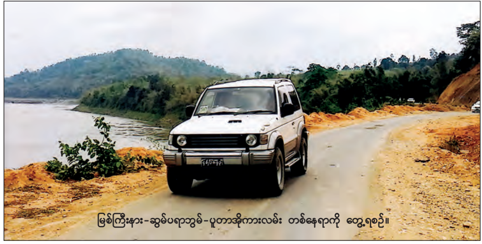
မြစ်ကြီးနား-ဆွမ်ပရာဘွမ်-ပူတာအိုကားလမ်း တစ်နေရာကို တွေ့ရစဉ်။

သတင်း-ခရမ်းစိုးမြင့်