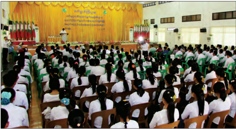
ကျောင်းသားဆုနှင့် ဘာသာရပ်လိုက် ထူးချွန်ဆုရရှိသူများအား ဆုများ ချီးမြှင့်၍ ကျောင်းအုပ်ကြီးက သင်တန်းဆင်း အောင်လက်မှတ်များအား သင်တန်းသား ၁၆၆ ဦးတို့အား (သတင်းစဉ်)

နေပြည်တော် ဧပြီ ၄ စက်မှုဝန်ကြီးဌာနသည် တိုင်းပြည် ၏ စက်မှုဖွံ့ဖြိုးတိုးတက်ရေးအတွက် အဓိက မောင်းနှင်အားဖြစ်သည့် အရည်အသွေးပြည့်ဝသော ကျွမ်း ကျင်လုပ်သားများအား နှစ်စဉ် လေ့ကျင့် မွေးထုတ်ပေးလျက်ရှိရာ စက်မှုဝန်ကြီးဌာနစက်မှု ပူးပေါင်း ဆောင်ရွက်ရေးဦးစီးဌာန ကြီးကြပ် မှုအောက်ရှိ အမှတ်(၆) စက်မှု သင်တန်းကျောင်း (မြင်းခြံ)၏ အမှတ်စဉ်(၂) သင်တန်းဆင်းပွဲအခမ်း အနားကို ဧပြီ ၁ ရက်က Auditorium ခန်းမ၌ ကျင်းပသည်။