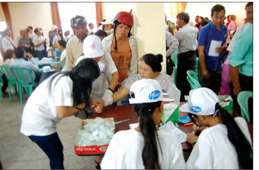
ကျောက်ကပ်ရောဂါ ရှိ မရှိ စစ်ဆေးပေးနေစဉ်။

“ကျောက်ကပ်တစ်စုံရဲ့ အရေးပါ တန်ဖိုးရှိပုံ၊ ကျောက်ကပ်နဲ့ နောက်ဆက်တွဲဆက်စပ်နေတဲ့