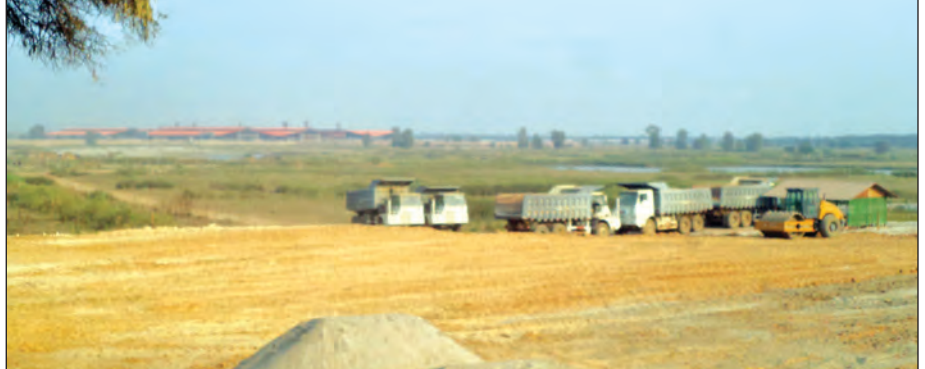
ကျောက်စိမ်းဥယျာဉ် ရေနက်ကွင်း၌ စိမ့်ကိန်းလုပ်ငန်းများဆောင်ရွက်နေမှုကို တွေ့ရစဉ်

ပြုပြင်ပြောင်းလဲမှုများစွာဖြင့် တိုင်းပြည်ဖွံ့ဖြိုးတိုးတက်ရေး အကောင်အထည်ဖော်ရာတွင် ဒေသတွင်းဖွံ့ဖြိုးရေး ဆောင်ရွက်မှုများသည်လည်း တစ်ထောင့်တစ်ကဏ္ဍမှ ပါဝင်နေပေသည်။ ရေနက်ကွင်းများအား ဒေသဖွံ့ဖြိုးရေးစီမံကိန်းအဖြစ် ဆောင်ရွက်နေခြင်းသည် နိုင်ငံဖွံ့ဖြိုးတိုးတက်ရေးအတွက် တစ်ခန်းတစ်ကဏ္ဍပင်ဖြစ်သည်။ ရေနက်ကွင်းဒေသရှိ ပြည်သူတို့၏ ကျေနပ်အားရသည့်အသံများနှင့် ပီတိအပြုံးများစွာကိုလည်း မြင်တွေ့ခဲ့