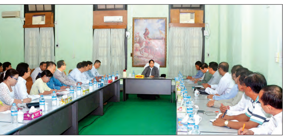
သတင်းတွေကို ထုတ်ပေးမယ်။ သို့သော် ဌာနဆိုင်ရာတွေရဲ့ လစ်ဟင်းချက်၊ ချို့ယွင်းချက်၊ အားနည်းချက်တွေကိုလည်း နိုင်ငံပိုင်မီဒီယာတွေဘက်က ပြည်သူ့ကိုယ်စားပြန်ပြီးတော့ရေးသားတဲ့သတင်းမျိုး လုပ်သင့်တယ်”ဟု ပြည်ထောင်စုဝန်ကြီးက ဆွေးနွေးပြောကြားခဲ့သည်။ ထို့အပြင် ပြည်ထောင်စုဝန်ကြီးက နိုင်ငံပိုင်သတင်းစာများအနေဖြင့်

စာတည်းများ၊ သတင်းထောက်များနှင့် တွေ့ဆုံစဉ် ပြည်ထောင်စုဝန်ကြီးက ထိုသို့ပြောကြားလိုက်ခြင်းဖြစ်သည်။ “အရင်တုန်းကလည်း Public Service ဆိုတဲ့ သဘောမျိုး ရွေးနေတာတော့ ရှိပါတယ်။ အခုအစိုးရသစ်မူဝါဒကတော့ ပြည်သူ့ကို မျက်နှာမူတယ်လို့ သုံးနှုန်းတာပေါ့။ သဘောကတော့ ဒီမိုကရေစီရွေးကောက်ပွဲနဲ့ တက်လာတဲ့ အစိုးရအဖွဲ့ဖြစ်တယ်။ အများပြည်သူက ယုံကြည်လို့ ရွေးကောက်တင်မြောက် တာဝန်ပေးလိုက်တယ်။ တာဝန်ယူထားတဲ့ ပုဂ္ဂိုလ်တွေကလည်း ဘာတွေဆောင်ရွက်နေတယ်ဆိုတာ ပြောဖို့သူတို့မှာ တာဝန်ရှိတယ်။ ရှိတဲ့အလျောက် သူတို့ဘာတွေလုပ်နေပါတယ်ဆိုတဲ့