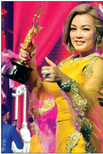
ဖွေးဖွေး