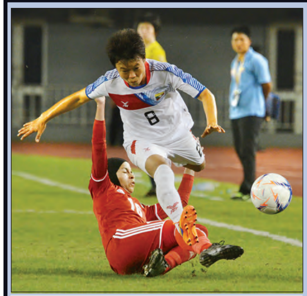
၂၀၁၅ ခုနှစ်အတွင်းက မြန်မာအမျိုးသမီးအသင်းအိုလံပစ်ခြေစစ်ပွဲ ယှဉ်ပြိုင်ကစားခဲ့စဉ်

ယနေ့ပွဲ မကွေး-ဟံသာဝတီ ချင်းယူနိုက်တက်-ဇေယျာရွှေမြေ (သုဝဏ္ဏကွင်း) (အောင်ဆန်းကွင်း)