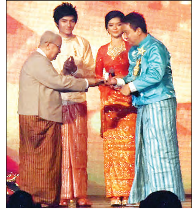
၂၀၁၅ အကောင်းဆုံး ဒါရိုက်တာဆုရ ဒါရိုက်တာတိုင်း ဆုလက်ခံ ယူစဉ် (သတင်းစဉ်)