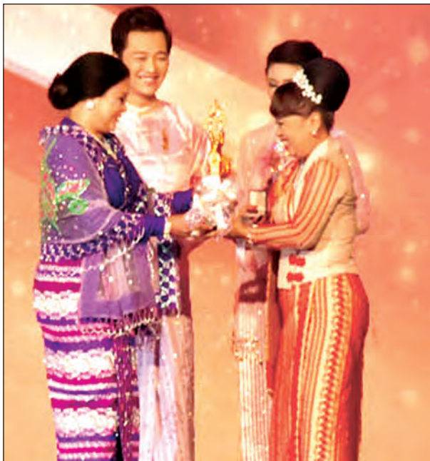
၂၀၁၅ အကောင်းဆုံး အမျိုးသမီးဇာတ်ပို့ဆုရ တက္ကသိုလ်ဂွမ်းပုံ ဆုလက်ခံယူစဉ် (သတင်းစဉ်)