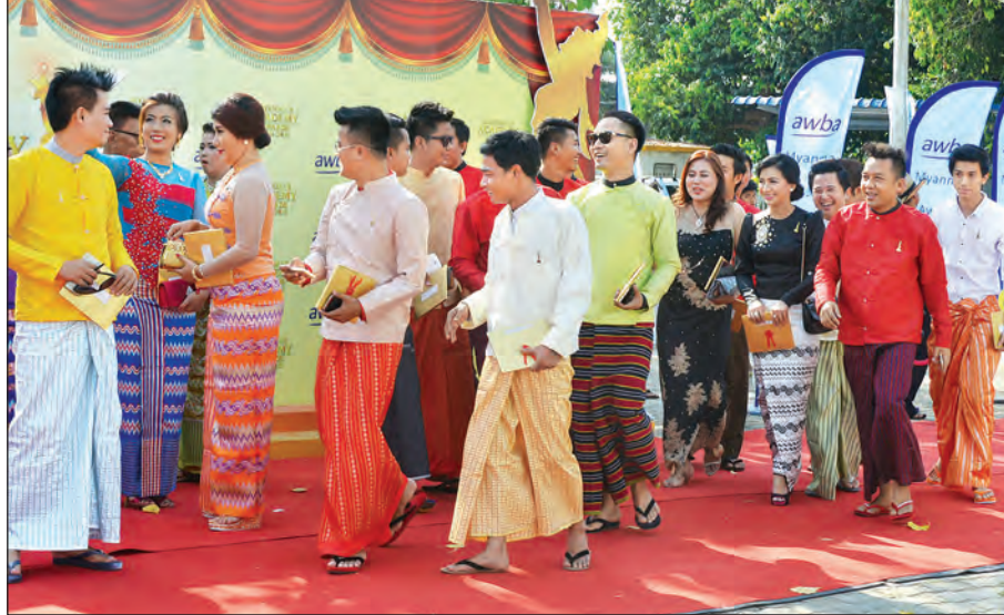
၂၀၁၄ ခုနှစ်နှင့် ၂၀၁၅ ခုနှစ် မြန်မာ့ရုပ်ရှင်ထူးချွန်ဆုရရှိခြင်းပွဲသို့ တက်ရောက်အားပေးသော အနုပညာမောင်နှမများကို တွေ့ရစဉ် (သတင်းစဉ်)

မှတ်ချက်။ ၂၀၁၄ ခုနှစ်အတွက် အကောင်းဆုံးဒါရိုက်တာဆု၊ ၂၀၁၅ ခုနှစ်အတွက် အကောင်းဆုံးရုပ်ရှင် ဇာတ်ကားဆု၊ အကောင်းဆုံးရုပ်ရှင်အသံဆုနှင့် အကောင်းဆုံးရုပ်ရှင်ဇာတ်ညွှန်းဆုတို့ ချီးမြှင့်နိုင်ခြင်းမရှိပေ။