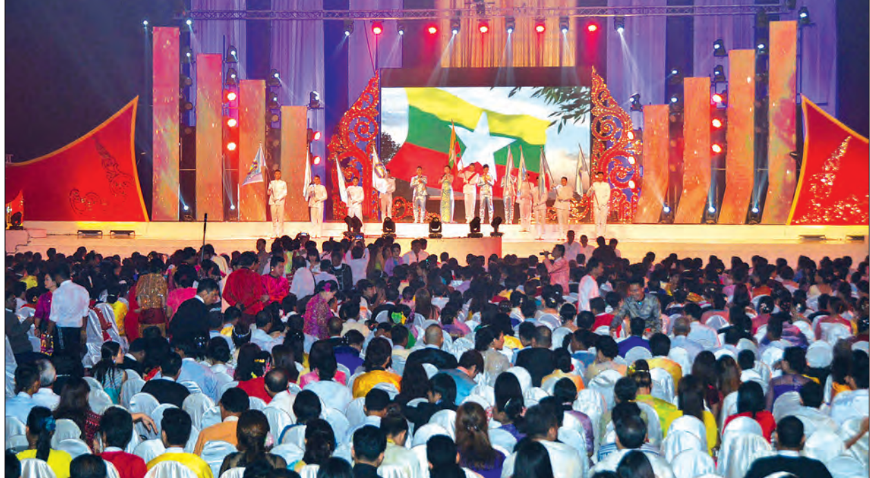
၂၀၁၄ ခုနှစ်နှင့် ၂၀၁၅ ခုနှစ်အတွက် ကျင်းပသည့် မြန်မာ့ရုပ်ရှင်ထူးချွန်ဆုပေးပွဲအခမ်းအနား ဖျော်ဖြေမှု တင်ဆက်သည့်မြင်ကွင်း (သတင်းစဉ်)

ချိန်တန်ပြီ” ဆိုသော ဆောင်ပုဒ်နှင့် တက်လာသော အစိုးရဖြစ်ကြောင်း၊ လူပြောင်း၊ မူပြောင်းစနစ်ပြောင်း ရုံမျှမကဘဲ ပြည်သူတို့၏ ဆန္ဒနှင့် အညီ အရာအားလုံး ဆက်လက် ပြောင်းလဲနိုင်အောင် ကြိုးပမ်းမည်