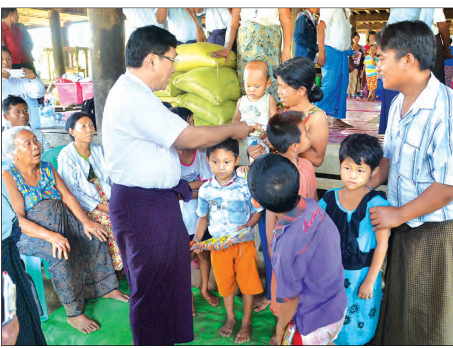
ကယ်ဆယ်ရေးပစ္စည်း ကိုးမျိုး၊ အိမ် ထောက်ပံ့ပေးအပ်ခဲ့ပြီး မီးဘေး ပြောကြားခဲ့ကြောင်း သိရသည်။ ထောက်ပံ့ငွေကျပ် ၆၃၀၀၀ တို့ကို တွေ့ဆုံကာ အားပေးစကား ထောက်ပံ့ပေးအပ်ခဲ့ပြီး မီးဘေး ပြောကြားခဲ့ကြောင်း သိရသည်။ သင့်ပြည်သူများနှင့် ရင်းရင်းနှီးနှီး (သတင်းစဉ်)

နေပြည်တော် ဧပြီ ၃ လယ်ဝေးမြို့နယ် အမှတ်(၁) ရပ်ကွက်၌ ဧပြီ ၂ ရက် ညနေ ၃ နာရီခွဲက မီးလောင်မှုဖြစ်ပွားခဲ့ရာ သွပ်မိုး၊ ထရံကာ နေအိမ်နှစ်လုံး၊ သက်ငယ်မိုးထရံကာ နေအိမ်ငါးလုံး စုစုပေါင်းနေအိမ် ခုနစ်လုံး မီးလောင်ကျွမ်းခဲ့ပြီး အိမ်ထောင်စု ခုနစ်စုမှ စုစုပေါင်း လူဦးရေ ၃၀ မီးဘေးအန္တရာယ်နှင့် ကြုံတွေ့ခဲ့ရ သည်။ လူမှုဝန်ထမ်း၊ ကယ်ဆယ်ရေး နှင့်ပြန်လည်နေရာချထားရေးဝန်ကြီး ဌာန ပြည်ထောင်စုဝန်ကြီး ဒေါက်တာ ဝင်းမြတ်အေးသည် ဧပြီ ၃ ရက် မွန်းတည့် ၁၂ နာရီတွင် မီးဘေးသင့် ပြည်သူများအတွက် ကယ်ဆယ်ရေး စခန်းဖွင့်လှစ်ထားရှိသည့် လယ်ဝေး မြို့ အမှတ်(၁)ရပ်ကွက်ရှိ မြွေရိုးကြီး ကျောင်းတိုက်သို့ သွားရောက်၍ ဝန်ကြီးဌာနက ထောက်ပံ့ပေးအပ် သော တန်ဖိုးငွေကျပ် ၁၅၄၄၆၂ ရှိ