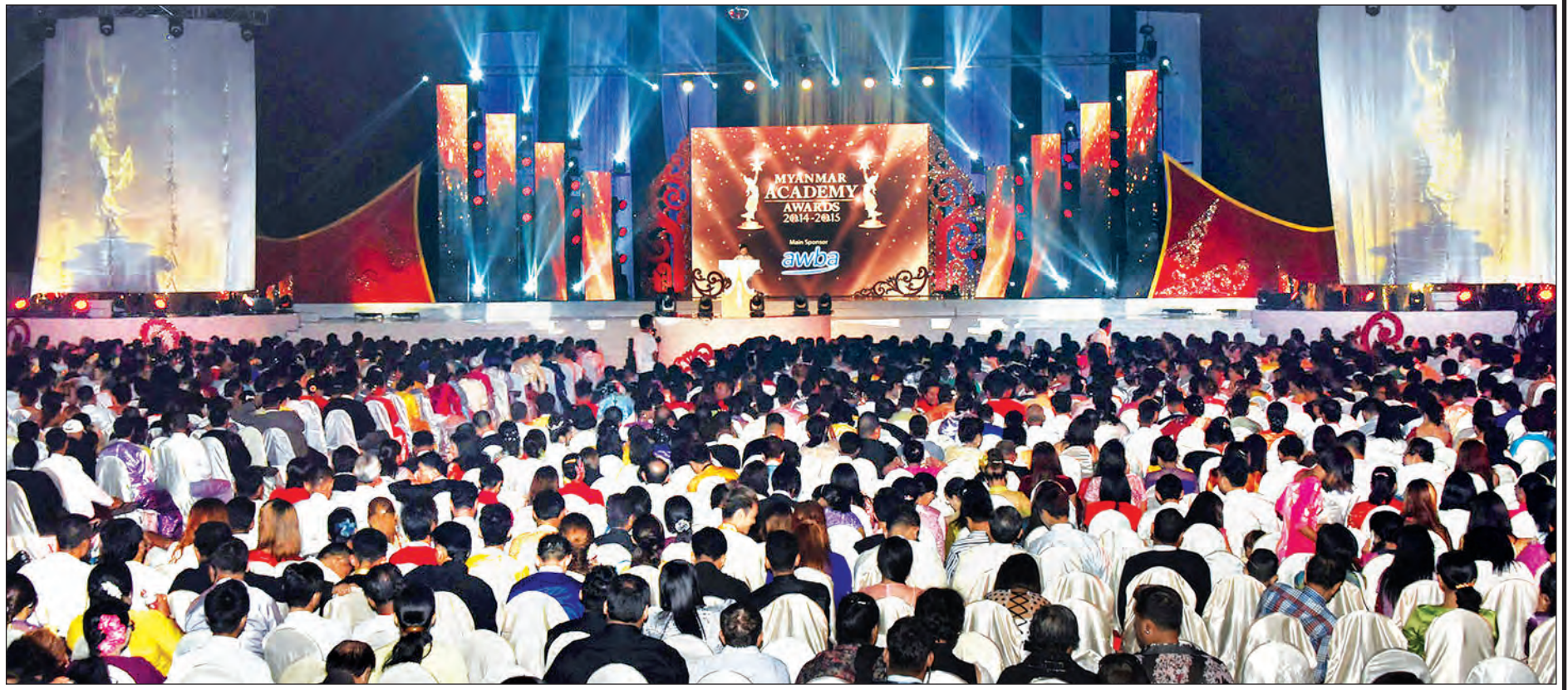
၂၀၁၄ ခုနှစ်နှင့် ၂၀၁၅ ခုနှစ်အတွက် မြန်မာ့ရုပ်ရှင်ထူးချွန်ဆုများမြှင့်ပွဲအခမ်းအနား မြင်ကွင်း (ဓာတ်ပုံ-သတင်းစဉ်)