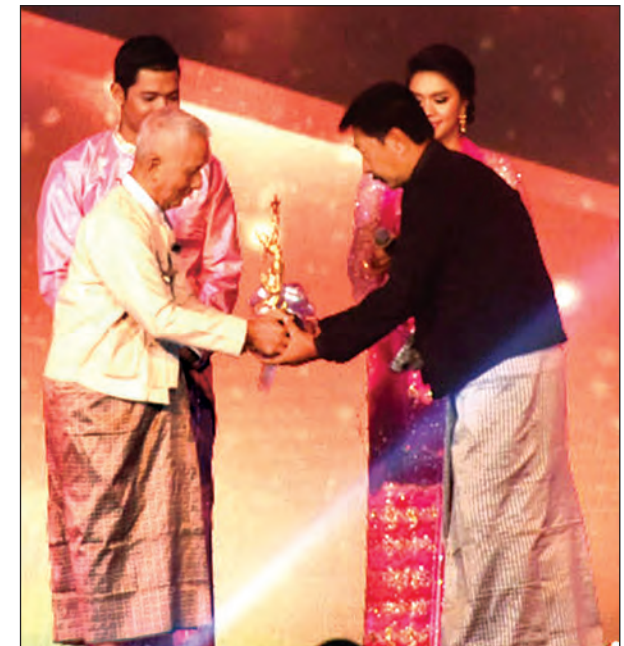
၂၀၁၄ အကောင်းဆုံး ရုပ်ရှင်ဇာတ်ပို့ဆုရ တိုးဝင်းပြည့်စိုး ဆုလက်ခံ ယူစဉ် (သတင်းစဉ်)