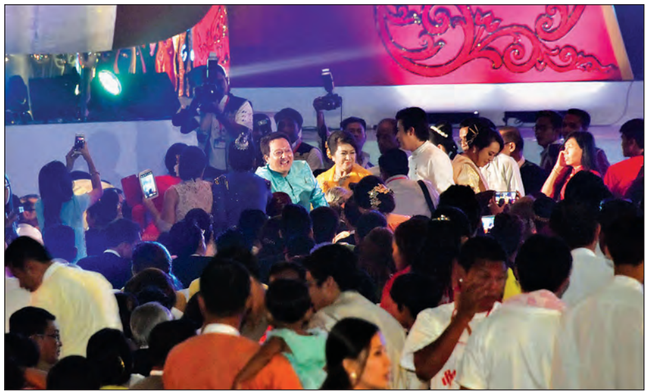
၂၀၁၅ ခုနှစ်အတွက် အကောင်းဆုံးဒါရိုက်တာဆုရရှိသည့် ဒါရိုက်တာ ဝိုင်းအား ဂုဏ်ပြုနှုတ်ဆက် ကြစဉ် (သတင်းစဉ်)