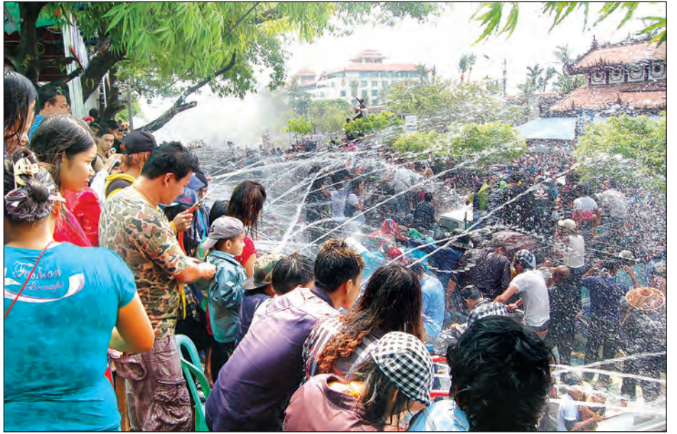
ယမန်နှစ်က မန္တလေးမဟာသင်္ကြန်ပွဲ ဆင်နွဲခွဲမှုကို တွေ့ရစဉ်