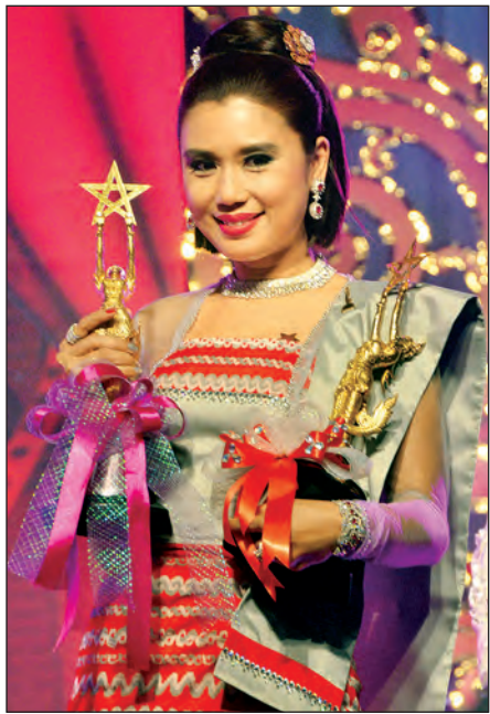
ခိုင်သင်းကြည်