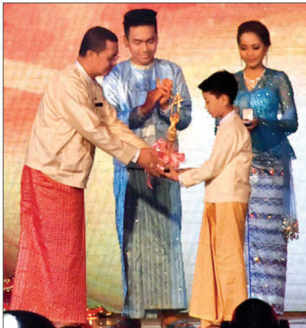
၂၀၁၅ အကောင်းဆုံး အမျိုးသားဇာတ်ပို့ဆုရ ဗေလုဝ ကိုယ်စား သားဖြစ်သူ ဆုလက်ခံယူစဉ် (သတင်းစဉ်)