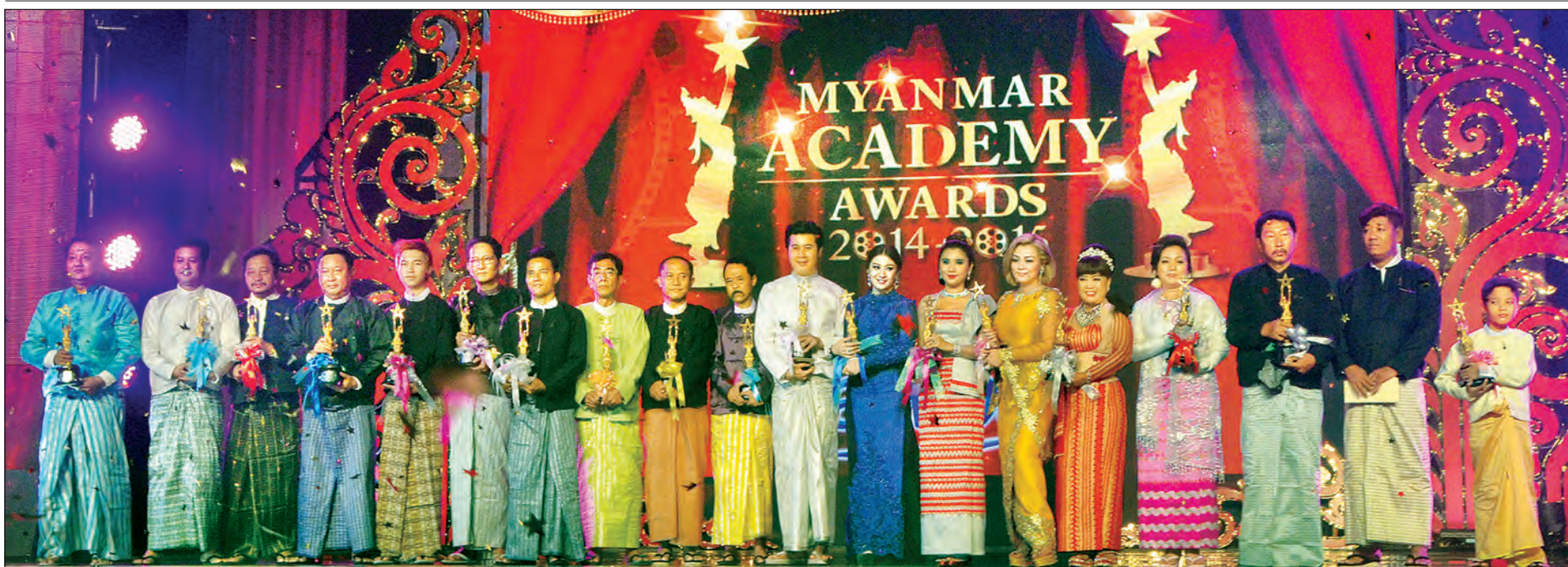
၂၀၁၄၊ ၂၀၁၅ ခုနှစ်အတွက် မြန်မာ့ရုပ်ရှင်ထူးချွန်ဆုရရှိသူများ စုပေါင်းမှတ်တမ်းတင်ဓာတ်ပုံရိုက်စဉ်