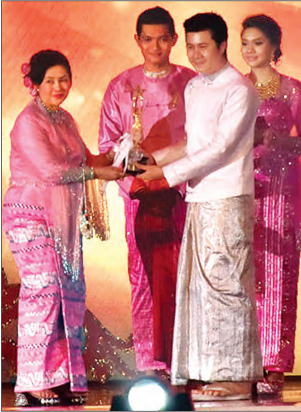
၂၀၁၅ ခုနှစ်အတွက် နက္ခတ်မှားတဲ့တိုက်ပွဲဇာတ်ကားဖြင့် အကောင်းဆုံး အမျိုးသားဇာတ်ဆောင်ဆုရ နေတိုး ဆုလက်ခံယူစဉ်