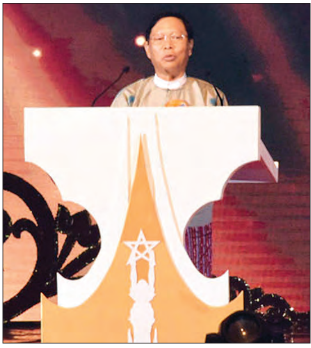
ပြည်ထောင်စုဝန်ကြီး သူရဦးအောင်ကို အမှာစကားပြောကြားစဉ် (သတင်းစဉ်)

ယင်းနောက် မြန်မာ့ရုပ်ရှင် ထူးချွန်ဆုများကို ဆက်လက်ကြေညာ ရာ ၂၀၁၄ ခုနှစ်အတွက် အကောင်း ဆုံး အမျိုးသမီးဇာတ်ပို့ဆုကို “နုလုံးသားဖြင့် ပြုလုပ်သည်” ရုပ်ရှင် ဇာတ်ကားမှ ဝတ်မှုန်ရွှေရည်၊ ၂၀၁၅ ခုနှစ်အတွက် အကောင်းဆုံး အမျိုးသမီးဇာတ်ပို့ဆုကို “ဤအရာကို