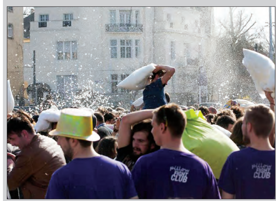
အပြည်ပြည်ဆိုင်ရာခေါင်းအုံးရိုက်ပွဲကို ဟန်ဂေရီနိုင်ငံ ဘူဒါပတ်မြို့ ဟီးရီးရင်ပြင်၌ ဧပြီ ၂ ရက်က ကျင်းပရာ ပျော်ရွှင်စွာ ပါဝင်ဆင်နွှဲနေကြသည့် လူများကိုတွေ့ရစဉ်။ (ဆင်ယာ)