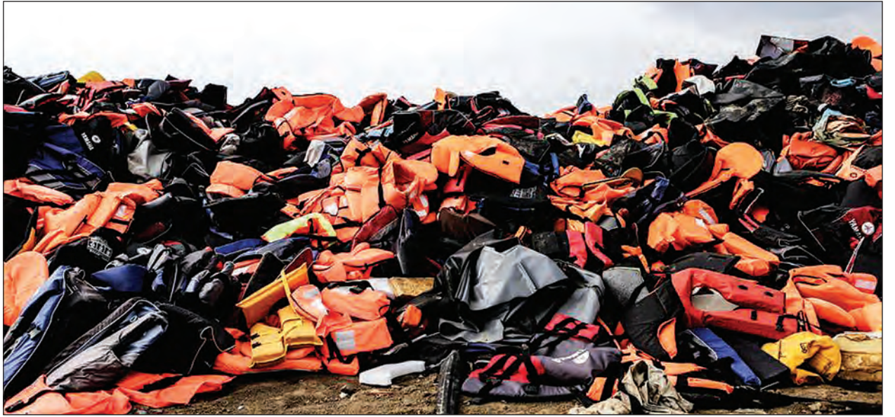
အဆိုပါစွန့်ပစ်ပစ္စည်းများသည် သဘာဝပတ်ဝန်းကျင်ထိခိုက်စေပြီး ကမ်းခြေများ၏အလှအပကို ညစ်နွမ်းစေကာ မီးဘေးအန္တရာယ်လည်း စိုးရိမ်ရသည်။ ထို့ကြောင့် ဒေသခံများနှင့် ဒုက္ခသည်များ ပြန်လည်အသုံးပြုနိုင်မည့် ပစ္စည်းများအဖြစ် ပြောင်းလဲထုတ်လုပ်ရန် စီစဉ်ခြင်းဖြစ်သည်ဟု လက်စွဲပစ္စည်းဒုတိယမြို့တော်ဝန်က ဆင်ယာသို့ ပြောသည်။ (ဆင်ယာ)

ဂရိသဘာဝပတ်ဝန်းကျင်ထိန်းသိမ်းကာကွယ်ရေးဝန်ကြီးဌာန၏ အကူအညီဖြင့် လက်စွဲပစ္စည်းသည် ဒုက္ခသည်များအရေး ခံစားနေရသော အခြားကျွန်းများအတွက် စံနမူနာကောင်းဖြစ်အောင် ပြုလုပ်သွားမည်ဟု မျှော်လင့်ထားသည်။ လွန်ခဲ့သောနှစ်များအတွင်း လက်စွဲပစ္စည်းသည် ဒုက္ခသည်များ အများဆုံးဝင်ရောက်ရာ ကျွန်းတစ်ခု ဖြစ်လာခဲ့သည်။ အသက်ကယ်အင်္ကျီ ခုနစ်သိန်းခန့်နှင့် ရော်ဘာလှေ ၁၀၀၀၀ ခန့်သည် ၂၀၁၅ ခုနှစ် ဇန်နဝါရီလက အဆိုပါကျွန်းပေါ်တွင် စုပြုံနေခဲ့သည်။ နွေရာသီအားလပ်ရက်တွင် ခရီးသွားများအဆိုပါကျွန်းသို့ လာရောက်မည်ဟု ယင်းပစ္စည်းများသည် တဖြည်းဖြည်းစုပုံလာခဲ့သည်။