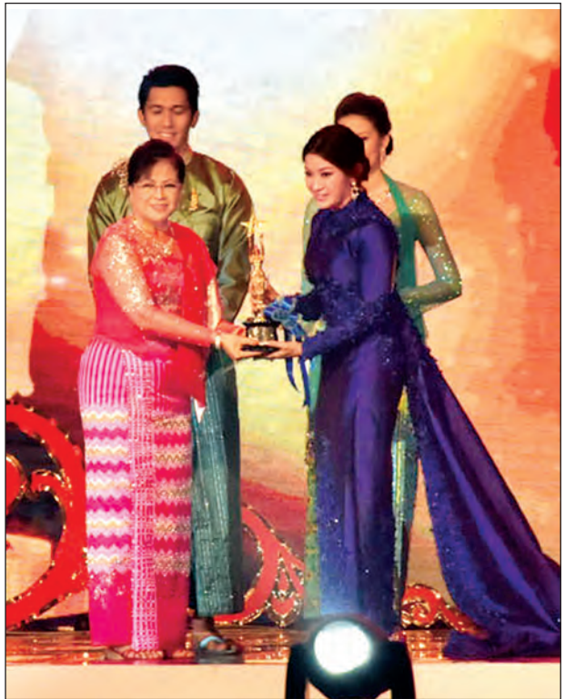
၂၀၁၄ ခုနှစ်အတွက် အကောင်းဆုံးအမျိုးသမီးဇာတ်ပို့ဆုရှင် ဝတ်မှုန်ရွှေရည် ဆုဖလှယ် (သတင်းစဉ်)

မြန်မာနိုင်ငံရုပ်ရှင် အစည်းအရုံး သည် ၂၀၁၄ ခုနှစ်မှစတင်၍ မြန်မာ့ ရုပ်ရှင်ထူးချွန်ဆု ချီးမြှင့်ခြင်းကို တာဝန်ယူဆောင်ရွက်ခဲ့ခြင်းဖြစ်သည်။ (သတင်းစဉ်)