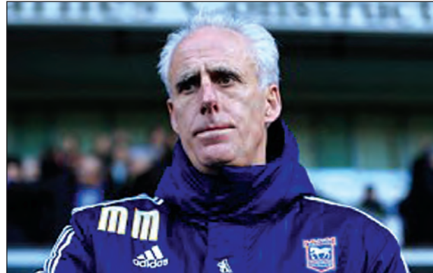
ကောင်းမြတ်သူ - စုစည်းသည်။