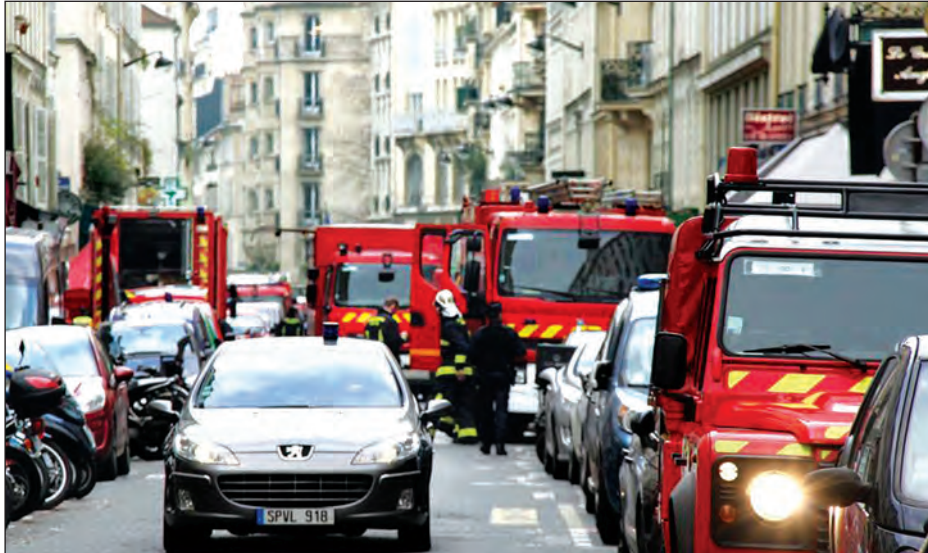
ဝါရှင်တန်မြို့လယ်ကောင်၌ ၂၀၁၆ ဧပြီ ၁ ရက်က ဓာတ်ငွေ့ပေါက်ကွဲမှုဖြစ်ပွားခဲ့ရာ လူ ၁၇ ဦး ဒဏ်ရာရရှိခဲ့သည်။ အဆိုပါ ပေါက်ကွဲမှုဖြစ်ပွားနေရာ၌ မီးသတ်သမားများက ကယ်ဆယ်ရေးလုပ်ငန်းများ ဆောင်ရွက်နေသည်ကို တွေ့ရစဉ်။ (ဆင်ဟွာ)