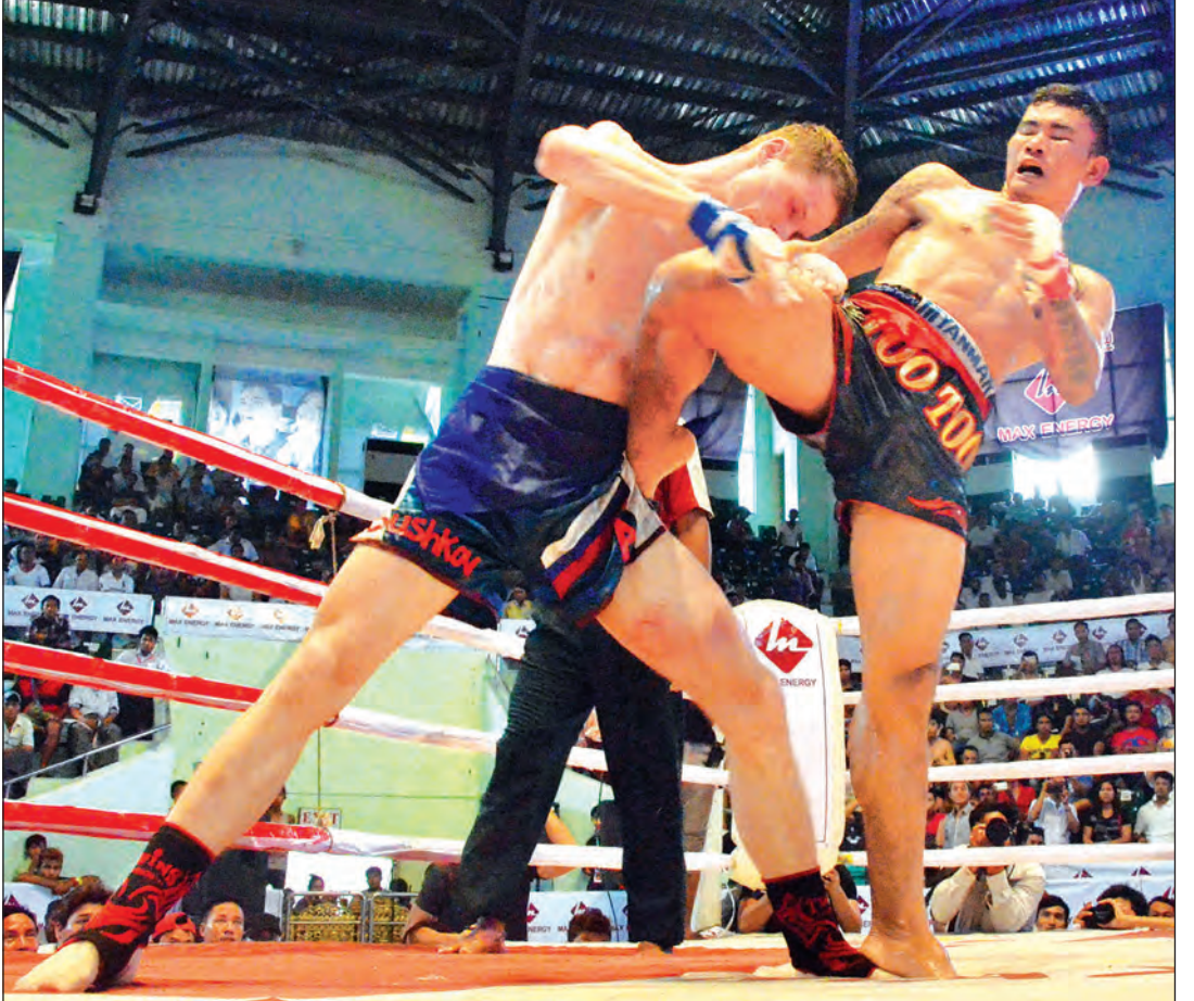
တူးတူးရဲ့ ညာခြေခွေးတိုက်ချက် ဆပ်ရှာကော့စ်အာတစ်ကို ထိမိစဉ်

သတင်းမြင်ကွင်း-မောင်စိန်လွင်(မြန်မာ့အလင်း)