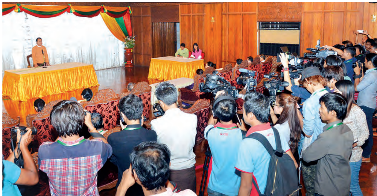
ရန်ကုန် ဧပြီ ၂

၂၀၁၆ ခုနှစ် မဟာသင်္ကြန်ပွဲတော်ကို ရန်ကုန်တိုင်းဒေသကြီးအတွင်းရှိ ခရိုင်လေးခုတွင် ခရိုင်ဗဟိုမဏ္ဍပ်များဆောက်လုပ်ရန် ဖြန့်ဖြူးမှုအဖွဲ့အစည်းများ အလုပ်အကိုင် နေရာအနှံ့ စည်ကားစွာကျင်းပသွားမည်ဖြစ်ပြီး ရိုးရာယဉ်ကျေးမှုကို ထိန်းသိမ်းလိုက်နာကာ အပြုသဘောဆောင်သည့် မဟာသင်္ကြန်မဏ္ဍပ်များ ပေါ်ပေါက်စေရန် အတွက် သင်္ကြန်သံချပ်စာသားများကို မဟာသင်္ကြန်ကျင်းပရေးကော်မတီမှ စိစစ်မည်မဟုတ်ဘဲ သံချပ်အဖွဲ့များက ၎င်းတို့ကိုယ်တိုင်တာဝန်ယူမှု၊ တာဝန်ခံမှုဖြင့် ခွင့်ပြုပေးသွားမည်ဖြစ်ကြောင်း ယနေ့ ညနေ ၄ နာရီက ရန်ကုန်တိုင်းဒေသကြီးအစိုးရအဖွဲ့ရုံး မင်္ဂလာခန်းမ၌ပြုလုပ်သည့် စာနယ်ဇင်းရှင်းလင်းပွဲတွင် တိုင်းဒေသကြီးဝန်ကြီးချုပ် ဦးဖိုးမင်းသိန်းက ပြောသည်။