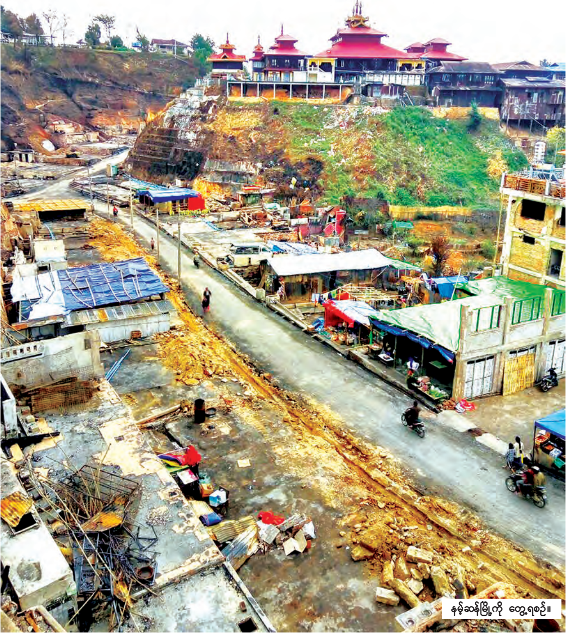
နမ့်ဆန်မြို့ကို တွေ့ရစဉ်။

မီးဘေးသင့်အိမ်ထောင်စုများ ပြန်လည်ထူထောင်ရေးလုပ်ငန်းများအတွက် ငွေကျပ်သိန်း ၂၃၀၀၀ ကျော် ထုတ်ပေးခဲ့ပြီးဖြစ်ကြောင်း သိရသည်။ စိုင်း(သီပေါ)