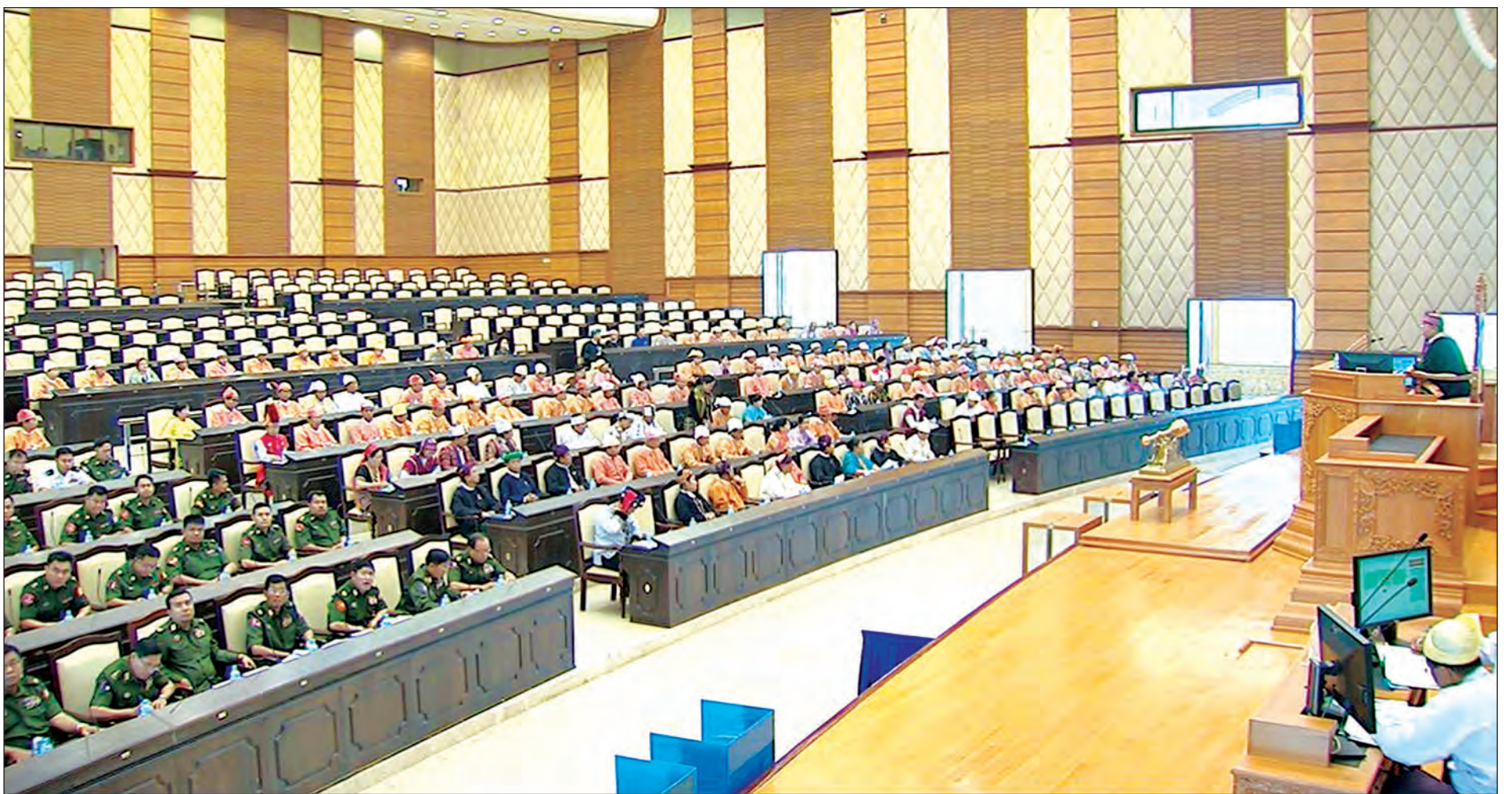
နေပြည်တော် မတ် ၃၁

ဒုတိယအကြိမ် အမျိုးသားလွှတ်တော် ပထမပုံမှန်အစည်းအဝေး ၁၄ ရက်မြောက်နေ့ကျင်းပ