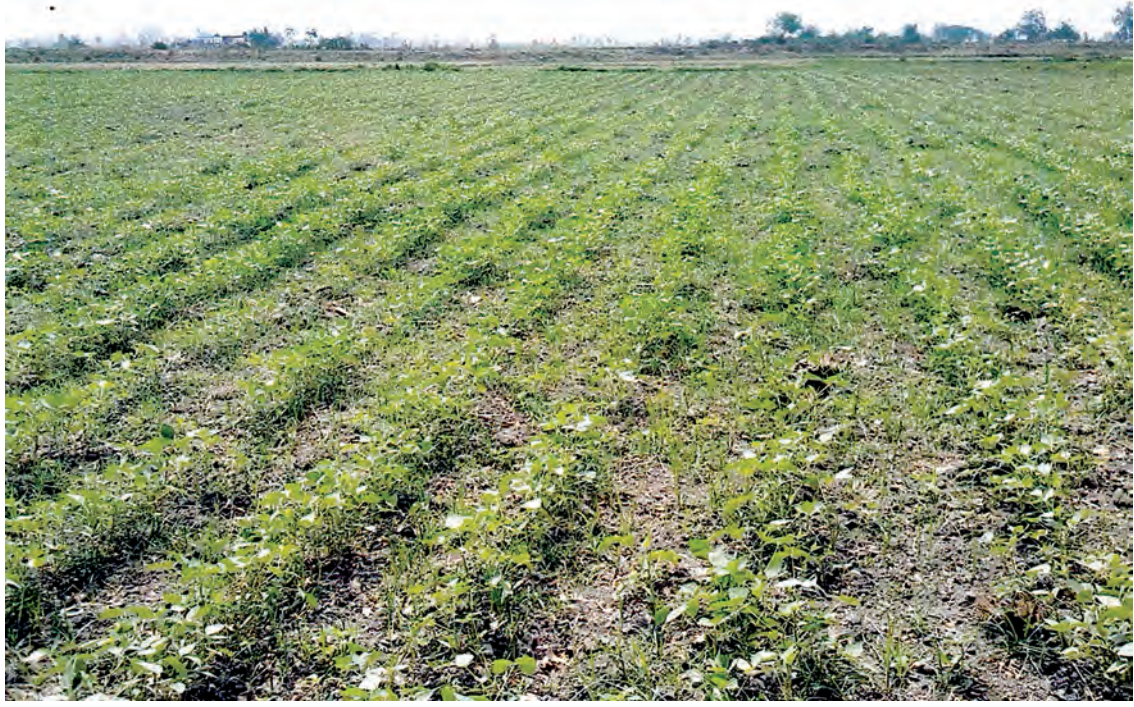
စိမ်းများ ဈေးကွက်ကောင်းပြီး အများဆုံး တင်ပို့ရောင်းချနေရခြင်းဖြစ်ကြောင်း၊ လက်ရှိတွင် မြန်မာပဲတီစိမ်းများ ပြည်ပတင်ပို့ရောင်းချမှုအနေဖြင့် ဥရောပဈေးကွက်များ ပဲတီစိမ်းရောင်းဝယ်သူ လုပ်ငန်းရှင်ကုန်သည်အထိ ယခင်ကထက် နှစ်ဆပိုမိုတင်ပို့နိုင် တစ်ဦးက ပြောပြသည်။

မျိုးကိုပဲ စိုက်ကြပါတယ်။ ဒီမျိုးက အပင်ပေါ်မှာ အဆင့်ဆင့်သီးတဲ့အတွက် ဘုံခုနစ်ဆင့်မျိုးလို့ အမည်ပေးထားတာပါ။ တစ်ကေမှာ မျိုး၊ ရိတ်သိမ်းစရိတ်နဲ့ သွင်းအားစုအပါအဝင် ငွေကျပ်သုံးသိန်း ရင်းရပါတယ်။ အထွက်နှုန်းကောင်းတော့ တစ်ကေ ၁၈ တင်းထိ ထွက်ပါတယ်။ အရင်းနှုတ်လိုက်ရင် တစ်ကေ ခြောက်သိန်းဝန်းကျင်ကျန်ပါတယ်။ အခုနှစ်မှာ အယ်နီညိုရာသီဥတုကြောင့် အပူအအေးမမျှတဘူး။ အချို့နေရာတွေမှာ ခူကောင်တွေကျတာတွေ့နေရတယ်။ မနှစ်ကထက် အထွက်နှုန်းလျော့နိုင်တယ်။ ခက်တာက ဒီပဲတီပင်ကိုက်တဲ့ ခူကောင်ကို နိုင်တဲ့ဆေးမရှိသေးဘူး။ ဒီခူကောင်တွေက အပင်နဲ့အခါကို ကိုက်တာ။ အပင်ရင့်သွားရင်တော့ မကိုက်တော့ဘူး” ဟု ကြို့ပင်ကျေးရွာ ပဲတီစိုက်တောင်သူတစ်ဦးက ပြောသည်။ မြန်မာပဲတီစိမ်းဈေးကွက်တွင် အဓိကဖောက်သည်ဈေးကွက်မှာ ထိုင်ဝမ်ဖြစ်ကြောင်း၊ ထိုင်ဝမ်ဈေးကွက်အနေဖြင့် နှစ်စဉ် မြန်မာပဲတီစိမ်းများကို ဝယ်ယူကာ အခြားသော ဈေးကွက်များသို့ ပြန်လည်တင်ပို့ရောင်းချနေမှုကြောင့် မြန်မာပဲတီ