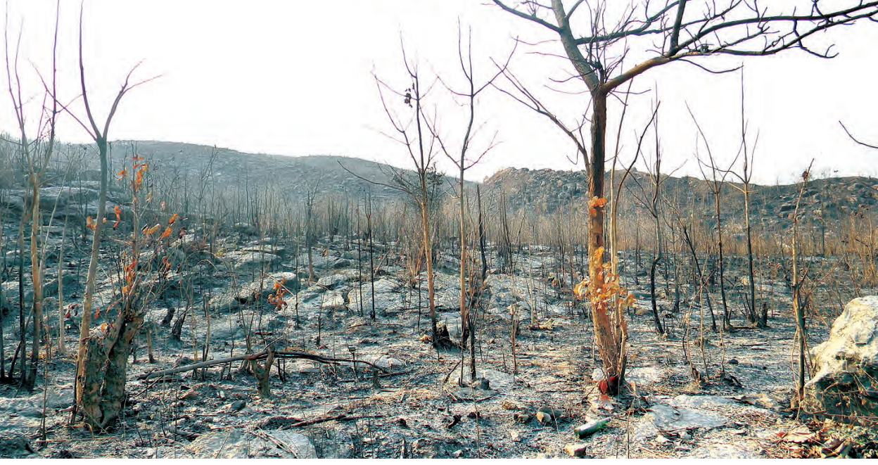
သစ်တောများ ပြန်တီးမှုဖြစ်နေသော ပြင်ဦးလွင်မြို့တစ်နေရာ

သို့သော်လည်း ယနေ့ပြင်ဦးလွင်သည် ယခင်ပြင်ဦးလွင်နှင့် လုံးဝလုံးဝမတူတော့ပေ။ သဘာဝသစ်တောအုပ်ကြီးများ ပြုတ်ပြုတ်ပြုန်းကန်သွားကြသဖြင့် အေးမြမှုတို့ဆိတ်သုဉ်းလျက် ပူလောင်မှုဒဏ်ကိုခံစားနေရပြီး နှစ်စဉ်ရေမခံတော့သည်မှာ ကြာမြင့်လေပြီ။ သန့်ရှင်းလတ်ဆတ်သောသဘာဝလေတို့ အစား ကြောံနဲ့ညှော်နဲ့ တသင်းသင်းဖြင့် ယခင်သုံးစွဲရန် စိတ်ပင်မကူးခဲ့ရသော ပန်ကာ၊ အဲကွန်းတို့ကို သုံးစွဲနေရလေသည်။ ပန်းပေါင်းစုံဝေဝေဆာဆာလှလှပပနှင့် ပန်းရနံ့တို့မှာလည်း ပန်းဥယျာဉ်ကြီးများထဲတွင်သာ ရှိတော့သည်။ ယခင်မြို့လယ်စည်ပင်ပန်းခြံ၊ ထောက်ပို့ပန်းခြံတို့မှာ အဆောက်အအုံလူနေအိမ်များနှင့် ဈေးဆိုင်ခန်းတို့ ဖြစ်ကုန်ကြလေပြီ။ လူနေရပ်ကွက်များအတွင်းရှိ မြက်ခင်းစိမ်းစိမ်းတို့သည် ကွန်ကရစ်ခင်းများဖြစ်သွားသလို လွန်စွာလှပပြီး ကျက်သရေရှိလှသောမြို့၏ သက်တတစ်ခုဖြစ်သည့် Forget me not (ခေါ်) ဝိုင်လ်ကတော်မျက်ခုံး(ခေါ်) ခြံစည်းရိုးပင်တို့အစား အုတ်တံတိုင်းများဖြစ်သွားကြသည်။