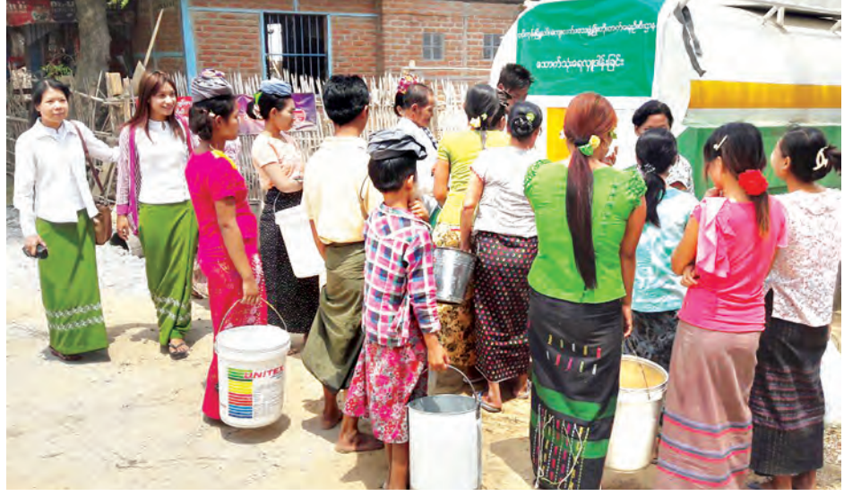
အယ်နီညီရာသီဥတုကြောင့် ကျေးရွာများ၌ ရေပြတ်လပ်မှုမရှိစေရန်အတွက် နေပြည်တော် တပ်ကုန်းမြို့နယ်အတွင်း ရေထွက်နည်းပါးသည့်ကျေးရွာများသို့ မြို့နယ်ကျေးလက်ဒေသဖွံ့ဖြိုးတိုးတက်ရေးဦးစီးဌာနက သောက်သုံးရေများ လှူဒါန်းလျက်ရှိရာ မတ် ၂၉ ရက်က ရေအေးကျေးရွာအုပ်စု ရေအေးကျေးရွာ၌ မြို့နယ်ကျေးလက်ဒေသ ဖွံ့ဖြိုး တိုးတက်ရေးဦးစီးဌာန ဝန်ထမ်းများ သောက်သုံးရေများ လှူဒါန်းစဉ်။ (မြို့နယ် ပြန်/ဆက်)