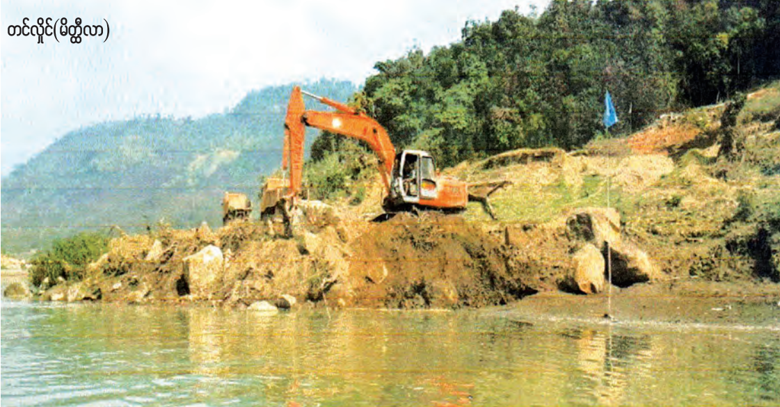
တင်လိုင်(မိတ္ထီလာ)

စစ်ကိုင်းတိုင်းဒေသကြီး ကလေးဒေသတွင် မြစ်သာမြစ်ရှိသည်။ မြစ်သာမြစ်သည် ချင်းပြည်နယ်အတွင်းရှိ တောင်တန်းများမှ မြစ်ဖျားခံ၍ ပုံတောင်ပုံညာတောင်တန်းကြားမှ ဖြတ်သန်းကာ တောင်ဘက်မှမြောက်ဘက်သို့ စီးဆင်းနေသော ထူးခြားသည့်မြစ်တစ်စင်းဖြစ်သည်။ မြစ်သာမြစ်၏ မြစ်ဖျားပိုင်းမှာ ဂန့်ဂေါမြို့အထိ မြစ်သာမြစ်ဝှမ်းအထက်ပိုင်းတွင်တောတောင်ထူထပ်ပြီး စိုက်ပျိုးရေးလုပ်ငန်းနည်းပါးသည်။ မြစ်သာမြစ်သည်ချင်းတွင်းမြစ်၏အကြီးဆုံးမြစ်လက်တက်ဖြစ်ပြီး ရေဆင်းဧရိယာအလွန်ကြီးမားကာ စတုရန်းမိုင် ၉၈၇၀ ခန့်အထိရှိသည်။ မြစ်သာမြစ်အတွင်းသို့ ၎င်း၏ မြစ်လက်တက်များဖြစ်သော မဏိပူရမြစ်နှင့် နေရဋ္ဌရာမြစ်တို့ စီးဝင်ရေအလွန်များပြားကာ ရေကြီးရေလျှံ၍ ကလေးလွင်ပြင်ဒေသ၌ ရေကြီးနစ်မြုပ်မှုများ ကြုံတွေ့ခဲ့ရသည်။ မြစ်သာမြစ်သည် ကလေးမြို့အနီးတွင် ချင်း တွင်းမြစ်အတွင်းသို့စီးဝင်ပြီး အလျား ၁၈၅ မိုင်ခန့် ရှည်လျားသည်။ စီးဝင်ရေအလွန်များ ပြားကာ ကလေးလွင်ပြင်ဒေသတွင် ရေကြီး ရေလျှံ၍ ရေနစ်မြုပ်မှုများဖြစ်သည်။ ရာသီဥတု၏ သဘာဝလွန်ပြောင်းလဲမှုကြောင့် ၂၀၁၅ ခုနှစ် ဇူလိုင်လလယ်ခန့်က မြန်မာနိုင်ငံအလယ်ပိုင်း စစ်ကိုင်းတိုင်းဒေသကြီး၊ မကွေးတိုင်းဒေသကြီးနှင့် ချင်းပြည်နယ်တို့တွင် တစ်ပတ်အတွင်း မိုးရေချိန်လက်မ ၃၀ ခန့် ထွက်မိုးရွာသွန်းခြင်း၊ ကိုမန်ဆိုင်ကလွန်း မုန်တိုင်းအရှိန်ကြောင့် မိုးသည်းထန်စွာ ရက်ဆက်ရွာသွန်းခြင်းများကြောင့် မြစ်သာမြစ်နှင့် ၎င်း၏ မြစ်လက်တက်များဖြစ်သော မဏိပူရမြစ်နှင့် နေရဋ္ဌရာမြစ်တို့တွင် စီးဝင်ရေအလွန်များပြားကာ ရေကြီးရေလျှံ၍ ကလေး