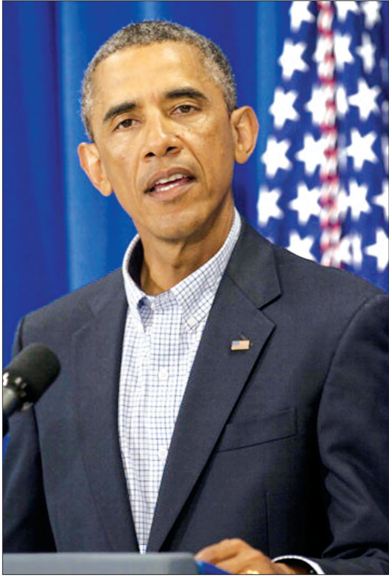
အမေရိကန်ပြည်ထောင်စုသမ္မတ ဘားရက်အိုဘားမား