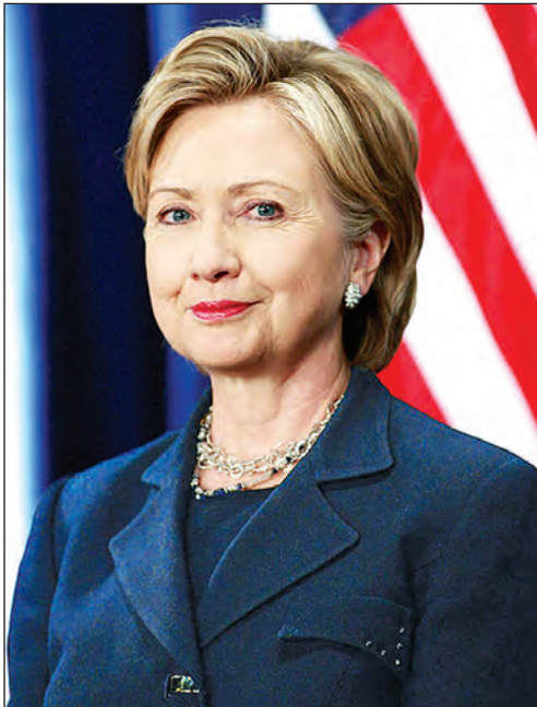
ဟီလာရီကလင်တန်