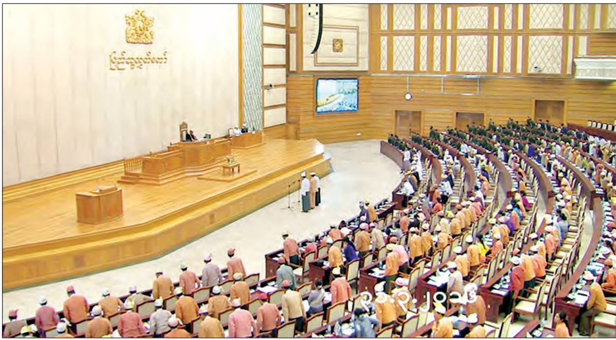
အား ဥက္ကဋ္ဌအဖြစ် ပြောင်းလဲဖွဲ့စည်းရန် ပြည်သူ့လွှတ်တော်ဥက္ကဋ္ဌက လွှတ်တော်က သဘောတူညီချက်ရယူအတည်ပြုသည်။