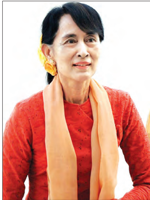
ဒေါ်အောင်ဆန်းစုကြည်

အခုချိန်မှာတော့ နိုင်ငံတကာအဆင့်မှာ အရှိန်ဩဇာရှိပြီး နိုင်ငံတကာဂုဏ်ထူးဆောင် ဆုတံဆိပ်ပေါင်း ၁၃၀ ကျော်ရရှိထားသူ နိုဗယ်ဆုရှင်က နိုင်ငံခြားရေးဝန်ကြီး တာဝန်ကို ထမ်းဆောင်မှာ ဖြစ်တဲ့အတွက် နိုင်ငံတကာဆက်ဆံရေး နယ်ပယ်မှာ မြန်မာနိုင်ငံရဲ့ အခန်းကဏ္ဍမြင့်တက်လာမယ် ဆိုတာက မြေကြီးလက်ခတ်မလွဲလို့ ဆိုရမှာပါ။ အင်္ဂလန်က နန်းရင်းဝန်ဟောင်း ဆာဝင်စတန်