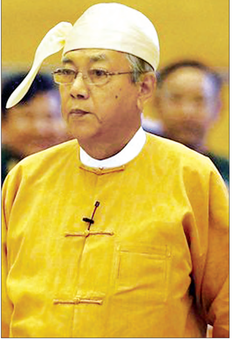
နိုင်ငံတော်သမ္မတ ဦးထင်ကျော်