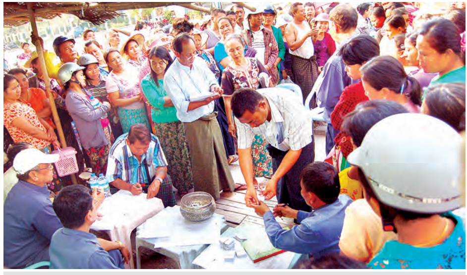
မန္တလေး မင်္ဂလာဈေး မီးဘေးသင့်ဆိုင်ခန်းပိုင်ရှင်များအား မဲစနစ်ဖြင့်နေရာချထားပေးရန် ဆောင်ရွက်နေစဉ်။

ကျန်းမာရေးဝန်ထမ်းများအနေဖြင့် လူနာများကို နွေးထွေးစွာဆက်ဆံပြီး ထိရောက်စွာ ကုသမှုပေးရန်နှင့် ဝေဒနာရှင်ကလေးငယ်များ၏ အသက်ကိုကယ်တင်ပေးရန်၊ ရောဂါသက်သာပျောက်ကင်းအောင် စေတနာထားကုသပေးရန် အဆိုပါအခန်းအနားတွင် ကျန်းမာရေးဝန်ကြီးဌာန ပြည်ထောင်စုဝန်ကြီးက တိုက်တွန်းပြောကြားခဲ့သည်။