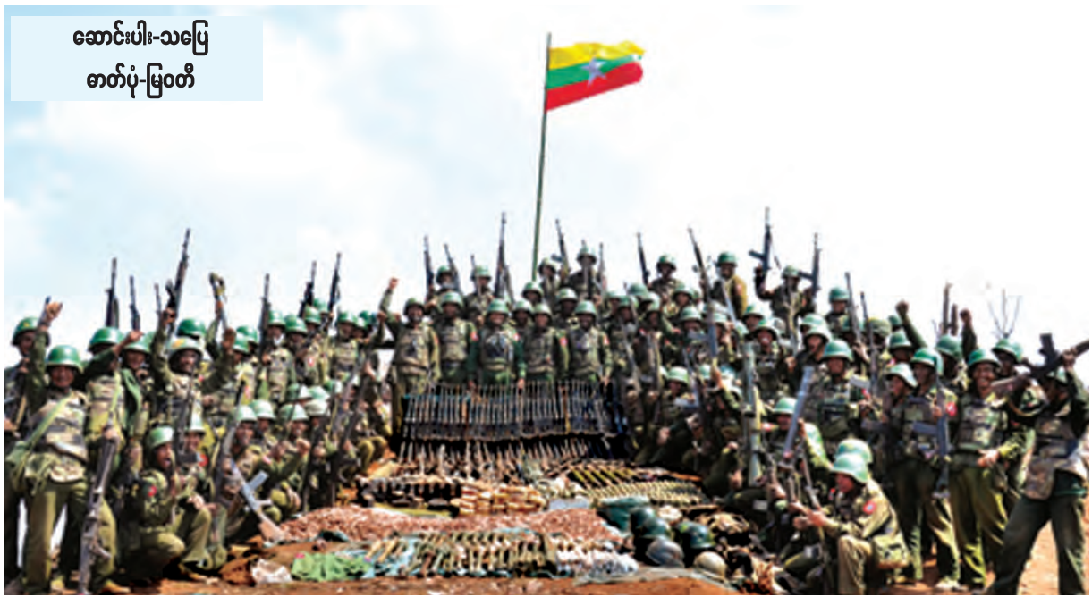
၂၀၁၅ ခုနှစ် မေ ၁၄ ရက်က ရှမ်းပြည်နယ်မြောက်ပိုင်း လောက်ကိုင်မြို့ မြောက်ဘက် စီကော်လုံဒေသရှိ ပွိုင့်-၂၂၀၂ တောင်ကုန်းအား တပ်မတော်က သိမ်းပိုက်ပြီးနောက် နိုင်ငံတော်အလံလွှင့်ထူ၍ အောင်ပွဲခံစဉ်။