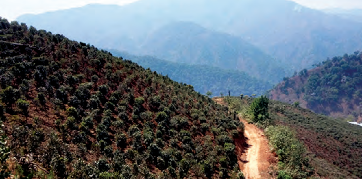
ပလောင်တောင်ပေါ်မှ လက်ဖက်စိုက်ခင်းကို ဤသို့ စိမ်းစိုလန်းဆန်းစွာ တွေ့မြင်ရစဉ်။

ကောင်းဘို့ကျေးရွာ ဈေးနေ့ဖြစ်၍ အုပ်အုပ်ဆိုင်ဆိုင်ရှိနေသော သက်တမ်းရှည်ညောင်ပင်များအောက်မှ ဈေးတန်းလေးက စည်ကားလျက် ရှိသည်။ ရွာ၏အနောက်မြောက်တွင် ပင်းတယရွှေဥမင်လိုဏ်ဂူနှင့် တစ်ဆက်တည်း ပင်လယ်ရေမျက်နှာပြင် ၅၆၆၂ ပေမြင့်သော တောင်တန်းများပေါ်တွင် ပလောင်တိုင်းရင်းသားတို့၏လက်ဖက်စိုက်ခင်းများကို တွေ့မြင်ရပြီး အတက်အဆင်းခက်ခဲသည့်တောင်စောင်းများတွင် လက်ဖက်ခင်းနေကြသည့် မြင်ကွင်းတို့မှာ အသည်းတအေးအေးဖြစ်စေပါသည်။ တောင်ခြေတွင် ဒေသမျိုးဖြစ်သော လိမ္မော်စိုက်ခင်းများရှိပြီး တောင်ပေါ်သစ်တောများနေရာ၌ လက်ဖက်ခင်းများက နေရာယူထားကာ တောင်ပေါ်ရွာ၏ အိမ်ဝင်းတိုင်း၌ ဖျာခင်း၍ နေရောင်အောက်တွင်လှန်းထားသော လက်ဖက်များမှထွက်ပေါ်လာသည့် ရနံ့တို့ကား တောင်ပေါ်လေတဖြူးဖြူးနှင့်အတူ သင်းပျံ့လျက်ရှိနေပါသည်။