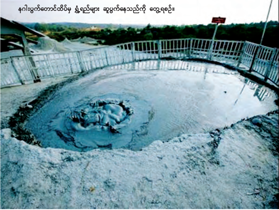
နဂါးပွက်တောင်ထိပ်မှ ရွှံ့ရည်များ ဆူပွက်နေသည်ကို တွေ့ရစဉ်။

စုန်ဆန်ခွတ်မောင်းသွားလာနေသော ရေယာဉ်အချို့ကို လှမ်းမြင်ရသည်။ မြစ်အတွင်းရေနည်းနေပြီဖြစ်ရာ ရေနက်သည့်လမ်းကြောင်းအတိုင်း တဖြည်းဖြည်း ခုတ်မောင်းသွားလာနေသည်ကို တွေ့ရသည်။ စိုက်ပျိုးရေးအတွက် မြစ်ရေတင်စီမံကိန်း၊ လျှပ်စစ်ဓာတ်အားထုတ်ယူမှုအပြင် ရာသီဥတုသဘာဝတို့ဖောက်ပြန်ကာ ရေအရင်းအမြစ်များ လျော့နည်းလာမှုကြောင့် ဧရာဝတီလည်း ပုံပျက်နေသည်ကို မြင်တွေ့ရသဖြင့် စိတ်မသက်သာဖြစ်မိသည်ကအမှန်ပင်။ အရှည်မီတာ ၂၉၃၀ ရှိသော ဧရာဝတီတံတား(မကွေး)ကို ဖြတ်ကျော်ပြီးသည်နှင့် ဧရာဝတီမြစ်အနောက်ဘက်ကမ်းရှိ မင်းဘူးမြို့နယ်သို့ ဆက်လက်ထွက်ခွာခဲ့သည်။ မိနစ်ပိုင်းအတွင်း မင်းဘူးမြို့သို့ရောက်ရှိလာခဲ့သည်။ ယခင်က မကွေးမှ မင်းဘူးမြို့သို့ စက်လှေဖြင့်သာသွားလာခဲ့ရသဖြင့် အချိန်တစ်နာရီကျော်ကြာရာ အချိန်ကုန်၊ ခရီးဖင့်ပြီး ငွေကုန်ကြေးကျလည်းများသည်။ ယခုတော့ မကွေးမှ မင်းဘူးသို့ မိနစ်ပိုင်းအတွင်း သက်သာစွာရောက်ရှိလာသည်။