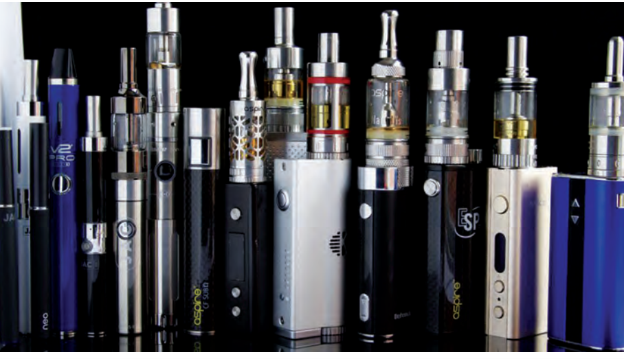
အသွင်ဒီဇိုင်းအမျိုးမျိုးဖြင့် ဝင်ရောက်လာနေသည့် အီး-စီးကရက်များ။

များကို ရယူပေးရန် ကြိုးစားမှုများကြောင့်လည်း ပေါက်ကွဲမှုဖြစ်ပွားနိုင်သည်ဟု ပြောသည်။ ထို့ပြင် သုံးစွဲသူများသည် လျှပ်စစ်ပိုင်းဆိုင်ရာ အခြေခံဗဟုသုတရှိထားရန် လိုအပ်ပြီး သို့မှသာ အီး-စီးကရက်သောက်သုံးရန် ဘက်ထရီဖြင့် စနစ်တကျမှန်ကန်သော အပူပေးခြင်းကို လုပ်ဆောင်နိုင်မည်ဖြစ်သည့်အပြင် သုံးစွဲမည့်ကိရိယာအား မှားယွင်းစွာတပ်ဆင်လျှင် အပူလွန်ကဲလာမည်ဟု ၎င်းက ပြောသည်။ ယခုအခါ အယ်လ်ဘာတာမှလွဲ၍ ဆက်ဆက်ချိတ်ဆက် နယူးဖော့ဒ်လန်ဒ်နှင့် လာဘရာဒါပြည်နယ်များတွင် အီး-စီးကရက်ရောင်းချခြင်းကို အသေးစားပိတ်ပင်မှုများ ပြုလုပ်ထားသည်။ အသက်မပြည့်သေးသည့် ဆယ်ကျော်သက်များသည် အသိပညာပေးခြင်းနှင့် နည်းစနစ်တကျအသုံးပြုရန် လိုက်နာမှုမရှိဘဲ မှားယွင်းစွာ တပ်ဆင်သုံးစွဲမှုကြောင့် အဖြစ်များရသည်ဟု ဖိစီးပြောခဲ့သည်။ သို့သော် အီး-စီးကရက်အသိပညာပေးခြင်းသည် လုံလောက်မှုမရှိဟု ဆရာဝန်အချို့ကဆိုသည်။ (အီး-စီးကရက်ကို ၂၀၁၄ ခုနှစ် ဧပြီ ၂၃ ရက်က ချီကာဂို၌ စမ်းသပ်ထုတ်ဖော်ခဲ့သည်။) (စိတ်ဗို့)