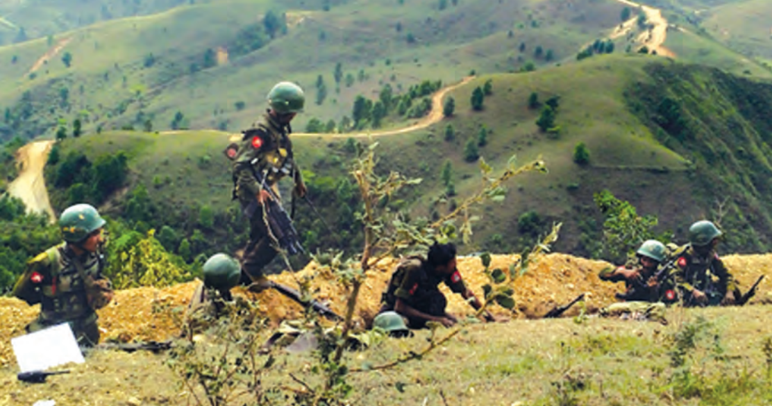
၂၀၁၅ ခုနှစ် မေလဆန်းက ရှမ်းပြည်နယ်မြောက်ပိုင်း လောက်ကိုင်မြို့ မြောက်ဘက် စီကော်လုံဒေသရှိ ပွိုင့်-၂၂၀၂ တောင်ကုန်းအား သိမ်းပိုက်ရန် တပ်မတော်သားများ ချဉ်းကပ်တိုက်ပွဲဝင်နေစဉ်။