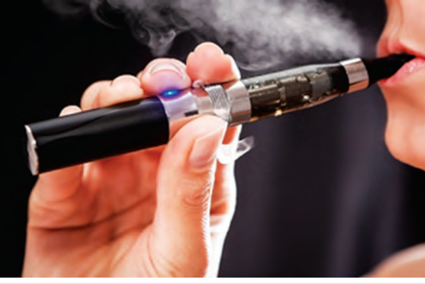
အီး-စီးကရက်သောက်နေသူတစ်ဦးကို တွေ့ရစဉ်။

ယခုအခါ အယ်လ်ဘာတာမှလွဲ၍ ဆက်ဆက်ချိတ်ဆက် နယူးဖော့ဒ်လန်ဒ်နှင့် လာဘရာဒါပြည်နယ်များတွင် အီး-စီးကရက်ရောင်းချခြင်းကို အသေးစား ပိတ်ပင်မှုများ ပြုလုပ်ထား