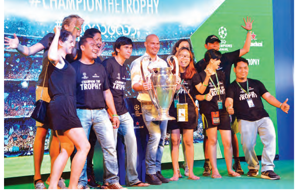
UEFA ဖလားကြီးနှင့်အတူ မြန်မာဘောလုံးချစ် လူငယ်လေးများပျော်ရွှင်ဖွယ် ဓာတ်ပုံရိုက်ကူးစဉ်။

ရန်ကုန် မတ် ၂၆ မြန်မာနိုင်ငံရှိ ဘောလုံးချစ် ပရိသတ်များရှိရာ ရန်ကုန်မြို့သို့ ပျော်ရွှင်စိတ်လှုပ်ရှားဖွယ် ရောက်ရှိ နေသော UEFA ချန်ပီယံလိဂ် ဖလားကြီးနှင့် အာဆင်နယ် ကစားသမားဟောင်း ယွန်းဘတ်တို့ ပျော်ရွှင်ဖွယ် နှုတ်ဆက်ဖော်ဖြေပွဲကို တာမွေ မြို့နယ် ရွှေထွဋ်တင် ကွင်း၌ မတ် ၂၆ ရက် ညနေ ၆ နာရီက ကျင်းပခဲ့ ကြောင်း သိရသည်။