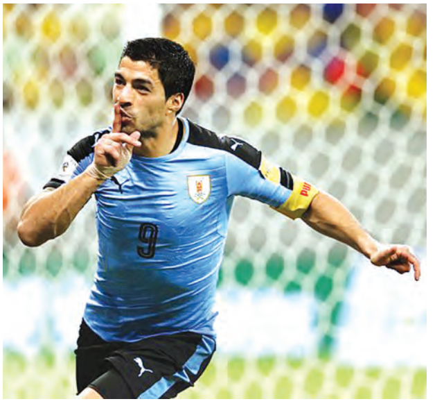
ဥရုဂွေးတိုက်စစ်မှူး ဆွာရက် ဂိုးသွင်းအပြီး အောင်ပွဲခံစဉ်။

မြောက်အမေရိကဇန် ကွန်ကာပိပ်စ် မတ် ၂၆ ရက် ရလဒ် အုပ်စု(A) အယ်လ်ဆာဗေဒို ၂-၂ ယွန်းဇူးရပ်စ် ကနေဒါ ၀-၃ မက္ကဆီကို အုပ်စု(B) ဟေတီ ၀-၀ ပနားမား ဂျမေကာ ၁-၁ ကော်စတာရီကာ အုပ်စု(C) စိန့်ပင်ဆင့် ၂-၃ ထရီနီဒဒ် ကောင်အမေရိကဇန် (မတ် ၂၅) ချီလီ ၁-၂ အာဂျင်တီးနား ပီရူး ၂-၂ ဗင်နီဇွဲလား