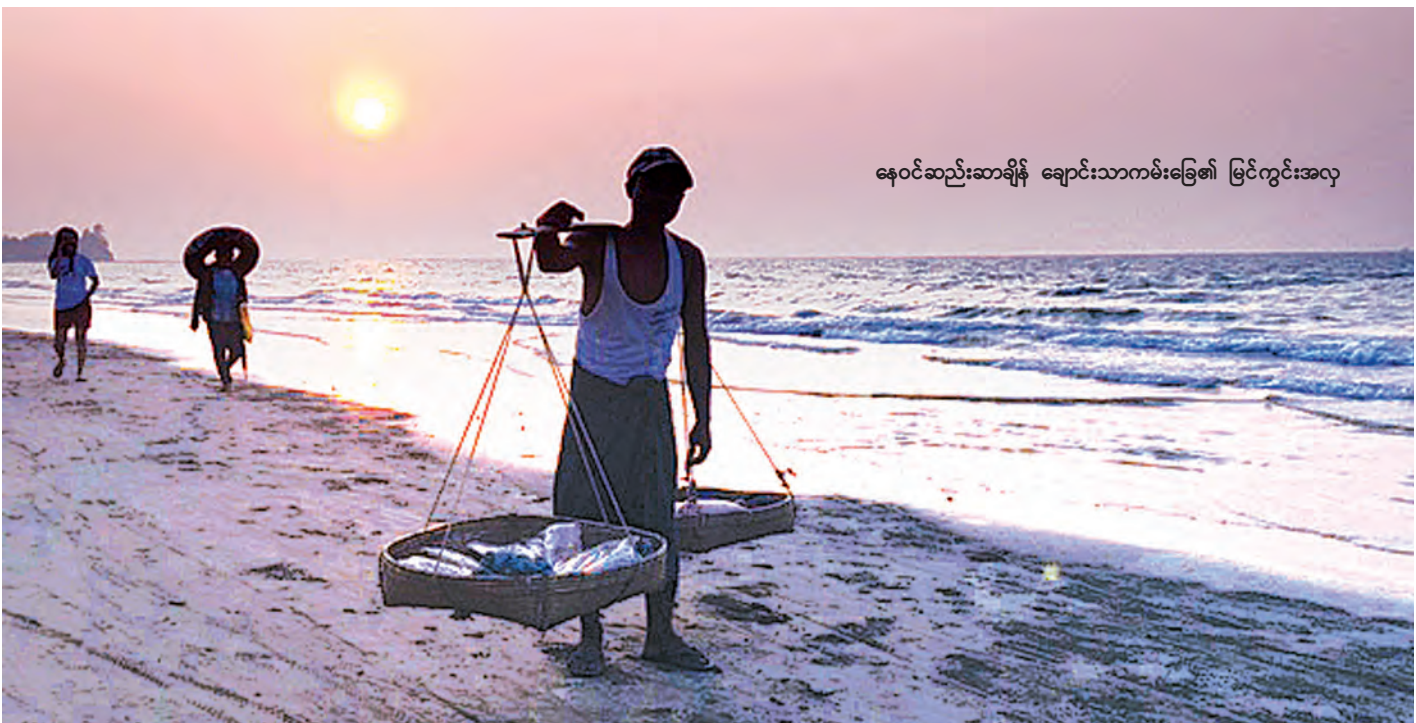
နေဝင်ဆည်းဆာချိန် ချောင်းသာကမ်းခြေ၏ မြင်ကွင်းအလှ

ဈေးသည်တွေအပြင် ဟိုတယ်၊ တည်းခိုခန်း၊ ဘန်ဂလိုကိုငှားရမ်းကြတဲ့သူတွေက ဈေးမတူကြဘူး။ အခြေအနေကြည့်ပြီးငှားကြတယ်။ လူစည်ကားရင် ဈေးတစ်မျိုး၊ ဧည့်သည်နည်းရင်ဈေးတစ်မျိုးယူကြတယ်။ အထူးသဖြင့် သင်္ကြန်ကာလမှာ တည်းခိုခန်းစရိတ်အဆမတန်ကြီးမြင့်တယ်လို့ သိရတယ်။ “ဒီရက်ပိုင်း(ဥတို)ချောင်းကူးတံတားကလည်း ပြင်နေတယ်။ စာမေးပွဲရက်လည်းဖြစ်နေတော့ လူသိပ်မစည်သေးဘူး။ ဒီအခန်းဆို လူစည်တဲ့ရက်ဆို ငါးသောင်းလောက်ထိယူတယ်။ သင်္ကြန်ရက်ဆို တစ်သိန်း