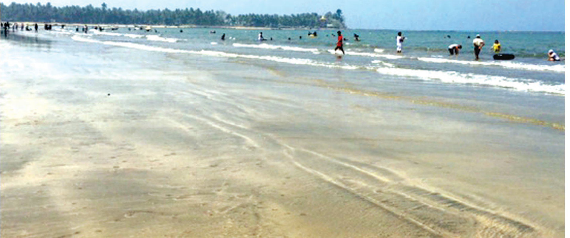
ချောင်းသာကမ်းခြေမှာ ပျော်ပျော်ပါးပါး ရေကစားနေကြသည်ကို ဤသို့ တွေ့မြင်ခဲ့ရသည်။