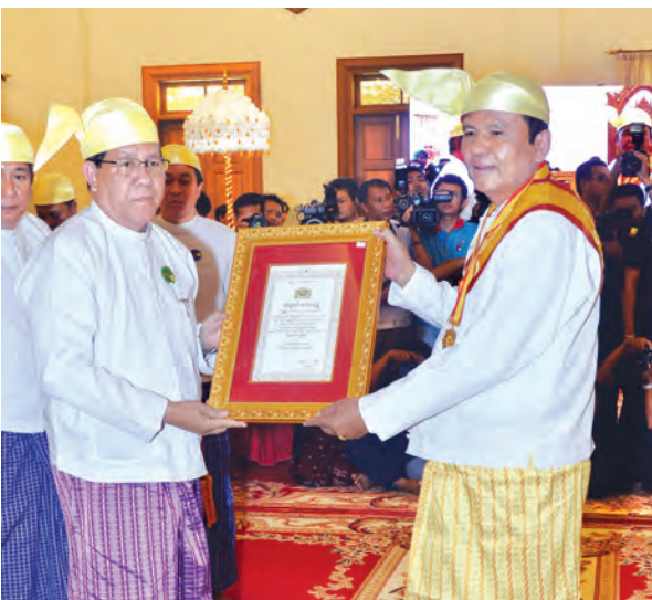
ပြည်ထောင်စု တရားသူကြီးချုပ် ဦးထွန်းထွန်းဦး ဘွဲ့တံဆိပ်ရရှိသူ တစ်ဦးအား ဘွဲ့တံဆိပ်နှင့်အဆောင်အယောင်တို့ကို ပေးအပ်ချီးမြှင့်စဉ်။