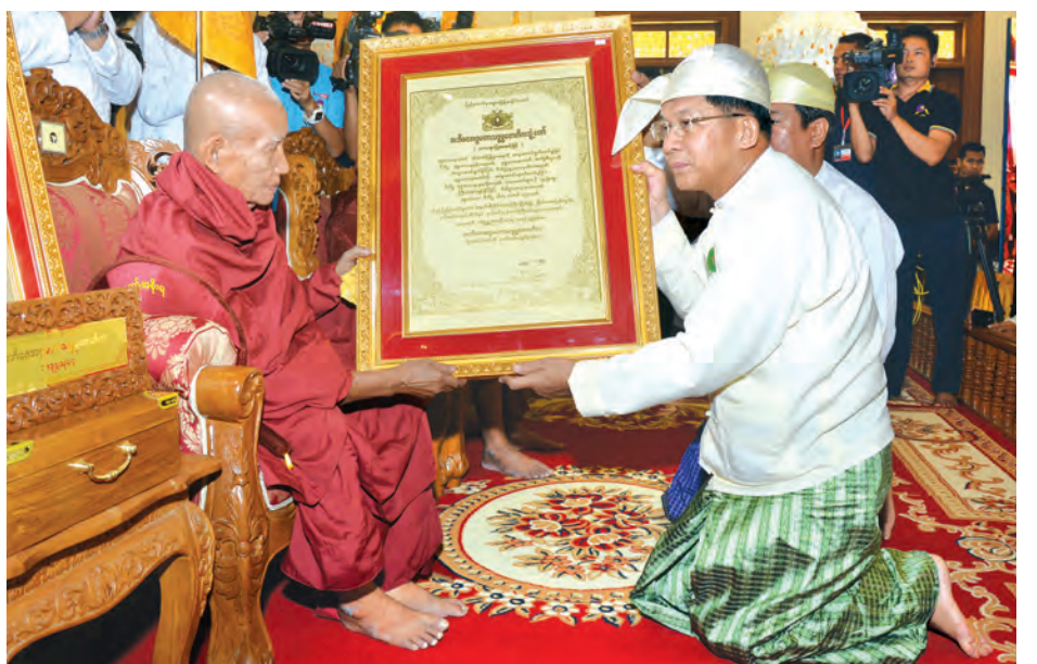
တပ်မတော်ကာကွယ်ရေးဦးစီးချုပ် ဗိုလ်ချုပ်မှူးကြီး မင်းအောင်လှိုင် ဆရာတော်အား ဘွဲ့တံဆိပ်တော် ဆက်ကပ်စဉ်။ (သတင်းစဉ်)