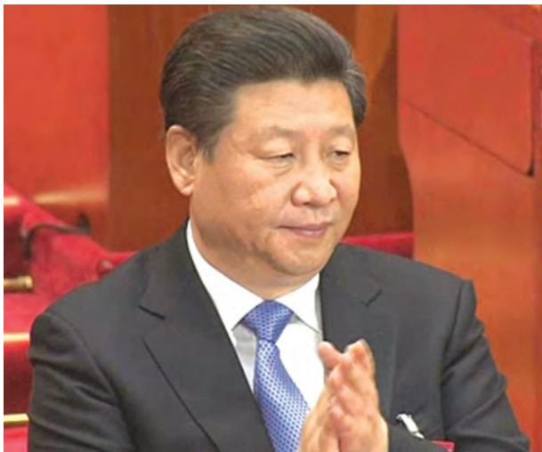
နျူကလီးယား ဆက်စပ်ပစ္စည်း လက်ဝယ်ကျရောက်ခြင်း မရှိစေရန် ကာကွယ်ရေး ရည်ရွယ်