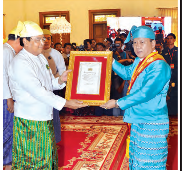
ဒုတိယသမ္မတ ဦးညွှန်ထွန်း ဘွဲ့တံဆိပ်ရရှိသူတစ်ဦးအား ဘွဲ့တံဆိပ် နှင့်အဆောင်အယောင်တို့ကို ပေးအပ်ချီးမြှင့်စဉ်။