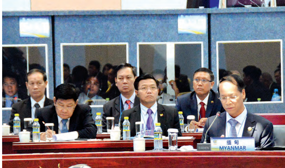
ဒုတိယသမ္မတ ဒေါက်တာစိုင်းမောက်ခမ်း ပထမအကြိမ် မဲခေါင်-လန်ချန်း ပူးပေါင်းဆောင်ရွက်ရေးဆိုင်ရာ ထိပ်သီးအစည်းအဝေးသို့ တက်ရောက်စဉ်။

ဒေါက်တာ စိုင်းမောက်ခမ်းနှင့် ဝန်ကြီးချုပ် နိုင်ငံ ဒုတိယဝန်ကြီးချုပ် တို့က ဆွေးနွေးကြသည်။ ဒုတိယသမ္မတ ဒေါက်တာ စိုင်းမောက်ခမ်းက ဆွေးနွေးပြောကြား ရာတွင် တရုတ်ပြည်သူ့သမ္မတနိုင်ငံ အနေဖြင့် မဲခေါင်ဒေသနိုင်ငံများနှင့် ပူးပေါင်းဆောင်ရွက်မှု မြှင့်တင်ရန် ခိုင်မာသည့် ကတိကဝတ်ထားရှိမှု အတွက် ကျေးဇူးတင်ရှိကြောင်း။ မိမိအနေဖြင့် နိုင်ငံတော်သမ္မတ ဦးသိန်းစိန်အား ကိုယ်စားပြုလျက် မဲခေါင်-လန်ချန်း ထိပ်သီးခေါင်း ဆောင်များ အစည်းအဝေးကို တက် ရောက်ခွင့်ရသည့်အတွက် အထူး ဝမ်းမြောက် ဂုဏ်ယူမိပါကြောင်း၊ နိုင်ငံတော်သမ္မတအနေဖြင့် ယခု အစည်းအဝေးကို တက်ရောက်ရန် ဆန္ဒရှိသော်လည်း နိုင်ငံအတွင်း အရေးကြီးသည့် အုပ်ချုပ်ရေး အပြောင်းအလဲ ကာလဖြစ်နေ၍ အစည်းအဝေးသို့ ပါဝင်တက်ရောက် နိုင်ခြင်း မရှိပါကြောင်းနှင့် နိုင်ငံတော် သမ္မတ ဦးသိန်းစိန်က မဲခေါင်- လန်ချန်း နိုင်ငံခေါင်းဆောင်များသို့ လည်းကောင်း၊ ဤသမိုင်းဝင်အစည်း အဝေးကြီး အထမြောက်အောင်မြင် စေရေးအတွက် လည်းကောင်း ဆုမွန် ကောင်းများ ပို့သလိုက်ပါသည် ပြောကြားလိုပါကြောင်း။