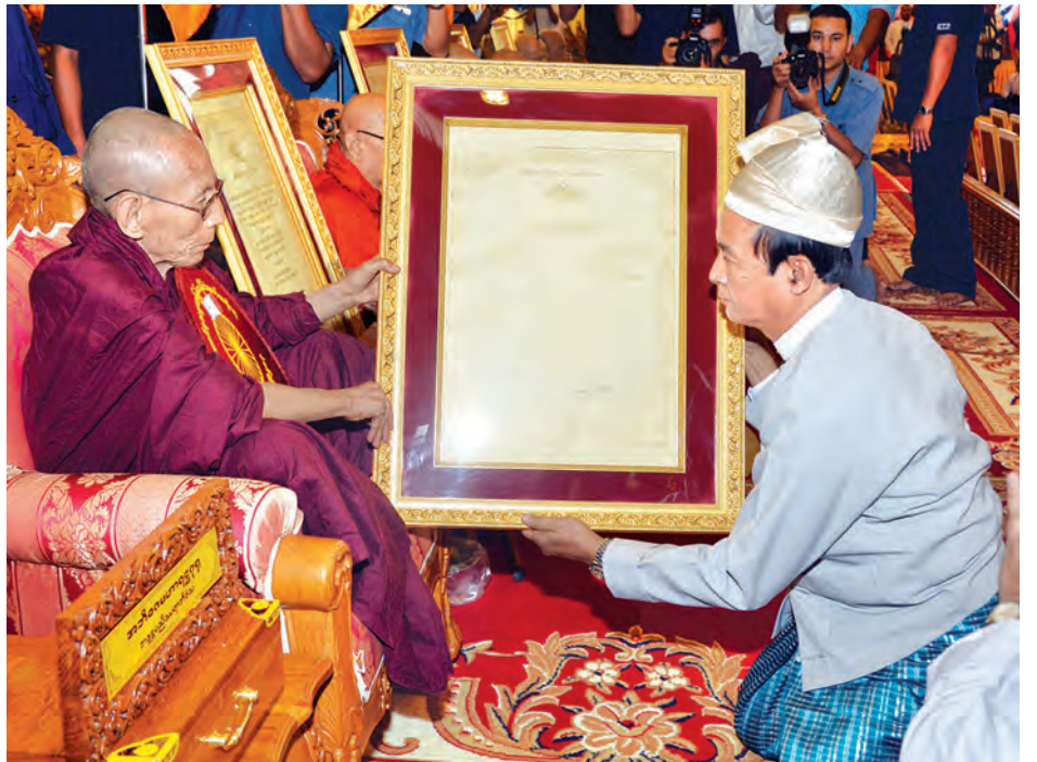
ပြည်သူ့လွှတ်တော်ဥက္ကဋ္ဌ ဦးဝင်းမြင့် ဆရာတော်အား ဘွဲ့တံဆိပ်တော် ဆက်ကပ်စဉ်။ (သတင်းစဉ်)