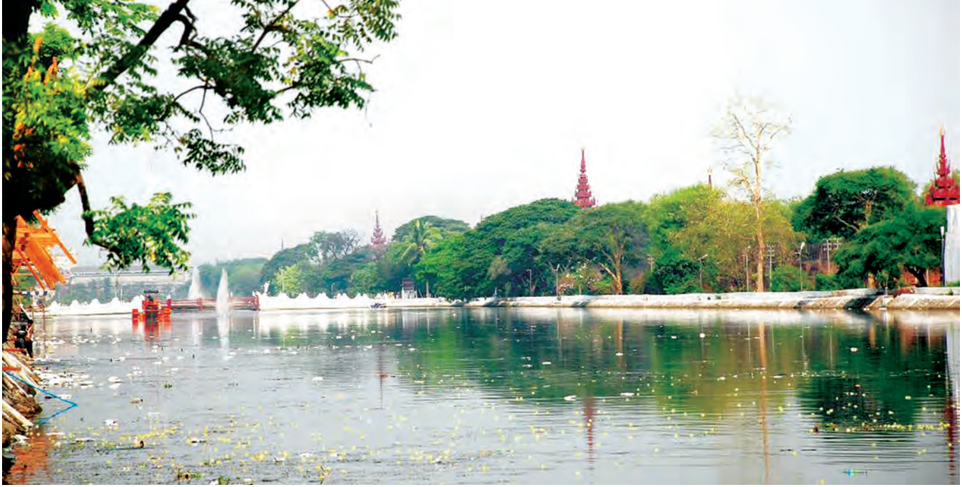
သင်္ကြန်အပြီး ညစ်ညမ်းသွားသော ကျွဲကိုတွေ့ရစဉ်။

ပြန်တော့ 'အိတ်ပေါက်နဲ့ ဖားကောက်' ဆိုတဲ့ စကားပုံလို ဖြစ်နေပြန်ပါတယ်။ မြို့တော်ရေပေးဝေရေးဟာ ဘယ်လိုပဲအဆင်ပြေအောင် ဆောင်ရွက်နေပါတယ်ဆိုစေကာမူ နှစ်စဉ်တိုးတက်လာတဲ့ လူဦးရေ အဆောက်အအုံနဲ့ လျော်ညီစွာ ရှေ့ကကြိုပြီး စနစ်တကျစီစဉ်ဆောင်ရွက်နိုင်မှုတော့ အားနည်းနေသေးတာ သေချာပါတယ်။ ဒီကြားထဲ လျှပ်စစ်မီးလာမှ ရေရရှိမှုမို့ ဒီအခက်အခဲကိုလည်း နေ့စဉ်နှင့်အမျှ ကျော်ဖြတ်နေရတာပဲ မဟုတ်ပါလား။ ကိုင်း... ထားပါတော့။ နှစ်စဉ်နှစ်တိုင်း ကျွဲရေကြီးကို ကျောပေး၊ ခြေကန်ကာ အကုန်အသတ်အတိုင်းအဆမဲ့ ရေတွေဖြန်းတီးမှုဟာ သင်္ကြန်တွင်းပျမ်းမျှကျွဲ ရေဂါလန် သန်း၄၀ ကျော် အနည်းဆုံးကုန်ပါတာပဲ။ ဒီအရေအတွက်ဟာ မန္တလေးမြို့လူထု ၁၀ သိန်းဝန်းကျင်အတွက် တစ်နေ့တာ ရေလိုအပ်မှုမာဏပါပဲ။