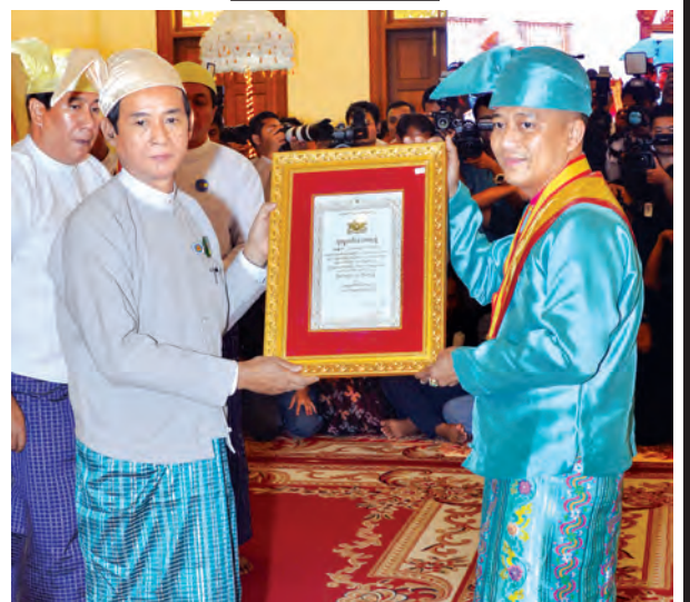
ပြည်သူ့လွှတ်တော်ဥက္ကဋ္ဌ ဦးဝင်းမြင့် ဘွဲ့တံဆိပ်ရရှိသူတစ်ဦးအား ဘွဲ့တံဆိပ်နှင့်အဆောင်အယောင်တို့ကို ပေးအပ်ချီးမြှင့်စဉ်။