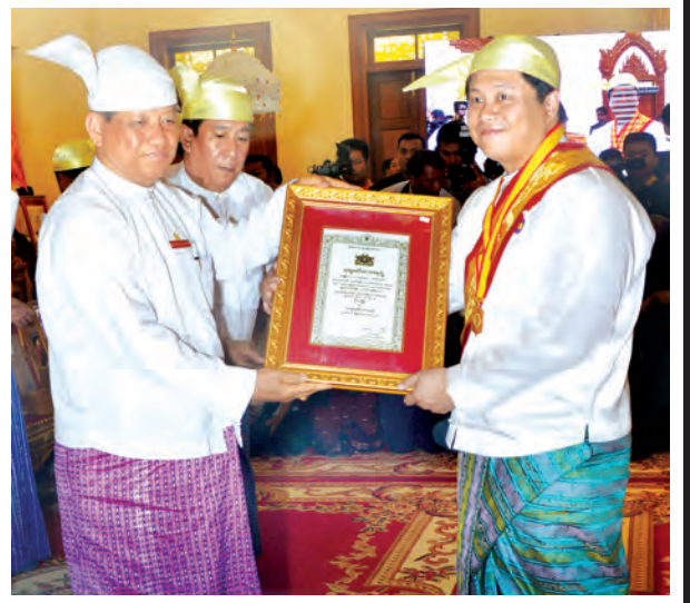
ပြည်ထောင်စုရွေးကောက်ပွဲကော်မရှင်ဥက္ကဋ္ဌ ဦးတင်အေး ဘွဲ့တံဆိပ် ရရှိသူ တစ်ဦးအား ဘွဲ့တံဆိပ်နှင့်အဆောင်အယောင်တို့ကို ပေးအပ်ချီးမြှင့်စဉ်။