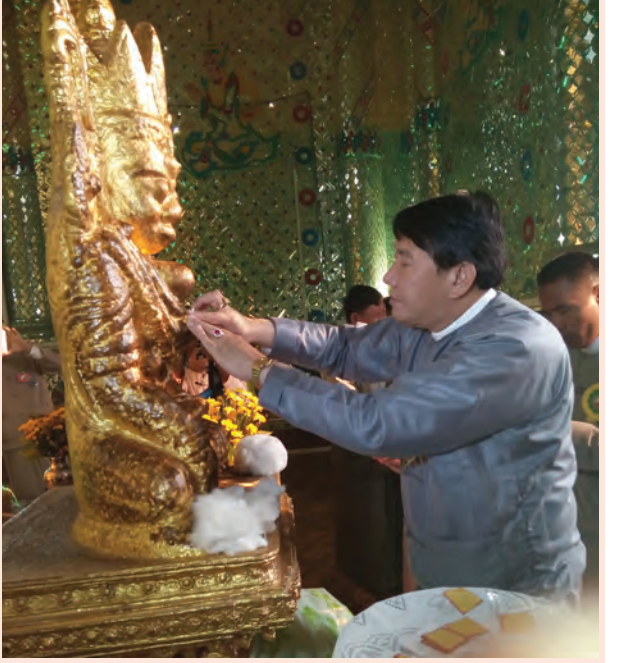
ရှမ်းပြည်နယ်(မြောက်ပိုင်း)သီပေါမြို့နယ် ဘော်ကြီးကျေးရွာရှိ သမိုင်းဝင် ဘော်ကြီးမြေဌာစေတီတော်ကြီး ဗုဒ္ဓပူဇော်ပွဲတော်၌ ရတနာမာန်အောင်၊ ရတနာရန်အောင်၊ ရတနာညောင်အောင်နှင့် ရတနာဇော်အောင် ဘုရားလေးဆူကို ရှမ်းပြည်နယ်ဝန်ကြီးချုပ် ဦးစစ်အောင်မြတ်နှင့် တာဝန်ရှိသူများက ရွှေသင်္ကန်းများ ကပ်လှူပူဇော်စဉ်။ (ဘော်ကြီးမြေဌာစေတီတော်ကြီး ဗုဒ္ဓပူဇော်ပွဲတော်ကို တပေါင်းလဆန်း ၁၀ ရက်မှ စတင်ကျင်းပနေပြီး တပေါင်းလပြည့်နေ့အထိ ကျင်းပသွားမည်ဖြစ်ကြောင်း သိရသည်။) ဝိုင်း(သီပေါ)