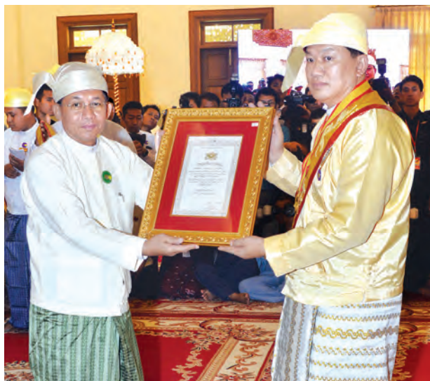
တပ်မတော်ကာကွယ်ရေးဦးစီးချုပ် ဗိုလ်ချုပ်မှူးကြီး မင်းအောင်လှိုင် ဘွဲ့တံဆိပ် ရရှိသူတစ်ဦးအား ဘွဲ့တံဆိပ်နှင့်အဆောင်အယောင်တို့ကို ပေးအပ်ချီးမြှင့်စဉ်။