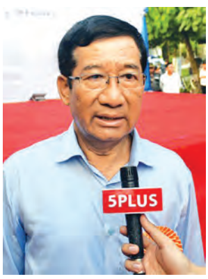
ဦးသန်းဆွေ

အဆိုပါ ခုံးကျော်တံတားသစ်၏ ပင်မတံတား အရှည်မှာ ၄၆၅ မီတာနှင့် ချဉ်းကပ်တံတား အရှည်မှာ တံတားသစ်၏ တစ်ဖက်တစ်ချက်စီ၌ မီတာ ၃၀ စီ ပါဝင်ကာ ပင်မနှင့် ချဉ်းကပ်တံတားအရှည်မှာ စုစုပေါင်း ၅၂၅ မီတာရှိသည်။ ရှစ်မိုင်လမ်းဆုံ ခုံးကျော်တံတားသစ်၏ ယာဉ်သွားလမ်းအကျယ် ဖွဲ့စည်းထားပုံမှာ တံတား၏ အပြောင့်နေရာတွင် ၁၃ ဒဿမ ၄ မီတာ (လေးလမ်းသွား) ဖြစ်ပြီး တံတား၏ အကျော့နေရာတွင် ၁၄ ဒဿမ ၅ မီတာ (လေးလမ်းသွား) ဖြစ်ကြောင်း သိရသည်။