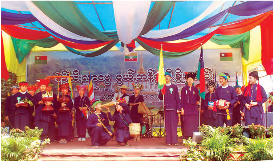
ဖျော်ဖြေတင်ဆက်ခဲ့သည်။ အမျိုးသားနေ့ရောက်တိုင်း ပအိုဝ်းတပေါင်းလပြည့်နေ့ (ပအိုဝ်းလူမျိုးများ အများဆုံးနေ့ထိုင်ရာ ရှမ်းပြည်နယ်၊ ကရင်ပြည်နယ်၊ ကယားပြည်နယ်၊ ပဲခူးတိုင်းဒေသ

ပအိုဝ်းအမျိုးသားနေ့ အခမ်းအနားတွင် ပအိုဝ်းလူမျိုးတို့၏ ရိုးရာယဉ်ကျေးမှုအကအလှများ၊ တိုင်းရင်းသားပေါင်းစုံတို့၏ အကအလှများအပြင် ပအိုဝ်းလူမျိုးတို့၏ ခေတ်အဆက်ဆက်အသုံးပြုခဲ့သည့် ပအိုဝ်းစောင်း၊ ပလွေ၊ ကွာ၊ အခရာ(အခယာ) စသော တူရိယာပစ္စည်းများဖြင့်