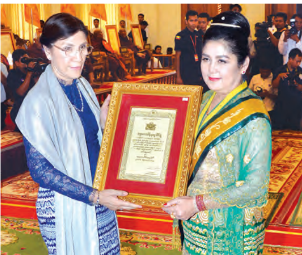
ဒုတိယသမ္မတ ဒေါက်တာစိုင်းမောက်ခမ်း၏ဇနီး ဒေါ်နန်းရွှေမွန် ဘွဲ့တံဆိပ် ရရှိသူတစ်ဦးအား ဘွဲ့တံဆိပ်နှင့်အဆောင်အယောင်တို့ကို ပေးအပ်ချီးမြှင့်စဉ်။