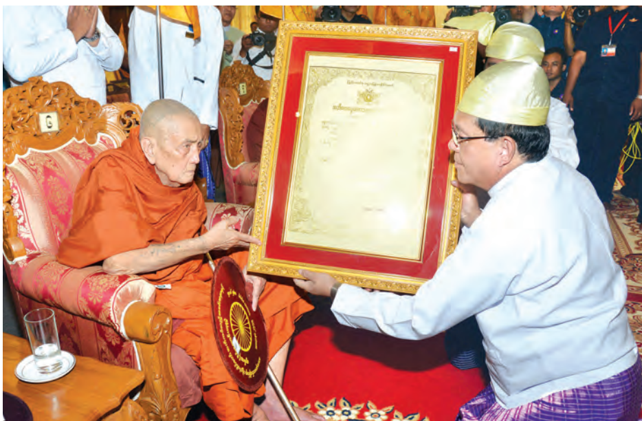
ပြည်ထောင်စုတရားသူကြီးချုပ် ဦးထွန်းထွန်းဦး ဆရာတော်အား ဘွဲ့တံဆိပ်တော် ဆက်ကပ်စဉ်။ (သတင်းစဉ်)