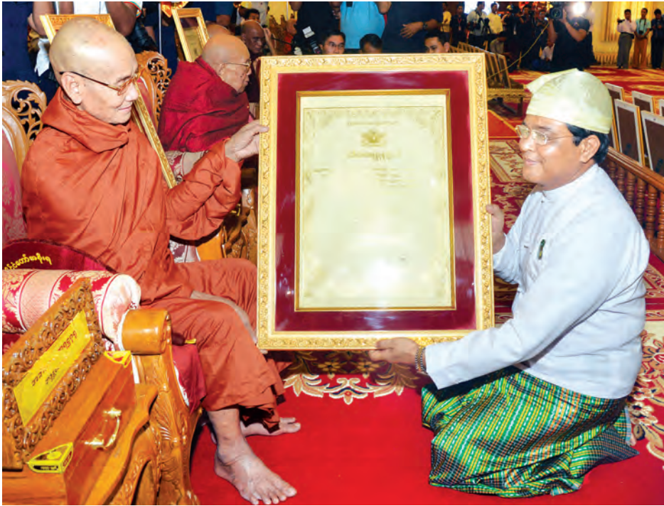
ဒုတိယသမ္မတ ဦးညွှန်ထွန်း ဆရာတော်အား ဘွဲ့တံဆိပ်တော် ဆက်ကပ်စဉ်။ (သတင်းစဉ်)