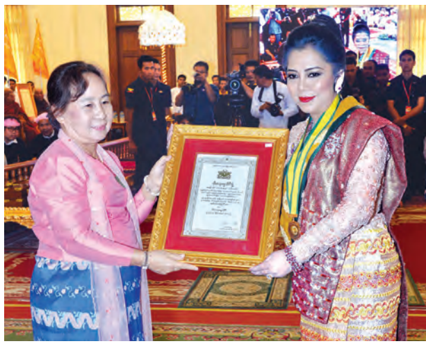
အမျိုးသားလွှတ်တော်ဥက္ကဋ္ဌ မန်းဝင်းခိုင်သန်း၏ဇနီး နန်းကြင်ကြည် ဘွဲ့တံဆိပ် ရရှိသူတစ်ဦးအား ဘွဲ့တံဆိပ်နှင့်အဆောင်အယောင်တို့ကို ပေးအပ်ချီးမြှင့်စဉ်။