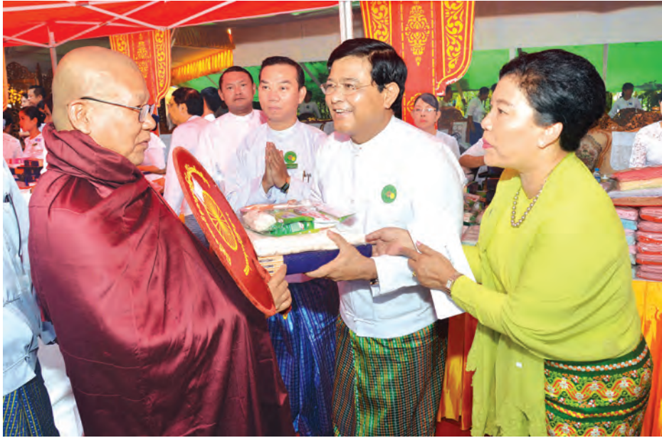
ဒုတိယသမ္မတ ဦးညွှန်ထွန်းနှင့်ဇနီး ဒေါ်ခင်အေးမြင့်တို့ ဆရာတော်အား ဆွမ်းဆန်စိမ်းနှင့် လှူဖွယ်ပစ္စည်းများ လောင်းလှူကြစဉ်။