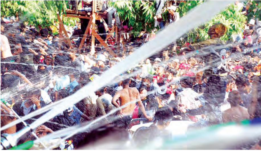
သင်္ကြန်ပွဲတော်ကာလ ကျွဲနှုတ်ခမ်းအပေါ် တည်ဆောက်ထားသည့် ရေကစားမဏ္ဍပ်ကို တွေ့ရစဉ်။

လာမယ့်နှစ်က အယ်နီညို အဆိုးဆုံးဖြစ်မယ့် နှစ်တဲ့။ အမြင့်ဆုံးအပူဒဏ်ကို ခံကြရမတဲ့။ မိုးခေါင်မတဲ့။ ရေကန်တွေ မြေအောက်ရေတွေ ခန်းခြောက်မတဲ့။ အထူးသဖြင့် သောက်သုံးရေပြတ်လပ်မှုတွေ ကြုံတွေ့ရနိုင်တယ်လို့ ပညာရှင်တွေက ခန့်မှန်းကြတယ်။ မြန်မာပြည်အလယ်ပိုင်းက မိုးနည်းရေရှားရပ်ဝန်းဒေသတွေမှာ ဒီအန္တရာယ်ကို ပိုပြီးသတိထားကြရမှာပေါ့။ ဒီဘေးဒုက္ခအတွက် ပိုမိုပြီးကြိုတင်ပြင်ဆင်ကြရမှာပေါ့။