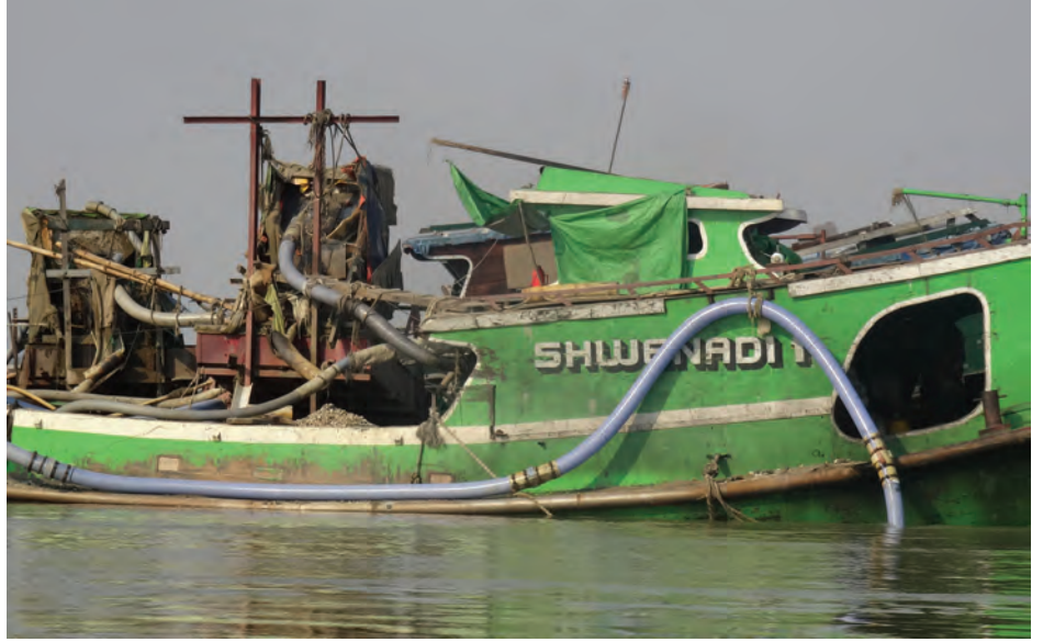
ဧရာဝတီမြစ်အတွင်း မြစ်သဲထုတ်လုပ်နေသော ရေယာဉ်ကြီးများ။

ဂန့်ဂေါမြို့နယ် မြောက်ခင်ရန်းရွာမှ ပြည်သူများ၏ စိုက်ပျိုးရေး၊ မွေးမြူရေးနှင့် အသက်မွေးဝမ်းကျောင်းလုပ်ငန်းများအတွက် အထောက်အကူဖြစ်စေရန်ရည်ရွယ်၍ ကျေးလက်ဒေသဖွံ့ဖြိုးတိုးတက်ရေးဦးစီးဌာနက ပေးအပ်ထားသော မြစ်မီးရှောက်ချေးငွေ ဒုတိယအကြိမ်ချေးငွေများကို မတ်လတတိယပတ်တွင် စတင်ထုတ်ချေးနေပြီဖြစ်ကြောင်း၊ ဒုတိယအကြိမ်တွင် စုစုပေါင်းချေးငွေ ကျပ်သိန်း ၃၃၀ ကို မွေးမြူရေးလုပ်ငန်းလုပ်ကိုင်သူ ၉၀၊ စိုက်ပျိုးရေးလုပ်ငန်း လုပ်ကိုင်သူ ၇၁ ဦး၊ အသက်မွေးဝမ်းကျောင်း လုပ်ငန်း လုပ်ကိုင်သူ ၁၃ ဦး၊ ပရိဘောဂလုပ်ငန်းလုပ်ကိုင်သူ လေးဦးနှင့် အရောင်းအဝယ်လုပ်ငန်းလုပ်ကိုင်သူ ရှစ်ဦးတို့အား ၄၄၀ တို့၏ လုပ်ငန်းများအတွက် အထောက်အကူဖြစ်စေရန် အတိုးနှုန်းသက်သာစွာဖြင့် ထုတ်ချေးသွားမည် ဖြစ်ကြောင်း သိရသည်။ (၁၀၁)