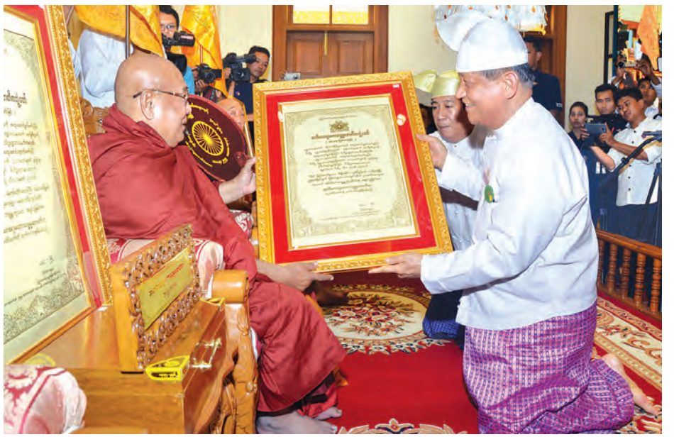
ပြည်ထောင်စုရွေးကောက်ပွဲကော်မရှင်ဥက္ကဋ္ဌ ဦးတင်အေး ဆရာတော်အား ဘွဲ့တံဆိပ်တော် ဆက်ကပ် စဉ်။

ဦးညွှန်ထွန်း၊ ပြည်သူ့လွှတ်တော် ဥက္ကဋ္ဌ ဦးဝင်းမြင့်၊ ပြည်ထောင်စု တရားသူကြီးချုပ် ဦးထွန်းထွန်းဦး၊ တပ်မတော်ကာကွယ်ရေး ဦးစီးချုပ် ပိုလ်ချုပ်မှူးကြီး မင်းအောင်လှိုင်၊ ပြည်ထောင်စု ရွေးကောက်ပွဲကော်မရှင် ဥက္ကဋ္ဌ ဦးတင်အေး၊ ဒုတိယတပ်မတော် ကာကွယ်ရေးဦးစီးချုပ်၊ အမျိုးသား လွှတ်တော် ဒုတိယဥက္ကဋ္ဌတို့က သီဟ သုဓမ္မမဏိဇောတရေ၊ သုဓမ္မမဏိ ဇောတရေ၊ မဟာသဒ္ဓမ္မဇောတိကဇေ သဒ္ဓမ္မဇောတိကဇေဘွဲ့တံဆိပ်ရရှိကြ သူများအား ဘွဲ့တံဆိပ်နှင့် အဆောင် အယောင်များကို ပေးအပ်ချီးမြှင့် ကြသည်။ ထို့နောက် ဒုတိယသမ္မတ ဒေါက်တာ စိုင်းမောက်ခမ်း၏ဇနီး ဒေါ်နန်းရွှေမှုန်၊ ဒုတိယသမ္မတ ဦးညွှန်ထွန်း၏ဇနီး ဒေါ်ခင်အေးမြင့်၊ ပြည်သူ့လွှတ်တော်ဥက္ကဋ္ဌ၏ ဇနီး ဒေါ်ချိုချို၊ အမျိုးသားလွှတ်တော်