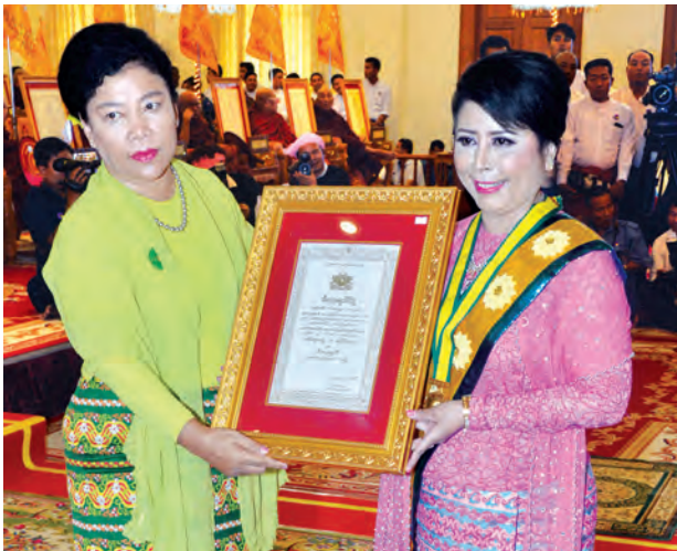
ဒုတိယသမ္မတ ဦးညွှန်ထွန်း၏ဇနီး ဒေါ်ခင်အေးမြင့် ဘွဲ့တံဆိပ်ရရှိသူ တစ်ဦးအား ဘွဲ့တံဆိပ်နှင့်အဆောင်အယောင်တို့ကို ပေးအပ်ချီးမြှင့်စဉ်။