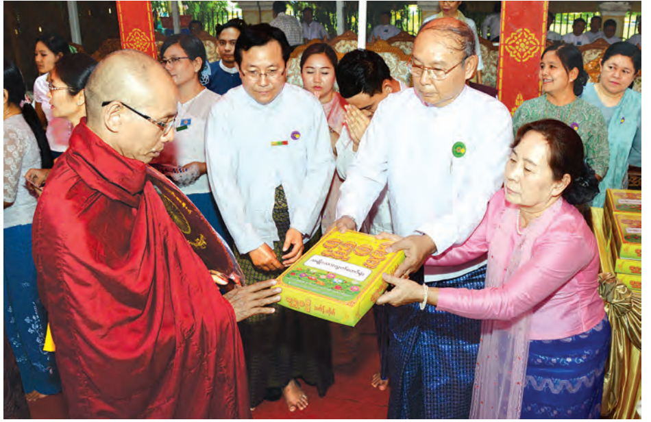
ပြည်ထောင်စုလွှတ်တော်နာယက၊ အမျိုးသားလွှတ်တော်ဥက္ကဋ္ဌ မန်းဝင်းခိုင်သန်းနှင့်ဇနီး နန့်ကြင်ကြည်တို့ ဆရာတော်အား ဆွမ်းဆန်စိမ်းနှင့် လှူဖွယ်ပစ္စည်းများ လောင်းလှူကြစဉ်။