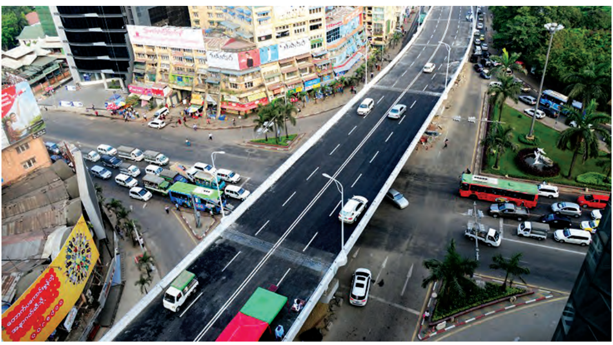
ရန်ကုန် မတ် ၁၅

ရန်ကုန်မြို့၏ ယာဉ်ကြောကျပ်တည်းမှုကို ပြေလျော့စေရေးအတွက် ငွေကျပ် ၁၅ ဒသမ ၅ ဘီလီယံ အကုန်ကျခံတည်ဆောက်ထားသည့် မရမ်းကုန်းမြို့နယ် ရစ်မိုင်လမ်းဆုံ ခုံးကျော်တံတားသစ်စီမံကိန်းမှာ ပြီးစီးသွားပြီဖြစ်သဖြင့် မတ် ၁၅ ရက် နံနက်ပိုင်းမှစတင်၍ ယာဉ်များဖြတ်သန်းသွားလာခွင့်ပြုလိုက်ပြီဖြစ်သည်။(အပေါ်ပုံ)