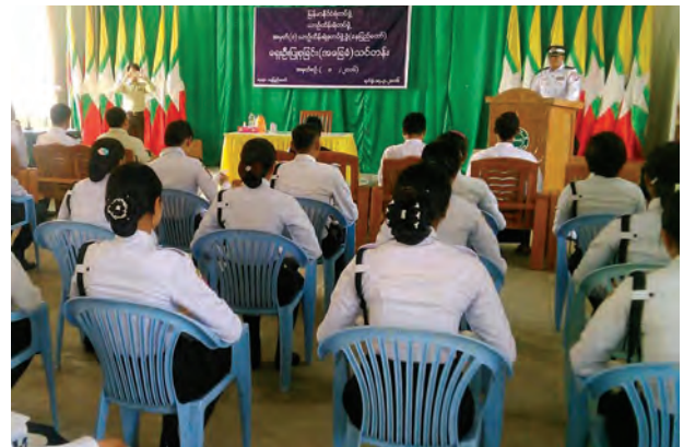
အဆိုပါ သင်တန်းသို့ နေပြည်တော်ယာဉ်ထိန်းရဲတပ်ဖွဲ့မှ သင်တန်းသား သင်တန်းသူ ၃၀ တက်ရောက်၍ သင်တန်းကာလမှာ ရက်သတ္တပတ် ကြာမြင့် မည်ဖြစ်ကြောင်း သိရသည်။

အဆိုပါသင်တန်းသည် ယာဉ်တိုက်မှုဖြစ်ပွားရာမှ ထိခိုက်ဒဏ်ရာရရှိသူ များကို ရှေးဦးပြုစုပေးခြင်းဖြင့် ပြည်သူလူထုကို ဝန်ဆောင်မှုပေးရသည့်အတွက် ပြည်သူများနှင့် ယာဉ်ထိန်းရဲတပ်ဖွဲ့တို့အတွက် အကျိုးပြုမည်ဖြစ်ကြောင်း၊ ယာဉ်တိုက်မှုဖြစ်၍ ဒဏ်ရာရသေဆုံးသူများမှာ အချိန်မီဆေးရုံသို့ ပို့ပေးနိုင်မှု မရှိခြင်းတို့ကြောင့် သေဆုံးခဲ့သူများရှိသလို ရှေးဦးပြုစုခြင်းဖြင့် ပြန်လည် ကောင်းမွန်လာသူများလည်းရှိကြောင်း၊ ရှေးဦးပြုစုခြင်းမရှိသည့်အတွက် ကိုယ်လက်အင်္ဂါဆုံးရှုံးမှုများ ကြုံတွေ့နေရဆဲဖြစ်ကြောင်း နေပြည်တော်ယာဉ် ထိန်းရဲတပ်ဖွဲ့ ဒုတပ်ဖွဲ့မှူး ဒုတိယရဲမှူးကြီး ရခိုင်က ပြောကြားခဲ့သည်။