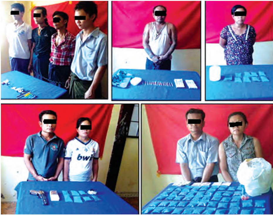
ဖြစ်မှုကျူးလွန်သူများအား ဖမ်းဆီးရမိမူးယစ်ဆေးဝါးများနှင့်အတူ တွေ့ရစဉ်။