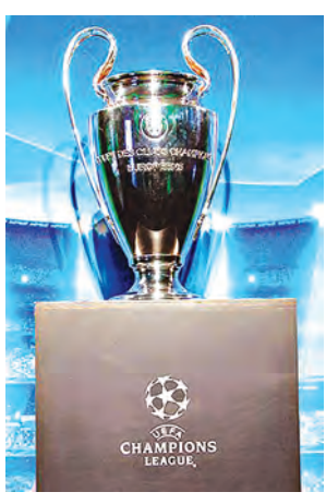
မြန်မာနိုင်ငံသို့ မတ် ၂၀ ရက် တွင် ရောက်ရှိမည့် ချန်ပီယံလိဂ် (UEFA) ဖလား။

ဘောလုံးဝါသနာရှင် ပြည်သူများ အနီးကပ်အမှတ်တရ ကြည့်ရှုခွင့်ရ စေရန် မြန်မာနိုင်ငံဘောလုံးအဖွဲ့ ချုပ်က ကားများဖြင့် စီတန်းစတင် လှည့်လည်ကာ ရွှေဂုံတိုင်လမ်းဆုံ၊ ဘုန်းကြီးလမ်း၊ လှည်းတန်းလမ်းဆုံ၊ အင်းလျားကန်အနီး ပြည်လမ်း တစ်လျှောက်မှတစ်ဆင့် ဆီဒိုးနား တိုတယ်သို့ ပြန်လည်ခိုလှုံမည်ဖြစ် သည်။ ချန်ပီယံလိဂ် (UEFA) ဖလား ကြီးသည် မတ် ၂၁ ရက်တွင် ယူနိုက်တက် ကာ မတ် ၂၂ ရက်တွင် သူဝဏ္ဏ ဘောလုံးကွင်း၌ ပြည်သူများဖြင့် ဘောလုံးအစီအစဉ်တစ်ရပ် ထည့် သွင်း၍ ကျင်းပမည်ဖြစ်ပြီး မတ် ၂၄ ရက်တွင် ဘောလုံးပိတ်ကျင်းပ ကာ ၂၅ ရက်တွင် ယင်းဖလားနှင့် အတူ သံတမန်အဖြစ် ရောက်ရှိလာ မည့် အာဆင်နယ်အသင်း၏ ကမ္ဘာ ကျော် ဘောလုံးသမား ဖရက်ဒရစ် လမ်းဘတ်ဂ်က ပါတီပွဲပြုလုပ်ကာ မီဒီယာရှင်းလင်းပွဲ ပြုလုပ်မည်ဖြစ်ပြီး နောက်ဆုံး မတ် ၂၆ ရက်တွင် ရွှေထွင်တင် ကွင်း၌ မွန်းလွဲပိုင်းမှ ညအထိ ပြည်သူများ အမှတ်တရ ဓာတ်ပုံရိုက်ခွင့်၊ ဗီဒီယိုရိုက်ခွင့်များ