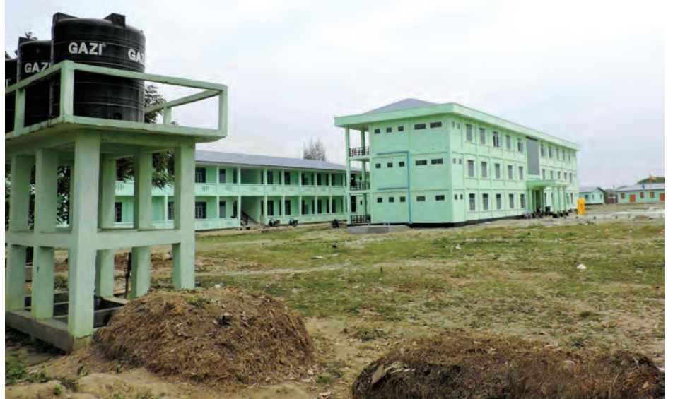
စိုက်ပျိုးရေးသိပ္ပံကျောင်း(ကျောက်တော်)မှ ကျောင်းအဆောက်အအုံများ

သစ်တောသစ်ပင် ဒိုချစ်ခင် နှစ်စဉ်စိုက်ပျိုး အလှတိုး