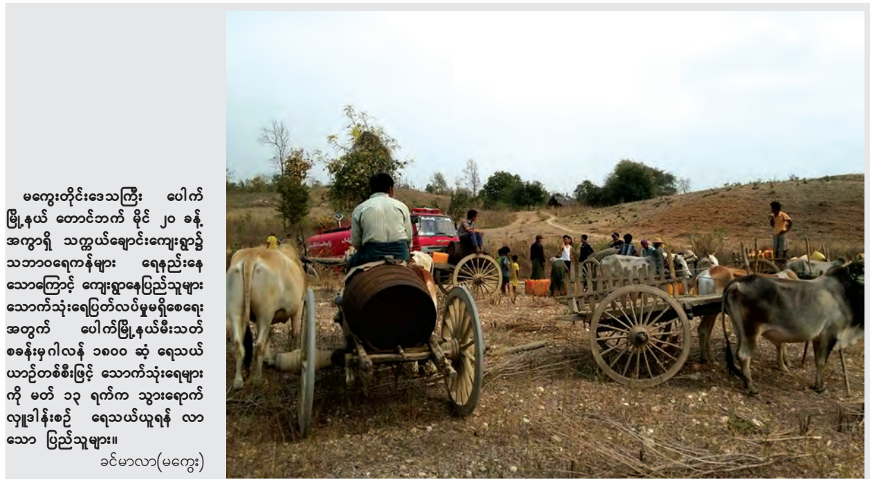
မကွေးတိုင်းဒေသကြီး ပေါက် မြို့နယ် တောင်ဘက် မိုင် ၂၀ ခန့် အကွာရှိ သတ္တမချောင်းကျေးရွာ၌ သဘာဝရေကန်များ ရေနည်းနေ သောကြောင့် ကျေးရွာနေပြည်သူများ သောက်သုံးရေပြတ်လပ်မှုမရှိစေရေး အတွက် ပေါက်မြို့နယ်စီးသတ် စခန်းမှဂါလန် ၁၈၀၀ ဆုံ ရေသယ် ယာဉ်တစ်စီးဖြင့် သောက်သုံးရေများ ကို မတ် ၁၃ ရက်က သွားရောက် လှူဒါန်းစဉ် ရေသယ်ယူရန် လာ သော ပြည်သူများ။ ခင်မာလာ(မကွေး)