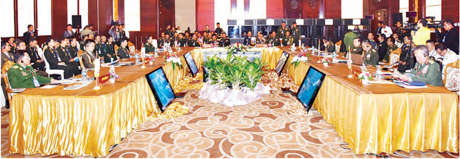
(၁၃)ကြိမ်မြောက် အာဆီယံတပ်မတော်ကာကွယ်ရေးဦးစီးချုပ်များ အလွတ်သဘောအစည်းအဝေး (13 th ACDFIM) ဆွေးနွေးပွဲကျင်းပစဉ်။

ကျော့ဖိုးမှ တပ်မတော် အကြီးအကဲများသည် စုပေါင်းမှတ်တမ်းတင် ဓာတ်ပုံရိုက်ကြသည်။ ထို့နောက် အစည်းအဝေး သဘာပတိ လာအိုပြည်သူ့တပ်မတော် စစ်ဦးစီးချုပ် Maj-Gen Souvone LEVANGBOUNMY က အာဆီယံဒေသတွင်း တည်ငြိမ်အေးချမ်းမှုရှိစေရေးအတွက် အာဆီယံတပ်မတော်များအနေဖြင့် ပိုမိုပူးပေါင်းဆောင်ရွက်သွားကြရမည်ဖြစ်ကြောင်းနှင့် သဘာဝဘေးအန္တရာယ် ကယ်ဆယ်ရေးနှင့် လူသားချင်းစာနာထောက်ထားမှုဆိုင်ရာ အကူအညီများကိုလည်း စုပေါင်းကူညီဆောင်ရွက်သွားကြရမည်ဖြစ်ကြောင်း အဖွင့်အမှာစကားပြောကြားသည်။ ဆက်လက်၍ 13 th ASEAN Military Intelligence Informal Meeting နှင့်စပ်လျဉ်း၍ လာအိုပြည်သူ့တပ်မတော်မှ ထောက်လှမ်းရေးမှူးချုပ်နှင့် 6 th ASEAN Military Operations Informal Meeting နှင့်စပ်လျဉ်း၍ လာအိုပြည်သူ့တပ်မတော်မှ စစ်ဦးစီးဌာန၊ ရုံးအဖွဲ့အကြီးအကဲတို့က အစည်းအဝေးရလဒ်များကို တင်ပြကြသည်။