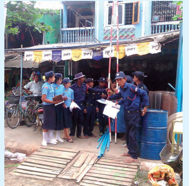
ပဲခူးတိုင်းဒေသကြီး ကျောက်တံခါးမြို့နယ် မီးသတ်ဦးစီးဌာနမှ အရန်မီးသတ်တပ်ဖွဲ့ဝင်များ မတ် ၁၂ ရက်က မီးဘေးအန္တရာယ် ကြိုတင်ကာကွယ်တားဆီးနိုင်ရေးအတွက် ရပ်ကွက်များအတွင်း လိုက်လံ စစ်ဆေးစဉ်။ ခင်ကို(ကျောက်တံခါး)

စစ်ကိုင်းတိုင်းဒေသကြီး ခင်ဦးမြို့နယ် မြန်မာ့လယ်ယာဖွံ့ဖြိုးရေးဘဏ်မှ နွေစပါး စိုက်ပျိုးစရိတ်ချေးငွေများကိုမတ် ၉ ရက်က စတင် ထုတ်ချေးပေးလျက်ရှိရာ အုပ်စုနှစ်အုပ်စုထုတ်ချေးပေးပြီးကြောင်းသိရသည်။ အဆိုပါချေးငွေထုတ်ချေးရာတွင် ၂၀၁၅ မိုးသီးနှံစုံ ချေးငွေပြေကျေမှု ထုတ်ချေးပေးသွားမည်ဖြစ်ကြောင်း၊ ၆၃ အုပ်စုတွင် ၁၃ အုပ်စုသာချေးငွေ ပြေကျေသေးသည့်အတွက် ချေးငွေကြေးကျန်မှာ ၁၇၁၈ ဒဿမ ၄၂ သန်းကျန်ရှိကြောင်း၊ ချေးငွေပြေကျေသည့် ရာခိုင်နှုန်း မှာ ၈၁ ဒဿမ ၀၆ ရာခိုင်နှုန်းရှိကြောင်း၊ အပြေအကျေဆပ်ထားသော တောင်သူများကိုသာ ချေးငွေများထုတ်ချေးသွားမည်ဖြစ်ကြောင်း မြို့နယ်မန်နေဂျာ ဒေါ်အေးအေးခိုင်က ပြောသည်။ ခင်ဦးစိုးဝေ