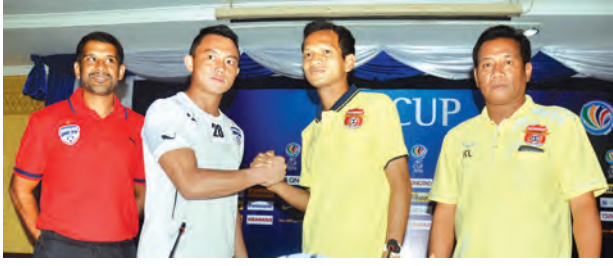
ဧရာဝတီအသင်းနှင့် ဘင်ဂါလူရှူးအသင်းနည်းပြနှင့် ကစားသမားများ အား ပွဲကြိုသတင်းစာရှင်းလင်းပွဲ၌ တွေ့ရစဉ်။