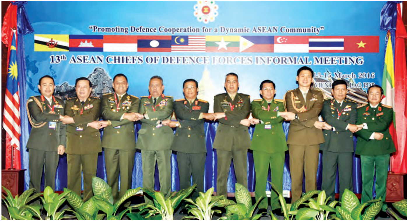
(၁၃)ကြိမ်မြောက် အာဆီယံတပ်မတော်ကာကွယ်ရေးဦးစီးချုပ်များ အလွတ်သဘောအစည်းအဝေး (13 th ACDIFIM) သို့ တက်ရောက်လာသော အာဆီယံနိုင်ငံများမှ တပ်မတော်အကြီးအကဲများ စုပေါင်းမှတ်တမ်းတင်ဓာတ်ပုံရိုက်စဉ်။