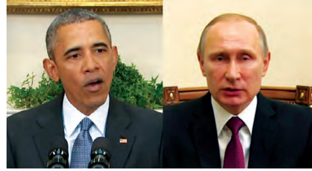
၁မတ်စကတ် မတ် ၁၅ ဆီးရီးယားပြည်တွင်းစစ် အဆုံးသတ်ရန်အတွက် ဆီးရီးယားသမ္မတ ဘတ်ရှာအယ်လ်အာဆင်စုကို ရာထူးမှ ဖယ်ရှားရမည်ဖြစ်ကြောင်း အမေရိကန်သမ္မတ ဘားရက်အိုဘားမားက ပူတင်အား ပြောခဲ့သည်။

ပြောကြားခဲ့သည်။ ရုရှားသမ္မတ ပူတင်အနေဖြင့် ဆီးရီးယားမှ ရုရှားတပ်ဖွဲ့ဝင် တစ်စိတ်တစ်ပိုင်းကို ရုပ်သိမ်းမည် ဖြစ်ကြောင်း ရုရှားသမ္မတရုံးက ပြောခဲ့သည်။ တစ်ဦးကိုတစ်ဦး ယုံကြည်ခြင်းသည် ဆီးရီးယား ပဋိပက္ခတွင် ပါဝင်သည့်အဖွဲ့အစည်း အားလုံးအတွက် အပြုသဘောဆောင် သည့် အချက်ပြုမှုပင်ဖြစ်သည်ဟု ရုရှားသမ္မတက ပြောခဲ့ပြီး အမှန်စင်စစ် အပစ်ရပ်စဲရေးလုပ်ငန်း စဉ်များကို လုပ်ဆောင်ရန်အတွက် မှန်ကန်သော အခြေအနေများကို ဖန်တီးပေးရမည်ဖြစ်ကြောင်း ၎င်းက ဆက်လက်ပြောကြားခဲ့သည်။ အမေရိကန်သမ္မတ အနေဖြင့် လည်း ဖေဖော်ဝါရီ ၂၇ ရက်ကတည်းက စတင်အကျိုးသက်ရောက်ခဲ့ သည့် ဆီးရီးယားအပစ်ရပ်စဲရေး ကြောင့် အကြမ်းဖက်မှုများလျော့ကျ လာခြင်းကို ဝမ်းမြောက်ဝမ်းသာ ကြိုဆိုကြောင်း အိမ်ဖြူတော်က ပြော ကြားခဲ့သည်။ သို့သော်လည်း အစိုးရတပ်ဖွဲ့များ ၏ ထိုးစစ်ဆင်မှုများကြောင့် ဆီးရီး ယားငြိမ်းချမ်းရေးနှင့် ကုလသမဂ္ဂ ဦးဆောင်သော နိုင်ငံရေးလုပ်ငန်း စဉ်များ အနှောင့်အယှက်ဖြစ်မည်ကို စိုးရိမ်ကြောင်း ၎င်းကပြောကြား ခဲ့သည်။ (အင်န်အိတ်ချ်ကေ)