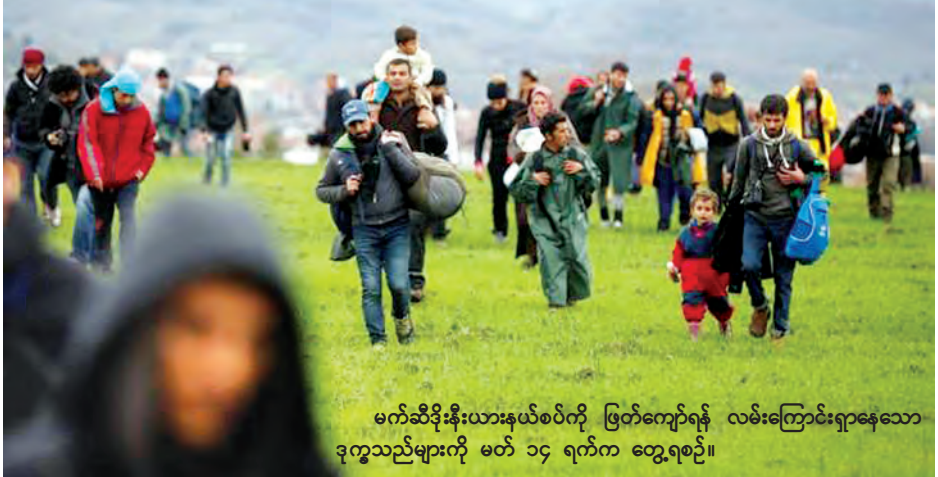
မက်ဆီဒိုးနီးယားနယ်စပ်ကို ဖြတ်ကျော်ရန် လမ်းကြောင်းရှာနေသော ဒုက္ခသည်များကို မတ် ၁၄ ရက်က တွေ့ရစဉ်။

နီးယား လုံခြုံရေးတပ်ဖွဲ့များက အသုတ်ကို မက်ဆီဒိုးနီးယားသို့ ဖြတ်ကျော်ဝင်ရောက်ခွင့်ကို ပိတ်ခဲ့ သောကြောင့် ၎င်းတို့သည် ဂရိ တောင်ကုန်းများကြားတွင် စခန်းချခဲ့ ရကြောင်း ရိုက်တာ ဓာတ်ပုံသတင်း ထောက်တစ်ဦးက ပြောသည်။ (ရိုက်တာ)