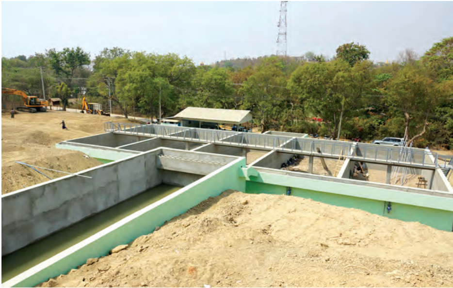
မင်းဘူးမြို့ တိုးချဲ့ရေပေးရေးအတွက် ဆောင်ရွက်နေသောလုပ်ငန်းများ ပြီးစီးနေမှုကို မတ် ၁၄ ရက်က တွေ့ရစဉ်။

မင်းဘူးမြို့ တိုးချဲ့ရေပေးရေးလုပ်ငန်းများ ဆောင်ရွက်