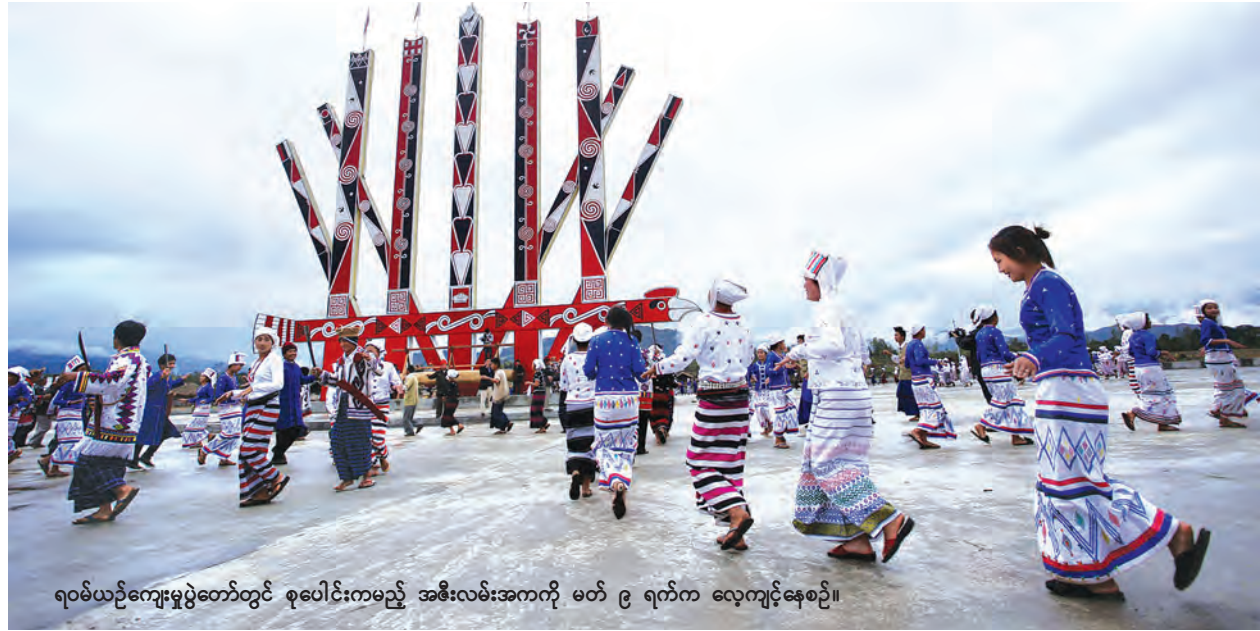
ရဝမ်ယဉ်ကျေးမှုပွဲတော်တွင် စုပေါင်းကမည့် အစီးလမ်းအကကို မတ် ၉ ရက်က လေ့ကျင့်နေစဉ်။

ဒဘူအီးခေါင်၏ အဓိပ္ပာယ်မှာ ဒဘူဆိုသည်မှာ ပျော်ရွှင်ခြင်း သို့မဟုတ် ကျေးဇူးတင်လို၍ ပျော်ရွှင် ခြင်း၊ ဝမ်းမြောက်ခြင်းဖြစ်ပြီး အီး ခေါင်ဆိုသည်မှာ စုပေါင်းကရသော အက(မနော)ဟူ၍ ဖြစ်ရာ ရဝမ် ယဉ်ကျေးမှုပွဲတော်(ဒဘူအီးခေါင်- ၂၀၁၆)က ရဝမ်လူမျိုးများ၏ ယဉ်ကျေးမှုနှင့် ရိုးရာဓလေ့များကို ပျော်ရွှင်စွာ ဖော်ထုတ်ပြသမည့် တိုင်းရင်းသားတို့၏ ပွဲတော်တစ်ရပ် ဖြစ်ရာ စုပေါင်းဆင်နွှဲခွင့်ရတော့ မည်ဖြစ်သည်။ မောင်မောင်မြင့်ဆွေ ဓာတ်ပုံ-တင်စိုး(မြန်မာ့အလင်း)