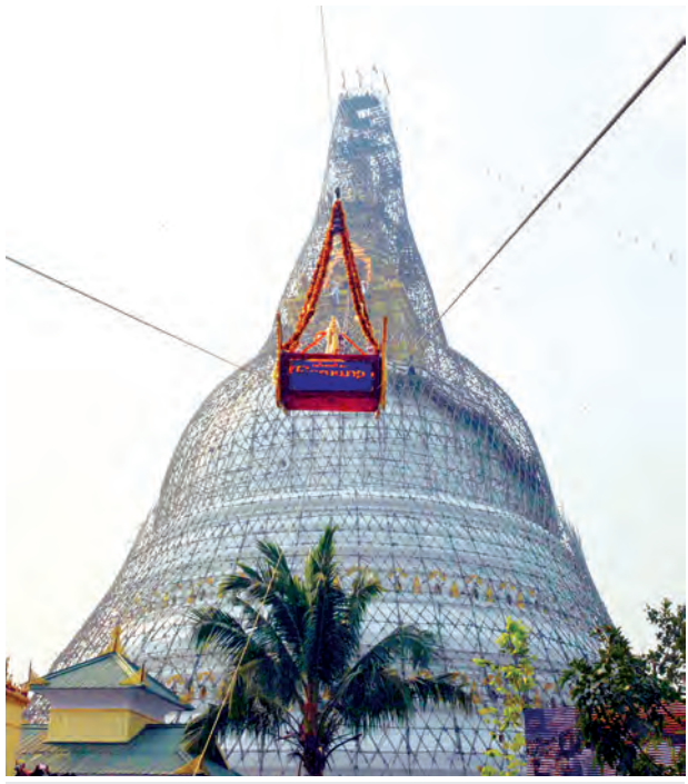
နိုင်ငံတော်သမ္မတ ဦးသိန်းစိန်နှင့် ဧည့်ပရိသတ်များ ထူပါရုံစေတီတော်မြတ်ကြီးသို့ ရတနာစိန်ဖူးတော်နှင့် ငှက်မြတ်နားတော်တို့ကို မင်္ဂလာရထားပျံဖြင့် တင်လှူပူဇော်ကြစဉ်။ (ဓာတ်ပုံ-သတင်းစဉ်)

နိုင်ငံတော်သမ္မတအမျိုးပြုသော ပရိသတ်များက ကိုးပါးသီလခံယူဆောက်တည်ကြသည်။ ယင်းနောက် နိုင်ငံတော်သမ္မတအမျိုးပြုသောပရိသတ်များက ရတနာစိန်ဖူးတော်နှင့် ငှက်မြတ်နားတော်တို့ကို ဗုဒ္ဓရုပ်ပွားတော်မြတ်ကြီးအား ဆက်ကပ်လှူဒါန်းကြသည်။ ဆက်လက်၍ နိုင်ငံတော်သမ္မတက သီတဂူဆရာတော်ထံ လှူဖွယ်ပစ္စည်းများဆက်ကပ်လှူဒါန်းပြီး ပရိသတ်များက ဆရာတော် သံဃာတော်များထံ လှူဖွယ်ပစ္စည်းများကို ဆက်ကပ်လှူဒါန်းကြသည်။ ထို့နောက် နိုင်ငံတော်သမ္မတအမျိုးပြုသောပရိသတ်များက သီတဂူဆရာတော်ထံမှ အနုမောဒနာတရားနာကြားကြပြီး လှူဒါန်းမှုအစုစုအတွက်