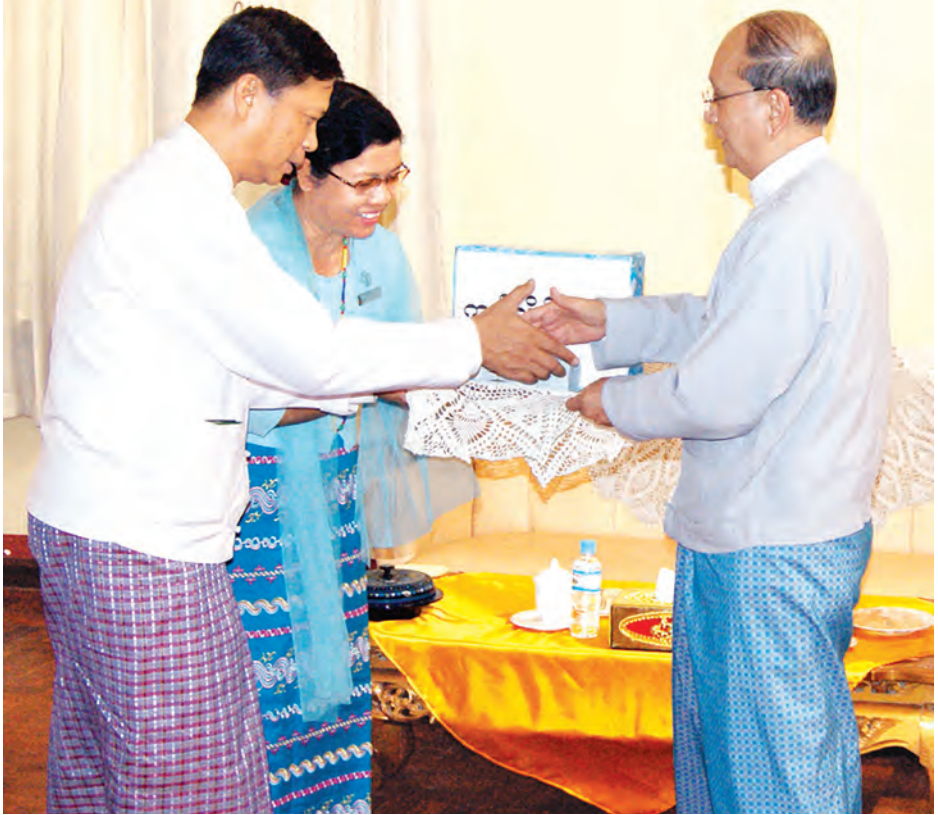
နိုင်ငံတော်သမ္မတ ဦးသိန်းစိန် ပြည်ထောင်စုတိုင်းရင်းသားလူမျိုးများ ဖွံ့ဖြိုးရေးတက္ကသိုလ်နှင့် ပြည်ထောင်စုတိုင်းရင်းသားလူမျိုးများ စွမ်းရည်ဖွံ့ဖြိုးရေးဒီဂရီကောလိပ်တို့အတွက် ထောက်ပံ့ငွေ ကျပ်သိန်း ၅၀ စီကို တာဝန်ရှိသူများထံ ပေးအပ်စဉ်။

တိုင်းရင်းသား လူမျိုးပေါင်း ၉၂ မျိုး ပါဝင်နေသည်ကို တွေ့ရှိရမည် ဖြစ်ပါကြောင်း။ ဤကျောင်းတော်ကြီးက မွေးထုတ်ပေးလိုက်သည့် ဖွံ့ဖြိုးရေး တက္ကသိုလ်ဆင်း လူငယ်များသည် သက်ဆိုင်ရာဒေသများတွင် ပညာရေးဝန်ထမ်းများအဖြစ် မျိုးဆက် သစ်လူငယ်များကို ပြုစုပျိုးထောင်ပေးခဲ့ကြပါကြောင်း၊ ယနေ့အချိန်တွင် ဤကျောင်းတော်ကြီးမှ မွေးထုတ်ပေးလိုက်သည့် လူငယ်များသည် ပြည်သူ့လွှတ်တော်၊ အမျိုးသားလွှတ်တော်၊ တိုင်းဒေသကြီး လွှတ်တော်နှင့် ပြည်နယ် လွှတ်တော်များတွင် လွှတ်တော်ကိုယ်စားလှယ်များအဖြစ် ဒီမိုကရေစီ ကူးပြောင်းရေးတွင် အရေးကြီးသည့် အခန်းကဏ္ဍများ၌ တာဝန်ထမ်းဆောင် နေကြသည်ကို လည်း ဂုဏ်ယူဝမ်းမြောက်ဖွယ်ရာ တွေ့မြင်နေရပြီ ဖြစ်ပါကြောင်း၊ ဤကျောင်းတော်ကြီးက မွေးထုတ်ပေးလိုက်သည့် လူငယ်များကို ဒေသဆိုင်ရာ ပြည်သူ့လူထုက မည်မျှ အထိ ယုံကြည် အားကိုးကြသည်ကို လွှတ်တော်ကိုယ်စားလှယ်များအဖြစ် ရွေးချယ်တင်မြှောက်နေကြသည်ကို ကြည့်ခြင်းအားဖြင့် ထင်ရှားစွာ တွေ့မြင်နိုင်ပါကြောင်း၊ အမိ