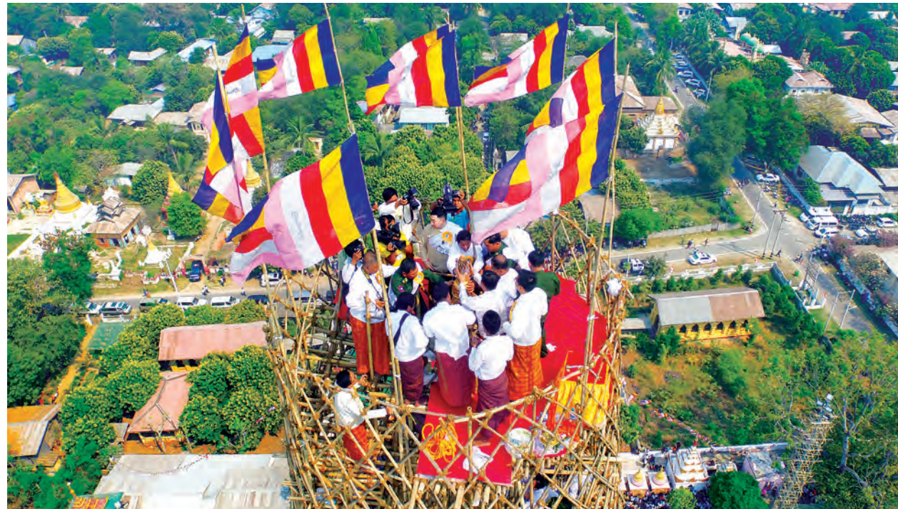
ရတနာစိန်ဖူးတော်၊ ငှက်မြတ်နားတော်တို့ကို တာဝန်ရှိသူများက ထူပါရုံစေတီတော်မြတ်ကြီးအထွတ်၌ တင်လှူပူဇော်စဉ်။

သီတဂူသာသနာပြုအဖွဲ့မှ သိရသည်။ “ဟောင်းနွမ်း ပျက်စီးတဲ့အရာတွေ ပြင်ဆင်တဲ့လုပ်ငန်းကို ဘုရားအဆုတ်တို့ ချီးမွမ်းတော်မူ၏” လို့ ရှင်မဟာကဿပမထေရ်မြတ် မိန့်ကြားအပ်ဖူးပါတယ်။ ဘာသာရေးနဲ့ ယဉ်ကျေးမှုအမွေအနှစ်တွေကို ထိန်းသိမ်းစောင့်ရှောက်ဖို့အတွက်နဲ့ နိုင်ငံသားတွေရဲ့လက်သိက္ခာကို စောင့်ရှောက်ထိန်းသိမ်းဖို့ ရည်ရွယ်ပြီး အင်းဝဘုရင်ကြီး နရပတိတည်ထားကိုးကွယ်တဲ့ ထူပါရုံစေတီတော်မြတ်ကြီးဟောင်းနွမ်းပျက်စီးနေတာကို မွမ်းမံပြုပြင်ခဲ့ခြင်းဖြစ်တယ်” ဟု သီတဂူဆရာတော်က အခမ်းအနားတွင် မိန့်ကြားသည်။