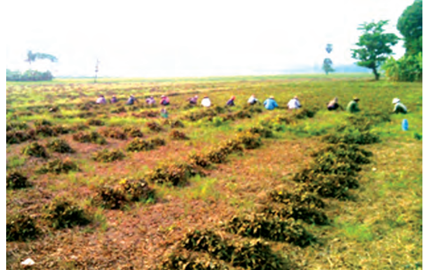
ယာခင်းတစ်ခုတွင် အလုပ်လုပ်နေသော လုပ်သားများ။

ထို့အတူ ရေတာရှည်မြို့နယ်အတွင်း ရန်ကုန်- မန္တလေးကားလမ်း အဆင့်မြင့်တင်မှုလုပ်ငန်းခွင် တွင် လုပ်ကိုင်ကြသော အလုပ်သမားများမှာလည်း အပူချိန်မြင့်တက်မှုကြောင့် အတော်ကို ဒုက္ခရောက်ကြရ ကြောင်း ကိုယ်တိုင်ကြုံခဲ့ရသူ တစ်ဦးကပြောသည်။ “ကျွန်တော်တို့ လမ်းအလုပ်သမားအတွေ့အနေနဲ့ ကိုယ့်နေ့စားခလေးရဖို့ရာ နေပူကြီးထဲမှာ အလုပ် လုပ်ကြရတာ အရမ်းပင်ပန်းပါတယ်။ ဒီကြားထဲ