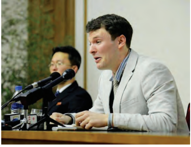
သတင်းစာရှင်းလင်းပွဲ၌ ပြောကြားနေသည့် အမေရိကန်ကျောင်းသားကို ဖေဖော်ဝါရီ ၂၉ ရက်က မြောက်ကိုရီးယားနိုင်ငံပိုင်သတင်းတွင် ဖော်ပြစဉ်။

၎င်းသည် မြောက်ကိုရီးယားသို့ နှစ်သစ်ကူးခရီးသွားအဖွဲ့နှင့် သွားရောက်ခဲ့ရာ နောက်ဆုံးနေ့တွင် လေဆိပ်လူဝင်မှုကြီးကြပ်ရေးဌာန၌ တားဆီးခံရကာ သက်ဆိုင်ရာအရာရှိများက လာရောက်ခေါ်ဆောင်သွားခဲ့ကြောင်း အဆိုပါ ခရီးစဉ်သူ ခရီးသွားအဖွဲ့က ပြောခဲ့သည်။ (ရိုက်တာ)