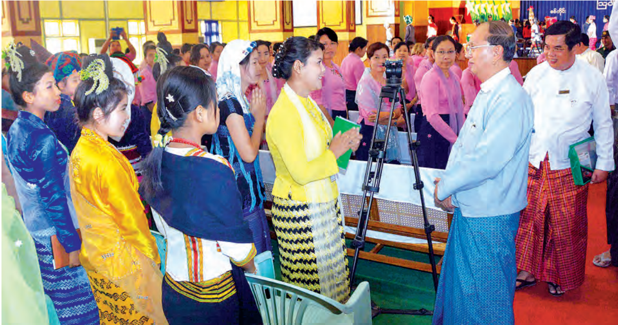
နိုင်ငံတော်သမ္မတ ဦးသိန်းစိန် စစ်ကိုင်းမြို့ ရွာသစ်ကြီး ပြည်ထောင်စုတိုင်းရင်းသားလူမျိုးများဖွံ့ဖြိုးရေးတက္ကသိုလ်မှ ဆရာ ဆရာမများ၊ ကျောင်းသား ကျောင်းသူများအား ရင်းရင်းနှီးနှီးနှုတ်ဆက်စဉ်။ (သတင်းစဉ်)

မိမိတို့နိုင်ငံတော်၊ မိမိတို့ ပြည်ထောင်စု၏သမိုင်းကို ပြန်ကြည့် ပါက ခေတ်အဆက်ဆက်မည်မျှပင် ကမ္ဘာ့အခြေအနေများ ပြောင်းလဲခဲ့ သော်လည်း အစဉ်အမြဲမပြောင်းလဲ သည့် ပြည်ထောင်စုစိတ်ဓာတ်ကို အရင်းတည်ပြီး တည်ဆောက်ထားခဲ့ သည်ကို သိရှိထားပြီးဖြစ်ပါကြောင်း၊ ပြည်ထောင်စု၏ မည်သည့်အရပ် ဒေသတွင် နေထိုင်သည်ဖြစ်စေ၊ ဥပမာအားဖြင့် မပျက် နေထိုင်သွားလို