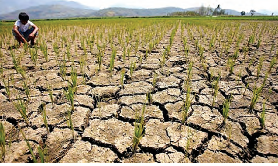
၂၀၀၉ ခုနှစ် အယ်နီညီရိုက်ခတ်ခံရသော အိန္ဒိယနိုင်ငံမှ လယ်ယာတစ်ခု။

ပြည်သူ့ဆေးရုံကြီးများ၊ ဆေးခန်းများ၊ ဒေသန္တရကျန်းမာရေးဌာနများ၊ ကျေးရွာဆေးပေးခန်းများ စသည်တို့၌လည်း အပူဒဏ်လွန်ကဲမှုကြောင့် ဖြစ်ပွားတတ်သော ရောဂါဝေဒနာအမျိုးမျိုးကို ကုသပေးနိုင်မည့် ဆေးဝန်ထမ်းများ၊ ဆေးဝါးများ၊ အထောက်အကူပြုပစ္စည်းများ၊ လျှင်မြန်စွာ ကယ်တင်ကုသနိုင်မည့် ကုထုံးများ စသည်တို့ကို အရန်သင့်ထားရှိပေးရန် လိုအပ်သလို... ကုသရမည့် ကုထုံးအဆင့်ဆင့်ကိုလည်း အများပြည်သူ ထင်သာမြင်သာရှိအောင် နံရံကပ်ပို့စတာများကပ်ထားခြင်းဖြင့် အသိပညာပေးရမည်ဖြစ်သည်။