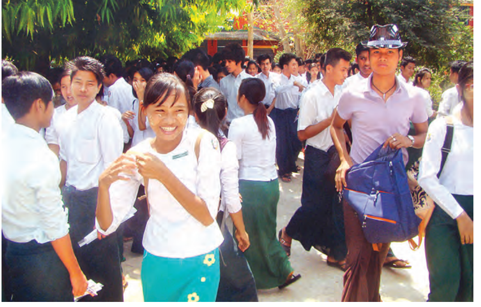
တက္ကသိုလ်ဝင်စာမေးပွဲ သိပ္ပံဘာသာတွဲ နောက်ဆုံးနေ့အဖြစ် ဇီဝဗေဒဘာသာရပ်ဖြေဆိုပြီး ပြန်လည်ထွက်လာသော အထက(၁) ကြည့်မြင်တိုင်စာဖြေဌာနမှ ကျောင်းသား ကျောင်းသူများကို တွေ့ရစဉ်။