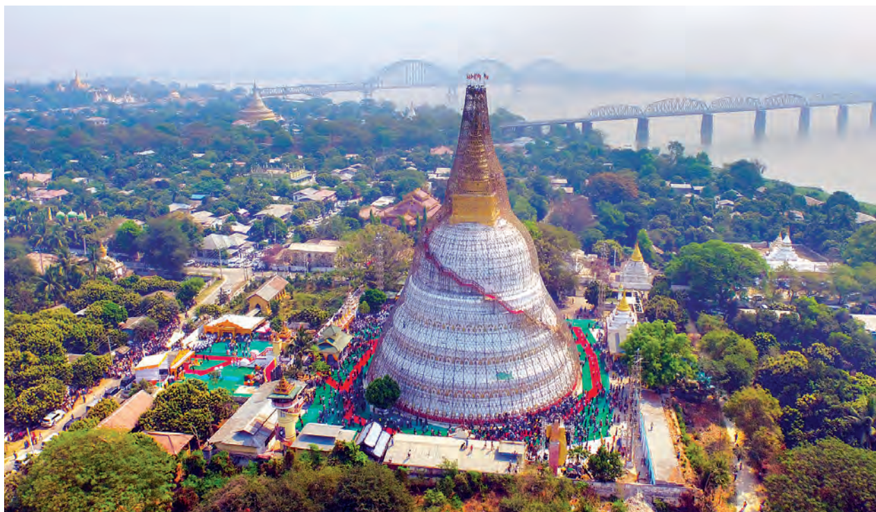
ထူပါရုံစေတီတော်မြတ်ကြီး စိန်ဖူးတော်တင် မဟာမင်္ဂလာအခမ်းအနားကျင်းပနေမှုကို စစ်ကိုင်းမြို့နောက်ခံအလှူရှင်နှင့် တွေ့ရစဉ်။

သီဟိုဠ်ကျွန်းက ထူပါရုံစေတီတော်ကြီး နည်းတူ ပုံစံတူပြန်ပြီးဖော်ဆောင်တာလည်း ဖြစ်ပါတယ်။ မူလစေတီတော်ကိုမဖျက်ဘဲနဲ့ အပြင်ဘက်ကနေငုံပြီး တည်ခဲ့တာဖြစ်လို့ အကုန်အကျလည်း အတော်များခဲ့ရတာဖြစ်ပါတယ်။ အချိန်ကာလအားဖြင့်တော့ သုံးနှစ်ကျော် ကြာမြင့်ခဲ့တယ်” ဟု စစ်ကိုင်းသီတဂူကမ္ဘာ့ဗုဒ္ဓတက္ကသိုလ်မှ သီတဂူဆရာတော်၏ လက်ထောက် ဆရာတော် အရှင်ဒေါက်တာ သုန္ဒရက မိန့်ကြားသည်။ ထူပါရုံစေတီတော်မြတ်ကြီး၏ မူလအစဓါယကာသည် အင်းဝဘုရင် နရပတိမင်းဖြစ်ပြီး သက္ကရာဇ် ၈၀၆ ခုနှစ်တွင် သီဟိုဠ်ကျွန်းမှ ပင့်ဆောင်လာခဲ့သည့် မြတ်စွာဘုရားဓာတ်တော်၊ မွေတော်များကို ဌာပနာထည့်သွင်းကာ တည်ထားပူဇော်ခဲ့ခြင်းဖြစ်သည်။ နရပတိမင်းသည် ဒုတိယ စစ်ကိုင်းမြို့ကို တည်ထောင်မင်းပြုခဲ့သူဖြစ်ပြီး စစ်ကိုင်းမြို့၌ ခြောက်နှစ်ခန့်နန်းစံကာ သက္ကရာဇ် ၉၁၃ ခုနှစ်တွင် နရပတိအမည်ဖြင့် အင်းဝသို့ ပြောင်းရွှေ့မင်းပြုခဲ့သည်။ သီဟိုဠ်ကျွန်း မဟိယင်္ဂါအရပ်မှသံဃာတော်များသည် မြန်မာနိုင်ငံသို့ လာရောက်သာသနာပြုခဲ့ကြသည်။ ထိုမင်းလက်ထက်တွင် သီဟိုဠ်ကျွန်းသို့