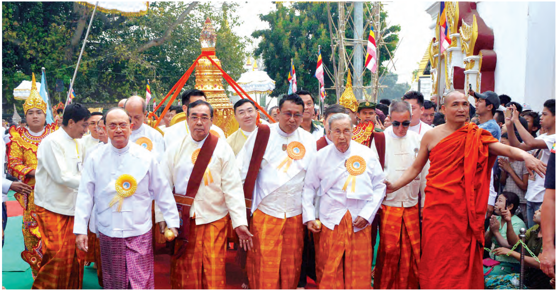
နိုင်ငံတော်သမ္မတ ဦးသိန်းစိန်နှင့် ပရိသတ်များ ရတနာစိန်ဖူးတော်နှင့် ငှက်မြတ်နားတော်တို့ကို ပင့်ဆောင်ပူဇော်ကြပြီး စေတီတော်အား လက်ယာရစ်လှည့်လည်ပူဇော်စဉ်။ (သတင်းစဉ်)