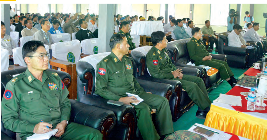
နိုင်ငံတော်သမ္မတ ဦးသိန်းစိန် တွေ့ဆုံပွဲအခမ်းအနား၌ အမှာစကားပြောကြားစဉ်။

အခမ်းအနားတွင် ပြည်နယ် ဝန်ကြီးချုပ်က ကချင်ပြည်နယ် ဖွံ့ဖြိုးတိုးတက်ရေးအတွက် ပညာ ရေး၊ ကျန်းမာရေး၊ လမ်းပန်းဆက်သွယ် ရေး၊ သောက်သုံးရေရရှိရေးနှင့်