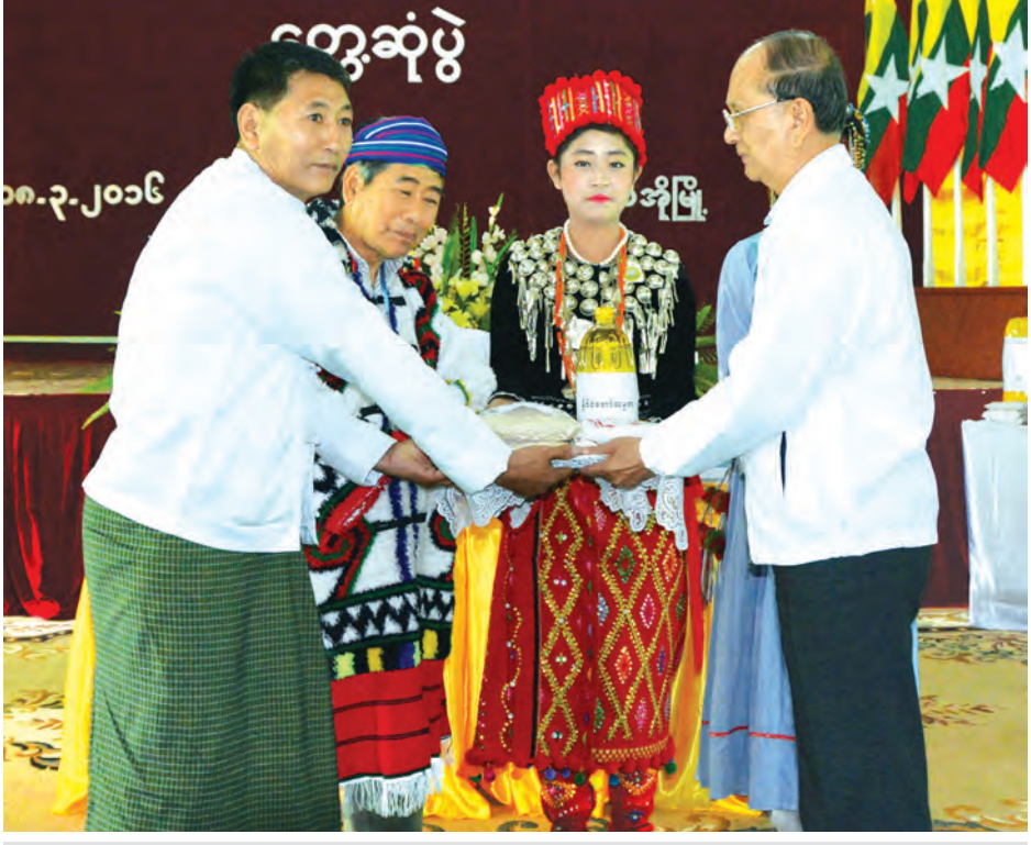
နိုင်ငံတော်သမ္မတ ဦးသိန်းစိန် ပူတာအိုခရိုင်အတွင်းရှိ ဘာသာရေးအဖွဲ့နှင့် ရိုးရာအဖွဲ့များအား ဆန်နှင့်ဆီများ ထောက်ပံ့ပေးအပ်စဉ်။

အခြေခံလိုအပ်ချက်များကို ဖြည့် ဆည်းဆောင်ရွက်ပေးခဲ့မှု၊ ဆက်လက် ဆောင်ရွက်ပေးမည့်အစီအစဉ်များ နှင့် လိုအပ်ချက်များကို ရှင်းလင်း တင်ပြသည်။