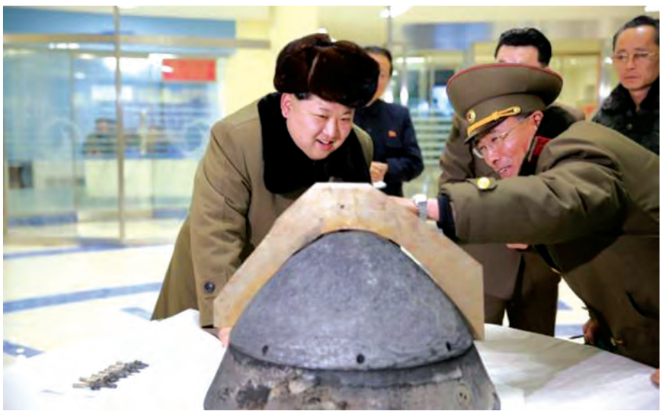
၁၇ကီလိုမီတာအရောက်တွင် ရေခါမှ ပျောက်ကွယ်သွား ကြေညာချက်တွင် ထပ်မံဖော်ပြခဲ့သည်။ (ရိုက်တာ)

တွင် မြောက်ကိုရီးယားနိုင်ငံ၏ နျူကလီးယားစမ်းသပ်မှု အပေါ်ပြုလုပ်ခဲ့သော အရေးယူပိတ်ဆို့မှုများကို မြောက် ကိုရီးယားနိုင်ငံအနေဖြင့် မသိကျိုးကျွန်ပြုခဲ့ပြီးနောက် ကိုရီးယားကျွန်းဆွယ်အရေးတင်းမာမှု ဖြစ်ပေါ်လာချိန် တွင် မြောက်ကိုရီးယားနိုင်ငံက ခုံးကျည်စမ်းသပ်ပစ်လွှတ် လိုက်ခြင်းဖြစ်ကြောင်းသိရသည်။ ထို့ကြောင့် ယခုအပတ် တွင် အမေရိကန်က မြောက်ကိုရီးယားနိုင်ငံအပေါ် အရေးယူပိတ်ဆို့မှုအသစ်များ ထပ်မံပြုလုပ်မည်ဖြစ် ကြောင်း ကြေညာချက်ထုတ်ပြန်ခဲ့သည်။ မြောက်ကိုရီးယားမြို့တော် ပြုယမ်းအနောက်ဘက်မှ ပစ်လွှတ်လိုက်သော ယင်းခုံးကျည်သည် ကိုရီးယား ကျွန်းဆွယ်ကိုဖြတ်၍ မတ် ၁၈ ရက် နံနက်အစောပိုင်း တွင် အရှေ့ဘက်ကမ်းရိုးတန်းကမ်းလွန်ပင်လယ်ပြင်ထဲ သို့ ကျရောက်ခဲ့ကြောင်း တောင်ကိုရီးယားစစ်ဘက်ဆိုင်ရာ ၏ ထုတ်ပြန်ကြေညာချက်တွင် ဖော်ပြခဲ့သည်။ မြောက်ကိုရီးယားနိုင်ငံက ပထမအကြိမ် ခုံးပုံ ပစ်လွှတ်လိုက်သောနေရာမှ ခုံးပုံပစ်လွှတ်စမ်းသပ်ပြီး မကြာမီ ဒုတိယမြောက်ခုံးကျည်ကို ထပ်မံပစ်လွှတ်စမ်းသပ် ခဲ့ကြောင်း သိရသည်။ ယင်းခုံးကျည်သည် ပစ်လွှတ်ပြီး