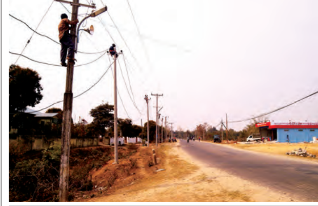
ကချင်ပြည်နယ် ဗန်းမော်မြို့နယ် လျှပ်စစ်အင်ဂျင်နီယာနှင့်အဖွဲ့သည် ပြည်သူများမှ လျှပ်စစ်ဓာတ်အားအပြည့်အဝအသုံးချနိုင်ရေး၊ လျှပ်စစ်အန္တရာယ် ကင်းရှင်းစေရေးအတွက် အောင်သာရပ်ကွက်၊ ဗန်းမော်-မိုးမောက်ကားလမ်း တွင် လက်ရှိ ၁၀ မီတာရှိ ကွန်ကရစ်တိုင်များ၌ စိုက်ထူခြင်းနှင့် ကြံ့ခိုင်မှု အားနည်းသော လက်ရှိလျှပ်စစ်မီးကြိုးများ အစားထိုးတပ်ဆင်ခြင်းကို မတ် ၁၇ ရက်က ဆောင်ရွက်နေစဉ်။ ဆီမီးခုံ- နန်းရီ

နေပြည်တော် မတ် ၁၈ မြန်မာနိုင်ငံရှိ တောင်သူလယ်သမားများ၏ စီမံကိန်းဝင်ရာသီစိုက်ပျိုး သီးနှံများ ရာသီဥတုဖောက်ပြန်၍ ဆုံးရှုံးမှုဖြစ်ပေါ်လျှင် အာမခံလျော်ကြေး ရရှိနိုင်ရန်နှင့် သီးနှံအာမခံလုပ်ငန်းစနစ် ထူထောင်နိုင်ရန်အတွက် လယ်ယာ စိုက်ပျိုးရေးနှင့် ဆည်မြောင်းဝန်ကြီးဌာန၊ ဘဏ္ဍာရေးဝန်ကြီးဌာနတို့၏ အကူအညီဖြင့် ပထမအကြိမ် စိုက်ပျိုးသီးနှံများ အာမခံထားရုံရေးအလုပ်ရုံ ဆွေးနွေးပွဲကို မတ် ၂၂ ရက်တွင် နေပြည်တော် (Hotel Grand Amara) ၌ ကျင်းပမည်ဖြစ်သည်။ ဆွေးနွေးပွဲတွင် လယ်ယာစိုက်ပျိုးရေးနှင့် ဆည်မြောင်းဝန်ကြီးဌာန၊ ဘဏ္ဍာ ရေးနှင့် အခွန်ဝန်ကြီးဌာန၊ မိုးလေဝသနှင့် မြန်မာ့အာမခံကုမ္ပဏီများ၊ တောင်သူလယ်သမား ကိုယ်စားလှယ်များနှင့်တကွ အိန္ဒိယနိုင်ငံမှ Basis အသေးစားငွေချေးလုပ်ငန်း၊ Weather risk management company၊ လယ်ယာသီးနှံအာမခံကုမ္ပဏီများမှ ပညာရှင်များ ပါဝင်ဆွေးနွေးကြမည် ဖြစ်ရာ တက်ရောက်လိုသူများအနေဖြင့် ဦးမူရာကာ ဖုန်း-၀၉-၅၂၃၁၅၇၄ သို့ ဆက်သွယ်နိုင်ကြောင်း သိရသည်။ (မြန်မာ့အလင်း)