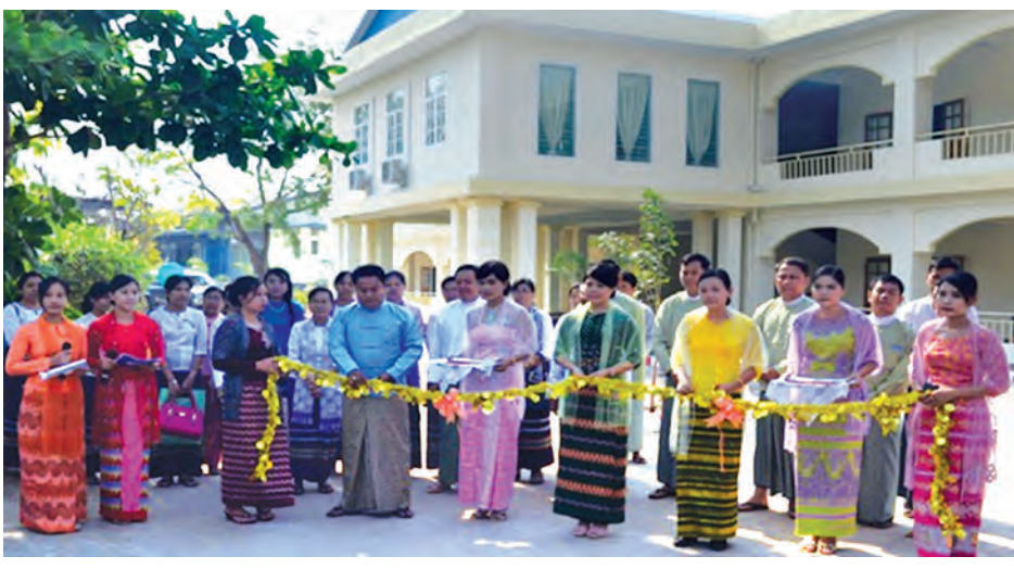
တန်းသူများက ဖဲကြိုးဖြတ်ဖွင့်လှစ်ပေးကြသည်။ (အပေါ်ပုံ) ထိုကဲ့သို့ ဖွင့်လှစ်ခွင့်ရကြောင်း သတင်းရရှိသည်။ (သတင်းစဉ်)

နိုင်ငံတော်၏ သားငါးကဏ္ဍနှင့် ကျေးလက်ဒေသ ဖွံ့ဖြိုးရေးအတွက် လူ့စွမ်းအားအရင်းအမြစ်များ မွေးထုတ်ပေးလျက်ရှိသည်။ မွေးမြူရေးဆိုင်ရာ ဆေးတက္ကသိုလ်၌ အာစီ နှစ်ထပ် လက်တွေ့စာသင်ဆောင် သစ်နှင့် E-Library အဆောက်အအုံသစ်ဖွင့်ပွဲ အခမ်းအနားကို ယနေ့နံနက် ၉ နာရီက ကျင်းပသည်။