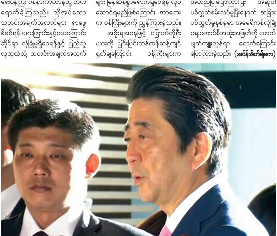
ရေးဝန်ကြီး ဖူမိအိုကူရိုဒါနှင့် ကာကွယ်

တိုကျို မတ် ၁၈ မြောက်ကိုရီးယားမှ နောက်ဆုံး အကြိမ် ခုံးကျည်ပစ်လွှတ်လိုက်မှု ကြောင့် ယင်းကိစ္စနှင့်ပတ်သက်ပြီး တောင်ကိုရီးယားနှင့် အမေရိကန်နိုင်ငံ တို့မှ သက်ဆိုင်ရာဝန်ကြီးများနှင့် တွေ့ဆုံညှိနှိုင်းရန် ဂျပန်ဝန်ကြီးချုပ် ရှင်ဒိုအာဘေးက ညွှန်ကြားခဲ့သည်။ ယနေ့အစောပိုင်းက နိုင်ငံ၏ အနောက်ဘက် ကမ်းရိုးတန်းဘက်မှ အရှေ့ပိုင်းကမ်းရိုးတန်းသို့ မြောက် ကိုရီးယား၏ ခုံးကျည်စမ်းသပ် ပစ်လွှတ်မှု ပြုလုပ်ခဲ့ပြီးနောက် သောကြာနေ့တွင် အမျိုးသားလုံခြုံ ရေးကောင်စီ အစည်းအဝေးတစ်ရပ် ကို ဂျပန်အစိုးရက ကျင်းပခဲ့ခြင်းဖြစ် သည်။ ယင်းပစ်လွှတ်လိုက်သော ခုံးကျည်သည် ဂျပန်ပင်လယ်ပြင်သို့ ကျရောက်သွားဖွယ်ရှိကြောင်း ခန့်မှန်း ရသည်။ အစည်းအဝေးသို့ ဝန်ကြီး ချုပ် ရှင်ဒိုအာဘေးနှင့်အတူ ဒုတိယ ဝန်ကြီးချုပ် တာရိုအေဆို၊ နိုင်ငံခြား ရေးဝန်ကြီး ဖူမိအိုကူရိုဒါနှင့် ကာကွယ်