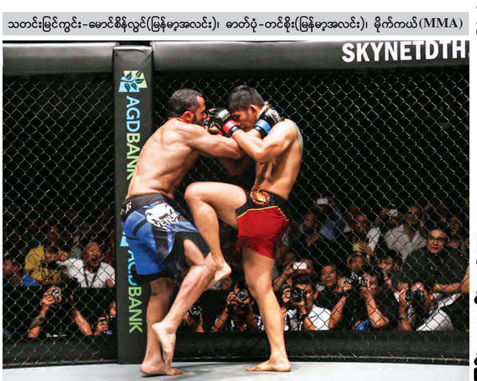
သတင်းမြင်ကွင်း-မောင်စိန်လွင်(မြန်မာ့အလင်း)၊ ဓာတ်ပုံ-တင်စိုး(မြန်မာ့အလင်း)၊ မိုက်ကယ်(MMA)

စာမျက်နှာ ၁၄ ကော်လံ ၁ ❖ မြန်မာစပါးကြီးမြေ အောင်လအန်ဆန်နှင့် အိဂျစ်နိုင်ငံသား မိုဟာမက်အလီတို့ ယှဉ်ပြိုင်ထိုးသတ်စဉ်။