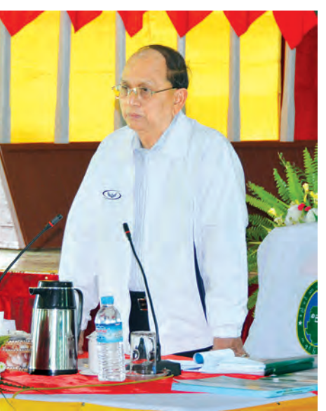
(သတင်းစဉ်)

ထုတ်လုပ် ဖြန့်ဖြူးနိုင်ရေးအတွက် လက်ခံရယူကြသည်။ ထို့နောက် ဒေသခံ မြို့မိမြို့ဖ