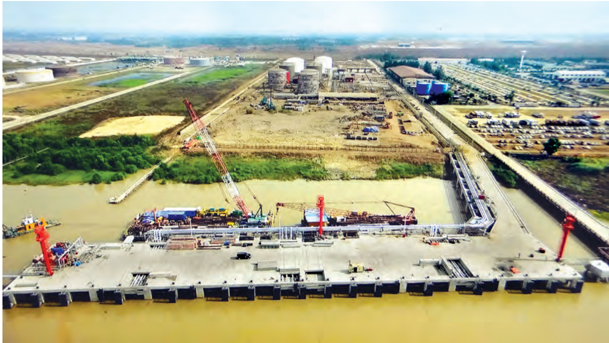
ရန်ကုန်မြို့၊ သီလဝါဆိပ်ကမ်း ကတ္တရာနှင့် ရေနံဆက်စပ်ပစ္စည်းများ တင်/ချ ဆိပ်ခံတံတားနှင့် သိုလှောင်ကန်များ တည်ဆောက်ပြီးစီးမှုကို တွေ့ရစဉ်။

သတင်း-မြင့်မောင်စိုး