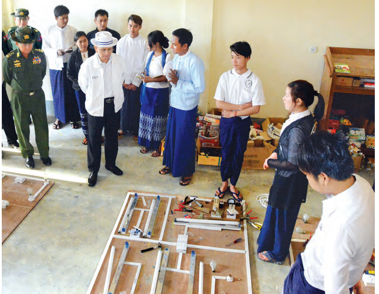
(သတင်းစဉ်)

ဒေသတစ်ခု ဖွံ့ဖြိုးတိုးတက်ရေးအတွက် အထူး လိုအပ်သည့်ကဏ္ဍများဖြစ်သော လမ်းပန်းဆက်သွယ် မှုကောင်းမွန်ရေး၊ လျှပ်စစ်မီးလုံလောက်စွာရရှိရေး၊ ကုန်ထုတ်လုပ်ငန်းများ လုပ်ကိုင်ဆောင်ရွက်နိုင်စွမ်း ရှိရေး၊ လူ့စွမ်းအားအရင်းအမြစ်များ ဖွံ့ဖြိုးတိုးတက် ရေးနှင့် ကျန်းမာရေးစောင့်ရှောက်မှုနှင့် အသိပညာ ပေးမှုလုပ်ငန်းများ ဆောင်ရွက်ရေးနှင့် ဒေသတည်ငြိမ် အေးချမ်းမှုနှင့် စည်းလုံးညီညွတ်မှုရှိရေးအတွက် ပြည်ထောင်စုစိတ်ဓာတ်ကို အရင်းခံပြီး တက်ညီ လက်ညီ ကြိုးပမ်းဆောင်ရွက်ကြရန် လမ်းညွှန်