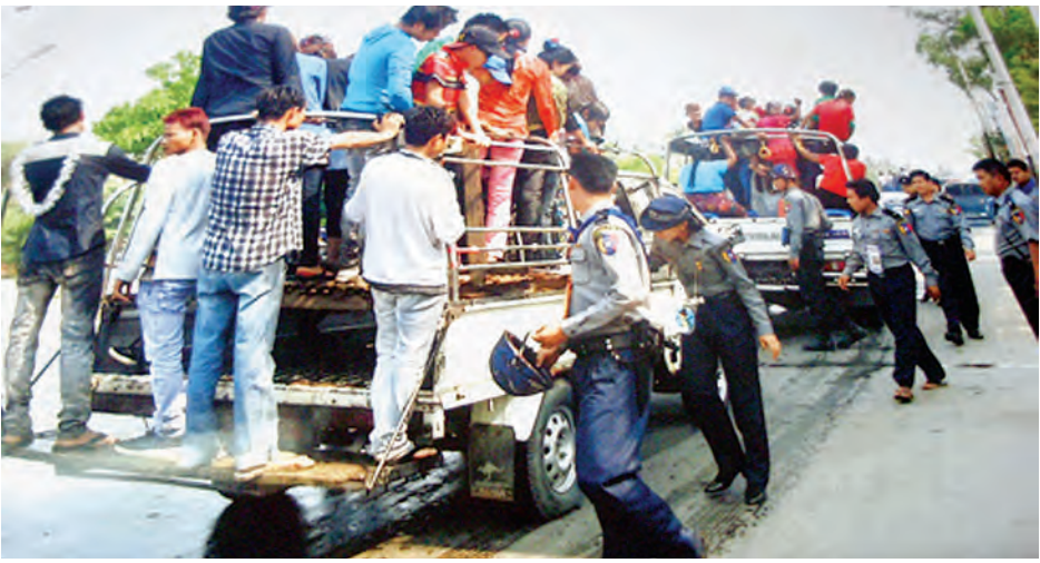
ယမန်နှစ် သင်္ကြန်ကာလက မန္တလေးမြို့၌ ရေပက်ခံကားများဖြင့် လျော်ပါးကြသည့် လူငယ်များကိုတွေ့ရစဉ်။