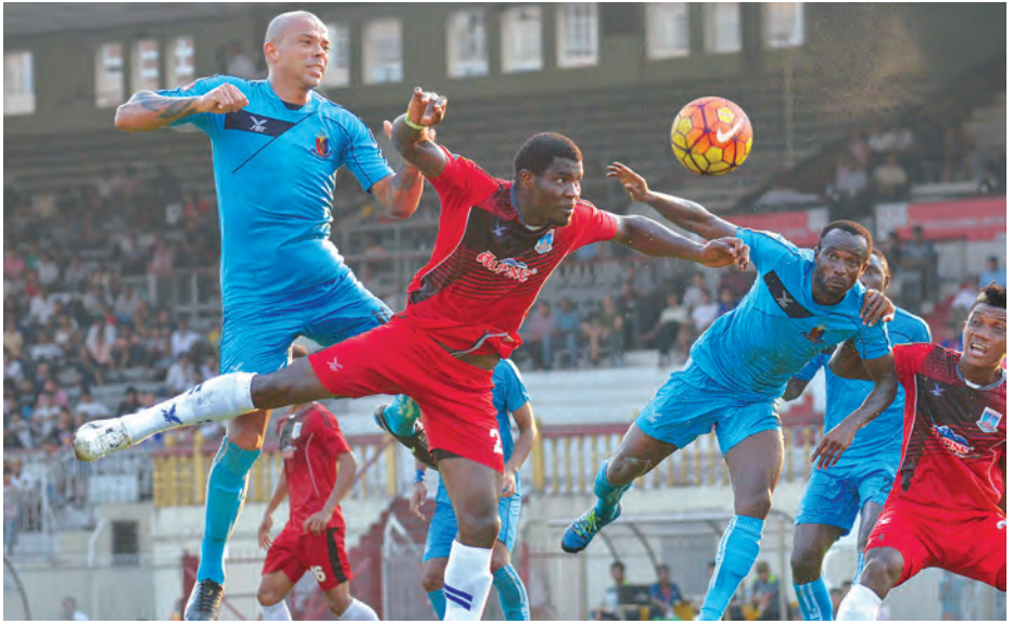
ရတနာပုံအသင်းနှင့် ဟံသာဝတီအသင်းတို့ အကြိတ်အနယ်ယှဉ်ပြိုင်နေစဉ်။