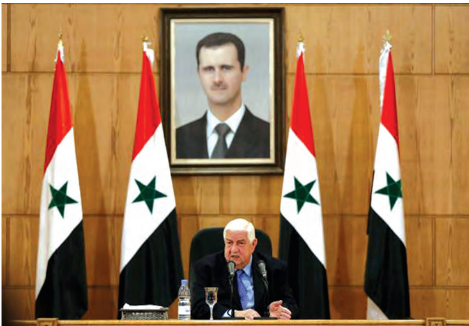
ဆီးရီးယားနိုင်ငံ ဒမတစ်ကတော် မတ် ၁၂ ရက်က သတင်းစာရှင်းလင်းပွဲတစ်ရပ်ကျင်းပရာ ဆီးရီးယားနိုင်ငံခြား ရေးဝန်ကြီး ဝီလစ်အယ်မော်လန် ရှင်းလင်းပြောကြားစဉ်။

ဆီးရီးယား အစိုးရအနေဖြင့် ယခုသီတင်းပတ်အတွင်း သမ္မတ၏ ကြံရွယ်ချက်ပတ်သက်၍ စနေနေ့က ဆွေးနွေးခဲ့ရာ အတိုက်အခံများ ကလည်း သမ္မတ ဘရှာအယ်လ် အာဆတ်ကို ဖြုတ်ချနိုင်ခြင်းမရှိလျှင် နိုင်ငံရေးအရ ဆွေးနွေးပွဲ စတင်နိုင် မည်မဟုတ်ကြောင်း ပြောဆိုလိုက် သည်။