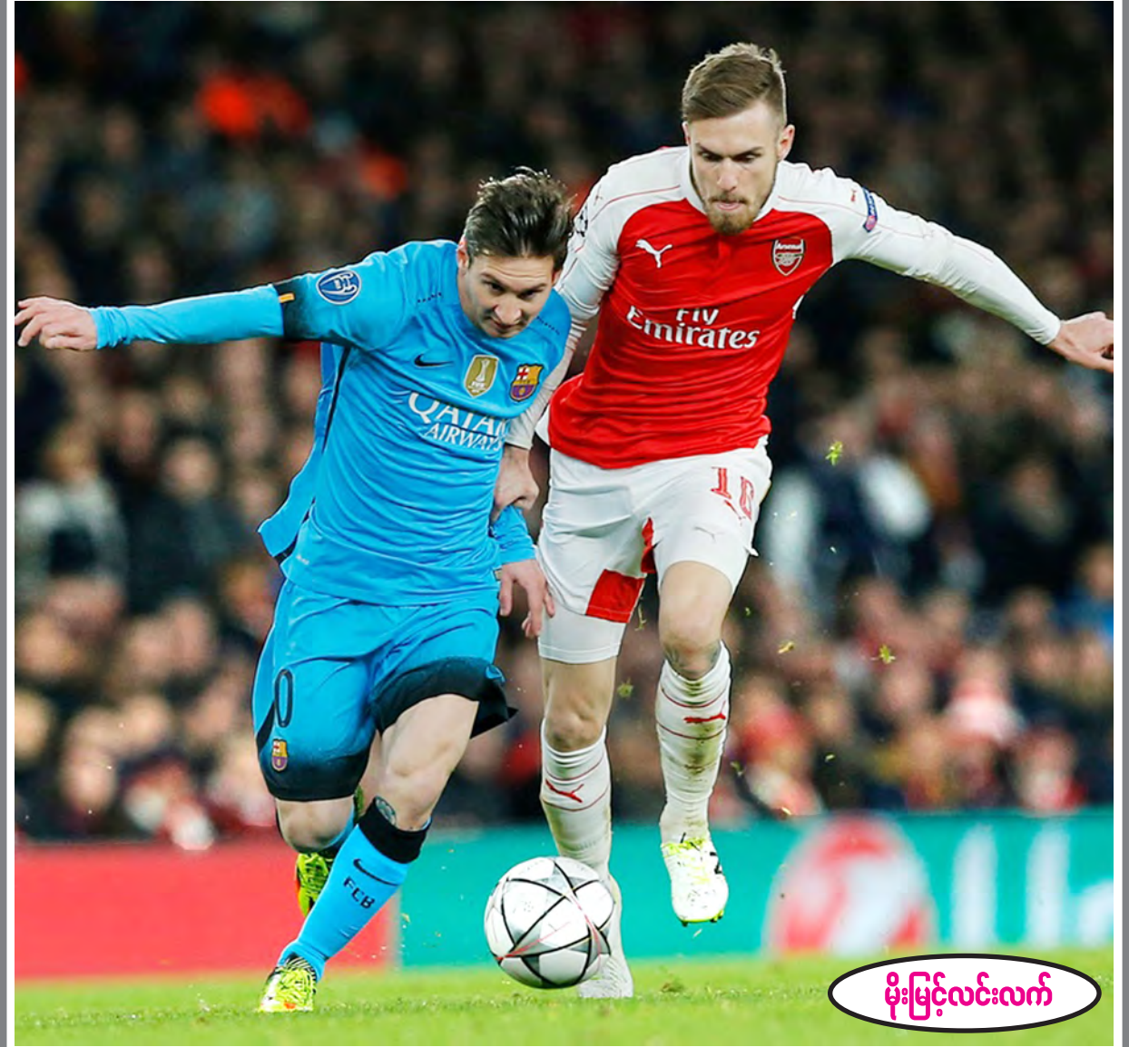
မိုးမြင့်လင်းလက်