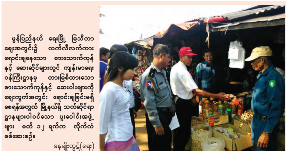
မွန်ပြည်နယ် ရေးမြို့ မြသီတာ ဈေးအတွင်း၌ လက်လီလက်ကား ရောင်းချနေသော စားသောက်ကုန် နှင့် ဆေးဆိုင်များ တွားမြစ်ထားသော စားသောက်ကုန်နှင့် ဆေးဝါးများကို စေရန်အတွက် မြို့နယ်ရှိ သက်ဆိုင်ရာ ဌာနများပါဝင်သော ပူးပေါင်းအဖွဲ့ များ မတ် ၁၂ ရက်က လိုက်လံ စစ်ဆေးစဉ်။ နေမျိုးထွဋ်(ရေး)

ရေလှူဒါန်းခြင်းနှင့် ဟောပြောပွဲသို့ မြို့မမြို့ဖများ၊ မြန်မာနိုင်ငံ ရဲတပ်ဖွဲ့ဝင်များ၊ ကျေးလက်ဒေသဖွံ့ဖြိုးတိုး တက်ရေးဦးစီးဌာနနှင့် မြို့နယ်မီးသတ်ဦးစီးဌာနမှ တာဝန် ရှိသူများ သုခကာရီကျွန်းမာရေနှင့် လူမှုကူညီရေးအသင်း မှ ဥက္ကဋ္ဌနှင့်အဖွဲ့ဝင်များ၊ မြို့နယ်အထောက်အကူပြု ကော်မတီဝင်များ၊ အလှူရှင်မိသားစုနှင့် ဒေသခံပြည်သူ များ တက်ရောက်ခဲ့ကြသည်။ မျိုးဝင်း(စစ်ကိုင်း)