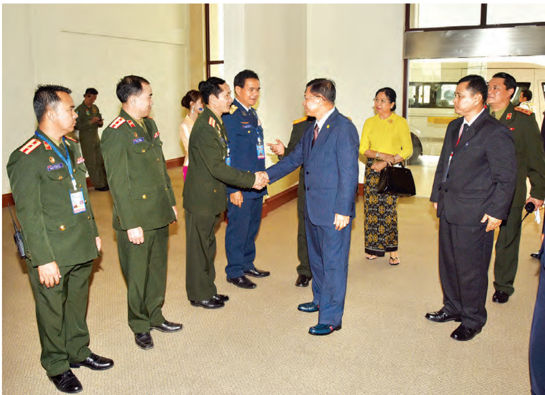
တပ်မတော်ကာကွယ်ရေးဦးစီးချုပ် ပိုလ်ချုပ်မှူးကြီး မင်းအောင်လှိုင်အား လာအို Watty အပြည်ပြည်ဆိုင်ရာလေဆိပ်၌ တာဝန်ရှိသူများက ကြိုဆိုနှုတ်ဆက်ကြစဉ်။