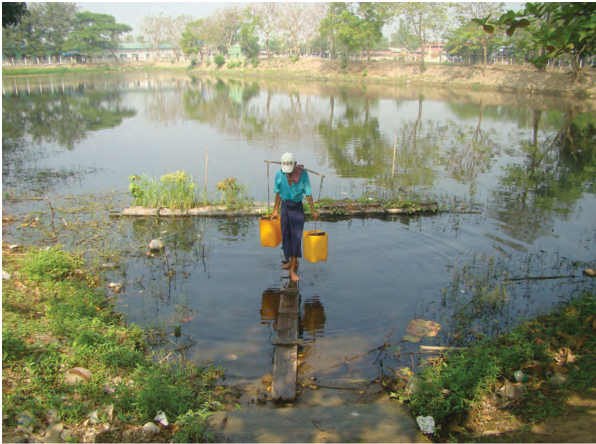
အလတ်ချောင်းရပ်ကွက်ရှိ သုံးရေကန်မှ ရေခပ်နေသော ပြည်သူတစ်ဦး။

ထို့အပြင် မြစ်ကမ်းစပ်မှ ရေများတင်ပို့ပေးရာ၌ မြစ်ရေအတက်အကျရှိနေသည့်အတွက် ရေကျပါက တင်ပို့ရာတွင် အခက်အခဲများရှိနေခဲ့သည်။ ထို့အတွက် လိုအပ်သော အုတ်ရေကန် ၂၂ ကန်အစား (၄x၄)ပေ၊ ရေဂါလန် ၄၀၀ ဆံ့ဖိုက်ဘာကန် ၆၆ ကန်ဖြင့်အစားထိုး ဖြည့်ဆည်းပေးသွားမည်ဖြစ်ကြောင်း မြို့နယ်အထွေထွေအုပ်ချုပ်ရေးမှူးက ပြောကြားသည်။ ထို့ဖိုက်