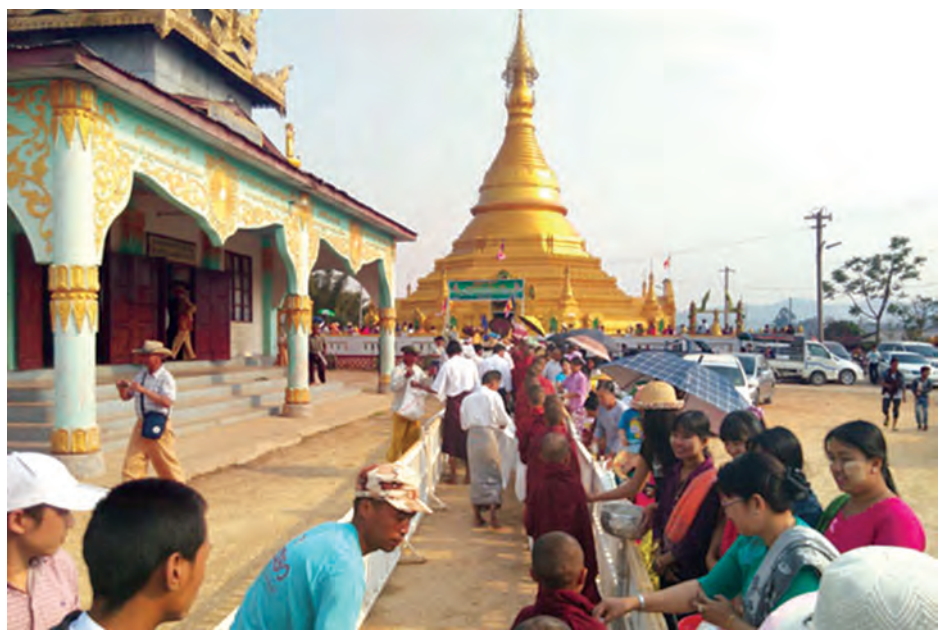
ရမ်းပြည်နယ်တောင်ပိုင်း လျှိုင်လင်မြို့ သာသနာပေပုလ္လဓာတ်တော်ကျောင်းတိုက် စာသင်တိုက်၌ တည်ထား ကိုးကွယ်သော ဆုတောင်းပြည့်ဓာတ်တော်စေတီတော်၏ (၉)ကြိမ်မြောက် သံဃိကဒါန ဆွမ်းဆန်စိမ်းလောင်းလှူပွဲကို မတ် ၁၃ ရက်က ကျင်းပစဉ်။

အစည်းအဝေးကြီးကို ၁၉၈၀ ပြည့်နှစ် မေ ၂၄ ရက်မှ ၂၆ ရက်အထိ ပထမအကြိမ် ကျင်းပခဲ့သည်။ အဆိုပါ အစည်းအဝေးကို နိုင်ငံတော် သံယမဟာနာယက ဆရာတော်ကြီးများသည် လေးလ တစ်ကြိမ် ကျင်းပကြောင်း သိရ သည်။ (သတင်းစဉ်)