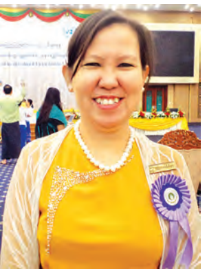
ဒေါက်တာ သန်းသန်းအေး

ပေမယ့် အသိပညာတွေ၊ လုပ်ဆောင်မှု စွမ်းပကားတွေ မြှင့်တင်ဖို့ ဆက်လက်လုပ်ဆောင်ရမှာပါ” ဟု လူမှုဝန်ထမ်းဦးစီးဌာနမှ ဒုတိယညွှန်ကြားရေးမှူးချုပ် ဒေါက်တာသန်းသန်းအေးက ဆောင်ရွက်လျက်ရှိသည့် အခြေအနေများအပေါ် ပြောပြသည်။