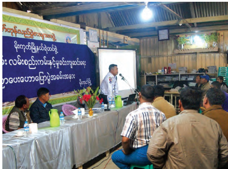
မိုးကုတ်မြို့၌ ယာဉ်စည်းကမ်း၊ လမ်းစည်းကမ်းနှင့် မူခင်းကျဆင်းရေး ပညာပေးဟောပြောပွဲအပြီးတွင် ယာဉ်စည်းကမ်း၊ လမ်းစည်းကမ်းဆိုင်ရာ အသိပညာပေး ပြန်ဝေပေးခဲ့ကြောင်း သိရသည်။ နေဝါ(မိုးကုတ်)

မူးယစ်ဆေးဝါး မူခင်းဖြစ်စဉ်များနှင့် မူးယစ် ဆေးဝါးအန္တရာယ်အကြောင်း သိကောင်း စရာများကိုလည်းကောင်း၊ မူခင်းလျော့နည်းကျ ဆင်းရေးဆိုင်ရာများကိုလည်းကောင်း အသိ ပညာပေး ဟောပြောခဲ့သည်။ ထို့နောက် အမှတ်(၉၄) ယာဉ်ထိန်းရဲတပ်ဖွဲ့စိတ်မှ ရဲတပ် ကြပ်ကျော်ကျော်က ၂၀၁၅ မော်တော်ယာဉ် ဥပဒေအကြောင်းနှင့် အဆိုပါ ဥပဒေအရ အရေးယူနိုင်သော ယာဉ်စည်းကမ်း၊ လမ်းစည်း ကမ်းဆိုင်ရာဖြစ်မှုပြစ်ဒဏ်များ၊ မော်တော် ယာဉ်များအား စည်းကမ်းမဲ့စွာ ရပ်နားမောင်း နှင်နေသည့် မှတ်တမ်းဓာတ်ပုံများနှင့် စည်း ကမ်းမဲ့မောင်းနှင်ခြင်းများကြောင့် ဒဏ်ရာ ရခြင်းနှင့် သေဆုံးခြင်းကိုလည်းကောင်း ပရိယုတ်တာဖြင့်ပြသ၍ ရှင်းလင်းဟောပြော