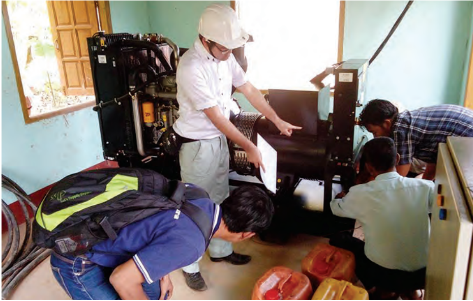
စစ်ဆေးဆောင်ရွက်ခဲ့ကြောင်း သိရသည်။ စုကလီမြို့အနေဖြင့် လျှပ်စစ်