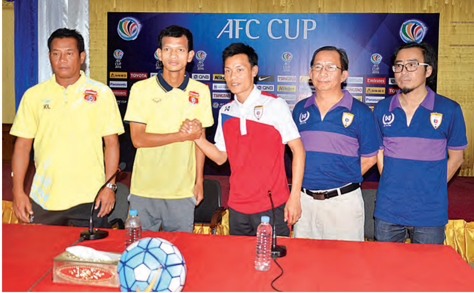
ဧရာဝတီနှင့် လာအိုတိုယိုတာအသင်းတို့မှ တာဝန်ရှိသူများနှင့် ကစားသမားများကို တွေ့ရစဉ်။