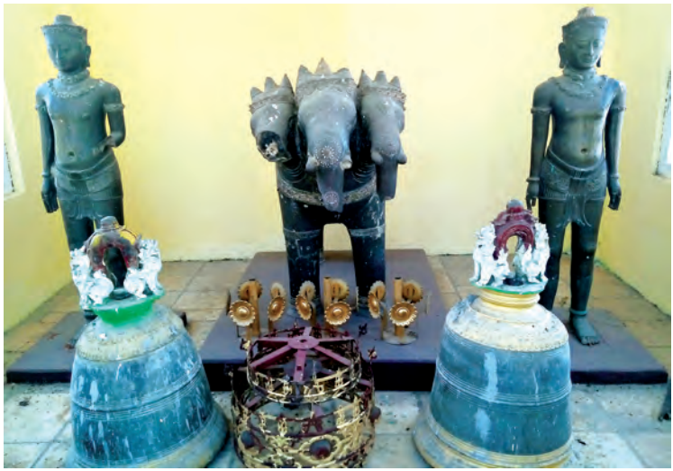
ခေါင်းသုံးလုံးပါ ဧရာဝတီဆင်၊ ကြေးရုပ်လူသားနှင့်ကြေးခေါင်းလောင်းများ။

ကြီး၏ အနောက်တောင်ထောင့်အရပ်တွင် စေတီတော်၏ အောက်မှ ရေစီးဆင်းနေပြီး ဆယ်နှစ်လရာသီရေထွက်နေခြင်း၊ ယင်းမှ တစ်ဆင့် ပေ ၂၀၀ အကွာတွင် အုတ်ရေကန်လေးတစ်ခုတည်ဆောက်ထားပြီး ယားယံဝေဒနာရှင်များ၊ မျက်စိဝေဒနာရှင်များ ရေကိုချိုးခြင်း၊ မျက်စဉ်ခတ်ခြင်းဖြင့် ဝေဒနာများပျောက်ကင်းခြင်း၊ ရေစင်ကို ဆောင်ထားပါက လာဘ်လာဘကောင်းမွန်ခြင်း၊ အန္တရာယ်ကင်းခြင်း၊ စေတီတော်၏ မုခ်များထွင် ကိန်းဝပ်စံပယ်နေသော ရုပ်ပွားတော်များသည် သီတင်းသုံးသည့် မုခ်များတွင်သာ အစဉ်အမြက်နီးဝပ်စံပယ်စေရခြင်း၊ ပင့်ဆောင်သည့်အခါ၌ လည်း ရှေ့နောက်ဘွဲ့စဉ်များအတိုင်း ပင့်ဆောင်ရခြင်း၊ ဘုရားကြီးတောင်ဘက်မုခ်၌ မြတ်စွာဘုရား၏ ခြေတော်ရာရှိခြင်း၊ မုခ်လေးမုခ်၌ ဘုရားအား မျက်နှာမူ၍ စောင့်ရှောက်နေသော ဘီလူးရုပ်တုငါးခုရှိခြင်း၊ ရှေးယခင်က ၎င်းတို့အား အမဲသားအစိမ်းများကို အပတ်စဉ်ကျွေးမွေးရခြင်း၊ ခေါင်းသုံးလုံးပါ ဧရာဝတီဆင်နှင့် ကြေးရုပ်လူသား စသည့် ဘုရားကြီးနှင့်ပတ်သက်၍ ထူးခြားဖွယ်ရာအများအပြားရှိပေသည်။