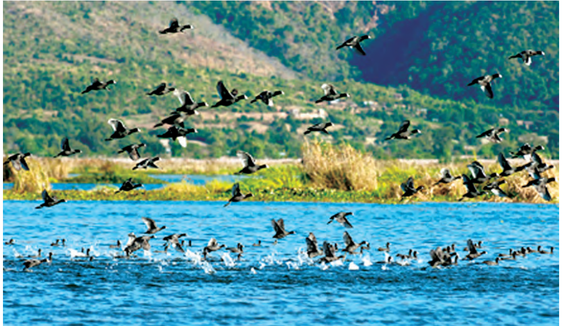
ရေကြက်ခုံ (Black Coot)

ကြောင်း မှတ်တမ်းတင်ထားပြီးဖြစ်သည်။ အင်းလေးကန်ရေတိမ်ဒေသ ဂေဟစနစ်နှင့်ဇီဝမျိုးစုံမျိုးကွဲများ စဉ်ဆက်မပြတ် ထိန်းသိမ်းရေးနှင့် ရေရှည်အသုံးချနိုင်ရေး၊ ဒေသခံတိုင်းရင်းသားတို့၏ ယဉ်ကျေးမှုဓလေ့ထုံးစံများ တိမ်ကောပျောက်မှုမရှိစေရေးနှင့် ဒေသခံတို့၏ စီးပွားရေးအခွင့်အလမ်းနှင့် လူမှုဘဝများ ဖွံ့ဖြိုးတိုးတက်ရေးသည် အင်းလေးကန်သာယာလှပရေး၊ ရေနေ၊ ကုန်းနေသတ္တဝါနှင့် ဇီဝမျိုးစိတ်များ ရှင်သန်ရေးတို့နှင့် တိုက်ရိုက်ဆက်စပ်နေသည့်အတွက် တိုင်းရင်းသားလူငယ်များ အင်းလေးကန်ရေရှည်တည်တံ့လှပရေးကို စိတ်ဝင်တစားဆောင်ရွက်လာခြင်းသည် အင်းလေးကန်အနာဂတ်အတွက် အလင်းရောင်များဖြင့် လမ်းပြခြင်းပင်ဖြစ်သည်။