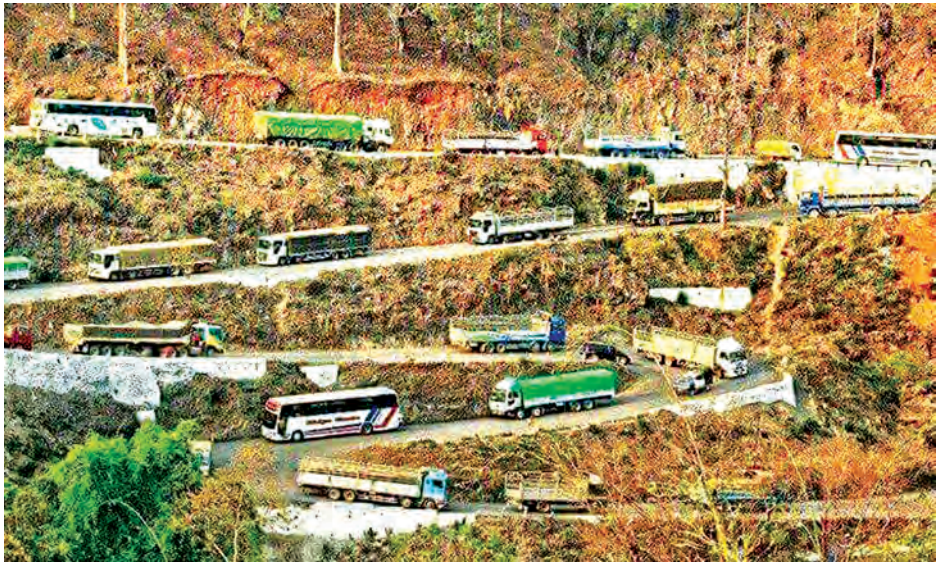
ရမယ့်ခရီး ညရောက်တာတွေ ဖြစ်ကုန်တယ်။ အဓိကကတော့ လမ်း ကျယ်စေချင်တယ်။ ဂုတ်တွင်းဘက် မှာပဲ ဖြစ်ဖြစ်၊ ကျောက်မဲ၊ နောင်ချို ဘက်မှာပဲဖြစ်ဖြစ် ကရိန်းကားတစ်စီး

အဆိုပါ ငါးဖမ်းကွက်အချို့တွင် သန္တာကျောက်တန်းများ များစွာပျက်စီးနေသည်ကို တွေ့ရှိရပြီး အချို့သော Coral မျိုးစိတ်များမှာ အသစ်ပြန်လည်ပေါက်ဖွားလာနိုင်သည်ဟု သိရသည်။