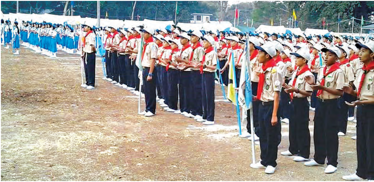
ကင်းထောက်လူငယ်များ စခန်းချတွေ့ဆုံပွဲ(ပုပ္ပားစခန်း)တွင် ကင်းထောက်လူငယ်များ ကင်းထောက်သီချင်း သီဆိုစဉ်။

“အနာဂတ်နိုင်ငံအတွက် မျိုးဆက်သစ် ကျောင်းသား ကျောင်းသူတွေကို ဘက်စုံထူးချွန်ထက်မြက်ဖို့ မွေးထုတ် ကြိုးပမ်းကြတဲ့နေရာမှာ စုပေါင်းဆောင်ရွက်တဲ့ အလေ့အထတွေနဲ့ ကလေးတွေရဲ့ ကာယ၊ ဉာဏ၊ စာရိတ္တ၊ မိတ္တပလ စတာတွေရော တစ်ပြိုင်နက်တည်း ရလာအောင် လုပ်ဆောင်ပေးဖို့ ကင်းထောက် သင်ခန်းစာတွေက အထောက်အကူပေးတယ်လို့ ယုံကြည်ပါတယ်။ ဒီနှစ်မှာတော့ ပုပ္ပားမှာ စခန်းချတွေ့ဆုံခဲ့ကြတယ်။ ဒီနှစ်ရဲ့ထူးခြားချက်က