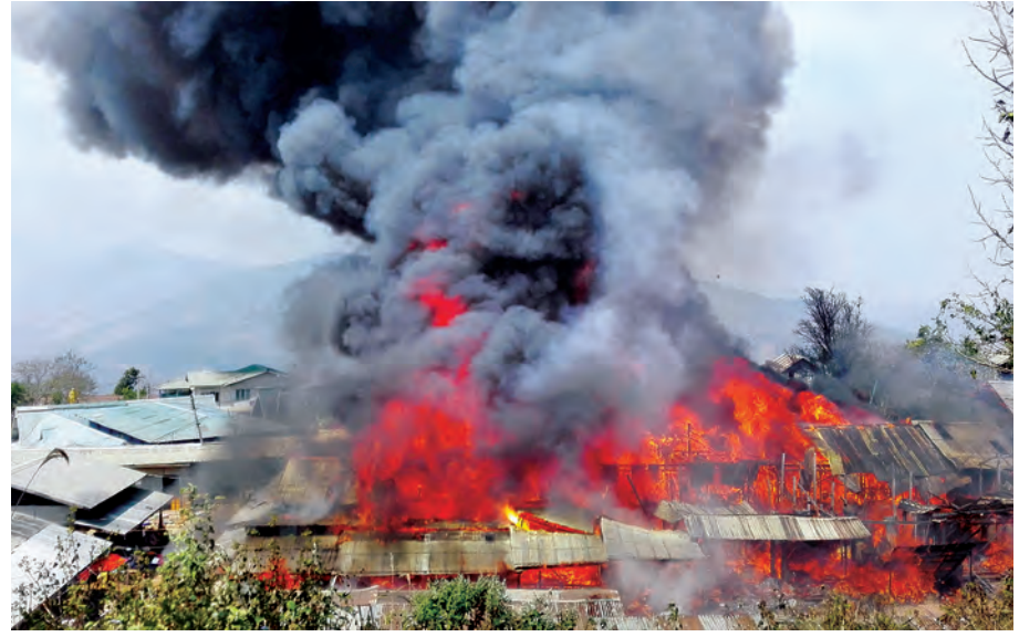
အပူချိန်မြင့်မားမှုကြောင့် လျှပ်စစ်ပိုင်းယာရှောခံဖြစ်ပွားရာမှ မီးလောင်မှုတစ်ခုဖြစ်ပွားစဉ်။

၂၀၁၆ ခုနှစ် အားကောင်းသော အယ်နီညီရာသီဥတုဖောက်ပြန်မှုနှင့် ယှဉ်ပြိုင်ရန် စိန်ခေါ်မှုတိုင်းအတွက် တုံ့ပြန်ရန်ဆိုင်ရန် မီးသတ်တပ်ဖွဲ့ဝင်များက ကြိုးပမ်းဆောင်ရွက်လျက်ရှိပါကြောင်း ရေးသားတင်ပြအပ်ပါသည်။ ။