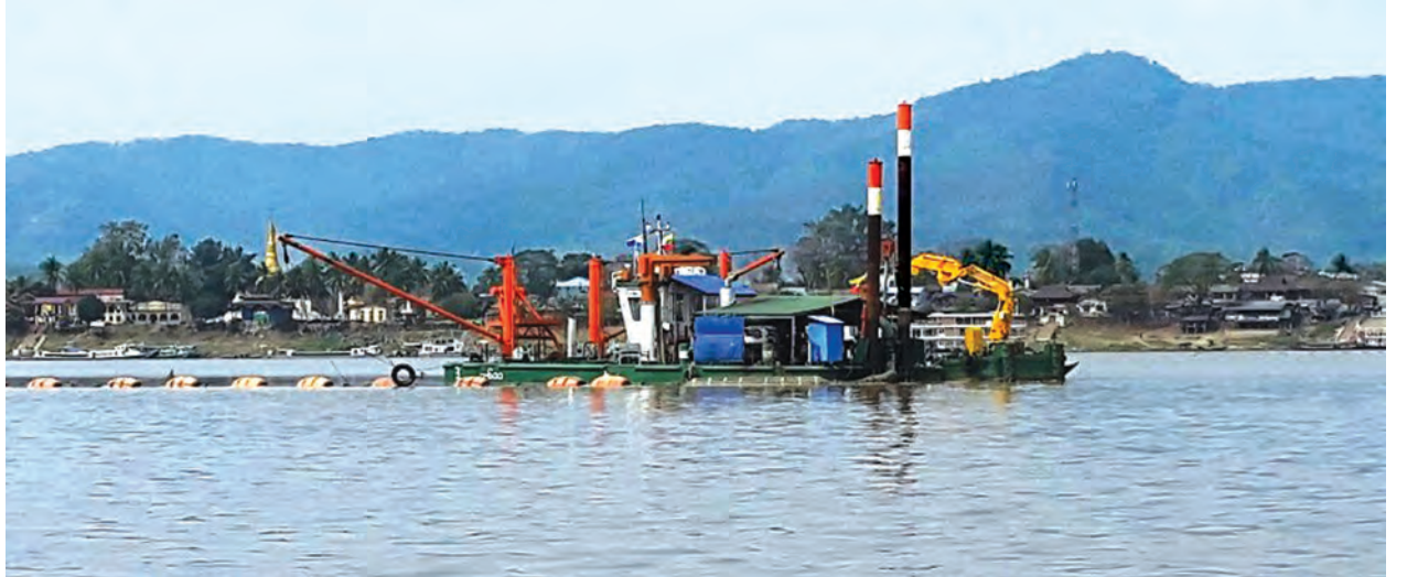
“ကသာမြို့က ရောဂါဖြစ်အနောက်ဘက်ကမ်းမှာ ရှိတယ်။ ရေလမ်းကို အဓိကအသုံးပြုပြီး ကုန်စည်ကူးသန်းရောင်းဝယ်ရေး လုပ်နေကြပေမယ့် အခုနောက်ပိုင်းတော့ ကားလမ်းတွေကလည်း သွားနေကြတယ်။ သယ်ယူစရိတ်ကတော့ ရေလမ်းက သက်သာတယ်” ဟု ကသာမြို့မှ ကုန်သည်တစ်ဦးက ပြောသည်။

ကသာမြို့ ဆိပ်ကမ်းတွင် သောင်တူးဖော်ရာ၌ အလျား ၁၁၄၃ ပေ၊ အကျယ် ၃၅-မီတာနှင့် အနက် ရေစစ်မျဉ်းအောက် ၃ မီတာဖြစ်ပြီး မတ်လကုန်တွင် ပြီးစီးမည်ဖြစ်ကြောင်း၊ ခန့်မှန်းကုန်ကျစရိတ် ငွေကျပ်သိန်း ၇၀၀ ဖြစ်ပြီး လုပ်ငန်းဆောင်ရွက်ချိန် တစ်လကြာမြင့်မည်ဖြစ်ကြောင်း၊ ရေလမ်းသယ်ယူပို့ဆောင်ရေးသည် ပို့ဆောင်ရေးနည်းလမ်းများတွင် ကုန်ကျစရိတ်အသက်သာဆုံးဖြစ်ပြီး ကုန်စည်ကူးသန်းရောင်းဝယ်ရေးအတွက် များစွာအထောက်အကူပြုကြောင်း သိရသည်။