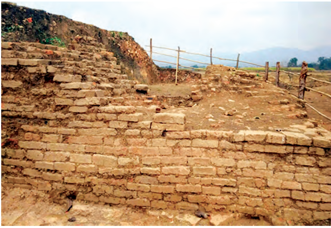
ပျူမြို့ဟောင်းရှိ အုတ်ရိုးနေရာတစ်နေရာကို တွေ့ရစဉ်။

သတင်းဆောင်းပါး-မြင့်မြတ်သစ္စာ