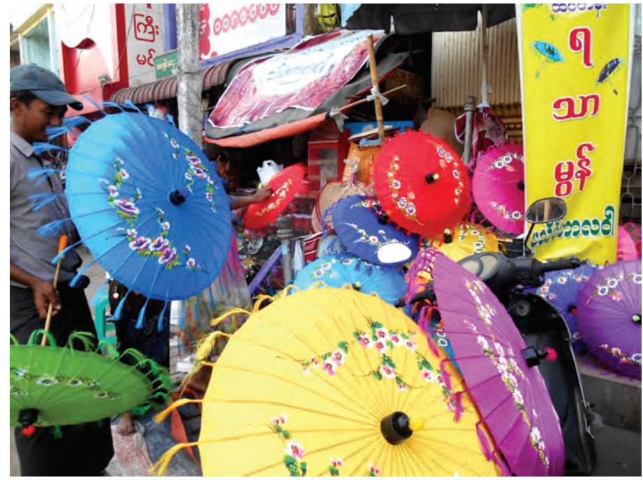
ပုသိမ်မြို့မှ ပုသိမ်ထီး အရောင်းဆိုင်တစ်ဆိုင်။

ပုသိမ်ထီးလုပ်ငန်း၏ အဓိက ကုန်ကြမ်းဖြစ်သော သာရကူဝါးရှားပါး နေမှုက ပုသိမ်ထီးလုပ်ငန်းကို တစ်စ တစ်စနှင့် ပျောက်ကွယ်သွားစေနိုင် သည်။ ကုန်ကြမ်းရှားပါးမှုမဖြစ်စေရန် အကျိုးတူ စီးပွားရေးလုပ်ငန်းရှင်များ လိုအပ်သကဲ့သို့ နိုင်ငံတော်ကလည်း သာရကူဝါးစိုက်ပျိုးမှု၊ ထုတ်လုပ်မှုကို ဇောင်းပေးဆောင်ရွက်သင့်