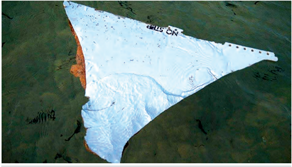
မိုဇမ်ဘစ်၌တွေ့ရှိရသော ပျောက်ဆုံးမလေးရှားလေကြောင်းလိုင်း MH-370 လေယာဉ်၏ အပိုင်းအစဟုယူဆရသော ပစ္စည်းကို တွေ့ရစဉ်။

မိုဇမ်ဘစ်ရေလုပ်သားများသည် နိုင်ငံအလယ်ပိုင်းအင်တန်ဘန်းပြည်နယ် ဝီလ်ကူလို့စ်မြို့အနီး သဲသောင်ခုံတစ်နေရာတွင် လေယာဉ်ပျက်အပိုင်းအစတစ်ခုကို ရှာဖွေတွေ့ရှိခဲ့သည်။ ရှာဖွေတွေ့ရှိရသော လေယာဉ်ပျက်အပိုင်းအစကို မိုဇမ်ဘစ်မြို့ပြလေကြောင်းတက္ကသိုလ်သို့ ပေးပို့ခဲ့သည်။