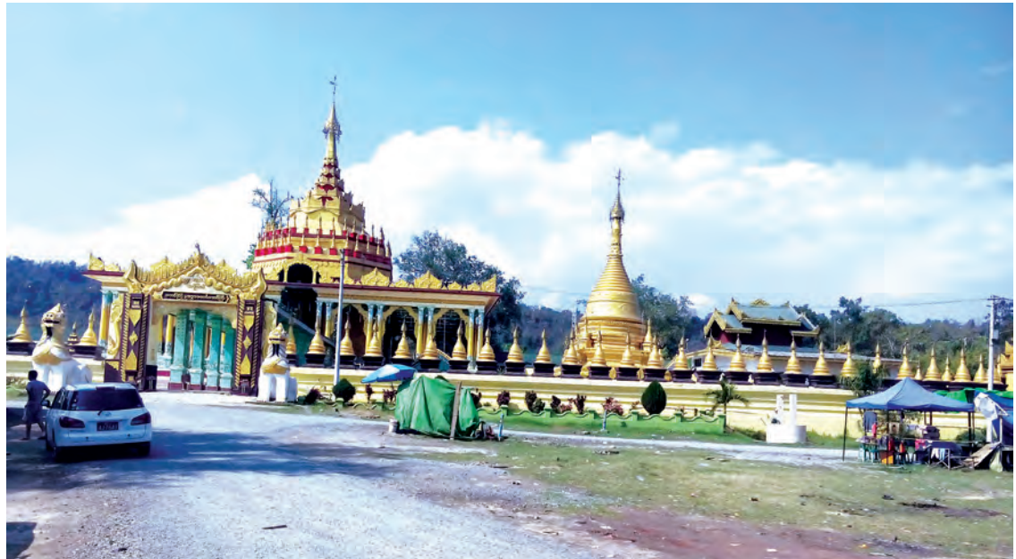
ဘော်ကြိုဘုရားကြီးနှင့် စေတီတော်အထက်မြင့်တက်သွားခြင်းမရှိသော စံကားပင်။

ဘော်ကြိုဘုရားကြီး ပုဒ္ဒပူဇနိယပွဲတော်ကို ၁၃၇၇ ခုနှစ် တပေါင်းလဆန်း ၁၀ ရက်မှ တပေါင်းလပြည့်နေ့အထိ(မတ် ၁၈ ရက်မှ ၂၃ရက်) မြောက်ရက်တိုင်တိုင် အငြိမ်း၊ ရှမ်းပြဇာတ်၊ ဇိုးရာယဉ်ကျေးမှုရှမ်း၊ ပလောင်ပဒေသာကပွဲများ၊ စင်တင်တေးဂီတနှင့် အခြားပျော်ပွဲရွှင်ပွဲများ၊ အားကစားပြိုင်ပွဲများဖြင့် စည်ကားသိုက်မြိုက်စွာ ကျင်းပမည်ဖြစ်သည်။ ရှေးဟောင်း သမိုင်းဝင်ဘော်ကြိုဘုရားကြီး အထွေထွေဘက်စုံပြုပြင်မွမ်းမံတည်ဆောက်ရေးအတွက် ရွှေပြား၊ ရွှေသင်္ကန်း၊ လျှပ်စစ်မီးနှင့် အလျှူငွေများ လှူဒါန်းလိုကြသော ရဟန်း ရှင်လူ စေတနာရှင်များ စိတ်ချမ်းမြေ့စွာလှူဒါန်းနိုင်ရေးအတွက် ဘော်ကြိုဘုရားကြီး ရင်ပြင်တော်ပေါ်၌ အလှူခံဌာနများ ဖွင့်လှစ်ထားကြောင်း သိရသည်။ သို့ဖြစ်၍ ပုဒ္ဒပူဇနိယဝင် တိုင်းရင်းသားပြည်သူများအနေဖြင့် ရှမ်းပြည်နယ် မြောက်ပိုင်း သီပေါမြို့ရှိ သမိုင်းဝင်ဘော်ကြိုဘုရားကြီး၏ ပုဒ္ဒပူဇနိယပွဲတော်သို့ လာရောက်ကြည့်ညှိနိုင်ပါကြောင်း သတင်းကောင်းပါးလိုက်ရပါသည်။