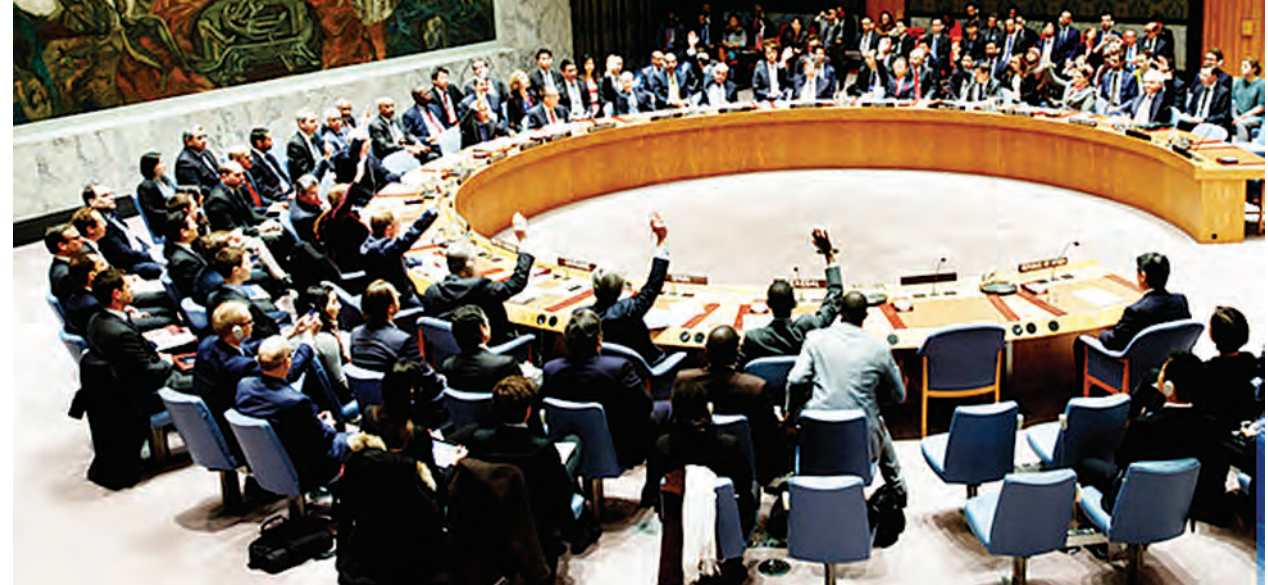
ကုလသမဂ္ဂဌာနချုပ်၌ မတ် ၂ ရက်က မြောက်ကိုရီးယားကို ပိတ်ဆို့မှုများပြုလုပ်ရန် လုံခြုံရေးကောင်စီအဖွဲ့ဝင်များ စည်းဝေးနေသည့်ကို တွေ့ရစဉ်။

မြောက်ကိုရီးယားအပေါ် ပိတ်ဆို့မှုများ တင်းတင်းကျပ်ကျပ် ထပ်မံပြုလုပ်ရန် ကုလသမဂ္ဂလုံခြုံရေးကောင်စီက ဗုဒ္ဓဟူးနေ့တွင် တညီတညွတ်တည်း ဆုံးဖြတ်ခဲ့ကြသည်။ အစောပိုင်းက ပြုလုပ်သော ခြောက်နိုင်ငံဆွေးနွေးပွဲတွင် ကောင်စီအဖွဲ့ဝင်များက ပြုယမ်း၏ နျူကလီးယားနှင့် ခုံးကျည်အစီအစဉ်ကို ရုပ်သိမ်းပေးရန်ကိုလည်း တောင်းဆိုခဲ့ကြသည်။ ဆွေးနွေးမှု အဖြေရလဒ်သစ်မှာ မြောက်ကိုရီးယားက ၎င်း၏နျူကလီးယားနှင့် ခုံးကျည်အစီအစဉ်ထပ်မံ တိုးချဲ့ပြုလုပ်ရန်အားထုတ်မှုကို ဟန့်တားရန် ရည်ရွယ်ထားကြောင်းသိရသည်။ ပြုယမ်း၏ ခုံးကျည်ပစ်လွှတ်မှုနှင့် နျူကလီးယား စမ်းသပ်မှုများကိုတားမြစ်ရန် ယခင်အစည်းအဝေးမှ ဆုံးဖြတ်ချက်များ ချမှတ်ခဲ့သည်။ (ဆင်ဟွာ)