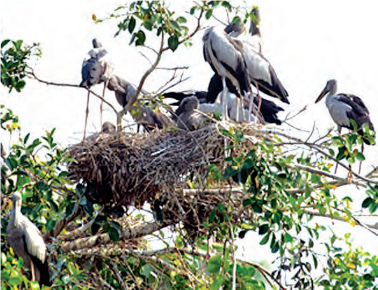
ခရုတုတ်ငှက်များ (Asian Openbill)

ဆောင်းပါး-မြင့်မြတ်သစ္စာ