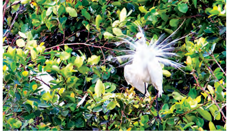
သာယာဝတီမျိုင်း (Intermedit Egret)

အင်းလေးကန်တောရိုင်းတိရစ္ဆာန် ဘေးမဲ့တောသည် အရှေ့တောင်အာရှ၏ အကြီးဆုံး ကုန်းတွင်းရေတိမ်ဒေသများတွင် တစ်ခုအပါအဝင်ဖြစ်သည့်အပြင် အာဆီယံအမွေအနှစ်ဥယျာဉ် (ASEAN Heritage Park) တစ်ခုလည်းဖြစ်သည်။ အင်းလေးကန်သည် ဇီဝနယ်မြေတစ်ခုဖြစ်သောကြောင့် ဘူမိဗေဒဆိုင်ရာ ထူးခြားမှုရှိခြင်း၊ သက်ရှိ သက်မဲ့ ဇီဝမျိုးစုံမျိုးကွဲများ ပေါကြွယ်ဝပြီး နိုင်ငံခြားသားများနှင့် သုတေသနပညာရှင်များ အထူးစိတ်ဝင်စားသော သဘာဝထိန်းသိမ်းရေးနယ်မြေတစ်ခုအဖြစ် ယနေ့တိုင်တည်ရှိနေခြင်းတို့ကြောင့်