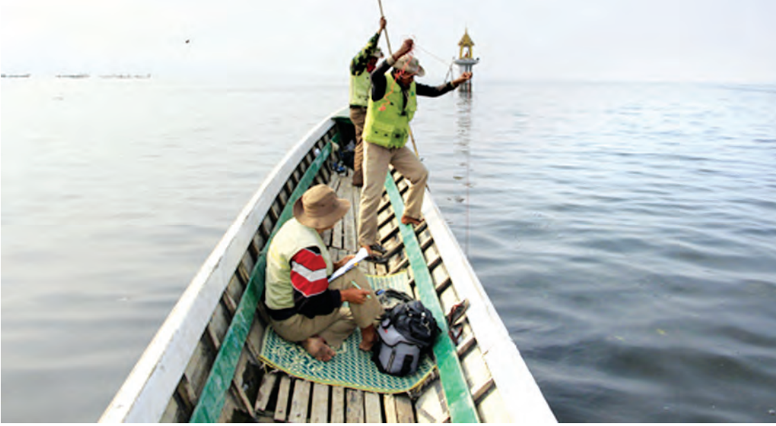
အင်းလေးကန် ရေရှည်တည်တံ့ရေး လေ့လာသုတေသနပြုနေသည့်အဖွဲ့ကို တွေ့ရစဉ်။