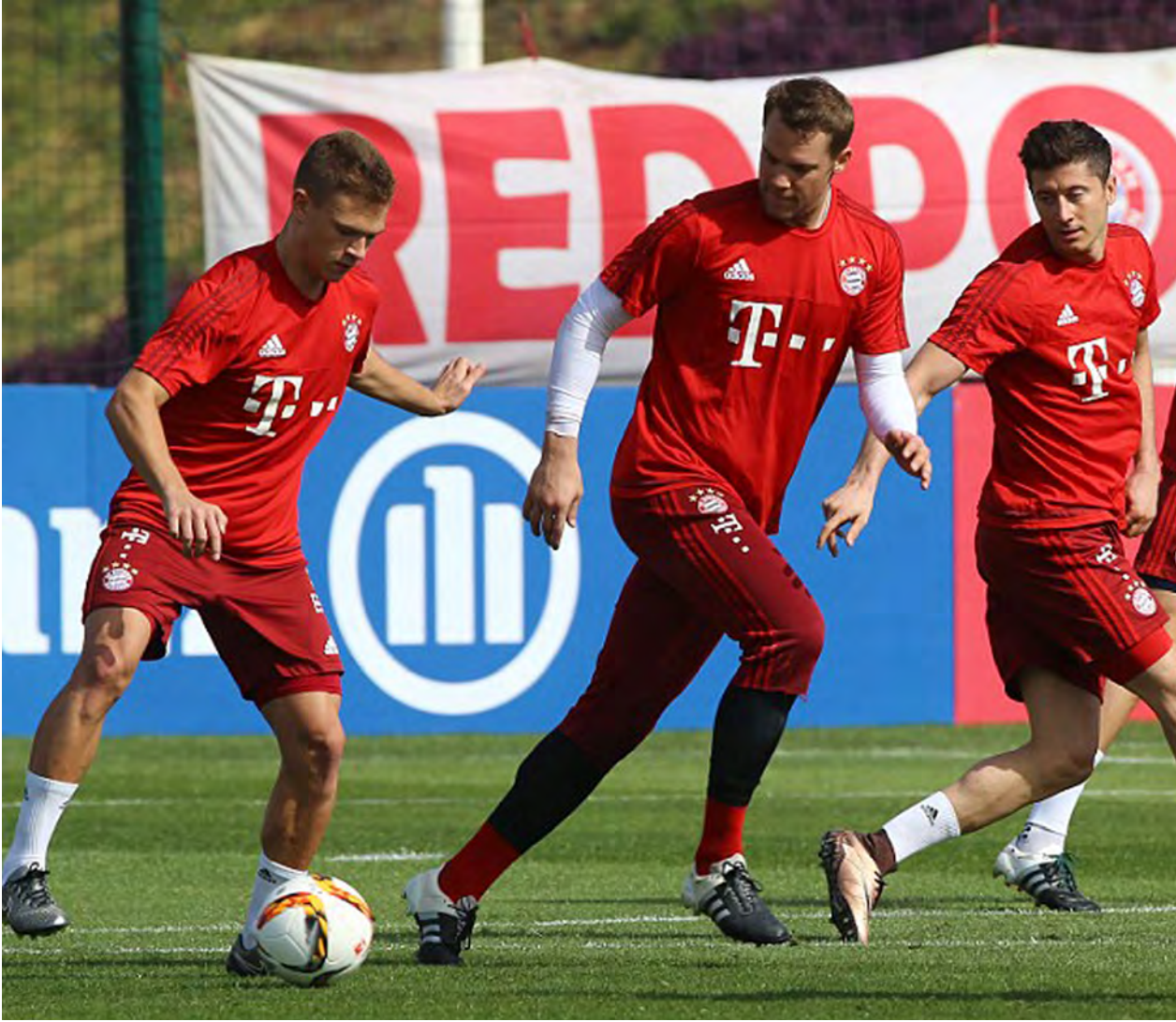
အိမ်ကွင်းရော အဝေးကွင်းမှာပါ ခြေစွမ်းပျောက်ဆုံးနေပေမယ့် ဒီပွဲမှာ အကောင်းဆုံးပုံစံပြသပြီး အောင်ပွဲခံပါလိမ့်မယ်။

နှစ်သင်းစလုံး ခြေရည်တူတာမို့ ဒီပွဲက ခက်ခဲတဲ့ ထိုးဖောက်ပိုးသွင်းမှုတွေ ကို မြင်တွေ့ရပါလိမ့်မယ်။ ဖရန်ဖတ်တို့က တန်းဆင်းဇန်ထဲ မကျဆင်းအောင် ရုန်းကန်ရဖို့ရှိနေသလို အင်ဂိုစတတ်တို့ကလည်း အဝေးကွင်းမှာ ရှုံးပွဲများနေမှု ကို ချေဖျက်နိုင်ဖို့ သက်သေပြရမယ့်ပွဲ ဖြစ်နေပါတယ်။ ဖရန်ဖတ်တို့က