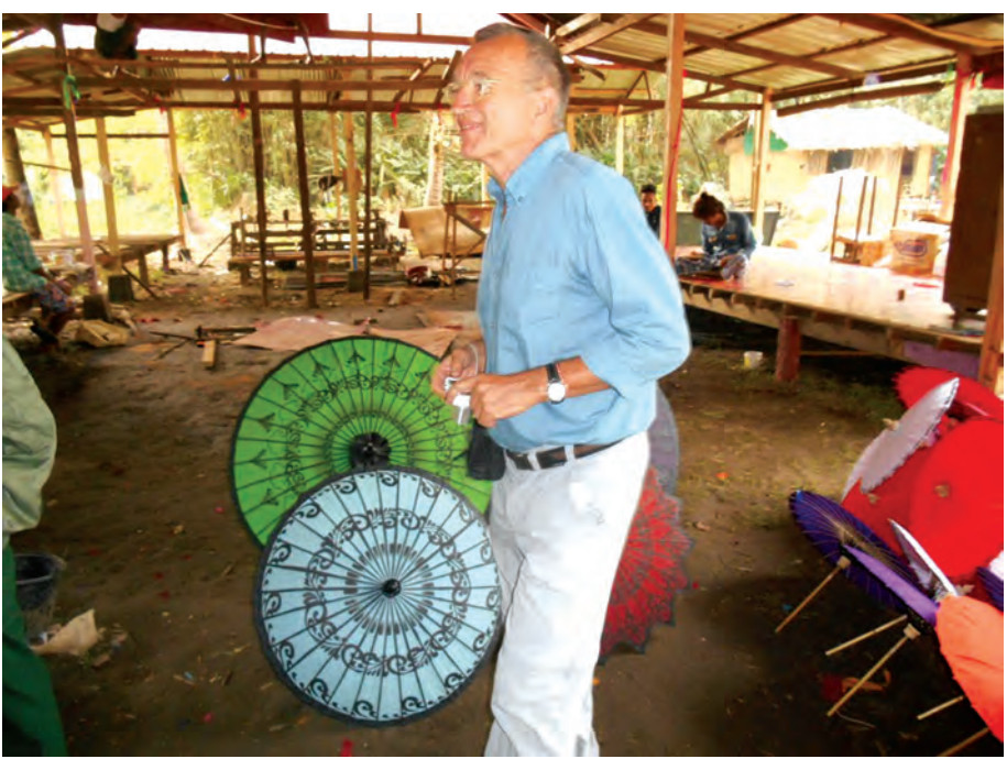
ပုသိမ်ထီးလုပ်ငန်းကို လေ့လာနေသော နိုင်ငံခြားသားတစ်ဦး။

ဆုရရှိခဲ့သော ထီး ၁၀ မျိုးမှာ (၁) မင်းသုံးထီး၊ (၂) ဇာတ်ကြီးဆယ်ဘွဲ့ ရုပ်စုံပန်းချီပါထီးကြီး၊ (၃) စနိုးပိုက်နှင့် လူပုလေးများရုပ်စုံပါ ထီးကြီး၊ (၄) မြန်မာစေတီပုထိုးများ ပန်းချီပုံပါ ထီးကြီး၊ (၅) လယ်သမားများ ကောက်စိုက်၊ ကောက်ရိုက်၊ စပါးလှေ၊ မောင်းထောင်း၊ ဆန်ပြာနေပုံ ရုပ်စုံပန်းချီ ထီးကြီး၊ (၆) အလှဆောင်းထီး အနားအမြိတ် နှင့် လက်ကိုင်ငွေရိုး ထီးပန်းရံ၍ ငွေချည်ရွှေချည်ထီး ထီးကြီး၊ (၇) ပြည်ထောင်စု တိုင်းရင်းသားရုပ်စုံပါ