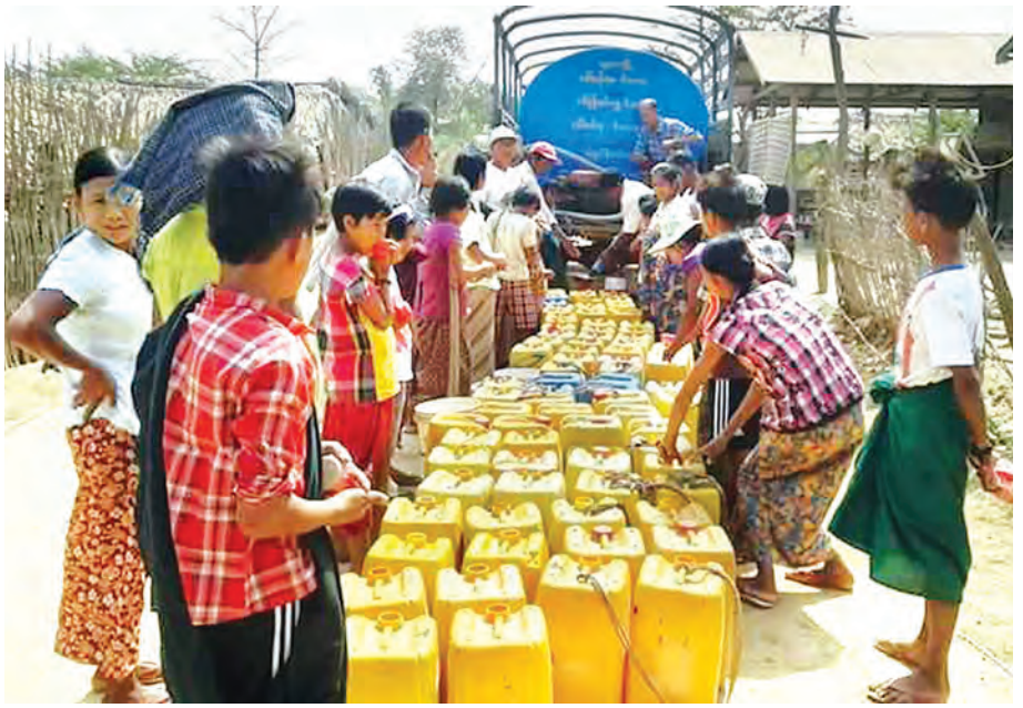
ရေရှားပါးရာဒေသများ၌ သောက်သုံးရေဖြန့်ဝေပေးနေစဉ်။

တပ်ခွဲ ၁၇ ခွဲတွင် အင်အား ၁၉၇၂ ဦး၊ တပ်စု ၃၃၃ စုတွင် အင်အား ၁၁၆၅၅ ဦး စုစုပေါင်းအင်အား ၁၃၆၂၇ ဦးအား သန္ဓေမီးသတ်တပ်ဖွဲ့ဝင်များ ဦးဆောင်၍ အရန်မီးသတ်တပ်ဖွဲ့ဝင်များဖြင့် ၂၀၁၁ ခုနှစ်မှ