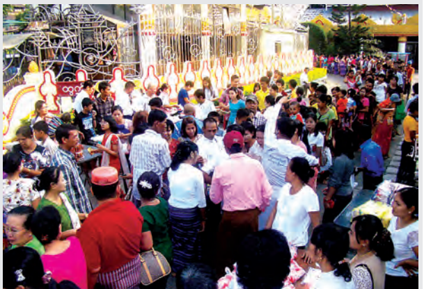
ရန်ကုန်မြို့ စမ်းချောင်းမြို့နယ်ရှိ အတုလာဓိပတိမဟာမုနိသကျ ကိုးထပ် ကြီးဘုရား(၄၄)ကြိမ်မြောက် ဗုဒ္ဓပူဇော်ပွဲအဖြစ် နိဗ္ဗာန်ဈေးကို ဖေဖော်ဝါရီ ၂၈ ရက်က ဖွင့်လှစ်ရာ လှူဒါန်းသူ အလှူခံသူများ စည်ကား နေသည်ကို တွေ့ရစဉ်။