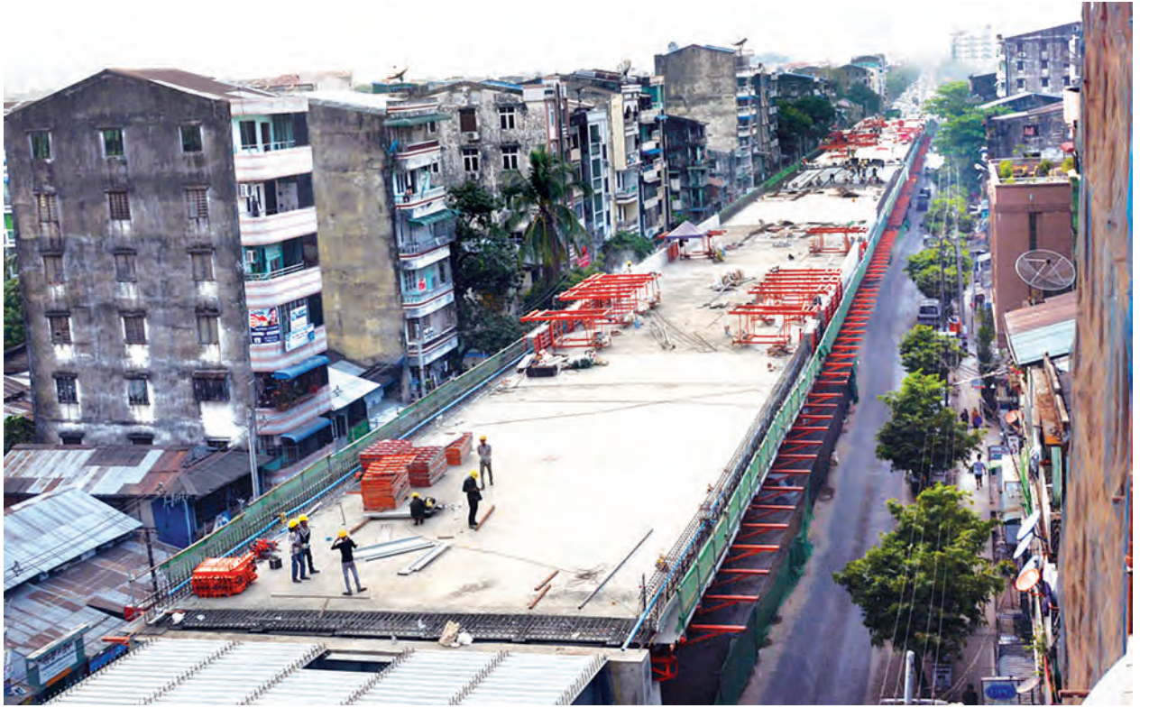
၈၅ ရာခိုင်နှုန်းပြီးစီးနေပြီဖြစ်သော ရန်ကုန်မြို့၏ အရှည်ဆုံး တာမွေခုံးကျော်တံတားကို တွေ့ရစဉ်။

တာမွေလမ်းဆုံ ဝိုင်းပုံသဏ္ဍာန်ခုံးကျော်တံတားသည် ရန်ကုန်မြို့ရှိ ခုံးကျော် တံတားများအနက် အရှည်ဆုံးဖြစ်လာမည့် ဝိုင်းပုံသဏ္ဍာန်ခုံးကျော်တံတား ကြီးဖြစ်ပြီး ပင်မလေးလမ်းသွားဘက်ခြမ်းဖြစ်သည့် ဗညားဒလလမ်းနှင့် ဦးချစ် မောင်လမ်းပေါ်ရှိ တံတားအရှည်သည် ၂၈၇၅ ဒဿမ ၀၇ ပေရှိကာ အရှေ့ မြင်းပြိုင်ကွင်းလမ်းဘက်ခြမ်းသို့ ခွဲထွက်သွားသော လက်တက်ပွား နှစ်လမ်း မောင်း တံတားအရှည်မှာ ၁၉၇၁ ဒဿမ ၅၂ ပေ ရှိမည်ဖြစ်သည်။ တံတား