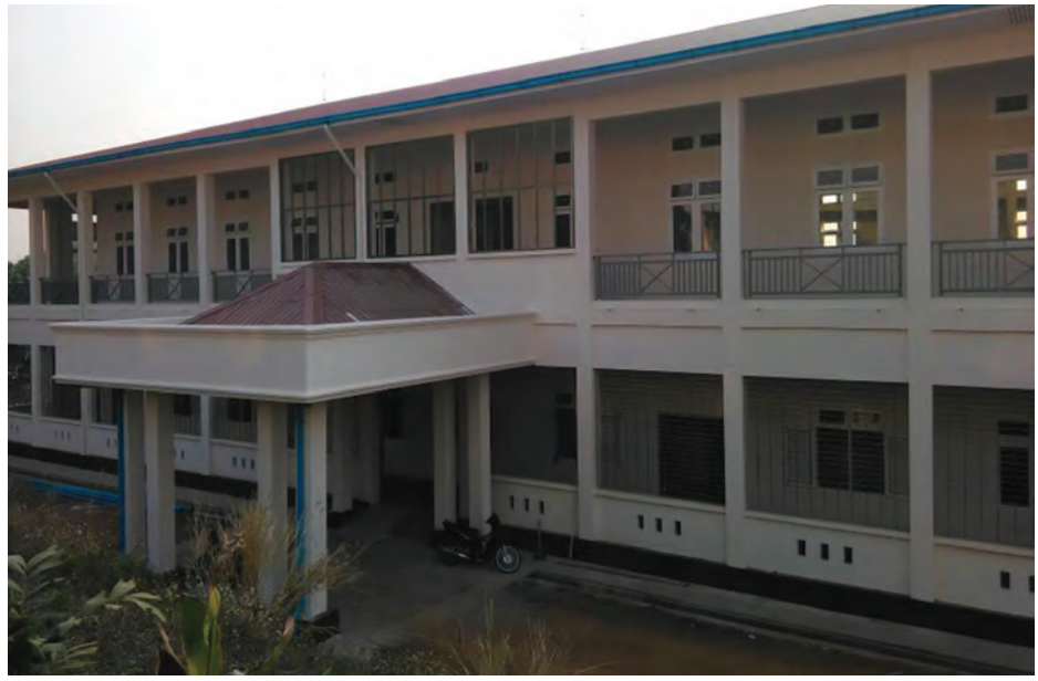
တည်ဆောက်ပြီးစီးနေသော မြို့နယ်ဆေးရုံ ခွဲစိတ်ကုသဆောင်။

လက်ရှိအချိန်တွင် ဆေးရုံကို ခုတင် (၁၀၀) ဆံ့အဖြစ် တိုးချဲ့တည်ဆောက်ပေးနေသည့်အပြင် အထူးကုဆရာဝန်ကြီးများနှင့် လက်ထောက်ဆရာဝန်များကို နေရာများအလိုက် အားဖြည့်ပေးထားကာ ဆေးဝါးများမှာလည်း အခမဲ့ရရှိလာကြောင်း၊ ဆရာဝန်များ၏ ကုသရေးအပိုင်း ပိုမိုအားကောင်းလာသည်နှင့်အမျှ ယခင်က မော်လမြိုင်ဆေးရုံသို့ သွားရောက်ဆေးကုသ ခံယူကြရာမှ ယခုအခါ ရေးဆေးရုံတွင် လူနာများ တစ်နေ့တခြား လာရောက်မှုများလာကြောင်း၊ တိုးချဲ့လူနာဆောင်အဆောက်အအုံများ ပြီးစီးသွားပါက လူနာများအတွက် ပို၍ကောင်းလာမည်ဖြစ်ကြောင်း မြို့ခံပြည်သူ