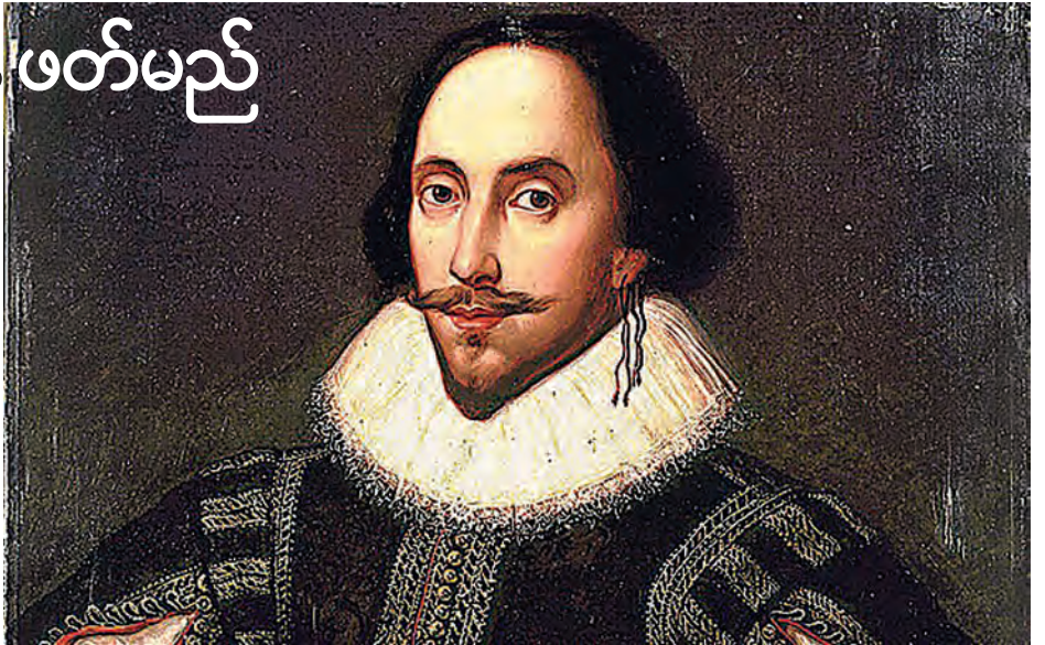
ဗြဟ္မစာရေးဆရာကြီး ဝီလျံရှိုက်စပီးယား

လန်ဒန် မတ် ၂ ရက်က ဗြိတိသျှ ဗြဟ္မစာရေးဆရာ ဝီလျံရှိုက်စပီးယား၏ ဇာတိမြေရှိ အုတ်ဂူကို စကန်ဖတ်ထားသော အချက်အလက် တွေ့ရှိချက်များနှင့် ပတ်သက်ပြီးလာမည့်သီတင်းပတ် အတွင်းကျင်းပမည့် ၎င်းကွယ်လွန်ပြီး နှစ် ၄၀၀ပြည့်အခမ်းအနား၌ ဖော်ထုတ်ပြသသွားမည်ဖြစ်ကြောင်း သိရသည်။ ကဗျာစာဆိုတစ်ဦးကွယ်လွန်ခြင်း နှစ် ၄၀၀ ပြည့်အခမ်းအနား၏ကဏ္ဍတစ်ခုအဖြစ် စထရက်ဖို့ဒ်ရှိ ဟိုလီထရိုက်တီ ဘုရားရှိခိုးကျောင်း၌ တွားရိုသော အုတ်ဂူကို ဖွင့်ဖောက်ပြီး ကိုယ်ခန္ဓာအစိတ်အပိုင်းများနှင့် ဆက်စပ်ပစ္စည်းများကို စကန်ဖတ်မည်ဖြစ်သည်။ ရိုက်စပီးယား၏ မိသားစုဝင်များ၊ ၎င်း၏ဇနီးအပါအဝင် ကလေးများ၏ ရုပ်အလောင်းများကိုလည်း ၎င်းနှင့်ယှဉ်၍မြှုပ်နှံထားခြင်း ဖြစ်နိုင်ကြောင်း ယူဆရသည်။ အုတ်ဂူပျက်စီးမှုမဖြစ်ပေါ်စေရန် တူးဖော်ခြင်း လုပ်ငန်းများကို ခေတ်မီနည်းပညာအသုံးပြုထားကြောင်း သိရသည်။ ရိုက်စပီးယားကွယ်လွန်ခဲ့သည့် ၁၆၁၆ ခုနှစ် ဧပြီလကတည်းက ၎င်း၏အုတ်ဂူကို တစ်ကြိမ်တစ်ခါ မျှ တူးဖော်ခြင်းမပြုကြောင်း ဒေသမီဒီယာများက ပြောသည်။ လန်ဒန်ရှိ စထရက်ဖို့ဒ် နှစ်ပတ်လည်အခမ်းအနား ကျင်းပစဉ်အတောအတွင်း တူးဖော်တွေ့ရှိမှုများ စာတမ်းဖတ်ပွဲများ၊ ညီလာခံများအပါအဝင် ဖျော်ဖြေတင်ဆက်မှု အမြောက်အမြားကိုလည်း ကျင်းပသွားမည်ဖြစ်သည်။ စထရက်ဖို့ဒ်ရှိ ရိုက်စပီးယား၏နေအိမ်မှ ရှာဖွေတွေ့ရှိချက်များကို မကြာခင် ပုံနှိပ်ထုတ်ဝေသွားမည်ဖြစ်ပြီး ဇူလိုင်လတွင် ၎င်း၏အိမ်ကို ပြန်လည်ဖွင့်လှစ်သွားမည်ဖြစ်သည်။ (ဆင်ဟွာ)