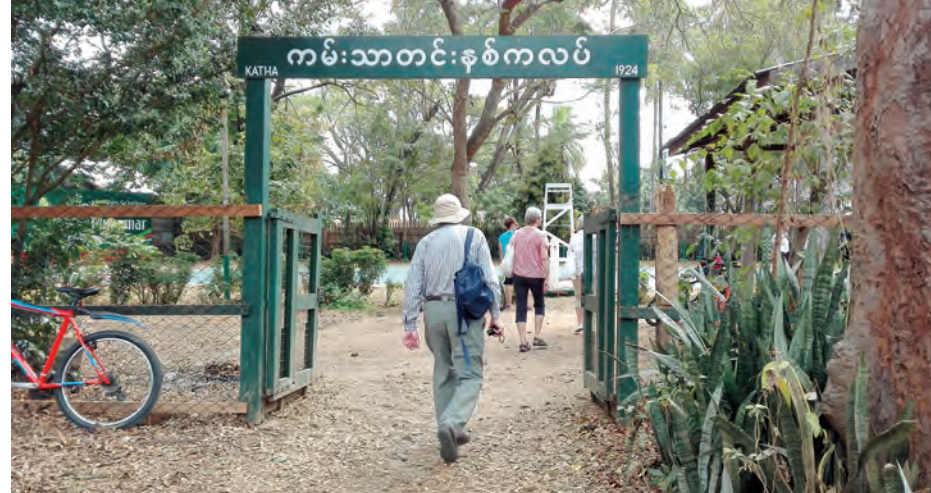
လူအောင်(ကသာ)

တင်းနစ်ကလပ်ဆိုလျှင် ၁၉၂၄ ခုနှစ်မှတိုင် ယနေ့အချိန် ထိအဆင့်မီ ကွင်းတစ်ကွင်းအဖြစ် အသုံးပြုနေကြောင်း တွေ့မြင်ရသည်။ အဆိုပါ ကမ္ဘာလှည့်ခရီးသည် ၁၅ ဦးသည် ဖေဖော်ဝါရီ ၂၇ ရက်မှ မတ် ၇ ရက်အထိ RV Katha Panda အပျော်စီး ရေယာဉ်ဖြင့် ရန်ကုန်၊ မန္တလေး၊ စစ်ကိုင်း၊ မင်းကွန်း၊ နွယ်ငြိမ်းကျေးရွာ၊ တတိယမြစ်ကျဉ်း၊ မလဲကျေးရွာ၊ ကြာညှပ် ကျေးရွာ၊ ထီးချိုင့်၊ ကသာ၊ သစ်တောကြီးဝိုင်း (နတ်ပေါက် ဆင်စခန်း)၊ ကျွန်းတော်(ရွှေကူ)၊ ဒုတိယမြစ်ကျဉ်း၊ စင်းခန်း ကျေးရွာ၊ မိုးတားကျေးရွာ၊ တကောင်း- စည်ပင်ကျွန်းနှင့် စစ်ကိုင်း၊ မန္တလေးမြို့များသို့ သွားရောက်လည်ပတ်မည် ဖြစ်ကြောင်း သိရသည်။