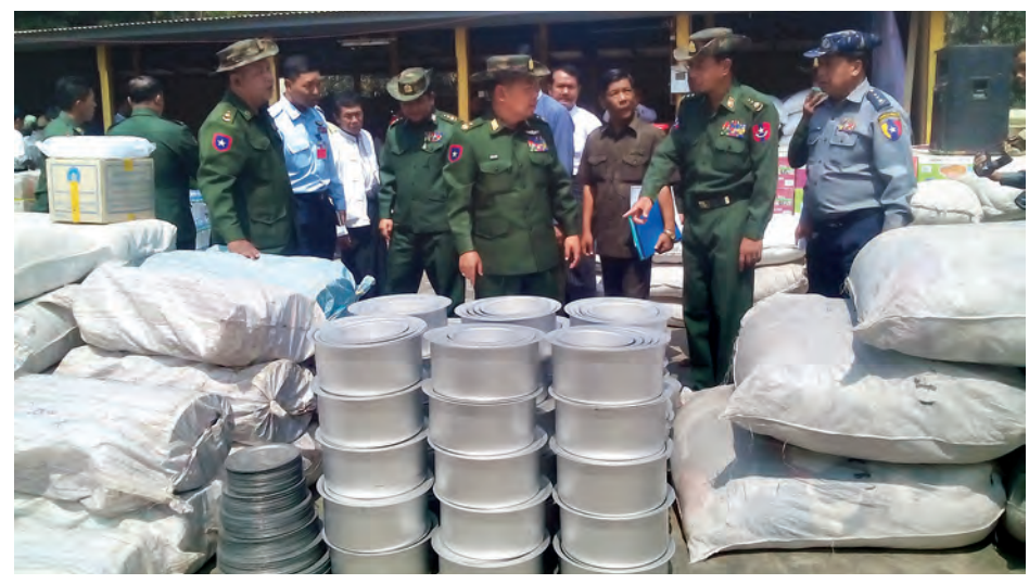
အိမ်ခြေ ၁၀၂ လုံး မီးလောင်ဆုံးရှုံးခဲ့ ပြောကြားသည်။ သည်ဆိုသော ကနဦးအင်တာနက် “မီးလောင်မှုကြောင့် စုစုပေါင်း အိမ်ခြေ ၂၉၀ အနက် ၈၉ အိမ် အိမ်ခြေ ၂၉၀ အနက် ၈၉ အိမ် မီးလောင်ဆုံးရှုံးခဲ့ပြီး အိမ်ထောင် စု တာဝန်ရှိသူတစ်ဦးက ပြေရှင်း ၉၀ မှ လူဦးရေ စုစုပေါင်း ၃၅၉ ဦး

တောင်တွင်းကြီး မတ် ၂ မကွေးတိုင်းဒေသကြီး တောင် တွင်းကြီးမြို့နယ် ဖျောက်ဆိပ်ကုန်း ကျေးရွာ၌ ဖေဖော်ဝါရီ ၂၉ရက်က မီး ဘေးသင့်ပြည်သူများအတွက် တပ်မ တော်(ကြည်း၊ ရေ လေ) မိသားစုများ၊ ဌာနဆိုင်ရာများနှင့် စေတနာရှင် များက မီးဘေးသင့်ပြည်သူများအား ပစ္စည်းများပေးအပ်လှူဒါန်းပွဲကို မတ် ၁ ရက် နံနက်ပိုင်းတွင် ကျင်းပရာ တပ်မတော်(ကြည်း၊ ရေလေ) မိသားစု များက လှူဒါန်းသည့်ပစ္စည်းများအား အလယ်ပိုင်းတိုင်း စစ်ဌာနချုပ်တိုင်း မှူးကလည်းကောင်း၊ ဌာနဆိုင်ရာများ နှင့် အလှူရှင်များက လှူဒါန်းသည့် ပစ္စည်းများကို နယ်စပ်ရေးရာဝန်ကြီး ကလည်းကောင်း မီးဘေးသင့်ပြည်သူ များထံ ပေးအပ်လှူဒါန်းခဲ့ကြောင်း သိရသည်။ အဆိုပါ မီးလောင်မှုဖြစ်စဉ်၌