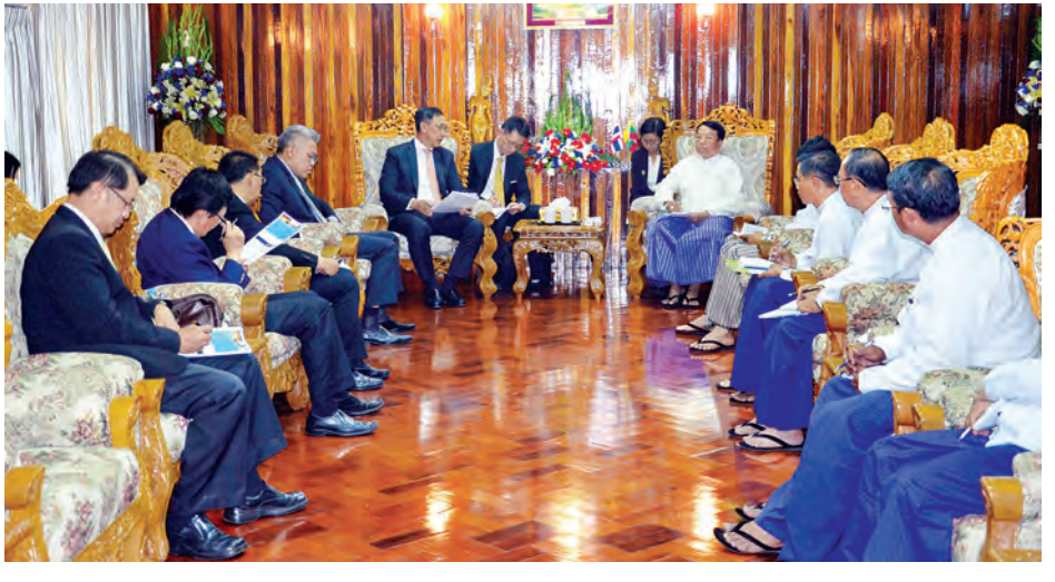
နေပြည်တော် မတ် ၂

အကောင်အထည်ဖော်နိုင်ရေးအတွက် လက်တွေ့ဆောင်ရွက်ရမည့် လုပ်ငန်းစဉ်များကို အသေးစိတ် ဆွေးနွေးကြကြောင်း သတင်းရရှိသည်။