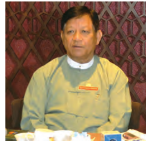
ဦးတင်အေး(ဥက္ကဋ္ဌ) ပြည်ထောင်စုရွေးကောက်ပွဲကော်မရှင်

ဆွေးနွေးခြင်းမှရရှိလာသည့် အကြံ ပြုချက်နှင့် သုံးသပ်ချက်များအပေါ် ပြန်လည်ဆွေးနွေးခဲ့ကြသည်။