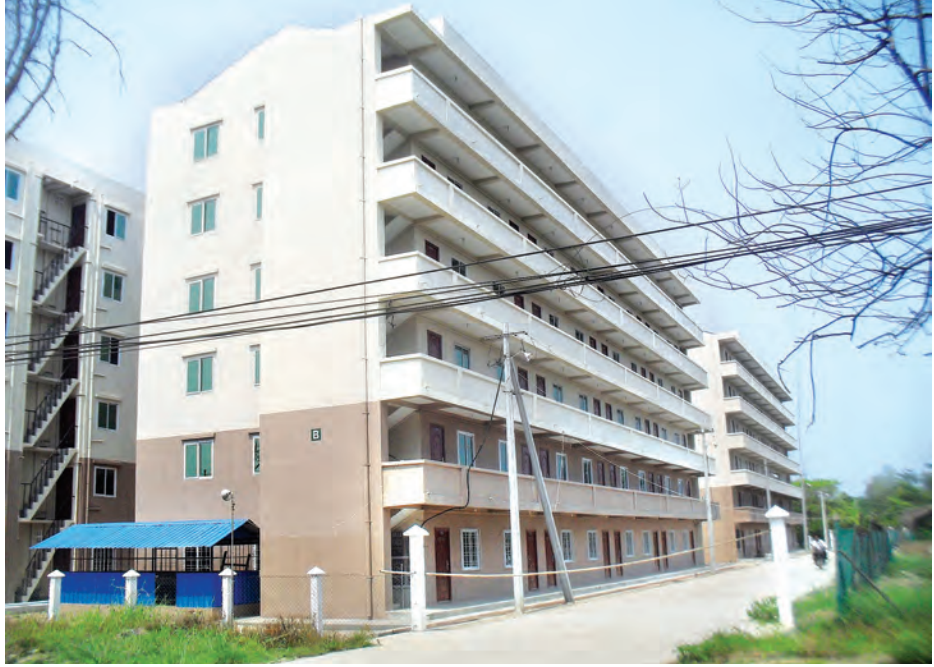
ရွှေပြည်သာစက်မှုဇုန် အမှတ်(၁)စက်မှုလမ်းနှင့် ပိတောက်လမ်းရှိ ရွှေပြည်သာတန်ဖိုးနည်းအိမ်ရာကို တွေ့ရစဉ်။