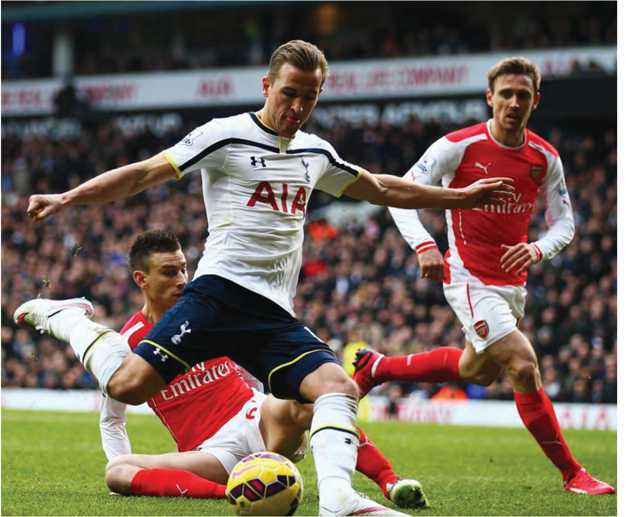
ဝက်စ်ဟမ်းတို့ကလည်း အခုတလော နိုင်ပွဲတွေဆက်နေတာမို့ ဒီပွဲက အကြိတ် အနယ်ရှိလာမယ့်ပွဲပါ။ နှစ်သင်းစလုံး အားထုတ်မှုကောင်းတဲ့အသင်းတွေမို့ ဒီပွဲဟာ အမှတ်ပွဲယူရမယ့်ကိန်းဆိုက်သွားနိုင်ပါတယ်။ ဆောက်သမ်တန်နဲ့ဆန်းဒါးလန်း ဆန်းဒါးလန်းကွင်းမှာ ကစားခဲ့တဲ့ နောက်ဆုံးပွဲမှာ ဆောက်သမ်တန်တို့

ဝက်စ်ဟမ်းကွင်းမှာ နောက်ဆုံးကစားခဲ့တဲ့ပွဲမှာတော့ ဒီနှစ်သင်းတစ်ဂိုးစီ သရေပွဲဖြစ်ခဲ့ပါတယ်။ ပုံမှန်ခြေစွမ်းရနေတဲ့ အဲဗာတန်ဟာ နောက်ဆုံးငါးပွဲ ကစားခဲ့ရာမှာ တစ်ပွဲသာရှုံးပြီး ကျန်လေးပွဲကို အနိုင်ရထားခဲ့ပါတယ်။