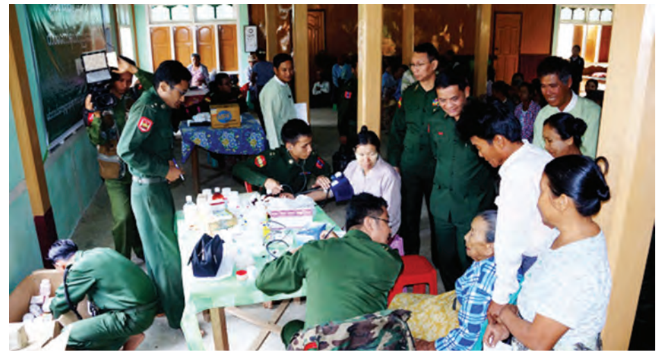
ကသာ မတ် ၂ တိုင်းစစ်ဌာနချုပ်တိုင်းမှူး ဗိုလ်မှူး မတ် ၁ ရက်က ကသာမြို့နယ် စစ်ကိုင်းတိုင်းဒေသကြီး ကသာ ခရိုင် ကသာမြို့သို့ အနောက်မြောက် ချုပ်သန်းလှိုင်နှင့် နမခေ-တပ်မတော် မင်းလယ်ကျေးရွာ ဘုန်းတော်ကြီး နယ်လှည့်ဆေးကုသရေးအဖွဲ့သည် ကျောင်းတွင် မင်းလယ်ကျေးရွာမှ (ခရိုင် ပြန်/ဆက်)

ကျေးရွာသူ ကျေးရွာသားများအား ကျန်းမာရေးစောင့်ရှောက်ရေး လုံလောက်မှုရရှိစေရန် အခမဲ့လာရောက် ကုသပေးခဲ့ကြောင်း သိရသည်။ ရှေးဦးစွာ အနောက်မြောက်တိုင်း စစ်ဌာနချုပ်တိုင်းမှူး ဗိုလ်မှူးချုပ် သန်းလှိုင်သည် မင်းလယ်ကျေးရွာ ဆရာတော်အား သင်္ကန်းပရိက္ခရာ စုံညီစွာဖြင့် ဆက်ကပ်လှူဒါန်းခဲ့သည်။ ထို့နောက် တပ်မတော်နယ်လှည့် ဆေးကုသရေးအဖွဲ့သည် မင်းလယ် ကျေးရွာရှိ သက်ကြီးရွယ်အိုများနှင့် ကျန်းမာရေးစောင့်ရှောက်မှုခံယူလို သူများအား မျက်စိ၊ နား၊ နှာခေါင်း၊ အထွေထွေကျန်းမာရေးလာရောက် ကုသသူ စုစုပေါင်း ၈၀ ခန့်ကို ကုသ ပေးခဲ့ကြောင်း သိရသည်။