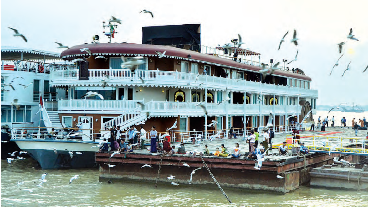
ဗီယက်နမ်မှ ခရီးသွားသင်္ဘော အနော်ရထာအား တွေ့ရစဉ်။