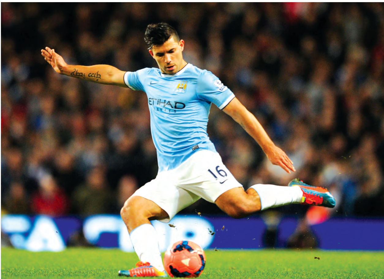
အောင်ပွဲခံဦးမှာပါ။

ဆွမ်ဆီးတို့က အာဆင်နယ်ကို ကောင်းကောင်းအခက်တွေ့စေနိုင်တဲ့ အသင်းဖြစ်ပြီး အဝေးကွင်းမှာလည်း ခြေစွမ်းပြနိုင်တဲ့ စွမ်းဆောင်ရည်ရှိပါ တယ်။ ပွဲကျပ်တွေ ဆက်တိုက်ဆင်နွှဲနေရတဲ့ အာဆင်နယ်တို့ကတော့ အခုပွဲ အိမ်ကွင်းဖြစ်တဲ့အပြင် တန်းစီဇယား ထိပ်ဆုံးကို ပြန်လည်ဖမ်းစားရအတွက် အမှတ်လိုအပ်နေတာမို့ ဒီပွဲကို အနိုင်ကစားပါလိမ့်မယ်။ အာဆင်နယ်တို့က နောက်ဆုံးသုံးပွဲ ကစားခဲ့တဲ့ရလဒ်ကိုကြည့်ရင် ရှုံးပွဲမရှိခဲ့တာမို့ အခုပွဲမှာလည်း