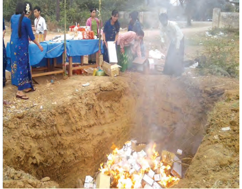
များ၊ တရားမဝင်ဆေးဝါးများနှင့် ဆေးဝါးအတုများ မီးရှို့ဖျက်ဆီးရာတွင် ငွေကျပ် ၄၃၂၁၆၄၆ တန်ဖိုးရှိ အစားအသောက်နှင့် ဆေးဝါး ၃၂၄ မျိုးကို မီးရှို့ဖျက်ဆီးခဲ့ကြောင်း သိရသည်။ ဖိုးချမ်း(မုံရွာ)

စစ်ကိုင်းတိုင်းဒေသကြီး စားသောက်ကုန်နှင့် ဆေးဝါး ကွပ်ကဲရေးဦးစီးဌာနမှ ၂၀၁၅ ခုနှစ်အတွင်း စားသုံးရန် မသင့်ဟု ထုတ်ပြန်ကြေညာထားသော ခွင့်မပြုဆိုးဆေး နှင့် တားမြစ်ဓာတုပစ္စည်းပါရှိသော စားသောက်ကုန်များ၊ သက်တမ်းလွန်ဆေးဝါးများ၊ တရားမဝင်ဆေးဝါးများနှင့် ဆေးဝါးအတုများ မီးရှို့ဖျက်ဆီးခြင်းကို ဖေဖော်ဝါရီ ၂၇ ရက်က မုံရွာမြို့ ဆားကျင်းသုသာန်အတွင်း ကျင်းပခဲ့ သည်။