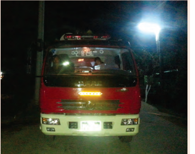
ရန်ကုန်တိုင်းဒေသကြီး သုံးစွဲမြို့နယ်အတွင်း မီးဘေးကာကွယ်ရေးအတွက် သတိပေးနိုးဆော်မှုများကို မြို့နယ်မီးသတ်ဦးစီးဌာနမှ ဖေဖော်ဝါရီ ၂၇ ရက် ညပိုင်းက အသံချဲ့စက်များဖြင့် လှည့်လည်ကြေညာစဉ်။ ကိုကျော်(သုံးခွ)

ဦးစီးဌာနကလည်း ဆေးဝါးကုသခြင်း၊ ကျန်းမာရေးစောင့်ရှောက်မှုပေးခြင်းများ ဆောင်ရွက်ပေးနေပြီး မြို့နယ်မီးသတ်ဦးစီးဌာနက သန့်ရှင်းရေးလုပ်ငန်းများ ဆောင်ရွက်ပေးလျက်ရှိသည်။ ထို့အပြင် မြို့နယ်ပြန်ကြားရေးနှင့် ပြည်သူ့ဆက်ဆံရေးဦးစီးဌာနကလည်း စေတနာရှင်များလှူဒါန်းထားသည့် အလှူပစ္စည်းနှင့် ငွေသားများကို မီးဘေးသင့်အိမ်ထောင်စုများသို့ ပေးအပ်ထောက်ပံ့လျက်ရှိရာ တစ်အိမ်ထောင်လျှင် ကျပ် ၁၅၀၀၀ ခန့်တန်ဖိုးရှိ ပစ္စည်းများ ထောက်ပံ့ထားပြီးဖြစ်ကြောင်း၊ ကျေးရွာနေပြည်သူများထံသို့ မီးဘေးလုံခြုံရေး ပညာပေးလက်ကမ်းစာစောင်များလည်း ပြန့်ဝေပေးလျက်ရှိကြောင်း သိရသည်။ (မြို့နယ် ပြန်/ဆက်)