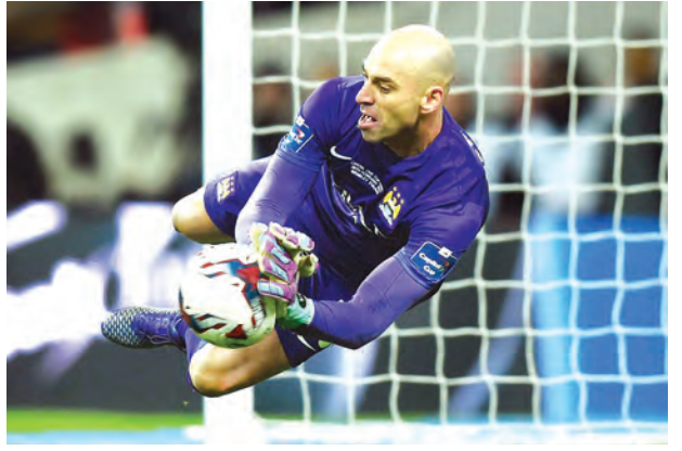
မန်စီးစီးဝိုးသမား ကာဘယ်လာရီ ပယ်နယ်တီကန်သွင်းမှုကို ကာကွယ်စဉ်။

ယင်းပွဲစဉ်တွင် လီဗာပူးအသင်းဘောလုံးပိုင်ဆိုင်မှုအသားရရှိခဲ့ပြီး ဝိုးကန်သွင်းခွင့် ၁၃ ကြိမ်အနက် ရှစ်ကြိမ်ပိုပေါက်တည့်ခဲ့သည်။ မန်စီးစီးအသင်းသည် ၂၂ ကြိမ်ဝိုးကန်သွင်းခွင့်ရခဲ့ပြီး ၁၂ ကြိမ် ဝိုးပေါက်တည့်ခဲ့သည်။ နည်းပြ ပယ်လီဂရီနိုသည် မန်စီးစီးမှထွက်ခွာမီ အသင်းအတွက် ဖလားတစ်လုံး ရယူပေးခဲ့ခြင်းဖြစ်သည်။ ကက်ပီတယ်ဝမ်းဖလားကို ၁၉၆၀ ပြည့်နှစ်တွင်စတင်ခဲ့ပြီး ဖလားအကြိမ်အများဆုံးပိုင်ဆိုင်ထားသည့်အသင်းမှာ လီဗာပူးဖြစ်ပြီး ရှစ်ကြိမ်အထိ ပိုလ်စွဲထားသည်။ မန်စီးစီးသည် လေးကြိမ်မြောက်ဖလားရရှိခြင်းဖြစ်ပြီး မန်ယူ၊ စပါး၊ နော်တင်ဟမ်တို့နှင့် အကြိမ်အရေအတွက် တူညီခဲ့သည်။ လီဗာပူးအောက်မှ ဖလားငါးကြိမ်စီရရှိထားသည့်အသင်းမှာ အက်စ်တွန်ဗီလာနှင့် ချယ်လ်ဆီးတို့ဖြစ်သည်။