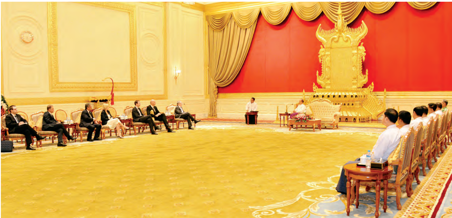
သမ္မတနှင့်အတူ ပြည်ထောင်စုဝန်ကြီး ဦးဝဏ္ဏမောင်လွင်၊ ဦးစိုးသိန်း၊ တာဝန်ရှိသူများ တက်ရောက်ကြပြီး ဝန်ကြီးနှင့်အတူ မြန်မာနိုင်ငံဆိုင်ရာ တက်ရောက်သည်။ အဆိုပါတွေ့ဆုံပွဲသို့ နိုင်ငံတော် ဒုတိယဗိုလ်ချုပ်ကြီး စိန်ဝင်း၊ ဦးရဲထွဋ်နှင့် ချက်သမ္မတနိုင်ငံ နိုင်ငံခြားရေး ချက်သမ္မတနိုင်ငံ သံအမတ်ကြီး (သတင်းစဉ်)

ပြည်ထောင်စုသမ္မတ မြန်မာနိုင်ငံတော် နိုင်ငံတော်သမ္မတ ဦးသိန်းစိန်သည် ချက်သမ္မတနိုင်ငံ နိုင်ငံခြားရေးဝန်ကြီး မစ္စတာ လျူဘို မိယာ ဇာအိုရာလက် ဦးဆောင်သည့် ကိုယ်စားလှယ်အဖွဲ့အား ယနေ့နံနက် ၁၁ နာရီတွင် နေပြည်တော်ရှိ နိုင်ငံတော်သမ္မတအိမ်တော် သံတမန် ဆောင်ရွက်ခန်းမ၌ လက်ခံ တွေ့ဆုံသည်။ (ယာဝုံ) ထိုသို့တွေ့ဆုံစဉ် နှစ်နိုင်ငံ ချစ်ကြည်ရေးနှင့် ပူးပေါင်းဆောင်ရွက်မှုများ ပိုမိုတိုးမြှင့်ရေး၊ စွမ်းအင်၊ သတ္တု၊ လယ်ယာစိုက်ပျိုးရေး၊ စားသောက်ကုန် ကဏ္ဍများနှင့် စပ်လျဉ်းသည့် စက်မှုစီးပွားရေး လုပ်ငန်းများတွင် လာရောက်ရင်းနှီးမြှုပ်နှံရေး၊ ခရီးသွားလုပ်ငန်း ဖွံ့ဖြိုးတိုးတက်ရေးကိစ္စရပ်များနှင့် မြန်မာ့နိုင်ငံရေးဖြစ်ပေါ် တိုးတက်မှုအခြေအနေများနှင့်စပ်လျဉ်း၍ ဆွေးနွေးကြသည်။