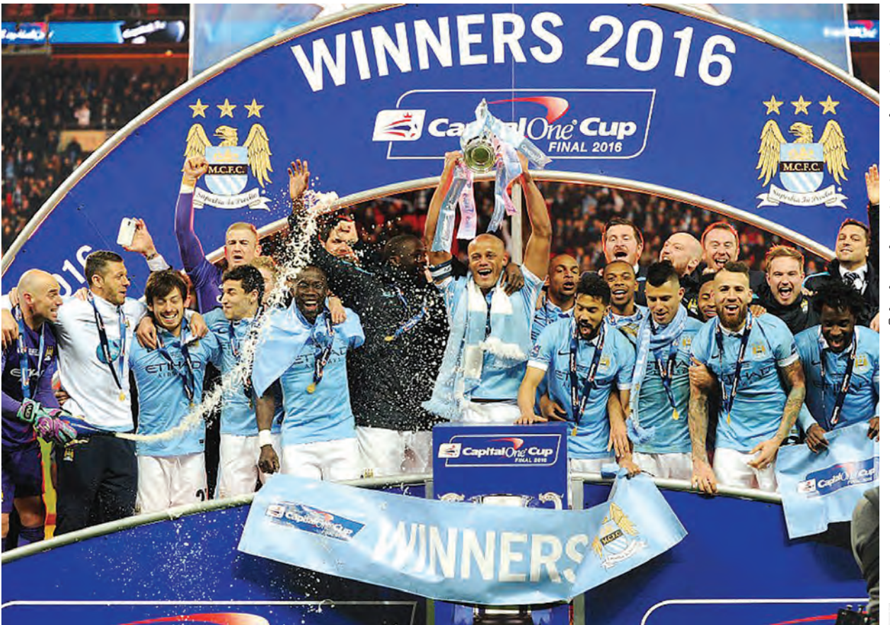
မန်စီးတီးတို့ ကက်ပီတယ်ဝမ်းပိုလ်လုပွဲအတွက် အောင်ပွဲခံနေစဉ်။