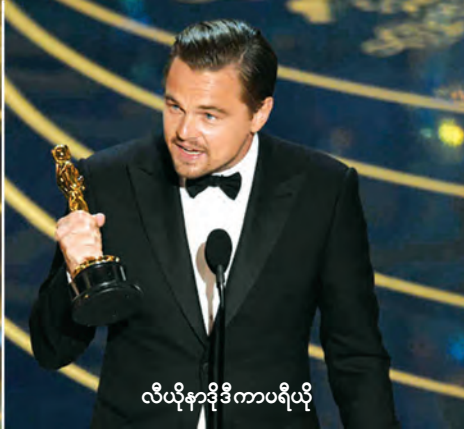
လီယိုနာဒိုဒီကာပရီယို

လော့အိန်ဂျလစ် ဖေဖော်ဝါရီ ၂၉ တနင်္ဂနွေနေ့က ကျင်းပခဲ့သည့် (၈၈)ကြိမ်မြောက် အော်စကာဆုပေးပွဲကြီးတွင် အကောင်းဆုံးရုပ်ရှင်ဇာတ်ကားဆုကို “Spotlight” အမည်ရှိ ဇာတ်ကားရရှိသည်။ အကောင်းဆုံး ရုပ်ရှင်ဇာတ်ညွှန်း