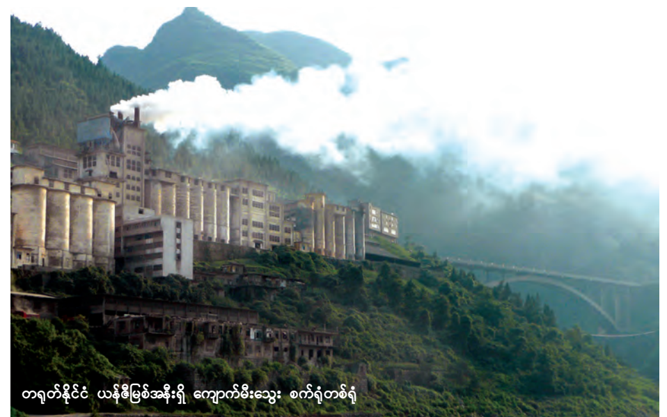
တရုတ်နိုင်ငံ ယန်စီမြစ်အနီးရှိ ကျောက်မီးသွေး စက်ရုံတစ်ရုံ

ပေကျင်း ဖေဖော်ဝါရီ ၂၉ တရုတ်နိုင်ငံသည် လုပ်သားအင်အားဖောင်းပွမှုကို လျှော့ချရန် သံမဏိစက်ရုံနှင့် ကျောက်မီးသွေးစက်ရုံများတွင် လုပ်ကိုင်နေသော အလုပ်သမားအရေအတွက် ၁ ဒသမ ၈ သန်းကို လျှော့ချရန်ခန့်မှန်းထားကြောင်း၊ သို့သော် အချိန်ကာလ မသတ်မှတ်ရသေးကြောင်း တနင်္လာနေ့တွင် ပြောသည်။ လုပ်ငန်းပိုင်းဆိုင်ရာ လေလွင့်ဆုံးရှုံးမှုများကို လျှော့နည်းစေရန် ဒေသရှိ အစိုးရအဖွဲ့က လုပ်ငန်းလည်ပတ်နေသည့် စက်ရုံများထဲမှ အရှုံးပေါ်နေသော စက်ရုံပေါင်းများစွာကို ဖယ်ရှားပြီး ပိုလျှံလုပ်သားပြဿနာကို ကိုင်တွယ်ဖြေရှင်းသွားမည်ဟု အလေးအနက် ပြောကြားခဲ့သည်။ ကျောက်မီးသွေးထုတ်လုပ်မှု ကဏ္ဍတွင် အလုပ်သမားဦးရေ ၁ ဒသမ ၃ သန်းမှာ အလုပ်ဆုံးရှုံးရမည်ဖြစ်ပြီး သံမဏိစက်ရုံမှ လုပ်သားငါးသိန်းတို့ အလုပ်အကိုင်ဆုံးရှုံးရမည်ဖြစ်ကြောင်း လူ့အရင်းအမြစ်နှင့် လူမှုဘဝ လုံခြုံရေးဝန်ကြီးရင်ဝိန်မင်က သတင်းစာရှင်းလင်းပွဲ၌ ပြောခဲ့သည်။ တရုတ်နိုင်ငံသည် လုပ်သားအင်အားဖောင်းပွမှုနှင့် ဖွံ့ဖြိုးတိုးတက်မှု နှောင့်နှေးခြင်းပြဿနာကို ရင်ဆိုင်နေရမည်ဖြစ်ရာ ယခုကိစ္စသည် အစိုးရ အာဏာပိုင်တစ်ဦးက အလုပ်အကိုင်ဆုံးရှုံးမှုများစွာကို ဖြစ်စေမည့် ပထမဆုံးသော ဆုံးဖြတ်ချက်ချမှုဖြစ်သည်ဟု ၎င်းက ပြောသည်။ (ရိုက်တာ)