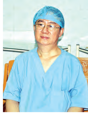
ဒေါက်တာမင်းသူ

သဖြင့် သွေးတိုးရောဂါရှိသူတွေ၊ ဆီးချိုရောဂါရှိတဲ့သူတွေ၊ ကိုယ့်ရဲ့ မိသားစုအတွင်းမှာ ကျောက်ကပ် ဝေဒနာ ခံစားခဲ့ရသူတွေဆိုရင် စောစောစီးစီး ပုံမှန်စစ်ဆေးဖို့လိုပါ တယ်။ တာကွယ်ခြင်းဟာ ကုသခြင်း ထက်ကောင်းတယ်။ ရောဂါသည် တွေဟာ ကြိုတင်လာပြထားမယ် ဆိုရင် ဥပမာ-ကျောက်ကပ်ပျက် တာနှစ်နှစ်နဲ့ပျက်မယ်၊ သူဟာပုံမှန် ကုသမှုခံယူရင် ၁၀ နှစ်၊ ၁၅ နှစ်