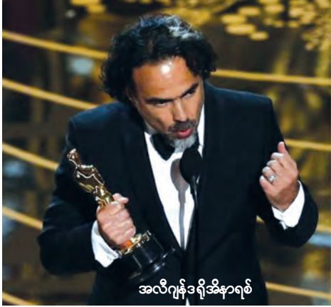
အလီဂျန်ဒရိုအိနာရစ်