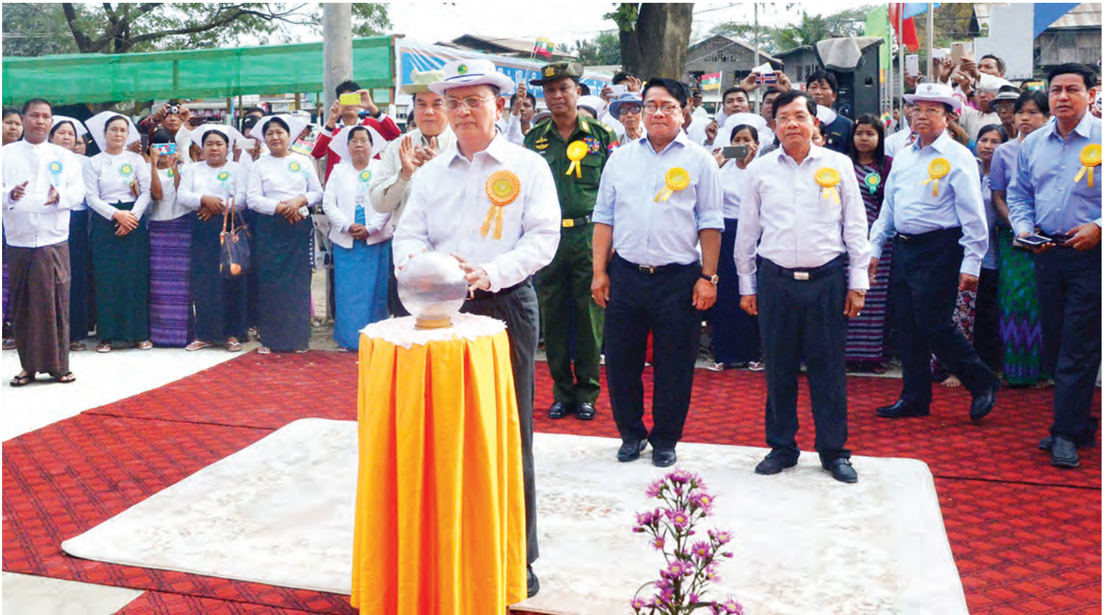
နိုင်ငံတော်သမ္မတ ဦးသိန်းစိန် သူနာပြုနှင့်သားဖွားသင်တန်းကျောင်း ကမ္ဘာ့ကျောက်စာတိုင်ကို စက်ခလုတ်နှိပ်ဖွင့်လှစ်ပေးစဉ်။ (သတင်းစဉ်)

နေပြည်တော် ဖေဖော်ဝါရီ ၂၇ ကျန်းမာရေးဝန်ကြီးဌာန ဆေးဘက်ဆိုင်ရာ လူ့စွမ်းအားအရင်းအမြစ်ဖွံ့ဖြိုးတိုးတက်ရေးနှင့် စီမံခန့်ခွဲရေးဦးစီးဌာန သူနာပြုနှင့်သားဖွားသင်တန်းကျောင်း ဖွင့်ပွဲအခမ်းအနားကို ယနေ့ ညနေပိုင်းတွင် စစ်ကိုင်းတိုင်းဒေသကြီး ကလေးမြို့ရှိ အဆိုပါ သင်တန်းကျောင်း ရှေ့မျက်နှာစာ၌ ကျင်းပရာ နိုင်ငံတော်သမ္မတဦးသိန်းစိန် တက်ရောက်၍ ကမ္ဘာ့ကျောက်စာတိုင်ကို စက်ခလုတ်နှိပ်ဖွင့်လှစ်ပေးသည်။