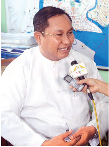
ရန်ကုန်တိုင်းဒေသကြီး သစ်တောနှင့်စွမ်းအင်ဝန်ကြီး ဦးကျော်စိုးစိုး။