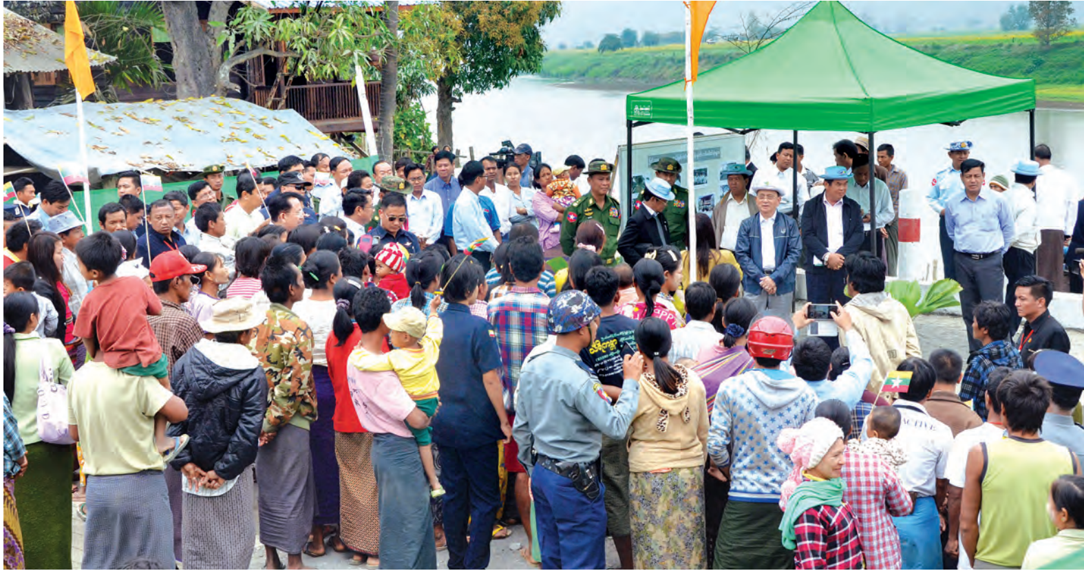
နိုင်ငံတော်သမ္မတ ဦးသိန်းစိန် ပြင်သာကျေးရွာ ဒေသခံပြည်သူများနှင့် ရင်းရင်းနှီးနှီးတွေ့ဆုံစဉ်။

ထုတ်မှုများ မရှိအောင် ကာကွယ် တားဆီးရန်တို့ကို လမ်းညွှန်မှာကြား သည်။