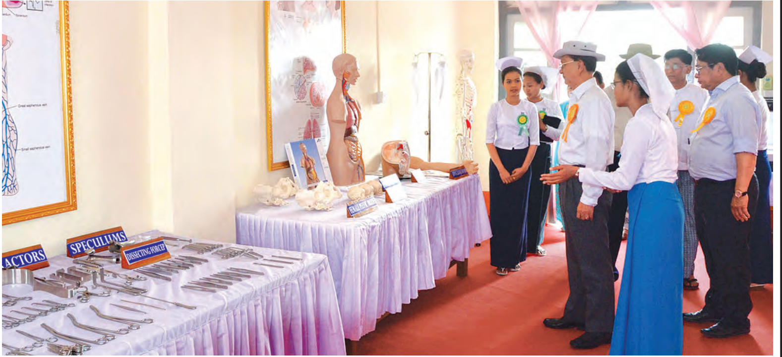
နိုင်ငံတော်သမ္မတ ဦးသိန်းစိန် ကလေးမြို့ရှိ သူနာပြုနှင့် သားဖွား သင်တန်းကျောင်းအတွင်း လှည့်လည်ကြည့်ရှုစဉ်။