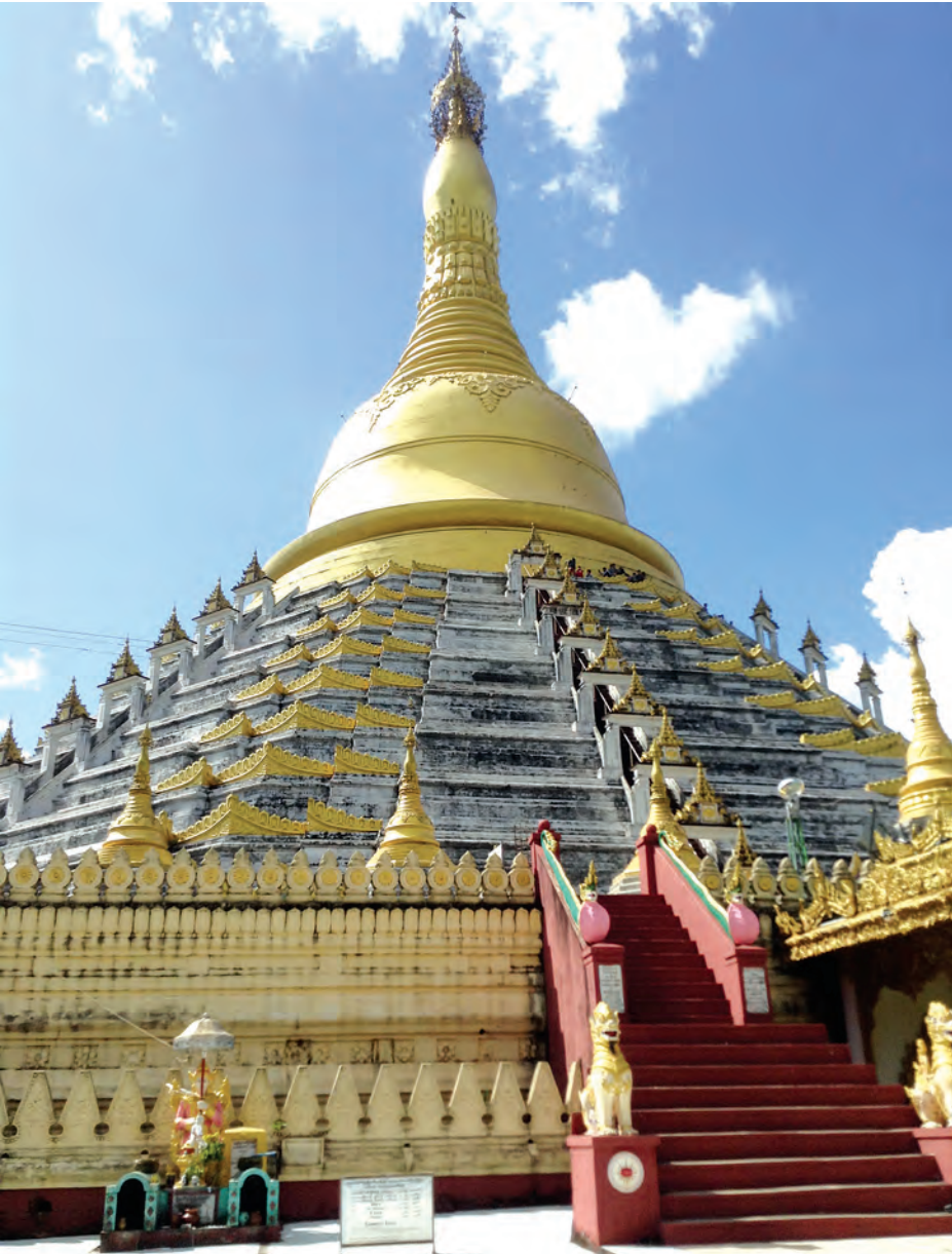
ဘုရင့်နောင်မင်းတရားကြီး တည်ထားခဲ့သည့် မဟာစေတီတော်။

မြန်မာ့သမိုင်းတွင် ဟံသာဝတီ မင်းနေပြည်အဖြစ် ထင်ရှားခဲ့သည့် ပဲခူးမြို့၌ ဘုရားစေတီများ များစွာ ရှိကြသည့်အနက် ရွှေမော်ခေနှင့် မဟာစေတီတို့သည် အထူးထင်ရှားသော စေတီတော်နှစ်ဆူဖြစ်သည်။ မြန်မာ နှင့် မွန်ဘုရင်များ ပဲခူး၌တည်ထားခဲ့သည့် စေတီများ အနက် မဟာစေတီသည် ရွှေမော်ခေစေတီပြီးလျှင် ဉာဏ်တော်အမြင့်ဆုံးနှင့် ထူထပ်အကြီးဆုံးစေတီတော် ဖြစ်ကာ မဟာစေတီကို တည်ထားခဲ့သည့် အလျှင်သည် ဒုတိယမြန်မာနိုင်ငံတော်ကြီးကို တည်ထောင်ခဲ့သော ဘုရင့်နောင်မင်းတရား (အေဒီ ၁၅၅၁- ၁၅၈၁) ဖြစ်သည်။