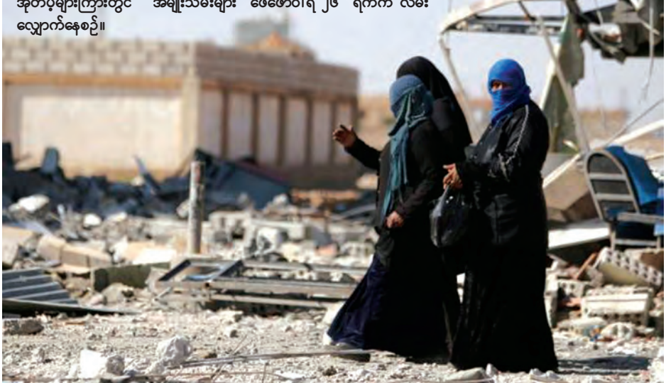
ဆီးရီးယားနိုင်ငံ ဟာဆာကာပြည်နယ် အယ်လ်ရာဒီမြို့ အုတ်ပွဲများကြားတွင် အမျိုးသမီးများ ဖေဖော်ဝါရီ ၂၆ ရက်က လမ်း လျှောက်နေစဉ်။

အင်အားကြီးနိုင်ငံများ၏ စေ့စပ်ညှိနှိုင်းမှုအရ ပြည်တွင်းစစ်အဆုံးသတ်ရန် ကြိုးပမ်းမှုမှာ မအောင်မြင်ဘဲ ရှိသည်။