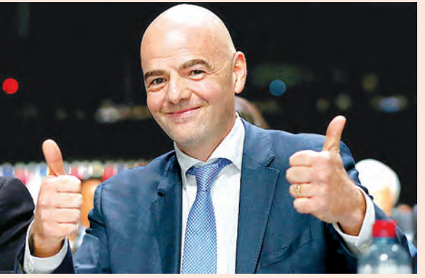
ဖီဖာဥက္ကဋ္ဌသစ် ဂိယန်နီအင်ဖန်တီနို

၁၉၉၈ ခုနှစ်ကတည်းက ဥက္ကဋ္ဌတာဝန်ထမ်းဆောင်ခဲ့သည့် ဆတ်ဘတ္တလားကို အနိုင်ယူပြီး ဂိယန်နီအင်ဖန်တီနိုကို ဖီဖာဥက္ကဋ္ဌသစ်အဖြစ် ရွေးချယ်ခဲ့ကြောင်း ကမ္ဘာ့ဘောလုံးအဖွဲ့ချုပ်က သောကြာနေ့က ကြေညာခဲ့သည်။ ဥရောပဘောလုံးအဖွဲ့ချုပ်၏ အတွင်းရေးမှူးဖြစ်သူ အင်ဖန်တီနိုသည် ပထမအကျော့တွင် ၈၈ မဲဖြင့် ဦးဆောင်ခဲ့ပြီး AFC ဥက္ကဋ္ဌ ရှိတ်ခ်ဆယ်မန်က ၈၅ မဲ၊ ဂျော်ဒန်မင်းသား အလီဘင်အယ်လ်ဟူစ်နိုက ၂၇ မဲနှင့် ဂျိုရီးယျန်နိုနိုက ခုနှစ်မဲ ရရှိခဲ့သည်။ ဒုတိယအကျော့ယှဉ်ပြိုင်မှုတွင် အင်ဖန်တီနိုက ၁၁၅ မဲဖြင့် အနိုင်ရရှိခဲ့ပြီး ၎င်း၏အမိကပြိုင်ဘက် ဆယ်လ်မန်ကမူ ၈၈ မဲ ရရှိခဲ့သည်။ ဖီဖာ၏ပုံရိပ်ကို မြှင့်တင်သွားမည်ဖြစ်ပြီး တစ်ကမ္ဘာလုံးအတိုင်းအတာဖြင့် ဖီဖာကိုလေးစားယုံကြည်မှုရရှိအောင် ကြိုးပမ်းသွားမည်ဖြစ်ကြောင်း ဖီဖာဥက္ကဋ္ဌ ရာထူးလက်ခံသည့်နေ့တွင် အင်ဖန်တီနိုက ပြောခဲ့သည်။ ဖီဖာအနေဖြင့် အခက်ခဲအကြမ်းတမ်းဆုံးအချိန်များကို ကျော်ဖြတ်ခဲ့ပြီဖြစ်ကြောင်း၊ ပြုပြင်ပြောင်းလဲမှုများစွာပြုလုပ်ရန် လိုအပ်ကြောင်း၊ ကောင်းမွန်သော အုပ်ချုပ်မှုနှင့် ပွင့်လင်းမြင်သာမှုရှိအောင် ကြိုးပမ်းသွားမည်ဖြစ်