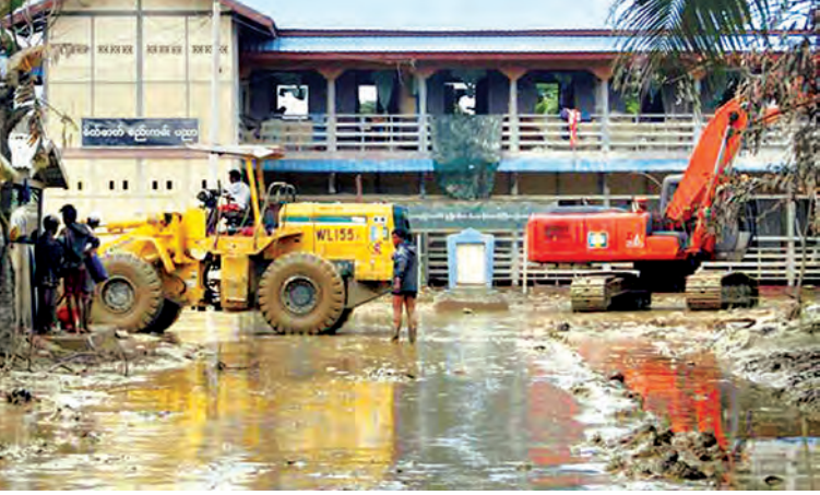
ကလေး အထက(၁) ကျောင်းအဝင်လမ်း ကွန်ကရစ်မခင်းမီတွေ့ရစဉ်(အပေါ်ပုံ)နှင့် ကျောင်းအဝင်လမ်းအား ကွန်ကရစ်မခင်းပြီးနောက်တွေ့ရစဉ်။ (ယာပုံ)