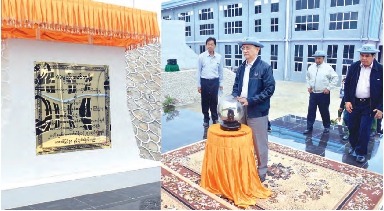
နိုင်ငံတော်သမ္မတ ဦးသိန်းစိန် ရာဇဂြိုဟ်ရေအားလျှပ်စစ်ဓာတ်အားပေးစက်ရုံ ကမ္ဘည်းကျောက်စာတိုင်ကို စက်ခလုတ်နှိပ်ဖွင့်လှစ်ပေးစဉ်။ (သတင်းစဉ်)

များ တိုးတက်လာစေနိုင်မည်ဖြစ် သည့်အတွက် မိသားစုတစ်စုချင်းစီ ၏ ဝင်ငွေနှင့် လူမှုစီးပွားဘဝများ ကြိုးစားကြလျှင် ကြိုးစားသလောက် တိုးတက်ရရှိတော့မည်မှာ မလွဲစကန် ဖြစ်ပါကြောင်း။ နိုင်ငံတော်အစိုးရအနေဖြင့် နိုင်ငံ သား အားလုံးတို့၏ ရေရှည် အမျိုး သားရေးအကျိုးစီးပွား အခြေခံလို အပ်ချက် အတွက် ရင်းနှီးမြှုပ်နှံတည် ဆောက် အကောင်အထည်ဖော်ပေး နိုင်ခဲ့သော နိုင်ငံတော်၏ ကျေးဇူး တရားတို့ကို တုံ့ပြန်သောအားဖြင့် မိမိတို့ နေထိုင်မိမိအားထားကြရာ နယ်မြေဒေသအသီးသီး တိုးတက်ရေး အတွက်လည်းကောင်း၊ နိုင်ငံနှင့် အဝန်း တိုင်းဒေသကြီးနှင့်ပြည်နယ် အလိုက် ဟန်ချက်ညီဖွံ့ဖြိုးတိုးတက် လာရေးအတွက် လည်းကောင်း အပြန်အလှန် ရိုင်းပင်းကူညီကြပြီး “တစ်လှေတည်းစီး တစ်ခရီးတည်း သွား ပြည်ထောင်စုစိတ်ဓာတ်ဖြင့် စည်းစည်းလုံးလုံး ညီညီညွတ်ညွတ်၊ ခိုင်ခိုင်မြဲမြဲ” အတူလက်တွဲကြလျက် နိုင်ငံသားအားလုံး ကျရာအခန်း ကဏ္ဍမှ ဦးထမ်းပဲ့ထမ်း ကြိုးပမ်းပါ ဝင် တည်ဆောက်သွားကြရန်