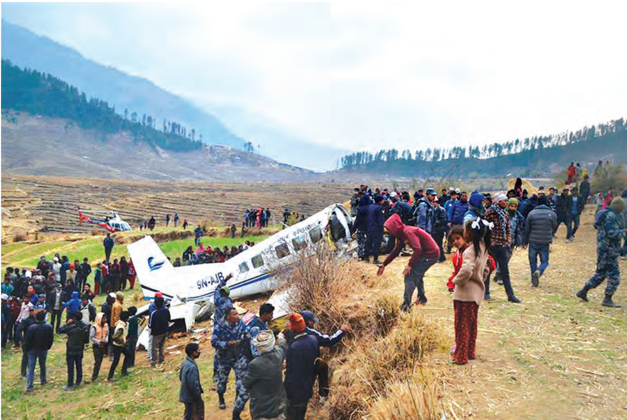
ပျက်ကျလေယာဉ်ကဲ့သို့သာမန်ဒပ်လေကြောင်းလိုင်းမှ 9N-AJB လေယာဉ်ကို နီပေါအနောက်ဘက် ကလိုင်ကော့တ်ဒေသ၌ ဖေဖော်ဝါရီ ၂၆ ရက်က တွေ့ရစဉ်။