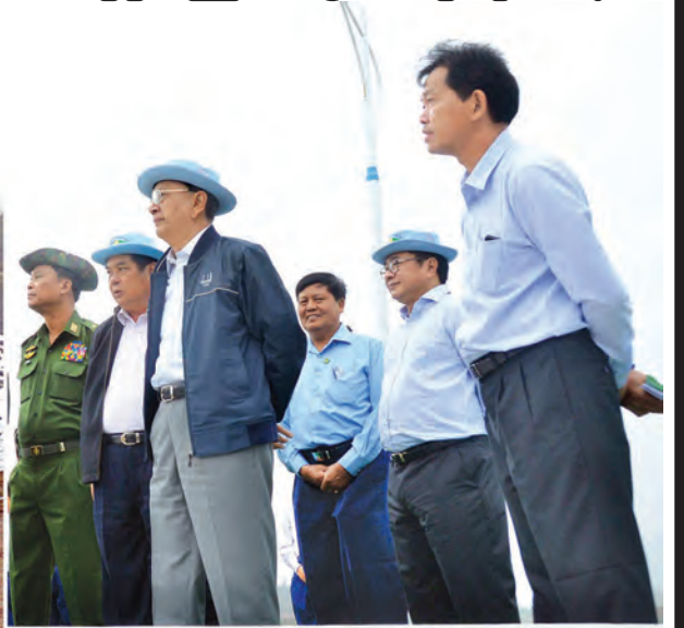
နိုင်ငံတော်သမ္မတ ဦးသိန်းစိန် ရာဇဗြိဟံရေလှောင်တံခံကို ကြည့်ရှုစစ်ဆေးစဉ်။