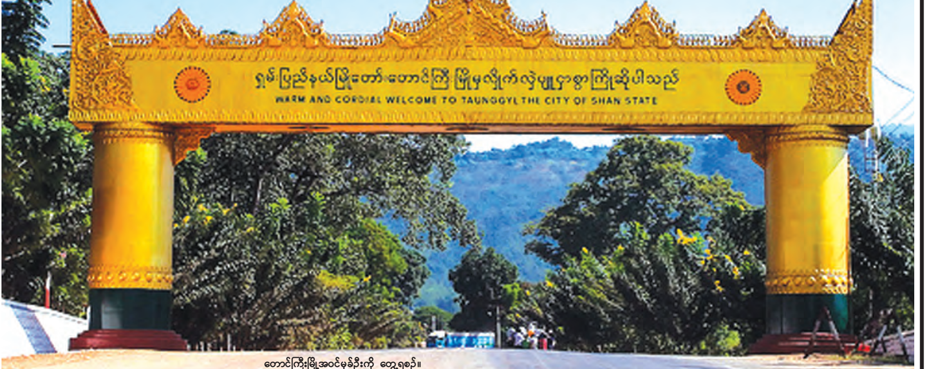
တောင်ကြီးမြို့အဝင်မုခ်ဦးကို တွေ့ရစဉ်။

တောင်ကြီးမြို့က မြန်မာသက္ကရာဇ် ၁၂၀၀(ခရစ်နှစ် ၁၈၃၈ ခုနှစ်)ခန့်တွင် ပအိုဝ်းကျေးရွာတစ်ရွာအဖြစ် တည်ရှိခဲ့သော်လည်း ၁၈၉၂ခုနှစ်၌ မြို့ကွက်စီရိုက်ပြီး ၁၈၉၄ ခုနှစ်စက်တင်ဘာ ၁၅ ရက်တွင် မြို့အဖြစ် သတ်မှတ်ခဲ့ခြင်းဖြစ်သည်။ တောင်ကြီးမြို့ ဖြစ်ပေါ်လာခြင်းမှာ ညောင်ရွှေမြို့ အရှေ့ဘက် ဝိုင်းသောက်တွင် တပ်စခန်းချထားသော စာတပ်မင်းခံတပ်အား ငှက်ဖျားပေါများသဖြင့် နေရာရွှေ့ပြောင်းခဲ့ရာမှ ယခုနေရာသို့ ရောက်ရှိခဲ့သည်။ ဂေါ်ရခါးတပ်ရင်း (၃)နှင့်အတူ ပါလာသူ နိုင်ငံရေးအရာရှိ ဟေးလီဒီဘရမ်းက တောင်ကြီးမြို့နေရာကို စတင်တွေ့ရှိခဲ့ခြင်းဖြစ်ပြီး မြို့စတင်တည်