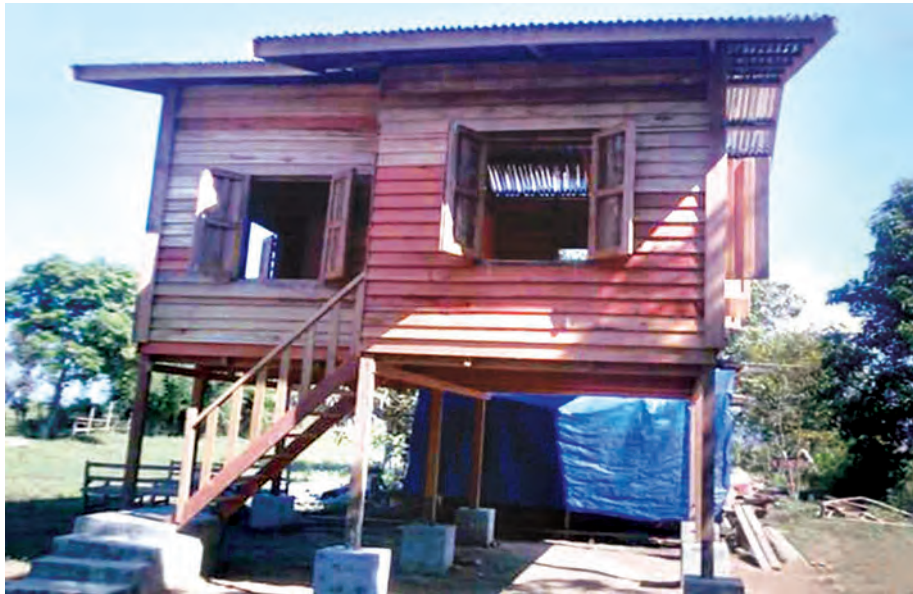
ကလေးမြို့ ပြင်သာကျေးရွာ အိမ်အမှတ် (၄) တည်ဆောက်ပြီးတွေ့ရစဉ်။ (သတင်းစဉ်)

ကလေး - ပြင်သာ လမ်းပိုင်းအား ကွန်ကရစ်ခင်း အပြီး တွေ့ရစဉ်။ (သတင်းစဉ်)