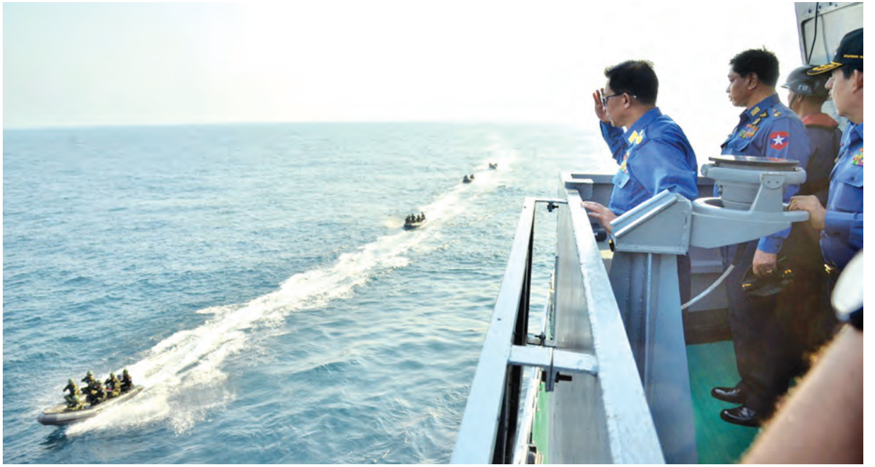
တပ်မတော်ကာကွယ်ရေးဦးစီးချုပ် ပိုလ်ချုပ်မှူးကြီးမင်းအောင်လှိုင်အား တပ်မတော်(ရေ) အထူးစစ်ဆင်ရေးတပ်ဖွဲ့ (NAVY SEALs)က ချေမှုန်းရေး စက်တပ်ရော်ဘာလှေလေးစင်းမှတစ်ဆင့် မျှော်စင်များ ချီတက်အလေးပြုစဉ်။ (မြဝတီ)

လေ့ကျင့်ခန်းများ အပြီးတွင် လေ့ကျင့်ခန်း၌ပါဝင်ကြသော ရဟတ် ယာဉ်နှင့် တပ်မတော်(ရေ) အထူး