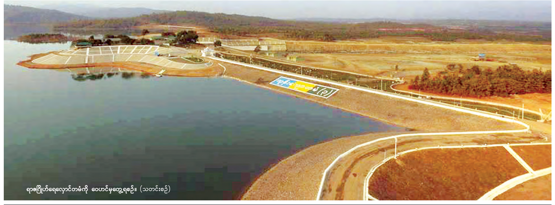
ရာဇဂြိုဟ်ရေလှောင်တံမံကို ဝေဟင်မှတွေ့ရစဉ်။ (သတင်းစဉ်)

နိုင်ငံတော်သမ္မတ ဦးသိန်းစိန်နှင့် အဖွဲ့ဝင်များ ရာဇဂြိုဟ်ရေလှောင် တံမံ ဖွင့်ပွဲအခမ်းအနားသို့ တက်ရောက်လာကြသူများနှင့်အတူ စုပေါင်း မှတ်တမ်းတင်ဓာတ်ပုံရိုက်ကြစဉ်။ (သတင်းစဉ်)