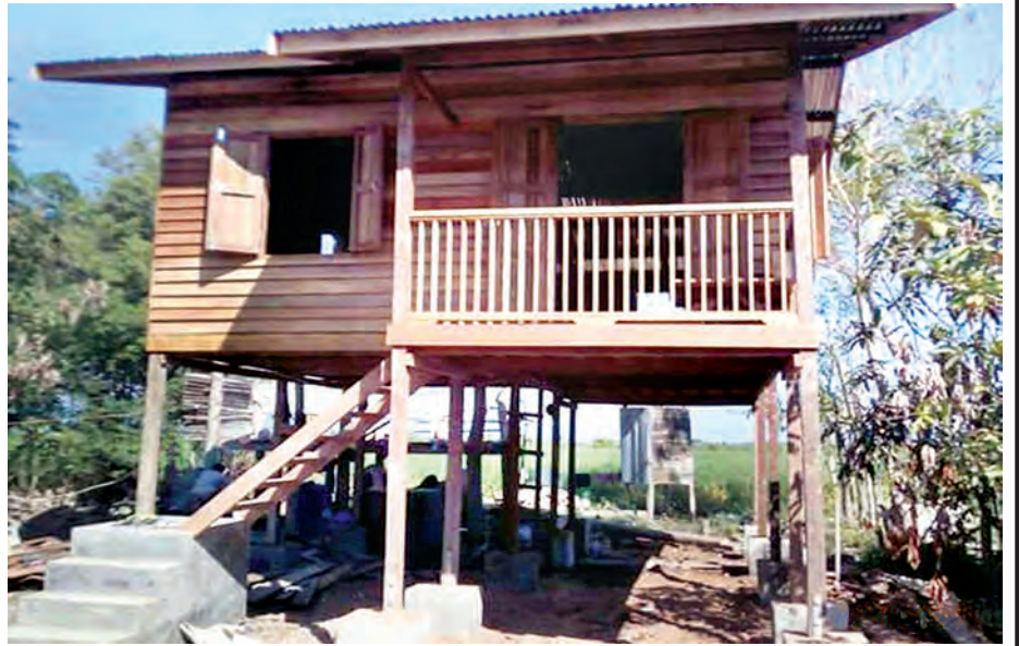
ကလေးမြို့ ပြင်သာကျေးရွာ အိမ်အမှတ် (၅) တည်ဆောက်ပြီးတွေ့ရစဉ်။ (သတင်းစဉ်)