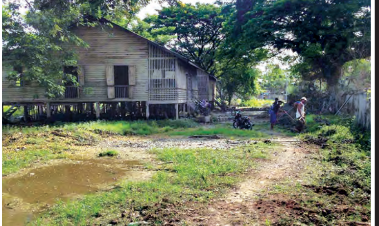
ကလေး အထက(၁) ကျောင်းဆရာမ နေအိမ်များ မပြုပြင်မီတွေ့ရစဉ်(အပေါ်ပုံ)နှင့် ကျောင်းဆရာမ နေအိမ်များ ပြုပြင်ပြီးနောက်တွေ့ရစဉ်။ (ဝဲပုံ)