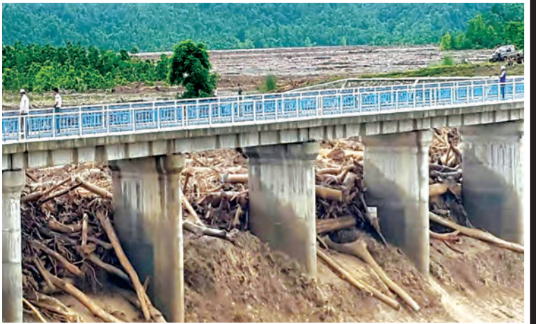
ကလေးဒေသ ရေကြီးရေလျှံမှု ဖြစ်ပွားပြီးနောက် ရာဇဗြိဟံရေလှောင်တံခံ ရေပိုလွှဲတွင် သစ်လုံးများ၊ အမှိုက်များ ပိတ်ဆို့နေသည်ကို ၁-၈-၂၀၁၅ ရက်က တွေ့ရစဉ်။