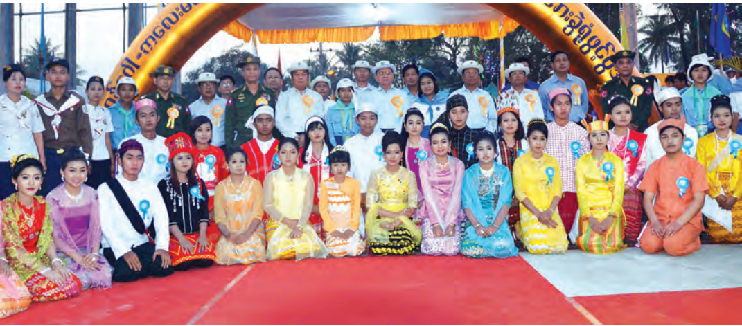
နိုင်ငံတော်သမ္မတ ဦးသိန်းစိန် ၂၃၀ ကေစီ ဂန့်ဂေါ-ကလေး မဟာဓာတ်အားလိုင်းနှင့် ၆၆/၁၁ ကေစီ ကလေးဓာတ်အားခွဲရုံ ဖွင့်ပွဲတွင် တက်ရောက်လာကြသူများနှင့်အတူ စုပေါင်းမှတ်တမ်းတင်ဓာတ်ပုံရိုက်စဉ်။