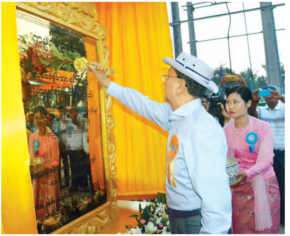
နိုင်ငံတော်သမ္မတ ဦးသိန်းစိန် ၂၃၀ ကေပီ ဂန့်ဂေါ-ကလေး မဟာဓာတ်အားလိုင်းနှင့် ၆၆/၁၁ ကေပီ ကလေး ဓာတ်အားခွဲရုံ ကမ္ဘာ့ကျော်စာတိုင်ကို အမွှေးနံ့သာရည်ပတ်ဖျန်းပေးစဉ်။ (သတင်းစဉ်)

လျှပ်စစ် ဓာတ်အားပေးသည့် လုပ်ငန်းတွင် ဓာတ်အားလိုင်းသွယ် တန်းခြင်း၊ ဓာတ်အားထုတ်လုပ်ခြင်း လုပ်ငန်းများကို ဝန်ကြီးဌာနအနေ ဖြင့် ခက်ခဲခဲဆဲ ဆောင်ရွက်ရပါ ကြောင်း။ ရွှေလီ(၁)ရေအားလျှပ်စစ် စက်ရုံမှ မန္တလေးမြို့အနီး ရွှေစာရုံသို့ သွယ်တန်းသည့် မဟာဓာတ်အားလိုင်း ကို ငါးနှစ်ကျော် တည်ဆောက်ခဲ့ ရသကဲ့သို့ တောင်ကုတ်-မအီ-အမ်း- မြောက်ဦး-ပုဏ္ဏားကျွန်းသို့ သွယ်တန်း သည့် မဟာဓာတ်အားလိုင်းကိုလည်း နှစ်နှစ်ခွဲကျော် တည်ဆောက်ခဲ့ရပါ ကြောင်း။ သို့သော် ယနေ့ဖွင့်လှစ်သည့် ဂန့်ဂေါ-ကလေး မဟာဓာတ်အား လိုင်းနှင့် ဓာတ်အားခွဲရုံများကို ၂၀၁၅ ခုနှစ် ဇန်နဝါရီ ၆ ရက်က လုပ်ငန်းများ စတင်ခဲ့ပြီး ၂၀၁၆ ခုနှစ် ဖေဖော်ဝါရီ ၈ ရက်တွင် ဓာတ်အားပို့လွှတ်နိုင်ခဲ့ သည့်အတွက် တစ်နှစ်အတွင်း ပြီးအောင် မနားမနေ ကြိုးပမ်းဆောင် ရွက်ခဲ့ခြင်းဖြစ်ပါကြောင်း။ ယခု စီမံကိန်းလုပ်ငန်းအတွက် ပစ္စည်းတန်ဖိုး အမေရိကန်ဒေါ်လာ ၂၀ ဒသမ ၃၃၃ သန်းနှင့် တည် ဆောက်ရေးစရိတ် ငွေကျပ် ၃၈၅၀ ဒသမ ၂၆၈ သန်း ကုန်ကျခံ ဆောင် ရွက်ခဲ့ခြင်း ဖြစ်ပါကြောင်း။ ဓာတ်အားတစ်ယူနစ် ထုတ်လုပ်မှု