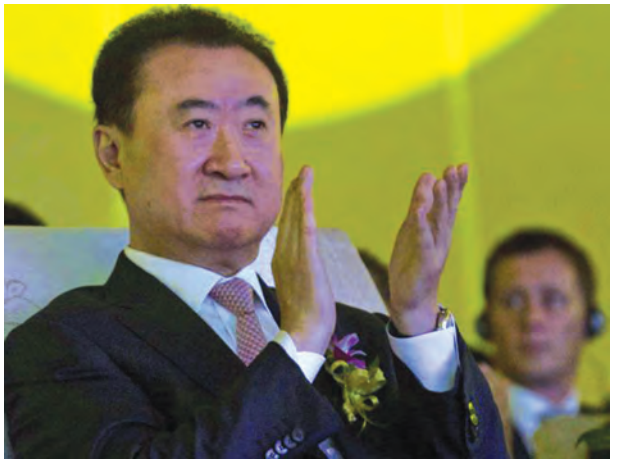
တရုတ်နိုင်ငံ၏အချမ်းသာဆုံးပုဂ္ဂိုလ် ဒါလီယံဝမ်ဒါအုပ်စုဥက္ကဋ္ဌ ဝမ်ကျန်လင်း။