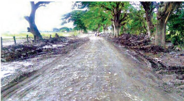
ကလေး-ပြင်သာ လမ်းအား ကွန်ကရစ်ခင်းမီ တွေ့ရသည့်အနေအထား (အပေါ်ပုံ)နှင့် ကွန်ကရစ်ခင်းပြီးနောက် ညီညာဖြောင့်ဖြူးသည့် လမ်းအနေအထားကို တွေ့ရစဉ်။(ယာပုံ) (သတင်းစဉ်)