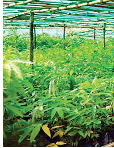
လိုင်ရိုးမတောင်ပေါ်ကြီးပိုင်း(၁) ကွင်းအမှတ်(၅)မှ စံပြဝါးမျိုးစုံစိုက်ခင်းပြကွက်ရှိဝါးပျိုးပင်များအား တွေ့ရစဉ်။