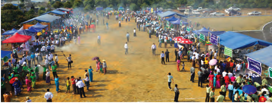
တစ်နာရီသတ်မှတ်ပေးပြီး အချိန်ကိုကိုင်ဆောင်ရွက်နိုင်မှု၊ သန့်ရှင်းသပ်ရပ်မှုနှင့် စနစ်ကျနမှု စည်းလုံးညီညွတ်မှု၊ အချိုးအစားမှန်တန်မှု၊ ထမနဲအရသာပြည့်စုံမှု စသည်တို့ဖြင့် အမှတ်ပေးရာမူဆယ်မြို့နယ် စာပေနှင့် ယဉ်ကျေးမှုအဖွဲ့ (တချင်း၊ ဗမာ၊ ပလောင်၊ ရှမ်း)တို့မှ ပထမဆု ငွေကျပ်၅၀၀၀၊ ဟိုမုန့် တောင်ရပ်ကွက် ဈေးရပ်ကွက်တို့မှ ဒုတိယဆုငွေကျပ် ၄၀၀၀၊ ခရိုင်/မြို့နယ်ပညာရေး များမှ တတိယဆုငွေကျပ် ၃၀၀၀ နှင့် နှစ်သိမ့်ဆု ခုနစ်ဆူတို့အား တာဝန်ရှိသူများက ချီးမြှင့်ခဲ့ကြောင်း သိရသည်။

မူဆယ် ဖေဖော်ဝါရီ ၂၅ ရမ်းပြည်နယ် မြောက်ပိုင်း မူဆယ်မြို့နယ်တွင် မြန်မာ့ရိုးရာ ထမနဲထိုးပြိုင်ပွဲနှင့် ဆုပေးပွဲအခမ်းအနားကို ဖေဖော်ဝါရီ ၂၂ ရက်က မူဆယ်မြို့၊ ပြည်ထောင်စုအားကစားကွင်း၌ ကျင်းပသည်။ (ယာပုံ) အဆိုပါ ထမနဲထိုးပြိုင်ပွဲတွင် ဌာနဆိုင်ရာများ၊ လူမှုရေးအသင်းအဖွဲ့များ၊ ရပ်ကွက်သူ/သားများ၊ လုပ်ငန်းရှင်များ၊ ပုဂ္ဂလိကဘဏ်များ စသည်တို့မှ ပြိုင်ပွဲဝင်အသင်းပေါင်း ၃၉ သင်း ဝင်ရောက်ယှဉ်ပြိုင်ကြပြီး အကအဖွဲ့များက ဦးရွှေရိုးနှင့် ဒေါ်မိုးအကများဖြင့် ပါဝင်ဆင်နွှဲခဲ့ကြသည်။ ထမနဲထိုးချိန်