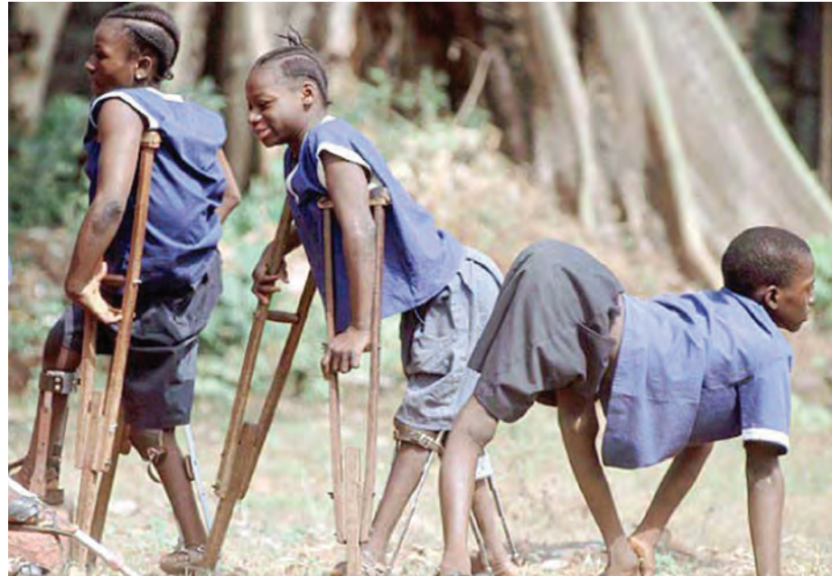
ပိုလီယိုအကြောသေရောဂါ ခံစားနေရသော ကလေးများ။

လေ့လာစရာရှိပေမယ့် အသုံးဝင်တဲ့ကင်ဆာဆေး အဖြစ် သေချာပေါက်ဖော်ထုတ်နိုင်တော့မယ်ဆိုတာ တင်ပြလိုက်ရပါတယ်။ ကလေးများတွင် ဖြစ်တတ်သည့် ကင်ဆာရောဂါ ကြိုတင်သိနိုင်သည့် စမ်းသပ်မှုတွေရှိ နောက်ဖော်ပြလိုတဲ့ သတင်းတစ်ပုဒ်က ကလေး တွေမှာ ဖြစ်တတ်တဲ့ ကင်ဆာရောဂါတချို့ကို ကြိုတင် သိနိုင်တဲ့ လွယ်ကူတဲ့ စမ်းသပ်မှုတစ်ခုကို ရှာတွေ့ခဲ့ပြီ ဆိုတဲ့ သတင်းပါ။ ဒီလိုတွေ့ခဲ့သူတွေကတော့ လန်ဒန် ကင်းဘရစ်ချ်တက္ကသိုလ် Alden Broke's Hospital က ဆေးပညာရှင်တွေပဲဖြစ်ပါတယ်။ သူတို့ တွေ့ရှိခဲ့တဲ့ ကင်ဆာအမျိုးအစားကတော့ Germ Cell Tumor ခေါ်တဲ့ ကင်ဆာမျိုးဖြစ်ပါတယ်။ Germ Cell ဆိုတာ သာမန်အားဖြင့် ယောက်ျားလေးဆိုရင် Testis (ဝှေးစေ့)၊ မိန်းကလေးဆိုရင် Ovary (မျိုးဥ) တို့ ပုံမှန်ရှိတတ်ကြတာပါ။ ဒါပေမယ့် ဆဲလ်တွေဟာ ကလေးသန္ဓေတည်စဉ်မှာ တခြားကိုယ်ခန္ဓာအစိတ် အပိုင်းမှာရောက်သွားပြီး ကြီးထွားလာရင် Germ ဆဲလ် Tumor ဆိုတဲ့ ကင်ဆာကျိတ်ဖြစ်လာတာဖြစ်ပါတယ်။ ဒီကင်ဆာ ရှိမရှိ သံသယရှိတဲ့ကလေးတွေကို သွေး ဖောက်ပြီးဖြစ်စေ၊ ကျောရိုးဆီရည် (Cerebro-Spinal fluid-CSF) ကို ဖောက်ပြီးဖြစ်စေ စစ်ဆေးနိုင်ပြီ လို့ဆိုပါတယ်။ ဒီအရည်တွေမှာ အနည်းဆုံး Micro