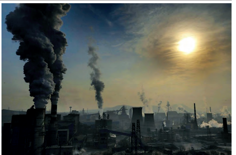
ဟီဘေးရှိ သံမဏိစက်ရုံတစ်ခုမှထွက်ပေါ်လာသော မီးခိုးထုကြီးကို တွေ့ရစဉ်။

ဟီဘေးတွင် လာမည့် ၂၀၂၀ ပြည့်နှစ်၌ ရေထုညစ်ညမ်းမှုကင်းစင်ရေးစီမံကိန်းအတွက် ယွမ် ၂၀၀ ဘီလီယံ (အမေရိကန်ဒေါ်လာ ၃၀ ဒသမ ၂ ဘီလီယံ) ရင်းနှီးမြှုပ်နှံသွားမည်ဟုသိရသည်။ ဟီဘေးသည် တရုတ်နိုင်ငံရှိ ပတ်ဝန်းကျင်အညစ်ညမ်းဆုံး ပြည်နယ် ၁၀ ခုတွင် အပါအဝင်ဖြစ်သည်။ (ဆင်ဟွာ)