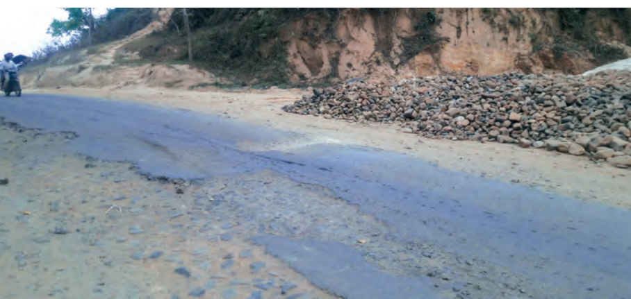
စစ်ကိုင်းတိုင်းဒေသကြီး အင်းတော်မြို့နယ် မော်လူးအုပ်စု ဟဲနုရွာ တပ်ပေါင်းစုစေတီအနီး ရွှေဘိုမြစ်ကြီးနား ပြည်ထောင်စုကားလမ်းမ မြစ်ကြီးနား ပြည်ထောင်စုကားလမ်းမပေါ်ရှိ မိုင်တိုင် (၁၆၂) အနီး လမ်းပိုင်းအတွင်းရှိ ကတ္တရာများမှာ အသစ်