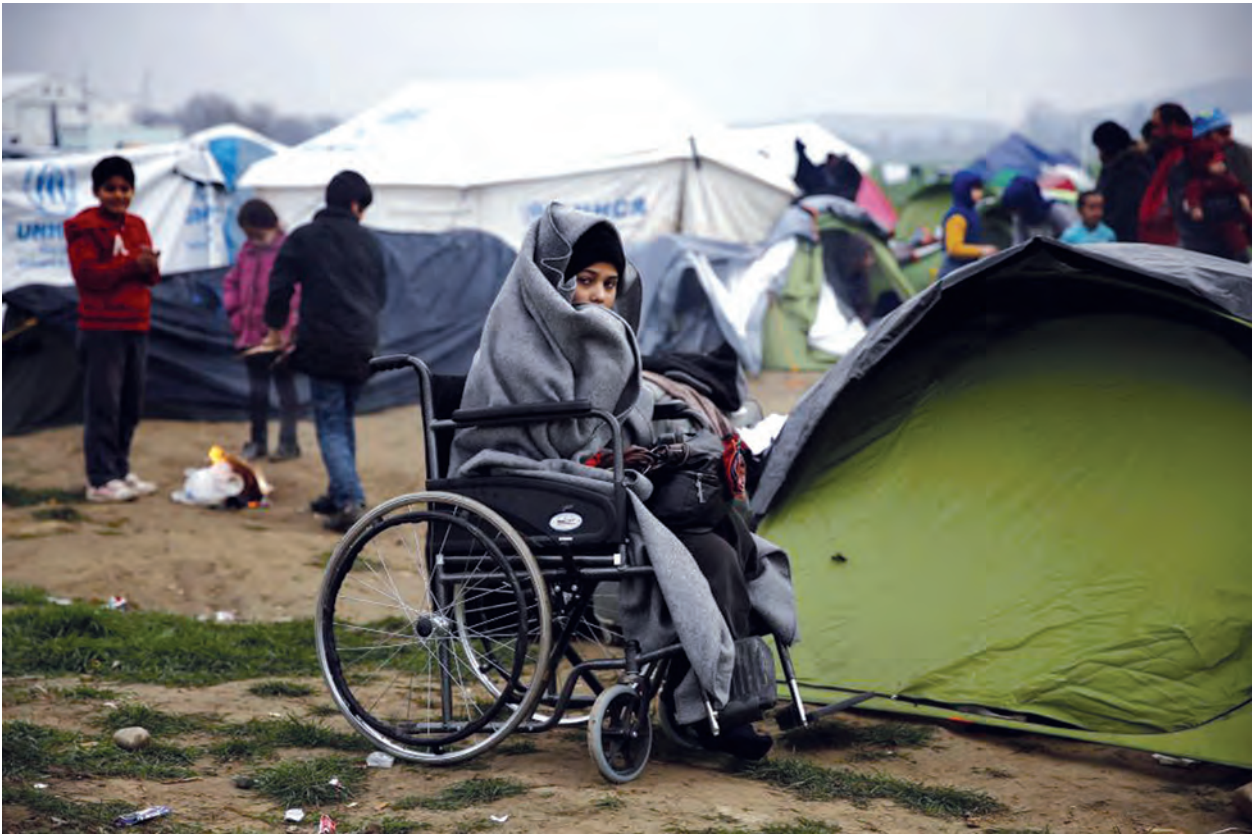
ဖေဖော်ဝါရီ ၂၄ ရက်က ဂရိ-မက်ဆီဒိုးနီးယားနယ်စပ်အနီးရှိ ယာယီတစ်ခန်းများတွင် သောင်တင်နေသည့် ဆီးရီးယားဒုက္ခသည်များကို တွေ့ရစဉ်။