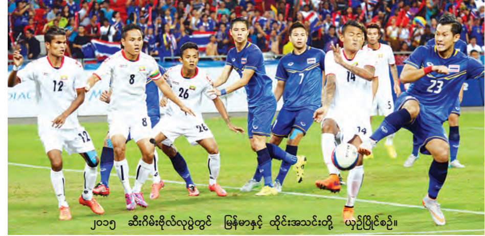
၂၀၁၅ ဆီးဂိမ်းဗိုလ်လုပွဲတွင် မြန်မာနှင့် ထိုင်းအသင်းတို့ ယှဉ်ပြိုင်စဉ်။

မြန်မာအသင်းသည် ယူ-၂၃ ပြိုင်ပွဲအဖြစ် ပြောင်းလဲပြီးနောက်ပိုင်း တွင် ရွှေဆုမရဖူးသော်လည်း ၂၀၀၇ ပြိုင်ပွဲနှင့် ၂၀၁၅ ပြိုင်ပွဲတို့တွင် ငွေ တံဆိပ်ဆု ရရှိခဲ့သည်။ စင်ကာပူ နိုင်ငံတွင် ကျင်းပခဲ့သည့် (၂၈)ကြိမ် မြောက် ဆီးဂိမ်းပြိုင်ပွဲတွင် မြန်မာ အသင်းမှာ ခြေစွမ်းပြကစားနိုင်ခဲ့ပြီး ဗိုလ်လုပွဲတွင် ထိုင်းအသင်းကို ရှုံးနိမ့် ခဲ့ခြင်းဖြစ်သည်။