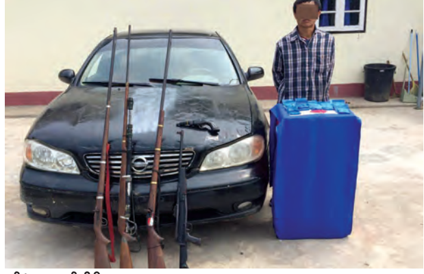
ဝမ်းပုံ ဖေဖော်ဝါရီ ၂၅ မူးယစ်ဆေးဝါးတားဆီး နှိမ်နင်းရေးရဲတပ်ဖွဲ့ တပ်ဖွဲ့စု (၃၀)မှ ပူးပေါင်း အဖွဲ့သည် ဖေဖော်ဝါရီ ၂၄ ရက် နံနက် ၁၀ နာရီခွဲက တာချီလိတ်မြို့နယ်

မိုင်းဖုန်း(က)အုပ်စု စံဖူးကျေးရွာ အမှတ်(၆၈)ရှိ အိုင်ဆီကျောက်၏ နေအိမ်ကို ဝင်ရောက်ရှာဖွေရာ စုစုပေါင်း စိတ်ကြွေးသွပ်ဆေးပြား ၄၁၅၀၊ အလေးချိန် ၄၁၅ ရခမ့်ခန့် ကာလတန်ဖိုးကျပ်သိန်းပေါင်း ၁၀၃ ဒသမ ၇၄ သိန်းခန့်နှင့် တူမီး သေနတ်အရှည် သုံးလက်၊ အတိုတစ်လက်၊ လေသေနတ်တစ်လက်၊ ခြံဝင်းအတွင်းမှ ၉၈/--- မော်တော်ယာဉ်တစ်စီးတို့ကို တွေ့ရှိရသဖြင့် သိမ်း ဆည်းခဲ့သည်။