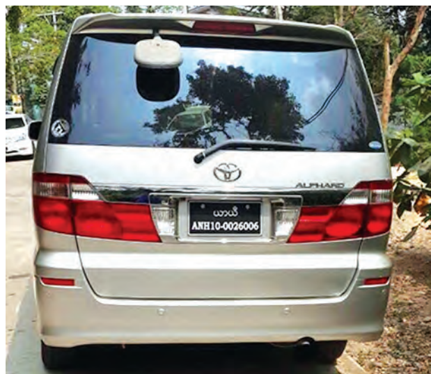
တရားဝင်သတ်မှတ်ထားခြင်းမရှိသည့် အကွရာဂဏန်းများ ရေးသား တပ်ဆင်၍ သွားလာနေသော ယာဉ်တစ်စီးကိုတွေ့ရစဉ်။

မော်တော်ယာဉ်ဥပဒေအရ မော်တော်ယာဉ်တွင် တပ်ဆင်ရမည့် မော်တော်ယာဉ် နံပါတ်များနှင့်ပတ်သက်၍ ယာဉ်နံပါတ်ပြားကို မထင်ရှားအောင် ပြုလုပ်ခြင်း၊ ယာဉ်နံပါတ်ပြားကို ထင်ယောင်ထင်မှားဖြစ်စေရန်ပြုလုပ်ခြင်း၊ မမှန်ကန်သော မော်တော်ယာဉ်နံပါတ်ပြားကို တင်ဆင်အသုံးပြုခြင်းများကို မည်သူမျှ မပြုလုပ်ရဟု တားမြစ်ပြဌာန်းထားသည်။