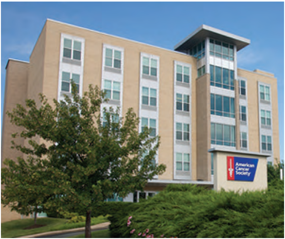
American Cancer Society အဆောက်အအုံကို တွေ့ရစဉ်။

RNA ခေါ်တဲ့ Protein အစ အနည်းဆုံး လေးခုထက်မနည်း ပါဝင်နေပြီဆိုရင် ကင်ဆာရှိနေပြီလို့ ယူဆနိုင်ကြောင်း ဖော်ပြထားပါတယ်။ သူတို့အဆိုအရ တခြား Malignant Cancer တချို့ကိုလည်း ဒီနည်းနဲ့ ခန့်မှန်းနိုင်လိမ့်မယ်လို့ ဆိုကြောင်း တင်ပြလိုက်ရပါတယ်။ ပိုလီယိုရောဂါဆေးအခဲတိုက်ကျွေးနေသည့် မြေးအဘွား နှစ်ယောက်ကို အာဖဂန်စစ်သွေးကြွများတိုက်ခိုက် နောက်ဖော်ပြလိုတဲ့ သတင်းတစ်ပုဒ်ကတော့ အာဖဂန်နစ္စတန်နိုင်ငံက ပိုလီယိုရောဂါဆေး အခဲ မြေအဘွားနှစ်ယောက် အကြောင်းပါ။ ဒီမြေးအဘွားဟာ ကာကွယ်ဆေးတိုက် ကျွေးဖို့ သွားနေစဉ်မှာ အာဖဂန်စစ်သွေးကြွနှစ်ဦးရဲ့ လက်ချက်နဲ့ အဘွားက နေရာတွင်မှာပဲ ပွဲချင်းပြီး သေဆုံးရပြီး မြေးမလေးကတော့ ပြင်းထန်တဲ့ ဒဏ်ရာ တွေရဲ့ ဆေးရုံတင် ကုသမှုခံယူနေရတယ်ဆိုတဲ့ သတင်းပါ။ ပါကစ္စတန်နဲ့ အာဖဂန်နစ္စတန်နိုင်ငံမှာ ဒီသတင်းမျိုးတွေ ယခင်ကလည်း ထွက်ပေါ်ခဲ့ပါတယ်။ အဲဒီနိုင်ငံတွေက စစ်သွေးကြွတွေဟာ အခုလိုကာကွယ် ဆေးပေးနေတဲ့ လုပ်သားတွေကို သူတို့ရဲ့သတင်းတွေ ထောက်လှမ်းဖို့ လာတဲ့လူတွေဆိုပြီး ပစ်ခတ်ခဲ့ကြတာ ပါလို့ဆိုပါတယ်။ အခုဆိုရင် ကမ္ဘာမှာ ပိုလီယိုရောဂါရှိ တဲ့နိုင်ငံလေးနိုင်ငံလောက်ပဲရှိတော့တာမှာ အာဖဂန် နိုင်ငံ နဲ့ ပါကစ္စတန်နိုင်ငံတို့ ပါဝင်နေပါတယ်။ ဒီ Campaign ကြီးရဲ့ အကျိုးကျေးဇူးကြောင့် အာဖဂန်နိုင်ငံမှာ ၁၉၉၉