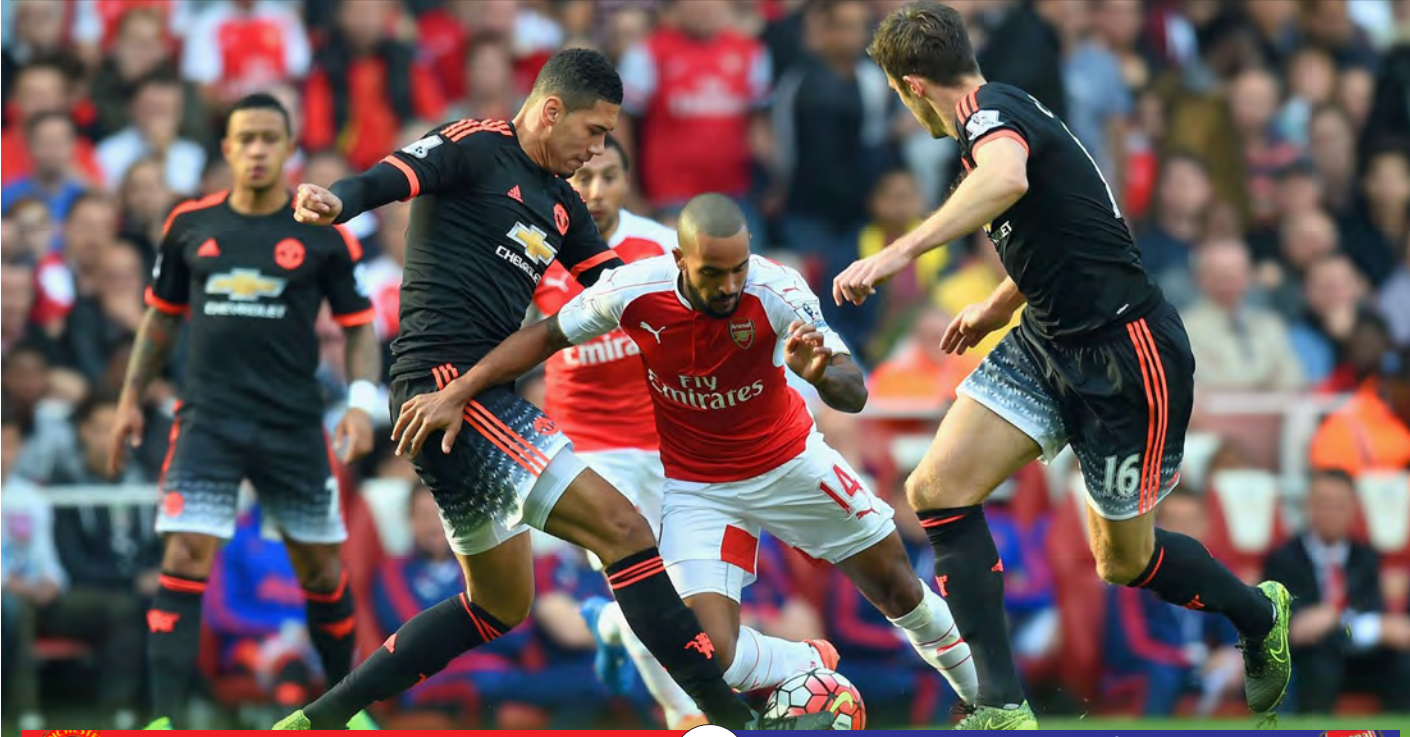
MANCHESTER UNITED VS KICK-OFF - 20:35 ARSENAL

ပရီမီယာလိဂ်ပွဲစဉ် (၂၇) ကို လာမယ့် ဖေဖော်ဝါရီ ၂၇ရက်၊ ၂၈ရက်တွေမှာ ကျင်းပသွားမှာဖြစ်ပါတယ်။ ဒီပွဲစဉ်မှာ ကက်ပီတယ်ဝမ်းဖလား ဗိုလ်လုပွဲကစားရမယ့် လီဗာပူး၊ မန်စီးတီးတို့ရဲ့ ပွဲစဉ်တွေ ပါဝင်မှာမဟုတ်ဘဲ ရှစ်ပွဲတည်းသာ ကျင်းပသွားမှာဖြစ်ပေမယ့် မန်ယူနဲ့ အာဆင်နယ်ဆုံတွေ့တဲ့ ပွဲပါဝင်နေလို့ စိတ်ဝင်စားဖို့ကောင်းနေပါတယ်။