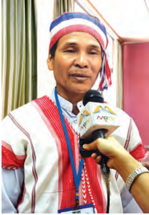
ဖထီး စောဝင်းရွှေ