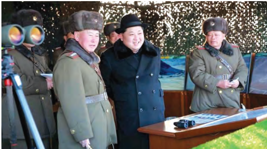
မြောက်ကိုရီးယားခေါင်းဆောင် ကင်ဂျီအန်း ကိုရီးယားပြည်သူ့တပ်မတော်စစ်ရေးလေ့ကျင့်မှုကို ကြည့်ရှုနေစဉ်။

အဆိုပါမူကြမ်းသည် တစ်ဦးချင်း အမည်ပျက် တင်သွင်းမှုစာရင်းကို တိုးချဲ့လုပ်ဆောင်သွားဖွယ်ရှိနေသည် ဟု ပြောသည်။ (ရိုက်တာ)