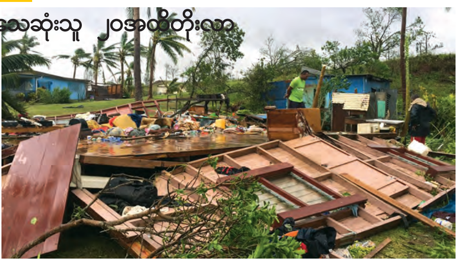
ဖိဂျီ၌ ဆိုင်ကလုန်းမုန်တိုင်းဝင်ရောက်ပြီးနောက် ပျက်စီးနေသောနေအိမ်အချို့။

ဖိဂျီ ဖေဖော်ဝါရီ ၂၂ ပစိဖိတ်ကျွန်းနိုင်ငံ ဖြစ်သည့် ဖိဂျီတွင် အင်အားပြင်းထန်သော ဆိုင်ကလုန်းမုန်တိုင်း တိုက်ခတ်ခဲ့ပြီးနောက် တနင်္လာနေ့မှစတင်ကာ အပျက်အစီးများကို ရှင်းလင်းနေပြီ ဖြစ်ကြောင်း၊ နေအိမ်အများအပြား ပျက်စီးပြီး ဆက်သွယ်ရေး လမ်းကြောင်းများ ပြတ်တောက်ကာ သေဆုံးသူ ၂၀ အထိရှိသွားပြီဖြစ်ကြောင်း ရိုက်တာသတင်းတွင် ဖော်ပြသည်။ ဖိဂျီလူဦးရေ ကိုးသိန်းတွင် အများစုမှာ မြေနိမ့်ပိုင်းဒေသများ၌ နေထိုင်လျက်ရှိရာ သဘာဝဘေးကြောင့် ဖြစ်ပေါ်လာသော ကျန်းမာရေးပြဿနာများ ထပ်မံဖြစ်ပွားလာနိုင်ခြင်းအပေါ် အကူအညီပေးရေး အေဂျင်စီများက သတိပေးလျက် ရှိသည်။ ကောက်ပဲသီးနှံစိုက်ခင်းများ အများအပြားပျက်စီးပြီး ရေချို