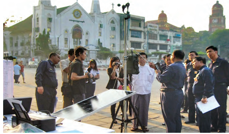
ရန်ကုန်မြို့၊ မြို့တော်ခန်းမအနီး တပ်ဆင်မည့် လေထုအရည်အသွေးတိုင်းတာစက်ကို တာဝန်ရှိသူများ ကြည့်ရှုစစ်ဆေးစဉ်။

ချင်တာက ထုတ်ပြန်ဖို့ဆိုရင် Base line data ကိုပဲ ထုတ်ပြန်လို့ရဦးမယ်။ များတယ် နည်းတယ်ဆိုတာ ဒုတိယအကြိမ် တိုင်းမှပဲ သိမှာလေ။ ဒုတိယ