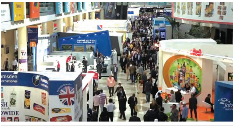
ဒူဘိုင်း၌ ငါးရက်ကြာကျင်းပနေသော ကမ္ဘာ့အကြီးဆုံး အစားအစာပြပွဲကြီး။

တိုကျို ဖေဖော်ဝါရီ ၂၂ ဂျပန်နိုင်ငံ အစားအစာထုတ်လုပ်သူများနှင့် အစားအစာကုမ္ပဏီများသည် ကျန်းမာရေးနှင့် ညီညွတ်ပြီး အရည်အသွေးမီ ထုတ်ကုန်ပစ္စည်းများကို အရှေ့အလယ်ပိုင်း ကမ္ဘာ့အကြီးဆုံးအစားအစာပြပွဲကြီးသို့ တင်ပို့ခဲ့သည်။ တနင်္ဂနွေနေ့က ဒူဘိုင်း၌ ငါးရက်ကြာကျင်းပသော အစားအစာပြပွဲသို့ နိုင်ငံပေါင်း ၁၂၀ မှ ကုမ္ပဏီနှင့် အဖွဲ့အစည်းပေါင်း ၅၀၀၀ ကျော် ဝင်ရောက်ပြသခဲ့သည်။ ဂျပန်နိုင်ငံ ပူကူရီးမားဆန်စပါးများသည် ဘေးကင်းကြောင်း ဂျပန်ကုန်သွယ်ရေးအဖွဲ့က အရှေ့အလယ်ပိုင်းအထိ ဈေးကွက်ချဲ့ထွင်ရန် လုပ်ဆောင်လျက်ရှိကြောင်း သိရသည်။ (အင်န်အိတ်ချီကေ)