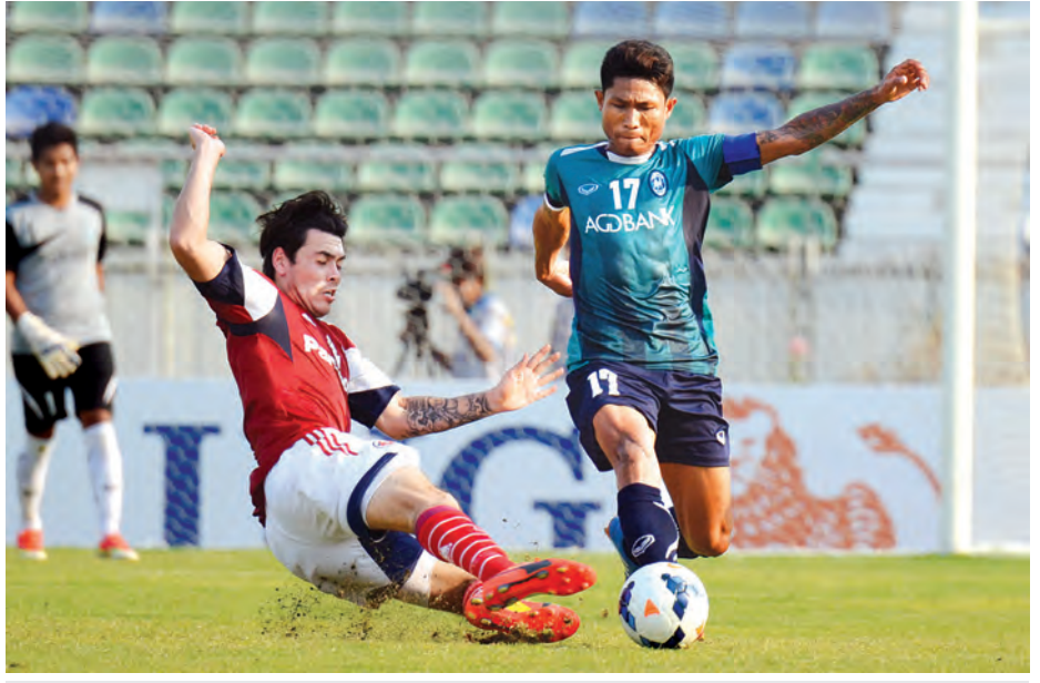
၂၀၁၄ ခုနှစ် AFC Cup ပြိုင်ပွဲတွင် ရန်ကုန်အသင်းနှင့် တောင်တရုတ်အသင်းတို့တွေ့ဆုံစဉ်။

ရန်ကုန် ဖေဖော်ဝါရီ ၂၂ အာရှ ဘောလုံးအဖွဲ့ချုပ်က ကြီးမှူးကျင်းပလျက်ရှိသည့် ၂၀၁၆ AFC Cup ပြိုင်ပွဲအုပ်စုစဉ်များကို ဖေဖော်ဝါရီ ၂၄ ရက်မှ စတင်ကာ ကျင်းပတော့မည်ဖြစ်သည်။ အဆိုပါ ပြိုင်ပွဲကို မြန်မာကိုယ်စားလှယ်အသင်းများအဖြစ် ရန်ကုန်အသင်းနှင့် ရောဂါတစ်အသင်းတို့ ယှဉ်ပြိုင်မည်ဖြစ်သည်။ AFC Cup ပြိုင်ပွဲကို အသင်း ၃၂ သင်း ဝင်ရောက်ယှဉ်ပြိုင်မည်ဖြစ်ပြီး လေးသင်းရှစ်အုပ်စုခွဲကာ အိမ်ကွင်း၊ စာမျက်နှာ ၁၄ ကော်လံ ၅ ◆