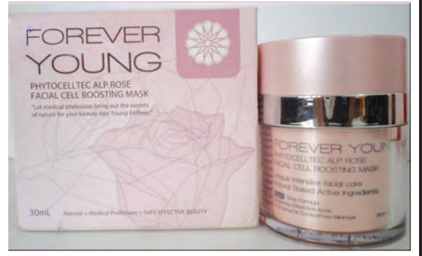
FOREVER YOUNG Phytocelltec Alp Rose Facial Cell Boosting Mask