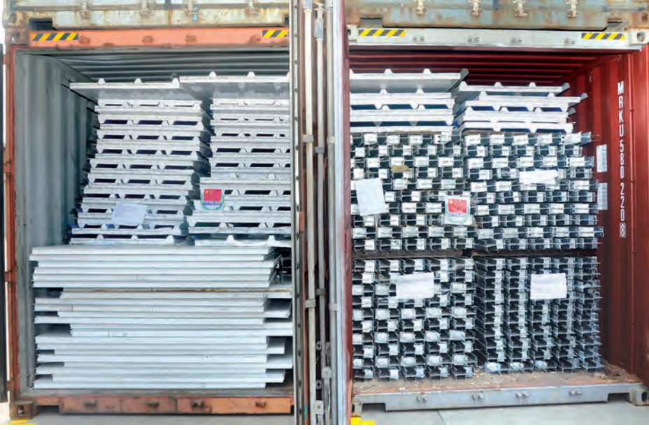
သီလဝါဆိပ်ကမ်း၌ရောက်ရှိနေသော အလွယ်တကူတပ်ဆင်နိုင်သည့် အိမ်ဆောက်ပစ္စည်းများအား တွေ့ရစဉ်။

ရင်းနှီးမှုကို ပြတာပါပဲ” ဟု မြန်မာ နိုင်ငံဆိုင်ရာ တရုတ်ပြည်သူ့သမ္မတ နိုင်ငံ သံအမတ်ကြီးက ပြောကြား သည်။ ၂၀၁၅ ခုနှစ်အတွင်း မြန်မာနိုင်ငံ တွင် သဘာဝဘေးအန္တရာယ် ကျရောက်ခဲ့ရာ တိုင်းဒေသကြီးနှင့် ပြည်နယ် ၁၂ ခုတို့တွင် ထိခိုက် ပျက်စီးဆုံးရှုံးမှုများ ကြုံတွေ့ခဲ့ရပြီး တရုတ်ပြည်သူ့သမ္မတနိုင်ငံမှ ရေဘေး သင့်ဒေသများ ပြန်လည်ထူထောင်ရေး အတွက် ၂၀၁၅ ခုနှစ် ဩဂုတ် ၁၅ ရက်တွင် အမေရိကန်ဒေါ်လာ ၁၆ သိန်းကျော်တန်ဖိုးရှိ လှေ၊ စက်လှေ များအပါအဝင် အထောက်အကူပြု ပစ္စည်းများနှင့် စက်တင်ဘာ ၃၀ ရက် တွင် အမေရိကန်ဒေါ်လာ ၃၁ သိန်း တန်ဖိုးရှိ သက်ကယ်အင်္ကျီ၊ ရေစုပ် စက်၊ ဆေးဝါးပစ္စည်းများကို လှူဒါန်း ခဲ့ကြောင်း သိရသည်။ တရုတ်ပြည်သူ့သမ္မတနိုင်ငံမှ လှူဒါန်းလိုက်သည့် အလွယ်တကူ တပ်ဆင်နိုင်သည့်အိမ်ရာ Assembled Board House (Prefabricated House)အလုံး ၁၁၆၀ ကို NORTH-ERN DIAMOND သင်္ဘောလိုင်း