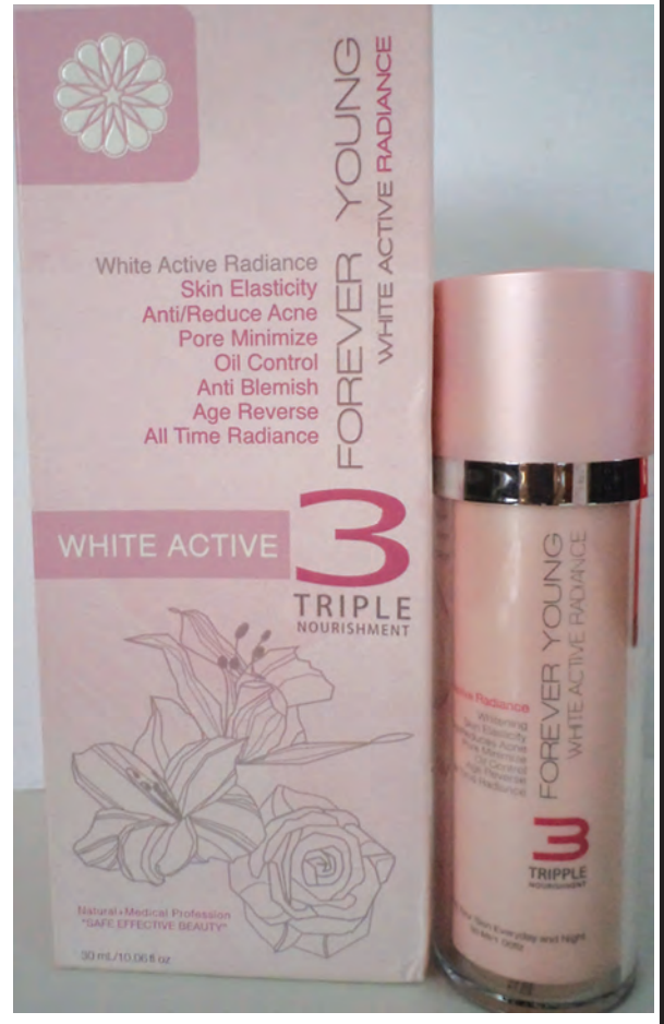
FOREVER YOUNG White Active Radiance 3 Triple Nourishment