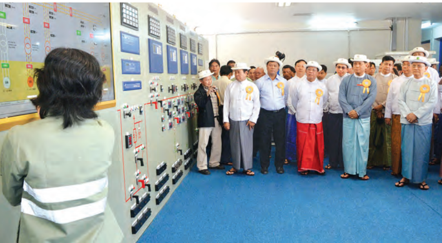
နိုင်ငံတော်သမ္မတ ဦးသိန်းစိန် ၂၃၀ မဂ္ဂါဝပ် သဘာဝဓာတ်ငွေ့နှင့် စွန့်ပစ်အပူသုံး ဓာတ်အားပေးစက်ရုံအတွင်း ကြည့်ရှုစဉ်။ (သတင်းစဉ်)