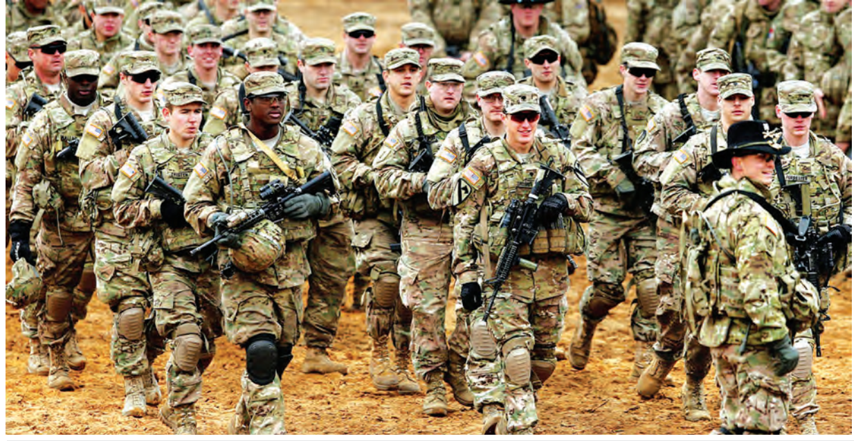
အမေရိကန်တပ်ဖွဲ့ဝင်များ စစ်ရေးလေ့ကျင့်နေမှုကိုတွေ့ရစဉ်။

လွန်ခဲ့သည့်လများတွင် ပါရီအကြမ်းဖက်မှုဖြစ်ရပ်ကြောင့် အရှေ့အလယ်ပိုင်းတွင် အမေရိကန်စစ်ရေးပါဝင်မှု တိုးမြှင့်လာသည်။ မြေပြင်အထူးတပ်ဖွဲ့များကို အီရတ်မြောက်ပိုင်းဒေသ၌ ဖြန့်ကြက်မှု ပြုလုပ်လာသည်။ ပြိုင်ဘက်နိုင်ငံများနှင့် ယှဉ်ပြိုင်ရာတွင် အမေရိကန်ပြည်ထောင်စုသည် လက်ရှိထက်ပို၍ ပြတ်သားဖို့လိုသည်ဟု ရွေးကောက်ပွဲဝင်မည့် သမ္မတလောင်းများက ကြွေးကြော်နေကြသည်။ သို့သော် စစ်ရေးအရ အရေးယူဆောင်ရွက်မှုမပြုမီ သေချာစွာစဉ်းစားခြင်း၊ သတိကြီးစွာထားခြင်းတို့က ရေရှည်တွင် အမေရိကန်ပြည်ထောင်စုအပေါ် ကမ္ဘာ့နိုင်ငံများ၏ ယုံကြည်ကိုးစားမှုလျော့ကျသွားစေမည်မဟုတ်ဘဲ ယုံကြည်မှုကို ကြာရှည်ထိန်းသိမ်းထားနိုင်အောင် ကူညီပေးပါလိမ့်မည်ဟု နိုင်ငံရေးပညာရှင်များက သုံးသပ်ဝေဖန်ကြသည်။