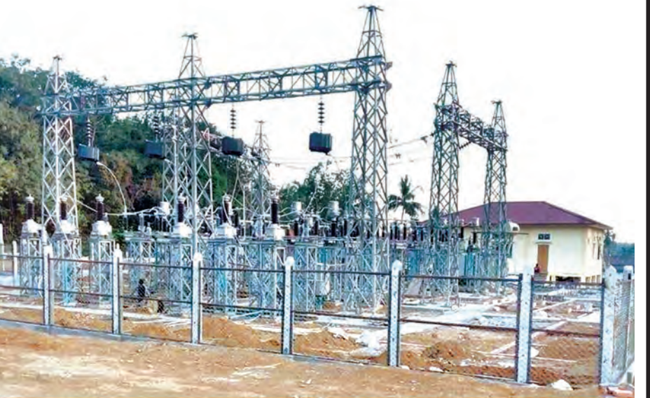
ရေလယ် ၆၆ ကေစီ RCS-2 တွင် တာဝါတိုင် သံပေါင်တပ်ဆင်ခြင်းလုပ်ငန်း ဆောင်ရွက်နေပုံ။