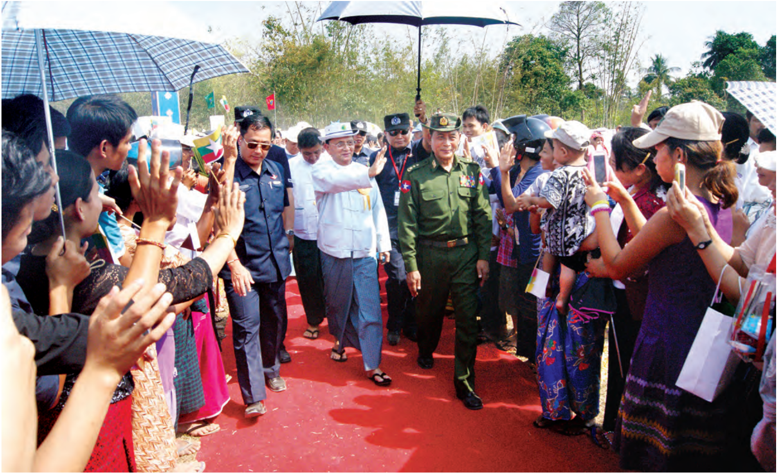
နိုင်ငံတော်သမ္မတ ဦးသိန်းစိန် ၆၆ ကေပီ မော်လမြိုင်-ချောင်းဆုံ သံလွင်မြစ်ကျော်ဓာတ်အားလှိုင်းနှင့် ၆၆/၁၁ ကေပီ ဓာတ်အားခွဲရုံဖွင့်ပွဲအခမ်းအနားသို့ တက်ရောက်လာကြသည့် ဒေသခံပြည်သူများအား ရင်းရင်းနှီးနှီးနှုတ်ဆက်စဉ်။ (သတင်းစဉ်)

အခမ်းအနားတွင် ပြည်ထောင်စုဝန်ကြီး ဦးခင်မောင်စိုးက မော်လမြိုင်-ချောင်းဆုံ ဓာတ်အားလှိုင်းနှင့် ဓာတ်အားခွဲရုံ ဖွင့်လှစ်ခြင်းနှင့် စပ်လျဉ်း၍ ရှင်းလင်းပြောကြားရာတွင် ယခင် ၁၉၈၀ ပြည့်နှစ်က မွန်ပြည်နယ်အတွင်း မော်လမြိုင်၊ ငန်းတေး ၁၂ မဂ္ဂါဝပ် ဓာတ်အားပေး