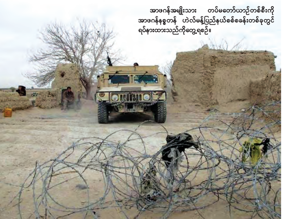
အာဖဂန်အမျိုးသား တပ်မတော်ယာဉ်တစ်စီးကို အာဖဂန်နစ္စတန် ဟဲလ်မန်ပြည်နယ်စစ်စခန်းတစ်ခုတွင် ရပ်နားထားသည်ကိုတွေ့ရစဉ်။

ဩဂုတ်လတွင် တာလီဘန်တပ်ဖွဲ့များက ယင်းပြည်နယ် များကို စီးနင်းမှုများပြုလုပ်ခဲ့သည်။ အမေရိကန်အရာရှိများက တာလီဘန်တပ်ဖွဲ့များသည် နိုင်ငံ၏သုံးပုံတစ်ပုံကို ခြိမ်းခြောက်လွှမ်းမိုးမှုများပြုလုပ် နေကြောင်း၊ အနည်းဆုံးပြည်နယ်လေးခုကို အပိုင်းစီး ထားကြောင်း ခန့်မှန်းခဲ့သည်။ လွန်ခဲ့သောနှစ်က ကွန်ဒူစ် ပြည်နယ်ကို ယင်းအဖွဲ့ကသိမ်းပိုက်ခဲ့သည်ဟု အကြမ်း ဖျင်းအားဖြင့် သတ်မှတ်ထားသော်လည်း ပြည်နယ်၊ မြို့တော်များကို ထိန်းချုပ်ခြင်းမပြုနိုင်ကြောင်း ကန်အရာရှိ များက ပြောခဲ့သည်။ နိုင်ငံတကာကပြုလုပ်သော စစ်ဆင်ရေးများ၂၀၀၄ ခုနှစ်ကတည်းက အဆုံးသတ်ခဲ့သောကြောင့် တာလီဘန် တပ်ဖွဲ့များသည် တိုက်ခိုက်မှုများကို နိုင်ငံအနှံ့ အရှိန်မြှင့် ပြုလုပ်လျက်ရှိရာ ဟဲလ်မန်ဒေသသည် အန္တရာယ်နှင့် ကြုံတွေ့နေရသောဒေသတစ်ခုဖြစ်ကြောင်း သိရသည်။ (ရိုက်တာ)