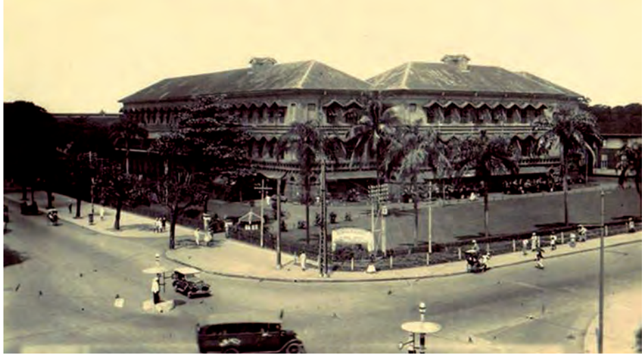
ယခင် မြန်မာ့မီးရထားရုံးချုပ်အဆောက်အအုံဟောင်းကို တွေ့ရစဉ်။

ခေတ်မီတိုးတက်မှုများ တစ်စတစ်စများပြားလာသည် နှင့်အမျှ ရှေးဟောင်းအမွေအနှစ်အဆောက်အအုံများစွာ သည်လည်း ပျောက်ကွယ်လာခဲ့ရာ ယနေ့မြင်တွေ့ရဆဲ ဖြစ်သည့် နှစ်ပေါင်း ၁၃၉ နှစ်က တည်ဆောက်ထားခဲ့ သည့် အဆောက်အအုံကြီးကို ဆက်လက်တည်တံ့စေရန် လိုအပ်နေပြီဖြစ်ကြောင်း ရှေးဟောင်းအဆောက် အအုံ ၃၀ စာအုပ်တွင် ရေးသားဖော်ပြထားသည်။