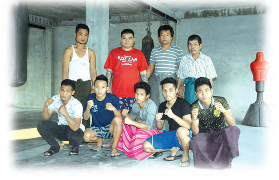
အောင်မြန်မာရိုးရာလက်ဝှေ့ကလပ်မှ နည်းပြချုပ်နှင့် ကလပ်အဖွဲ့သားများကို တွေ့ရစဉ်။