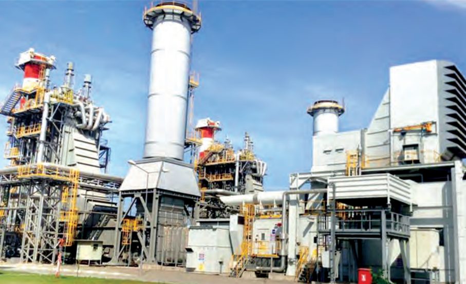
Myanmar Lighting (IPP) Co., Ltd.၏ မော်လမြိုင် ၂၃၀ မဂ္ဂါဝပ် သဘာဝဓာတ်ငွေ့နှင့် စွန့်ပစ်အပူသုံး ဓာတ်အားပေးစက်ရုံကို တွေ့ရစဉ်။ (သတင်းစဉ်)

၆၆/၁၁ ကေစီ၊ ၃၀ အမ်ပီအေ ချောင်းဆုံ ဓာတ်အားခွဲရုံ