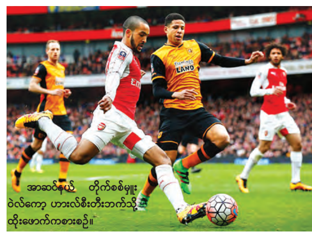
အာဆင်နယ် တိုက်စစ်မှူး ဝဲလ်ကျော့ ဟားလ်စီးတီးဘက်သို့ ထိုးဖောက်ကစားစဉ်။