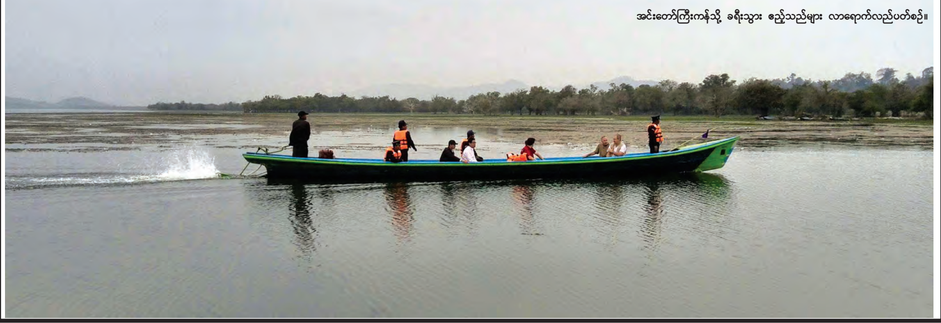
အင်းတော်ကြီးကန်သို့ ခရီးသွား စဉ်သည်များ လာရောက်လည်ပတ်စဉ်။

ဆောင်းခိုက်များပျော်ပါးရာ အင်းတော်ကြီးကန်သည် မြန်မာနိုင်ငံ တွင် အကြီးဆုံးရေကန်တစ်ခုဖြစ်ပြီး အရှေ့တောင်အာရှတွင် တတိယမြောက်အကြီးဆုံးရေကန်ဖြစ်သည်။