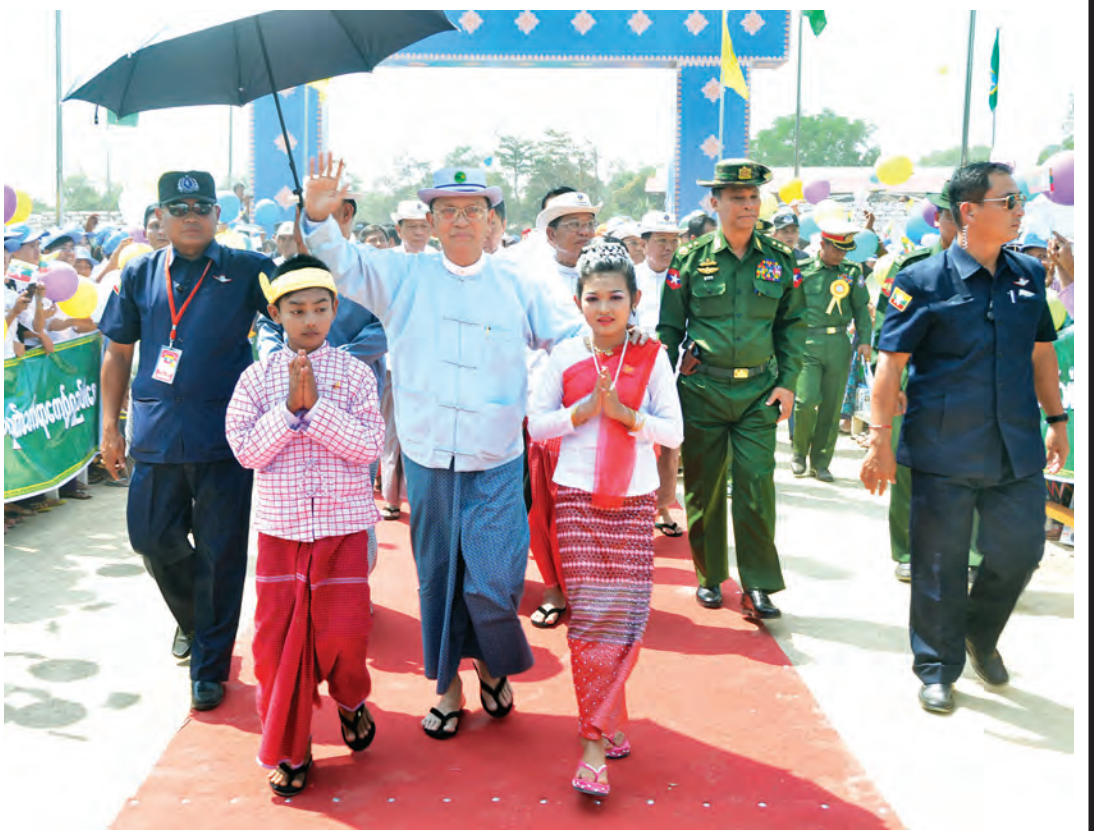
နိုင်ငံတော်သမ္မတ ဦးသိန်းစိန် ၆၆ ကေစီ မော်လမြိုင်-ချောင်းဆုံ သံလွင်မြစ်ကျော်ဓာတ်အားလိုင်းနှင့် ၆၆/၁၁ ကေစီ ဓာတ်အားခွဲရုံ ဖွင့်ပွဲအခမ်းအနားသို့ တက်ရောက်လာကြသည့် ဒေသခံပြည်သူများအား ရင်းရင်းနှီးနှီးနှုတ်ဆက်စဉ်။ (သတင်းစဉ်)