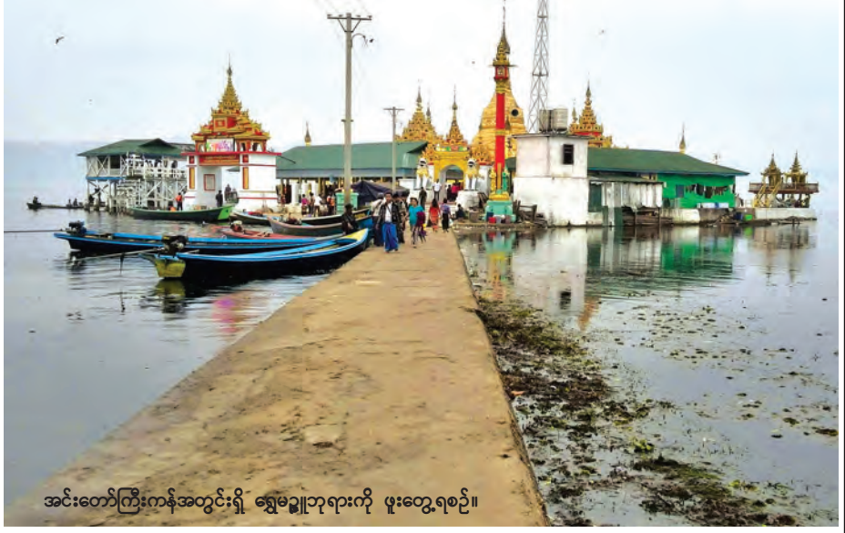
အင်းတော်ကြီးကန်အတွင်းရှိ ရွှေမဏ္ဍိတုရားကို ဖူးတွေ့ရစဉ်။