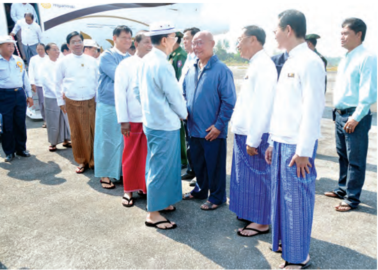
နိုင်ငံတော်သမ္မတ ဦးသိန်းစိန် မော်လမြိုင်မြို့သို့ ရောက်ရှိလာရာ တာဝန်ရှိသူများ ကြိုဆိုကြစဉ်။ (သတင်းစဉ်)