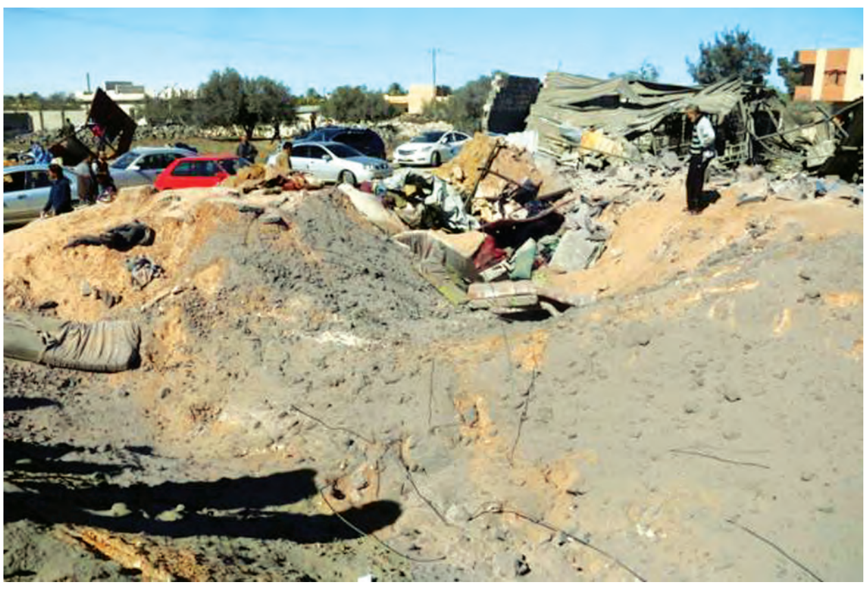
လစ်ဗျားနိုင်ငံ ဆာဘာရာသာဒေသရှိ အိုင်အက်စ်အကြမ်းဖက်စစ်သွေးကြွများကို အမေရိကန်စစ်လေယာဉ်များတိုက်ခိုက်သဖြင့် ပျက်စီးသွားသောနေရာများကို ဖေဖော်ဝါရီ ၁၉ ရက်က တွေ့ရစဉ်။