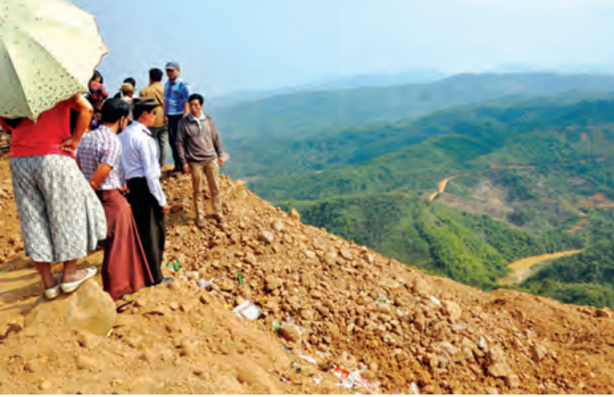
ယခင်စွန့်ပစ်ခဲ့သော မြေစာပုံကို တာဝန်ရှိသူများ သွားရောက်ကြည့်ရှုစဉ်။