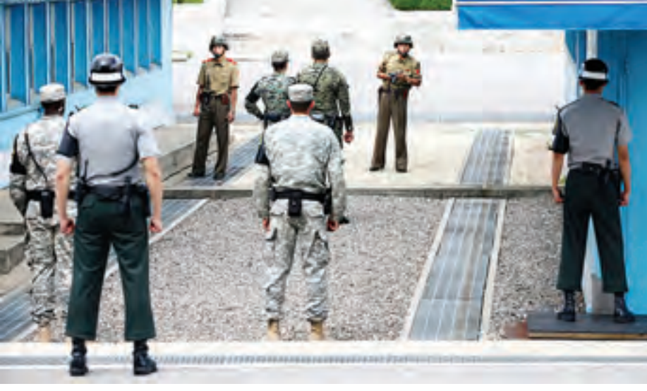
မြောက်ကိုရီးယား တပ်ဖွဲ့ဝင်များက (GJ)နှစ်မြောက် ကိုရီးယားစစ်ပွဲ အထိမ်းအမှတ်အခမ်းအနားသို့ တက်ရောက်လာသော တောင်ကိုရီးယားနှင့် ကုလသမဂ္ဂအရာရှိများကို စောင့်ကြည့်နေစဉ်။

အိန္ဒိယနိုင်ငံမြို့တော်ဒေလီအလယ်ပိုင်း ဆင်းရဲသား ရပ်ကွက်တစ်ခု မီးလောင်သွားကြောင်း ဆင်ဟွာသတင်းဌာနကဖော်ပြသည်။ မီးလောင်ရာသို့ အနည်းဆုံး မီးသတ်ကား ခြောက်စီးရောက်လာပြီး မီးများငြိမ်းသတ်ခဲ့ကြောင်း ရဲတပ်ဖွဲ့က ပြောသည်။ သို့သော်လည်း မီးလောင်မှုကြောင့် သေဆုံးပျက် စီးသည့် သတင်းဖော်ပြချက် တစ်စုံတစ်ရာမရှိသေးကြောင်း သိရသည်။ (ဆင်ဟွာ)