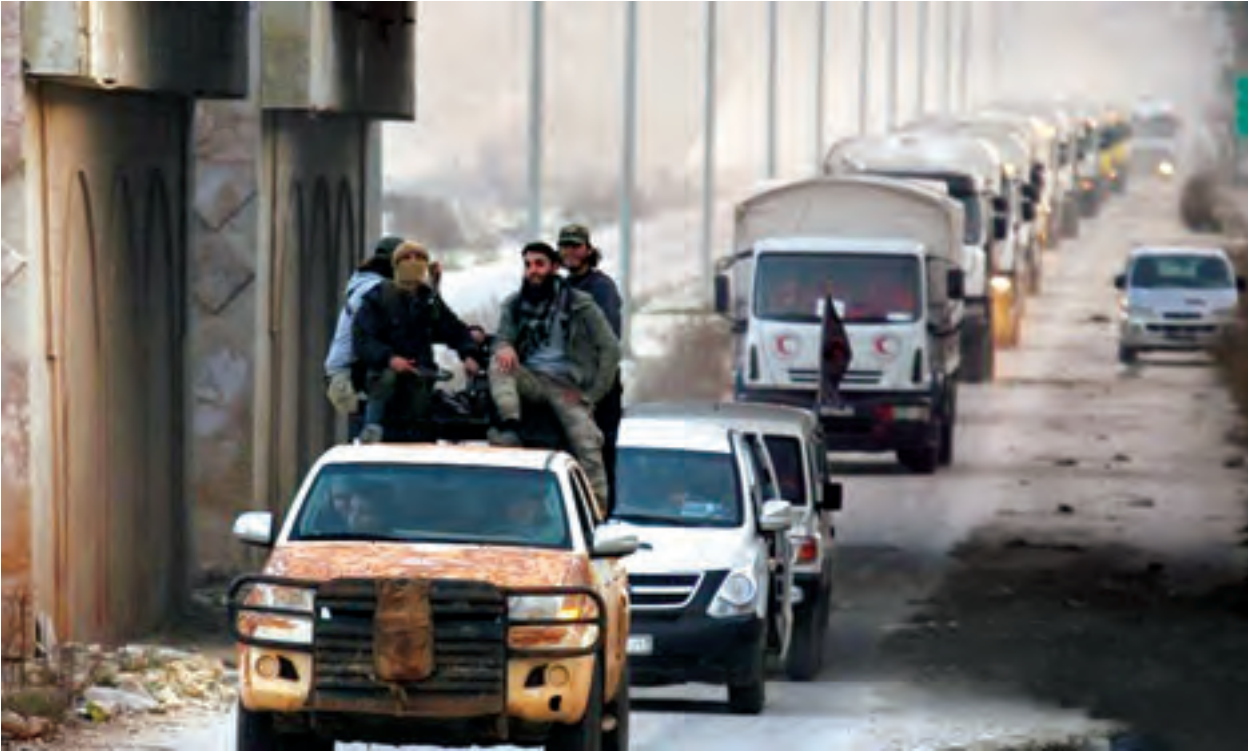
တိုက်ခိုက်ရေးသမားများလိုက်ပါ စောင့်ကြပ်လာသော ဆီးရီးယား အာရပ်ကြက်ခြေနီအသင်း အကူအညီပေးရေး ယာဉ်တန်းကို ဆီးရီးယားနိုင်ငံ အိမ်ပြည်နယ် အယ်ဖိုရာနှင့် ကဲဖရာယာကျေးရွာများအနီးတွင် ဖေဖော်ဝါရီ ၁၇ ရက်က တွေ့ရစဉ်။