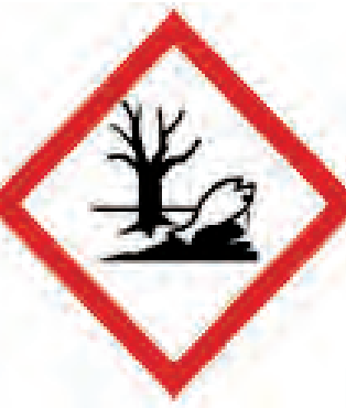
ငါးသေနှင့် သစ်ခြောက်ပင် (Fish & Dead Tree)

ဤသင်္ကေတသည် ပါးစပ်မှမျိုချမိခြင်း (Oral) ကြောင့်ဖြစ်စေ၊ အရေပြားမှစုပ်ယူခြင်း (Dermal) ကြောင့်ဖြစ်စေ၊ နှာခေါင်းမှမျိုသွင်းမိခြင်း (Inhalation) ကြောင့်ဖြစ်စေ ဓာတုပစ္စည်းများ ကိုယ်ခန္ဓာတွင်းသို့ နည်းတစ်မျိုးမျိုးဖြင့် ရောက်ရှိလာသည့်အခါတွင် ကျန်းမာရေးဆိုင်ရာ သက်ရောက်မှုများ၊ တုံ့ပြန်မှုများ၊ အဆိပ်သင့်မှုများ ချက်ချင်းခံစားရခြင်း (Acute Toxicity) ဖြစ်ပြီး သေသည်အထိ ဘေးအန္တရာယ်ဖြစ်စေသော ဓာတုပစ္စည်းများကို ဖော်ပြသည့်အခါတွင်သုံးပါသည်။ အသက်စိုးရိမ်ဖွယ်ရာ အဆင့်ရှိသော ဘေးအန္တရာယ်ဖြစ်ပေါ်စေသည့် ဓာတုပစ္စည်းများအတွက် သတိပေးသည့်တံဆိပ်ဖြစ်သည်။ ယင်းဓာတုပစ္စည်းများသည် မျက်စိနာကျင်စေခြင်း၊ မျက်စိပြင်းထန်စွာပျက်စီးခြင်း၊ ယားယံခြင်း (Serious Eye