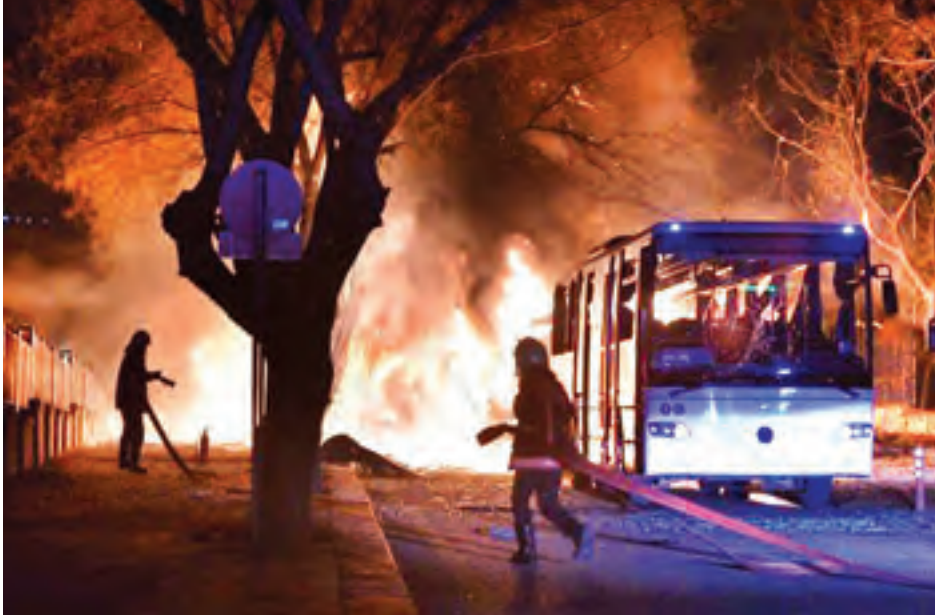
ဖေဖော်ဝါရီ ၇ ရက် အန်ကာရာပေါက်ကွဲမှုဖြစ်ပြီး မီးသတ်သမားများက မီးငြိမ်းသတ်ရန် ကြိုးစားနေစဉ်။

တူရကီအနေဖြင့် ယင်းတိုက် ခိုက်မှုအပေါ် နောက်ကွယ်မှ လှုပ် ရှားမှုများကို ဖော်ထုတ်ရှင်းလင်း သွားရန်ဆုံးဖြတ်ထားကြောင်း သမ္မတ တေရစ်အာဒိုဂန်က ပြောသည်။ ယင်းတိုက်ခိုက်မှုကြောင့် တပ်ဖွဲ့ နှင့်အရပ်သားများ အပါအဝင် ၂၈ ဦးသေဆုံးကာ ၆၁ ဦး ဒဏ်ရာရရှိ သွားကြောင်း ဒုတိယဝန်ကြီးချုပ်၏ ပြောရေးဆိုခွင့်ရှိသူ နမန်းကာတူမတ် က ပြောသည်။ (ရိုက်တာ)