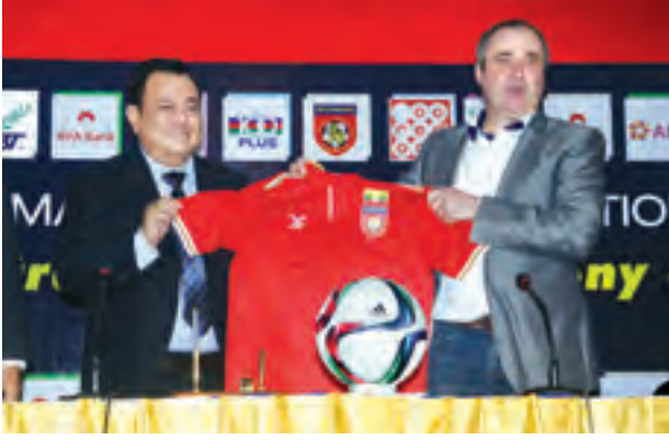
မြန်မာအမျိုးသမီးအသင်းနည်းပြချုပ် ရော်ဂျာရိုင်နာနှင့် MFF အမျိုးသမီးဘောလုံးဆက်တိုက်ပွဲအတွက် စာချုပ်အပြီး တွေ့ဆုံစဉ်။

မြန်မာနိုင်ငံ ဘောလုံးအဖွဲ့ချုပ်သည် နည်းပြချုပ်ရာကို အိမ်ရှင်အဖြစ် လက်ခံကျင်းပမည့် ၂၀၁၆ အာဆီယံအမျိုးသမီးပြိုင်ပွဲအပြီးထိ တာဝန်ပေးအပ်ခဲ့ပြီး ဩဂုတ် ၁၂ ရက်အထိ ခြောက်လစာချုပ် ချုပ်ဆိုခဲ့သည်။