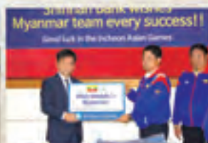
•National Sports Sponsorship