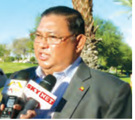
ပြည်ထောင်စုဝန်ကြီး ဦးဝဏ္ဏမောင်လွင်

ကြောင်း လုံခြုံရေးနဲ့ ပတ်သက်လို့ သူတို့စီမံချက်တစ်ခု လုပ်ထားတာ ရှိတယ်။ ပြီးတော့ နိုင်ငံဖြတ်ကျော် မှုခင်းတွေ အခုဖြစ်နေတဲ့ မိုင်းရပ်စ် ကိစ္စဆိုရင် အာရှကိုကူးစက်မလား ဆိုပြီး ဝိုင်းပြီးကူညီပေးမယ့်ဆိုတာမျိုး ပြောတယ်။ အဓိက ဆွေးနွေးတာ ကတော့ လူကုန်ကူးမှုပေါ့။ လူကုန် ကူးမှုနဲ့ပတ်သက်လို့ ဒေသအတွင်း နိုင်ငံတွေရော ကျန်တဲ့လူတွေပါ ပေါင်းပြီးလုပ်ဖို့ရှိတယ်။ ပြီးတော့ အကြမ်းဖက် အိုင်အက်စ်(IS)လို အဖွဲ့မျိုးတွေ အာရှမှာ အခြေမချ နိုင်အောင် ဘယ်လိုသတင်းအချက် ဖလှယ်မယ့်ဆိုတာကို လုပ်ခဲ့တယ်။ ပထမတစ်ခုကတော့ ကျွန်တော်