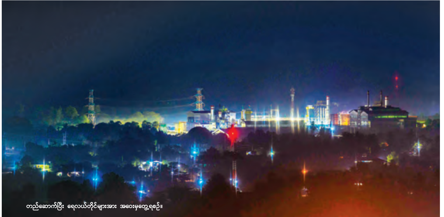
တည်ဆောက်ပြီး ရေလယ်တိုင်များအား အဝေးမှတွေ့ရစဉ်။

မွန်ပြည်နယ် ချောင်းဆုံဒေသရှိ ကျေးရွာ ပေါင်း ၁၁ ရွာရှိ မီးသုံးစွဲသူ ၁၇၄၀ အား