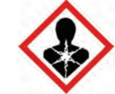
ကျန်းမာရေးအန္တရာယ်ပုံ (Health Hazard Pictogram)

ဤသင်္ကေတသည် ပါးစပ်မှမျိုချမိခြင်း (Oral) ကြောင့်ဖြစ်စေ၊ အရေပြားမှစုပ်ယူခြင်း (Dermal) ကြောင့်ဖြစ်စေ၊ နှာခေါင်းမှမျိုသွင်းမိခြင်း (Inhalation) ကြောင့်ဖြစ်စေ ဓာတုပစ္စည်းများ ကိုယ်ခန္ဓာတွင်းသို့ နည်းတစ်မျိုးမျိုးဖြင့် ရောက်ရှိလာသည့်အခါတွင် ကျန်းမာရေးဆိုင်ရာ သက်ရောက်မှုများ၊ တုံ့ပြန်မှုများ၊ အဆိပ်သင့်မှုများ ချက်ချင်းခံစားရခြင်း (Acute Toxicity) ဖြစ်ပြီး သေသည်အထိ ဘေးအန္တရာယ်ဖြစ်စေသော ဓာတုပစ္စည်းများကို ဖော်ပြသည့်အခါတွင်သုံးပါသည်။ အသက်စိုးရိမ်ဖွယ်ရာ အဆင့်ရှိသော ဘေးအန္တရာယ်ဖြစ်ပေါ်စေသည့် ဓာတုပစ္စည်းများအတွက် သတိပေးသည့်တံဆိပ်ဖြစ်သည်။ ယင်းဓာတုပစ္စည်းများသည် မျက်စိနာကျင်စေခြင်း၊ မျက်စိပြင်းထန်စွာပျက်စီးခြင်း၊ ယားယံခြင်း (Serious Eye