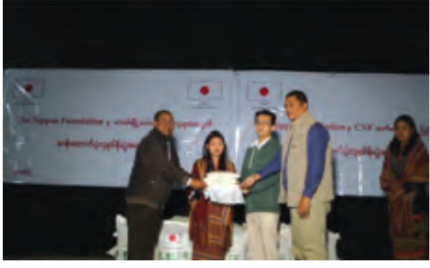
ဆန်အိတ် ၂၂၅၀ ကိုထောက်ပံ့ပေးအပ်ခဲ့ကြောင်း သိရသည်။ (ပြည်နယ်မြန်/ဆက်)

ဆန်အိတ်များ ထောက်ပံ့လှူဒါန်းရာတွင် ဟားခါးမြို့နယ်ရှိ သဘာဝဘေးသင့်ပြည်သူများအတွက်ဆန်အိတ် ၁၀၀၀ နှင့် ချင်းအမျိုးသားတပ်ဦး(CNF) နယ်မြေအတွင်းရှိ သဘာဝဘေးသင့် ပြည်သူများအတွက်ဆန်အိတ် ၂၂၅၀ စုစုပေါင်း