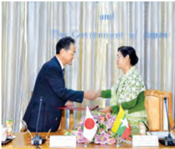
သည်။ ယခုစီမံချက်အတွက်ဂျပန်နိုင်ငံအစိုးရကဂျပန်ယန်း ၁ ဒသမ ၂ ဘီလီယံ ကူညီထောက်ပံ့ပေးအပ်မည်ဖြစ်ကြောင်း သတင်းရရှိသည်။ (သတင်းစဉ်)

အဆိုပါအကူအညီပေးရေးဆိုင်ရာ စာချွန်လွှာကို လက်မှတ်ရေးထိုးလဲလှယ် ခြင်းဖြင့် မြန်မာနိုင်ငံအတွင်း ရေဘေးသင့်ဒေသရှိ စာသင်ကျောင်းများ အလျင် အမြန်ပြန်လည်ပြုပြင်ရာတွင် အထောက်အပံ့ကောင်းများ ရရှိလာနိုင်မည်ဖြစ်ပြီး ယင်းဒေသ၏ ပညာရေးကဏ္ဍများစဉ်ဆက်မပြတ်ကောင်းမွန်လာစေမည်ဖြစ်