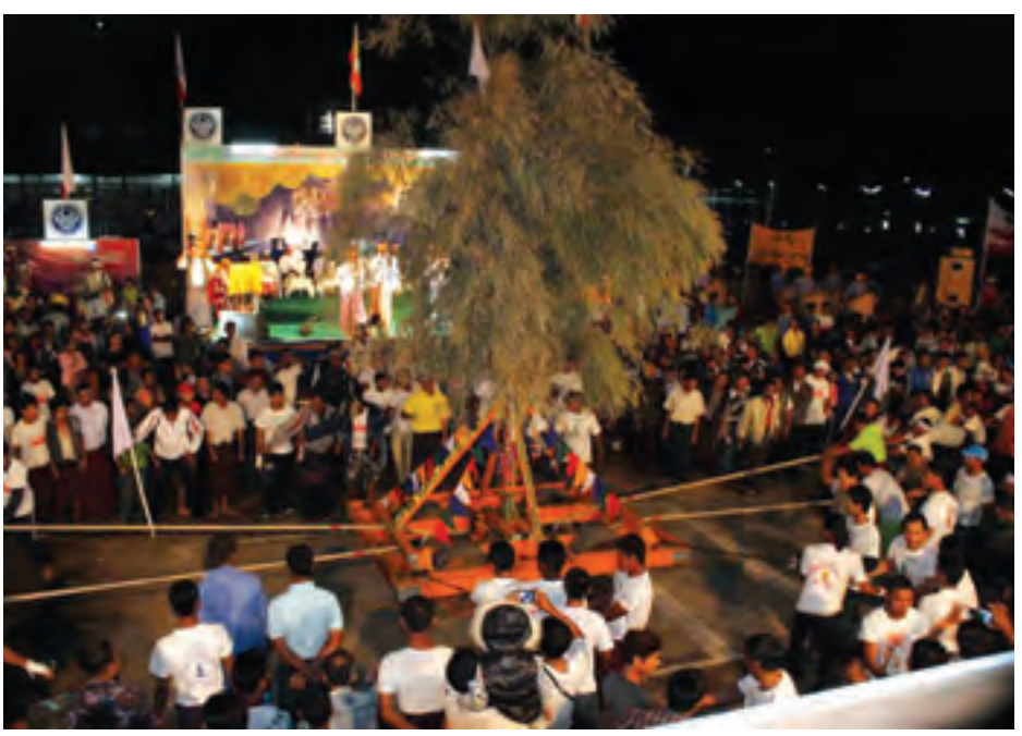
ပွဲတော်တစ်ခုအဖြစ် နှစ်စဉ်တပို့တွဲလတွင် ကျင်းပကြပြီး ရခိုင်သား၊ ရခိုင်သူတို့သည် ရထားဆွဲပွဲကျင်းပရခြင်းကြောင့် ဥတုရာသီမျှတခြင်း၊ လယ်ယာသီးနှံအထွက်တိုး ပေါများခြင်း၊ တိုင်းပြည်နိုင်ငံအေးချမ်းသာယာခြင်းတို့ဖြစ်စေသည်ဟု ရှေးခေတ်ကပင်ယုံကြည်မှုဖြင့် ရထားဆွဲပွဲကို အလေးထား၍ ပါဝင်ဆင်နွှဲပြီး ရထားဆွဲကြောင်း သိရသည်။ (ခရိုင် ပြန်/ဆက်)

အဋ္ဌမအကြိမ်မြောက် စစ်တွေမြို့ လုံးကျွတ် ရခိုင်ရိုးရာရထားဆွဲပွဲတော်ကြီးကို စစ်တွေမြို့ ဝက်ပါကွင်း၌ ဖေဖော်ဝါရီ ၁၉ ရက်မှ ၂၃ ရက်အထိ ငါးညတိုင်တိုင် စည်ကားသိုက်မြိုက်စွာ ကျင်းပသွားမည်ဖြစ်ကြောင်း သိရသည်။