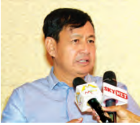
ပြည်ထောင်စုဝန်ကြီး ဦးရဲထွဋ်

အမေရိကန်နိုင်ငံ အနေနဲ့က တော့ အဲဒီဟာမျိုးတွေကို အာဆီယံ နိုင်ငံအတွင်းမှာ ဦးစားပေးဖော်ထုတ် ပေးနိုင်ဖို့အတွက် စီမံကိန်းသုံးခုကို အဆိုပြုပါတယ်။ ဒါတွေအားလုံး လက်ခံလိုက်ပါတယ်။ ဒုတိယနေ့မှာ လုံခြုံရေးနဲ့ပတ်သက်တဲ့ အဓိကအား ဖြင့် တောင်တရုတ်ပင်လယ်နဲ့ ပတ်သက်တဲ့စွဲတွေ ဆွေးနွေးတယ်။ ပြီးရင် နိုင်ငံဖြတ်ကျော် မှုခင်းတွေ၊ ရောဂါကိစ္စတွေ၊ တရားမဝင်လူကုန် ကူးမှုကိစ္စတွေ ဆွေးနွေးတယ်။ နှစ်ရက်လုံးမှာတော့ အာဆီယံနဲ့ အမေရိကန်အကြားမှာ မဟာဗျူဟာ ဆွေးနွေးပွဲအဆင့်ကို ရောက်သွား တာဖြစ်ပါတယ်။ ဒါကြောင့် အများကြီး အကျိုးရှိပါတယ်။