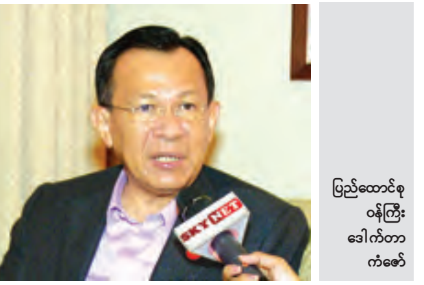
ပြည်ထောင်စု ဝန်ကြီး ဒေါက်တာ ကော်ဖော်

ဘယ်လိုနေရာပေးမလဲ၊ နောက်နံပါတ် (၃)အနေနဲ့ ထိရောက်တဲ့ပတ်ဝန်းကျင် ထိန်းသိမ်းမှုစနစ် နည်းပညာပြောင်းလဲ မှုနဲ့ စီးပွားရေးလုပ်ငန်းတွေ ဖြစ်ထွန်း ကိစ္စဆိုရင် အာရှကိုကူးစက်မလား ဆိုပြီး ဝိုင်းပြီးကူညီပေးမယ့်ဆိုတာမျိုး ပြောတယ်။ အဓိက ဆွေးနွေးတာ ကတော့ လူကုန်ကူးမှုပေါ့။ လူကုန် ကူးမှုနဲ့ပတ်သက်လို့ ဒေသအတွင်း နိုင်ငံတွေရော ကျန်တဲ့လူတွေပါ ပေါင်းပြီးလုပ်ဖို့ရှိတယ်။ ပြီးတော့ အကြမ်းဖက် အိုင်အက်စ်(IS)လို အဖွဲ့မျိုးတွေ အာရှမှာ အခြေမချ နိုင်အောင် ဘယ်လိုသတင်းအချက် ဖလှယ်မယ့်ဆိုတာကို လုပ်ခဲ့တယ်။ ပထမတစ်ခုကတော့ ကျွန်တော်