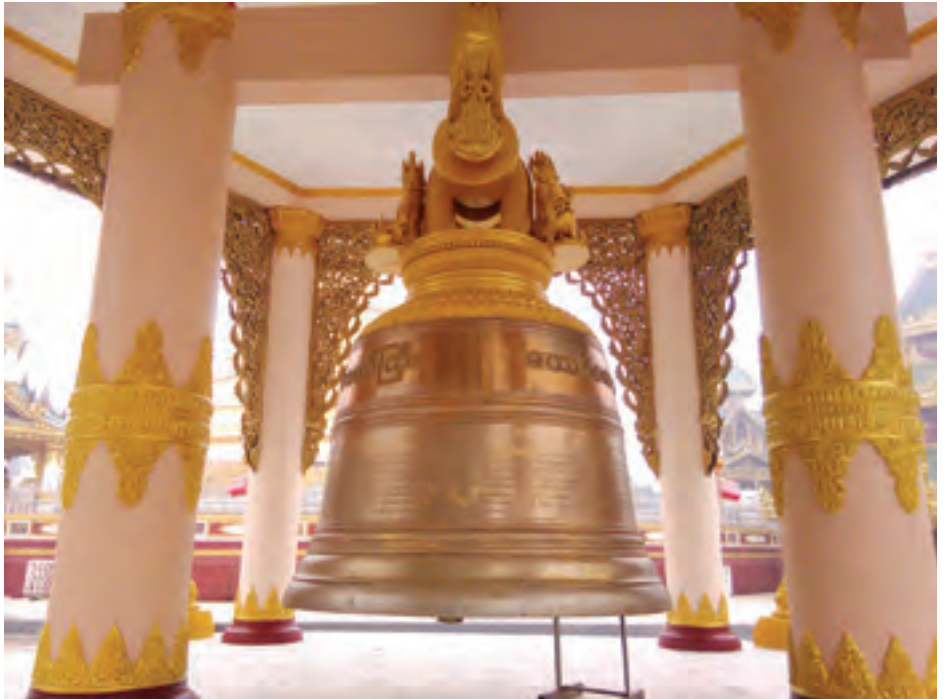
နေမျိုးထွဋ်(ရေး)

မဟာဝိဇယ ကြေးခေါင်းလောင်းတော်ကြီးအတွက် ဓေတနာရှင်၊ အလှူရှင်များက အလှူငွေနှင့် ကြေးသတ္တုများကို သီးသန့်ပေးအပ်လှူဒါန်းခဲ့ကြပြီး လုပ်အားခကုန်ကျစရိတ်မှာကျပ်သိန်းပေါင်း ၁၄၀၀ ကျော်ခန့် ကုန်ကျခဲ့ကြောင်း၊ ဖွင့်ပွဲကို တိုင်းဒေသကြီးအစိုးရအဖွဲ့ဝင်များ ဦးဆောင်မှုဖြင့် ကျင်းပသွားမည်ဖြစ်ကြောင်း ဂေါပကရုံးမှ တာဝန်ရှိသူတစ်ဦး၏ ပြောကြားချက်အရ သိရသည်။