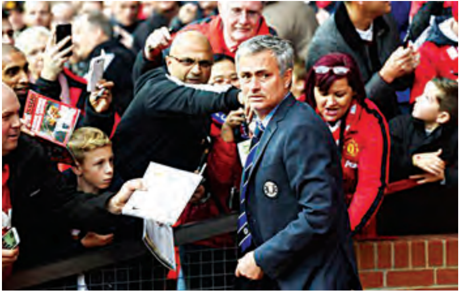
မော်ရင်ညီဟာ ပရိမီယာလိဂ်ချန်ပီယံဆုဖလားကို ရအောင်ဘယ်လိုလုပ်ယူမလဲဆိုတာ ကောင်းကောင်းသိသူဖြစ်တာနဲ့အမျှ ဂွာဒီယိုလာရောက်လာမယ့် မန်စီးတီးကို ပခုံးချင်းယှဉ်ဖို့ဆိုရင် မန်ယူအတွက် မော်ရင်ညီလိုမန်နေဂျာမျိုး လိုကိုလိုပြန်တဲ့အခါ။

ပြောမယ်ဆိုရင်ပေါ့။ လက်ရှိမန်ယူရဲ့စုစုပေါင်း မော်ရင်ညီစိတ်ကြိုက်ကစားသမားက အတော်နည်းနိုင်တယ်။ ဂိုးသမား ဒီဂီယာဟာ မော်ရင်ညီရဲ့ယုံကြည်မှုနဲ့ အားကိုး