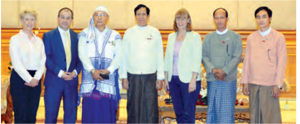
ပြည်ထောင်စုလွှတ်တော်နာယက အမျိုးသားလွှတ်တော်ဥက္ကဋ္ဌ မန်းဝင်းခိုင်သန်း ဗြိတိန်နိုင်ငံ အောက်လွှတ်တော်ကိုယ်စားလှယ် Mr. Paul Scully ဦးဆောင်သော လွှတ်တော်ကိုယ်စားလှယ်အဖွဲ့နှင့် စုပေါင်းမှတ်တမ်းတင်ဓာတ်ပုံရိုက်စဉ်။ (သတင်းစဉ်)