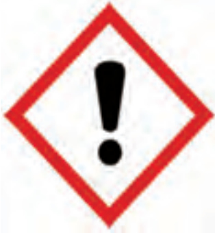
အာမေဏိတ်အမှတ်အသား (Exclamation Pictogram)

အာမေဏိတ်အမှတ်အသား (Exclamation Pictogram)၊ အရေပြားလောင်စားခြင်း၊ ယားယံခြင်း (Skin Corrosion/ Irritation)၊ အရေပြားနီမြန်းစေခြင်း၊ Sensitizer ဟုခေါ်သည့် ဓာတ်ပြုမှုအရှိန်ကိုမြှင့်တင်ပေးသည့် ဓာတုပစ္စည်းများနှင့် ထိတွေ့ပြီး ပါက အခြားဓာတ်ပြုနိုင်သည့် ဓာတုပစ္စည်း အနည်းငယ်မျှထိတွေ့ရုံမျှနှင့် အကြီးအကျယ်ဓာတ်ပြုမှုဖြစ်ပြီး အသက်ရှူလမ်းကြောင်းနှင့် အရေပြားကို ပြင်းထန်စွာ ထိခိုက်မှုဖြစ်ပေါ်စေပြီး (Respiratory or Skin Sensitization) အရေပြားဓာတ်ပြုမှုမြန်ခြင်းကို ဖော်ပြရာတွင်လည်းကောင်း၊ ဓာတုပစ္စည်းနှင့် တစ်ကြိမ်ထိတွေ့ခြင်းဖြင့် ခန္ဓာကိုယ်အစိတ်အပိုင်းများကို ထိခိုက်စေခြင်း [Specific Target Organ System (STOT) (Single Exposure)]၊ ဓာတုပစ္စည်းများ အကြိမ်ကြိမ်ထိတွေ့ခြင်းဖြင့် ခန္ဓာကိုယ်အစိတ်အပိုင်းများ ထိခိုက်စေခြင်း [Specific Target Organ System (STOT) (Repeated Exposure)] တို့၏ အန္တရာယ်သတိပေးရာတွင်လည်းကောင်း၊ မူးယစ်ဆေးဝါးသုံးစွဲသကဲ့သို့ မူးယစ်စေခြင်းအစရှိသည့် ကျန်းမာရေးဆိုင်ရာ ထိခိုက်မှုများကို သတိပေး (Warning) ဖော်ပြရာတွင် ဤပုံကို အသုံးပြုနိုင်ပါသည်။ သို့ရာတွင် အထက်ပါ ဓာတုပစ္စည်းတစ်မျိုးအတွက် Hazard Sign ပြသည့်အခါတွင် အန္တရာယ်ပိုကြီးသည့် Danger သတိပေးထားသည့် ရုပ်ပုံများနှင့် နှိုင်းယှဉ်လျှင် Warning ပုံကို ထပ်မံဖော်ပြရန်မလိုအပ်ပါ။