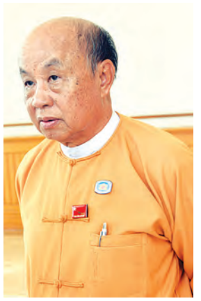
ဦးထွန်းအောင်(ခ) ဦးထွန်းထွန်းဟိန်

ဒီမိုကရေစီအဖွဲ့ချုပ်အနေနဲ့ အစိုးရဖွဲ့ပြီး အစိုးရအလွှဲအပြောင်းအတွက် ကတော့ အဖွဲ့ဖွဲ့ထားတာရှိပါတယ်။ ဦးဝင်းထိန်၊ ဒေါက်တာ အောင်သူ၊ နောက် ဒေါက်တာ မျိုးအောင်ပါပါတယ်။ တစ်ဖက်မှာလည်း လက်ရှိအစိုးရကနေ အဖွဲ့ဖွဲ့ထားတာရှိပါတယ်။ ဒီအဖွဲ့ နှစ်ဖွဲ့တိုင်ပင်ပြီး ဆောင်ရွက်နေတယ်လို့ သိရပါတယ်။ အစိုးရအဖွဲ့မှာ သမ္မတအမည်စာရင်းကို တော့ ကျွန်တော်မသိပါဘူး။ ပြည်ထောင်စုလွှတ်တော်က ဒီနေ့မှာ ပထမဆုံးစခေါ်တာ၊ ပြည်သူ့လွှတ်တော်ခေါ်ပြီးနောက် ၁၅ ရက်အတွင်းမှာ ခေါ်ရမယ်ဆိုတဲ့ ဖွဲ့စည်းပုံ အခြေခံဥပဒေပါပြဋ္ဌာန်းချက်အတိုင်း ဒုတိယသမ္မတများ အမည်စာရင်း တင်သွင်းနိုင်ရေး