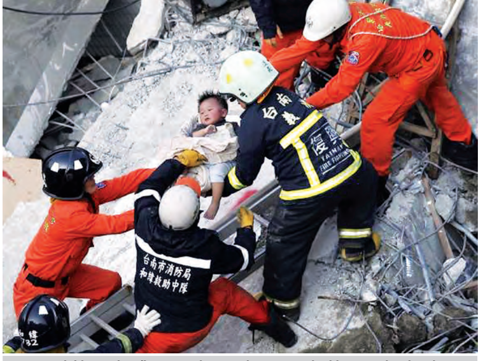
ဖေဖော်ဝါရီ ၆ ရက်က ပြိုကျအဆောက်အအုံအတွင်းမှ ကလေးငယ်တစ်ဦးအား ကယ်ထုတ်နေစဉ်။

တိုင်နန် ဖေဖော်ဝါရီ ၈ ကြောက်မက်ဖွယ် မြေငလျင်ကြီး တစ်ခု ထိုင်ဝမ်တွင် လှုပ်ခတ်ခဲ့ပြီး နောက် နှစ်ရက်ကျော်အကြာတွင် ပြိုကျအဆောက်အအုံ၏ အပျက်အစီးများကြားမှ လူနှစ်ဦးကို ကယ်ဆယ်ရေးအဖွဲ့များက ထပ်မံကယ်ထုတ်နိုင်ခဲ့ကြသည်။ သို့သော်လည်း တိုင်နန်မြို့တော်ဝန်က အသေအပျောက်အရေအတွက်မှာ ၁၀၀ မက ရှိနိုင်သည်ဟု ပြောဆိုခဲ့သည်။ ငလျင်ဒဏ်ကြောင့် သေဆုံးသူ အရေအတွက်မှာ ၃၇ ဦးထိရှိသွားပြီဖြစ်ပြီး လူ ၁၀၀ မက ပျောက်ဆုံးနေဆဲဖြစ်သည်ဟု သိရသည်။ စနေနေ့ ဒေသစံတော်ချိန် နံနက် ၄ နာရီတွင်ဖြစ်ပွားခဲ့သည့် မြေငလျင်ကြောင့် Weiguan Golden Dragon အဆောက်အအုံ ပြိုကျပျက်စီးကာ လူများစွာ အသက်ဆုံးရှုံးခဲ့ရသည်။ အဆိုပါ ၁၇ ထပ်အဆောက်အအုံ ပြိုကျရာတွင် လူ ၁၁၇ ဦးတို့ ပျောက်ဆုံးနေဆဲဖြစ်ကာ အပျက်အစီးများအောက်တွင် ပိတ်မိနေကြသည်ဟု ယူဆရသည်။ ရှာဖွေကယ်ထုတ်ခဲ့ကြသူများတွင် သေဆုံးသူအရေအတွက် မြင့်တက်လာဆဲဖြစ်ပြီး သေဆုံးသူအရေအတွက်မှာ Daily News ဝက်ဘ်ဆိုက်တွင် ၁၀၀ မက ရှိလာနိုင်သည်ဟု တိုင်နန် မှတ်ချက်ပြုခဲ့ကြောင်း သိရသည်။ မြို့တော်ဝန် ဝီလီယံလိုင်က United