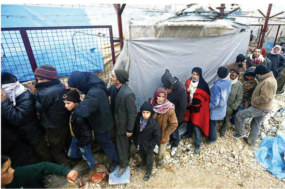
စောင်များဝေငှရာတွင် တန်းစီစောင့်ဆိုင်းနေကြသည့် ဆီးရီးယားစစ်ဘေးသည်ပြည်သူများ

ဘေရွတ် ဖေဖော်ဝါရီ ၈ အလက်ပိုတွင် အစိုးရတပ်များက အရှိန်မြှင့်တိုက်ခိုက်မှုကြောင့် ထွက်ပြေးလာသော ထောင်ပေါင်းများစွာသော ပြည်သူများအား ကူညီရန် တူရကီမှ အကူအညီပေးရေး ကုန်တင်ယာဉ်များနှင့် လူနာတင်ယာဉ်များ တနင်္ဂနွေနေ့တွင် ယင်းမြို့သို့ စတင်ဝင်ရောက်ခဲ့သည်။ တူရကီနယ်စပ်အနီး အလက်ပိုမြို့နှင့်ဆက်သွယ်ထားသော လမ်းပေါ်ရှိ ကျေးရွာများကို လေကြောင်းမှ ပစ်မှတ်ထား တိုက်ခိုက်ခဲ့သည်။ စစ်ပွဲမတိုင်မီ အလက်ပိုမြို့သည် ဆီးရီးယားနိုင်ငံ၏ အကြီးဆုံး မြို့ဖြစ်ပြီး မြို့အနီးပတ်ဝန်းကျင်တို့တွင် သူပုန်များက ထိန်းချုပ်ထားသည်။ ယင်းမြို့သည် လူပေါင်း ၃၅၀၀၀၀ နေထိုင်လျက်ရှိရာ မကြာမီ အစိုးရလက်သို့ ကျရောက်တော့မည်ဖြစ်ကြောင်း အကူအညီပေးရေး အလုပ်သမားများက ပြောသည်။ အလက်ပိုမြို့ မြောက်ပိုင်းရှိ ကျေးရွာများကို ပစ်မှတ်ထား၍