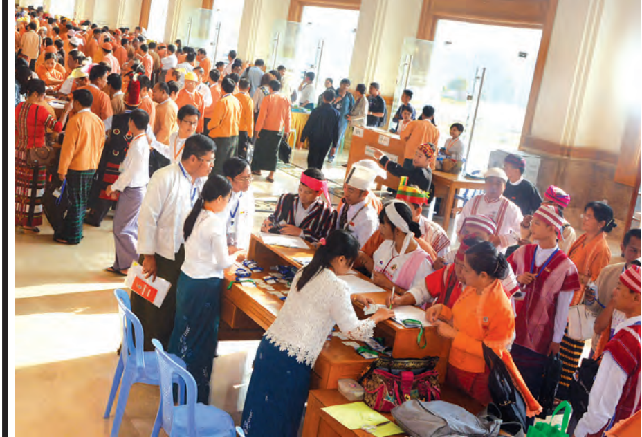
ပြည်ထောင်စုလွှတ်တော်သို့ တက်ရောက်လာကြသော လွှတ်တော်ကိုယ်စားလှယ်များ တက်ရောက်ကြောင်း လက်မှတ်ရေးထိုးနေသည့်ကို တွေ့ရရည်။

ယနေ့ ကျင်းပသည့် ပြည်ထောင်စုလွှတ်တော်အစည်းအဝေးပထမနေ့တွင် ရှမ်းပြည်နယ် နမ့်ဆန်မြို့နှင့် ဧရာဝတီတိုင်းဒေသကြီး လပွတ္တာမြို့ မီးဘေးသင့်ပြည်သူများအတွက် လွှတ်တော်ကိုယ်စားလှယ်များ၏ နေ့တွက်စရိတ် တစ်ရက်စာ လျှို့ဝှက်စရိတ် အတည်ပြုခဲ့ကြသည်။ ကိုယ်စားလှယ်တစ်ဦး၏ နေ့တွက်စရိတ်မှာ တစ်ရက်လျှင် ငွေကျပ်နှစ်သောင်း ဖြစ်ပြီး လွှတ်တော်ကိုယ်စားလှယ်စုစုပေါင်း ၆၀၀ ကျော်ရှိသည့် အတွက် ပထမဆုံး ပြည်ထောင်စုလွှတ်တော်ခေါ်သည့် နေ့မှစ၍ တစ်ရက်လျှင် ကျပ်သိန်း ၁၂၀ ကျော် လျှို့ဝှက်သွားမည်ဖြစ်ကြောင်း သိရသည်။