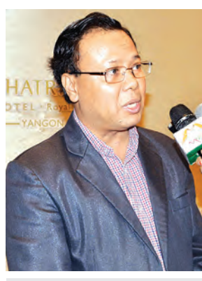
ဦးစိုးမြင့် (Mizzima Media Group)

တွေ့ဆုံမေးမြန်း-ရဲခေါင်၊ စန္ဒီ၊ ရီရီ၊ ဓာတ်ပုံ-ဇော်မင်းလတ်