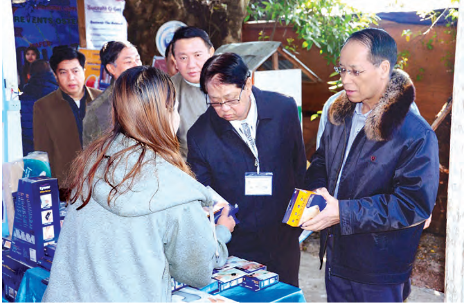
ဒုတိယသမ္မတ ဒေါက်တာစိုင်းမောက်ခမ်း ဆေးနှင့် ဆေးပစ္စည်းပြခန်းများ လှည့်လည်ကြည့်ရှုစဉ်။ (ပြည်နယ် ပြန်/ဆက်)

ဖြန့်ဖြူးမှုမှာ သုံးသောင်းငါးထောင် ကျော်သာ ရှိသေးသည့်အတွက် ဆရာဝန်များ ပိုမိုမွေးထုတ်ပေးရန် လိုအပ်ကြောင်း၊ ဆေးခန်းမရှိ၊ ဆရာဝန်၊ ဆရာမ မရှိသည့် ကျေးလက်ဒေသများ၌ ပြည်သူတို့၏ ကျန်းမာရေး စောင့်ရှောက်မှုများကို ပိုမိုကောင်းမွန်လာစေရန် မည်သို့ ဆောင်ရွက်ရမည်ကို ဆွေးနွေး ကြစေလိုကြောင်း၊ မြန်မာနိုင်ငံ တွင် ကျေးရွာပေါင်း ၆၄၀၀၀ ကျော် ရှိရာ တစ်ရွာလျှင် ကျန်းမာရေး ကျွမ်းကျင်သူတစ်ဦးနှုန်းပါး ရှိနေ မည်ဆိုပါက ပိုမိုကောင်းမွန်သည့် ကျန်းမာရေး စောင့်ရှောက်မှုများ ပေးအပ်နိုင်မည်ဖြစ်ကြောင်း၊ တွေ့ကြုံ ရမည့် ပြဿနာအရပ်ရပ်ကိုလည်း ညှိနှိုင်းဖြေရှင်းနည်းဖြင့် ပူးပေါင်း ဆွေးနွေးနိုင်သည့် ယဉ်ကျေးမှုရှိလာ စေရန် ကြိုးပမ်းကြစေလိုပါကြောင်း ဖြင့် ပြောကြားသည်။